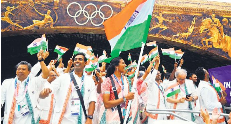
पेरिस ओलंपिक-2024 का रंगारंग समारोह नयनाभिराम रहा। भारतीय दल की अगुवाई शटलर पीवी सिंधु व टेबल टेनिस खिलाड़ी अचंत शरत कमल ने की। इस अवसर पर भारतीय खिलाड़ियों की खुशी देखते ही बन रही।

सीन नदी पर 85 नावों में सवार 205 देशों के 6800 खिलाड़ी रहे आकर्षण का केंद्र