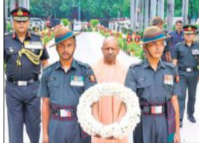
शहीदों के स्मारक पर पुष्पचक्र अर्पित करने जाते मुख्यमंत्री योगी आदित्यनाथ।