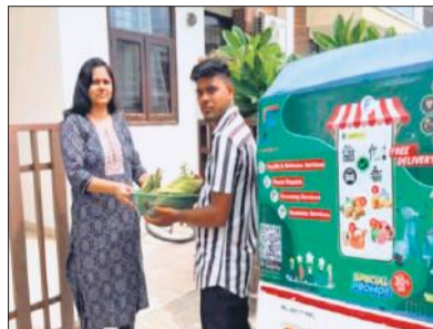
एप के जरिए फल व सक्की की खरीदारी करती महिला।