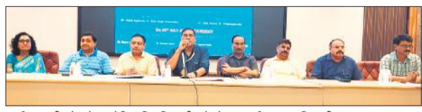
आईएमए की ओर से आयोजित विलिनिक मीट में मौजूद आईएमए पदाधिकारी।