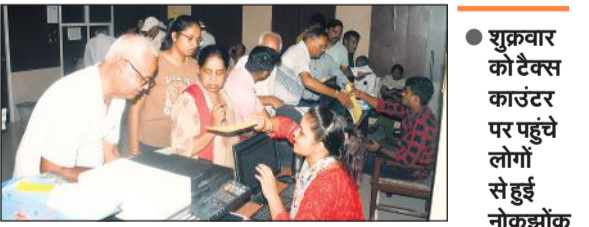
नगर निगम में हाउस टैक्स जमा करने के लिए पहुंचे लोग।

बरेली, अमृत विचार : हाउस टैक्स को लेकर लोगों की दिक्कतें कम नहीं हो रही हैं। जीपीएस से फोटो लेकर आने के लिए कहा जा रहा है। इसको लेकर शुक्रवार को टैक्स काउंटर पर नोकझोंक भी हुई। कुछ लोगों का कहना है कि वे कम पढ़े लिखे हैं और मोबाइल फोन भी ठीक नहीं है। ऐसे में टैक्स जमा करने में परेशानी सामने आ रही है।