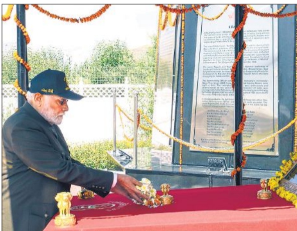
द्वास में कारगिल युद्ध स्मारक पर श्रद्धांजलि अर्पित करते प्रधानमंत्री नरेंद्र मोदी।

उन्होंने कहा कि पाकिस्तान को अतीत में अपने सभी अनैतिक और शर्मनाक प्रयासों के लिए हार का सामना करना पड़ा है। मोदी ने जम्मू-कश्मीर में बढ़ते आतंकवादी हमलों का परोक्ष रूप से जिक्र करते हुए कहा कि वह (पाकिस्तान) अतीत में हमेशा विफल रहा है लेकिन उसने अपने