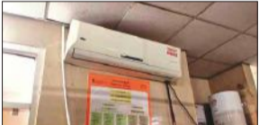
लेबर रूम में एसी हुआ खराब।

बरेली, अमृत विचार : जिला अस्पताल के लेबर रूम और पीपीएच वार्ड में लगे चार एसी खराब हो गए हैं। ऐसे में मरीजों को काफी परेशानी हो रही है। स्टाफ के अनुसार यहां सामान्य प्रसव कराने के लिए चार मेज हैं। प्रसूताओं को गर्मी के कारण कोई परेशानी न हो, इसके लिए एसी की व्यवस्था की गई है। कुछ दिनों से लेबर रूम और पीपीएच वार्ड के चार एसी खराब हो गए हैं। ऐसे में गर्मी और उमस के कारण वार्ड में इतनी घुटन हो रही है कि वहां पहुंचने वाली महिलाओं के बेहोश होने की स्थिति उत्पन्न हो गई है। प्रसव कराने के दौरान स्टाफ भी पसीने से तर-ब-तर हो रहा है। सीएमएस डॉ. त्रिभुवन प्रसाद ने बताया कि जल्द ही एसी की मरम्मत करा दी जाएगी।