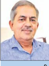
सुशाकर आशावादी सेवानिवृत्त प्रोफेसर

देश में जातीय क्षत्रघों की बहुतायत होने के कारण नित्य ही जाति आधारित आरक्षण की सीमा में वृद्धि हेतु धरने व आंदोलन आयोजित किए जाते हैं। दूसरी ओर अन्य देशों में आरक्षण जैसी व्यवस्था का खुलकर विरोध किया जाता है। बांग्लादेश इसका ताजा उदाहरण है, कहां स्वतंत्रता सेनानियों के परिवारों को दिए जाने वाले तीस प्रतिशत आरक्षण की समाप्ति की मांग को लेकर लोग सड़कों पर आ गए तथा सरकार को उनके सम्मुख झुकना पड़ा। निःसंदेह अपनी योग्यता पर विश्वास न करके नित्य धर्म और जाति के नाम पर आरक्षण की मांग करने वालों को पड़ोसी बांग्लादेश से सबक सीखना चाहिए, कि वहां आरक्षण की समाप्ति के लिए भयंकर दंगे हुए तथा बांग्लादेश के सर्वोच्च न्यायालय ने आरक्षण की सीमा 30 प्रतिशत के घटाकर केवल पांच प्रतिशत कर दी, इसके अतिरिक्त केवल दो प्रतिशत आरक्षण अन्य विशिष्ट श्रेणी के लिए है जबकि