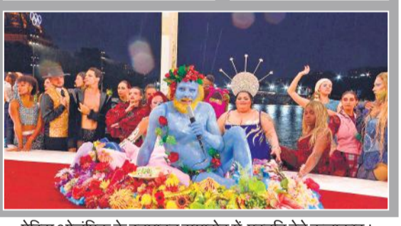
पेरिस ओलंपिक के उद्घाटन समारोह में प्रस्तुति देते कलाकार।

ओलंपिक पदक विजेता पीवी सिंधु और टेबल टेनिस के दिग्गज शरत कमल ने की अगुवाई