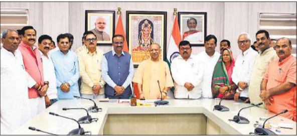
शुक्रवार को सरकारी आवास पर लखनऊ मंडल के सांसद और विधायकों के साथ मुख्यमंत्री योगी आदित्यनाथ

मुख्यमंत्री ने क्षेत्रवार नई कार्ययोजना बनाने को कहा है, ताकि समयबद्ध तरीके से क्षेत्र का विकास किया जा सके। उन्होंने जनप्रतिनिधियों की अपेक्षाओं को ध्यान में रखते हुए कार्ययोजना बनाने को कहा