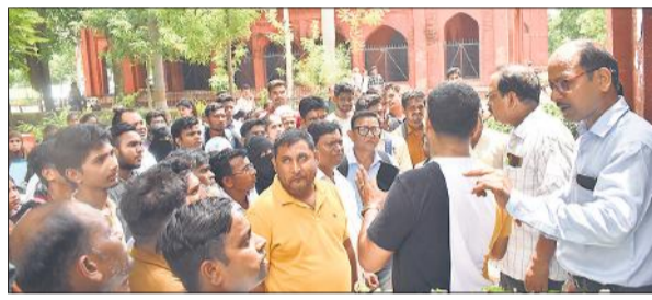
हंगामा करते छात्रों व अभिभावकों को समझाते प्रॉक्टरियल बोर्ड के सदस्य।

कॉलेज ने बीए और बीएससी जीव विज्ञान में प्रवेश के लिए पहले चार मेरिट निकालीं। मेरिट में शामिल छात्रों को निर्धारित समय के बाद एक दिन और शुल्क जमा कर प्रवेश लेने का मौका दिया। एक मेरिट के प्रवेश पूरे होने पर रिक्त सीट के बाद दूसरी मेरिट जारी की गई। इसके बाद भी मेरिट में शामिल कई छात्रों का प्रवेश नहीं हो सका। छात्रों का कहना है कि शुल्क जमा न होने की वजह से उनका प्रवेश अटक गया। गुरुवार