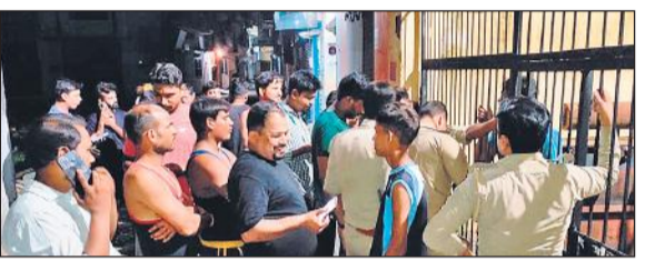
सुभाषनगर उपकेंद्र पर शुक्रवार रात प्रदर्शन करते लोग।

आते रहे। उपभोक्ताओं ने बताया कि सुभाषनगर उपकेंद्र का कोई अफसर समस्या का निदान करने को तैयार नहीं है। शिकायत के बाद भी सुनवाई नहीं होती है। लिहाजा, वे लोग उपकेंद्र पर प्रदर्शन करने पहुंचे थे। वहीं, आए दिन फॉल्ट होने और मरम्मत का कार्य समय से नहीं होने