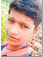
● पुलिस ने एक दिन पूर्व दर्ज की गुमशुदगी शुक्रवार को झाड़ी में मिला शव