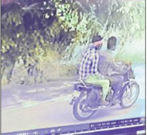
सीसीटीवी फुटेज में दिखे बदमाश।

अमृत विचार : बुखारा-फरीदपुर मार्ग पर बाइक सवारों की आंखों में मिर्च पाउडर डालकर लूट की कोशिश की गई। चार दिन में इस तरह की दो घटनाएं सामने आई हैं। दोनों पीड़ितों ने थाना कैंट में तहरीर दी है, लेकिन पुलिस ने अभी तक कोई कार्रवाई नहीं की है। वहीं मंगलवार को कांथरपुर के एक सराफ का बैग छीनने वाले बदमाश भी अभी फरार हैं।