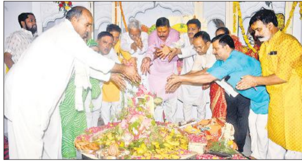
बालाजी विहार कॉलोनी स्थित नाथ शिव मंदिर में पूजन करते लोग।