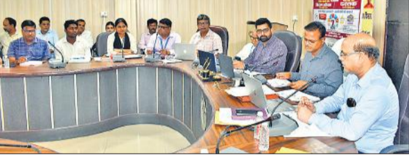
जिला स्वास्थ्य समिति की बैठक में समीक्षा करते जिलाधिकारी।