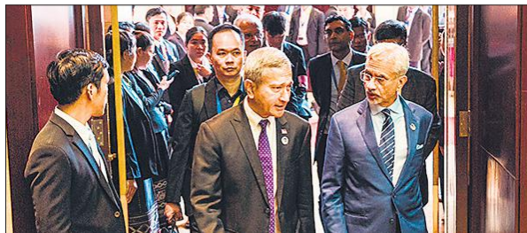
आसियान की बैठक के लिए जाते विदेश मंत्री जयशंकर।

विद्युत्तियान। विदेश मंत्री जयशंकर ने दक्षिण पूर्व एशियाई देशों के संगठन (आसियान) के साथ राजनीतिक, आर्थिक और सुरक्षा सहयोग बढ़ाने को भारत की प्राथमिकता बताते हुए शुक्रवार को कहा कि यह 10 सदस्यीय प्रभावशाली क्षेत्रीय समूह भारत की एक ईस्ट नीति और हिन्द-प्राशांत दृष्टिकोण की आधारशिला है। जयशंकर आसियान की बैठकों में भाग लेने के लिए लाओस की राजधानी में हैं। उन्होंने आसियान-भारत विदेश मंत्रियों की बैठक के उद्घाटन सत्र में अपने संबोधन के दौरान कहा कि भारत आसियान और ईएएस (पूर्वी एशिया शिखर सम्मेलन) में जो जो प्राथमिकता देता है, वह पिछले साल नयी दिल्ली में जी-20 शिखर सम्मेलन की पूर्व संध्या पर प्रधानमंत्री नरेन्द्र मोदी द्वारा जकार्ता की यात्रा किए जाने से स्पष्ट है। उन्होंने कहा कि प्रधानमंत्री मोदी ने 12 सूत्री योजना की घोषणा की थी, जिस पर बड़े पैमाने पर अमल किया गया है। भारत के लिए आसियान उसकी एक इंडिया नीति