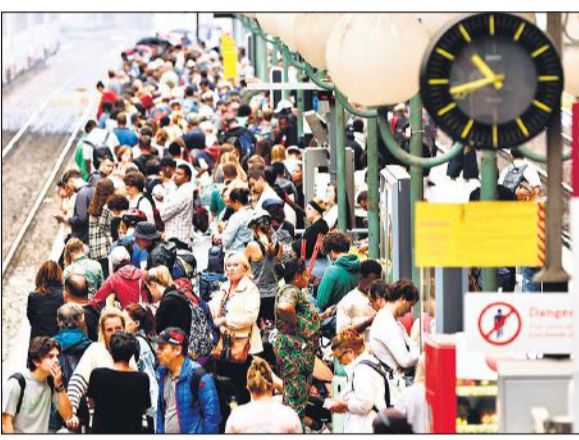
पेरिस में ट्रेन नहीं जाने के कारण स्टेशन पर जमा भीड़।

अधिकारियों के मुताबिक ओलंपिक खेलों के मद्देनजर पूरी दुनिया की नर्सों पेरिस पर थीं, ऐसे में इन हमलों से अकेले शुरूवार को बाई लाख यात्रियों के प्रभावित होने की आशंका है। रेल लाइनों पर तोड़फोड़ और आगजनी की घटनाओं से ट्रेन परिचालन सप्ताहांत और इससे अधिक समय तक प्रभावित रहने की आशंका है। फ्रांस के परिवहन मंत्री पेट्रिस वर्गीते ने बताया कि जिन जगहों पर आगजनी की घटनाएं हुईं, वहां से लोगों को भागते देखा गया और इन स्थानों पर आग लगाने के