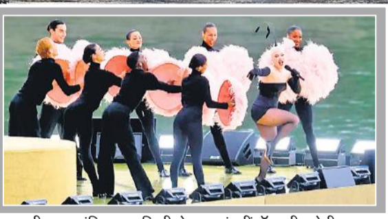
अपनी भाव-भंगिमा व गायिकी से समा बांधती पाँप क्वीन लेडी गंगा।