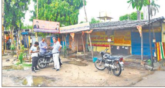
आरटीओ के बाहर शुक्रवार को पसरा सन्नाटा।

अमृत विचार : आरटीओ में गुरुवार को जिलाधिकारी की छापेमारी के बाद पकड़े गए दो दलालों को थाना कैंट पुलिस ने शुक्रवार को कोर्ट में पेश किया, जहां से उन्हें जेल भेज दिया गया। पुलिस फरार दलालों की तलाश कर रही है। वहीं मौके से बरामद ई-स्टांप की जांच की जा रही है।