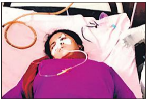
● बालिका के नामकरण में डीजे पर डांस को लेकर हुआ था विवाद