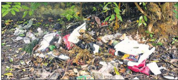
गोविंद बल्लभ पंत पार्क में लगा कूड़े का ढेर।

पहले इस पार्क में आसपास के लोग रोजाना टहलने और स्मार्ट सिटी के तहत बने ओपन जिम में व्यायाम के लिए आते थे। बेंच पर बैठकर फव्वारे का आनंद उठाते थे। बच्चों को यहां खेलने लिए भेजते थे, मगर अब कम ही लोग आते हैं, क्योंकि पार्क में गंदगी