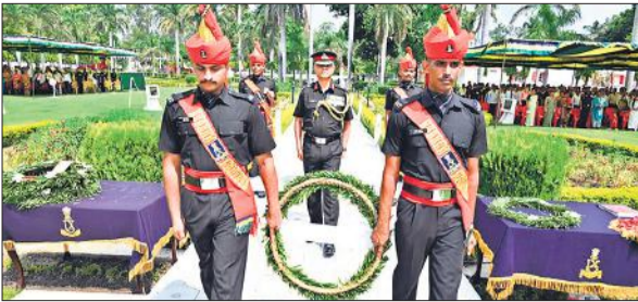
जाट रजिमेंट सेंटर स्थित वार मेमोरियल में कारगिल शहीदों को दी गई श्रद्धांजलि।

बरेली, अमृत विचार : शुकवार को जाट रजिमेंट सेंटर वॉर मेमोरियल में आयोजित कार्यक्रम में कारगिल युद्ध में शहीद हुए सैनिकों को श्रद्धांजलि अर्पित की गई।