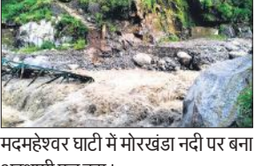
मदमहेश्वर घाटी में मोरखंडा नदी पर बना अस्थायी पुल बहा।

गांवों का संपर्क जिला मुख्यालय से कट गया है। उत्तराखंड के गढ़वाल मंडल में उत्तरकाशी और रुद्रप्रयाग जिले में अतिवृष्टि से काफी नुकसान हुआ है। नदी का पानी यमुनोत्री धाम तक पहुंच गया। नदी के बहाव के साथ आए बोल्टर व पथरों की वजह से धाम के मंदिर परिसर को काफी नुकसान हुआ है। मंदिर समिति के कार्यालय, रसोई,