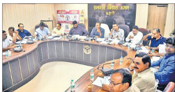
जिला उद्योग बंधु की बैठक में जिलाधिकारी को समस्याएं बताते उद्यमी।