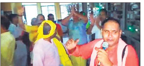
सुभाषनगर उपकेंद्र में राधे-राधे का जाप करते लोग।

अमृत विचार : 33 केवी लाइन में फाल्ट से सुभाष नगर क्षेत्र में आपूर्ति बाधित हो गई। गुरुवार देर रात तक जब आपूर्ति सुचारु नहीं हुई तो लोगों को पारा चढ़ गया। उन्होंने रात में ही सुभाष नगर उपकेंद्र पर पहुंचकर हंगामा किया। इस दौरान उन्होंने विभागीय अफसरों की सद्बुद्धि के लिए राधे-राधे नाम का जाप किया। पुलिस ने किसी तरह लोगों को समझाकर शांत कराया। पूरी रात लोगों की जाग कर कटी। शहर के कई अन्य इलाकों में भी बिजली संकट रहा। एक लाख से ज्यादा घरों की बिजली गुल रही। गर्मी में लोग परेशान होते रहे। वहीं लोगों