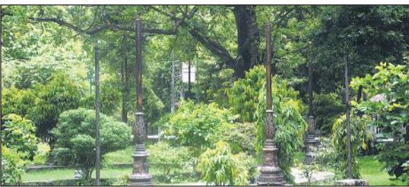
पार्क में फेंसी लाइटी पर नहीं लगे हैं बल्ब।

रहा है। यहां कई लोग पेसे आते हैं, जो नशीले पदार्थों का सेवन करते हैं। फव्वारे सहित कई उपकरण खराब हो चुके हैं। बंदरों के अंतक की वजह से