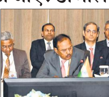
बिम्स्टेक की बैठक में संबोधित करते एनएसए अजीत डोभाल

डोभाल ने म्यांमा की राजधानी में बिम्स्टेक देशों के सुरक्षा प्रमुखों की चौथी वार्षिक बैठक में भारतीय प्रतिनिधिमंडल का नेतृत्व करते हुए भारत का राष्ट्रीय वक्तव्य दिया। म्यांमा स्थित भारतीय दूतावास ने सोशल मीडिया मंच एक्स पर एक पोस्ट में कहा एनएसए ने बिम्स्टेक बैठक में भारत का राष्ट्रीय वक्तव्य दिया। उन्होंने आतंकवाद, मादक पदार्थों की तस्करी और हथियारों की तस्करी तथा संगठित अपराध से निपटने में सहयोग मजबूत करने, बिम्स्टेक