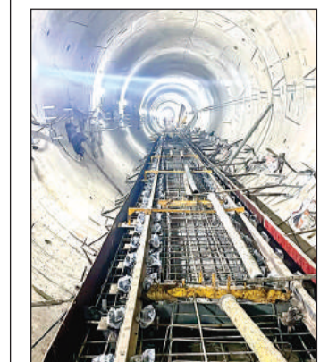
ट्रैक स्लैब की ढलाई शुरू की गई।