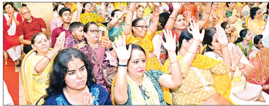
साईंनाथ के भजनों में भक्त आनंदित हुए।