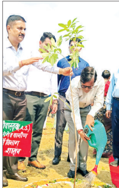
जिलाधिकारी ने भी पौधा लगाया। अमृत विचार