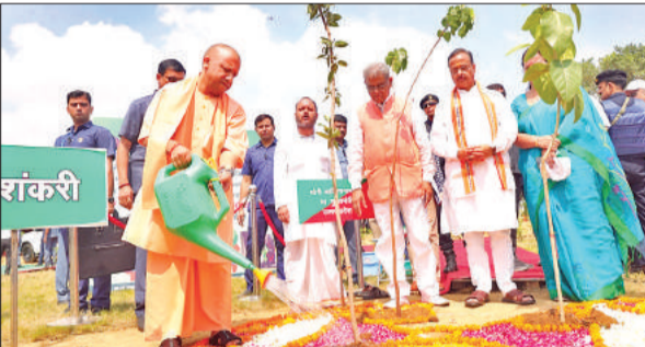
लखनऊ में कुकरैल नदी तट पर पौधरोपण महाअभियान की शुरुआत करते मुख्यमंत्री।

बहुत चिंतित हैं। यह संकट मनुष्य के स्वार्थ ने पैदा किया है। इसे रोकने की जिम्मेदारी भी मनुष्यों की है। प्रधानमंत्री नरेंद्र मोदी का पौधरोपण को लेकर आह्वान हर देशवासी के लिए मंत्र बनना चाहिए। हमें पौधों का दुष्प्रभाव है।