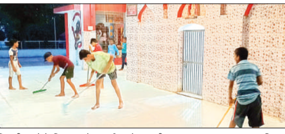
शिवली कस्बे के शिवालय में सजाई करते उत्साही भक्त।

। भगवान शिव के पूजन के लिए पवित्र सावन माह सोमवार से शुरू होगा। इसके चलते जिले में आस्था के प्रमुख केंद्र पौराणिक व ऐतिहासिक शिवालयों में सज सज्जा की जा रही है। श्रद्धालु भगवान शिव का जलाभिषेक कर बेल पत्र आदि से पूजन करेंगे। सावन माह के सोमवार पर आस्था का केंद्र बनीपारा जिन्हें स्थित पौराणिक वाणेश्वर महादेव मंदिर में आसपास जिलों के भक्तों की भीड़ उमड़ती है। मान्यता है कि दैत्यराज बलि के पुत्र वाणासुर ने मंदिर में विशाल शिवलिंग की स्थापना की थी। श्रीकृष्ण-वाणासुर युद्ध के बाद यह स्थल विध्वंस हो गया। बाद में राजा परीक्षित के पुत्र जन्मेजय ने जीर्णोद्धार कराकर वाणपुरा जन्मेजय नाम रखा था, जो अंधश्रद्धा के रूप में बनीपारा जिन्हें के नाम से जाना जाता है। शिवली क्षेत्र के पांडु नदी किनारे