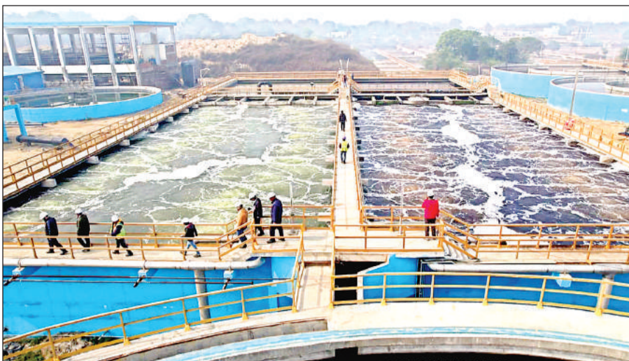
जाजमऊ टेनरी क्लस्टर के लिये बना 20 एमएलडी कॉमन इंप्लूट ट्रीटमेंट प्लांट।

जाजमऊ में कॉमन एफ्लुट ट्रीटमेंट प्लांट (सीईटीपी) को 454 करोड़ रुपये से बनाया गया है। इसका शिलान्यास पीएम नरेंद्र