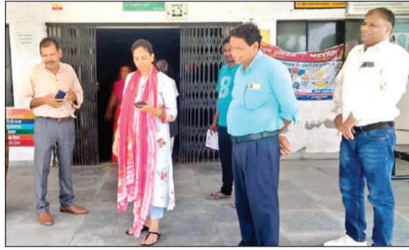
भीषण गर्मी से परेशान होकर बाहर खड़े डॉक्टर व कर्मचारी।