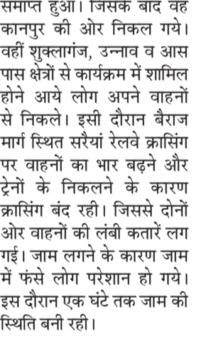
बैराज मार्ग जाम में फंसे वाहन सवार।

अमृत विचार। शनिवार को बैराज मार्ग स्थित ट्रांस गंगा सिटी कार्यक्रम के समापन के बाद वाहनों का रैला बैराज मार्ग से निकल पड़ा। जिस कारण सरैयां रेलवे क्रॉसिंग पर वाहनों का भार बढ़ने और ट्रेनों के निकलने के कारण वीआईपी भी फंसे रहे। इस दौरान एक घंटे तक जाम की स्थिति बनी रही। ट्रांस गंगा सिटी में दोपहर करीब एक बजे उपमुख्यमंत्री ब्रजेश पाठक का कार्यक्रम समाप्त हुआ। जिसके बाद वह कानपुर की ओर निकल गये। वहीं शुक्लागंज, उज्जाव व आस पास क्षेत्रों से कार्यक्रम में शामिल होने आये लोग अपने वाहनों से निकले। इसी दौरान बैराज मार्ग स्थित सरैयां रेलवे क्रॉसिंग पर वाहनों का भार बढ़ने और ट्रेनों के निकलने के कारण क्रॉसिंग बंद रही। जिससे दोनों ओर वाहनों की लंबी कतारें लग गईं। जाम लगने के कारण जाम में फंसे लोग परेशान हो गये। इस दौरान एक घंटे तक जाम की स्थिति बनी रही।