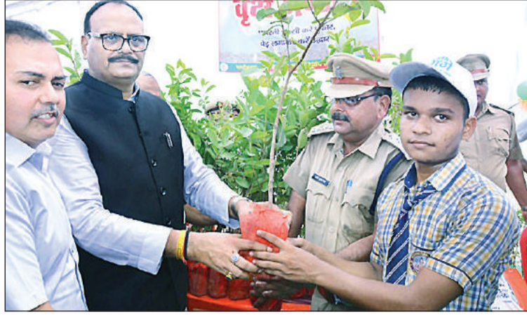
अमृत विचार छात्र को पौधा भेंट करते उप मुख्यमंत्री ब्रजेश पाठक और जिलाधिकारी आलोक सिंह।