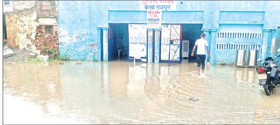
शनिवार को बारिश के बाद पुलिस चौकी में भरा पानी। अमृत विचार

शनिवार दोपहर हुई तेज बारिश में बैलाही बाजार, सराफा बाजार से लेकर कन्हैया नगर में जलभराव हो गया। वहीं पुलिस चौकी परिसर में पानी भरने से पुलिसकर्मियों को खासी दिक्कतों का सामना करना पड़ा। दफ्तर में भी पानी घुसने से पुलिस कर्मियों को दिक्कत हुई।