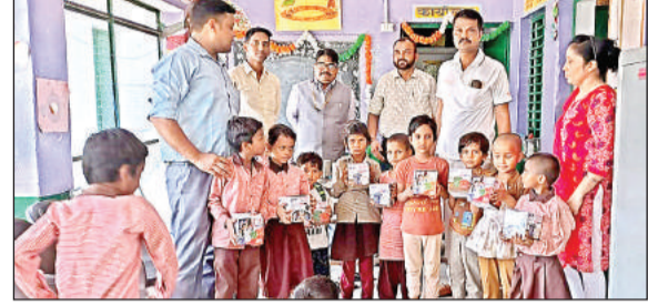
बच्चों को उपहार देते बैंक के शाखा प्रबंधक। अमृत विचार