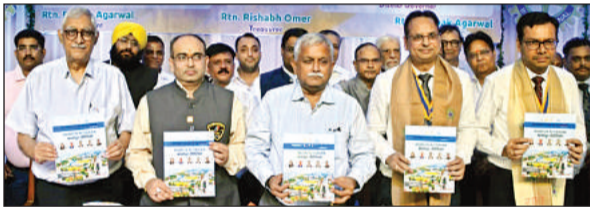
समारोह में मौजूद रोटीरी के नए सदस्य।