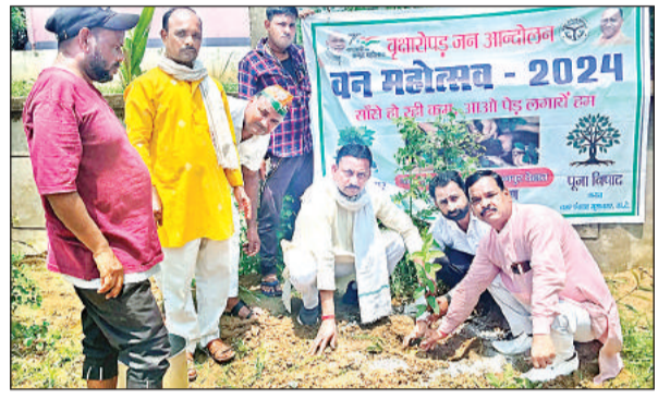
मूसानगर में पौधरोपण करते नगर पंचायत अध्यक्ष के प्रतिनिधि व अन्य।