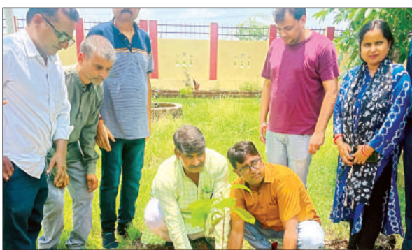
आईटीआई परिसर में पौधरोपण करते ग्राम प्रधान और प्रधानाचार्य। अमृत विचार