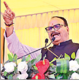
मौजूद लोगों को संबोधित करते उप मुख्यमंत्री ब्रजेश पाठक।

अमृत विचार। उज्जाव और गंगाघाट क्षेत्र के सभी लोगों को मैं भलिभांति जानता हूँ। इतना ही नहीं यहां के लोगों को मैं घर की तरह मानता हूँ। आज मैं जो भी हूँ वह उज्जाव के लोगों के दम पर हूँ, इसीलिये उज्जाव मेरी रग रग में बसा हुआ है। पूरी दुनिया ग्लोबल वार्मिंग के प्रति चिंतित है। आने वाले समय में अगर अधिक से अधिक पौधे न लगाये गये तो जीवन खतरे में आ जायेगा। इसलिये अभी से हर व्यक्ति को एक पौधा मां के चित्र के साथ अवश्य लगाये।