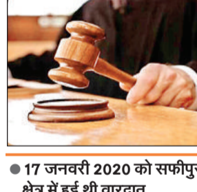
● 17 जनवरी 2020 को सफीपुर क्षेत्र में हुई थी वारदात