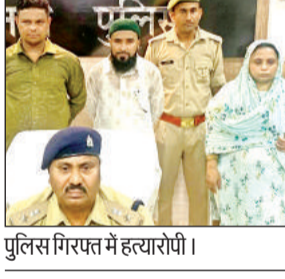
पुलिस गिरफ्तार में हत्यारोपी।

कोतवाली क्षेत्र के क्षेत्र दरबारी खेड़ा गांव के सामने लखनऊ-कानपुर हाईवे किनारे एक कुएं से कानपुर के अनवरगंज थानाक्षेत्र