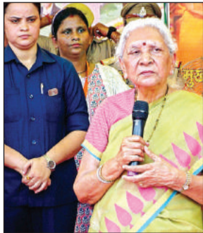
मंच से नाराजगी व्यक्त करती राज्यपाल आनंदी बेन पटेल।

अमृत विचार। वृहद पौधरोपण कार्यक्रम में शामिल होने आयीं राज्यपाल आनंदीबेन पटेल ने कार्यक्रम के दौरान अव्यवस्थाओं को देखकर मंच से ही अफसरों और मंत्रियों, जनप्रतिनिधियों के खिलाफ नाराजगी व्यक्त की। राज्यपाल ने कहा कि सेना के कार्यक्रम में भी ऐसी व्यवस्था आप लोग करेंगे मुझे पहले पता होता तो मैं सीतापुर आती ही नहीं। राज्यपाल की नाराजगी के बाद कार्यक्रम में सननाटा छा गया। उन्होंने कहा कि मंत्री से लेकर विधायक तक सब फोटो खिंचवाने आये हैं। राज्यपाल ने इस दौरान सफेद चन्दन का पौधा लगाकर एक वृक्ष मां के नाम अभियान की शुरुआत की।