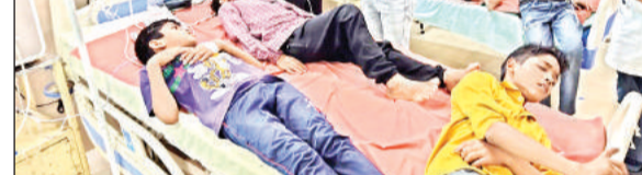
लोहिया अस्पताल में भर्ती बच्चों का उपचार करते चिकित्सक व स्टाफ।