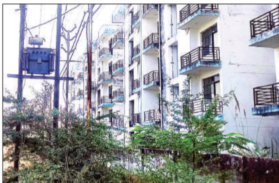
केडीए के शताब्दी नगर में खाली पड़े फ्लैट।