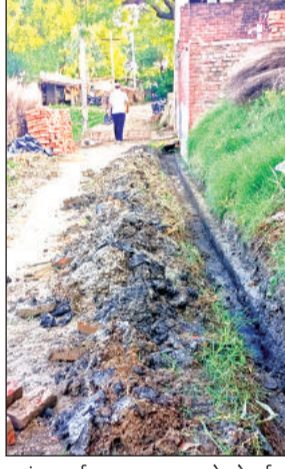
खड़जा मार्ग पर काम पूरा कराने को नई ईंट लाई गई।