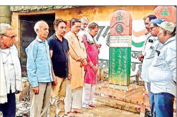
कटुआ आंतकी हमले में शहीद जवानों को श्रद्धांजलि देते कांग्रेसी।

बुधवार को जिला कांग्रेस कमेटी की तरफ से सदर तहसील स्थित स्वतंत्रता सेनानी व शहीद स्मारक पर कैंडिल जलाकर नेताओं ने दो मिन्ट का मौन रखकर शहीदों को श्रद्धांजलि अर्पित की। शिलापट के चारों तरफ कैंडिल जलाकर दो मिन्ट का मौन रखा। कांग्रेस नेताओं ने कहा कि आंतकी हमला देश को तोड़ने की बड़ी साजिश है। केंद्र