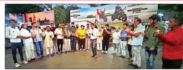
कैडल जलाकर शहीदों को नमन करते कांग्रेस नेता व कार्यकर्ता।