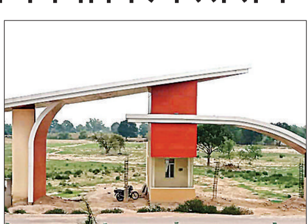
एक्सप्रेस-वे के किनारे निर्माणाधीन इत्र पार्क का भव्य प्रवेश द्वार।

जिले के प्रमुख उत्पाद को विश्वस्तरीय पर पहचान देने के लिए सप्ताश नेशनल में पूर्व मुख्यमंत्री अखिलेश यादव ने नींव रखी थी और इसके लिए आगरा-लखनऊ