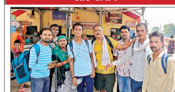
बाबा बर्फानी के दर्शन के लिए बुधवार को रवाना हुए श्रद्धालु।