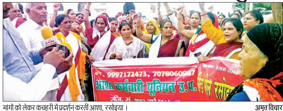
मांगों को लेकर कचहरी में प्रदर्शन करती आशा, रसोइया।