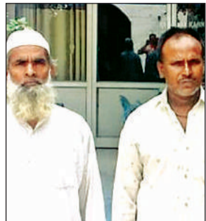
पुलिस गिरफ्त में वांछित आरोपी।