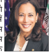
अमेरिकी उपराष्ट्रपति कमला हैरिस

वाशिंगटन। अमेरिका की उपराष्ट्रपति कमला हैरिस ने कहा कि पूर्व राष्ट्रपति और रिपब्लिकन पार्टी की ओर से राष्ट्रपति पद के चुनाव के उम्मीदवार डोनाल्ड ट्रंप अमेरिकी लोकतंत्र को तानाशाही में बदल देंगे। हैरिस ने बाइडेन-हैरिस के लिए एक राष्ट्रीय कार्यक्रम की शुरुआत करते हुए लास वेगास में कहा 'डोनाल्ड ट्रंप हमारे लोकतंत्र को तानाशाही में बदलना चाहते हैं। यह कार्यक्रम पूरे देश में एशियाई अमेरिकी, मूल हवाई नागरिक और प्रशांत द्वीपसमूह के लिए विश्वविद्यालयों और शैक्षणिक कक्षाओं को फिर से प्राप्त किया। हमने मीडिया स्पेस वापस लिया। मैं