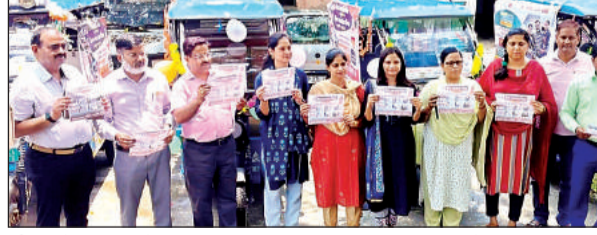
सीएमओ कार्यालय के बाहर जनसंख्या नियंत्रण का प्रचार प्रसार करते स्वास्थ्य विभाग के अधिकारी-कर्मचारी।