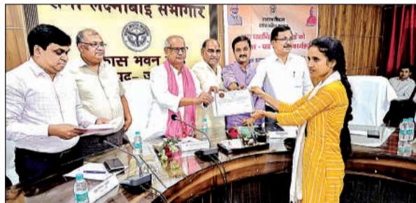
नियुक्तिपत्र देते अधिकारी।