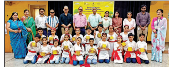
शील्ड व प्रशस्तिपत्र के साथ बच्चे।