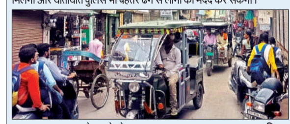
यातायात अराजकता से जुझते लोग।

फर्रुखाबाद। पिछले एक वर्ष से नगर क्षेत्र में ई रिक्शा और टेपो के रूट निर्धारण की प्रक्रिया चल रही है। फाइल कार्यालय दर कार्यालय भटक रही है। इसका खामियाजा आम जनता उठाने को मजबूर है। शहर क्षेत्र में मुख्य मार्ग के साथ गली मोहल्लों में भी ई रिक्शा, टेपो की वजह से जाम लगता है। बुधवार को साहगंज चौराहा पर ई रिक्शा की वजह से जाम लगा। फिर काफ़ी देर वाहनों की लंबी लाइन चारों तरफ लगी रही। शहर वासी जूझते रहे। जून के अंतिम सप्ताह में यातायात पुलिस ने नगर क्षेत्र में ई रिक्शा संचालन हेतु रूट चार्ट तैयार किया था जिसमें 11 मार्गों पर 1100 ई रिक्शा को चलाने का खाका तैयार किया गया था। प्रत्येक मार्ग पर 100 ई रिक्शा चलाने का प्लान बनाया गया। यातायात विभाग ने रूट चार्ट नगर पालिका कार्यालय भेज दिया। जिसके बाद मामला फिर टंडे बस्ते में चला गया था। मंगलवार को डीएम ने शहर क्षेत्र से जुड़े कई मामलों पर अधिकारियों के साथ मीटिंग की। जिसमें जाम की समस्या से शहर को निजात दिलाने के लिए ई-रिक्शा के रूट निर्धारण को काफ़ी जरूरी बताया। वहीं रूट चार्ट के हिसाब से काम हो सके और रूट निर्धारित हो सके इसके लिए डीएम ने नगर मजिस्ट्रेट की अध्यक्षता में बैठक के आदेश दिए। जिसमें सीओ ट्रेफिक, सीओ सिटी, एआरटीओ व्यापार मंडल के चार सदस्यों के साथ कमेटी बनाकर रूट प्लान प्रस्तुत किया गया। जिस प्रक्रिया में तेजी आने के आसार नजर आ रहे हैं। मामले पर यातायात प्रभारी रजनेश कुमार ने बताया कि मीटिंग के बाद रूट चार्ट की व्यवस्था शुरू हो सकती है। जिससे शहर की जनता को जाम से भी निजात मिलेगी और यातायात पुलिस भी बेहतर ढंग से लोगों की मदद कर सकेगी।