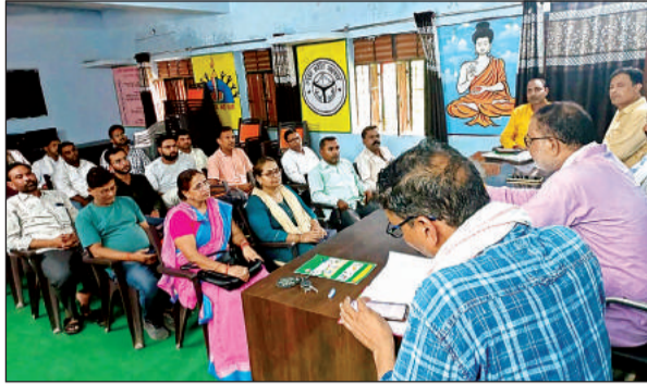
अन्दोलन को गति देने के लिए बीआरसी में बैठक करते शिक्षक।

अमृत विचार। बेसिक शिक्षा विभाग के शिक्षकों की ऑनलाइन हाजिरी बुधवार को तीसरे दिन भी नहीं लगी। शिक्षक ऑनलाइन हाजिरी लगाने के लिए तैयार नहीं है। उनका कहना है कि शिक्षकों की समस्याओं का निदान किया जाए। राज्य कर्मचारियों की तरह व्यवहार किया जाए। शिक्षक संगठनों के नेताओं का दावा है कि तीसरे दिन किसी भी शिक्षक ने ऑनलाइन हाजिरी नहीं लगाई। शिक्षक स्कूल तो पहुंचे और बच्चों को पढ़ाया लेकिन ऑफलाइन हाजिरी ही लगाई। साथ में बांध में काली पट्टी बांध कर विरोध जताते रहे। वहीं छात्र-छात्राओं के अभिभावकों का मानना है कि शिक्षकों का विरोध जायज नहीं है। बेसिक शिक्षा विभाग के स्कूलों में शिक्षकों को ऑनलाइन हाजिरी लगानी है। यह व्यवस्था सोमवार से लागू की गई थी लेकिन लगातार तीसरे दिन भी यह व्यवस्था फलाप रही। शिक्षक ऑनलाइन हाजिरी लगाने के लिए तैयार नहीं है और शिक्षक संगठन भी ऑनलाइन