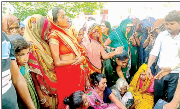
लोहिया अस्पताल में बिलखते परिजन।