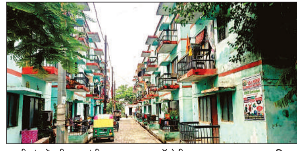
बलही गांव में बनी प्रधानमंत्री आसरा आवास कॉलोनी।

अमृत विचार। शहरी गरीबों के लिए बनाए गए प्रधानमंत्री आसरा आवासों पर अराजकतत्वों ने ताला तोड़कर कब्जा कर लिया है। जानकारी होने के बाद भी जिला नगरीय विकास अधिकरण (डूडा) के अधिकारी कोई भी कार्रवाई नहीं कर रहे हैं। इनमें कई आवंटी भी हैं, जो एक से अधिक आवासों पर कब्जा कर रहे हैं। बाशिंदों की माने तो इसमें डूडा के कर्मचारियों की मिलीभगत है। शहरी बेघर गरीबों के लिए प्रधानमंत्री आवास योजना के तहत शहर के पास बलही गांव के निकट 84 आवासों का निर्माण किया गया था, जिनमें 30 पात्र लोगों आवंटित कर दिए। वर्तमान में यहां लगभग सभी आवासों पर कब्जा हो गया है। मूल आवंटियों के अलावा कई बाहरी