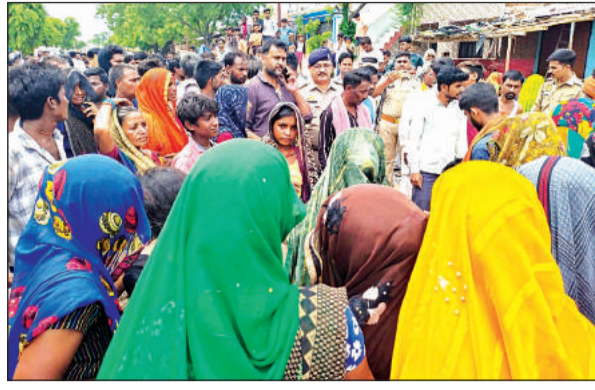
महिला की मौत के बाद हंगामा करते परिजन व ग्रामीण।