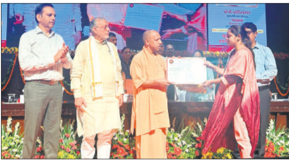
लोकभवन में चयनित लेखपालों को नियुक्ति पत्र देते मुख्यमंत्री योगी आदित्यनाथ।

कर्तव्यों के प्रति रहें सजग, लोगों के बीच अपनी छवि सुधारें लेखपाल : योगी आदित्यनाथ