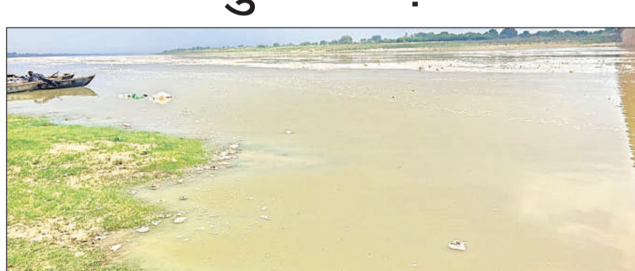
यमुना नदी का जलस्तर बढ़ने से तराई क्षेत्र में पहुंचने लगा पानी।

यमुना नदी में बढ़ रहे पानी को लेकर तटवर्ती गांवों के किसानों के माथे पर चिंता की लकीरें आ गई हैं। बाढ़ की आशंका से प्रशासन ने यमुना नदी के पानी पर निगरानी रखना शुरू कर दिया है। बारिश के मौसम में यमुना नदी के उफानने से भोगनीपुर तहसील क्षेत्र के करीब 28 से अधिक गांव बाढ़ की चपेट में आ जाते हैं। इन गांवों के किसानों की हजारां बीघा फसल जलमग्न होकर चौपट हो जाती है। जिससे किसानों