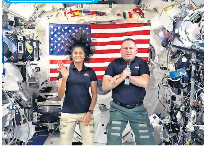
नासा ने बुधवार को एक वीडियो शोयर किया है जिसमें अंतरिक्ष यात्री सुनीता विलियम्स और बुच विल्मोर को अंतरिक्षीय अंतरिक्ष स्टेशन पर दिखाया गया है।