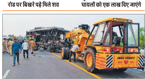
क्रेन से हटाई जा रही दुर्घटनाग्रस्त बस।

● तेज धमाके के बाद मची चीत्कार रोड पर बिखरे पड़े मिले शव