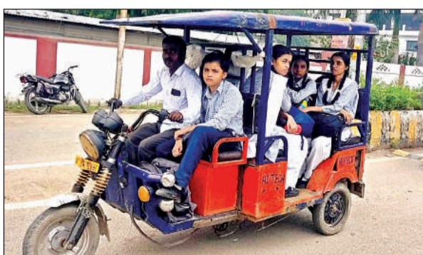
स्कूली बच्चों को ढोते डग्गामार वाहन।

शहर से लेकर कस्बों तक की सड़कों में खासकर सुबह-शाम विक्रम और वैन से बच्चों को स्कूल ले जाते दिखाई पड़ जाते हैं। ये वाहन कहीं से मानक पूरे नहीं कर रहे हैं। इसके बावजूद सड़कों पर धड़ल्ले के साथ फर्राटा भर रहे हैं। शहर क्षेत्र में ही कई प्राइवेट विद्यालय वर्षों से संचालित हैं।