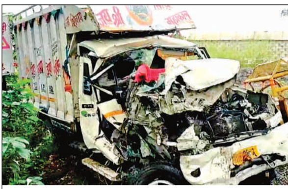
घटनास्थल पर खड़ी लड़ी हुई गाड़ियां।