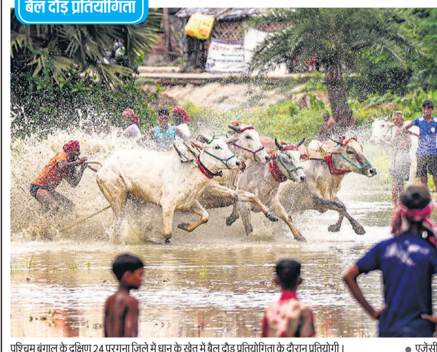
पश्चिम बंगाल के दक्षिण 24 परगना जिले में धान के खेत में बैल दौड़ प्रतियोगिता के दौरान प्रतियोगी।