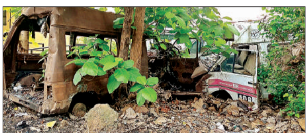
जिला अस्पताल में कंडम हालत में खड़ी 108 व 102 एंबुलेंस से चोरी हो चुका कीमती सामान।

मरीजों को घर से अस्पताल ले जाने के लिये वर्ष 2012 में शुरू की गई 108 व 102 एंबुलेंस सेवा मरीजों को लाभ दे रही है। कई वर्षों से चलने के कारण यह अब दगा देने लगी है। करीब 30 एंबुलेंस कंडम हो जाने पर चालकों ने सीएचसी, पीएचसी व जिला अस्पताल में खड़ी कर दी है। अब भी जहां की तहां खड़ी है। कंडम होने की जानकारी एंबुलेंस के सुपरवाइजर व अन्य अधिकारियों ने लिखित में सीएमओ को दे दी। नियम के तहत शासन से स्वीकृति लेने के बाद इनकी नीलामी कराई जानी चाहिये लेकिन