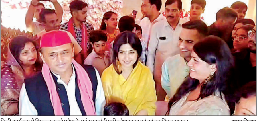
निजी कार्यक्रम में शिरकत करते प्रदेश के पूर्व मुख्यमंत्री अखिलेश यादव एवं सांसद डंपल यादव।

अमृत विचार। सपा के राष्ट्रीय अध्यक्ष और पूर्व मुख्यमंत्री अखिलेश यादव ने भाजपाइयों को देश का सबसे बड़ा भू माफिया करार देते हुए कहा है कि पवित्र राम मंदिर के निर्माण स्थल अयोध्या में भाजपाइयों ने बड़े पैमाने पर बेशकीमती जमीन अपने नाम करवा ली है। गृह जिले इटावा में एक निजी कार्यक्रम में शामिल होने के बाद अपने सिविल लाइन स्थित आवास पर पत्रकारों से बात करते हुए उन्होंने कहा कि भाजपा से जुड़े हुए लोग विपक्ष को भू माफिया बताते हैं जबकि असल भू माफिया भाजपा के लोग हैं, जिन्होंने अयोध्या की ही बेसकीमती जमीन को नहीं बक्सा है। उन्होंने कहा कि भाजपा सरकार द्वारा पिछले सात सालों से सर्किल में न बढ़ाना, स्थानीय लोगों के खिलाफ एक आर्थिक षड्यंत्र है। इसकी वजह से अरबों रुपये के भूमि घोचले हुए हैं। हम अयोध्या में तथाकथित विकास के नाम पर हुई 'धांधली' और भूमि सौदों की गहन जांच और समीक्षा की मांग करते