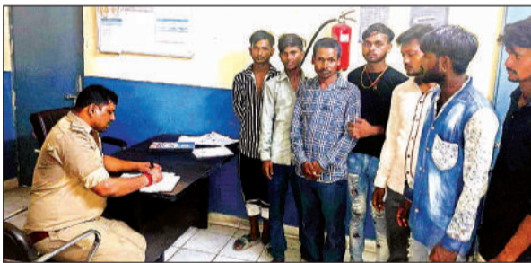
घटना के बावत जानकारी लेती पुलिस।