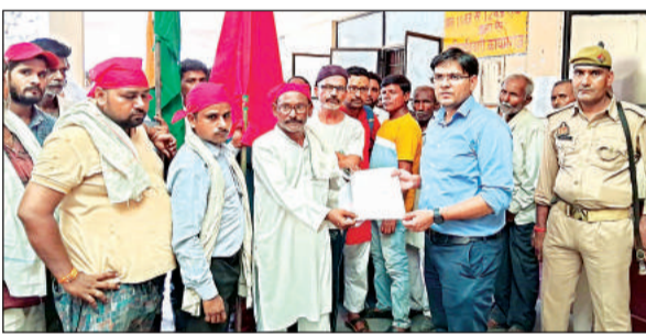
एसडीएम को ज्ञापन देते यूनियन के पदाधिकारी।