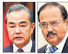
विदेश मंत्री वांग यी अजीत डोभाल

डोभाल को भारत के राष्ट्रीय सुरक्षा सलाहकार और भारत-चीन सीमा मुद्दे के लिए विशेष प्रतिनिधि के रूप में उनकी पुनर्निर्भूत पर बधाई संदेश में वांग ने कहा कि चीन और भारत एक ऐसा रिश्ता साझा करते हैं जो द्विपक्षीय सीमाओं से परे है और वैश्विक महत्व बढ़ाने वाला है। वांग विदेश मंत्री के अलावा भारत-चीन सीमा वार्ता प्रणाली के लिए चीन के विशेष प्रतिनिधि भी हैं। चीन की सत्तारूढ़