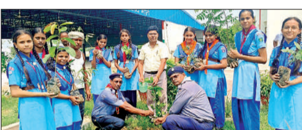
पीएमश्री केंद्रीय विद्यालय में पौधरोपण करते स्काउट शिक्षक व छात्र। अमृत विचार

नाले से भारी वाहनों के आवागमन पर नो एंट्री लगाई है। दोपहिया व पैदल लोग इस पुल से आवागमन कर सकते हैं। पीडब्ल्यूडी प्रांतीय खंड के एक्सईएन देवेंद्र कुमार ने बताया कि सियारी नाले से भारी वाहनों की आवाजाही प्रतिबंधित की गई है। जिसके चलते रूट डायवर्जन किया गया है। उन्होंने बताया कि कठारा से उसरी, रंजीतपुरवा, सिहुरामीरा, रानाइटाहा आदि गांवों की ओर जाने वाला ट्रैफिक रसूलाबाद-लहरापुर मार्ग से रसूलाबाद से उसरी की ओर जाएगा। इसी तरह उसरी से कठारा की ओर जाने वाला ट्रैफिक रसूलाबाद होते हुए रसूलाबाद-लहरापुर मार्ग के किमी-5 से कठारा की ओर जाएगा।