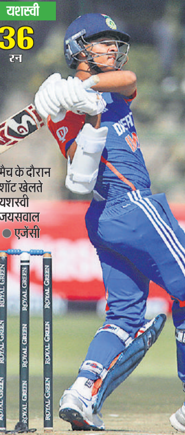
यशस्वी 36 रन

तीसरे टी-20 में भारतीय कप्तान गिल ने जड़ा शतक, शृंखला में बनाई 2-1 की बढ़त