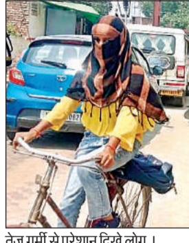
तेज गर्मी से परेशान दिखे लोग।

बुधवार को सारा दिन धूप लोगों की परीक्षा लेती रही। पुरुष गमछा व केप व महिलाएं स्टॉल व दुपट्टा