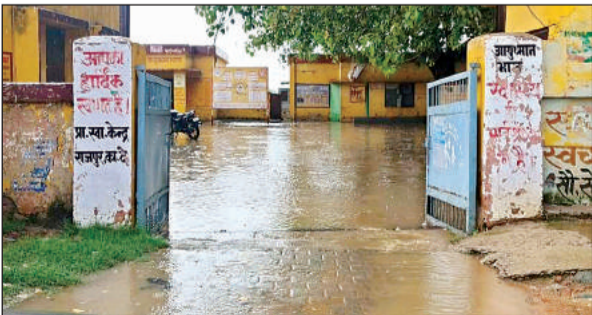
राजपुर पीएचसी परिसर में बारिश से हुआ जलभराव।