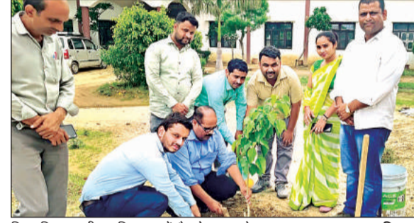
तिरुपति बाला जी महाविद्यालय में पौधरोपण करते प्राध्यापक।