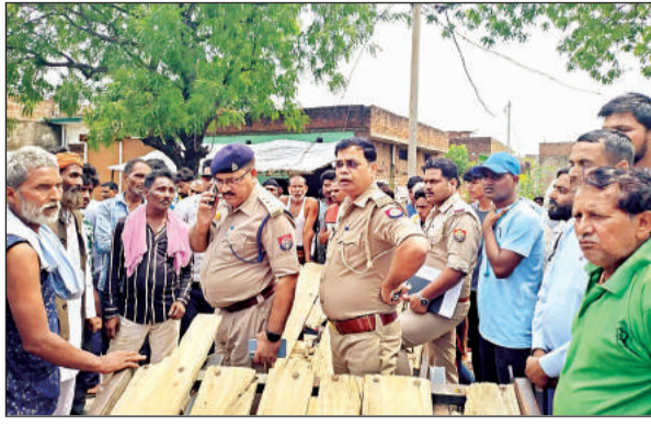
मौके पर पहुंची पुलिस।