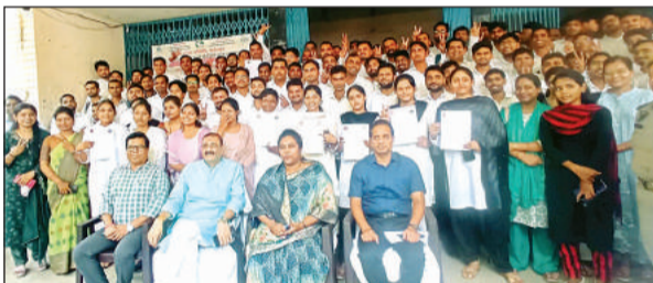
नियुक्ति पत्र के साथ खड़े नवनियुक्त लेखपाल।