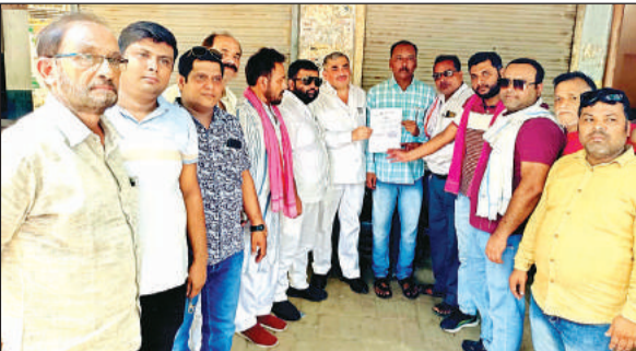
प्रमाण पत्र के साथ खुशी मनाते समर्थक।