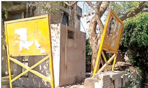
गांव में लगे बिजली विभाग की सौभाग्य योजना के खाली पड़े बोर्ड।