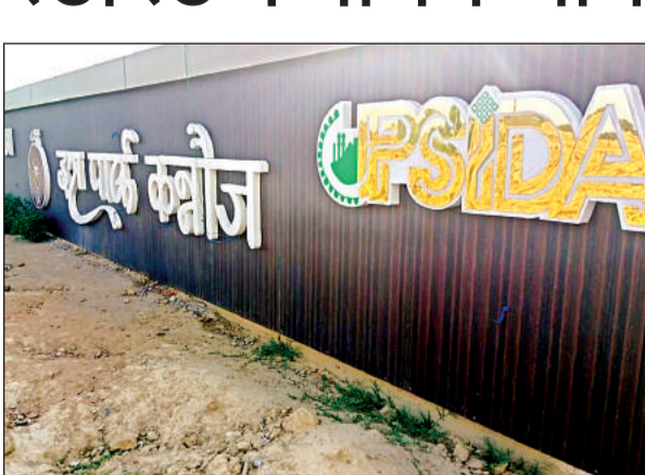
इत्र पार्क की बनाई गई ग्लोसाइन चहारदीवारी।

में इसका निर्यात भी कर सकेंगे। इत्र पार्क में 64 भूखंड बनाए गए हैं, जिनमें 24 का आवंटन भी कर दिया गया है। इन भूखंडों पर इत्र कारोबारी अपने कारखाने व शोरूम स्थापित कर सकेंगे। पार्क के लिए आगरा-