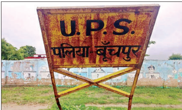
छिबरामऊ के गांव पलिया बूचपुर में स्कूल का प्रचार करता बिजली विभाग का बोर्ड।