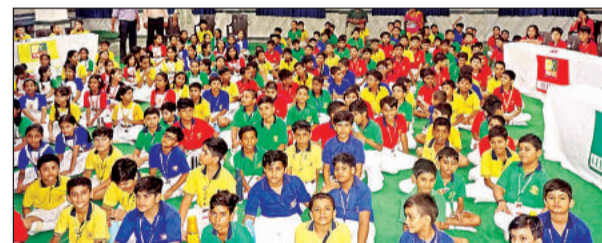
सामान्य ज्ञान प्रतियोगिता में भाग लेते बच्चे।