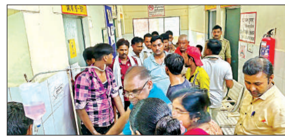
सिंकदरा सीएचसी में घायलों को देखने पहुंचे लोग।