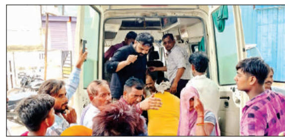
बिजली से झुलसे लोगों को एंबुलेंस से अस्पताल पहुंचाया गया।