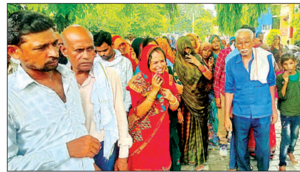
जिला अस्पताल में मगमीन परिजन।

बगैर ड्राइविंग लाइसेंस चलते पाए गए। जिस पर उनका चालान किया गया। अभियान निरंतर जारी रहेगा कुल 85 वाहनों का चालान किया गया। जिससे वाहन चालकों में अफरा-तफरी मच गई। वहीं उन्हेने बताया जो भी बाइक पर बिना हेलमेट के और तीन सवारी बैठे हुए दिखाई देंगे। उनका चालान के साथ-साथ कानूनी कार्रवाई भी की जाएगी। और कुछ वाहनों को हिदायत देकर भी छोड़ दिया गया है कि बिना हेलमेट के घर से ना निकले और गाड़ी पर सीट बेल्ट लगाना अतिआवश्यक है।