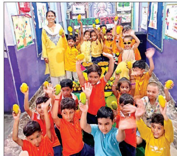
सुप्रभाष अकादमी में मैंगो पार्टी मनाते बच्चे।

जीवन मिशन के तहत पाइप लाइन बिछाने के दौरान जिन सड़कों की खुदाई कराई गई है उनकी मरम्मत भी कराई जाए।