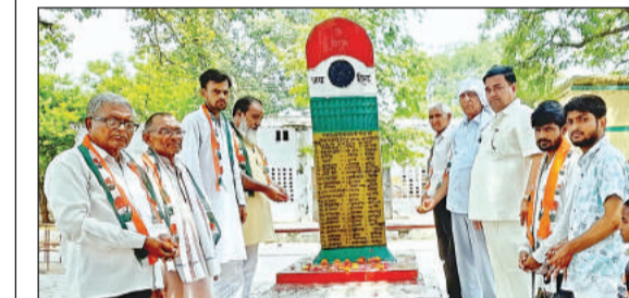
शहीद जवानों को पुष्पांजलि देते कांग्रेस जिलाध्यक्ष व अन्य पदाधिकारी।