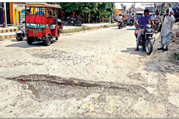
सड़क पर जगह-जगह गड्डे।

डीएम आवास से होते हुए रेलवे स्टेशन को जाने वाली वीआईपी रोड खराब होने के साथ ही गड्डे हो गए हैं। कई दिन से बारिश नहीं हुई, फिर भी जलभराव की स्थिति है। इसी तरह से बुलट चौराहे से तहसील मार्ग, अस्ती जाने वाली सड़क समेत अन्य कई मार्गों में