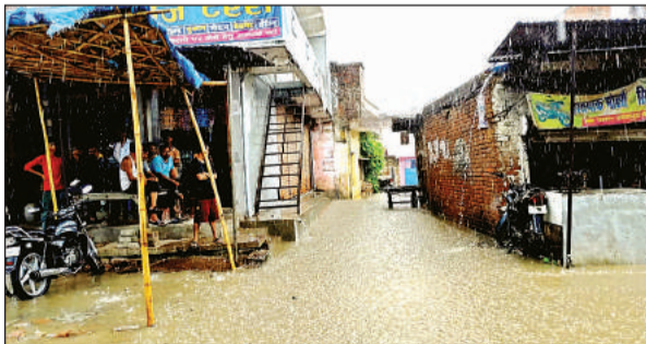
जोरदार बारिश से राजपुर में जलमग्न गली।