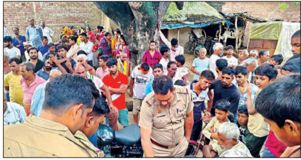
हादसे की जांच करती पुलिस व मौके पर जुटे ग्रामीण।

अमृत विचार। बुधवार की दोपहर बारिश के बाद कड़की तेज आकाशीय बिजली ने दो लोगों के साथ खेत में चर रही 13 बकरियों को अपनी चपेट में ले लिया। हादसे में एक किसान की मौत हो गई जबकि दूसरा गंभीर रूप से झुलस गया। इसके अलावा 13 बकरियों की भी मौत हो गई। बकेवर व भरथना क्षेत्र में दो मकानों पर भी बिजली गिरी जिससे मकान क्षति ग्रस्त हो गए। साथ ही बिजली के उपकरण फुंक गए। शुभसे व्यक्ति को उपचार के लिए जिला अस्पताल में भर्ती कराया गया है।