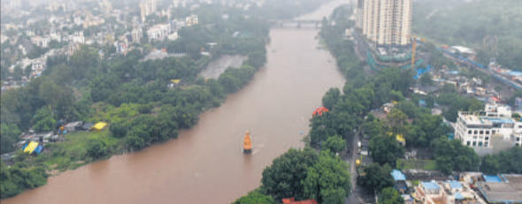
महाराष्ट्र के पुणे शहर में भरा बारिश का पानी।

महाराष्ट्र में गुरुवार को भारी बारिश से हुई घटनाओं में चार लोगों की मौत हो गई। बारिश से पुणे और मुंबई शहर के निचले इलाकों में पानी भर गया जिसके बाद यहां से लोगों को निकाला जा रहा है। मुंबई में बारिश से रास्तों पर पानी भर गया है और रेल सेवा प्रभावित हो गई है। जिला प्रशासन के अधिकारियों ने यह जानकारी दी। उपमुख्यमंत्री अजित पवार ने पुणे का दौरा किया और कहा, सेना सिंहगढ़ मार्ग पर एकता नगर में तैनात है। उन्होंने बताया कि एनडीआरएफ इलाके में मौजूद हैं। लवासा में भूस्खलन वाले स्थल पर बचाव