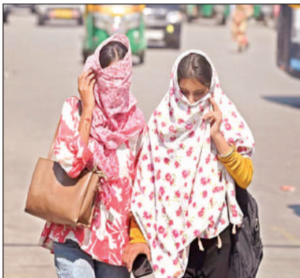
अमृत विचार बारिश के बाद निकली धूप में स्कार्फ बांधकर निकली युवतियां।

लोग पंखे, कूलर और एसी का सहारा लेते रहे। गुरुवार को जिले का अधिकतम तापमान 34 डिग्री, तो न्यूनतम तापमान 28 डिग्री सेल्सियस दर्ज किया गया, जबकि आज का अधिकतम तापमान भी 34 डिग्री व न्यूनतम तापमान 29 डिग्री रहने की संभावना है।