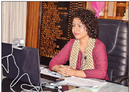
कैम्प कार्यालय से यूट्यूब सत्र में निर्देश देती डीएम।