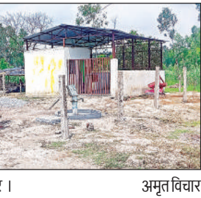
आर आर सेंटर।