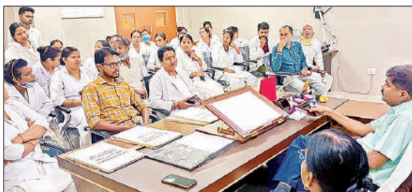
नर्सों को मरीजों को बेहतर चिकित्सीय सुविधा मुहैया कराने के निर्देश देते सीएमएस।

उन्होंने कहा कि मरीज के पास जाकर उसे दी जाने वाली दवाओं का अवलोकन करें और वार्ड छोड़कर कदापि न जाएं। सहयोगी वार्ड बॉय, गार्ड, एमरजेंसी में मौजूद डॉक्टर और इलाज करने वाले डॉक्टर का नंबर पास में अवश्य