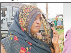
शंकरगढ़ के नारी बारी में अस्पताल संचालक की लापरवाही से महिला की मौत के बाद चौकी पर कार्रवाई की मांग लेकर पहुंचे पीड़ित परिजन।

अमृत विचार : जिले के शंकरगढ़ थाना क्षेत्र स्थित नारीबारी के एक निजी अस्पताल में डॉक्टर की बड़ी लापरवाही सामने आई है। डॉक्टर ने गर्भवती महिला का प्रसव के दौरान ऑपरेशन किया और उसकी यूरिन की नली काट दी। जिससे महिला की हालत बिगड़ गई। हालत बिगड़ने पर डॉक्टर ने महिला को शहर के सरदार पटेल चिकित्सालय भेज दिया। जहां डॉक्टरों ने महिला को भर्ती करने से साफ इनकार कर दिया। परिजन महिला को लखनऊ लेकर भागे, लेकिन प्रसूता की मौत हो गई। घटना के बाद परिजन शव लेकर वापस घर पहुंचे और अंतिम संस्कार कर दिया। परिजनों ने शंकरगढ़ थाने में