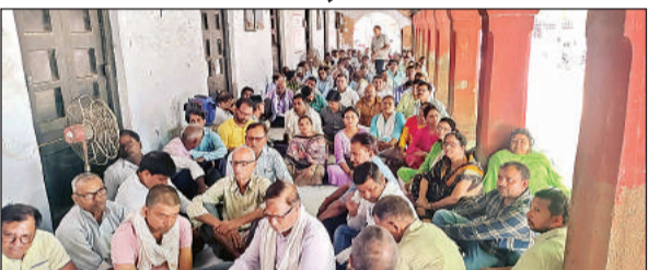
डीआईओएस कार्यालय पर धरना देते शिक्षक नेता।

अमृत विचार। उत्तर प्रदेश माध्यमिक शिक्षक संघ के नेतृत्व में गुरुवार को डीआईओएस कार्यालय पर धरना दिया गया। धरने में 23 बिन्दुओं पर मांग की गई है। इस दौरान शिक्षक नेताओं ने मुख्यमंत्री को संबोधित ज्ञापन डीआईओएस को सौंपा है।