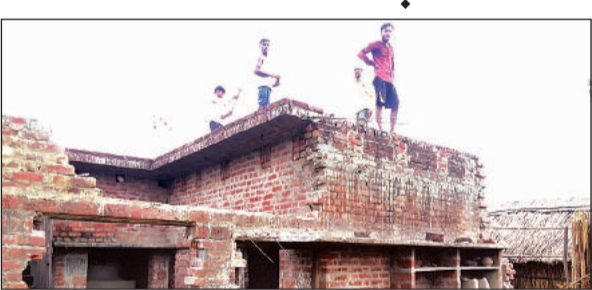
नयापुरवा गांव में खुद का मकान तोड़ते ग्रामीण।

तहसील गोला के विकास खंड बिजुआ क्षेत्र के गांव नयापुरवा में शारदा नदी के कटान की रफ्तार आश्चर्यक तेज हो गई है। पिछले वर्ष इस गांव में बाढ़ के चलते सैकड़ों लोगों को बेघर होना पड़ा था। नयापुरवा गांव में शारदा नदी ने मंगलवार से कटान तेज कर