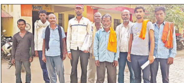
उपजिलाधिकारी को ज्ञापन देने आए ग्रामीण।