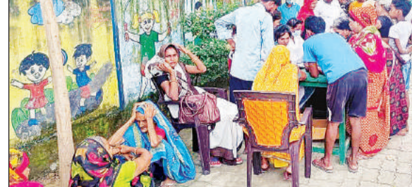
शिविर में जानकारी लेते मरीज।

अमृत विचार। प्रधानमंत्री टीबी मुक्त पंचायत के क्रम में विभाग स्वयंसेवी संस्था के टीबी अलर्ट इंडिया के सहयोग से चार ब्लॉक हरपालपुर, माधौगंज, भरखनी और शाहाबाद के 20-20 ग्राम पंचायतों में परियोजना चला रही है जिसका उद्देश्य दिसम्बर तक इन सभी 80 ग्राम पंचायतों को टीबी मुक्त करना है। इसी क्रम में हरपालपुर के कितियापुर ग्राम में गुरुवार को टीबी जांच शिविर का आयोजन किया गया। यह जानकारी जिला क्षय रोग अधिकारी डा. शरद वैश्य ने दी। जिला क्षय रोग अधिकारी ने