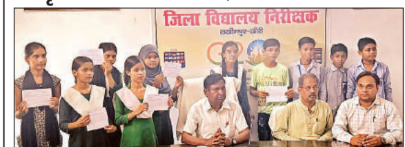
सभागार में डीआईओएस के साथ मौजूद मेधावी छात्र-छात्राएं।

छात्रवृत्ति परीक्षा के विजेताओं को प्रमाण पत्र वितरित