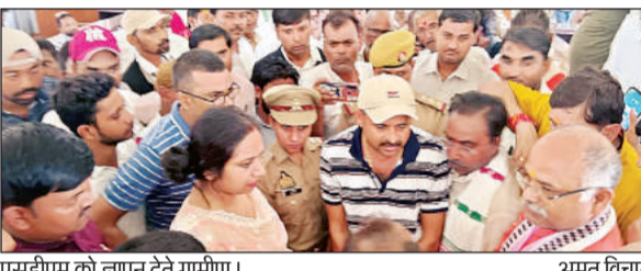
एसडीएम को ज्ञापन देते ग्रामीण।

घर से कोचिंग पढ़ने गई एक छात्रा को कुछ युवक बीती 18 जुलाई को तहसील मुख्यालय कोरांव के समीप बोरें में भरकर उठा ले गए। आरोप है कि वहां उसके साथ गैंगरेप व घटना को अंजाम दिया गया। घटना की जानकारी होने पर पीड़िता के