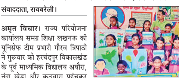
प्रतियोगिता में प्रतिभाग करने वाले बच्चे।