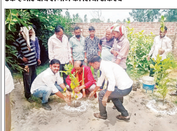
पौधरोपण करते संस्था के लोग।