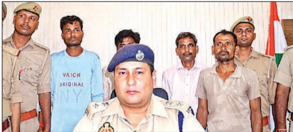
जानकारी देते एसपी व गिरफ्तार किए गए अभियुक्त।

अमृत विचार। महोली कोतवाली इलाके में सोमवार की देर रात कांडा यात्रा निकालने की तैयारी के दौरान रास्ते में ट्रैक्टर खड़ा कर विवाद मामले में पुलिस ने चार अभियुक्तों को गिरफ्तार करने का दावा किया है। पुलिस ने जानलेवा हमले और मारपीट के मामले में हिस्ट्रीशीटर समेत चार अभियुक्तों को गिरफ्तार किया है। गिरफ्तार अभियुक्तों के कब्जे से पुलिस ने दो अवैध असलहों को बरामद करते हुए जेल भेजने की कार्रवाई की है। मालूम हो कि कोतवाली क्षेत्र के बड़ागांव इलाके में कांडा के लिए डीसीएम तैयार करने के दौरान गांव