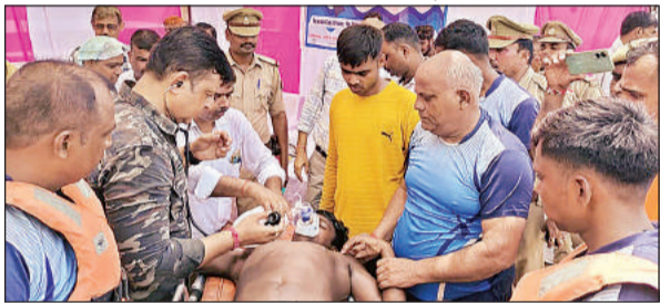
डलमऊ गंगा नदी में डूबे युवक को बाहर निकाल कर उसके बचाव का अभ्यास करती एसडीआरएफ टीम।

अमृत विचार। शासन के निर्देश पर उत्तर प्रदेश राज्य आपदा प्रबंधन विभाग लखनऊ द्वारा गुरुवार को गंगा तट डलमऊ में मॉक एक्सर साइज किया गया। इस दौरान टीम ने बाढ़ के समय डूबने आदि जैसी आपदाओं से निपटने का पूर्वाभ्यास किया। इसमें क्षेत्रीय विभागों द्वारा बड़ चढ़कर हिस्सा लिया गया। सभी विभागों द्वारा अपने-अपने आपदा के समय दी जाने वाली सुविधाओं की एक्सर साइज की गई।