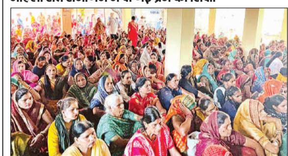
गोला के निरंकारी सत्संग में मौजूद श्रद्धालु।

महिला संत समागम में दी गई प्रेम की शिक्षा