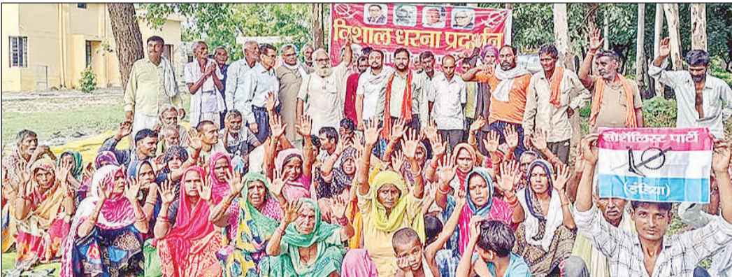
मांगों को लेकर समाजसेवी के नेतृत्व में धरने पर बैठे ग्रामीण।

उत्तर: हाँ बिल्कुल ऑपरेशन के बाद भी यदि मरीज को दर्द या तकलीफ रह जाती है तो आयुर्वेदिक दवाइयों से इलाज किया जा सकता है