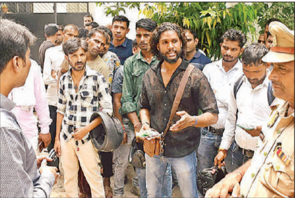
एआरटीओ कार्यालय पर लोगों से पूछताछ करते एसडीएम सदर।

अमृत विचार: सहायक सभागीय परिवहन कार्यालय के बाहर उस समय हड़कंप मच गया जब दोपहर अचानक भारी पुलिस बल के साथ प्रशासन व पुलिस की संयुक्त टीम ने छापा मारा। छापेमारी के दौरान कार्यालय के बाहर दलालों की दुकान पर बैठे मिले 11 संदिग्ध लोगों को पुलिस हिरासत में ले लिया गया। जिन्हें कोतवाली लाकर उनसे पूछताछ की जा रही है। इस कार्यवाही के दौरान मेडिकल बनाने वाले एक शख्स से भी पूछताछ कर सीएमओ कार्यालय से लाइसेंस के संबंध में जानकारी मांगी गई है।