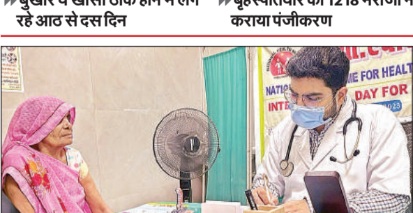
ओपीडी में बुजुर्ग महिला को दवा लिखते जिरियाट्रिक फिजिशियन।

► बुखार व खांसी ठीक होने में लग रहे आठ से दस दिन