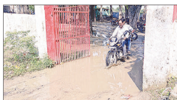
बीआरसी गेट पर कीचड़ व जलभराव के बीच से निकलते लोग।

विकास खण्ड सरकार मुख्यालय ग्राम पंचायत सांडा में स्थित बीआरसी और जूनियर विद्यालय सांडा को इसी गेट से आना जाना होता है। ऐसे में मुख्य मार्ग गेट पर जलभराव की समस्या से विद्यालय आने वाले बच्चों के साथ अध्यापकों को काफी दिक्कतें उठानी पड़ रही हैं। मेन गेट पर जलभराव होने से जहां बच्चों के कपड़े गन्दे हो जाते