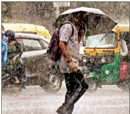
सुबह हुई बारिश में छाता लगाकर निकले लोग।

बारिश के बाद तेज धूप निकलने से उमस भरी गर्मी का असर देखने को मिला। जिससे बचने के लिए