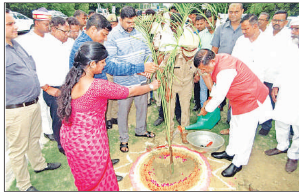
बॉटल पाम का पौधा लगाते नगर विकास राज्यमंत्री।