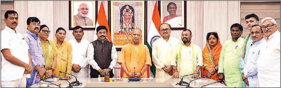
प्रयागराज मंडल के सांसदों व विधायकों के साथ मुख्यमंत्री योगी आदित्यनाथ।

मुख्यमंत्री ने लोकसभा चुनाव के नतीजों वोट प्रतिशत समेत कई बिन्दुओं पर जानकारी ली। पार्टी के वोट प्रतिशत में कमी आने के कारणों के बारे में जानकारी ली। मुख्यमंत्री