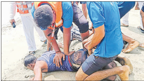
युवक के पेट से पानी निकालते पीएसी के जवान।

अचानक नदी के जलस्तर बढ़ने से अधिक जलभराव होने की सूचना पर प्रशासन ने ग्रामीणों को तत्काल सूचना देते हुए उन्हें पंचायत भवन चहलारी में बनाए गए बाढ़ शरणालय/राहत शिविर में बतवाया की भी मॉक अभ्यास का प्रदर्शन किया गया।