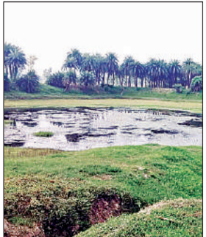
जंगल की जमीन पर बना तालाब।