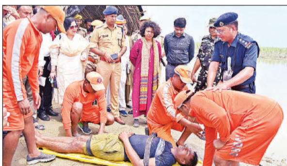
मॉक ड्रिल में डूबते को बचाने का पूर्वाभ्यास करती एनडीआरएफ की टीम। मौके पर मौजूद डीएम-एसपी व अन्य अधिकारी।

गांव श्रीनगर के कर्बला मैदान से डीएम के निर्देशन में एडीएम ने गांव लंगड़ीपुर और गांव गूम के लिए एक-एक टीम रवाना की। पहली टीम बाढ़ के संभावित गांव गूम के लिए रवाना हुई, जहां पहुंचकर टीम ने गांव के लोगों को सुरक्षित स्थान पर ले जाकर बसाया। दूसरी टीम ग्राम लंगड़ीपुर के लिए रवाना हुई। जहां से बाढ़ के पानी में डूबते दो व्यक्तियों को बचाकर राहत शिविर गजोधर प्रसाद इंटर कॉलेज में लाकर चिकित्सा शिविर में लाया गया। घटना स्थल गांव लंगड़ीपुर में शारदा नदी में बाढ़ आने से क्षेत्र दो लोग डूबने लगे। जिनके शोर मचाने और डूबते