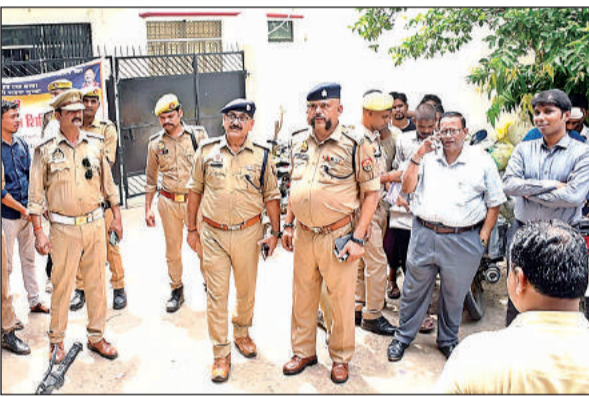
जांच करते एसपी साउथ और एडीएम न्यायिक के साथ सीओ सिटी, एसडीएम सदर।

मारा। अधिकारियों का काफिला के अंदर बाहरी लोगों द्वारा सरकारी कार्यालय में हाथ बटाया जा रहा है। बैट दुकानदार डर के मारे अपनी-अपनी दुकान बंद कर भाग खड़े हुए। वहीं कुछ दुकानें जरूर खुली रहें। इन दुकानों पर संदिग्ध मिलने वाले 11 लोगों को पुलिस ने हिरासत में ले लिया। और उन्हें पूछताछ के लिए कोतवाली भेज दिया। बताया जा रहा है कि एआरटीओ कार्यालय