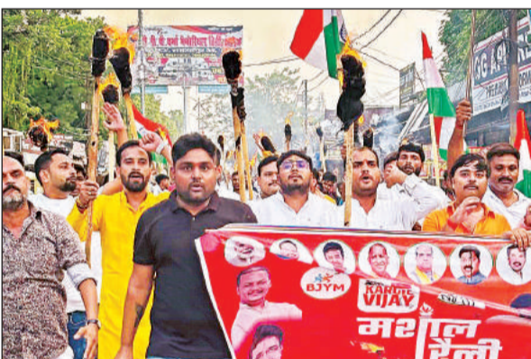
मशाल जुलूस निकालते भारतीय जनता युवा मोर्चा के पदाधिकारी व कार्यकर्ता।