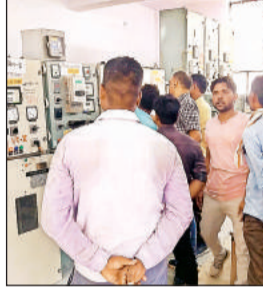
पावर हाउस फीडर को ठीक करते इंजीनियर व विभाग की टीम।

अमृत विचार: बड़ेल पावर हाउस में तकनीकी खराबी आ जाने के कारण इससे जुड़े चार उपकेंद्रों में बिजली आपूर्ति प्रभावित रही। करीब 220 गांवों में बिजली आपूर्ति ठप है। इसके अलावा उपभोक्ता भी गर्मी से बेहाल रहे।