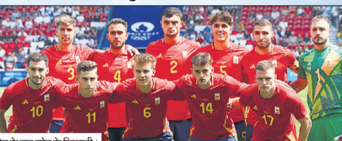
मैच के बाद स्पेन के खिलाड़ी।