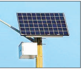
सोलर स्ट्रीट लाइट।

सोलर स्ट्रीट लाइट लगाने के लिए विधान सभावार प्रतिनिधियों ने 20 ग्राम पंचायतों के नाम और निर्धारित स्थलों के प्रस्ताव नेडा को भेजा है। इनमें सांसद, एमएलसी, विधायक शामिल हैं। प्रस्ताव मिलने के बाद नेडा ने पत्रावलियां तैयार कर अनुमोदन के लिए जिलाधिकारी कार्यालय में भेजी है। जिस पर जल्द ही अनुमोदन मिलने की बात कही जा रही है। बताते चलें कि योजना के तहत शासन ने कुर्सी, रामनगर,