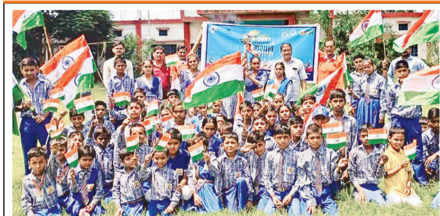
मशाल यात्रा निकालकर ओलंपिक के लिए खिलाड़ियों को दी शुभकामनाएं