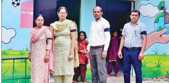
हसनपुर में काली पट्टी बांधकर विरोध जताते शिक्षक।

रूप में भी कार्य करने होते हैं। इनमें स्वास्थ्य विभाग, मतदाता सूची का सर्वे, मिड-डे मील का राशन, गैस, सब्जी, फल आदि की व्यवस्था करनी होती है। उन्हें कर्मचारियों के नजरिए से न देखा जाए। ज्ञापन देने वालों में