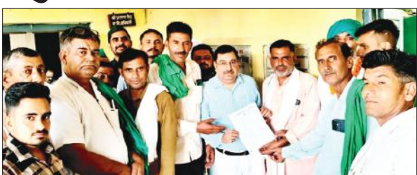
बीडीओ को ज्ञापन सौंपते किसान।

अमृत विचार : भारतीय किसान यूनियन अराजनैतिक की मासिक बैठक ब्लॉक परिसर में आयोजित की गई। इसमें विलाई शुगर मिल का बकाया गन्ने का भुगतान शीघ्र कराए जाने की मांग की। गन्ने का भुगतान न होने पर बड़े आंदोलन की चेतावनी दी गई।