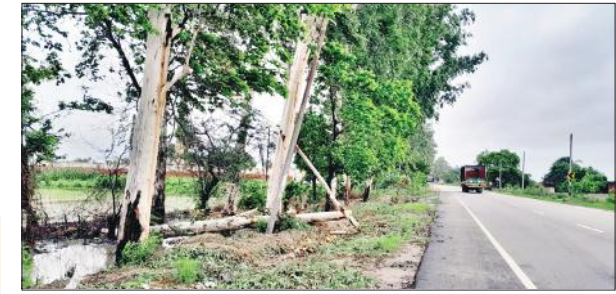
हसनपुर जाने वाले मुख्य मार्ग के किनारे लकड़ी का सहारा देकर रोका गया हाईटेशन लाइन का पोल।

जाए। दोषी बचे नहीं निर्दोष फंसे नहीं इस सिद्धांत पर कार्य करें। प्रभारी मंत्री ने बिजली विभाग के अधिकारी से कहा कि खराब ट्रांसफार्मर 24 घंटे में सही होना चाहिए। कृषि विभाग को पीएम कुसुम योजना का लक्ष्य बढ़ाने और मोटे अनाज की बुआई के लिए किसानों को प्रेरित करने के निर्देश दिए। कहा कि बैंकर्स की बैठक बुलाकर सरकारी योजनाओं का लोगों को लाभ दिलाया जाए। उन्होंने स्वास्थ्य विभागके