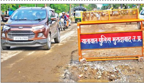
कांठ रोड पर बारिश के बाद धंसी सड़क।

अभियंता, सहायक अभियंता, अवर अभियंता आदि के साथ कांठ रोड व आगे छजलैत तक कांवड़ पट्टी की निरीक्षण कर टूटी सड़कों की मरम्मत कराने और गड्ढों को शीघ्र भर कर रिपोर्ट देने का निर्देश दिया था।