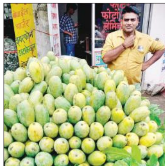
कांड में आम बेचते फल विक्रेता। ● अमृत विचार

कांड, अमृत विचार : तहसील क्षेत्र में हजारों एकड़ भूमि में आम के वृक्ष लगे हुए हैं। कई क्वालिटी के आम यहां से विदेशों को सप्लाई किए जाते हैं। इस वर्ष आंधी कम आने के कारण आम की पैदावार अच्छी हुई है। तहसील क्षेत्र के ग्राम गद्दी, सलेमपुर, अकबरपुर चैधरी, सालावा, मतलब, सदरपुर, उमरी, मुख्तियारपुर नवादा, रायपुर खुर्द, लाडला बाद आदि स्थानों पर कई एकड़ भूमि में आम के वृक्ष लगे हुए हैं। जिन पर दशहरी, चौसा, बनारसी, लंगड़ा आदि की पर्याप्त मात्रा में फसल हुई है। क्षेत्र में सबसे अच्छे आम दशहरी माना गया है जिसका उत्पादन अधिक होने से इस वर्ष मात्र 15 से 30 रुपये प्रति किलो बिक रहा है। बाकी सभी आम 10 से लेकर 25 रुपये किलो तक बिक रहे हैं।