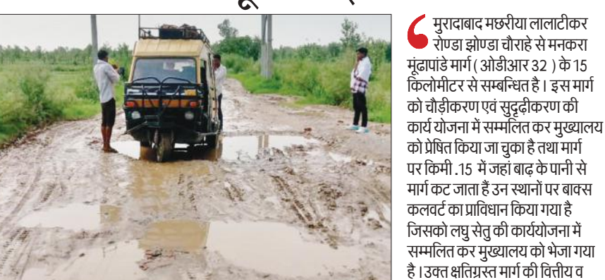
मूंडापांडे के सुल्तानपुर गांव में टूटे संपर्क मार्ग में फंसा टैंपो।

अमृत विचार: लोक निर्माण विभाग के अधिकारियों की लापरवाही सुल्तानपुर और गोविंदपुर गांव के लोगों पर भारी पड़ सकती है। लोगों को बाढ़ का डर सता रहा है। पिछले साल बाढ़ आने से मूंडापांडे ब्लॉक के सुल्तानपुर गांव का संपर्क मार्ग व गोविंदपुर गांव की पुलिया क्षतिग्रस्त हो गई थी। लोक निर्माण विभाग ने सड़क व टूटी पुलिया का निर्माण नहीं कराया। इस लापरवाही से लगभग 40 गांवों के लोगों की मुश्किल बढ़ी है। चीनी मिल द्वारा पुलिया और संपर्क मार्ग को मिट्टी डलवाकर ठीक करा दिया था, लेकिन अब बारिश में पुलिया और सड़क क्षतिग्रस्त हो गईं। पिछले वर्ष रामगंगा नदी में आई बाढ़ ने मूंडापांडे ब्लॉक के तीन दर्जन से ज्यादा गांवों में हलचल मचा कर रख दी थी। महीने भर तक गांव के