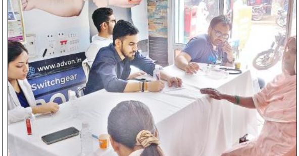
निशुल्क शिविर में मरीजों को दवा लिखते चिकित्सक।