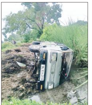
खंडक में पलटी पड़ी वैन।

अमृत विचार : मारुति वैन पलटने से नजीबाबाद के मंदिर में प्रसाद चढ़ाने ने जा रहे एक ही परिवार की दो बालिकाओं सहित सात लोग घायल हो गए। सभी घायलों को उपचार के लिए सीएचसी में भर्ती कराया गया।