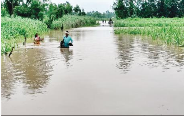
गांव ओसिता जगदेपुर में नदी के पानी के बीच से गुजरते लोग। ● अमृत विचार

अखिल भारतीय साहित्य परिषद की जनपद इकाई की ओर से कन्या गुरुकुल चोटीपुरा में आयोजित अखिल भारतीय संगोष्ठी वसुधैव कुटुंबकम के रूप में मुख्य अतिथि के रूप में प्रतिभाग करेंगे। इस मौके पर कला संस्कृति साहित्य एवं सामाजिक क्षेत्र में योगदान करने वाली विभूतियों को भारत विभूति सम्मान से सम्मानित किया जाएगा। संयोजक डॉ. यतीन्द्र कटारिया ने बताया कि गुरुकुल चोटीपुरा में आयोजित