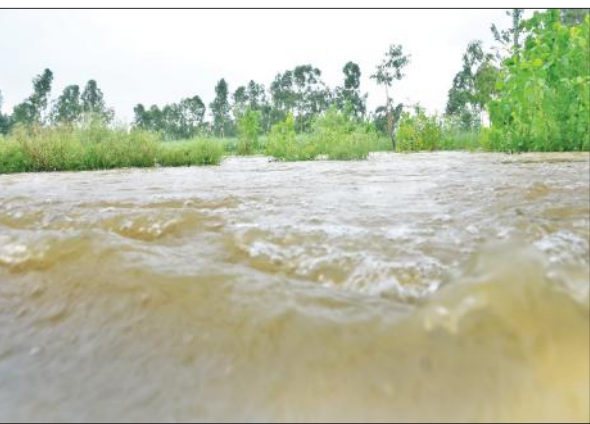
खेतों की तरफ तेजी से बढ़ता डेला नदी का पानी।

पीपलसाना भोजपुर क्षेत्र के अक्का, भीकनपुर, शाहपुर, इस्लामनगर, काफियाबाद, आदमपुर, बसावनपुर, खईया, सियाली, मिलक सहित लगभग एक दर्जन गांवों के लोगों को लगभग 15 किमी का लम्बा सफर तय कर अपने मजिल पर पहुंचना पड़ रहा है। काफियाबाद स्थित खईया खदर में बने श्मशान में भी दो फीट तक पानी भर गया है। बरसात के दौरान गांव में किसी की मौत पर उसका अंतिम संस्कार भी होना मुश्किल होगा। डेला नदी व बरसात का पानी खेतों में भर जाने से किसानों की लगभग चार हजार बीघा फसल बर्बाद हो गई है। भोजपुर पीपलसाना मुख्य मार्ग पर पानी आने से ग्रामीण ट्रैक्टर के सहारे पशुओं का चारा ले जा रहे हैं। ग्रामीणों ने बच्चों को सड़क पर जाने पर रोक दिया है। ग्रामीणों का कहना है कि पुलिस ने भोजपुर पीपलसाना मुख्य मार्ग पर किसी अनहोनी की आशंका को रोकने के लिए ट्रैक्टर ट्राली के आवाजाही पर रोक लगा दी है।