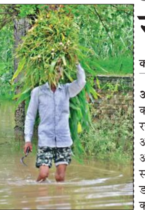
पशुओं के लिए चारा लेकर जाता किसान।

सोमवार को दोपहर एक बजे के बाद डेला बैराज से 12927 वयुसेक पानी छोड़ा गया है। इसके अतिरिक्त पहाड़ों पर बारिश का पानी आने से भी डेला नदी का जलस्तर बढ़ जाता है।