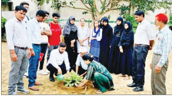
हसनपुर में पौधा लगाते शिक्षक।