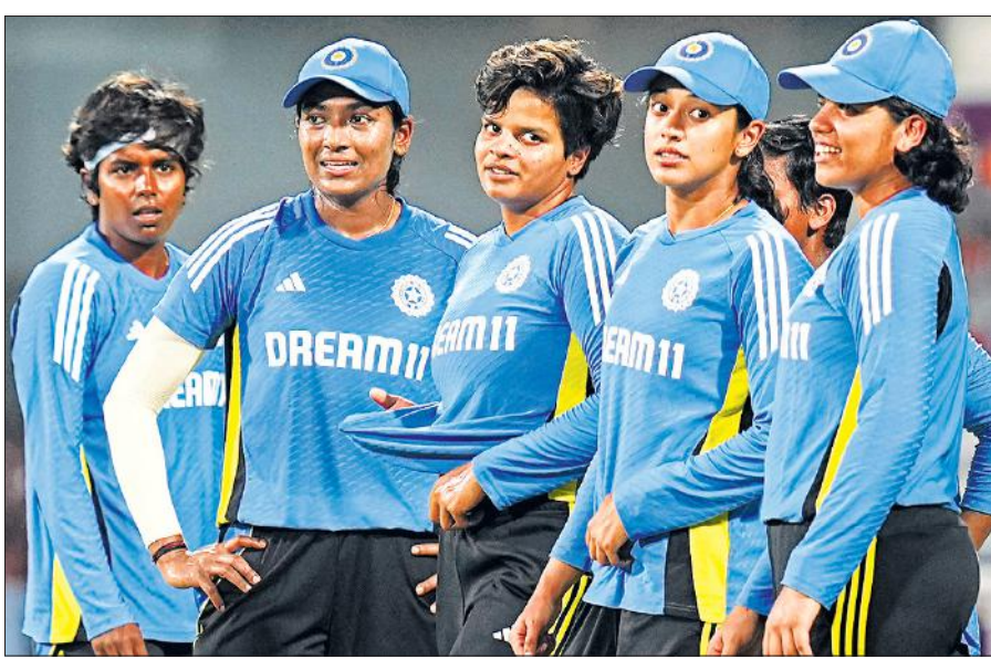
मैच : शाम 07:00 बजे

भारतीय महिला टीम तीन मैचों की टी-20 अंतर्राष्ट्रीय श्रृंखला में मंगलवार को आखिरी मैच में जब दक्षिण अफ्रीका के खिलाफ मैदान में उतरेगी तब उसके सामने जीत दर्ज कर इसे 1-1 से बराबर करने की चुनौती होगी। इसके लिए हालांकि भारतीय गेंदबाजों को अपने प्रदर्शन के स्तर को ऊंचा उठाना होगा जिसके खिलाफ दक्षिण अफ्रीका ने पहले मैच में नौ विकेट पर 189 रन बनाकर 12 रन से जीत दर्ज की। दूसरे मैच में बारिश के कारण भारत को बल्लेबाजी का मौका नहीं मिला लेकिन गेंदबाजों ने इस मुकाबले में भी छह विकेट पर 177 रन लुटाए थे। तीसरे टी20 में पर भी खराब मौसम का खतरा मंडरा रहा है क्योंकि मंगलवार को भी बारिश की 30 से 40 प्रतिशत संभावना है।