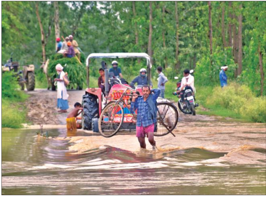
इस्लामनगर- भोजपुर मार्ग पर डेला नदी के तेज बहाव में जान जोखिम में डालकर सड़क पार करते लोग