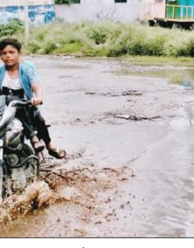
लक्ष्मणगंज वारिसनगर में क्षतिग्रस्त सड़क पर हुए जलभराव से गुजरता बाइक सवार।