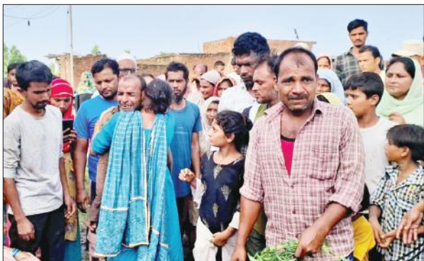
बालिका की मौत के रोते-बिलखते परिजन।