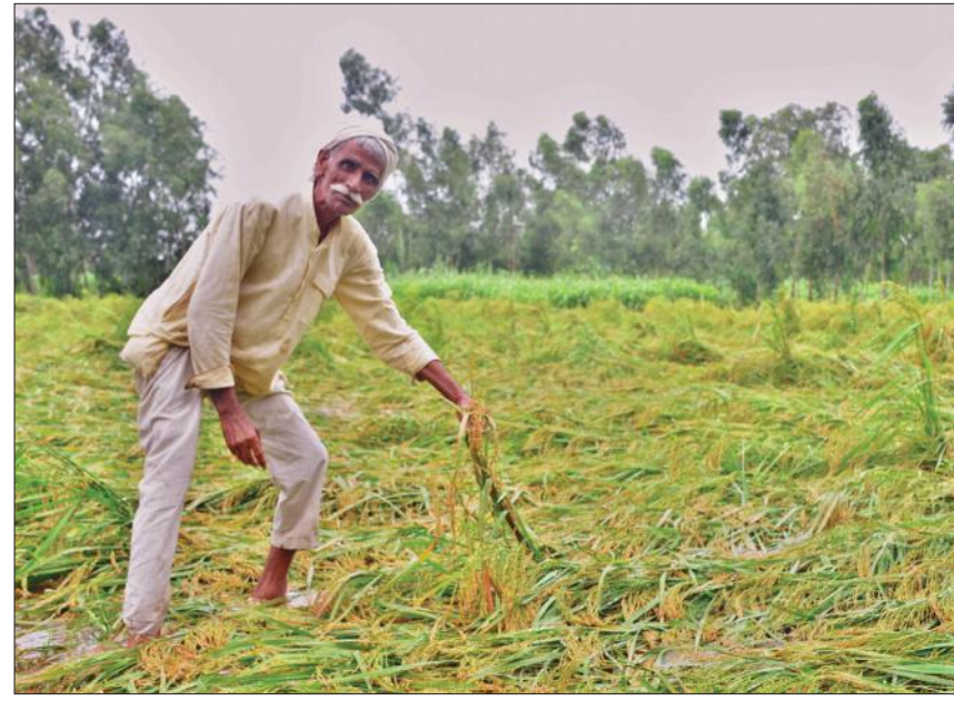
काफियाबाद गांव में बाद के पानी से बर्बाद हुई धान की फसल को दिखाता किसान।

मुद्रादाबाद, अमृत विचार: मैदानी और पहाड़ी इलाकों में हो रही बारिश के चलते रेल संचालन प्रभावित हो रहा है। जिसके चलते सोमवार को मुद्रादाबाद रूट से गुजरने वाली काठगोदाम संपर्क क्रांति, पूर्णागिरी एक्सप्रेस और पैसंजर ट्रेन समेत सात ट्रेनें रद्द रहीं। कोसी नदी पर बने पुल तक बरसात का पानी पहुंचने से रेल मुख्यालय ने ट्रेनों का संचालन रद्द कर दिया। काशीपुर रेल सेक्शन पर बने पुल तक पहुंचने से लालकुआं और काशीपुर से मुद्रादाबाद के बीच चलने वाली पैसंजर ट्रेनों को रद्द किया है। रेलवे के अनुसार काठगोदाम-दिल्ली के बीच चलने वाली काठगोदाम संपर्क क्रांति 15036-35 को रद्द कर दिया। टनकपुर-दिल्ली 12035, टनकपुर-सिंगरौली- 15074 व टनकपुर-दौरई एक्सप्रेस 05097 व रामनगर-मुद्रादाबाद व लालकुआं-मुद्रादाबाद पैसंजर ट्रेन को रद्द किया गया है। इसके अलावा बाघ एक्सप्रेस, नई दिल्ली-काठगोदाम शताब्दी को रुद्रपुर सिटी, दिल्ली-टनकपुर पूर्णागिरी को इज्जतनगर बरेली और लखनऊ काठगोदाम को पतनगर तक संचालित किया गया।