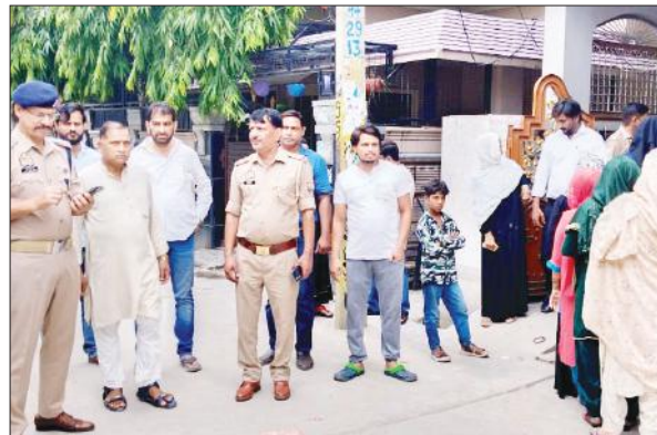
हसनपुर में मतदान के दौरान मौजूद पुलिस।

अमृत विचार : नगर पालिका में सभासद के एक पद के लिए सोमवार को उपचुनाव में वोट डाले गए। इसके बाद मतपेटियों को ब्लॉक के स्ट्रांग रूम में जमा कर दिया गया है। नगर के वार्ड नंबर 17 में सभासद की मौत होने के बाद उपचुनाव कराया गया। यहां तीन प्रत्याशी चुनाव मैदान में थे। सोमवार सुबह सात बजे मतदान शुरू हुआ। दोनों मतदान केंद्रों पर मतदाताओं की लाइन लग गई।