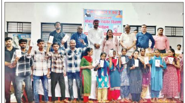
स्मार्टफोन दिखाते विद्यार्थियों के साथ शिक्षक।