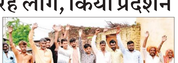
प्रदर्शन करते भोवपुरा के ग्रामीण। ● अमृत विचार

अमृत विचार : विकासखंड गंगेश्वरी की ग्राम पंचायत चचौरा के मझरा भोवपुरा में दो वर्षों से तालाब की सफाई नहीं की गई और न ही रास्तों पर पुलियों के टूटे स्लैब बदले गए हैं। इसे लेकर सोमवार को ग्रामीणों ने प्रदर्शन किया और समस्या के समाधान की मांग की।