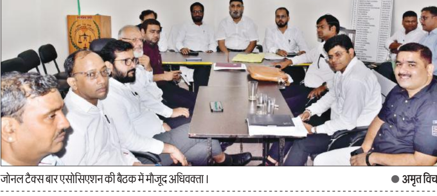
जोनल टैक्स बार एसोसिएशन की बैठक में मौजूद अधिवक्ता।

अमृत विचार: फर्जी रजिस्ट्रेशन कराकर विचार में धोखाधड़ी कर अधिवक्ताओं की छवि खराब करने की कोशिश कर रहे जालसाजों के खिलाफ जोनल बार टैक्स एसोसिएशन ने रणनीति तैयार की है। सोमवार को राज्य कर कार्यालय के मीटिंग हाल में संयुक्त कार्यकारिणी सदस्यों की मौजूदगी में अधिवक्ताओं के हितों को ध्यान में रखते हुए महत्वपूर्ण फैसले लिए गए। अधिवक्ताओं की छवि धूमिल न हो सके इसके लिए कार्यकारिणी सदस्यों की सहमति से तय हुआ कि राज्य कर विभाग के अधिकारियों से व्यापारियों की ओर से कोई भी व्यक्ति इस स्थिति में बातचीत कर सकता है जिससे या तो व्यापारी खुद मौजूद हो, या फिर व्यापारी अपनी फर्म की तरफ से लिखित दस्तावेज