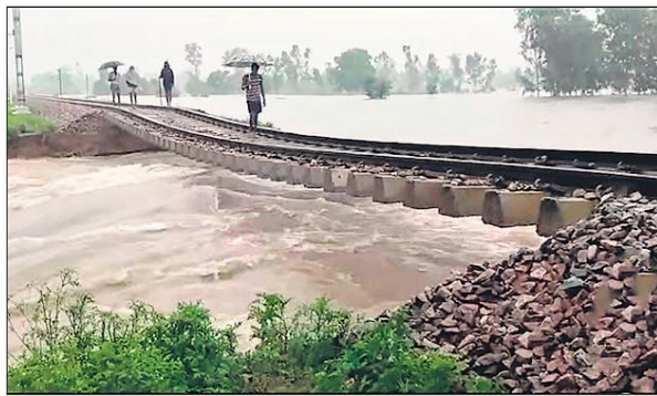
पीलीभीत में शाहगढ़-संडई के बीच पुलिया बहने के बाद लटका रेल ट्रैक।

अमृत विचार : पिछले कई दिनों से पहाड़ों और मैदानी क्षेत्र में लगातार हो रही बारिश के बाद बाढ़ के हालात बन गए। सड़कें, पुलिया कट गईं। दर्जनों गांवों में बाढ़ का पानी घुसा गया। दो लोगों की मौत हो गई। ट्रेन संचालन भी बाधित हो गया।