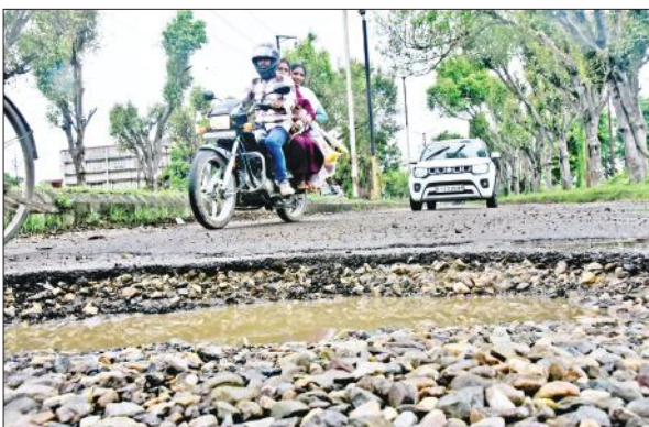
बुद्धि विहार में बारिश के बाद टूटी सड़क।

अमृत विचार: टूटी सड़कों को ठीक करने में ढिलाई नागरिकों पर भारी पड़ रही है। कांठ रोड, रामगंगा विहार, आशियाना, नवीन नगर सहित कई अन्य कॉलोनियों की गलियों व मुख्य सड़क धंसने और टूटने से हादसे का डर बना है। वहीं कांठ रोड पर गड्ढों से कांवड़ यात्रा में शिवभक्तों को परेशानी होगी। जब वह हरिद्वार से भोलेनाथ का जलाभिषेक करने के लिए गंगा जल भरने जाएंगे और कांवड़ लेकर लौटेंगे। बरसात के पहले से टूटी सड़कों की हालत बारिश का पानी भरने से और खराब हो गई है। कांठ रोड पर पीएसी तिराहे से लेकर कांसमास हास्पिटल और उसके आगे भी कई जगह कांवड़ पट्टी पर सड़कों में गड्ढे बन गए हैं। 22 जुलाई से शुरू हो रही कांवड़ यात्रा में मुद्रादाबाद के अलावा रामपुर, बरेली व आसपास के कई अन्य जिलों से शिवभक्त गंगा जल भरने हरिद्वार जाते हैं। ऐसे में कांठ रोड के क्षतिग्रस्त होने और कांवड़ पट्टी टूटी होने से शिवभक्तों के पैरों में कंकड़ चुभेंगे। गड्ढों में उनके वाहन फंसने से हादसे की आशंका भी बढ़ गई है। हालांकि जिलाधिकारी अनुज सिंह ने पिछले सप्ताह बारिश पुलिस अधीक्षक सतपाल अतिल और लोकनिर्माण विभाग के प्रांतीय खंड के अधिशासी