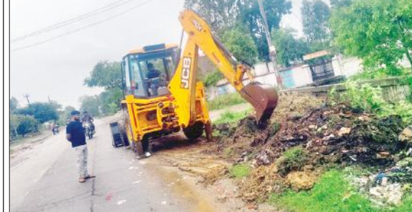
कांवड़ पथ पर कूड़ा हटाती जेसीबी।