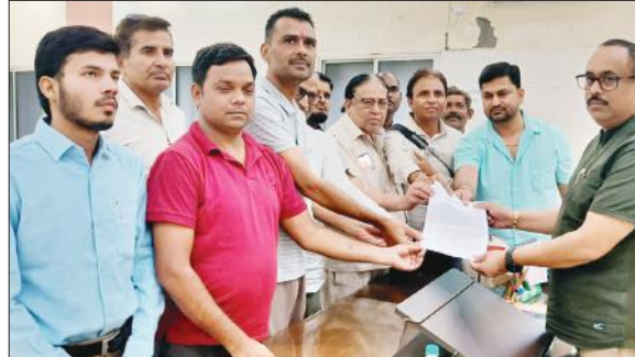
ज्ञापन सौंपते सामाजिक नागरिक संगठन के कार्यकर्ता।

सोमवार को संगठन के कार्यकर्ता एकत्र होकर नगर पालिका परिषद पहुंचे। जहां उन्होंने पालिका अध्यक्ष के नाम अधिशासी अधिकारी को सौंपे गए ज्ञापन में बताया कि राजकीय आयुर्वेदिक एवं यूनानी चिकित्सालय के लिए जो भूमि नगर पालिका परिषद द्वारा आयुर्वेदिक चिकित्सालय को दी गई थी। आरोप लगाया कि उस पर हेराफेरी कर नौ जून 2022 से 26 फरवरी 2024