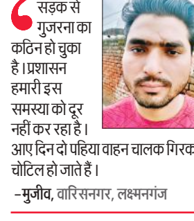
सड़क से गुजरना का कठिन हो चुका है। प्रशासन हमारी इस समस्या को दूर नहीं कर रहा है।

से गुजरते रहते हैं। इसके बावजूद भी पालिका इस ओर ध्यान नहीं दे रही है। कई बार इस मार्ग को दुरुस्त कराने की मांग की जा चुकी है, लेकिन कोई सुनने वाला नहीं है।