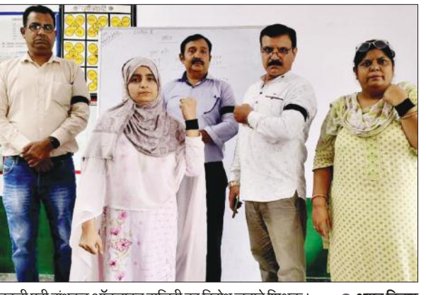
काली पट्टी बांधकर ऑनलाइन हाजिरी का विरोध जताते शिक्षक।

ऑनलाइन हाजिरी के विरोध में जिलेभर के सैकड़ों शिक्षक तीन बजे से ही कलेक्ट्रेट स्थित मुशायरा ग्राउंड पर जुट गए थे। इस दौरान जिलाध्यक्ष ने कहा कि प्रदेशीय नेतृत्व द्वारा कई बार महानिदेशक स्कूल शिक्षा को ज्ञापन सौंपकर डिजिटाइजेशन से जुड़ी मौलिक समस्याओं को दूर करने की मांग की गई है। बीती 14 मार्च को महानिदेशक स्कूल शिक्षा कार्यालय में धरना भी दिया गया था। तब महानिदेशक द्वारा संगठन के प्रतिनिधि मंडल को आशवासन दिया गया था कि डिजिटाइजेशन से जुड़ी मौलिक समस्याओं के निस्तारण के पश्चात ही इसे लागू किया जाएगा।