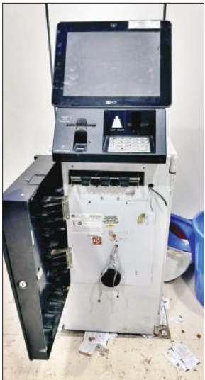
बिलासपुर में तोड़ा गया एटीएम।

अमृत विचार : रविवार तड़के पांच बजे एक व्यक्ति ने एटीएम तोड़कर पैसे निकालने का प्रयास किया। सूचना पर बैंक प्रबंधक मौके पर पहुंच गए। उन्होंने थाने में अज्ञात के खिलाफ तहरीर दी। इसके आधार पर पुलिस ने रिपोर्ट दर्ज कर ली है।