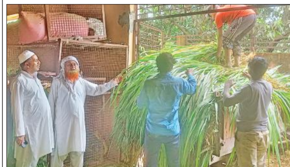
कान्हा गोशाला का निरीक्षण करते नगर पंचायत अध्यक्ष।