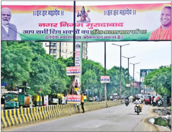
कांट रोड पर निगम द्वारा शिव भक्तों के स्वागत के लिए लगाया गया हॉटिंग।