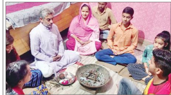
बिलारी के प्रेम शांति सदन में गायत्री यज्ञ करते साधक।