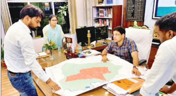
डीएम को नगर पालिका में शामिल 39 गांवों का मानचित्र दिखाते आरडीए के अधिकारी

कलेक्ट्रेट सभाभार में रविवार को हुई समीक्षा बैठक में जिलाधिकारी ने स्थानीय निकाय व रामपुर विकास प्राधिकरण के अधिकारियों से जानकारी ली। नगर पालिका परिषद क्षेत्र से सटे 39 ग्रामों को नगर पालिका में शामिल करने की कार्रवाई जारी है। नगर पालिका परिषद के अधिशासी अधिकारी ने इन गांवों को शामिल करने के लिए मानचित्र तैयार कर जिलाधिकारी के सामने प्रस्तुत किया। 39 गांवों के नगर पालिका में शामिल होने से ग्रामवासियों को नगरीय सुविधाओं का लाभ मिलेगा। नगर पालिका की आय में भी वृद्धि होगी। नगर पालिका बिलासपुर में भी 11 गांवों को शामिल