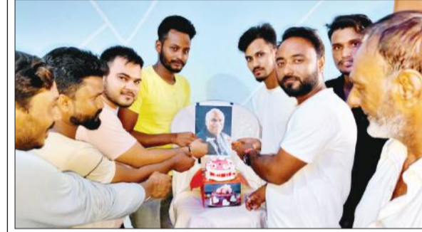
ठाकुरद्वारा में राष्ट्रीय अध्यक्ष का जन्मदिन मनाते कांग्रेस कार्यकर्ता।