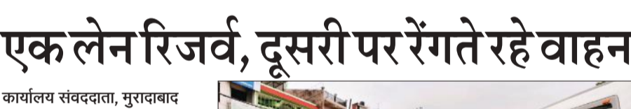
रविवार को राष्ट्रीय राजमार्ग पर जाम में फंसे वाहन।

अमृत विचार: कांवड़ियों की सुरक्षा को लेकर लागू किए गए रूट डायवर्जन से दिल्ली-लखनऊ राष्ट्रीय राजमार्ग पर ट्रैफिक व्यवस्था फेल हो गई। रविवार को श्रद्धालुओं के लिए हाईवे की एक लाइन को रिजर्व कर दिया। वहीं दूसरी पर कई किलोमीटर तक वाहन रेंगते रहे। एक लेन पर आवाजाही से लोगों को परेशानी झेलनी पड़ी। रविवार को महानगर से जीरो प्वाइंट से आगे तक कई किलोमीटर तक जाम लगा रहा। श्रद्धालुओं की आस्था का सम्मान करते हुए पुलिस प्रशासन ने हाईवे की एक लाइन को रिजर्व कर दिया। इसकी वजह से दिनभर वाहन रेंगते रहे। खासकर हाईवे पर पूरी तरह से प्रतिबंधित है। इसके लिए रूट डायवर्जन प्लान लागू किया गया है। पूरे रूट पर जगह-जगह पुलिस की टीमों कांवड़ियों की सुरक्षा