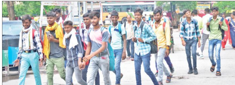
रेलवे स्टेशन पर ट्रेनें के इंतजार में भटकते यात्री।

मुरादाबाद रेल मंडल के अमरोहा रेलवे स्टेशन पर शनिवार शाम मालगाड़ी बेचटरी होने से रेलवे लाइन क्षतिग्रस्त हो गई थी। जिससे कई ट्रेनें प्रभावित हो गई थीं। देर रात में ही रेलवे अधिकारियों ने घटना स्थल पर डेरा डालकर राहत और बचाव कार्य शुरू करा दिया था। 16 घंटे तक युद्धस्तर पर चले कार्य के बाद रविवार को अप और डाउन लाइन पर रेल संचालन शुरू करा दिया। जिसके बाद दोपहर में अप