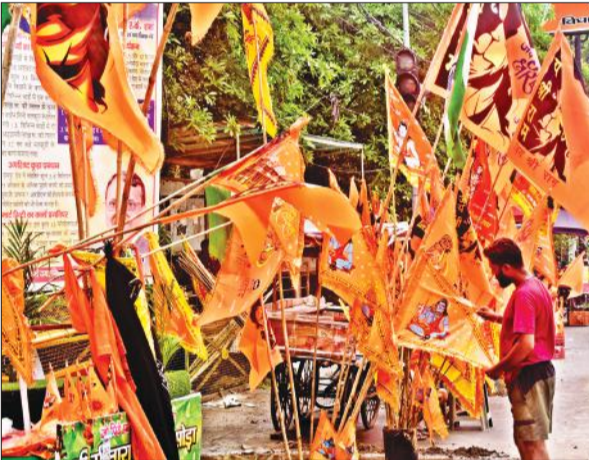
वौ. चरण सिंह चौक पर भावा झंडा पसंद करता युवक।

अमृत विचार: सावन माह का पहला सोमवार आज है। बाबा भोलेनाथ के भक्त पूरी श्रद्धा और आस्था के साथ उनका जलाभिषेक करेंगे। तड़के से ही शिवालयों में जलाभिषेक शुरू हो जाएगा। जिसके लिए शिवालयों में विशेष तैयारियों की गई हैं। वहीं रविवार को महानगर की सड़कों पर आस्था का सैलाब दिखा। पूरे दिन बम-बम भोले और हर हर महादेव की गूंज रही। शिवभक्त हरिद्वार व बृजघाट से जलाभिषेक के लिए गंगाजल लेकर अपने गंतव्यों की ओर रवाना हुए। इस दौरान कांवड़िए डीजे की धुन पर झूमते नजर आए।