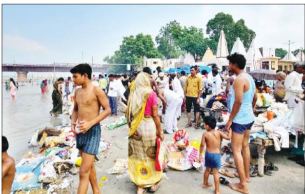
राजघाट गंगा तट पर उमड़े श्रद्धालु।

या फिर जो एआरटीओ के यहां पंजीकृत होंगे उन वाहनों में बच्चों को भेजना सुरक्षित है। स्कूल वाहन का लाइसेंस जारी होता है। जिन वाहनों के पास स्कूल वाहन का लाइसेंस होगा