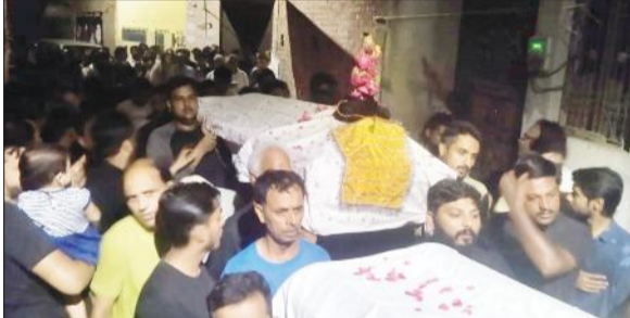
शबीहे ताबूत का जुलूस निकालते शिया समाज के लोग।