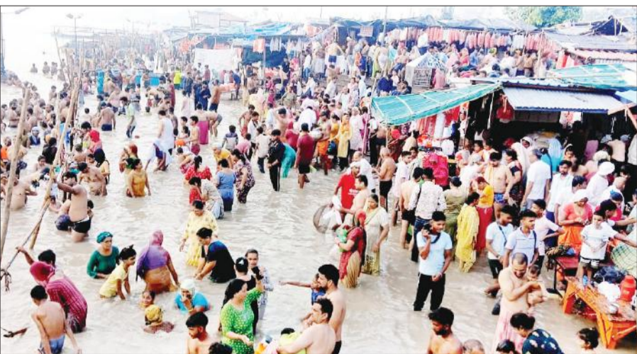
बृजघाट पर गंगा में गुरु पूर्णिमा पर स्नान करते श्रद्धालु।

अमृत विचार : गुरु पूर्णिमा पर हजारों श्रद्धालुओं ने बृजघाट व तिगरी गंगा में आस्था की डुबकी लगाई। रविवार को सुबह से ही गंगास्नान के लिए श्रद्धालुओं की भीड़ जुटनी शुरू हो गई थी। श्रद्धालुओं ने गंगा स्नान कर परिवार की सुख-शांति एवं समृद्धि की कामना की। अमरोहा, मुरादाबाद, हापुड़, संभल, दिल्ली आदि से आए श्रद्धालुओं ने रविवार सुबह बारिश के बीच बृजघाट में गंगा में स्नान किया। दोपहर तक गंगास्नान के लिए श्रद्धालु गंगा घाट पर पहुंचते रहे। श्रद्धालुओं ने गंगा में स्नान कर परिवार व समाज में सुख-शांति एवं समृद्धि की कामना की। मंदिरों में पूजा-अर्चना कर जकरुतमंदों को दान देकर पुण्य लाभ कमाया। उधर,