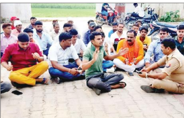
बजरंग दल कार्यकर्ताओं के पास बैठकर उन्हें मनाने का प्रयास करते थाना प्रभारी।