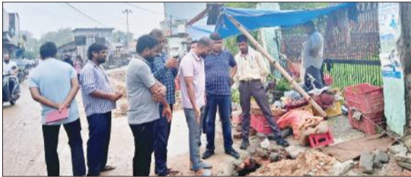
पाइप लाइन योजना का निरीक्षण करते पालिका अध्यक्ष व अधिशासी अधिकारी।