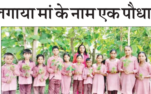
स्कूल में पौधों के साथ खड़े बच्चे व शिक्षिका।