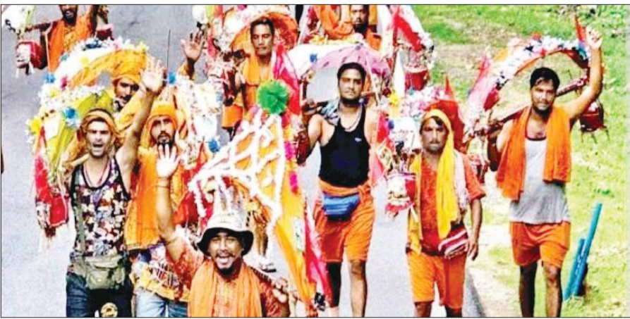
कांट से गुजरते कांठड़िये।

नगर से डीजे की धुनों और बाइकों पर लगे साउंड सिस्टम पर चल रहे भजनों पर थिरकते हुए कांठड़िये हरिद्वार से गंगाजल लेकर लौटने लगे हैं। वहीं हरिद्वार के लिए भी कांठड़ियों के जत्थे रवाना भी हो रहे हैं। भक्ति का माहौल है और चारों ओर भगवान शिव शंकर के जयकारे गूंज रहे हैं। खास बात यह रही कि बारिश में भी शिवभक्तों के कदम नहीं रुक रहे हैं और वे शिवालयों की ओर कूच करते नजर आए। सावन के प्रथम सोमवार पर भगवान शिव के जलाभिषेक के