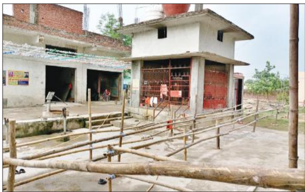
भमरोआ मंदिर में की गई बैरिकेडिंग।

उत्साह से पौधरोपण में सहयोग दिया। पीपल का पौधा लगाने के बाद प्रबंधक ने कहा कि प्रधानमंत्री द्वारा चलाए गए इस महा अभियान ने पूरे देश में जन अभियान का स्वरूप ले लिया है। वृक्षों की कटाई से पर्यावरण का संतुलन बिगड़ रहा है। तापमान में वृद्धि हो रही है। इसलिए पर्यावरण का संतुलन आवश्यक है। प्रबंध निदेशक