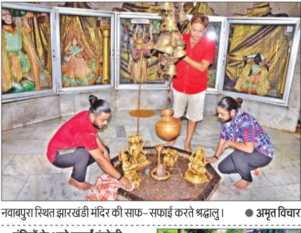
नवाबपुरा स्थित झारखंडी मंदिर की साफ-सफाई करते श्रद्धालु।

अमृत विचार: श्रावण महीने के पहले सोमवार को महानगर के शिवमंदिरों पर जलाभिषेक किया जाएगा। इसको देखते हुए नगर निगम प्रशासन ने मंदिरों के आसपास सफाई कराने के साथ ही मुख्य द्वार रंगोली बनाई। सड़क किनारे व मंदिर के आसपास के झाड़ियों की कटाई कर चूने का छिड़काव कराया। श्रावण महीने में कांवड़ यात्रा को देखते हुए कांट रोड व दिल्ली रोड पर नगर निगम की ओर से भव्य स्वागत द्वार लगाया गया। कांवड़ रूट पर सफाई कराकर झाड़ियों की कटान कराई गई। महानगर के चौरासी घंटा मंदिर, झारखंडी शिव मंदिर सहित अन्य मंदिरों के आसपास सफाई कराकर मंदिरों के मुख्य द्वार रंगोली बनाई गई। कांट रोड पर सड़क किनारे उगी घासों