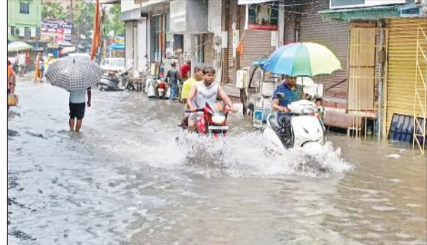
मिरतन गंज चौराहे में भरे पानी से गुजरते लोग।

महानसून में जलभराव से निपटने के लिए पालिका के अधिकारियों ने तमाम इंतजाम किए गए थे। अधिकतर नालों की तलीझाड़ सफाई कराई थी। इस पर लाखों रुपये भी खर्च किए, लेकिन शहरवासियों को जलभराव से निजात नहीं मिल सकी। रविवार को हुई मूसलाधार बारिश से नाले, नालियां ओवरफ्लो हो गईं।