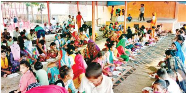
गुमथल में भंडारे में प्रसाद ग्रहण करते श्रद्धालु।