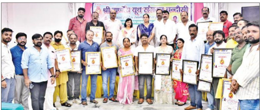
समारोह में सम्मानित वार्षीय समाज के लोग।

अमृत विचार : श्री वार्षीय यूथ संगठन की ओर से 11 अप्रैल को वार्षीय समाज के कुलप्रवर्तक श्री अक्रूरजी महाराज के जन्मोत्सव पर शोभायात्रा निकाली गई। शोभायात्रा को भव्य बनाने में वार्षीय समाज के विभिन्न लोगों ने अपना सहयोग एवं योगदान दिया। जिन्हें रविवार को समारोह पूर्वक वार्षीय शिरोमणि उपाधि से सम्मानित किया गया।