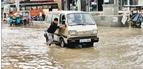
अमरोहा मार्ग पर पानी में बंद वाहन को धक्का लगाता चालक।