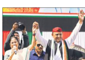
● ममता बनर्जी ने शरणार्थियों पर संयुक्त राष्ट्र का हवाला दिया

पश्चिम बंगाल की मुख्यमंत्री ममता बनर्जी ने रविवार को कहा कि बांग्लादेश में बढ़ती हिंसा के मद्देनजर वह पड़ोसी देश में संकट में फंसे लोगों के लिए अपने राज्य के दरवाजे खोलें रखेंगी और उन्हें शरण दिया जाएगा। बनर्जी ने संभावित मानवीय संकट पर अपने रुख को न्यायोचित ठहराने के लिए शरणार्थियों पर संयुक्त राष्ट्र के संकल्प का हवाला दिया। उन्होंने कोलकाता में तृणमूल कांग्रेस की शहीद दिवस रैली में कहा मुझे बांग्लादेश के मामलों पर नहीं बोलना चाहिए क्योंकि वह एक संप्रभु राष्ट्र है और इस मुद्दे पर जो कुछ भी कहा