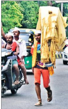
हरिद्वार से गंगा जल लेकर आता शिव भक्त।