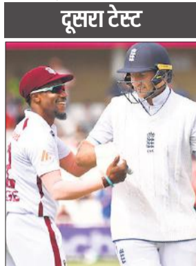
दूसरा टेस्ट 122 रनों की पारी खेलने के बाद पवेलियन लौटते जो रूट

वेस्टइंडीज के सबसे सफल गेंदबाज जॉर्डन सील्स (97 देकर 4 विकेट) ने ब्रूक को आउट करके यह साझेदारी तोड़ी। इसके बाद रूट ने एक छोर संभाले रखा लेकिन दूसरी तरफ से उन्हें पर्याप्त सहयोग नहीं मिला। ब्रूक ने अपनी पारी में 132 गेंद का सामना करते हुए 13 चौके लगाए। जेसन होल्डर ने रूट