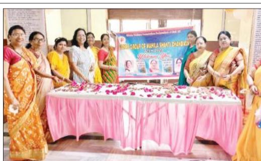
गुरु पूर्णिमा पर दीपोत्सव मनाती महिला शक्ति की सदस्य।