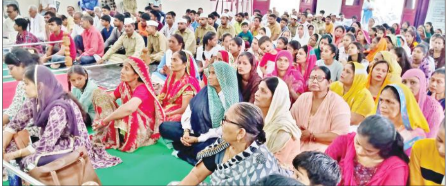
ठाकुरद्वारा स्थित निरंकारी भवन में संगत में भाग लेते श्रद्धालु।

रविवार को आयोजित साध संगत में प्रचारक ने कहा कि पूर्ण सतगुरु ब्रह्म ज्ञान को रोशनी से संसार का पथ-प्रदर्शन करने आता है और मोक्ष प्रदान करता है। उन्होंने कहा कि जब धरती पर धर्म की हानि होती है, तब परमात्मा को सद्गुरु के रूप में अवतार लेना पड़ता है और अपने भक्तों को ब्रह्म ज्ञान देकर उनका कल्याण करते हैं। सद्गुरु सदैव अभियान मिटाने आते हैं। ब्रह्म ज्ञानी