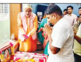
गुरु पूर्णिमा पर वेद व्यास जी के चित्र पर पुष्प अर्पित करते समिति के सदस्य।