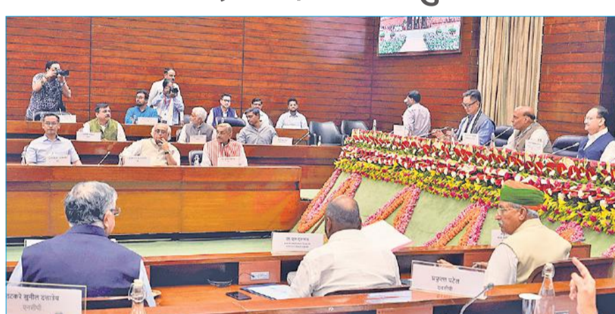
नई दिल्ली में बजट सत्र से पूर्व सर्वदलीय बैठक की अध्यक्षता करते राजनाथ सिंह।

इतना ही नहीं, सरकार के सहयोगी और महत्वपूर्ण मौकों पर उसका साथ देने वाले अन्य दलों ने भी अपने-अपने राज्यों के विशेष दर्जे का मुद्दा उठाते हुए केंद्र को अपनी प्राथमिकताओं से अवगत कराया और अपने भावी रुख का मुजाहिरा किया। सरकार ने सत्र से पहले होने वाली इस पारंपरिक बैठक में कई छोटे दलों को आमंत्रित किया और सभी मुद्दों पर चर्चा करने की अपनी इच्छा व्यक्त की। संसदीय कार्य मंत्री किरेन रीजीजू ने उन्होंने संसद को सुचारू रूप से चलाने के लिए सभी