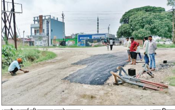
भमरोआ मांग की मरम्मत करते मजदूर।