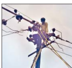
पोल पर चढ़ा बिजली कर्मी।

चन्दौसी, अमृत विचार : मंडी समिति स्थित रेलवे फाटक पर ओवरब्रिज का निर्माण कराया जा रहा है। विद्युत विभाग के कर्मचारियों ने रविवार को रेलवे फाटक से आसपास से गुजर रही विद्युत लाइनों को हटा दिया। जिससे सुबह छह बजे से रात नौ बजे मौलागढ़ फीडर की बिजली बंद रही। रविवार की सुबह छह बजे विद्युत विभाग के कर्मचारी मंडी समिति स्थित रेलवे फाटक पहुंच गए। रविवार को विद्युत कर्मचारियों ने हाईटेशन लाइन के पोल हटाने का कार्य आरंभ कर दिया। विद्युत लाइन हटने के बाद बहजोई रोड पर ओवरब्रिज निर्माण का कार्य दो से तीन दिन में आरंभ कर दिया जाएगा। फिलहाल मंडी समिति के सामने कार्य जारी है। वहीं विद्युत लाइन हटने को लेकर मौलागढ़ फीडर के क्षेत्र विकास नगर, मौलागढ़, शक्ति नगर, गोशाला रोड आदि क्षेत्रों की विद्युत आपूर्ति टप रही है। जिससे उभयोक्ताओं को उमस भरी गर्मी में परेशानी उठानी पड़ी।