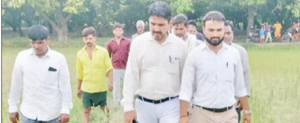
थूनापुर गांव में जांच करती राजस्व विभाग की टीम।