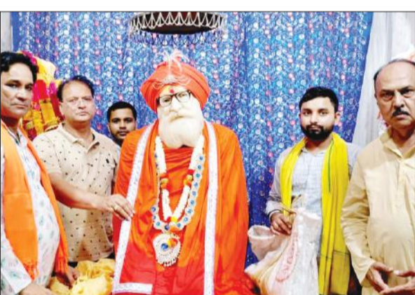
हरिबाबा आश्रम पर बाबा का दर्शन पूजन करते श्रद्धालु।

हरिबाबा बांध धाम पर गुरु पूर्णिमा के मौके पर रविवार को सुबह से ही श्रद्धालुओं का जनसेलाब उमड़ पड़ा। सुबह चार बजे से ही श्रद्धालु कतारों में खड़े हो गए और आगे बढ़कर हरिबाबा के दर्शन पूजन करते रहे। श्रद्धालुओं ने हरि बाबा के दर्शन कर दूध और जल से अभिषेक कर आशीर्वाद लिया। इस बीच तेज बारिश शुरू हो गई तो श्रद्धालु