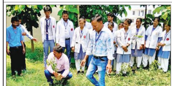
चन्दौसी के राधागोविंद में पौधरोपण करते विद्यार्थी व स्टाफ।