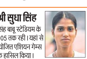
लेकिन आज तक यहां रहने वाली बालिकाओं के लिए सिंथेटिक ट्रैक तक नहीं बिछाया जा सका। पद्मश्री सुधा सिंह ने यहां से ही अपने खेल कैरियर की शुरुआत की। उन्होंने कई बार छात्रावास की लड़कियों को ट्रैक पर अभ्यास की सुविधा देने

पद्मश्री सुधा सिंह ने बताया कि वह केडी सिंह बाबू स्टेडियम के एथलेटिक्स छात्रावास में वर्ष 2001 से 2005 तक रही। यहां से प्रशिक्षण लेने के बाद 2010 में चीन में आयोजित एशियन गेम्स में 3000 मीटर स्टीपल चेंज में स्वर्ण पदक हासिल किया। इसके बाद 2018 में एशियन गेम्स में इसी स्पर्धा में रजत जीत कर देश का मान बढ़ाया। एथलेटिक्स के खिलाड़ियों के लिए सिंथेटिक ट्रैक तो होना ही चाहिए। जब लड़कियां मिट्टी के मैदान में अभ्यास करेगी तो परिणाम कैसे सामने आयेगा।