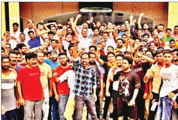
कलेक्ट्रेट पर प्रदर्शन करते सफाई कर्मचारी।