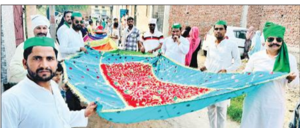
दरगाह पर चादरपोशी करने जाते भाकियू के कार्यकर्ता।