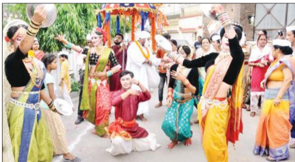
साईं पालकी यात्रा में नृत्य करते कलाकार।