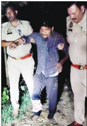
मुठभेड़ के बाद गिरफ्तार आरोपी।

अमृत विचार : बरेली कॉलेज में बीए और बीएससी जीव विज्ञान प्रथम वर्ष की रिक्त सीटों पर प्रवेश के लिए सोमवार को चौथी मेरिट जारी की जाएगी। वहीं तीसरी मेरिट में शामिल छात्रों को सोमवार दोपहर 3 बजे तक शुल्क जमा कर प्रवेश का एक और मौका दिया जाएगा। बीए की 18 फीसदी और बीएससी जीव विज्ञान की 22 फीसदी सीटें ही रिक्त रह गई हैं। बीए, बीएससी और बीकॉम में 15 जुलाई से प्रवेश शुरू हुए हैं। अब तक तीन मेरिट जारी की जा चुकी हैं। बीए की 1840 सीटों में अब तक 1504 पर प्रवेश हो चुके हैं और 336 सीटें रिक्त रह गई हैं। इसके अलावा बीएससी जीव विज्ञान की 720 सीटों में 556 पर प्रवेश हो चुके हैं और सिर्फ 164 शेष रह गई हैं। चौथी मेरिट जल्द आएगी और इसके बाद