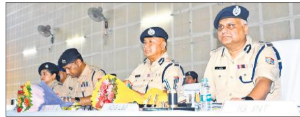
हरिद्वार में कांवड़ मेले को लेकर ब्रीफिंग करते पुलिस अफसर।

अमृत विचार : सोमवार से शुरू हो रही कांवड़ यात्रा को लेकर राज्य सरकार ने सभी जिलों के स्थानीय प्रशासन को सतर्कता बरतने के निर्देश दिये हैं। सरकार के निर्देश पर राज्य की पुलिस मुस्तैद भी हो गई है। पूरे प्रदेश में कांवड़ यात्रा की निगरानी ड्रोन से की जाएगी। वाराणसी में काशी विश्वनाथ मंदिर में दर्शन के लिए पुख्ता इंतजाम किए गए हैं। वहीं उत्तराखंड पुलिस प्रशासन ने भी कांवड़ यात्रा को लेकर सुरक्षा व्यवस्था चाक-चौबंद कर ली है। शासन के अधिकारियों ने बताया