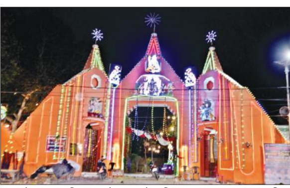
संभल में पक्का बाग स्थित पातालेश्वर महादेव मंदिर।

संभल नगर के सूर्यकुंड तीर्थ मंदिर, बहजोई मार्ग पर पक्का बाग स्थित सिद्धपीठ श्री पातालेश्वर महादेव मंदिर, फतेहपुर भाऊ स्थित प्रकटेश्वर महादेव मंदिर, गुमसानी के झारखंडी महादेव मंदिर, बहजोई के सादात बाड़ी शिव मंदिर के अलावा गुनौर, जुनावई, रजपुरा और सौधन क्षेत्र के शिव मंदिरों पर विशेष सफाई, रंगाई और सजावट कराई गई है। सोमवार को सुबह से ही भक्त मंदिरों का रुख करेंगे। मंदिरों में भगवान शिव का जलाभिषेक करते हुए पूजा अर्चना की जाएगी। भक्तों की सुरक्षा के मद्देनजर शिव मंदिरों पर पुलिस बल की तैनाती कर दी गई है।