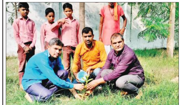
रविवार को सड़क किनारे पौधरोपण करते शिक्षक।