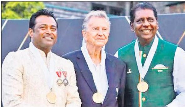
टेनिस हॉल ऑफ फेम में शामिल हुए लिण्डर पेस और विजय अमृतराज।