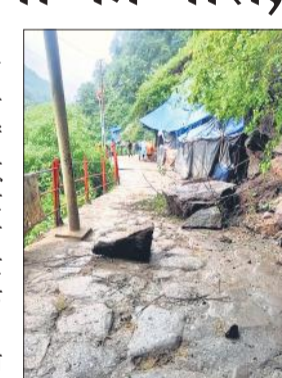
गए। सूचना पर एसडीआरएफ की टीमों मौके पर पहुंची और बचाव अभियान चलाया। मृतकों में दो महाराष्ट्र व एक उत्तराखंड का निवासी था।