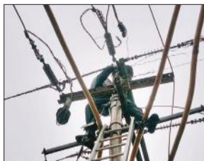
डूंगरपुर क्षेत्र में तार टूट करते कर्मचारी।

अमृत विचार : रविवार को बारिश से शहर को विद्युत आपूर्ति ठप हो गई। बिजली नहीं आने से उपभोक्ताओं को परेशानियों का सामना करना पड़ा। डूंगरपुर, जेल रोड क्षेत्र की बिजली नौ घंटे टप रही। उमस भरी गर्मी में बिजली न आने से लोगों का हाल-बेहाल हो गया। शाम सात बजे आपूर्ति सुचारु होने पर उपभोक्ताओं ने राहत की सांस ली। बारिश की वजह से डूंगरपुर बिजलीघर की 33 केवीए लाइन के तारों में नमी आ गई। इसके चलते सब स्टेशन फीडर, आसरा, डिग्री कॉलेज, नवीन मंडी, खुसरो बाग, वाटर वर्क्स और जेल रोड की आपूर्ति ठप रही। 33 केवीए लाइन में पूर्वाह्न 11 बजे आई खराबी को शाम सात बजे ठीक कराया गया। इस दौरान नौ घंटे बिजली नहीं मिलने