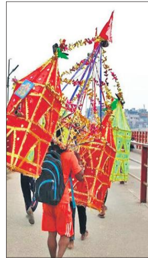
ने सावन में दर्शनार्थियों की सुविधा और सुगम दर्शन के लिए पूरी तैयारी कर ली है।