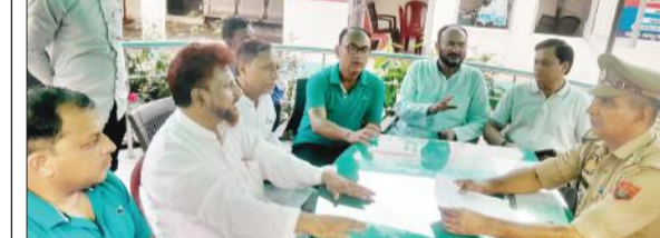
ठाकुरद्वारा कोतवाली में व्यापारियों के साथ बैठक करते थाना प्रभारी।