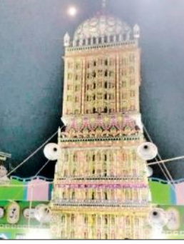
संभल के मंडी किशन दास सराय में सजाया गया ताजिया।

अमृत विचार : इमाम हुसैन के भतीजे और बेटे कर्बला के शहीद कासिम की याद में मंगलवार को संभल समेत आसपास के क्षेत्रों में इमामबाड़ों पर शाही मेहंदी की रस्म अदा की गई। सजी हुई मेहंदी को देखने के लिए लोगों का ताता लगा रहा। रात के वक्त कई मेहंदी रोशनी से जगमग हुई तो नजारा आकर्षक हो गया। मेहंदी के जुलूस भी निकाले गए।