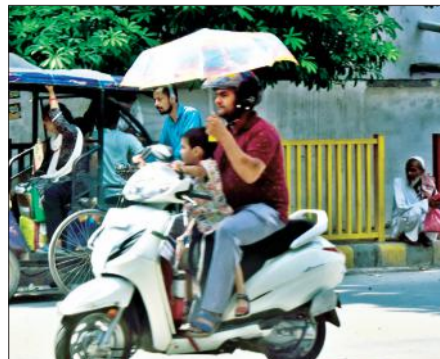
गर्मी से बच्चे को बचाने के लिए छाते से ढक कर ले जाता पिता।

इलाकों में कहीं-कहीं बारिश हो रही है। लेकिन, मैदानी क्षेत्रों में बारिश न के बराबर है। मुरादाबाद और आसपास के क्षेत्रों में अभी चार पांच बादल और धूप का क्रम चलेगा। कहीं छिटपुट फुहारे पड़ सकती हैं। 20-21 जुलाई या इसके बाद फिर तेज बारिश का अनुमान है।