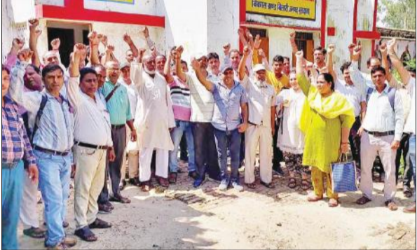
बिलारी में नारेबाजी कर मासिक बैठक का बहिष्कार करते शिक्षक।