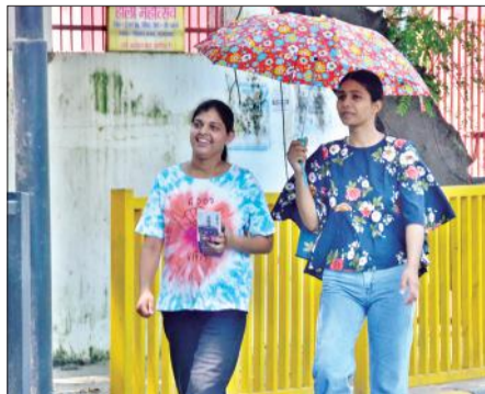
धूप से बचने के लिए छाता लगा कर जाती युवतियां।

छह दिन से बारिश थमने से नदियों के जलस्तर में कमी आने से तटीय इलाकों के लोगों को राहत मिली है। खेतों में भी पानी कम हुआ है। लेकिन, बारिश न होने और धूप निकलने से तापमान बढ़ रहा है। अधिकतम तापमान बढ़कर 34 डिग्री सेल्सियस और न्यूनतम 29 डिग्री सेल्सियस पहुंचा है। 24 घंटे उमस भरी गर्मी से लोग बेहाल हैं। पंखे कूलर की