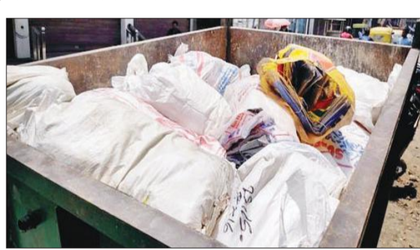
नगर निगम की टीम द्वारा जब्त की गई प्रतिबंधित पॉलीथिन।

मुख्य कर निर्धारण अधिकारी के नेतृत्व में टीम ने गोदामों में भंडारित किए प्रतिबंधित पॉलीथिन का खजौरा पकड़ा। जिसमें 550 किलोग्राम पॉलीथिन निकला। टीम ने इसे जब्त कर ऐसा करने वालों को कड़ी चेतावनी दी। चालान करते हुए 15,000 रुपये का जुर्माना भी वसूला। इस दौरान कर अधीक्षक