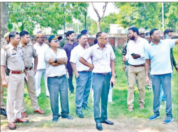
टाइटस स्कूल को सील करने पहुंची नगर निगम व प्रशासन की टीम।

सिविल लाइंस में स्थित टाइटस स्कूल को 1940 में लीज पर दिया गया था। करोड़ों रुपये की इस बेशकीमती जमीन पर टाइटस स्कूल संचालित हो रहा था। साथ ही परिसर में कॉलोनी में कई परिवार बस गए थे। लीज की अवधि समाप्त होने पर नवागत नगर आयुक्त ने