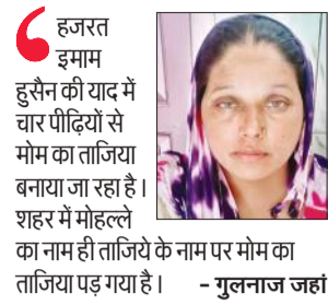
हजरत इमाम हुसैन की याद में चार पीढ़ियों से मोम का ताजिया बनाया जा रहा है। शहर में मोहल्ले का नाम ही ताजिये के नाम पर मोम का ताजिया पड़ गया है। - गुलनाज जहां

वन विभाग को 400992, जनपद विकास विभाग को 59,000, ग्राम्य विकास विभाग को 12,75,214, राजस्व विभाग को 1,04,000, पंचायतीराज विभाग को 1,26,000 पौधे लगाने का लक्ष्य दिया गया है। आवास विकास विभाग को 9,346, औद्योगिक विकास विभाग को 7,000, नगर विकास को 29,577, लोक निर्माण विभाग को 16,166, जल शक्ति विभाग को 15,000 पौधे रोपित करने का लक्ष्य मिला