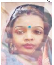
आकांक्षा की फाइल फोटो।

अमृत विचार: ससुराल वालों की दहेज की मांग से तंग आकर विवाहिता ने मायके में सोमवार को फंदे पर लटक कर आत्महत्या कर ली। मृतका के भाई की ओर से पति सहित छह ससुरालियों के विरुद्ध रिपोर्ट दर्ज कराई है। पोस्टमार्टम के बाद परिजनों ने शव का अंतिम संस्कार कर दिया।