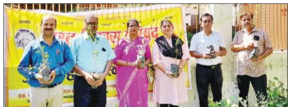
पौधरोपण करते भारत विकास परिषद के पदाधिकारी।