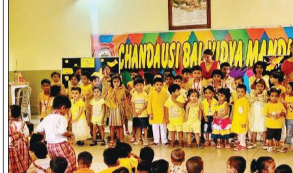
चंदौसी बाल विद्या मंदिर में यलो डे मनाते बच्चे।