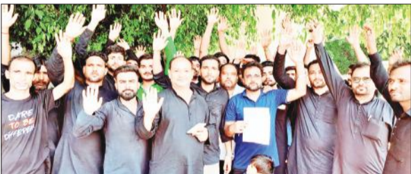
शाहबाद बिजलीघर में प्रदर्शन करते सुहावा के ग्रामीण।

बाबा दीप सिंह नगर स्थित बसपा कार्यालय पर मंगलवार को हुई बैठक में जिलाध्यक्ष ने कहा कि भाजपा सरकार को किसानों का कर्ज माफ करना चाहिए। किसान कर्ज से दबा है। सरकार पूंजीपतियों को लाभ पहुंचाती है,