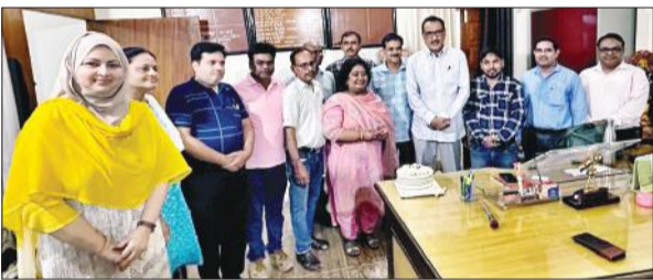
रजा डिट्री कॉलेज में केक काटने के दौरान मौजूद प्राचार्य एवं अन्य।