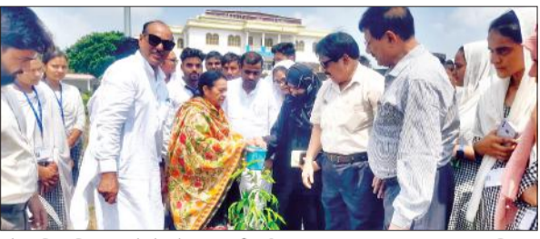
जौहर विश्वविद्यालय में पौधरोपण करती पूर्व सांसद एवं अन्य।

तैनात चिकित्सकों पर लापरवाही तथा निजी चिकित्सकों से मिलीभगत का आरोप लगाया। कहा कि कमीशन के चक्कर में सरकारी चिकित्सक मरीजों को निजी चिकित्सकों के यहां जाने की सलाह देते हैं। इसके बाद किसान बिजलीघर पहुंचे और एसडीओ