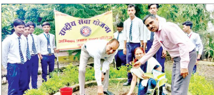
अंबिका प्रसाद इंटर कॉलेज में पौधरोपण करते शिक्षक।