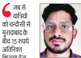
जब से यात्रियों को चन्दौसी से मुरादाबाद के बीच 15 रुपये अतिरिक्त किराया देना पड़ रहा है, तब से बहुत से लोगों ने बस से सफर करना छोड़ दिया। वह ट्रेनों में सफर कर रहे हैं।

आवश्यक कार्य होने पर आम आदमी रोडवेज बस में सफर करता है। क्योंकि किराया अधिक होने से वह रोडवेज बस में यात्रा करने से कतराता है। मगर मुरादाबाद जाने के 15 रुपये अतिरिक्त देने से आम आदमी परेशान है।