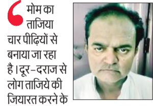
मोम का ताजिया चार पीढ़ियों से बनाया जा रहा है। दूर-दराज से लोग ताजिये की जियारत करने के लिए आते थे। रियासत काल में नवाब मोम के ताजिये की जियारत करने पहुंचते थे।