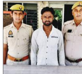
पुलिस की गिरफ्त में आरोपी।

नगर निवासी युवक का एक मोहल्ला निवासी किशोरी के घर