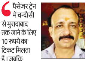
पैसेंजर ट्रेन में चन्दौसी से मुरादाबाद तक जाने के लिए 10 रुपये का टिकट मिलता है। जबकि रोडवेज बस में 47 रुपये देने पड़ते हैं। मगर जब से पंडित नगला रेलवे फाटक पर ओवरब्रिज निर्माण होने से 15 रुपये अतिरिक्त देने पड़ रहे हैं।

फाटक पर ओवरब्रिज का निर्माण चल रहा है। कार्य के चलते बड़े वाहनों का आवागमन पूरी तरह बंद कर दिया है। जिससे चन्दौसी से मुरादाबाद जाने वाली रोडवेज बसें को पिछले 15 दिन से बाईपास से रामपुर चौराहा होकर से गुजारा जा रहा है। जिससे समय के अधिक लगने के साथ यात्रियों पर 15 रुपये अतिरिक्त भार पड़ रहा है। वैसे रोडवेज बस में चन्दौसी से मुरादाबाद का किराया 74 रुपये निर्धारित है। मगर अब यात्रियों को 89 रुपये किराए के देने पड़ रहे हैं। जिससे यात्रियों को समय अधिक लगने के बाद 15 अतिरिक्त देने से आर्थिक संकट का सामना करना पड़ रहा है।