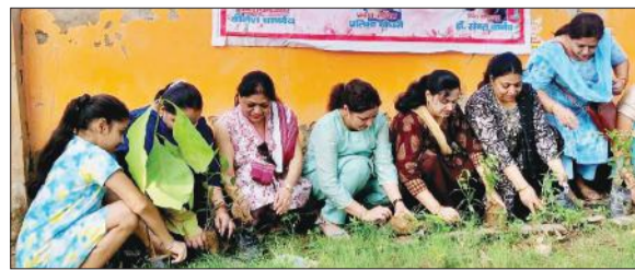
शिव मंदिर परिसर में पौधरोपण करती समिति की पदाधिकारी।