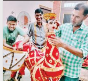
दुलदुल बुराक बनाते कारीगर