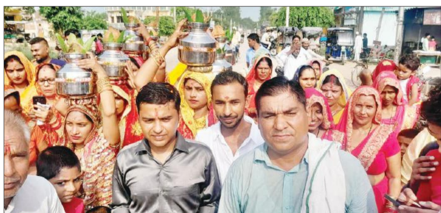
गांव रामनगर खाम्गुवाला में कलश यात्रा निकालती महिलाएं व अन्य।

क्षेत्र के गांव रामनगर खाम्गुवाला स्थित माता भवानी मंदिर में भगवान श्रीकृष्ण व राधारानी की मूर्ति स्थापना से पहले विधिविधान व पूजा अर्चना के बाद कलश यात्रा का आरंभ किया गया। कलश यात्रा में महिलाएं पीले वस्त्र धारण कर भगवान श्रीकृष्ण व राधारानी का गुणगान करती चल रही थीं। अन्य श्रद्धालु डीजे पर भगवान श्री कृष्ण के भजनों पर थिरकते चल रहे थे।