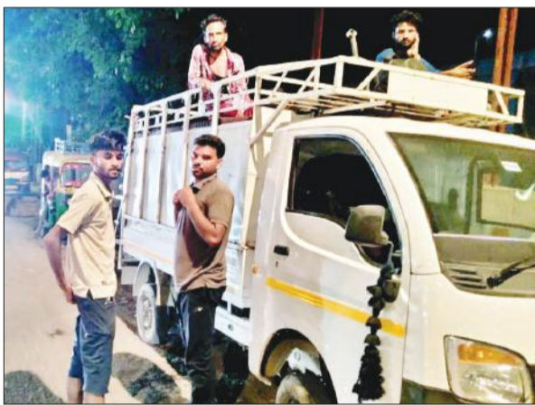
आंबेडकर पार्क के सामने डग्गामार वाहन में बैठते यात्री।

जिले में करीब 16,500 कमर्शियल वाहन पंजीकृत हैं। इनमें टैक्सी, यात्री बस एवं बड़े वाहन शामिल हैं। इसमें लगभग 150 वाहन स्वामियों ने टैक्स ही जमा नहीं किया है। इसके बाद भी उनके वाहन सड़कों पर बेखोफ दौड़ रहे हैं। परिवहन विभाग के अधिकारी लगातार सड़कों पर निगरानी करते रहते हैं, लेकिन वाहनों की धरपकड़ से दूर ही रहते हैं। मगर अब विभाग सक्रिय हो गया है। एआरटीओ के आदेश पर कर्मचारियों ने जिले के करीब एक साल से टैक्स जमा नहीं करने