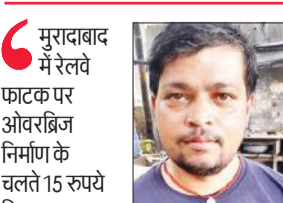
मुरादाबाद में रेलवे फाटक पर ओवरब्रिज निर्माण के चलते 15 रुपये किराया बढ़ा दिया है। यह सिलसिला निर्माण कार्य पूरा होने तक जारी रहेगा। जिससे यात्रियों को रोजाना आर्थिक हानि उठानी पड़ेगी।