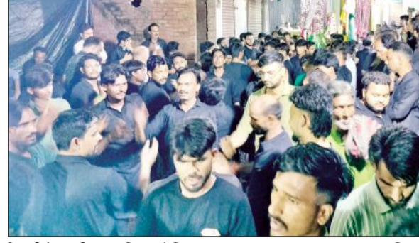
सिरसी में मातमी जुलूस निकालते शिया मुसलमान।