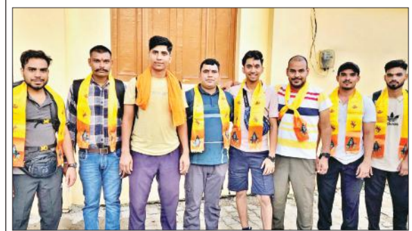
मानपुर दत्ताराम से रवाना होते श्रद्धालु।