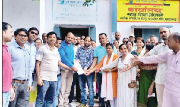
खंड शिक्षा अधिकारी को पत्र देते शिक्षक।

शिक्षकों ने कहा कि यह आदेश जबरन थोपा जा रहा है। प्रदेश के लाखों शिक्षकों की मांगें- 31 उपाजित अवकाश, अर्ध आकस्मिक अवकाश, प्रतिकर व अध्ययन अवकाश, निशुल्क चिकित्सा, पुरानी पेशन पर बेसिक शिक्षा विभाग ने निर्णय लिया है। बेसिक शिक्षा विभाग के शिक्षकों के प्रति आदेश से संकुल शिक्षक आहत हैं। संकुल शिक्षकों का चयन विद्यालय में रहकर शिक्षण कार्य को सुचारु ढंग से कराने के लिए किया गया था। इससे बच्चों के शिक्षण पर प्रतिकूल प्रभाव पड़ रहा है। इस काफ़ी शिक्षक मौजूद रहे