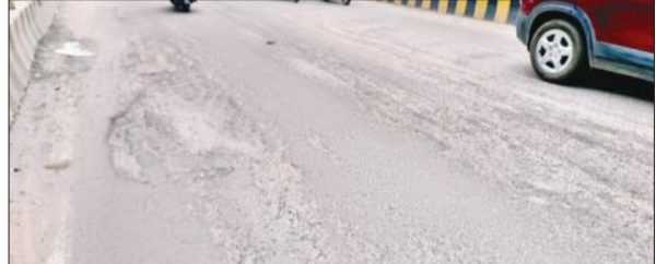
जगह-जगह से उधड़ी राम रहीम पुल की सड़क।