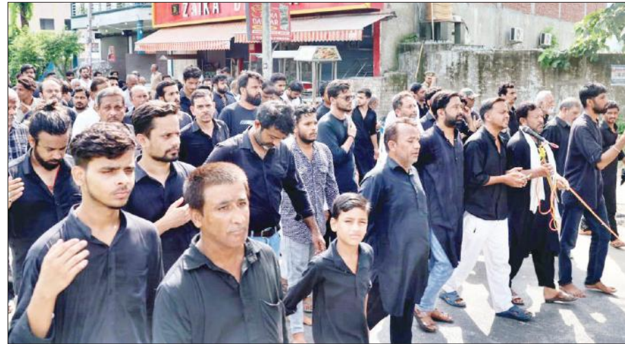
जरीह के जुलूस में नोहाखानी करते लोग।