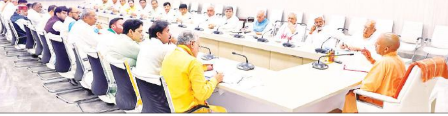
बुधवार को अपने सरकारी आवास पर मंत्रियों के साथ बैठक करते मुख्यमंत्री योगी आदित्यनाथ।