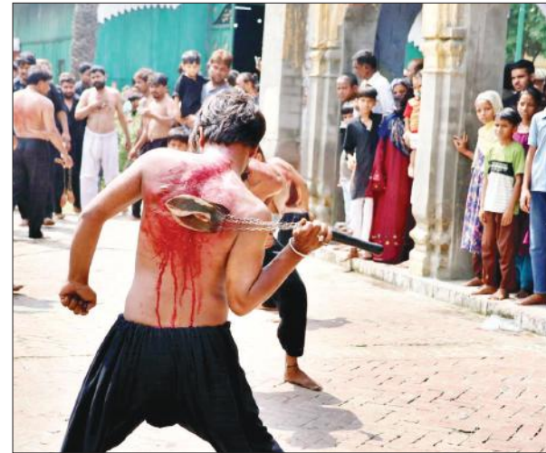
कर्बला में छुरियों का मातम करते अजादार।