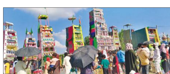
मानपुर उत्तरी स्थित कर्बला मैदान में रखे ताजिये।

अन्य गांवों के ताजियों के जुलूस नवादा गांव पहुंचे। क्षेत्र के संकरा, मनकरा, नरखेड़ा, करीमपुर शर्की, किशरोल में भी जुलूस निकाले गए। नवादा स्थित कर्बला में मेला लगा। कर्बला में देर शाम तक ताजियों के दफन करने का सिलसिला जारी रहा।