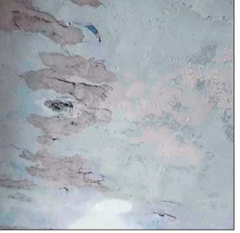
बरखेड़ा नंबर दो स्कूल के कमरे की टपकती छत।