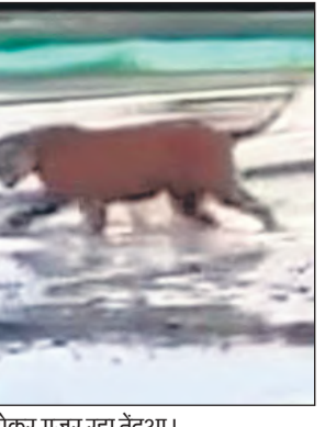
खेत से होकर गुजर रहा तेंदुआ।