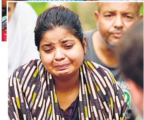
हाथरस हादसे के बारे में बताते हुए रोती युवती।