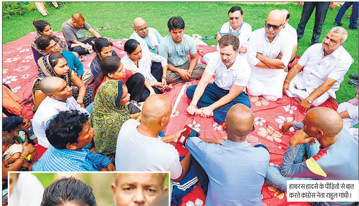
हाथरस हादसे के पीड़ितों से बात करते कांग्रेस नेता राहुल गांधी।