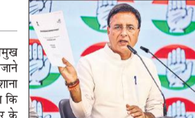
● मोदी के तीसरे कार्यकाल का जनता के लिए उसके मित्रवादी पूंजीवाद का प्रसाद है: रणदीप सुरजेवाला

कांग्रेस ने दूरसंचार क्षेत्र की तीन प्रमुख कंपनियों द्वारा शुल्क दर में बढ़ोतरी किए जाने के बाद शुक्रवार को केंद्र सरकार पर निशाना साधा। कांग्रेस ने कटाक्ष करते हुए कहा कि प्रधानमंत्री मोदी के नेतृत्व वाली सरकार के तीसरे कार्यकाल का जनता के लिए उसके मित्रवादी पूंजीवाद का प्रसाद है।