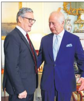
महाराजा चार्ल्स तृतीय से मुलाकात के बाद आधिकारिक रूप से ब्रिटेन के नए प्रधानमंत्री।

सुनक ने एक संदेश में कहा इस मुश्किल समय में मैं रिचमंड और नॉर्थलैंटन निर्वाचन क्षेत्र के लोगों के प्रति अपना आभार व्यक्त करना चाहता हूँ जिन्होंने मुझे लगातार समर्थन दिया है। अपनी सीट फिर से जीतने वाले अन्य प्रमुख ब्रिटिश भारतीय टोरी नेताओं में पूर्व गृह मंत्री सुरेला