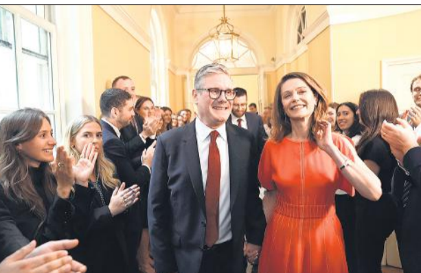
डाउनटाउन आवास में पत्नी के साथ नवनिवृत्त प्रधानमंत्री खुशी जाहिर करते हुए।