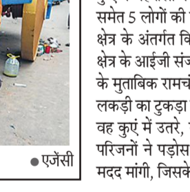
कोलकाता में रथ यात्रा उससे से पहले रथ के पहियों को पेंट करता इस्कॉन का सदस्य।