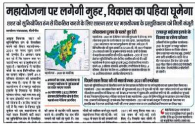
महायोजना पर लगेगी मुहर, विकास का पहिया घूमेगा

बाद में इस पर आपत्तियां लगी थीं, लेकिन प्रशासनिक स्तर पर इन आपत्तियों का निस्तारण कर लिया गया। पिछले दिनों शासन स्तर पर महायोजना का प्रस्तुतीकरण भी हो चुका है। इधर,