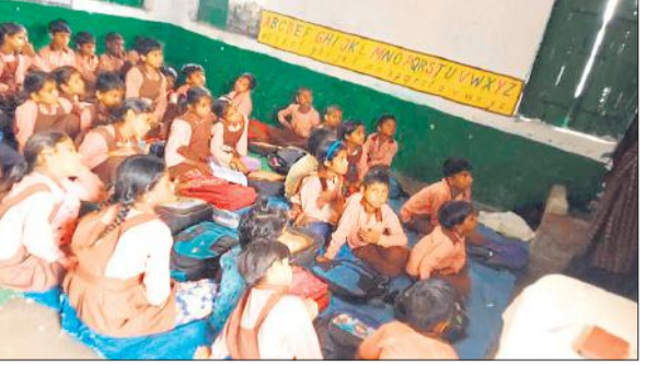
जर्जर कक्ष में बैठकर पढ़ाई करते बच्चे।