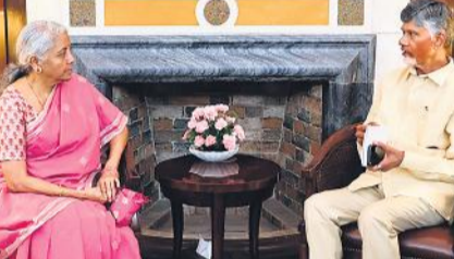
नई दिल्ली में केंद्रीय वित्त मंत्री निर्मला सीतारमण से मुलाकात करते आंध्र प्रदेश के मुख्यमंत्री एन चंद्रबाबू नायडू।

केंद्रीय बजट पेश होने से पहले आंध्र प्रदेश के मुख्यमंत्री एन. चंद्रबाबू नायडू ने शुक्रवार को केंद्रीय वित्त मंत्री निर्मला सीतारमण से मुलाकात की और कर्ज में डूबे राज्य की मदद करने का आह्वान किया। नॉर्थ ब्लॉक में हुई बैठक में नायडू ने आंध्र की विभिन्न परियोजनाओं के लिए केंद्रीय सहायता मांगी। तेलुगू देशम पार्टी के मंत्री भी बैठक में शामिल हुए। राज्य सरकार के अनुसार, आंध्र प्रदेश का सार्वजनिक ऋण 2019-20 में सकल राज्य घरेलू उत्पाद (जीएसडीपी) के 31.02% से बढ़कर 2023-24 में 33.32% हो गया है। यह राज्य के राजकोषीय स्थिति में गिरावट का संकेत देता है। नायडू की प्रमुख मांगों में पोलावरम सिंचाई परियोजना के लिए धन, पिछड़े क्षेत्रों