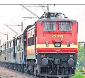
● बरेली के रास्ते लखनऊ-हरिद्वार के बीच चलेगी स्पेशल ट्रेन ● दिल्ली से चलने वाली कई ट्रेनों का हरिद्वार तक होगा विस्तार

अमृत विचार : 21 जुलाई से सावन शुरू हो रहा है। इस अवसर पर बड़ी संख्या में शिव भक्त ट्रेनों से भी जल लेने के लिए हरिद्वार के अलावा अन्य जगहों पर जाते हैं। ऐसे में सावन से पहले ही मंडल रेल प्रशासन ने कमर कस ली है। खास तौर से हरिद्वार तक स्पेशल ट्रेनें चलाने के लिए मुख्यालय पर प्रस्ताव भेजा गया है। लखनऊ से हरिद्वार के बीच भी एक स्पेशल ट्रेन चलाने का प्रस्ताव है, जो बरेली जंक्शन से होकर गुजरेगी। मंडलीय अधिकारियों का कहना है कि दिल्ली से बड़ी संख्या में यात्री सावन में हरिद्वार आते हैं। ऐसे में दिल्ली से आने वाली कई ट्रेनों का विस्तार करने का प्रयास किया जा रहा है। इनकी यात्रा हरिद्वार तक बढ़ाई जाएगी। मुरादाबाद रेल