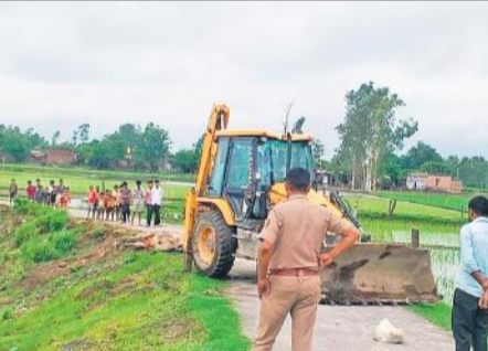
तालाब किनारे मृत सांडों को दफनवाते पुलिसकर्मी।