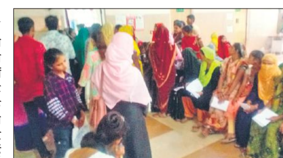
जिला महिला अस्पताल में ओपीडी के बाहर लगी महिला मरीजों की लाइन।

अमृत विचार : जिला महिला अस्पताल में आठ महीने की गर्भवती महिला चिकित्सक नहीं मिलने पर शुक्रवार को तीन घंटे तक फर्श पर तड़पती रही। उसके परिजन चीखते-पुकारते रहे। देख लेने की गुहार लगाते रहे मगर उनकी फरियाद सुनने वाला कोई नहीं था। महिला को तड़पता देख अन्य महिलाओं की भी आंखें नम थीं। उन्होंने भी अस्पताल की बीमार व्यवस्था को खूब कोसा।