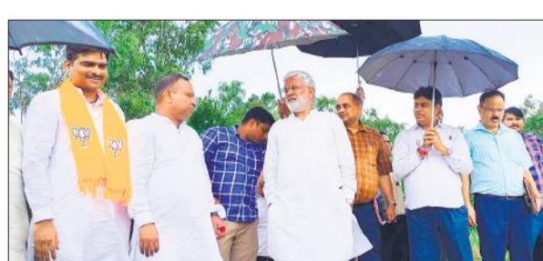
खनका उचसिया गांव के पास बनी टोकरो का जायजा लेते जल शक्ति मंत्री स्वतंत्र देव सिंह।