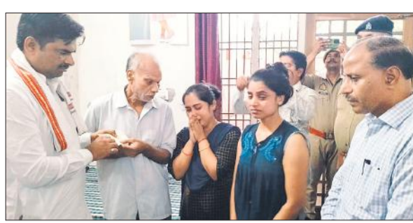
मृतक के परिजनों को सहायता राशि का चेक सौंपते भाजपा जिलाध्यक्ष व डीएम।