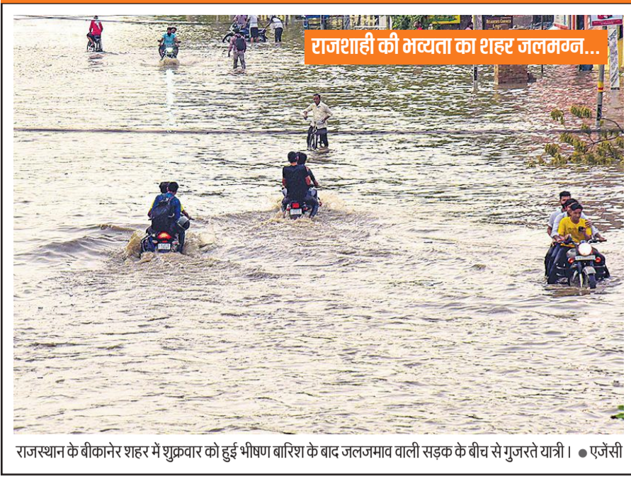
राजस्थान के बीकानेर शहर में शुक्रवार को हुई भीषण बारिश के बाद जलजमाव वाली सड़क के बीच से गुजरते यात्री।