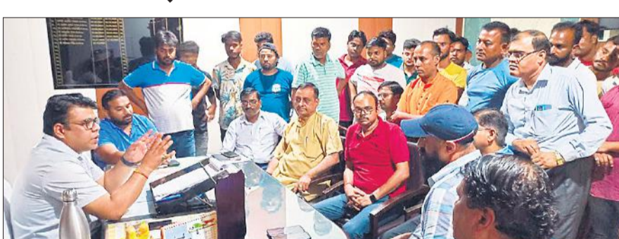
एसडीएम कार्यालय में पहुंचे काँलोनी के लोग।

बीसलपुर रेलवे स्टेशन के प्लेटफार्म पर करीब डेढ़ वर्ष से कोयले की रैक उतर रही है। इसका विरोध रेलवे स्टेशन के सामने वाली काँलोनी के रहने वाले लगातार करते चले आ रहे हैं। बीच में कई महीने कोयले का उतार प्लेटफार्म पर बंद भी हो गया था, लेकिन दोबारा से प्लेटफार्म पर टीन के तख्ते लगाकर व पानी की