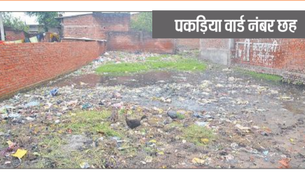
एकड़िया वार्ड नंबर छह

है। जहां करीब 1200 से अधिक मकान बने हुए हैं। मगर सुविधा के नाम पर यहां कुछ नहीं है। जल निकासी के इंतजाम नहीं होने से नालियों का गंदा पानी खाली पड़े प्लाटों में जमा हो गया है। नगर पंचायत की ओर से फॉगिंग तक नहीं कराई गई है। आलम यह है कि नाले नालियां टूटी हुई हैं। उनकी भी सफाई नहीं होती है। इसी मोहल्ले में खाली जमीनों पर लोगों के घरों का गंदा पानी बजबजा रहा है। उससे उठती दुर्गंध से लोग परेशान हैं। खाली जगहों पर जलभराव होने से मच्छर के लार्वा तेजी से पनप रहे हैं। सड़कों पर भी सफाई नहीं कराई जाती है। दिन भर कूड़े के ढेर लगे रहते हैं।