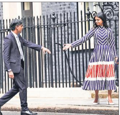
डाउनटाउन छोड़ने के बाद पत्नी अश्विनी के साथ ऋषि सुनक।