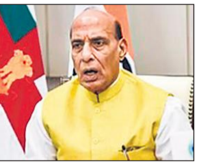
● वित्त वर्ष 2022-23 में रक्षा उत्पादन का मूल्य था 1,08,684 करोड़ रुपये

नई दिल्ली, एजेंसी रक्षा मंत्री राजनाथ सिंह ने शुक्रवार को कहा कि भारत का वार्षिक रक्षा उत्पादन 2023-24 में 1.27 लाख करोड़ रुपये के रिकॉर्ड स्तर पर पहुंच गया। यह मेक इन इंडिया कार्यक्रम में एक और उपलब्धि है। वित्त वर्ष 2022-23 में रक्षा उत्पादन का मूल्य 1,08,684 करोड़ था।