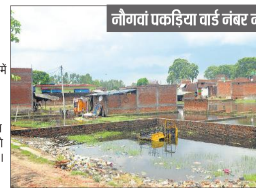
नौगांव पकड़िया वार्ड नंबर नौ

मकान बने हुए हैं। इनमें अधिकतर लोगों को पीएम आवास नहीं मिल सके। जिस वजह से वह पानी आदि डालकर जीवन यापन कर रहे हैं। इन घरों के आगे कई खाली प्लाट पड़े हुए हैं। आसपास में जलनिकासी की कोई सुविधा नहीं है जिस वजह से गंदगी के ढेर लगे हुए हैं। मानसून की बारिश में सफाई न होने और जलनिकासी न होने से खाली प्लाटों में जलभराव हो गया है। 26 जून को हुई बारिश के बाद खाली पड़े एक प्लाटों में रातों रात चार फुट से अधिक गंदा पानी भर गया। मानों जैसे कोई तालाब बना हुआ है। इतना ही नहीं लोगों के घरों तक में गंदा पानी घुस गया है। जहां संक्रामक बीमारियों का खतरा बना हुआ है। शिकायत करने के बाद भी कोई सफाई करने के लिए नहीं आता है।