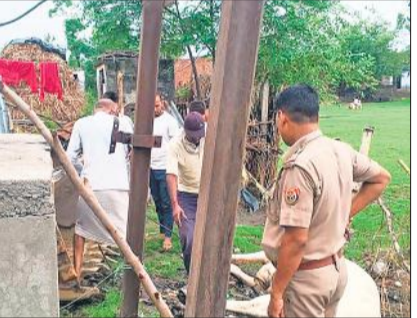
ट्रांसफार्मर के पास से मृत सांडों को निकालते ग्रामीण।

अमृत विचार: गांव रौतापुर कलां में विद्युत ट्रांसफार्मर के पास लोहे के पोल में उतरे करंट की चपेट में आकर दो सांडों की मौत हो गई। तीन दिन पहले एक बछिया की करंट की चपेट में आकर जान कर्वाई थी। सांडों की मौत पर ग्रामीणों ने सप्लाई बंद कराने को सूचना खुटार विद्युत उपकेंद्र के जेई के साथ ही लाइनमैन को दी। लेकिन फोन रिसीव नहीं किया। इसके बाद सूचना पर पुलिस पहुंच गई और जांच की। प्रधान पति और ग्रामीणों की मदद से जेसीबी मशीन से तालाब में खोदाई कर गड्ढे में सांड के शवों को दफन करवा दिया गया। ग्रामीणों ने बिजली विभाग के खिलाफ काफी नाराजगी जताई है। गांव रौतापुर कलां में उत्तर दिशा में ट्रांसफार्मर रखा हुआ है। इसके पास में ही दो बिजली के पोल लगे हैं। जिसमें करंट उतर रहा है। लोगों ने बताया कि करीब चार दिनों से बिजली के पोल में करंट आ रहा था।