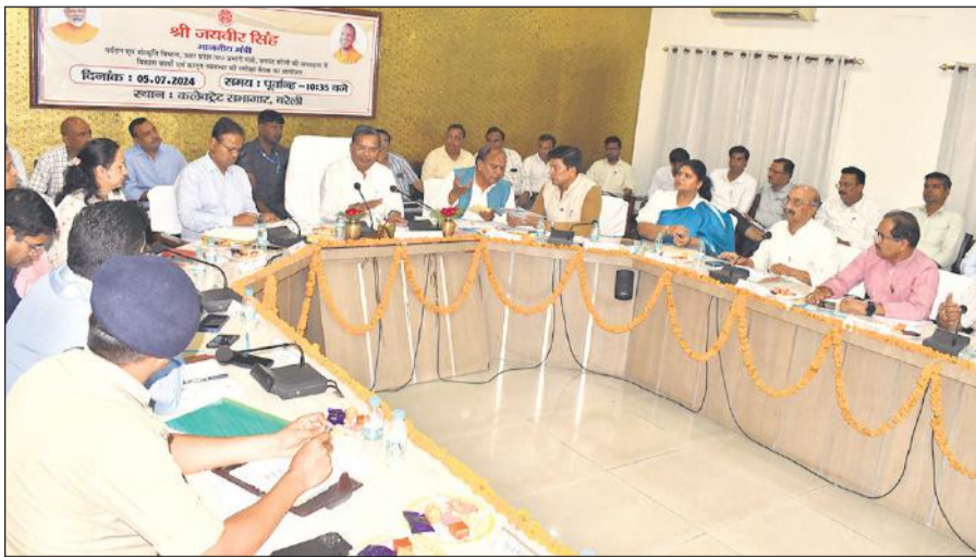
अधिकारियों-जनप्रतिनिधियों के साथ समीक्षा बैठक करते प्रभारी मंत्री जयवीर सिंह।

कलेक्ट्रेट सभागार में हुई बैठक में जिले के जनप्रतिनिधियों ने अफसरशाही की जमकर परतें उधड़ीं। सबसे ज्यादा मामले पुलिस के भ्रष्टाचार के गिनाए गए। बैठक में मौजूद विधायकों ने एक-दूसरे से सिपाही, दरोगा, इन्स्पेक्टर से लेकर सीओ स्तर तक के अधिकारियों के रिश्वतखोरी में लिप्त होने के मामले उजागर होने को शर्मनाक बताया। प्रभारी मंत्री ने इस स्थिति को सरकार की छवि खराब करने वाला बताते हुए चिंता जताई और वरिष्ठ पुलिस अधीक्षक की गैरमौजूदगी में उनकी जगह पहुंचे पुलिस अधीक्षक नगर को ऐसे मामलों में सख्ती करने और रोक लगाने का निर्देश दिया।