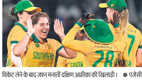
विकेट लेने के बाद जश्न मनाती दक्षिण अफ्रीका की खिलाड़ी।

दक्षिण अफ्रीका महिला क्रिकेट टीम ने तजमिन ब्रिट्स (81 रन) और मारिजने काप (57 रन) के अर्धशतकों की मदद से शुकवार को यहां पहले टी20 अंतरराष्ट्रीय में भारत को 12 रन से शिकस्त देकर तीन मैच की श्रृंखला में 1-0 से बढ़त बनाई। ब्रिट्स ने 56 गेंद में 10 चौके और तीन छक्के जड़े जबकि काप ने 33 गेंद में आठ चौके और एक छक्का लगाया। बल्लेबाजी का न्योता मिलने के बाद दक्षिण अफ्रीका ने 189 रन का चुनौतीपूर्ण स्कोर खड़ा किया जिसके जवाब में भारतीय टीम जेमिमा रोड्रिग्स (नाबाद 53 रन) के अर्धशतक के बावजूद चार विकेट पर 177 रन ही बना सकी। सलामी बल्लेबाज शेफाली वर्मा (18 रन) और स्मृति मंधाना (46 रन) ने पहले विकेट के लिए 56 रन का साझेदारी निभाकर भारत को अच्छी शुरुआत कराई, लेकिन अयाबोंगा खाका ने शेफाली को आउट कर पहला झटका दिया। मंधाना को क्लो ट्रायोन की आउट किया। मंधाना ने 30 गेंद की पारी में सात चौके और दो छक्के लगाए। दयालन हेमलता (14 रन) ज्यादा देर तक बल्लेबाजी नहीं कर सकी और 17 गेंद खेलने के बाद नाडिने डि क्लर्क का शिकार हुई। कप्तान हरमनप्रीत कौर (35 रन) पारी की अंतिम गेंद पर एन मलाबा की गेंद पर आउट