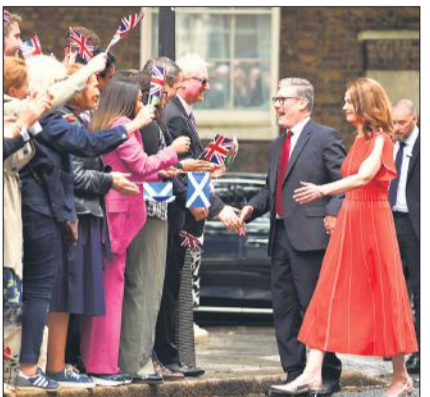
प्रधानमंत्री बनने के बाद स्टॉर्मर का स्वागत करते नागरिक।

कार्ड का कोई गलत इस्तेमाल तो नहीं कर रहा है, यह जानने का सबसे अच्छा तरीका है क्रेडिट स्कोर को चेक करना। स्कोर आपको इस बारे में जानकारी देता है कि पैन कार्ड के साथ कुछ अनअथॉराइज्ड एक्टिविटी तो नहीं हो रही है। अगर किसी तरह के फ्राड की जानकारी लगे तो तुरंत शिकायत करनी चाहिए।