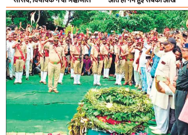
अंत्येष्टि से पहले सेना ने दिया गाई ऑफ ऑनर।

● डीएम और एसएसपी के साथ ही सांसद, विधायक ने दी श्रद्धांजलि