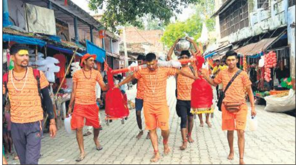
तीर्थ नगरी सोरो में होकर कांवड़ लेकर जाते कांवड़िया। ● अमृत विचार

अमृत विचार: सावन के दूसरे सोमवार को जलाभिषेक को लेकर चारों तरफ हर-हर महादेव, बम-बम भोले की गूंज सुनाई दे रही है। जयकारों से वातावरण भक्ति में बना हुआ है। डीजे पर बजते भजनों की धुन पर कांवड़िया नाचते-झूमते हुए अपनी मंजिल पर आगे बढ़ते जाते हैं। सावन के दूसरे सोमवार को लेकर शिवालय सज गए हैं। सावन का महीना हिंदुओं के लिए विशेष और पवित्र माना जाता है। मान्यता है कि सावन भोलेनाथ का पसंदीदा महीना होता है। सावन मास से सोलह सोमवार व्रत की शुरुआत की जाती है। सावन मास के सोमवार को व्रत रखना बेहद फलदायी और शुभ माना जाता है। खासकर सावन का दूसरा सोमवार शिव से स्वास्थ्य और बल प्रदान करने का व्रत