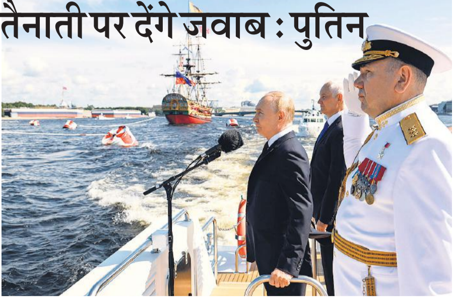
सेंट पीटर्सबर्ग में एक नौसैनिक परेड में संबोधित करते रूस के राष्ट्रपति पुतिन।

और यूरोपीय देशों की रक्षा के लिए अपनी प्रतिबद्धता की पुष्टि कर सके। पुतिन ने कहा अगर अमेरिका ऐसी योजनाओं को लागू करता है तो हम अपने नौसैनिकों के तटीय बलों की क्षमता बढ़ाने सहित मध्यम और कम दूरी की मिसाइल की तैनाती पर पहले से लगाए गए एंकरफा प्रतिबंध से खुद को मुक्त मानेंगे। उन्होंने कहा कि मॉस्को द्वारा उपयुक्त हथियार प्रणालियों का विकास अपने अंतिम चरण में है। वाशिंगटन और मॉस्को दोनों ने हाल के हफ्तों में मध्यम दूरी की मिसाइल तैनात करने