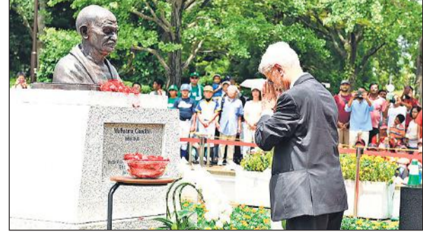
अनावरण के बाद गांधी की प्रतिमा के समक्ष प्रणाम करते जयशंकर।