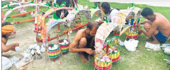
लहरा गंगा घाट पर कांवड़ सजाते श्रद्धालु। ● अमृत विचार

का आशीर्वाद प्राप्त करें। इस सोमवार को शिवजी को भांग, धतूरा एवं शहद अर्पित करना उत्तम फलदायी रहेगा।