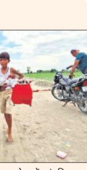
लहरा गंगा घाट से कांवड़ में जल लेकर जाते नन्हें कांवड़िया।

लहरा गंगा घाट से कंधे पर आस्था की कावड़ सजाकर बाल कांवड़िया आगे बढ़ रहे हैं। नन्हें कांवड़िया आकर्षण का केंद्र बने रहे। इन्हें देखकर दूसरे कांवड़ियों में उत्साहित नजर आया।