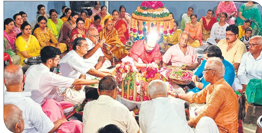
मोहल्ला मतानी में आयोजित रुद्राभिषेक अनुष्ठान में पार्थिव शिवलिंग और गणपति का श्रृंगार करते श्रद्धालु।