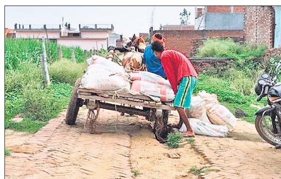
गड्ढे में फंसे तांगे को निकालते ग्रामीण।

ब्लॉक भावलखेड़ा क्षेत्र के गांव बल्लिया में जल जीवन मिशन के तहत पाइप लाइन का कार्य हुआ था, लेकिन पाइप लाइन डालने को खोदी गई सड़क को समतल नहीं किया गया। जिससे बरसात में मिट्टी धंस गई और गड्ढे हो गए। इन खुदी पड़ी उबड़-खाबड़ सड़क पर बच्चे बुजुर्ग आए दिन गिरकर चोटिल हो रहे हैं। प्रत्येक घर तक पानी की सप्लाई देने के लिए पिछले कई महीनों तक गलियां खोदी गईं, ज्यादातर गलियों में पाइप लाइन