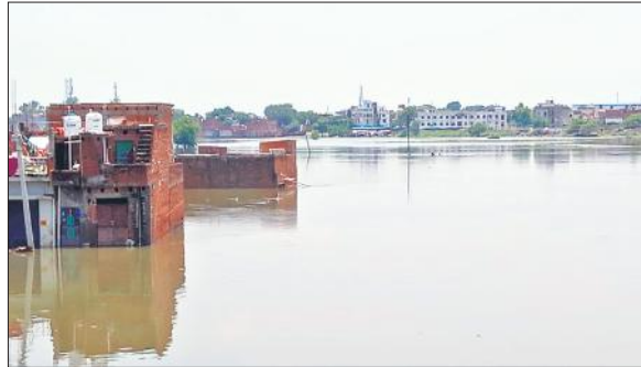
बाढ़ के दौरान खन्नात नदी के पानी में डूबे मकान। (फाइल फोटो)। ● अमृत विचार

शनिवार को 222 किसानों के खातों में सात लाख रुपये डाले