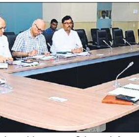
विधानभवन में गृह विभाग के अधिकारियों की बैठक लेते उपमुख्यमंत्री केशव मौर्य।

उप मुख्यमंत्री केशव प्रसाद मौर्य लोकसभा चुनाव के बाद से चर्चा में हैं। नए घटनाक्रम ने एकबार फिर