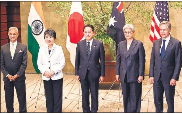
तोक्वो में क्वाड देश के विदेश मंत्रियों के साथ मौजूद जयशंकर।

उन्होंने कहा हमारे बीच एक समस्या है, या मैं कहना चाहूंगा कि भारत और चीन के बीच एलएसओ एक युवा है। मुझे लगता है कि हम दोनों को इस पर बात करनी चाहिए और समाधान निकालना चाहिए। उन्होंने इस महीने चीन के विदेश मंत्री वांग यी के साथ दो बार हुई अपनी बैठक को याद करते हुए कहा कि जाहिर है, दुनिया के अन्य देशों की भी इस मामले में रुचि होगी, क्योंकि हम दो बड़े देश हैं और हमारे संबंधों की स्थिति का बाकी दुनिया पर प्रभाव पड़ता है। जयशंकर और वांग की पिछले सप्ताह लाओस की