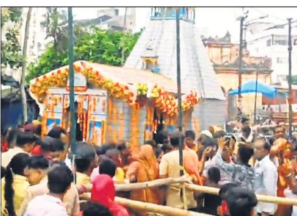
बाबा केदारनाथ मंदिर के स्वरूप की कांवड़ देखने को लगी लोगों की भीड़।