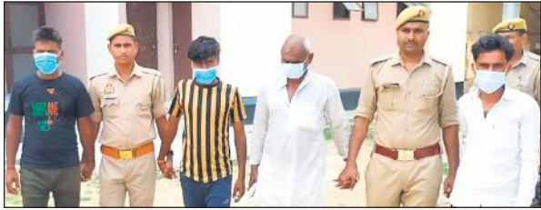
पुलिस की गिरफ्त में बालक की हत्या करने के चारों आरोपी।