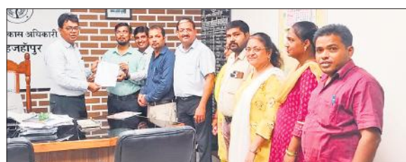
डीडीओ को ज्ञापन देते ग्राम्य विकास मिनिस्ट्रियल एसोसिएशन के पदाधिकारी।