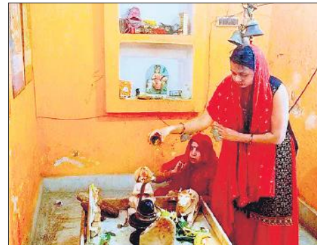
शहर के महादेव मंदिर में पूजा अर्चना करती महिलाएं।