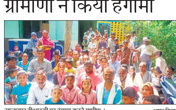
सालारपुर बीआरसी पर हंगामा करते ग्रामीण।