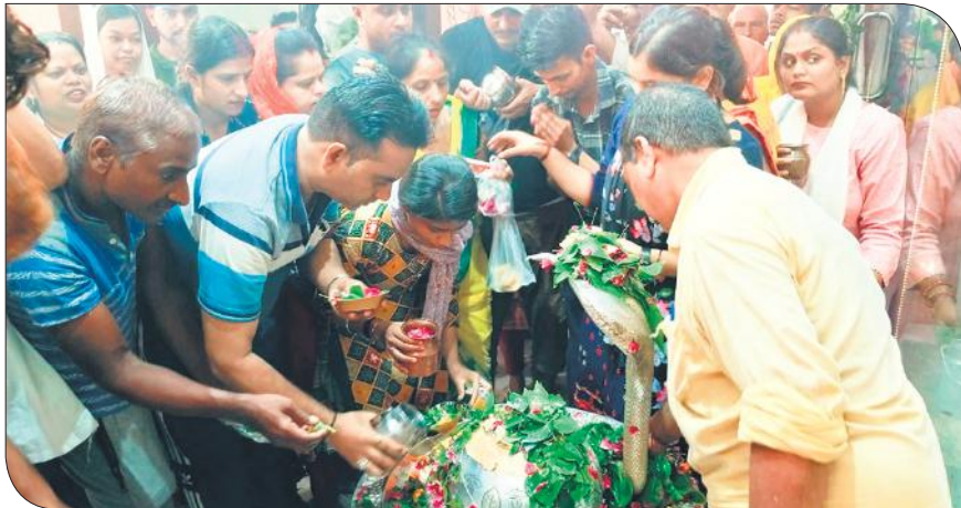
बाबा विश्वनाथ मंदिर में भोलेनाथ का जलाभिषेक करते श्रद्धालु।