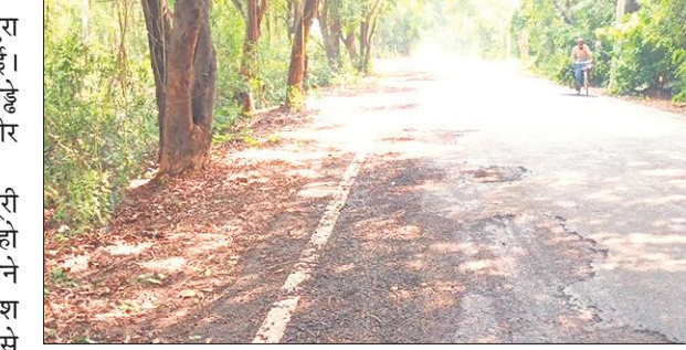
पटियाली-सिद्धपुरा मार्ग की टूटी सड़क।

अमृत विचार: पटियाली-सिद्धपुरा सड़क दो महीने में ही उखड़ गई। सड़क टूटने से जगह-जगह गड्डे बन गए हैं, जिससे गिरकर राहगीर जख्मी हो रहे हैं। सिद्धपुरा-पटियाली सड़क पूरी तरह से बनकर तैयार भी नहीं हो पाई कि गुणवत्ता की परतें खुलने लगीं। अभी अच्छी तरह से बारिश भी शुरू नहीं हो पाई कि उससे पहले ही सड़क की स्थिति दयनीय हो गई है। कई जगह सड़क उखड़ चुकी है। समाजवादी पार्टी के