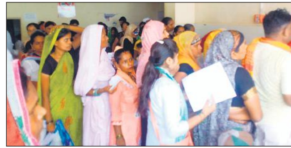
दवा काउंटर पर लगी मरीजों की लाइन।

उसके बाद ओपीडी में लाइन में लगकर डॉक्टर को दिखाया और फिर दवा काउंटर पर सैकड़ों की भीड़ जुटी रही। सभी डाक्टर दवाएं लिखते हैं तो