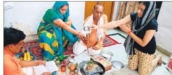
बहादुरगंज लक्ष्मी मंडी में शिवाचन करते दंपती।

इस प्रकार के विशेष अनुष्ठान में लोग अपने पड़ोसियों और सगे-संबंधियों का आमंत्रित कर श्रद्धाभाव से आदिदेव महादेव का पूजन कर रहे हैं। इसी क्रम