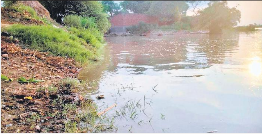
गांव ब्रह्मपुरी बस्तौली में गांव तक पहुंचा गंगा का पानी।

गंगा में हर घंटे बढ़ रहा पानी, तराई क्षेत्र में बढ़ती जा रही ग्रामीणों की मुश्किलें, तटवर्ती इलाकों के किसानों की टेंशन बढ़ी