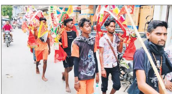
कांवड़यात्रा में जाता श्रद्धालुओं का जत्था।