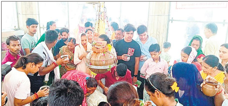
शहर के बिरुआबाड़ी मंदिर में जलाभिषेक करते श्रद्धालु।

दूसरे सोमवार को शहर के बिरुआबाड़ी मंदिर, हर प्रसाद मंदिर, गौरी शंकर मंदिर सहित अन्य छोटे बड़े सभी शिवालयों में सुबह से ही श्रद्धालुओं का तांता लगना शुरू हो गया था। शिव भक्तों ने फल, फूल, वेलपत्र आदि से भगवान की पूजा अर्चना की। इसके बाद जल, दूध, दही, घी, शहर आदि से शिवलिंग का अभिषेक किया और सुख, शांति व समृद्धि के लिए कामना की गई। मंदिरों में सुबह से लेकर शाम तक भगवान शिव की जय-जयकार के स्वर गूंजते रहे। गौरी शंकर मंदिर में विशेष पूजा अर्चना की गई। मंदिरों में पूजा अर्चना के लिए पहुंचे श्रद्धालुओं को कतार में खड़े होकर अपनी बारी का इंतजार भी करना पड़ा। सबसे ज्यादा भीड़ पथिक चौक स्थित बिरुआ बाड़ी