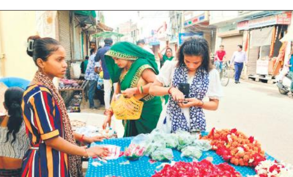
भोले बाबा के पूजन के लिए पुष्प खरीदते श्रद्धालु।

साथ आधी रात तक चले अनुष्ठान में बड़ी संख्या में महिलाएं, पुरुष, युवा और बच्चे शामिल हुए। महिलाओं की भोले बाबा की भजन सुनाकर वातावरण को भक्तिमय बनाया। पुरोहितों ने कच्ची मिट्टी से शिवलिंग, माता पार्वती और भगवान गजानन को रुद्र रूप में स्थापित कर उनका विधि-विधान से श्रृंगार किया। बाद में सभी ने बेलपत्र, पुष्प आदि अर्पित कर भोलेनाथ की आरती की। प्रसाद वितरण के साथ अनुष्ठान का समापन किया गया। इसी तरह के आयोजन कई घरों में किए गए।