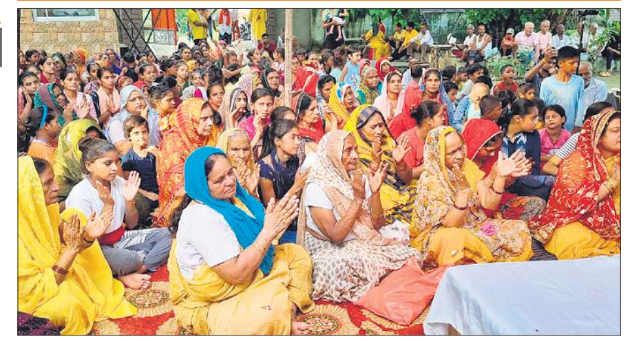
पटियाली में आयोजित शिव-विवाह कार्यक्रम में शामिल श्रद्धालु।