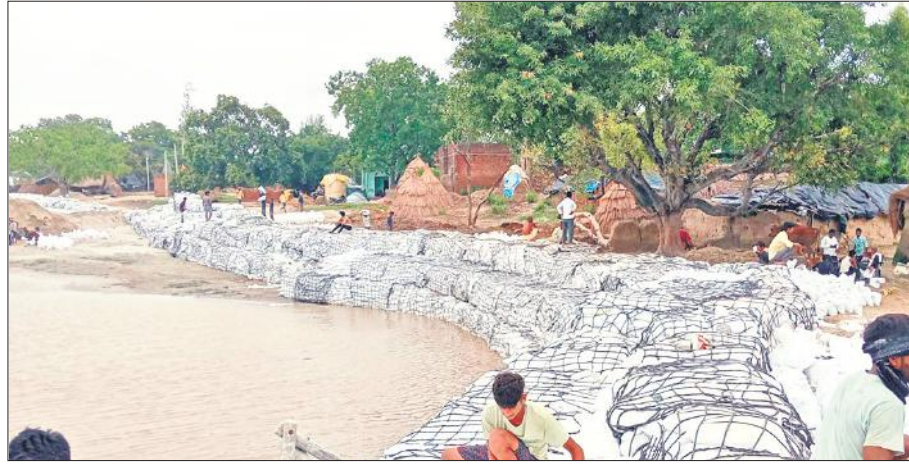
गांव बरोना में बाढ़ रोधी कार्य करने में जुटे मजदूर।

बैराजों से छोड़े जा रहे पानी से गंगा का जलस्तर बढ़ गया है। जिससे बाढ़ का खतरा बढ़ गया है। निगरानी के लिए टीमें लगी हैं। बाढ़ और कटाव से निपटने के लिए पूरी तैयारी कर ली गई है। -शमशेर सिंह अधिशासी अभियंता सिंचाई बैराज पर पानी का दबाव बढ़ गया है। सिंचाई विभाग के अधिकारी तटवर्ती क्षेत्रों में निगरानी बनाए हुए हैं। सिंचाई विभाग के अधिकारी दिन-रात निगरानी करने में जुटे हैं।