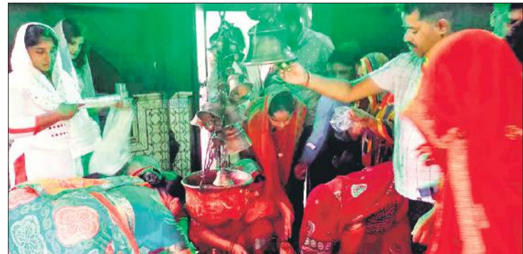
तीर्थ नगरी सौरों के योगेश्वर महादेव मंदिर में पूजा करते श्रद्धालु।

सावन के दूसरे सोमवार को ब्रह्म मुहूर्त से ही श्रद्धालुओं की भीड़ जुटने लगी और जयकारे गूंजने लगे। दोपहर करीब 12 बजे तक लंबी-लंबी कतारें लगी रहीं। हर-हर महादेव के स्वर मंदिर परिसर में गूंज रहे थे। घंटे की ध्वनि भी सुनाई दे रही थी। जिले भर के मंदिरों में बम-बम भोले, हर-हर महादेव की जय जयकार हो रही। सौरों के लहरा में लहरेश्वर मंदिर के अलावा तीर्थनगरी के शिवालयों में भक्तों की भारी भीड़ रही। शहर के नदरई गेट स्थित शिवालय मंदिर, भूतेश्वर मंदिर, मां शोतला मंदिर, चामुंडा मंदिर आदि मंदिरों में सुबह से देर शाम तक श्रद्धालुओं का तांता लगा रहा। कस्बा सिद्धपुरा के मोहल्ला गांधी नगर स्थित दुर्गा मंदिर में शिवजी की पूजा की गई। गंजडुंडुवारा के मोहल्ला खेरू स्थित शिव मंदिर में भक्तों ने जलाभिषेक किया। पटियाली के शिवालयों में भी भक्तों का तांता लगा रहा। मिश्राणा मोहल्ले के पाताली महादेव, बिजली घर के निकट गड्डा वाले महादेव, मेहदी वाले भोलेनाथ, स्टेशन रोड स्थित शिव मंदिर में भक्तों की खासी भीड़ रही।