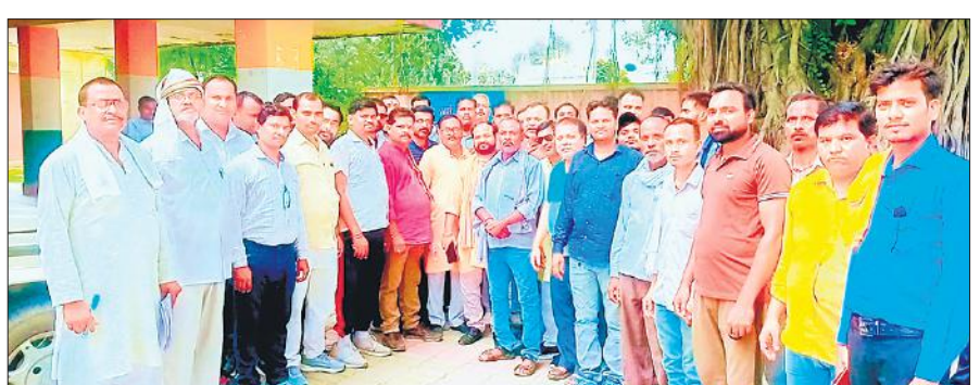
ज्ञापन देने कलेक्ट्रेट पहुंचे कोटेदार।

दिए गए ज्ञापन में कहा गया है कि सर्वर की समस्या के कारण राशन वितरण भी सही तरह से नहीं हो पा रहा है तो ईकेवाईसी कैसे संभव है। सर्वर की समस्या का समाधान किया जाए। सिम कार्ड बदलकर कंपनियों के भुगतान पर रोक लगाई जाए। जिस कार्ड धारक परिवार की ईकेवाईसी की जाती है, उस परिवार की अधिकंश बुजुर्ग एवं बच्चों के अंगूठे नहीं आ पाते हैं, जिससे उनका यूनिट कटता है। इस स्थिति में कार्ड धारक