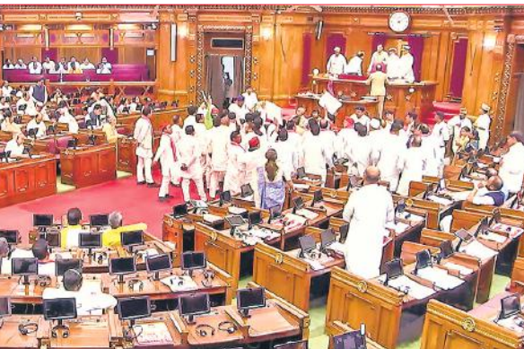
मानसून सत्र के दौरान विधानसभा के वेल में विरोध प्रदर्शन करते विपक्ष के विधायक।