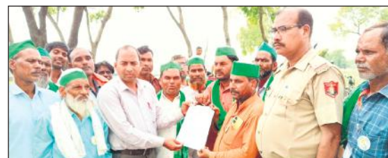
जेई को ज्ञापन सौंपते किसान।