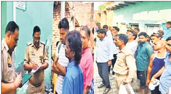
मौके पर जांच पड़ताल करती पुलिस एवं एकत्र ग्रामीणों की भीड़। ● अमृत विचार

में भर्ती कराया गया है। इस्पेक्टर ने बताया कि इसकी जानकारी पुलिस के आलाधिकारियों को दे दी गई