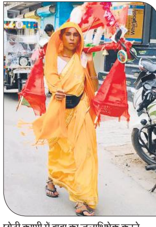
छोटी काशी में बाबा का जलाभिषेक करने कांवड़ लेकर जाती महिला श्रद्धालु।