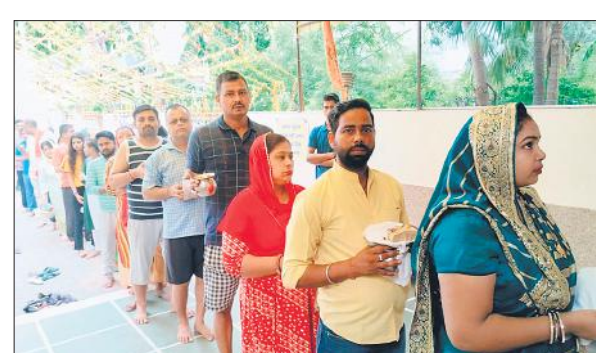
शहर के एक मंदिर में कतार में खड़े श्रद्धालु।

मंदिरों में सुरक्षाकर्मी भी तैनात रहे। नगर निगम की ओर से मंदिरों के