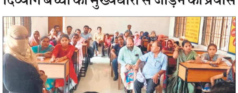
नगर संसाधन केंद्र किला पर बैठक में मौजूद दिव्यांग बच्चों के अभिभावक।