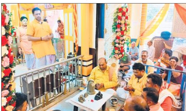
बाबा बनखंडीनाथ मंदिर में रुद्राभिषेक करते भगवान भोलेनाथ के भक्त।

महानगर में बाबा विश्वनाथ मंदिर, बाबा बनखंडीनाथ मंदिर, बाबा चाकसीनाथ मंदिर, मनकामेश्वर मंदिर, मनोकरण मंदिर, हनुमत धाम मंदिर समेत अन्य प्रमुख शिवालयों में महिलाओं, पुरुषों और युवा पुरे दिन उमड़ते रहे। बाबा बनखंडीनाथ मंदिर में रुद्राभिषेक भी किया गया। हर हर महादेव, वम-वम भोले, ओम नमः शिवाय के साथ घंटों की ध्वनि भी गूंजती