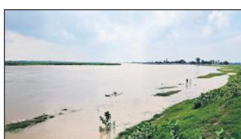
उसहैत क्षेत्र में गंगा में बढ़ रहा पानी।

नरौरा बैराज से सोमवार को एक लाख 54 हजार 350 क्यूसेक पानी छोड़ा गया। जबकि एक दिन पहले भी एक लाख 38 हजार क्यूसेक पानी छोड़ा गया। रविवार को छोड़ा गया पानी कछला गंगा में पहुंच गया है जिससे गंगा का जलस्तर फिर खतरे के निशान से 38 सेमी ऊपर पहुंच गया है। आज छोड़ा गया पानी भी मंगलवार को यहां पहुंच जाएगा उसके बाद स्थिति और भयावह हो जाएगी। उसहैत इलाके में आज गंगा की धार का पानी आस पास के खेतों में पहुंच गए। धान की फसलें जलमग्न हो