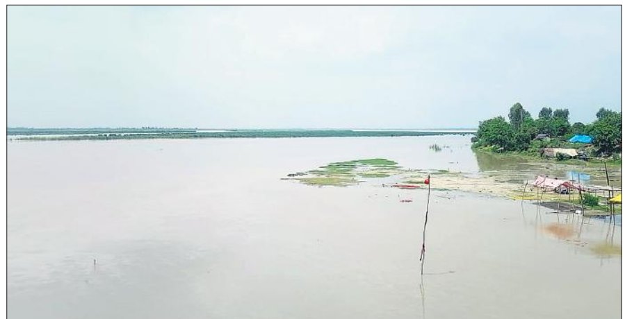
बढ़ते जलस्तर में डूब रहा डाई घाट गंगा तट पर लगा जिला पंचायत का टेंट। ● अमृत विचार

मिर्जापुर के इस्लामनगर, आजादनगर, मस्जिदनगला और पंखियानगला गांव चपेट में