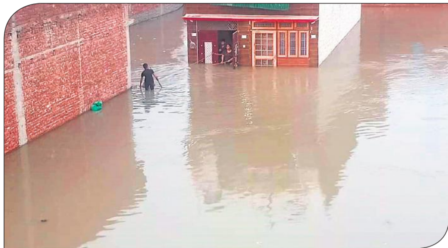
महानगर के घरों में भरे पानी के बीच फंसे लोग।