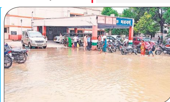
मैडिकल कॉलेज में भरा पानी।