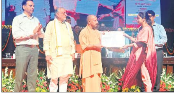
लोकभवन में चयनित लेखपाल को नियुक्ति पत्र देने मुख्यमंत्री योगी आदित्यनाथ।

कर्मियों के प्रति रहें सजग, लोगों के बीच अपनी छवि सुधारें लेखपाल : योगी आदित्यनाथ