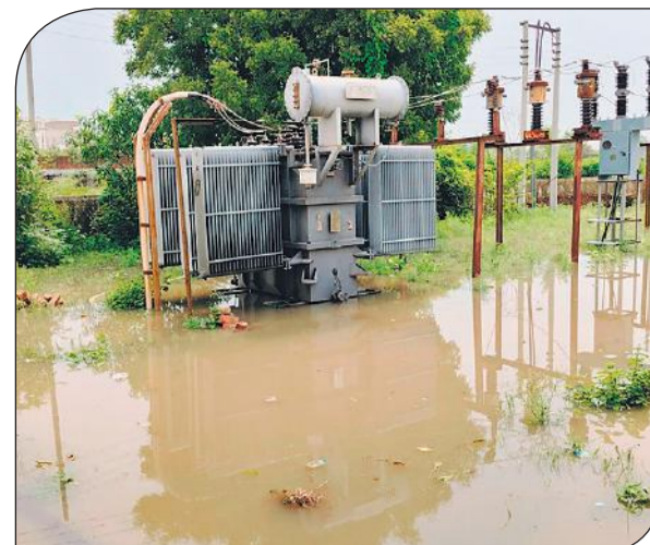
सिटी पार्क बिजली घर में भरा पानी।