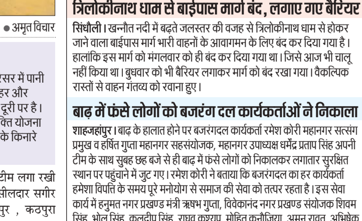
बैरियर लगाकर बंद किया गया रास्ता।