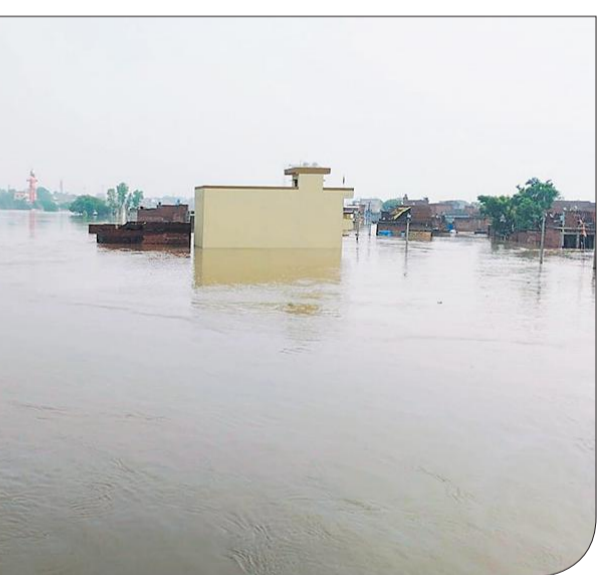
हनुमत धाम के पास मकान कुछ इस तरह आधे-आधे पानी में डूब गए हैं।

से पूछताछ की। साथ ही ग्रामीणों की समस्या का समाधान करने को कहा। समाधान न करने पर बीडीओ ने डाकघर के उच्चाधिकारियों को मामले से अवगत कराने की बात कहकर वापस लौट गए। इसके बाद ग्रामीणों ने अधिकारियों से इस मामले में शिकायत की है। यह मामला सोशल मीडिया पर वायरल हो रहा है।