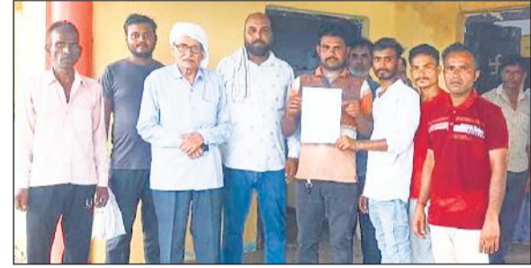
एसडीओ को ज्ञापन देते महुआ पिमई गांव के ग्रामीण।

संवाददाता, खुटार अमृत विचार: गांव महुआ पिमई में एक दिन पहले रखा गया ट्रांसफार्मर फुंक गया। इससे भीषण गर्मी में परेशान तमाम ग्रामीणों ने एकत्र होकर बुधवार को खुटार विद्युत उपकेंद्र पहुंचकर एसडीओ को ज्ञापन सौंपा। एसडीओ ने एक दिन की मोहलत मांगी है। इसके बाद खराब ट्रांसफार्मर बदलवाकर दूसरा रखवाने का आश्वासन दिया है। लोगों ने बताया कि गांव में बिजली लाइन निकली हुई है। जो काफी जर्जर हो गई है। इसके चलते बिजली लाइन कई बार टूट चुकी है। इस मामले में अधिकारियों को अवगत कराया गया। बावजूद इसके जर्जर लाइन को बदलवाया नहीं गया। इससे हर वक्त हादसे की आशंका रहती है। इसके अलावा कई दिन पूर्व बिजली विभाग की ओर से गांव में पंच लाइन डालने के लिए पोल लगाए गए थे। इस कार्य को ऐसे ही छोड़ दिया गया। जिससे गांव में लोग जर्जर लाइन में कटिया डालकर घरों में बिजली सप्लाई चला रहे हैं। जिस कारण ओवरलोड के चलते रोजाना फॉल