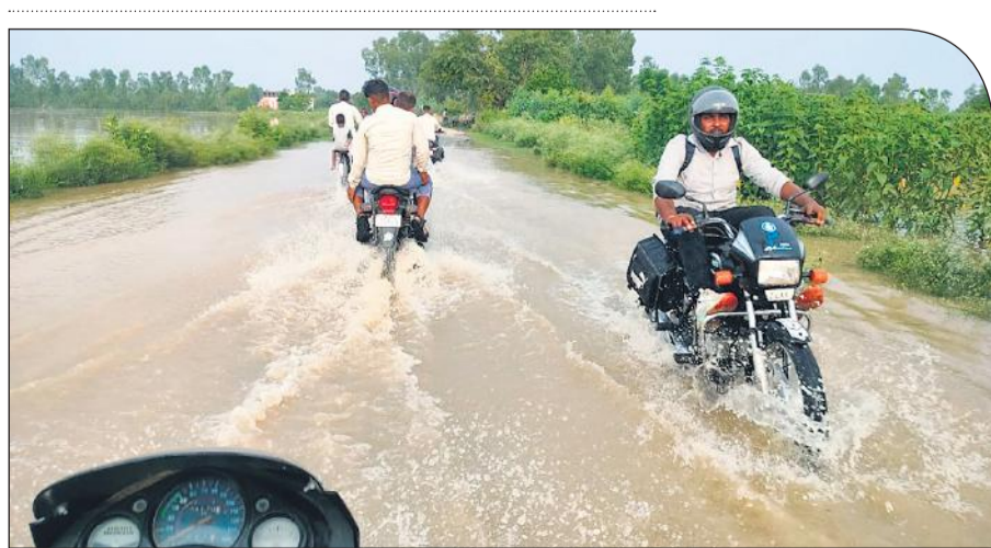
रटा गांव के पास सड़क पर बह रहे पानी के बीच निकलते वाहन।