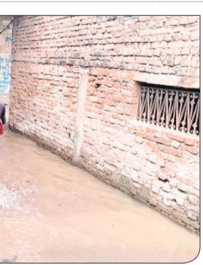
लोधीपुर में पानी में समाए घरों से निकल कर सुरक्षित स्थान की ओर जाते लोग।