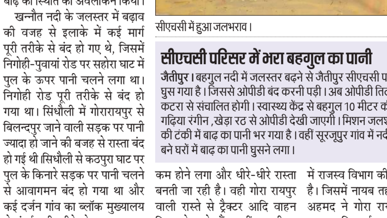
बैरियर लगाकर बंद किया गया रास्ता।