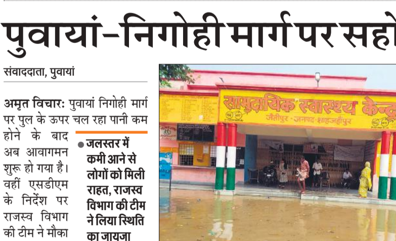
इस तरह निकाले गए बाढ़ में फंसे लोग।