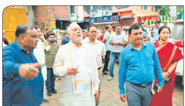
लोधीपुर का निरीक्षण करते वित्त मंत्री सुरेश कुमार खन्ना।

शाहजहांपुर। प्रशासन ने अब तक कुल 750 लोगों को बाढ़ क्षेत्र से निकाल कर सुरक्षित स्थान पर पहुंचाया है। पानी भरने के चलते सुभाष नगर से 35 परिवारों को विस्थापित किया गया है। इसी तरह मोहल्ला हयातपुर से 12 परिवार, खजा फिरोज से 20 परिवार, लोदीपुर से 15 परिवार, अक्षरधाम कॉलोनी से 12 परिवार, लोक विहार कॉलोनी से 10 परिवार विस्थापित किए गए हैं। इस तरह कुल 519 लोगों को राहत शिविरों में पहुंचाया गया है। यह राहत शिविर बचपन पब्लिक स्कूल सुभाष नगर, तक्षशिला विद्यालय, गुरु नानक विद्यालय, गन्ना शोध संस्थान में बनाए गए हैं। बुधवार तक प्रशासन की ओर से कुल 750 लोगों को सुरक्षित बाढ़ प्रभावित मकान से बाहर निकाला गया है।