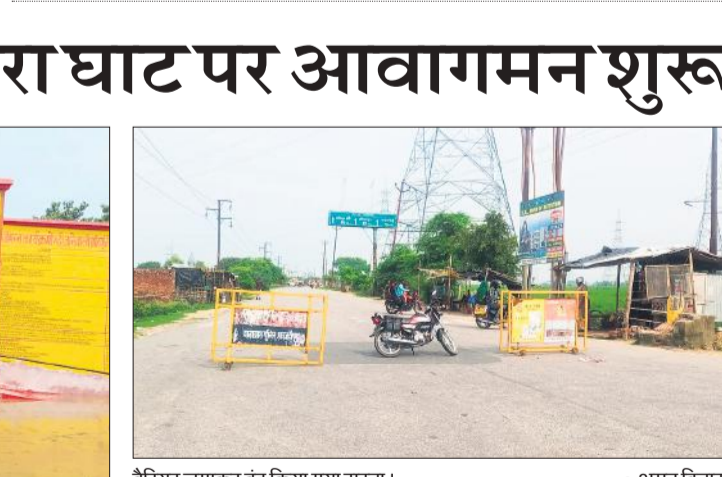
बैरियर लगाकर बंद किया गया रास्ता।