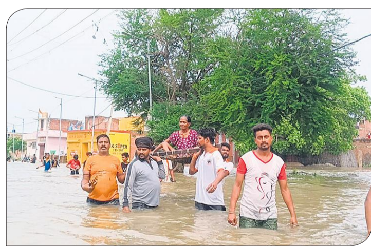
इस तरह निकाले गए बाढ़ में फंसे लोग।