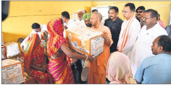
चंदिया हजारा में राहत सामग्री बांटते मुख्यमंत्री योगी आदित्यनाथ।

अमृत विचार : मुख्यमंत्री योगी आदित्यनाथ ने पीलीभीत जिले के तहसील कलीनगर और पूरनपुर के गांवों का हवाई निरीक्षण किया। उन्होंने चंदिया हजारा गांव में बाढ़ पीड़ितों की समस्याएं जानीं और राशन किट का वितरण किया। उन्होंने कहा कि सरकार आपके साथ है डरने की कोई बात नहीं है। कहा कि नेपाल और पहाड़ों पर हुई बारिश से प्रदेश के 12 जनपद प्रभावित हुए हैं। पीलीभीत के 152 गांव और फसलें प्रभावित हुई हैं। तीन जनहानि होने पर पीड़ित तीनों परिवार को चार-चार लाख रुपये की