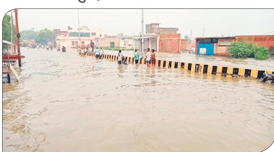
लोधीपुर में सड़क पर पहुंचा पानी।