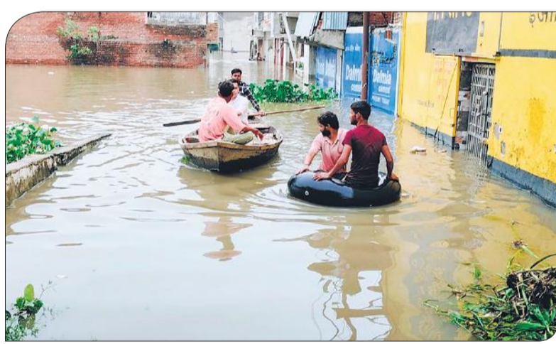
बाढ़ के बीच फंसे लोगों को बोट से निकालते राहत कर्मी।

तिलहर, अमृत विचार : नदियों का जलस्तर बढ़ने पर प्रभावित क्षेत्र खुदागंज के गांव भुंडी, बमिहाना, भुंडा हरवंशपुर, रामपुर जयचंद का बुधवार को एसडीएम अंजली गंगवार ने निरीक्षण किया। एसडीएम ने बताया कि गरीब नदी का जलस्तर बढ़ने के कारण पानी गांवों के समीप पहुंच गया है। गनीमत है कि अभी आबादी तक नहीं पहुंचा है। भुंडा हरवंशपुर में गरीब नदी से आवागमन बाधित होने के कारण नाव की व्यवस्था की गई है। बमिहाना एवं रामपुर जयचंद के मध्य भी जलस्तर बढ़ने से मार्ग बाधित हो गया। उक्त गांवों भी नाव की व्यवस्था कर दी गई है। तिलहर के क्षेत्रांतर्गत कुल 25 बाढ़ चौकियां स्थापित की गई हैं। गढ़िया रंगीन में रामगंगा नदी का जलस्तर बढ़ा है। नदी का जलस्तर बढ़ने से अभी कोई अपरिहार्य स्थिति उत्पन्न नहीं हुई है।