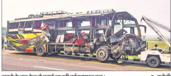
हादसे के बाद क्रेन से हटाई जा रही दुर्घटनाग्रस्त बस।