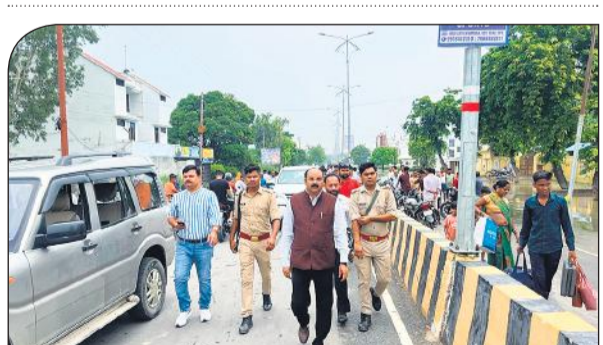
बाढ़ की स्थिति का जायजा लेते सांसद अरुण कुमार सागर।