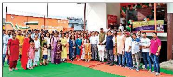
स्वतंत्रता दिवस पर हुए कार्यक्रम में मौजूद बैंक ऑफ बड़ौदा के अधिकारी-कर्मचारी।