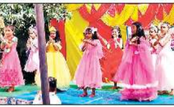
शक्तिधाम में कार्यक्रम प्रस्तुत करती छात्राएं।