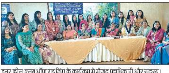
इनर हील क्लब ऑफ राइडिंग के कार्यक्रम में मौजूद पदाधिकारी और सदस्य।