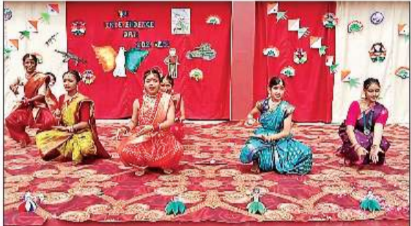
जेडीएम स्कूल में रंगारंग प्रस्तुति देती छात्राएं।