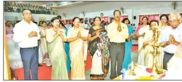
आरएन पब्लिक स्कूल में कार्यक्रम का शुभारंभ करते अतिथि।