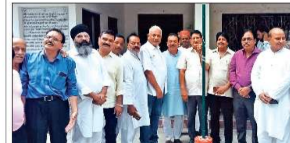
कांग्रेस कार्यालय में ध्वजारोहण करते कांग्रेस कार्यकर्ता।