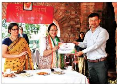
कर्मचारियों को सम्मानित करती विधायक सरिता आर्या व डीएम।