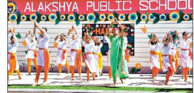
खाटीमा में सांस्कृतिक कार्यक्रम प्रस्तुत करते अलक्ष्या पब्लिक स्कूल के बच्चे।