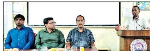
एरीज की ओर से आयोजित कार्यशाला में छात्रों को संबोधित करते संयुक्त निदेशक।