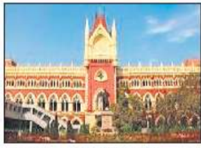
● मुख्य न्यायाधीश ने कहा कि अदालत चिकित्सा प्रतिष्ठान को बंद करने का आदेश दे सकती है आदेश