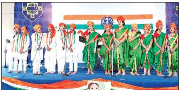
स्वतंत्रता दिवस के अवसर पर विभिन्न प्रकार की केशभूषा में सजे दीक्षांत स्कूल के बच्चे