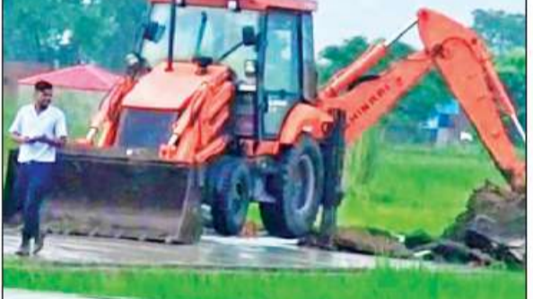
किच्छा में खेत के बीच काटई गई सड़क तोड़ती जेसीबी।