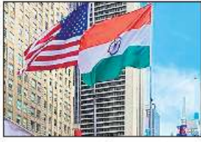
● शहरभर में कार्यक्रम आयोजित भारत और अमेरिका के बीच मजबूत संबंधों को किया प्रदर्शित

भारत के स्वतंत्रता दिवस के उपलक्ष्य में गुरुवार को शहरभर में कई कार्यक्रम आयोजित किए गए, जिनमें भारत और अमेरिका के बीच मजबूत संबंधों के साथ-साथ भारत की समृद्ध विरासत को प्रदर्शित किया गया। न्यूयॉर्क में भारत के महावाणिज्य दूतावास, संयुक्त राष्ट्र में भारत के