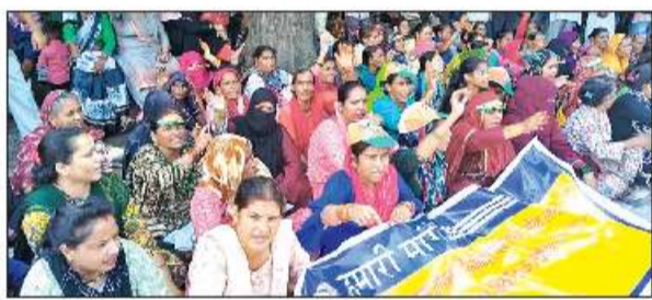
रामनगर में भूख हड़ताल व धरने पर बैठे लोग।

अमृत विचार: वन ग्राम फुड्री में घरों को तोड़ने के नोटिस को वापस लेने तथा जो व्यक्ति जहां निवास कर रहा है, उसे वहां पर नियमित कर मालिकाना हक देने की मांग को लेकर सैकड़ों लोग स्वतंत्रता दिवस पर भूख हड़ताल कर धरना दिया। लखनपुर में धरने पर लोगों ने वन ग्रामों को राजस्व ग्राम बनाए जाने, किसी भी व्यक्ति को हटाने से पहले उसका पुनर्वास करने की भी मांग की। ग्रामिणों ने कहा कि कल 15 अगस्त को मोदी सरकार ने स्वतंत्रता दिवस पर हर घर तिरंगा झंडा लगाने का आह्वान किया है। मगर हमारे घर तोड़े जा रहे हैं। ऐसे