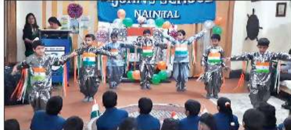
सेंट जॉन्स स्कूल में कार्यक्रम पेश करते बच्चे।