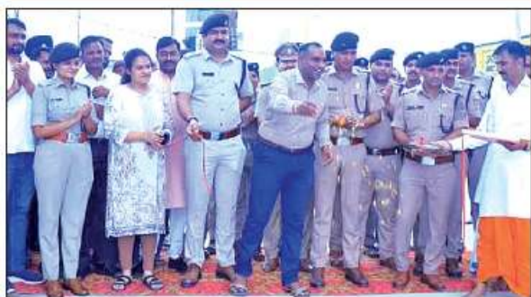
धर्मपुर पुलिस चौकी के नवनिर्मित भवन का उद्घाटन करते एसएसपी।