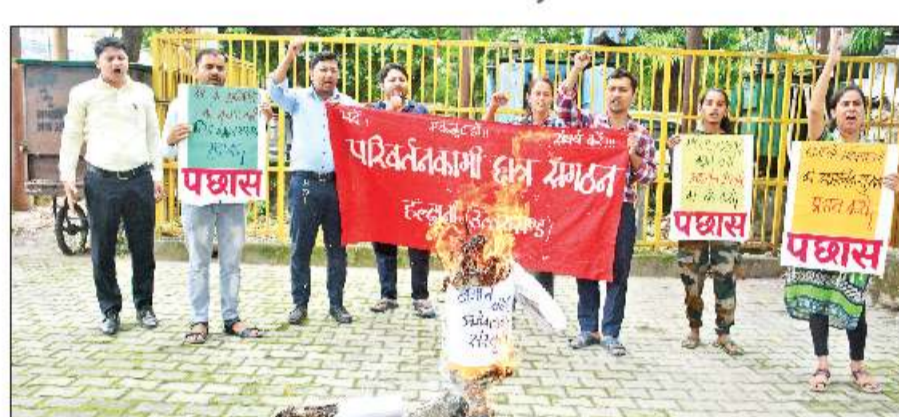
डॉक्टर की बलात्कार के बाद हत्या के विरोध में बुद्ध पार्क में पश्चिम बंगाल सरकार का पुला फूँका

अमृत विचार: पश्चिम बंगाल के कोलकाता में एक डॉक्टर के साथ हुए बलात्कार के विरोध में सरकारी डॉक्टरों ने हड़ताल का फैसला किया है। निजी अस्पतालों के डॉक्टरों से भी विरोध जताएंगे। शनिवार को सरकारी और निजी अस्पतालों की ओपीडी बंद रहेगी। सरकारी अस्पतालों की ओपीडी अब रक्षाबंधन के बाद मंगलवार को ही खुलेगी हालांकि इमरजेंसी सेवाएं चालू रहेंगी।