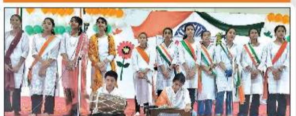
टीगोर पब्लिक स्कूल में स्वतंत्रता दिवस पर कार्यक्रम प्रस्तुत करते छात्र।