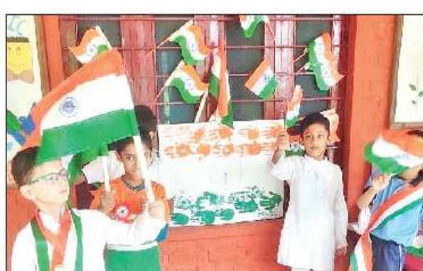
सुजन स्पेशल स्कूल में स्वतंत्रता दिवस पर कार्यक्रम करते बच्चे।