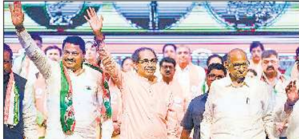
सभा के दौरान महाराष्ट्र कांग्रेस प्रमुख नाना पटोले, शिवसेना (यूबीटी) प्रमुख उद्धव ठाकरे और एनसीपी (एसपी) प्रमुख शरद पवार।

शिव सेना प्रमुख उद्धव ठाकरे ने शुक्रवार को कहा कि वह महा विकास आघाटी (एमवीए) के मुख्यमंत्री पद के चेहरे के रूप में कांग्रेस और राष्ट्रवादी कांग्रेस पार्टी (शरद पवार) की ओर से घोषित किसी भी उम्मीदवार का समर्थन करेंगे। विपक्षी गठबंधन एमवीए के पार्टी कार्यकर्ताओं को यहां संबोधित करते हुए ठाकरे ने कहा कि विधानसभा चुनाव महाराष्ट्र के स्वाभिमान को बचाने की लड़ाई है। महाराष्ट्र में अक्टूबर या नवंबर में