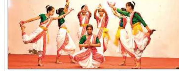
भीमताल में लेक्स इंटरनेशनल स्कूल में आयोजित कार्यक्रम।