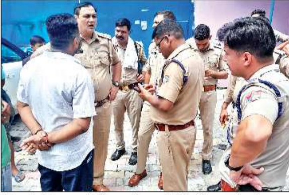
सीमावर्ती यूपी-रुद्रपुर गांव में घटना की जानकारी लेती यूपी-उत्तराखंड पुलिस।

अमृत विचार: कोतवाली रुद्रपुर व बिलासपुर कोतवाली के सीमावर्ती इलाके में द्यूशन पढ़ने वाली छात्राओं से छेड़छाड़ का विरोध करने पर मनचलों ने दो युवकों पर हमला कर घायल कर दिया। सूचना मिलने पर यूपी-उत्तराखंड की पुलिस ने घटना की जानकारी ली और आरोपियों की धरपकड़ शुरू कर दी। बताया जा रहा है कि यूपी पुलिस ने एक शादीशुदा युवक को गिरफ्तार कर लिया, जबकि रुद्रपुर पुलिस ने युवकों को मेडिकल परीक्षण कर रिपोर्ट दर्ज करने की तैयारी शुरू कर दी है। कोतवाली बिलासपुर मानपुर ओझा की रहने वाली कुछ छात्राएं प्रीत विहार फेस दो कोतवाली रुद्रपुर इलाके में द्यूशन पढ़ने आती हैं। दोनों ही कोतवाली की