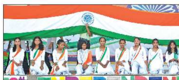
रुद्रपुर के स्टोन रिज स्कूल में रंगारंग कार्यक्रम पेश करती छात्राएं।