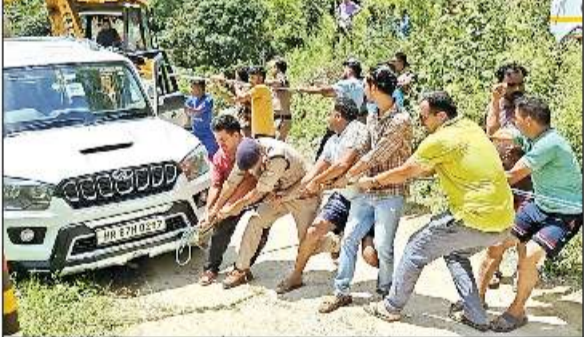
सड़क किनारे लटके वाहन को निकालती पुलिस और स्थानीय लोग।