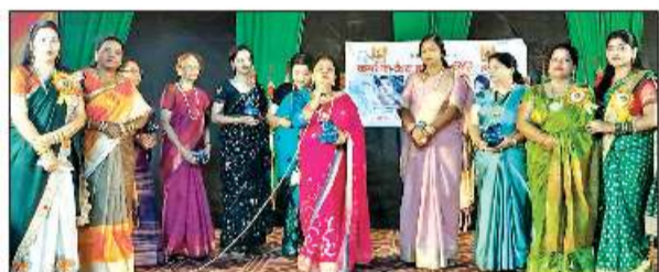
कसौधन वैश्य सभा का तीज महोत्सव में मौजूद महिलाएं।