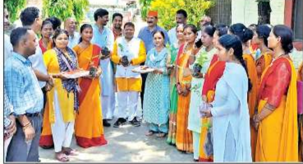
सिताराज में वन अधिकारियों को रक्षा सूत्र बांधने पहुंची एकल परिवार की क्वैन।