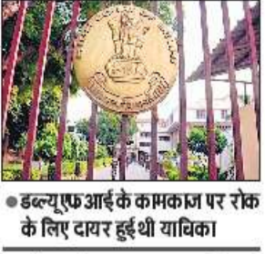
● डब्ल्यूएफआई के कामकाज पर रोक के लिए दायर हुई थी याचिका

नई दिल्ली, एजेंसी दिल्ली उच्च न्यायालय ने शुक्रवार को भारतीय कुश्ती महासंघ (डब्ल्यूएफआई) के लिए भारतीय ओलंपिक संघ (आईओए) की तदर्थ समिति के अधिकार को बहाल कर दिया जिसमें मौजूदा स्वरूप में डब्ल्यूएफआई के कामकाज पर रोक लगाने और खेल के लिए राष्ट्रीय महासंघ के रूप में कोई भी गतिविधि करने से रोकने की मांग की गई थी। शीघ्र पहलवान बजरंग पुनिया, विनेश फोगाट, साक्षी मलिक और