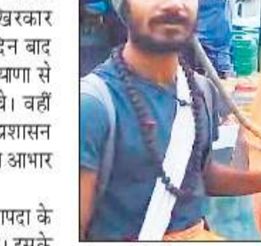
पैदल मार्ग से केदारनाथ धाम पहुंचे तीर्थयात्री।

हो पाना बड़ी चुनौती थी। आपदा से 19 किमी लंबा पैदल मार्ग 29 जगहों पर बुरी तरह क्षतिग्रस्त हो गया था। कई जगह तो रास्ता पहाड़ के मलबे के साथ ही बह गया था। सरकार ने जल्द से जल्द पैदल यात्रा मार्ग सुचारू कराने के लिए विभिन्न स्थानों पर 260 से अधिक मजदूरों को लगाया गया। ज्यादा जगहों पर मार्ग दुरुस्त हो गया है, एक-दो जगह पर परेशानी बनी है। आपदा के 15 दिन बाद गुजरात व हरियाणा के कई तीर्थयात्री इसी पैदल मार्ग से केदारनाथ धाम पहुंचे। उनका कहना है कि एक-दो जगह ज्यादा दिक्कत है, लेकिन वहां सुरक्षा जवान तीर्थयात्रियों को रास्ता पार करवा रहे हैं। उनका कहना है कि जिला प्रशासन की तरफ से मार्ग पर बेहतर व्यवस्थाएं की गई हैं।