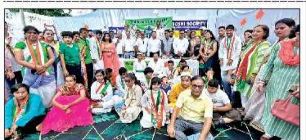
रोशनी सोसायटी द्वारा आयोजित कार्यक्रम में उपस्थित एसडीएम और अन्य।