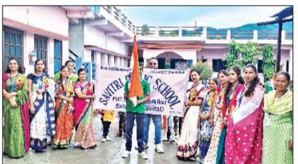
सावित्री पब्लिक स्कूल में तिरंगा रेली निकालते विद्यार्थी व शिक्षक।