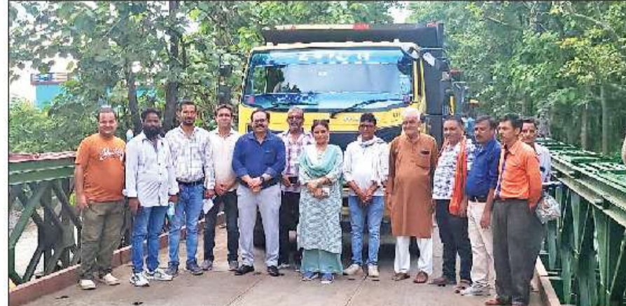
चकलुआ में वैली ब्रिज पर वाहनों के ट्रायल के दौरान लॉन्चिंग शुरू की गई।

अमृत विचार: कालाढुंगी-हल्लानी स्टेट हाईवे पर चकलुआ के पास वैली ब्रिज बनकर तैयार हो गया है। हाईवे पर वाहनों की आवाजाही के लिए रविवार तक इंतजार करना होगा। शुक्रवार को वैली ब्रिज का सफल ट्रायल किया गया। राजधानी देहरादून से जोड़ने वाले रामनगर-कालाढुंगी-हल्लानी स्टेट हाईवे पर चकलुआ के पास बीते 31 जुलाई को भारी बारिश के चलते निहाल नाले के उफान पर आने से पुलिया नाले में समा गयी थी। पुलिया बहने से आवाजाही पूरी तरह खप हो गयी थी। बीते 1 अगस्त से प्रशासन व लोक निर्माण विभाग हल्लानी द्वारा 100 फीट के बैली ब्रिज का निर्माण शुरू कर दिया था। 17 दिन बाद लॉन्चिंग