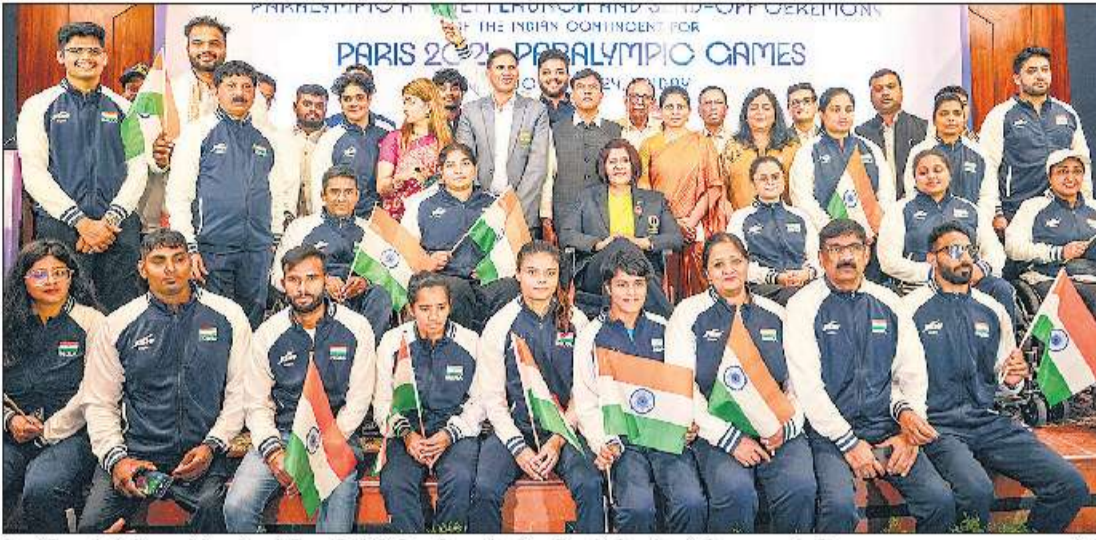
पैरालंपिक खेलों में भाग लेने वाले जाते खिलाड़ियों के विदाई समारोह में शामिल केंद्रीय खेलमंत्री मनसुख मांडविया व अन्य।

खेलमंत्री मांडविया बोले- पेरिस पैरालंपिक में सर्वश्रेष्ठ प्रदर्शन की उम्मीद