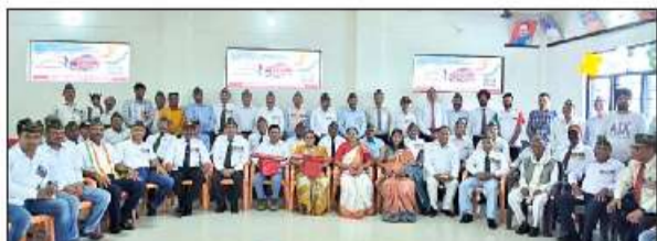
दिनेशपुर सैनिकभवन में आयोजित स्मारोह में मौजूद पूर्व सैनिक।