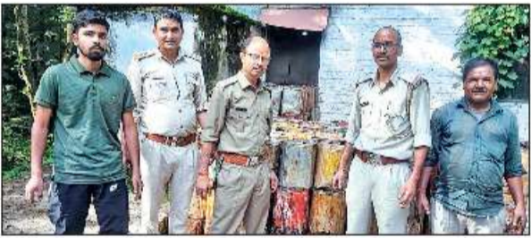
जागेश्वर के वन कर्मियों द्वारा फकड़ा गया अवैध लीसा।