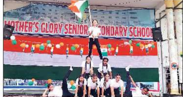
रामनगर के मदर्स ग्लोरी स्कूल में कार्यक्रम प्रस्तुत करते बच्चे। ● अमृत विचार

स्कूली छात्र-छात्राओं ने निकाली प्रमातफेरी, ध्वजारोहण के साथ हुए रंगारंग कार्यक्रम