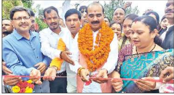
देवीधुरा बगवाल मेले का फीता काट कर शुभारंभ करते केंद्रीय राज्य मंत्री अजय टट्टा।

शुक्रवार को केंद्रीय सड़क परिवहन एवं राजमार्ग राज्य मंत्री अजय टट्टा ने हनुमान मंदिर के निकट मुख्य गेट पर फीता काटकर देवीधुरा बगवाल मेले का शुभारंभ किया। महिलाओं, स्कूली बच्चों द्वारा पारम्परिक परिधानों में मंदिर प्रांगण तक भव्य शोभा यात्रा निकाली गई। मेले का मुख्य आकर्षण रक्षाबंधन पर्व पर हनुमान जिसमें प्रदेश के मुख्यमंत्री पुष्कर