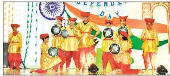
रुद्रपुर के कोलम्बस पब्लिक स्कूल में कार्यक्रम प्रस्तुत करते छात्र।