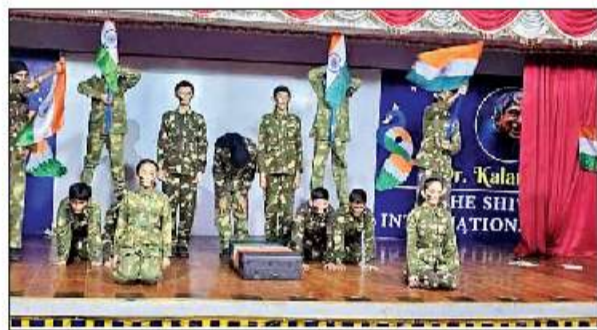
शिवालिक इंटरनेशनल स्कूल में कार्यक्रम प्रस्तुत करते बच्चे