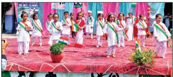
स्वतंत्रता दिवस पर रंगारंग कार्यक्रम प्रस्तुति करती जेडीएम स्कूल की छात्राएं।