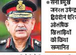
● सेना प्रमुख जनरल उपेन्द्र द्विवेदी ने पेरिस ओलंपिक खिलाड़ियों को किया सम्मानित। जनरल द्विवेदी ने विश्वास व्यक्त किया कि सेना के खिलाड़ी उत्कृष्टता की अपनी खोज जारी रखेंगे और आने वाले दिनों में और भी अधिक ऊंचाइयों हासिल करेंगे। भारतीय सेना ने कहा भारतीय दल ने पेरिस ओलंपिक में कुल छह पदक जीते हैं जिसमें एक रजत और पांच कांस्य शामिल था। सेना के सुबेदार मेजर नीरज चोपड़ा ने भारत के लिए बाला फेंक में एकमात्र रजत पदक जीता। उनका यह अनुकरणीय प्रदर्शन ओलंपिक खेलों में सेना के सबसे उल्लेखनीय प्रदर्शनों में से एक बन गया है। भारत की 2036 ओलंपिक की मेजबानी के लिए बोली लगाने की तैयारी को देखते हुए भारतीय सेना ओलंपिक उत्कृष्टता को बढ़ावा देने में महत्वपूर्ण भूमिका निभा रही है।

पेरिस खेलों के दौरान भारतीय दल में भारतीय सेना का प्रतिनिधित्व 11.11 प्रतिशत (117 में से 13) था। सेना के खिलाड़ियों ने समग्र पदक तालिका में 16.66 प्रतिशत का योगदान दिया। इसमें सेना के सुबेदार मेजर बाला फेंक खिलाड़ी नीरज चोपड़ा का रजत पदक शामिल है। इस सम्मान समारोह को यहां साउथ ब्लॉक में आयोजित किया था और यह उपलब्धियों का जश्न मनाने के साथ देश में खेल प्रतिभाओं को निखारने में सेना द्वारा निभाई गई महत्वपूर्ण भूमिका को स्वीकार करने का भी अवसर था। जनरल द्विवेदी ने पेरिस खेलों में उनकी उल्लेखनीय उपलब्धियों के लिए उन्हें सम्मानित किया।