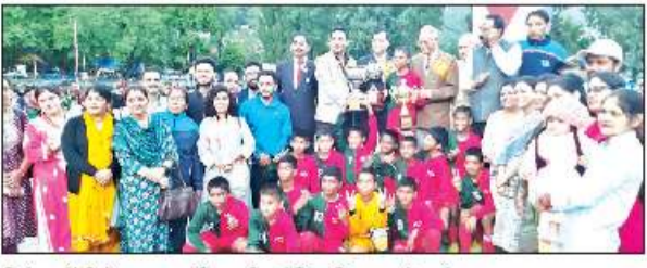
विजेता टॉफी के साथ भारतीय शहीद सैनिक विद्यालय के बच्चे।