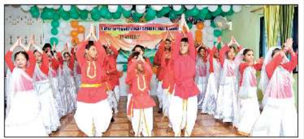
जेएमडी इंटरनेशनल स्कूल में कार्यक्रम प्रस्तुत करते बच्चे।