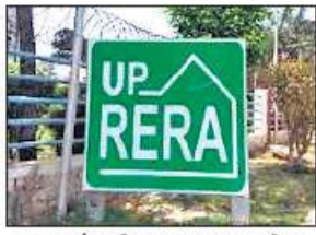
● राज्य में करीब 3,700 आवासीय परियोजनाएं रेरा के साथ पंजीकृत