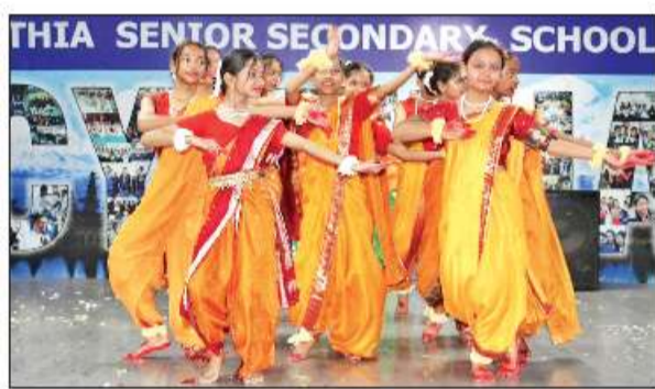
सिथिया इंटरनेशनल स्कूल में सांस्कृतिक कार्यक्रम पेश करती छात्राएं।