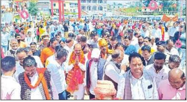
देवीधुरा मेले में लोगों की उमड़ती भीड़। ● अमृत विचार

इस अवसर पर कार्यक्रम में आए अतिथियों का संस्कृत महाविद्यालय देवीधुरा के छात्रों तथा राजकीय उच्चतर माध्यमिक विद्यालय की छात्राओं द्वारा मनमोहन स्वस्तिक वचन कर स्वागत किया गया। टट्टा ने कहा कि मां वाराही की असीम कृपा से ही मुझे इस पावन