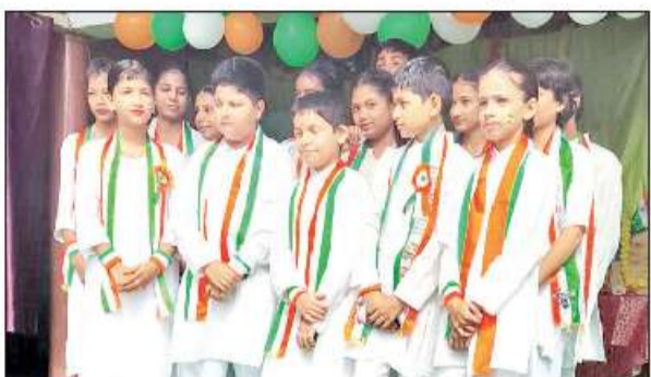
स्वतंत्रता दिवस के अवसर पर सजे विजडम स्कूल के बच्चे