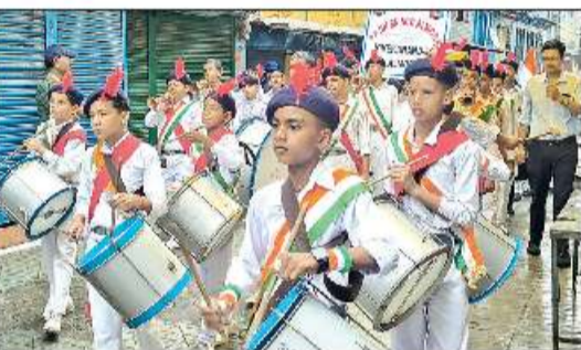
अल्मोड़ा में स्वतंत्रता दिवस पर प्रभात फेरी निकालते स्कूली बच्चे।