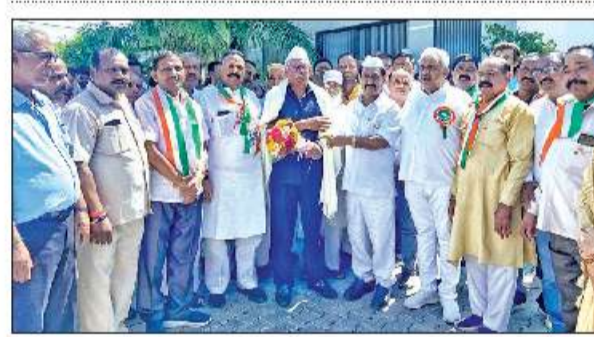
किष्कः में वरिष्ठ समाजसेवी को सम्मानित करते विधायक बेडू।