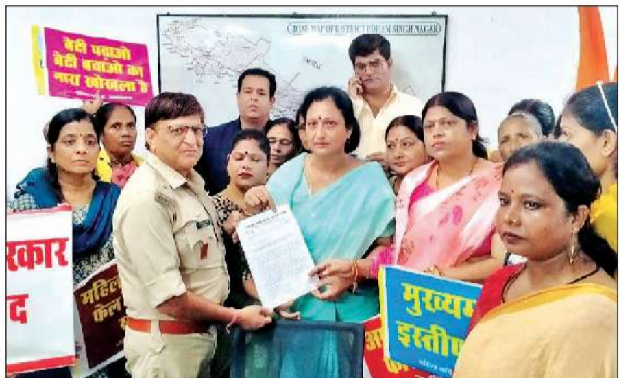
रुद्रपुर में एसपी सिटी को ज्ञापन देते कांग्रेस कार्यकर्ता।

08 अगस्त को उसका सड़ा-गला शव डिबडिबा यूपी के खाली प्लाट में मिला था