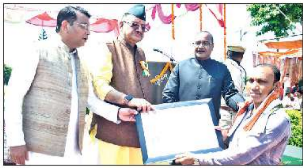
बेहतर स्वच्छता के लिए नगर निगम कर्मियों को सम्मानित करते प्रभारी मंत्री गणेश जोशी।

अमृत विचार: ऊधमसिंह नगर में 78वां स्वतंत्रता दिवस धूमधाम के साथ मनाया गया। इस दौरान सरकारी, अर्द्ध सरकारी, निजी संस्थानों, स्कूल-कॉलेजों में ध्वजारोहण किया गया और देशभक्ति से संबंधित रंगारंग कार्यक्रम आयोजित हुई। इसी क्रम में पुलिस लाइन रुद्रपुर में आयोजित कार्यक्रम में जनपद प्रभारी एवं कृषि मंत्री गणेश जोशी ने ध्वजारोहण किया। इस दौरान स्वतंत्रता संग्राम सेनानी एवं उनके परिजनों को सम्मानित किया गया। साथ ही लखपति दीदी, स्वयं सहायता समूह, परीक्षाओं में अधिकतम अंक प्राप्त करने वाले छात्र-छात्राओं, उत्कृष्ट कार्य करने वाले पुलिस कर्मियों, स्वच्छता के लिए बेहतर कार्य करने के लिए नगर निगम की टीम को सम्मानित किया गया।