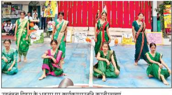
स्वतंत्रता दिवस के अवसर पर कार्यक्रम प्रस्तुति करती छात्राएं