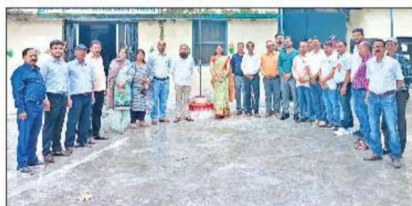
कृषि एवं भूमि संरक्षण कार्यालय में ध्वजारोहण के दौरान अधिकारी व कर्मचारी।