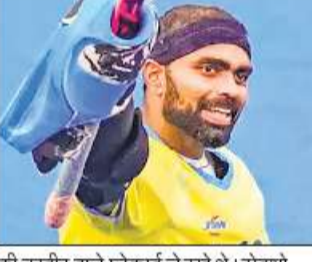
की तस्वीर वाले पोस्टकार्ड ले रहे थे। रोडशो के दौरान खुली जीप में श्रीजेश ने लोगों का अभिवादन स्वीकार किया। उन्हें फूल, गुलदस्त भेंट किए गए और लोगों ने उनसे हाथ मिलाते की होड़ लगी थी। श्रीजेश ने पेरिस ओलंपिक में कांस्य पदक जीतने के बाद हॉकी को अलविदा कह दिया। अब वह जूनियर टीम के कोच होंगे।

कोच। भारतीय हॉकी के महान गोलकीपर पी आर श्रीजेश को यहां पहुंचने पर भय स्वागत किया गया। उन्होंने कहा कि भला दो तीन महीने पर खिलाड़ी से कोच बनने के लिये खुद को तैयार करने पर बितायेंगे। यहां उनको स्वागत में हवाई अड्डे से पलारिकोम तक रोडशो किया गया। श्रीजेश ने कहा देश के लिए कड़ी मेहनत करके, कई कुर्बानियां देकर पदक जीता और यह सिर्फ मेरा नहीं बल्कि देश का पदक है। इस खुशी का हिस्सा बनना सोने पे सुहागा जैसा है। सुशी दुग्गी हो गई है। अब मुझे एक खिलाड़ी से एक कोच बनना है। इसके लिए मानसिक रूप से तैयारी करनी होगी। अपने दो तीन महीने बही करूंगा। यहां पहुंचने पर श्रीजेश के स्वागत के लिए काफी भीड़ जमा थी जिसमें कई क्लिबक भी थे। लोगों ने हाथ में श्रीजेश