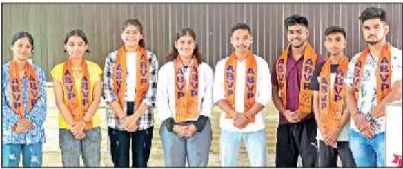
अखिल भारतीय विद्यार्थी परिषद की नगर ईकाई के सदस्य। ● अमृत विचार

अल्मोड़ा : जिलेभर में लोक पर्व धी संक्रांति शुक्रवार को हर्षोल्लास के साथ मनाया गया। लोगों ने कुल देवता को नई फसल चढ़ाकर पूजा-अर्चना की। मान्यता है कि इस पर्व पर धी का सेवन जरूर करना चाहिए। साल भर कभी भी धी का सेवन नहीं करने वाले लोग भी इस दिन एक चम्मच धी जरूर खाते हैं। प्रमुख तौर पर हरेला पर्व की तर्ज पर यह पर्व भी ऋतु पर आधारित है। हरेला बीज बने व नये पौधे लगाने का प्रतीक है, तोषी-त्योहार फसलों में बालियां लगाने की खुशी का प्रतीक है। त्योहार के एक दिन फले सभी घरों में शुद्ध धी बनाया गया। फिर धी संक्रांति के दिन इसे खया जाता है। इस दौरान मुख्य रूप से किसानों ने फसलों के अंकुरित होने पर कुल देवताओं का पूजन कर सुख-समृद्धि की कामना की। वहीं, नवविवाहित बेटों को ससुराली अंग देने पहुंचे। यह पर्व हरे के राजा सूर्य के कर्क राशि से निकलकर अपनी सिंह राशि में प्रवेश करने के अवसर पर यह पर्व मनाया जाता है।