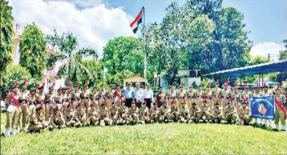
रामनगर डिग्री कालेज में ध्वजारोहण के उपरांत विद्यार्थी व प्राचार्य।