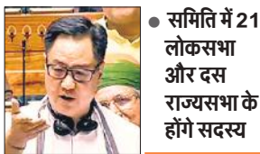
समिति में 21 लोकसभा और दस राज्यसभा के होंगे सदस्य

संसद ने वक्फ संशोधन विधेयक पर विचार करने के लिए दोनों सदनों की संयुक्त समिति के गठन की खातिर लोकसभा के 21 और राज्यसभा के 10 सदस्यों को नामित करने की अनुशंसा संबंधी प्रस्ताव को मंजूरी दे दी। बता दें कि विपक्षी दल जेपीसी की मांग कर रहे थे। इस संयुक्त समिति में लोकसभा से जिन 21 सदस्यों को शामिल किया गया है, उनमें भाजपा के आठ और कांग्रेस के तीन सांसद शामिल हैं। राज्यसभा से समिति में शामिल किए गए सदस्यों में से चार भाजपा के