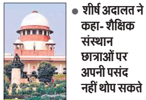
शीर्ष अदालत ने कहा- शैक्षिक संस्थान छात्राओं पर अपनी पसंद नहीं थोपा सकते

सुप्रीम कोर्ट ने इसके साथ ही यह भी कहा कि छात्राओं को यह चयन करने की स्वतंत्रता होनी चाहिए कि वह क्या पहनें। शीर्ष अदालत ने यह भी कहा कि शैक्षिक संस्थान छात्राओं पर अपनी पसंद को नहीं थोपा सकते। मुंबई के कॉलेज में हिजाब, बुर्का और नकाब पर पाबंदी को लेकर