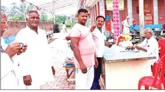
मां काली मंदिर परिसर में भंडारे की तैयारी में जुटे मंदिर कमेटी के पदाधिकारी।