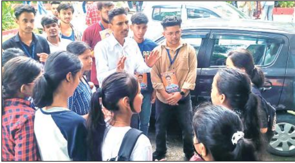
कॉलेज में छात्राओं से वोट की अपील करता संभावित प्रत्याशी।

इधर, कॉलेज परिसर में प्रचार के कारण बैक और यूओयू की परीक्षा दे रहे छात्र-छात्राओं को