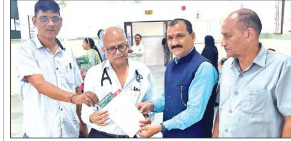
मेडिकल कॉलेज प्राचार्य को ज्ञापन देते उत्तराखंड क्रांति दल के पदाधिकारी।