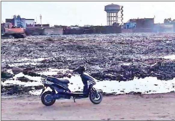
किच्छा रोड स्थित ट्रंचिंग ग्राउंड। • अमृत विचार

30 साल बाद मिली है नगर निगम को कूड़े की समस्या से निजात