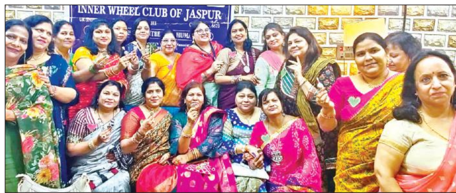
हरियाली तीज महोत्सव में भाग लेती इनर व्हील क्लब की सदस्य।