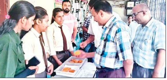
कार्यशाला के दौरान प्रदर्शनी का अवलोकन करते प्राचार्य व प्राध्यापक।

कॉलेज परिसर में प्रचार कर नारेबाजी करना मना है। यदि कोई छात्र नारेबाजी करते पाया गया तो उसके खिलाफ कार्रवाई की जायेगी। उन्होंने बताया कि स्नातक और स्नातकोत्तर पंचम सेमेस्टर में प्रवेश चल रहे हैं। छात्र-छात्राएं कॉलेज की वेबसाइट में आवेदन कर पूरी जानकारी ले सकते हैं।