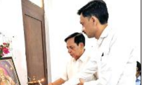
कार्यक्रम का शुभारंभ करते अतिथि।

ज्ञानार्थी मीडिया कॉलेज में हुई एनसीडीईएक्स के तहत कार्यशाला