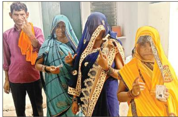
औरास में मतदान करने जाती महिलाएं।

बता दें कि विकासखंड फतेहपुर चौरासी की ग्राम पंचायत दबौली में बीते छह माह से रिक्त पड़े प्रधान पद के लिए मंगलवार को