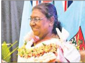
● फिजी के राष्ट्रपति रातू विलियम मैवालिनी ने किया सम्मानित

राष्ट्रपति कार्यालय ने 'एक्स' पर एक पोस्ट में कहा कि फिजी के राष्ट्रपति रातू विलियम मैवालिनी के प्रतिबिंब बताया।