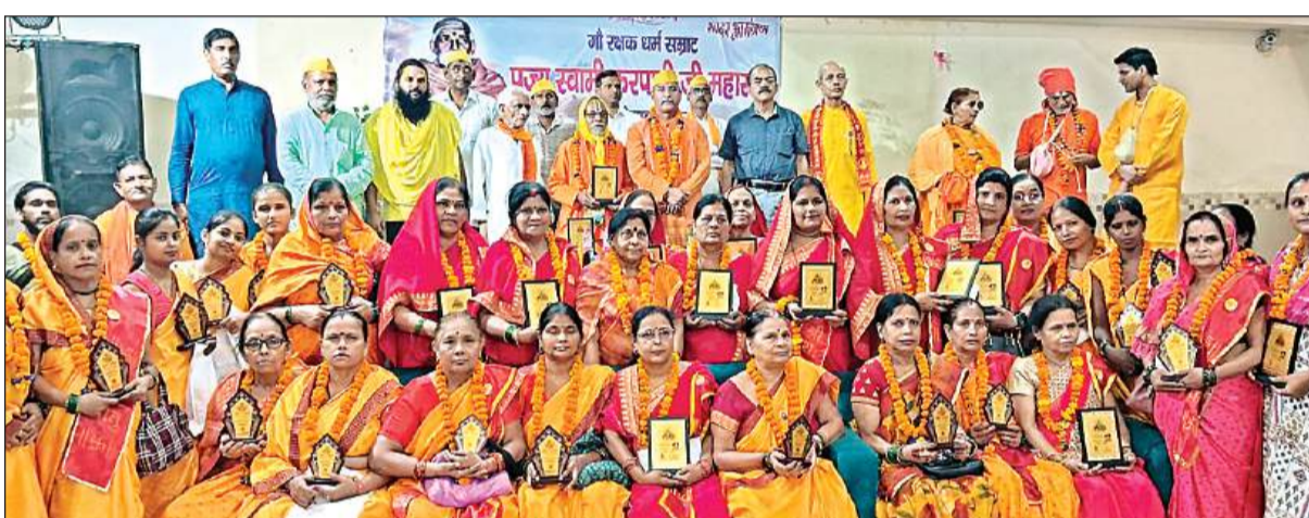
करपात्री जयंती के अवसर पर मौजूद अतिथियों को स्मृति चिह्न दिया गया।

इस धन से इस योजना की गाइडलाइन के अनुसार निर्माण के लिए चार सड़कें चयनित की गईं। इनके निर्माण के लिए टेंडर 6 अगस्त को दोपहर तक पड़ने थे और शाम को खुलने थे। लेकिन, अधिकारियों ने 3 दिन की मोहलत