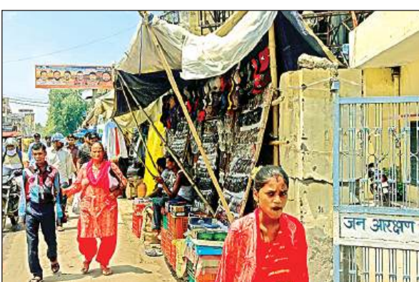
फुटपाथ पर दुकानों का कब्जा।

डिवाइडर की दो सरिया निकली हैं, जो राहगीरों को चोट पहुंचा सकती हैं। रेलवे लाइन से लेकर मार्केट तक ई-रिक्शा, आटो, फल के ठेला व काम की तलाश में निकले मजदूरों से जाम की स्थिति बनी रहती है। क्रॉसिंग के पास ही पनकी रोड पर दीवार पर चश्मे वाले अपनी दुकानें सजाए बैठे रहते हैं। सबकुछ देखें तो कल्याणपुर क्रॉसिंग इस समय अतिक्रमण का अड्डा बनी है। यहां से हर विभाग के अधिकारी रोज गुजरते हैं, लेकिन कार्रवाई के नाम पर कुछ नहीं है।