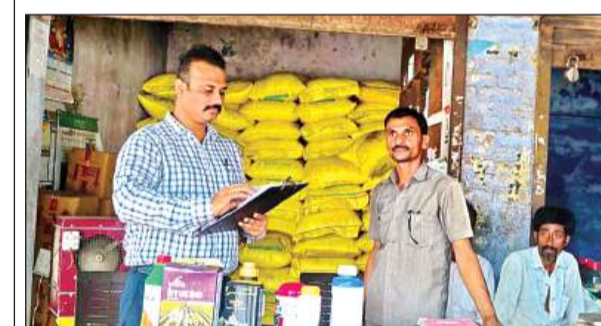
खाद व बीज दुकान में जांच करते जिला कृषि अधिकारी।