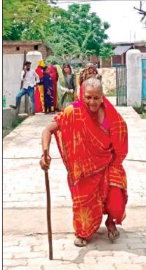
फतेहपुर चौरासी में मतदान करने जाती वृद्ध महिला।