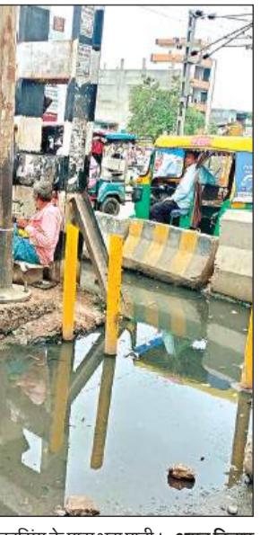
क्रॉसिंग के पास भरापानी। अमृत विचार