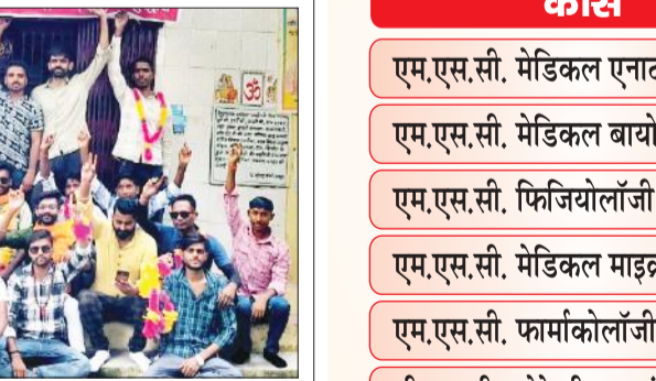
अब्दुल्लापुर पट्टी से हरिद्वार रवाना होने से पहले जयकारा लगाते कांवड़िये।