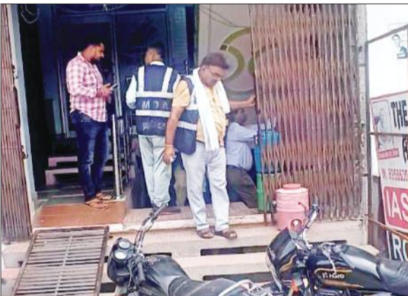
बेसमेंट में सील लगाने की कार्रवाई करती टीम।

संस्थानों को चिह्नित किया जा रहा है और उनके खिलाफ कार्रवाई की जा रही है।