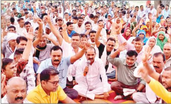
कलेक्ट्रेट में धरना प्रदर्शन करते सफाई कर्मचारी।

अमृत विचार: उत्तर प्रदेश पंचायती राज सफाई कर्मचारी संघ से जुड़े जिले भर के सफाई कर्मचारियों ने बायोमेट्रिक हाजिरी के विरोध में कलेक्ट्रेट पर धरना दिया। अपनी मांगों को पूरा करने के लिए सफाई कर्मियों ने नारेबाजी की। बायोमेट्रिक हाजिरी व्यवस्था समाप्त करने की जोरदार मांग उठाई।