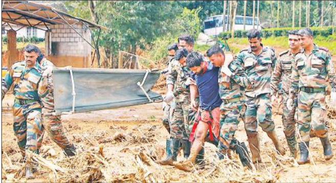
भूस्खलन के बाद बचाव कार्य के तहत युवक को सुरक्षित निकाल कर ले जाते सेना के जवान।