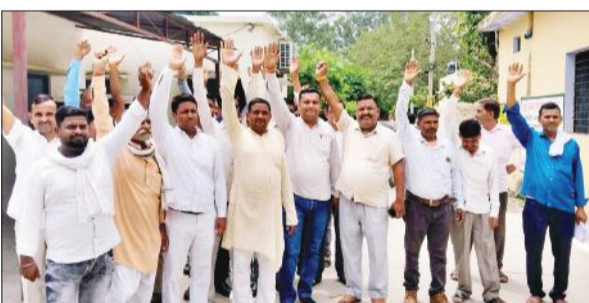
संपूर्ण समाधान दिवस में प्रदर्शन करते ग्राम प्रधान।

चौधरपुर, अमृत विचार : मुरादाबाद पुलिस ने शनिवार सुबह से ही भारी वाहनों को मुरादाबाद जिले की सीमा में प्रवेश नहीं होने दिया। इससे दिल्ली-लखनऊ हाईवे पर वाहनों की लंबी कतार लग गई। कई घंटे तक वाहन जाम में फंसे रहे। मुरादाबाद पुलिस ने ट्रक, कंटेनर, निजी बसों व बड़े वाहनों को सीमा में प्रवेश नहीं दिया। इससे हाईवे पर मुरादाबाद की सीमा से लेकर कोतवाली डिंडोली सीमा तक कई किलो मीटर तक वाहनों की कतार लग गई। जाम लगते ही डिंडोली पुलिस के हाथ पांव फूल गए। घंटों मशकत के बाद वाहनों को वैकल्पिक मार्ग से निकाल कर राहत की सांस ली।