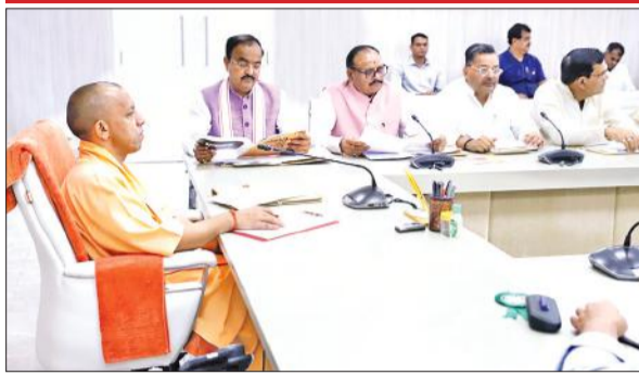
कार्यक्रम की तैयारी को लेकर बैठक करते मुख्यमंत्री योगी आदित्यनाथ।

महोत्सव की शुरुआत नौ अगस्त से होगी। निर्देश दिया कि प्रदेश के शहीद स्मारकों, स्मृति स्थलों,