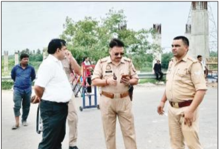
कोसी पुल पर तैनात पुलिस अधिकारी।

पांच अगस्त को सावन का तीसरा सोमवार है। इसके चलते गुरुवार और शुक्रवार को भारी संख्या में शिवभक्तों के जत्थे जल लेने के लिए बृजघाट और हरिद्वार के लिए रवाना हो गए थे। शनिवार को सुबह से ही कांवड़ियों का जल लेकर वापस आना शुरू हो गया। भीड़ को देखते हुए पुलिस ने रोडवेज बसों का भी रूट बदल दिया है। शनिवार सुबह से बसों को शाहबाद-पटवाई रोड से गुजारा गया। ताकि कांवड़ियों