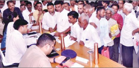
संपूर्ण समाधान दिवस के दौरान शिकायत सुनते डीएम व एसपी।