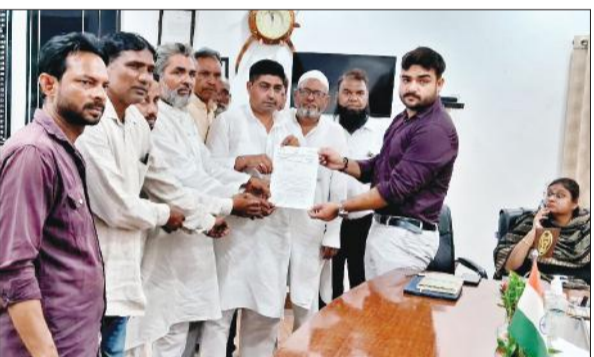
कलेक्टर में डिप्टी कलेक्टर को ज्ञापन सौंपते कांग्रेसी।

अमृत विचार : जिला एवं शहर कांग्रेस कमेटी के पदाधिकारियों ने अधोषित बिजली कटौती के विरोध में जिलाधिकारी कार्यालय के बाहर प्रदर्शन किया। बिजली कटौती रोकने की मांग की। राज्यपाल को संबोधित ज्ञापन डिप्टी कलेक्टर को सौंपा।