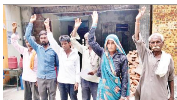
हसनपुर में संपूर्ण समाधान दिवस में प्रदर्शन करते ग्रामीण।

जांच कर कार्रवाई करें। अभियान चलाकर चक्रोड, तालाब को कब्जा मुक्त कराकर रिपोर्ट प्रस्तुत करें। इस दौरान उपजिलाधिकारी अमरोहा, तहसीलदार सहित अन्य जिला स्तरीय अधिकारी उपस्थित रहे।