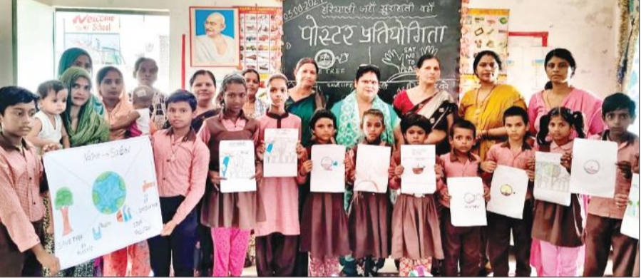
प्राथमिक विद्यालय में पर्यावरण जागरूकता के पोस्टर दिखाते बच्चे।