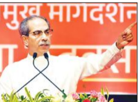
● ठाकरे ने शाह पर अफगान शासक अहमद शाह अब्दाली के राजनीतिक वंशज होने का लगाया आरोप

शिवसेना (यूबीटी) प्रमुख ने शाह पर पानीपत की लड़ाई में मराठों को हराने वाले अफगान शासक अहमद शाह अब्दाली के राजनीतिक वंशज होने का भी आरोप लगाया। ठाकरे ने शिवसेना और राकांपा में विभाजन