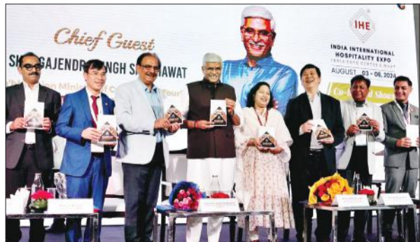
आईएचई 2024 का उद्घाटन करते केंद्रीय मंत्री गजेंद्र सिंह शेखावत और अन्य लोग।

केंद्रीय मंत्री ने कहा कि आईएचई 2024 का हिस्सा होना हमारे लिए गर्व की बात है। आईएचई वैश्विक मंच भारतीय हॉस्पिटैलिटी क्षेत्र की क्षमता को उजागर करता है। उन्होंने कहा कि हमारी सरकार पर्यटन और आर्थिक में उत्कृष्टता प्राप्त करने के लिए प्रतिबद्ध है। विश्व धरोहर