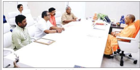
लखनऊ में मुख्यमंत्री से भेंट करता प्रतिनिधि मंडल।