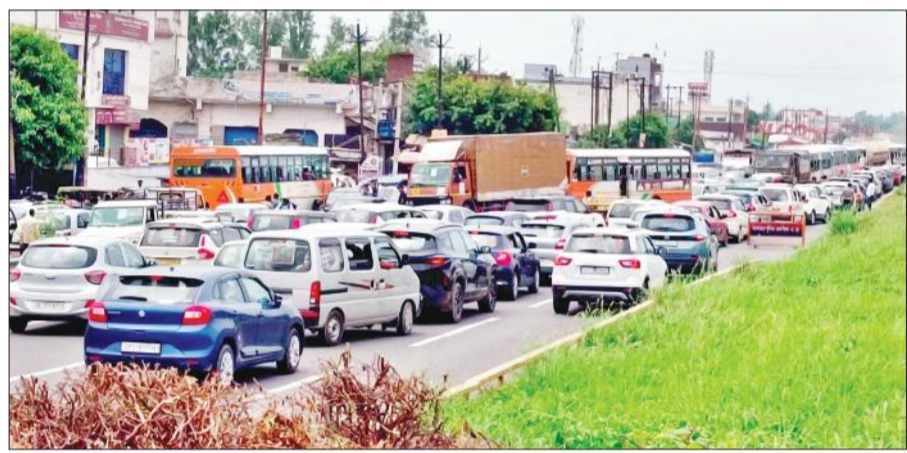
गजरोला में हाईवे पर जाम में फंसे वाहन।