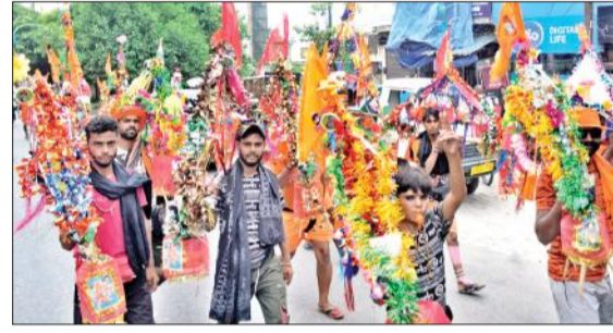
हरिद्वार से गंगाजल लेकर आते कांवड़िये।