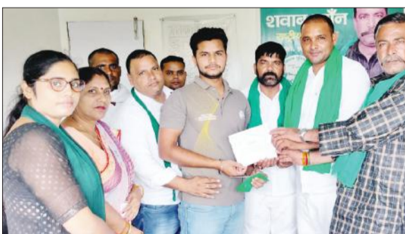
भाकियू के नए सदस्य को प्रमाण पत्र देते पदाधिकारी।