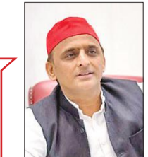
अमृत विचार : मुख्यमंत्री योगी आदित्यनाथ ने विपरीत परिस्थितियों में भी अथक परिश्रम के साथ मरीजों की सेवा करने के लिए डॉक्टरों की सराहना करने के साथ किसी भी हालत में धैर्य बनाए रखने की सलाह दी है।