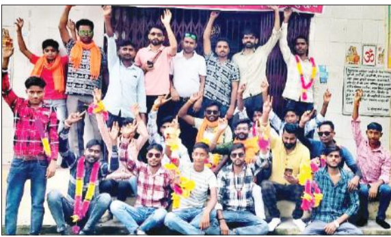
अब्दुल्लापुर पट्टी से हरिद्वार रवाना होने से पहले जयकारा लगाते कांवड़िये।

लाख रुपये नकद लाने पर ही घर आने की बात कही। पीड़ित महिला ने थाने में तहरीर देकर कार्रवाई की मांग की है।