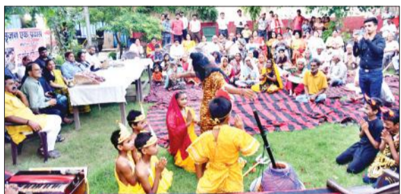
वृद्ध आश्रम में सांस्कृतिक कार्यक्रम प्रस्तुत करते बच्चे।