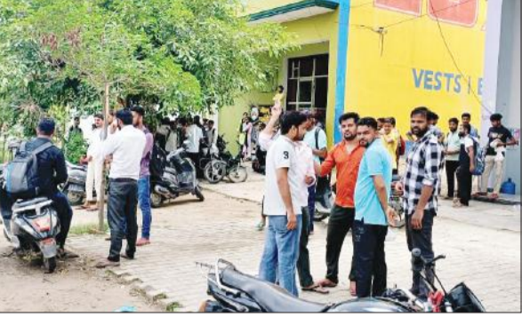
लाइब्रेरी बंद होने के बाद बाहर मौजूद छात्र।

अमृत विचार : दिल्ली में भूमिगत लाइब्रेरी में पानी भरने से यूपीएससी की तैयारी कर रहे तीन छात्र-छात्राओं की मौत को ध्यान में रखकर शनिवार को गजरोला में नायब तहसीलदार, एमडीए की टीम ने चार लाइब्रेरी और दो कोचिंग सेंटर बंद करा दिए। शुकवार को धनौरा में भी भूमिगत भवन में चल रहे लाइब्रेरियों को बंद कराया गया था।