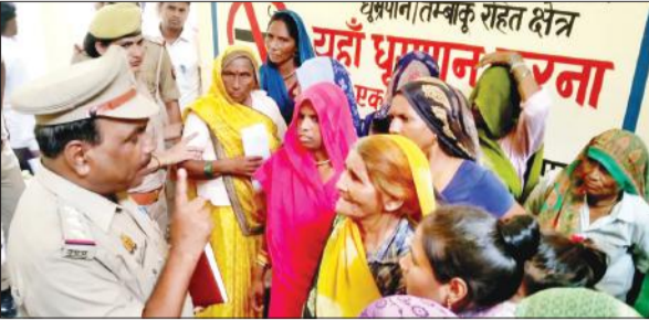
कोतवाल से नोकझोंक करते बमनेटा के ग्रामीण।