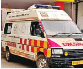
रोगी को लेकर जिला अस्पताल पहुंची एंबुलेंस।

अमृत विचार : स्वास्थ्य विभाग के पास मौजूद एंबुलेंस की लंबी आयु हो गई है। उनका अब रफ्तार भरने में भी दम निकलने लगा है, लेकिन फिर भी उन्हें दौड़ाया जा रहा है। जिले में 108 नंबर वाली 30 और 102 वाली 24 एंबुलेंस हैं। जो वर्तमान में रोगियों की सेवा में लगी हैं। लेकिन इनमें कई एंबुलेंस ऐसी हैं जिनका दम निकल चुका है पर उन्हें रोगियों की सेवा में किसी तरह से घसीटा जा रहा है। दूसरी बात यह है कि एंबुलेंस की सुविधा करीब 9-10 साल पहले शुरू हुई थी, उस समय आबादी के हिसाब से जिले को एंबुलेंस मिली थीं। तब से इनकी संख्या में कोई वृद्धि नहीं हुई है। कंडम घोषित होने के बाद उनकी जगह कुछ नई एंबुलेंस जरूर मिल