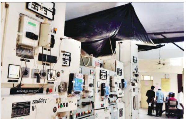
शाहबाद गेट बिजलीघर के लिंटर पर बंधी काली पॉलीथिन। ● अमृत विचार

वर्ष 2023 में हुई झमाझम बारिश से बिजलीघरों में पानी भर गया था। इससे शहर की बिजली आपूर्ति कई दिन तक टप रही थी। लिंटरों से भी पानी टपकने लगा था। ऐसी स्थिति का सामना न करना पड़े इसके लिए शाहबाद गेट, पहाड़ी गेट, रजा, किला