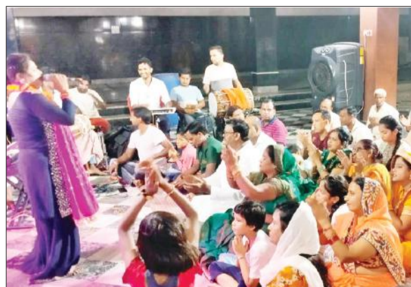
भजन संध्या में शामिल महिलाएं व अन्य।