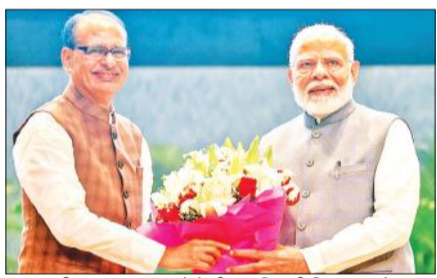
प्रधानमंत्री का स्वागत करते केंद्रीय कृषि मंत्री शिवराज चौहान।

मोदी ने अपने भाषण में कहा कि 65 साल पहले जब भारत ने मैसूर में इस सम्मेलन का आयोजन किया था। उस समय भारत की खाद्य सुरक्षा