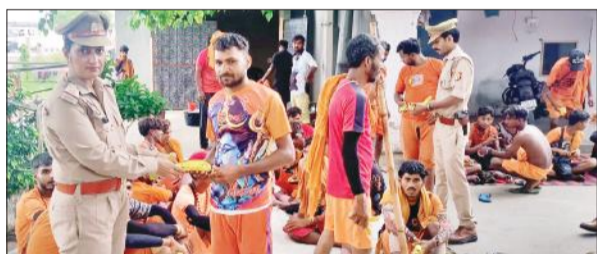
भोट थाने में कांवड़ियों को फल बांटती प्रभारी निरीक्षक व पुलिस कर्मी।