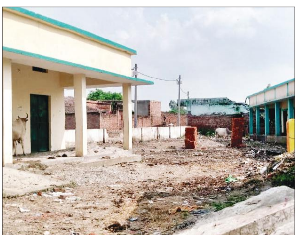
उच्च प्राथमिक विद्यालय के नए भवन में फैली गंदगी।

अमृत विचार : तहसील क्षेत्र के एक गांव में सरकारी विद्यालय का नया भवन छुट्टा पशुओं का आश्रय स्थल बन गया है। भवन में गंदगी फैली हुई है। लेकिन जिम्मेदार समस्या की अनदेखी कर रहे हैं। क्षेत्र के गांव हथियाखेड़ा में स्थित प्राथमिक विद्यालय एवं उच्च प्राथमिक विद्यालय मंगरोली के नाम से नए भवनों का निर्माण कराया गया है। लेकिन उसमें छुट्टा पशु घुस जाते हैं। नए भवन में गंदगी के अंبار हैं। विद्यालय के बच्चे ग्राम मंगरोली स्थित सरकारी स्कूल के एक कमरे में 4-5 माह से शिक्षा ग्रहण करने पर मजबूर हैं। पूर्व में विद्यालय में तैनात अध्यापकों ने शिक्षा विभाग एवं प्रशासनिक अधिकारियों को पत्र लिखकर भवन का निर्माण