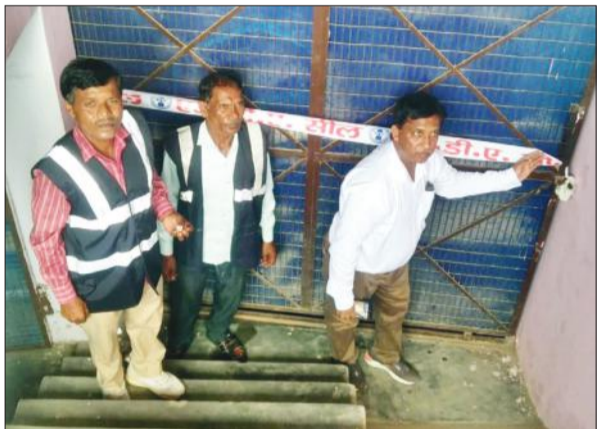
अवैध रूप से संचालित बेसमेंट को सील करती मुरादाबाद विकास प्राधिकरण की टीम।

शुक्रवार को एमडीए की ओर से सभी को नोटिस भेजना शुरू किया गया था। शनिवार को प्राधिकरण की टीम ने बिना मानकों के अवैध रूप से बेसमेंट में चल रहे कोचिंग सेंटर व अस्पतालों के खिलाफ कार्रवाई कर उन्हें सील कर दिया। इसके अलावा कई अन्य अस्पतालों व कोचिंग सेंटरों को नोटिस भेजा गया है कि कहीं भी बिना मानकों के बेसमेंट में कोचिंग सेंटर व अस्पतालों को बंदकर दिया जाए, अन्य उन्हें सील