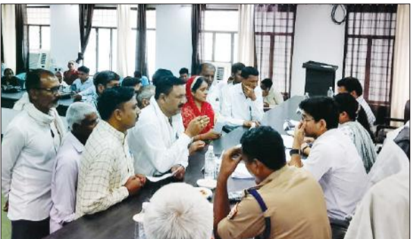
ठाकुरद्वारा में लोगों की शिकायतें सुनते मुख्य विकास अधिकारी व अन्य।

अमृत विचार : शनिवार को बजरंग दल डाक कांवड़ बेड़ा के कांवड़ियों ने बुजघाट से गंगाजल लाकर रायसत्ती मंदिर में भगवान भोलैनाथ का जलाभिषेक किया। बजरंग दल डाक कांवड़ बेड़ा के कांवड़ियों का जत्था दो अगस्त को बुजघाट रवाना हुआ था। वहां से गंगाजल लाकर शनिवार को भोलैनाथ के जयकारे लगाए हुए नगर में प्रवेश किया और रायसत्ती