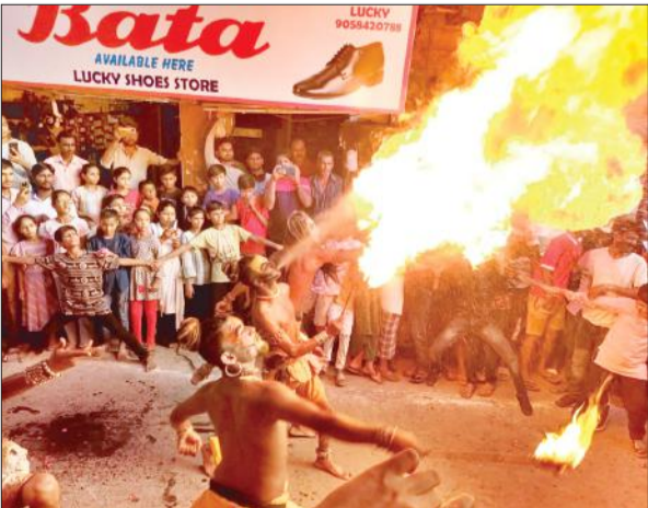
महाकाल पालकी यात्रा के दौरान आग का करतब दिखाते कलाकार।

अमृत विचार : श्री महाकाल सेवा परिवार कल्क नगरी संभल के तत्वावधान में नगर में श्री महाकाल सरकार (उज्वैन वालों) की पालकी यात्रा निकाली गई। जिसमें कलाकारों ने आग के हैरतअंगेज करतब दिखाकर लोगों को अर्चिभत किया। विभिन्न स्थानों पर पालकी यात्रा का स्वागत हुआ। इस दौरान महाकाल के जयकारे गूंजते रहे। जिससे माहौल भक्तिमय हो गया।