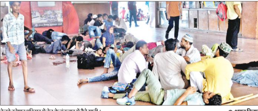
रेलवे स्टेशन परिसर में ट्रेनें के इंतजार में बैठे यात्री।

मई व जून में गर्मी की छुट्टियों के दौरान ट्रेनों में जहां एक तरफ यात्रियों की भीड़ थी तो वहीं ट्रेनों का संचालन पूरी तरह बिगड़ा हुआ था। जुलाई में ट्रेनें के संचालन में सुधार हो गया था। ट्रेनें अपने निर्धारित समय पर पहुंच रही थीं, लेकिन अगस्त शुरू होते से ट्रेनों का संचालन एक बार फिर से गड़बड़ हो गया है। कई जगहों पर बारिश होने से भी ट्रेनों का संचालन प्रभावित हुआ है। शनिवार को छह ट्रेनें अपने निर्धारित समय पर नहीं पहुंचीं।