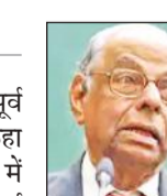
● आरबीआई के पूर्व गवर्नर सी रंगराजन बोले- रूस-यूक्रेन युद्ध से कई देशों ने आत्मनिर्भरता पर सोचना किया शुरू

हायर एजुकेशन के 14वें दीक्षांत समारोह को संबोधित करते हुए कहा कि भारत की वृद्धि रणनीति बहुआयामी होनी चाहिए। रंगराजन ने कहा कि निवेश दर बढ़ाकर, कृषि, विनिर्माण और सेवाओं पर जोर देकर, नई तकनीकों को आत्मसात करके और रोजगार के अनुकूल क्षेत्रों के मिश्रण को बढ़ावा देकर वृद्धि को प्रोत्साहित किया जा सकता है।