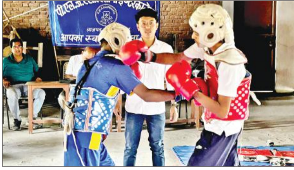
मंडलीय वुशु प्रतियोगिता में भाग लेते खिलाड़ी।