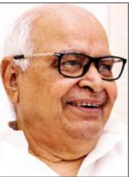
हृदय नारायण दीक्षित पूर्व विधानसभा अध्यक्ष उ.प्र.

रामचरितमानस में सबसे अच्छा वर्णन रामराज्य का है। दुनिया में राजव्यवस्था के अनेक मॉडल हैं। साम्यवाद, समाजवाद, उपयोगितावाद, लोककल्याण पर आधारित लोकतांत्रिक संसदीय पद्धति और प्लेटो का दार्शनिकवाद आदि राजव्यवस्था के कई उदाहरण हैं, लेकिन रामराज्य अनूठा है।