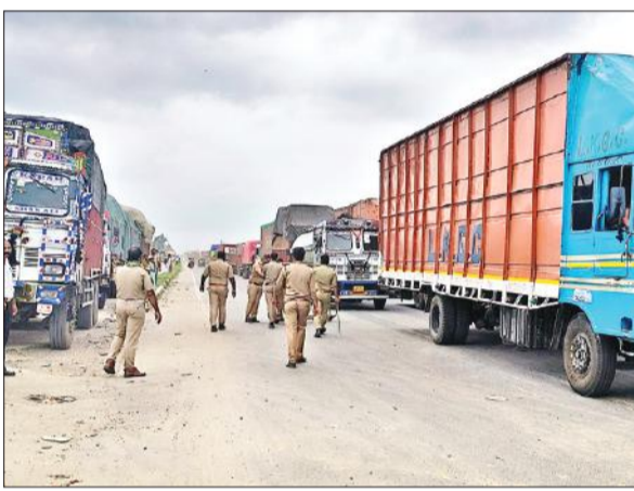
चौधरपुर में हाईवे पर वाहनों को निकलवाती पुलिस टीम।

देखकर नेशनल हाईवे पर भारी वाहनों को नहीं चलने दिया जाएगा।