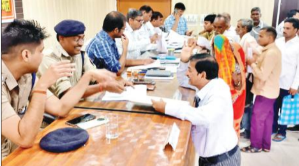
संभल में शिकायतें सुनते एडीएम व एसपी।