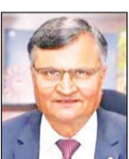
● कृषि अर्थशास्त्रियों के 32वें आईसीईए में चंद ने कहा- विश्व बैंक के अनुसार भारत ने 10 वर्षों में कृषि जीडीपी में अधिक वृद्धि दर की

कृषि अर्थशास्त्री ने बताया कि वैश्विक जीडीपी में कृषि का हिस्सा 2006 में 3.2% से बढ़कर हाल के वर्षों में 4.3% हो गया है।