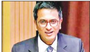
● सुप्रीम कोर्ट के विशेष लोक अदालत सप्ताह पर बोले डीवाई चंद्रचूड़

चंद्रचूड़ ने सुप्रीम कोर्ट में विशेष लोक अदालत सप्ताह पर कहा कि