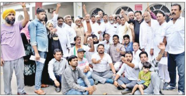
जिलाधिकारी कार्यालय के सामने प्रदर्शन करते कांग्रेसी।