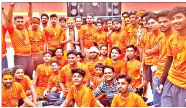
भगवान शिव का जयघोष करते शिवभक्त।