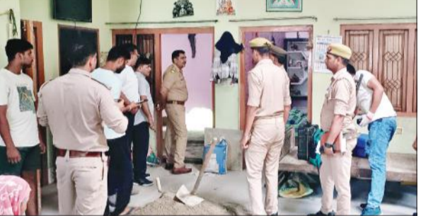
घटनास्थल की जांच करती पुलिस।