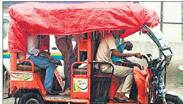
बारिश में ई-रिक्शा को ढककर जाते लोग।