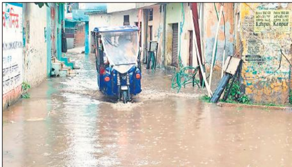
मधुवन कॉलोनी में हुआ जलभराव।

अमृत विचार: सावन के तेरह दिन बीतने के बाद आखिरकार रविवार को मेघराज मेहरबान हुए। सुबह से ही आसमान में बादल छाए गए। दोपहर के समय शुरू हुई झमाझम बारिश ने लोगों को उमस भरी गर्मी से राहत दिलाई। लगातार तेज धूप और उमस से बेहाल लोगों के चेहरे पर बारिश ने मुस्कान ला दी। इधर बारिश होने से फसलों का काफी लाभ पहुंचा है। सिंचाई की तैयारी कर रहे किसानों के चेहरों पर मुस्कान उभर गई है। कृषि अधिकारियों के मुताबिक तीन दिनों तक बारिश होने की संभावना है। वहीं बारिश की वजह से शहर में कई स्थानों पर जलभराव हो गया। जिसकी वजह से लोगों को आवगमन में दिक्कत उठानी पड़ी। पिछले कई दिनों से उमस भरी गर्मी लोगों को परेशान किए हुए थी। सुबह से खिल रही चटक धूप लोगों के पसीने छुड़ा रही थी। तापमान भी लगातार वृद्धि हो रही थी। अधिकतम तापमान 40 डिग्री सेल्सियस तक पहुंच चुका था। पिछले तीन दिनों से मौसम में अचानक से परिवर्तन