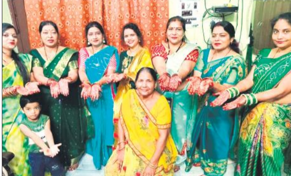
हरियाली तीज पर मेहदी रचे हाथ दिखाती महिलाएं।

अमृत विचार : हरियाली तीज जिले भर में बुधवार को मनाया गया। महिलाओं ने अखंड सौभाग्य और उत्तम संतान की कामना से व्रत रखा। बायना मंस कर घर के बुजुर्गों को देकर उनका आशीर्वाद लिया। सावन के शुक्ल पक्ष की तृतीया को हरियाली पर्व मनाया जाता है। बुधवार को यह पर्व महिलाओं द्वारा उत्साह के साथ मनाया गया। महिलाओं ने सोलह श्रंगार किए। एक दिन पूर्व मेहदी रचाई, हरी साड़ी एवं हरे कांच की चूड़ियां पहनीं। युवतियों ने मन चाहे वर की प्राप्ति के लिए व्रत रखा। घर में चौक काढ़कर भगवान शिव और माता गौरी की पूजा की। पूजा के बाद बायना मंसा और घर की बुजुर्ग महिलाओं को देकर उनका आशीर्वाद प्राप्त किया। पर्व को लेकर महिलाओं में उत्साह दिखाई दिया। शहर से लेकर कस्बों और गांवों में भी पर्व को हर्षोल्लास के साथ मनाया गया।