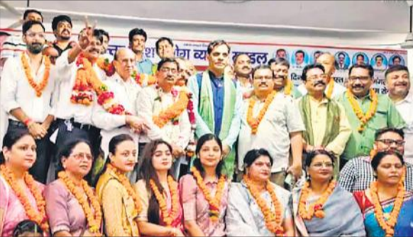
बैठक में उपस्थित व्यापार मंडल के पदाधिकारी।

सम्मेलन में आगरा में 8 और 9 अगस्त 2024 को होने वाले त्रिदिवसीय चुनाव पर भी चर्चा हुई जिसमें पदाधिकारियों का चुनाव