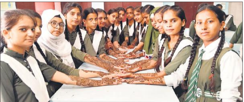
पटियाली के सेंट केएम इंटर कॉलेज में हाथों पर रची मेहंदी दिखाती छात्राएं।