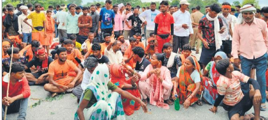
हाईवे जाम कर बैठे कांवड़िया और ग्रामीण।