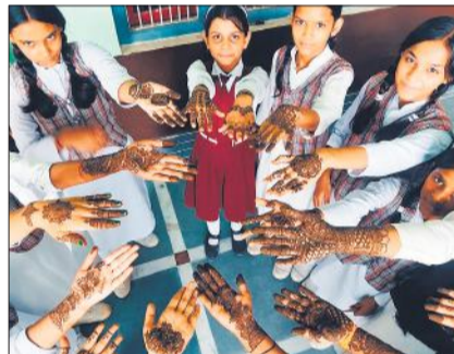
अमांपुर में मेहंदी रची हेथैलियां दिखाती छात्राएं।