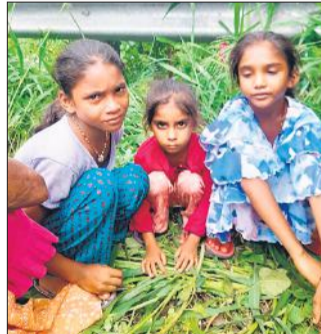
सड़क किनारे बैठी मृतक की बेटियां।