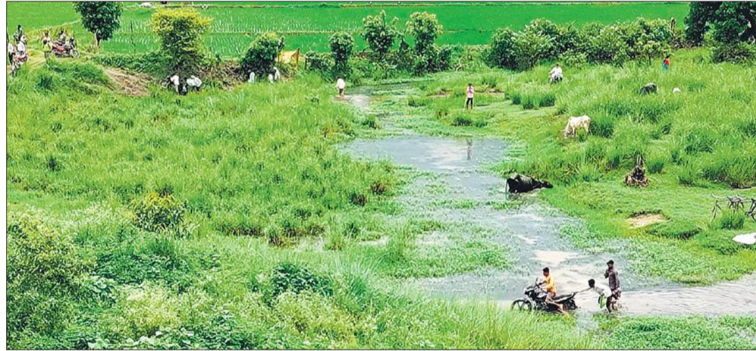
हाईवे पर जाम के कारण खेतों से होकर नदी पार करके निकलते राहगीर।