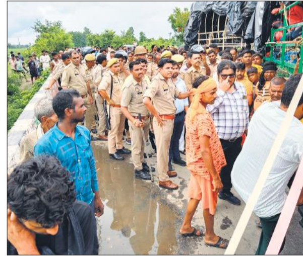
कठिना पुल से जाम खुलवाती पुलिस।