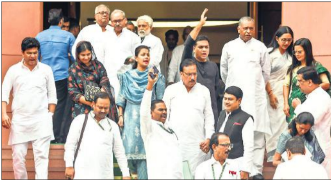
मानसून सत्र के दौरान विनेश फोगाट के समर्थन में वॉकआउट करते विपक्ष के सांसद।

विपक्षी दलों ने विनेश फोगाट के ओलंपिक में अयोग्य घोषित होने के पीछे घड़्यंत्र की आशंका जताते हुए केंद्र को घेरा और सवाल किया कि फाइनल मुकाबले से पहले उनका वजन 100 ग्राम कैसे बढ़ा तथा सरकार स्तर पर क्या किया गया है। उन्होंने कहा कि प्रधानमंत्री मोदी के एक्स पर पोस्ट कर देने से काम नहीं चलेगा। देश की बेटी को न्याय मिलना चाहिए। विपक्षी दलों ने दोनों सदनों से वाकआउट भी किया। खेल मंत्री के जवाब से असंतुष्ट विपक्ष ने वाकआउट कर संसद भवन के मकर द्वार पर नारेबाजी की। कांग्रेस महासचिव प्रियंका गांधी वाद्रा ने एक्स पर पोस्ट किया कि इस मुश्किल