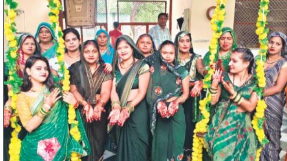
सोरो के लहरा में हरियाली तीज पर झूला झूलती महिलाएं।

तीज पर्व पर झूला झूलने की परंपरा रही है। यह वीतने समय की बात हो गई जब पूरे सावन मास में घर-घर झूले पड़ते थे और लोग झूलते थे। मल्हार और सावन के गीतों की धूम रहती थी, लेकिन अब यह सब गए गुजरे जमाने की बातें हो गई हैं। इस वर्ष भी हरियाली तीज पर शहर में कहीं झूले दिखाई नहीं दिए। नहीं मल्हार और सावन के गीतों के स्वर गुंजे।