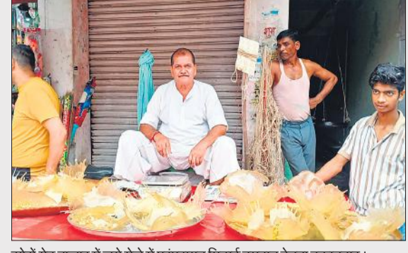
सोरो गेट बाजार में लगे मेले में परंपरागत मिठाई दमदान बेचना दुकानदार।

चीनी से बनी यह एक विशेष मिठाई होती है। यह वर्ष में सिर्फ दो दिन ही बनती और बिकती है। हरियाली तीज पर सोरो गेट बाजार में लगने वाले मेले के अलावा रक्षाबंधन पर्व पर नदरई गेट बाजार में लगने वाले मेले में भी यह मिठाई बिकती है। हरियाली तीज पर दमदान खूब बना और जमकर बिकी हुई।