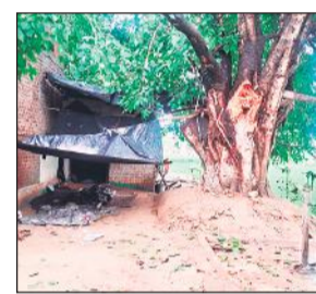
पीपल का पेड़ जिसकी डाली टूटकर गिरी।