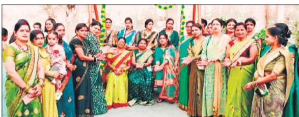
हरियाली तीज पर झूला झूलकर सावन के गीत गाती महिलाएं।