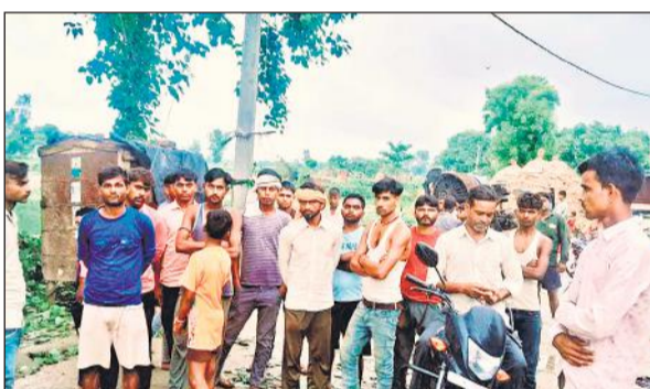
हादसे में बुजुर्गों की मौत के बाद मौके पर मौजूद ग्रामीण।

अमृत विचार : परिवार में एक युवक की मौत के बाद परिजन और पड़ोसी मंगलवार रात पेड़ के नीचे बैठे थे। मृतक का छोटा भाई चारपाई पर लेटा था। इसी दौरान पेड़ की टहनी उसके ऊपर गिर गई। युवक टहनी से दब गया। उसकी मौत हो गई। सूचना मिलने पर पुलिस और राजस्व विभाग की टीम पहुंची। पुलिस ने शव का पोस्टमार्टम कराया।