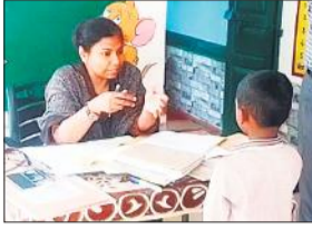
बच्चे से प्रश्न पूछती डीएम निधि श्रीवास्तव।

जिलाधिकारी ने निरीक्षण के दौरान स्कूल में साफ सफाई व्यवस्था, पेयजल, शौचालय की व्यवस्था, मध्याह्न भोजन की व्यवस्था आदि विभिन्न पहलुओं पर निरीक्षण किया। उपस्थित बच्चों से विभिन्न विषयों पर सवाल किए, सही उत्तर देने पर उनको प्रोत्साहित भी किया। उपस्थिति पंजिका का अवलोकन कर अध्यापकों व बच्चों की उपस्थिति को भी जाना। जिलाधिकारी ने निरीक्षण के दौरान मध्यान