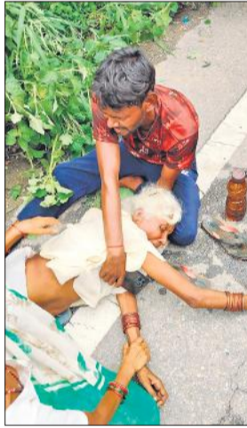
वैसुध मृतक की मां विधावती।