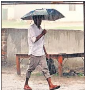
बारिश में छाटा लगाकर जाता व्यक्ति।

जून और जुलाई महीने में मानसून की बेरुखी से किसान और आम जनता दोनों ही परेशान थे। इवका-दुक्का बारिश को छोड़ दिया जाए तो मानसून के ये दोनों महीने बूढ़ाबांदी तक ही सिमट रहे। लेकिन बुधवार को हुई भारी बारिश ने लोगों को राहत की सांस ली है। कृषि अधिकारियों के मुताबिक बुधवार को करीब 20 एमएम बारिश रिकार्ड की गई।