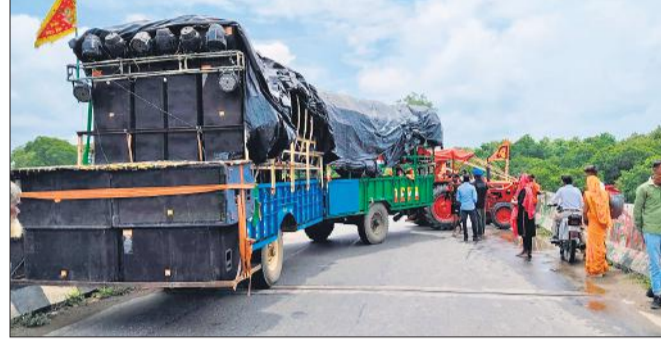
कांवड़ियों द्वारा पुल पर ट्रैक्टर खड़ा करके लगाया गया जाम।