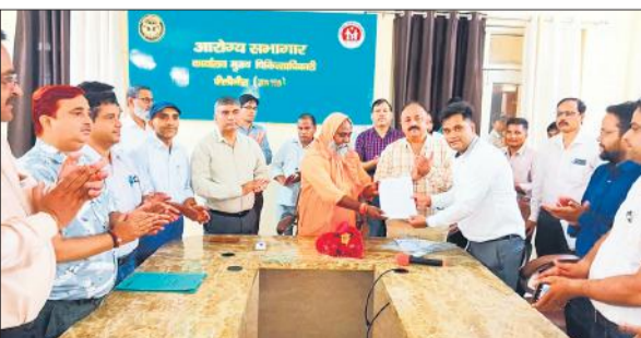
सीएमओ कार्यालय सभागार में नियुक्ति पत्र देते बरखेड़ा विधायक।

अमृत विचार: कलेक्ट्रेट एवं सीएमओ कार्यालय सभागार में जनप्रतिनिधियों ने दो सहायक शोध अधिकारियों (सांख्यिकी) को नियुक्ति पत्र वितरित किए। इसके साथ ही निष्ठा एवं ईमानदारी से कार्य करने को प्रेरित किया। कलेक्ट्रेट स्थित गांधी सभागार एवं सीएमओ कार्यालय स्थित सभागार में मंगलवार को लखनऊ में हुए