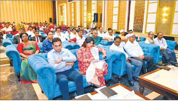
कार्यक्रम में मौजूद निर्यातक एवं उद्यमी।