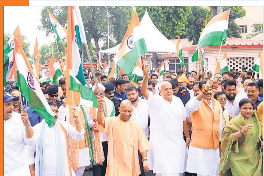
हर घर तिरंगा: मुख्यमंत्री योगी आदित्यनाथ मंगलवार को अपने लखनऊ स्थित सरकारी आवास से जैसे ही भारत माता की जयकार करते हाथ में तिरंगा लहराते पैदल चले, बाहर मौजूद भाजयुमो कार्यकर्ताओं का उत्साह देखते ही बना।