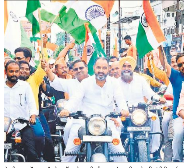
रोटरी क्लब रॉयल और रेड क्रॉस सोसाइटी की यात्रा को एसडीएम ने हरी झंडी दिखाई।