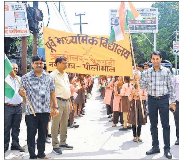
उच्च प्राथमिक विद्यालय से तिरंगा यात्रा को रवाना करते बीएसए व डीपीआरओ।