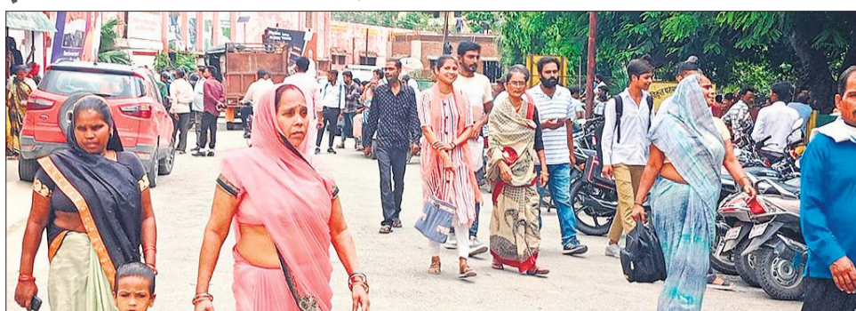
हड़ताल के चलते मेडिकल कॉलेज से वापस जाते मरीज।

अमृत विचार : कोलकाता के आरजी कर मेडिकल कॉलेज में जूनियर महिला डॉक्टर की हत्या से डॉक्टरों में आक्रोश है। मंगलवार को जिले में मेडिकल कॉलेज के डॉक्टरों ने ओपीडी टप कर हड़ताल कर दी। इस दौरान डॉक्टरों ने ओपीडी के बाहर जमीन पर बैठकर न्याय की मांग करते हुए विरोध प्रदर्शन किया। डॉक्टरों के हड़ताल की जानकारी मिलने पर अफसरों ने उनसे वार्ता की, लेकिन वह नहीं माने। इस पर मेडिकल कॉलेज के प्रशासनिक अफसरों ने मरीजों की भीड़ देखते हुए खुद ओपीडी की कमान संभाली। हालांकि अधिक मरीजों को ओपीडी का लाभ नहीं मिल सका। ऐसे में अधिकतर मरीज बिना इलाज के ही वापस लौट गए। जिन्होंने निजी अस्पताल में अपना इलाज कराया