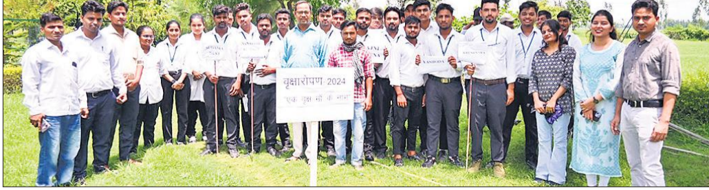
वरुण अर्जुन फार्मेसी कॉलेज में शिक्षकों के साथ विद्यार्थी।