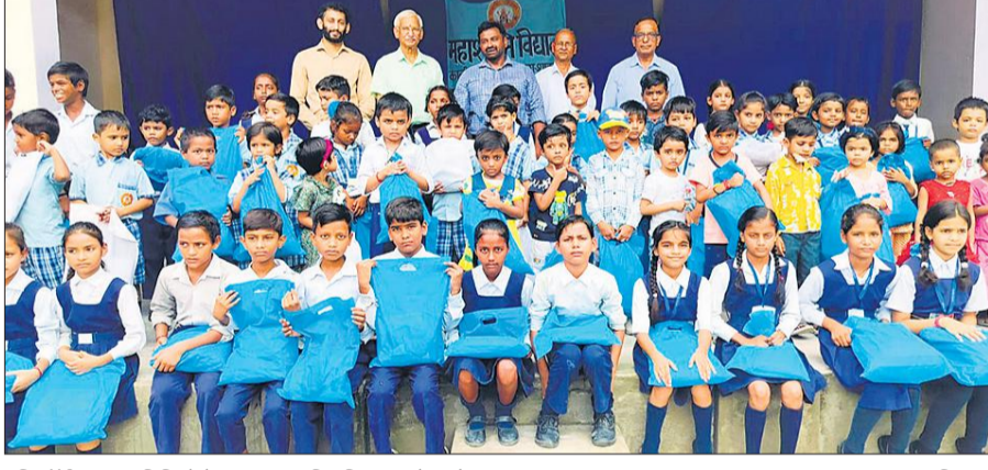
यूनिफॉर्म पाकर अतिथियों के साथ महाशक्ति विद्यालय के बच्चे।