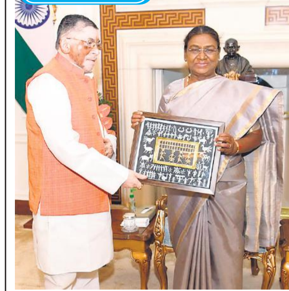
झारखंड के राज्यपाल संतोष गंगवार ने बुधवार को राष्ट्रपति भवन, नई दिल्ली में राष्ट्रपति द्रौपदी मुर्मू से शिष्टाचार शेंट की। राज्यपाल ने उनसे राज्य के विकास से संबंधित विषयों पर चर्चा की। ● अमृत विचार