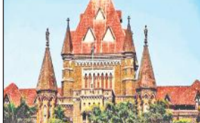
● बंबई उच्च न्यायालय ने कहा- ऐसे लोग जैविक माता-पिता होने का दावा नहीं कर सकते