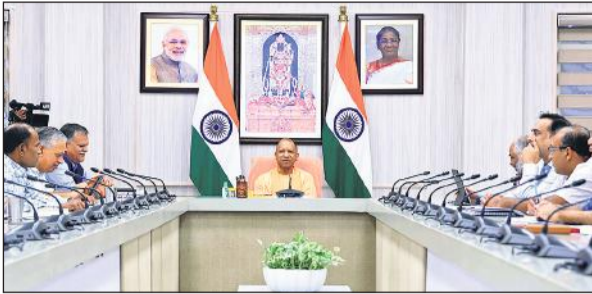
मुख्यमंत्री मंगलवार को अपने सरकारी पर परिवहन विभाग की समीक्षा करते हुए।

अमृत विचार: मुख्यमंत्री योगी आदित्यनाथ ने आरटीओ कार्यालयों में पासपोर्ट कार्यालयों की तर्ज में सुविधाएं मुहैया कराने के निर्देश दिए हैं। मंगलवार को परिवहन निगम एवं परिवहन विभाग की समीक्षा बैठक में मुख्यमंत्री ने कहा कि आरटीओ कार्यालयों में जनोपयोगी सुविधाएं बढ़ाएं। लोगों को अनावश्यक प्रतीक्षा न करनी पड़े। तकनीक का सहारा लें और प्रक्रियाओं का सरलीकरण करें। मुख्यमंत्री ने कहा कि फर्जी लाइसेंस कतई न बनने पाएं। आरटीओ ऑफिस में बाहरी व्यक्तियों की अनावश्यक