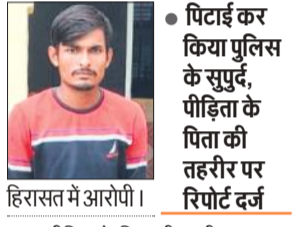
हिरासत में आरोपी।

अमृत विचार: स्कूल जा रही कक्षा सात की छात्रा को एक ई-रिक्शा चालक रोजाना तंग किया करता था। मंगलवार सुबह बंडा रोड पर गांव सौफरी के पास आरोपी ने छात्रा को फिर रोक लिया और उसके साथ छेड़छाड़ शुरू कर दी। पीछे से आ रहे छात्रा के पिता और दो भाइयों ने उसे पकड़ लिया। कुछ ही देर में लोगों की भीड़ इकट्ठा हो गई। छात्रा को रोज तंग किए जाने की जानकारी पर लोगों ने आरोपी की धुनाई कर उसे पुलिस के सुपुर्द कर दिया। पीड़िता के पिता की तहरीर पर पुलिस ने आरोपी के खिलाफ पाँक्सो एक्ट, छेड़छाड़ सहित कई धाराओं में रिपोर्ट दर्ज की है। पुलिस ने आरोपी को जेल भेज दिया है।