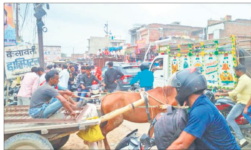
कलान में परीर तिराहे के पास लगे जाम में आड़े-तिरछे फंसे वाहन।

पुलिस रिवार से चौथे सोमवार तक पटना देवकली में स्थित शिव भक्तों की सुरक्षा के लिए ड्यूटी पर तैनात थी, लेकिन मंगलवार को भी मार्ग पर पुलिस नजर नहीं आ रही थी। वहीं कांवेडियों की संख्या बढ़ी नजर आ रही थी, कोई बाइक से निकल रहा था तो कोई दोपहिया वाहन से। रोड पर ट्रैफिक के दबाव के बीच स्टेट हाईवे किनारे सब्जी बेचने वाले ठेली लगाकर और चालक अपने वाहन आड़े-तिरछे लगाकर जाम का सबब बने हुए थे। इसी वजह से मंगलवार दोपहर के बाद लंबा जाम लग गया। जिसे जरा सा मौका मिला वहीं अपना वाहन घुसा देता था, इससे जाम में फंसे वाहनों की लाइन लंबी होती चली गई। परीर तिराहे से लेकर सात सौ मीटर की दूरी पर पानी निकास के