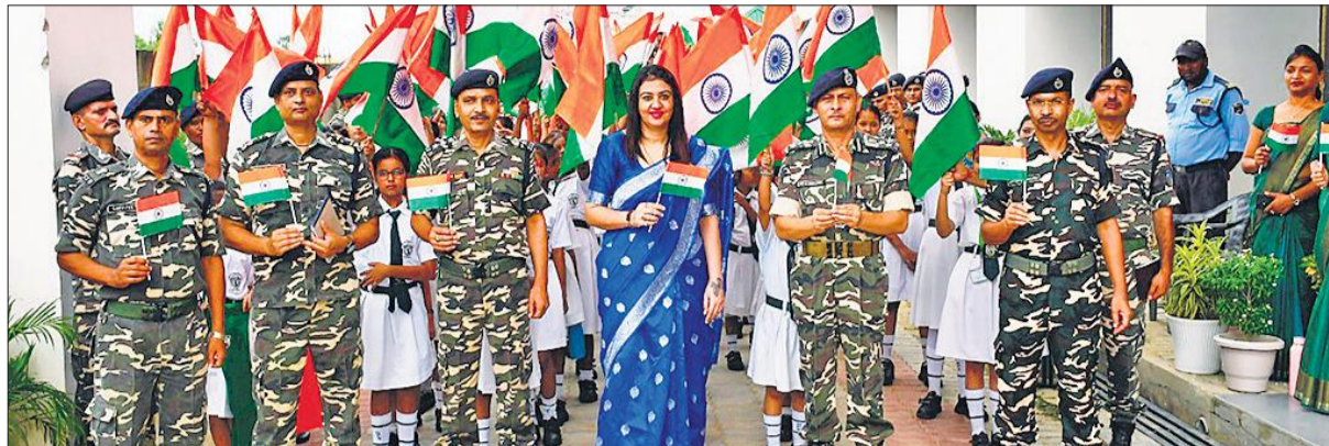
दिल्ली पब्लिक स्कूल में विद्यार्थियों के साथ तिरंगा यात्रा निकालते एसएसबी जवान।