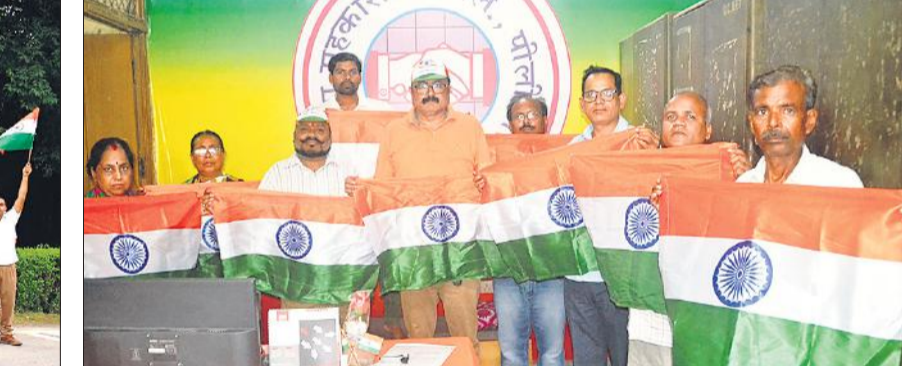
बैंक ग्राहकों को तिरंगा प्रदान करते शाखा प्रबंधक।