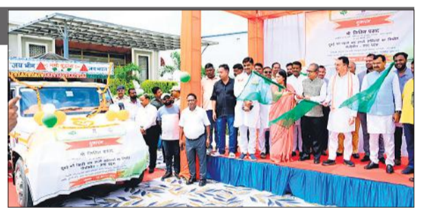
सौंपा। इसी के साथ पीलीभीत भी फल-सब्जी निर्यात की सूची में शामिल हो

एक्सपोर्ट डेवलपमेंट अथॉरिटी (एफिडा) के सहयोग से सड़ियों से भरी गाड़ी दुबई भेजी जाएगी। इसके साथ ही निर्यात में फल व सब्जी को स्थान मिलने से इसकी खेती करने वाले किसानों की आय में भारी इजाफा होगा। विदेश में बिक्री के रास्ते खुल जाने से इन फसलों के क्षेत्रफल व गुणवत्ता में भी इजाफा होगा। जितिन ने पीलीभीत की महफ फेड फार्म प्रोड्यूसर कंपनी लिमिटेड को निर्यात लाइसेंस