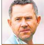
● 1991-92 में हुई थी पांच टेस्ट मैच की श्रृंखला

रिकी पॉटिंग का मानना है कि भारत के खिलाफ धरंलू मैदान पर लगातार दो टेस्ट श्रृंखलाओं में हार के बाद ऑस्ट्रेलिया के पास साबित करने के लिए काफी कुछ होगा। पेट कर्मिस की अगुवाई वाली टीम इस साल नवंबर-दिसंबर में होने वाली पांच मैचों की बॉर्डर-गावस्कर ट्रॉफी 3-1 से जीत सकती है।