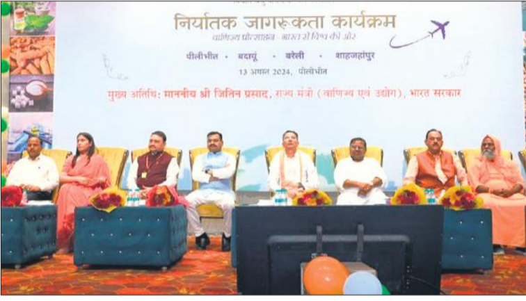
कार्यक्रम के दौरान मंच पर मौजूद केंद्रीय राज्य मंत्री जितिन प्रसाद, राज्यमंत्री संजय सिंह गंगवार व अन्य।

केंद्रीय राज्यमंत्री जितिन प्रसाद ने जिले में निर्यात को बढ़ावा देकर वैश्विक अवसरों को खोलने के लिए स्थानीय शक्तियों का लाभ उठाने के महत्व पर जोर दिया। निर्यातकों से निर्यात को बढ़ाने पर