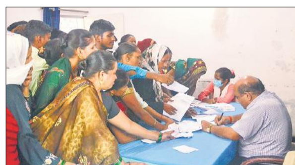
डॉक्टरों के हड़ताल पर जाने के बाद मरीजों को इलाज करते प्रोफेसर।

बता दें कि आरजी मेडिकल कॉलेज कांड को लेकर मंगलवार को फेडरेशन ऑफ रेजिडेंट डॉक्टर एसोसिएशन ने नेतृत्व में मेडिकल कॉलेज में कार्य कर रहे सीनियर रेजिडेंट और जूनियर रेजिडेंट ने हड़ताल करने का आह्वान किया था। इस पर मंगलवार को सुबह नौ बजे डॉक्टर ओपीडी टप कर विरोध प्रदर्शन कर ओपीडी के बाहर बैठ गए। डॉक्टरों की मांग है कि इस मामले की निष्पक्ष और पूरी तरह से जांच और एक केंद्रीय सुरक्षा अधिनियम बनाया जाए, जो विशेष रूप से स्वास्थ्य कर्मियों की सुरक्षा के लिए हो। इससे वह बिना किसी डर के अपने कर्तव्यों का पालन कर सकें। सुबह आठ बजे से मरीज और तीमारदार मेडिकल कॉलेज की ओपीडी में पहुंचना शुरू हो गए। सुबह 11 बजे तक ओपीडी में पंचे बनावे गए, लेकिन डॉक्टरों