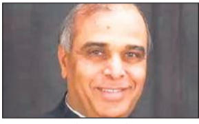
● वक्फ (संशोधन) विधेयक पर विचार के लिए संयुक्त संसदीय समिति का किया गया गठन

भारतीय जनता पार्टी के वरिष्ठ लोकसभा सदस्य जगदंबिका पाल विवादास्पद वक्फ (संशोधन) विधेयक पर विचार के लिए गठित संयुक्त संसदीय समिति की अध्यक्षता करेंगे। लोकसभा सचिवालय की ओर से जारी एक अधिसूचना में कहा गया है कि लोकसभाध्यक्ष ओम बिरला ने पाल को 31 सदस्यीय समिति का अध्यक्ष नियुक्त किया है। विधेयक के प्रावधानों पर लोकसभा में विपक्ष के विरोध के बीच सरकार ने इसे दोनों सदनों की संयुक्त समिति को भेजने