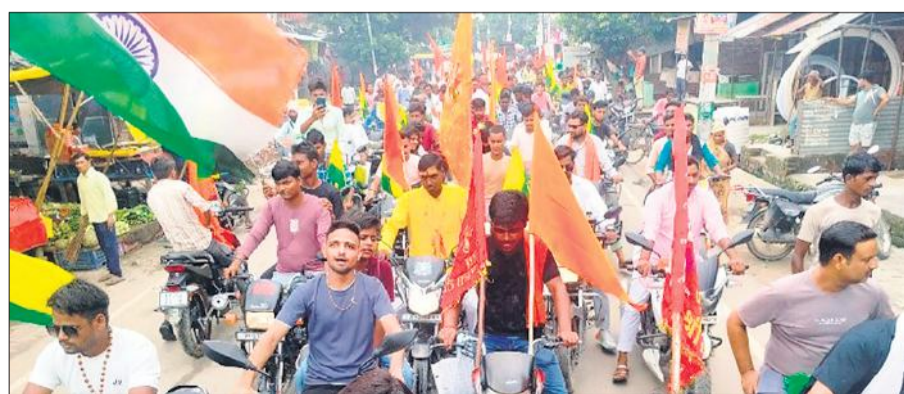
गंगा जलाभिषेक बाइक यात्रा निकालती किसान कल्याण महासंघ छात्र इकाई।