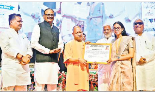
उग्र अधीनस्थ सेवा चयन आयोग से चयनित अभ्यर्थियों को नियुक्ति पत्र देते मुख्यमंत्री योगी आदित्यनाथ साथ में उपमुख्यमंत्री ब्रजेश पाठक, कैबिनेट मंत्री डॉ. संजय निषाद।

अमृत विचार: मुख्यमंत्री योगी आदित्यनाथ ने कांग्रेस नेता राहुल गांधी व सपा प्रमुख अखिलेश यादव पर तंज कसते हुए कहा कि 'खटाखट' वाले फिर पिकनिक मनाने निकल गए हैं। उन्होंने कहा कि ये लोग समाज को विभाजित करने व अराजकता फैलाने का कार्य करते हैं। मुख्यमंत्री मंगलवार को लोकभवन में उत्तर प्रदेश अधीनस्थ सेवा चयन आयोग के जरिए चयनित 1036 अभ्यर्थियों के नियुक्ति पत्र वितरण कार्यक्रम को संबोधित कर रहे थे। इस मौके पर उन्होंने चयनित अभ्यर्थियों को नियुक्ति पत्र सौंपा। उन्होंने आर्क्षित वर्ग को मिलने वाली नौकरियों के आंकड़े पेश करते हुए कहा कि चुनावी मौसम आया तो ये 'खटाखट' वाले नजर आएंगे। लोकसभा चुनाव के दौरान अप्रैल-मई के महीने में खटाखट स्क्रीम के