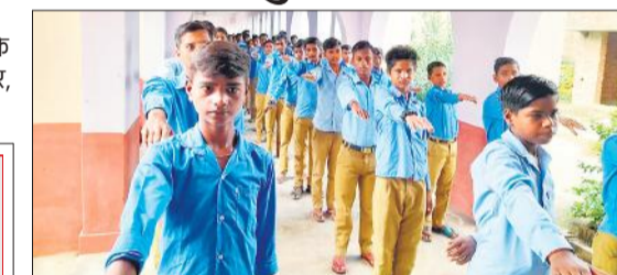
जीआईसी में नशा मुक्ति की शपथ लेते छात्र।