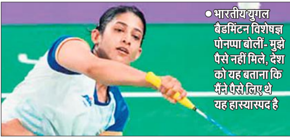
● भारतीय यूगल बैडमिंटन विशेषज्ञ पोन्नप्पा बोली- मुझे पैसे नहीं मिले, देश को यह बताना कि मैंने पैसे लिए थे यह हास्यास्पद है

भारतीय यूगल बैडमिंटन विशेषज्ञ अश्विनी पोन्नप्पा ने मंगलवार को कहा कि उन्हें पेरिस ओलंपिक की तैयारी के लिए खेल मंत्रालय से बहुत कम या कोई व्यक्तिगत वित्तीय सहायता नहीं मिली और यहां तक कि कोच के लिए उनके अनुरोध को भी खारिज कर दिया गया।