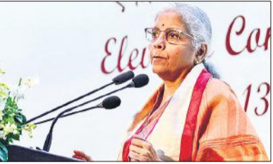
भोपाल में आयोजित कार्यक्रम को संबोधित करती वित्तमंत्री निर्मला सीतारमण।

वैज्ञानिक समुदाय से अक्षय ऊर्जा के मंडारण पर अधिक शोध करने की अपील करते हुए सीतारमण ने कहा कि दुनिया ने जीवाश्म ईंधन से अक्षय ऊर्जा में बदलाव के लिए बहुत सारा धन देने का वादा किया है, लेकिन यह आना अभी बाकी है। वित्त मंत्री ने कहा कि लेकिन भारत ने इंतजार नहीं किया। पेरिस (पेरिस समझौते) में किए वादे हमारे अपने पैसे से पूरे किए गए। कई बार वित्त मंत्री होने के नाते मुझे लोगों को यह जवाब देना पड़ता है कि हमारे