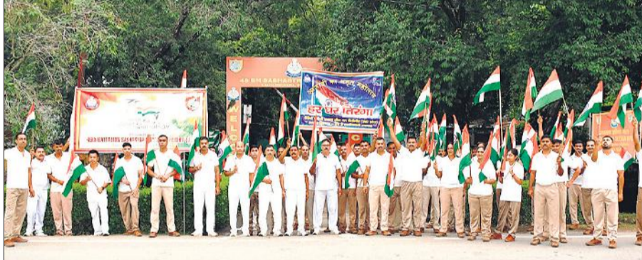
49 वीं वाहिनी एसएसबी मुख्यालय लालौरखेड़ा पर तिरंगा झंडों के एसएसबी जवान।