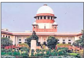
● न्यायमूर्ति अभय एस ओका और न्यायमूर्ति अगस्टीन जॉर्ज मसीह की पीठ ने सुनाया फैसला

न्यायमूर्ति अभय एस ओका और न्यायमूर्ति अगस्टीन जॉर्ज मसीह की पीठ ने कहा कि अगर अदालतें उचित मामलों में जमानत से इनकार करना शुरू कर देंगी तो यह बुनियादी अधिकारों का उल्लंघन होगा। पीठ ने फैसला सुनाते हुए कहा, अभियोजन