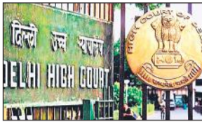
● कहा- बीएनएस से अप्राकृतिक संबंध के दंडात्मक प्रावधानों को बाहर करने पर रुख स्पष्ट करें