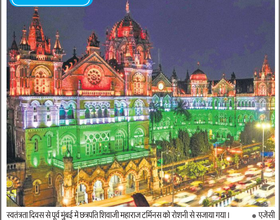
स्वतंत्रता दिवस से पूर्व मुंबई में छत्रपति शिवाजी महाराज टर्मिनस को रोशनी से सजाया गया।