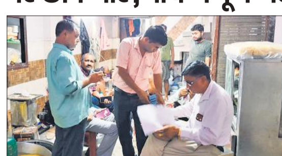
छापेमारी के दौरान सैपल लेने की कार्रवाई करती एफएसडीए टीम। • अमृत विचार