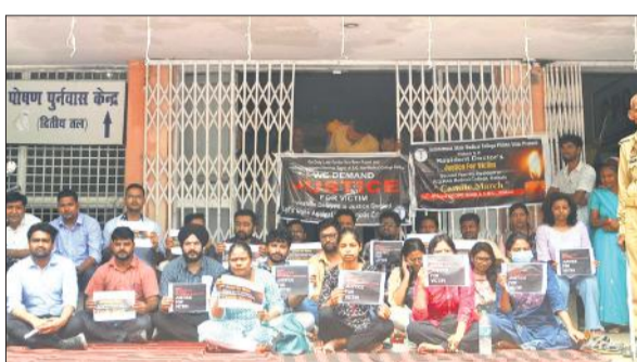
विरोध प्रदर्शन करने सीनियर और जूनियर रेजिडेंट।