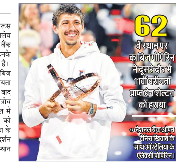
62 वें स्थान पर काबिज पोपिरिन ने दूसरे दौर में 11वीं वरीयता प्राप्त वेन शोल्टन को हराया। <<नेशनल बैंक ओपन टेनिस खिताब के साथ ऑस्ट्रेलिया के एलेक्सि पोपिरिन।>>

ऑस्ट्रेलिया के एलेक्सि पोपिरिन ने रूस के पांचवीं वरीयता प्राप्त आंद्रे रूबलेव को 6-2, 6-4 से हराकर नेशनल बैंक ओपन टेनिस खिताब जीत लिया जो उनके कैरियर का सबसे बड़ा स्थल खिताब है। विश्व रैंकिंग में 62वें स्थान पर काबिज पोपिरिन ने दूसरे दौर में 11वीं वरीयता प्राप्त वेन शोल्टन को हराया। इसके बाद सातवीं वरीयता प्राप्त गिगोर दिमित्रोव को मात दी। उन्होंने क्वार्टर फाइनल में चौथी वरीयता प्राप्त डबल्ट हुरकाज को हराया। फिर सेमीफाइनल में अमेरिका के सेबेस्टियन कोरडा को हराया। इस प्रदर्शन से पोपिरिन रैंकिंग में 62वें से 23वें स्थान पर पहुंच जाएंगे।