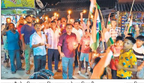
ज्ञापन सौंपते अखिल भारत हिंदू महासभा के पदाधिकारी

अल्पसंख्यक हिंदुओं को साजिश के तहत निशाना बनाया जा रहा है। वर्तमान में बांग्लादेश में कट्टरपंथियों की अंतरिम सरकार अस्तित्व में है, हिंदुओं के अस्थाये के प्रतीक मंदिरों को तोड़ा जा रहा है। कार्यकर्ताओं ने भारत