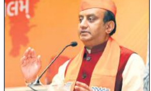
● कहा- दो लड़कों की राजनीतिक ताकत में इजाफे से उत्तर प्रदेश में अपराधियों के हासिले बुलंद हुए

भारतीय जनता पार्टी ने कांग्रेस नेता राहुल गांधी और समाजवादी पार्टी के मुखिया अखिलेश यादव पर निशाना साधते हुए कहा कि दो लड़कों की राजनीतिक ताकत में जब से इजाफा हुआ है, उत्तर प्रदेश में अपराधियों के हासिले बुलंद हो गए हैं। भाजपा प्रवक्ता सुधांशु त्रिवेदी ने यहां एक संवाददाता सम्मेलन में सपा पर अपराधियों को पनाह देने का आरोप लगाया और बलात्कार तथा बलात्कार के प्रयास के आरोप में सपा पर अपराधियों की गिरफ्तारी को लेकर यादव नीत पार्टी पर निशाना साधा। उन्होंने कहा कि सपा जहां अपराधियों का बचाव कर रही है वहीं विपक्षी गठबंधन के सदस्य अपने सहयोगियों के आपराधिक तत्वों की रक्षा करने में भी एक-दूसरे की मदद कर रहे हैं। त्रिवेदी ने कहा, दो लड़कों