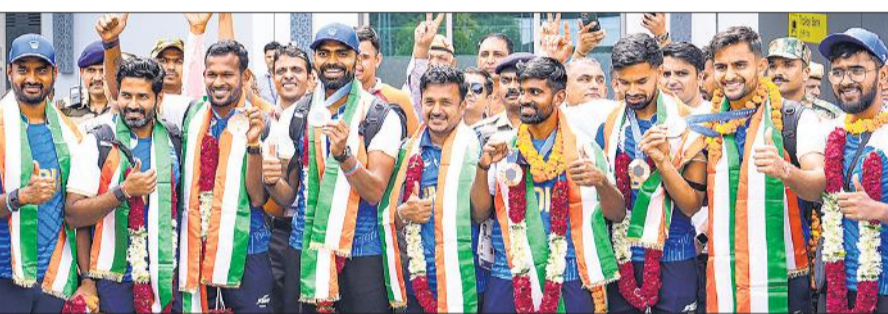
दिल्ली के इंदिरा गांधी हवाई अड्डे पर प्रशंसकों ने किया कांस्य विजेता हॉकी टीम का भव्य स्वागत।