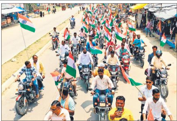
शहर में निकाली जा रही तिरंगा यात्रा।