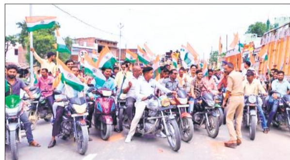
शहर में निकाली जा रही तिरंगा यात्रा।