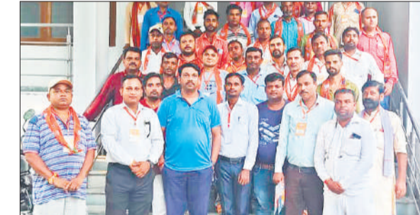
कार्यशाला में शामिल हुए भाजपा कार्यकर्ता।