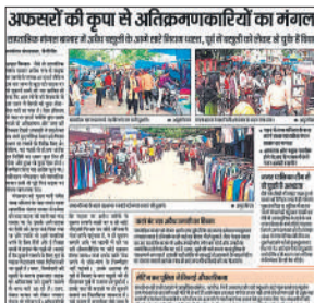
अमृत विचार में प्रकाशित खबर।

फुटपाथ अतिक्रमण की जद में हैं। कर्मोदेश कुछ ऐसा ही हाल पुरानी सब्जी मंडी का है। यहाँ दुकानों के आगे सब्जी बेचने वालों में पांच-पांच फिट चौड़े पक्के चबूतरे बनाकर सड़क पर अतिक्रमण कर रखा है। स्थिति यह है कि यहाँ सब्जी खरीदने आने वालों को ही निकलना मुश्किल हो रहा है। इधर शहर की पुरानी सब्जी मंडी में अतिक्रमण का मामला संज्ञान में आने पर उच्चाधिकारियों के निर्देश ने पालिका प्रशासन ने निरीक्षण किया था। निरीक्षण के दौरान चूने वाली गली स्थित सब्जी मंडी में सब्जी विक्रेताओं द्वारा दुकानों के आगे पक्के चबूतरे बनाकर अतिक्रमण करना पाया गया। जिस पर पालिका प्रशासन की ओर से इन अतिक्रमणकारियों के नोटिस जारी करते हुए सात दिन में स्वतः अतिक्रमण हटाने के निर्देश दिए गए थे। इधर समाजवादी बीतने के बाद भी अतिक्रमण न हटाने पर छह अगस्त को अभियान चलाकर बुधवार शाम को अभियान चलाने की तैयारी की गई। पालिका प्रशासन