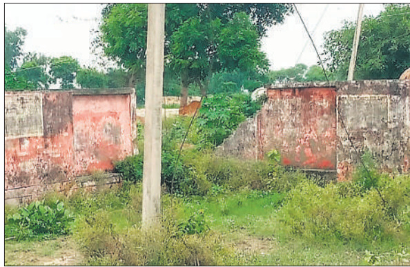
प्राथमिक स्वास्थ्य केंद्र की टूटी दीवार और उगी घास।

कलान तहसील क्षेत्र में स्वास्थ्य विभाग की लापरवाही के कारण व्यवस्था बेपटरी चल रही है। सरकार भले ही बेहतर स्वास्थ्य सुविधा देने का दावा कर रही है लेकिन कटरी