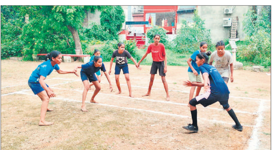
बालिका कबड्डी प्रतियोगिता में प्रतिद्वंदी को कब्जे में लेने का प्रयास करती खिलाड़ी।

जिला स्तरीय बालिका कबड्डी प्रतियोगिता की दुर्दशा में रही-बची कसर बारिश ने पूरी कर दी। खिलाड़ियों से परिचय के बाद जैसे ही मैच शुरू हुए बरसात शुरू हो गई और नतीजा यह हुआ कि फाइनल मुकाबला होना भी दुश्वार हो गया और एक मैच के बाद ही प्रतियोगिता खत्म कर दी गई। फिलहाल दो सितंबर को बदायूं में होने वाली मंडलीय प्रतियोगिता के लिए उपलब्ध टीमों में से ही खिलाड़ी चुनकर जिला टीम घोषित कर दी गई। मजे की