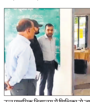
खंड शिक्षा अधिकारी कार्यालय में बीएसए से जानकारी लेते सिटी मजिस्ट्रेट।

अमृत विचार: बेसिक शिक्षा विभाग में बुधवार का दिन निरीक्षण के नाम रहा। डीएम ने अमरिया क्षेत्र के दो परिषदीय विद्यालयों का औचक निरीक्षण किया। इस दौरान उन्हें एक प्रधानाध्यापक गैरहाजिर मिले। वहीं सिटी मजिस्ट्रेट ने बुधवार सुबह बीएसए एवं एबीएसए कार्यालयों में छापेमारी की। इस दौरान खंड शिक्षा अधिकारी नगर समेत तीन लोग अनुपस्थित मिले। डीएम एवं सिटी मजिस्ट्रेट की इस कार्रवाई से हड़कप देखा गया।