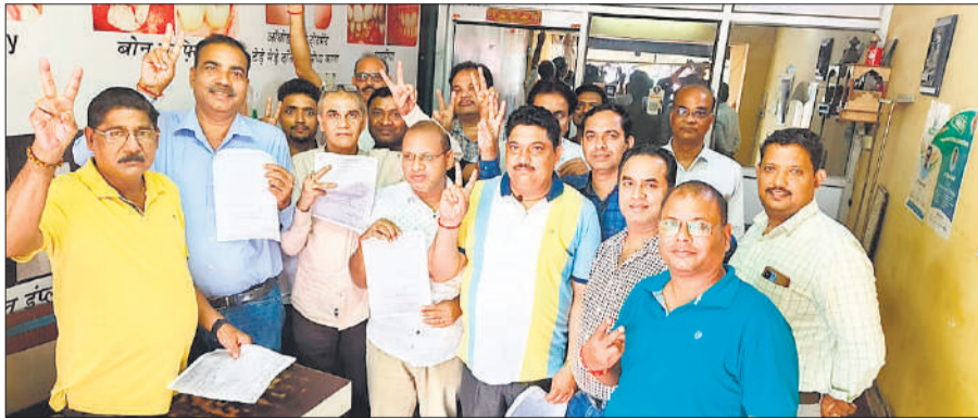
निलंबित चल रहे दवा लाइसेंस बहाल होने पर खुशियां मनाते दवा व्यापारी।