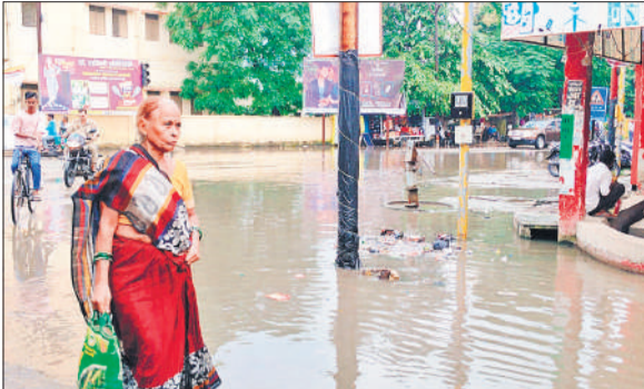
नगर निगम के पास जल भराव के बीच गुजरती महिला।

बुधवार को महानगर में बरसात हुई, जिससे शहर के नाले पानी से भर गए। जबकि शुरुआत से शहर भर के नाले साफ करने का दावा नगर निगम की ओर से किया गया था। निगम अधिकारियों के अनुसार नाला सफाई का काम हुआ पर बरसात का पानी सड़कों पर कुछ और ही सच्चाई बयां कर रहा है। बरसात का पानी कई चौराहे, रास्तों और बाजारों में भर गया। शहर के कई मुख्य मार्गों पर पानी भर गया। सड़कों पर भरे पानी