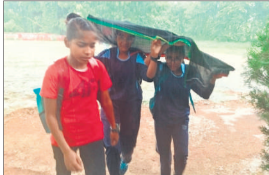
बारिश में भीगकर गुजरती बच्चियां।