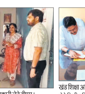
खंड शिक्षा अधिकारी कार्यालय में बीएसए से जानकारी लेते सिटी मजिस्ट्रेट।