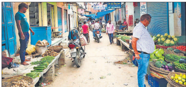
सब्जी मंडी में सड़क के दोनों किनारे पर चबूतरों पर बेची जा रही सब्जी।

अमृत विचार: शहर की सब्जी मंडी को अतिक्रमण मुक्त कराने को चलाया जाने वाला अभियान एक बार फिर टल गया। अभियान बुधवार शाम को चलना था, लेकिन जिम्मेदार बैकफुट पर आ गए। इसके पीछे वजह को लेकर चर्चाएँ तो कई तरह की चल रही हैं। मगर, अफसरों ने पुलिस बल न मिलने के चलते अभियान टालने की बात कहकर इज्जत बचाई है। अधिकारियों के मुताबिक अब मंगलवार को साप्ताहिक बंदी के दिन सब्जी मंडी में अभियान चलाया जाएगा।