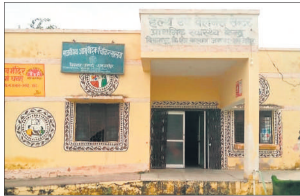
विक्रमपुर गांव का प्राथमिक स्वास्थ्य केंद्र।

लेकिन यहां पर किसी भी चिकित्सक की तैनाती नहीं है। जिस कारण अस्पताल लोगों के लिए बेकार साबित हो रहा है। विक्रमपुर गांव में नवीन प्राथमिक स्वास्थ्य केंद्र का निर्माण