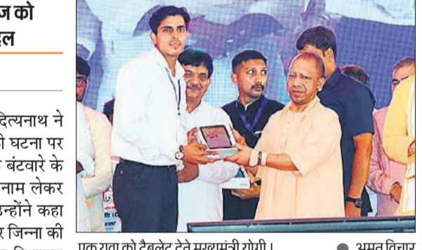
एक युवा को टैबलेट देते मुख्यमंत्री योगी।

अमृत विचार: मुख्यमंत्री योगी आदित्यनाथ ने बांग्लादेश में हिंदुओं पर हुई हमले की घटना पर आक्रोश जताने के बाद अब भारत के बंटवारे के जिम्मेदार मोहम्मद अली जिन्ना का नाम लेकर विरोधियों पर तीखा हमला बोला। उन्होंने कहा कि कांग्रेस और सपा के लोगों के अंदर जिन्ना की आत्मा घुस गई है। जिन्ना ने देश का विभाजन करने का पाप किया था, इसलिए वह अंतिम समय में घुट-घुट कर मरा था। समाज को बांटकर यही पाप कांग्रेस और सपा कर रही है। मुख्यमंत्री बुधवार को अलीगढ़ में वृहद रोजगार मेला में पांच हजार युवाओं को नियुक्ति पत्र, उद्यमियों को ऋण, विद्यार्थियों को टैबलेट, स्मार्टफोन वितरण समेत 705 करोड़ की परियोजनाओं के लोकार्पण व शिलान्यास के बाद लोगों को संबोधित कर रहे थे।