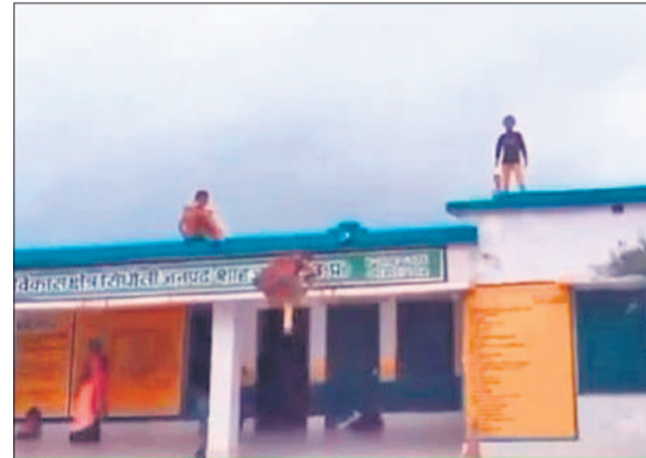
स्कूल की छत पर बच्चे। कुछ बच्चे छज्जे से लटक रहे हैं।

और प्रधान अध्यापक एवं शिक्षामित्र अनुपस्थित हैं। बीएसए ने स्कूल में नियुक्त प्रधान अध्यापक और शिक्षामित्र पर फौरी कार्रवाई करते हुए एक माह का वेतन और मानदेय रोकते हुए स्पष्टीकरण मांगा है।