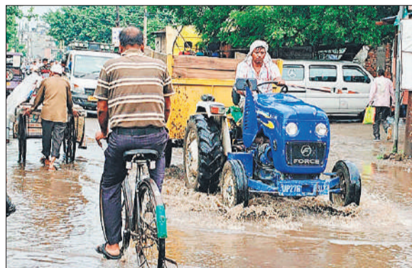
रोडवेज बस अड्डे के पास हुए जल भराव से होकर गुजरता ट्रैक्टर।

महानगर में सीवर लाइन की खोदाई के चलते कई सड़कें खुदी हुईं पड़ी हैं। जिसके चलते इनमें गड्ढे हो गए हैं और लोगों को लगातार परेशानी हो रही है। अब भी तमाम सड़कें धंसी हुई हैं। इनकी स्थिति में सुधार नहीं हो सका है। सड़कों में कई जगह गड्ढे भी हैं। जिससे लोगों को परेशानी का सामना करना पड़ रहा है। बुधवार को बारिश के बाद तमाम लोग गड्ढों में गिरकर चोटिल हुए। ऐसा इसलिए हुआ क्योंकि पानी निकालने के लिए बनाए गए नाले अपना काम नहीं कर पाए। पानी निकासी ठीक से नहीं हो सकी। कुछ स्थानों पर ऐसा लगा मानो कि मानो नाले पानी बैक फेंक रहे हों।