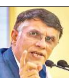
● चौहान के कांग्रेस के डीएनए में किसान विरोध होने के आरोप का पवन खेड़ा ने दिया जबाब

नई दिल्ली। कांग्रेस ने कृषि मंत्री शिवराज सिंह चौहान द्वारा उस पर हमला किए जाने के एक बाद शनिवार को पलटवार किया और कटाक्ष करते हुए कहा कि मौजूदा सरकार की विफलताओं के लिए देश के पहले प्रधानमंत्री पंडित जवाहरलाल नेहरू को दोषी ठहराना अब उबारू हो गया है। पार्टी के मीडिया विभाग के प्रमुख पवन खेड़ा ने कहा कि कांग्रेस की सरकारों में कृषि क्षेत्र में ऐतिहासिक विकास हुआ। चौहान ने कांग्रेस के 'डीएनए में किसान विरोध होने' का आरोप लगाते हुए शुक्रवार को कहा था कि 2014 में सत्ता में आने के बाद से नरेंद्र मोदी सरकार ने कृषि के क्षेत्र में प्राथमिकताओं को बदला जिसके अच्छे परिणाम आज देखने को मिल रहे हैं। राज्यसभा में कृषि एवं किसान कल्याण मंत्री ने कहा था कि वह देश के प्रथम प्रधानमंत्री पंडित जवाहरलाल नेहरू का आदर करते हैं किंतु उन्होंने (नेहरू ने) पारंपरिक भारतीय कृषि की परवाह नहीं की। उन्होंने कहा कि नेहरू रूस गये, वहां का मॉडल देखा और