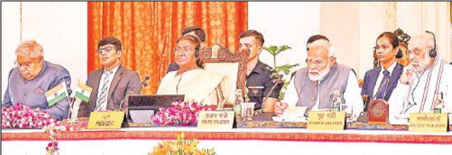
राष्ट्रपति भवन में राज्यपालों के सम्मेलन में शामिल राष्ट्रपति द्रौपदी मुर्मू, उपराष्ट्रपति जगदीप धनखड़, प्रधानमंत्री नरेंद्र मोदी और केंद्रीय मंत्री अमित शाह।

उन्होंने सम्मेलन में परस्पर सीख की भावना से व्यापक चर्चा करने के लिए राज्यपालों के सामूहिक प्रयासों की सराहना की। उन्होंने कहा कि राज्यपालों के विभिन्न समूह अपने कामकाज में सुधार के साथ जनकल्याण के लिए अपने विचार और सुझाव लेकर आए, और विश्वास व्यक्त किया कि इन सुझावों को लागू किया जाएगा। सम्मेलन का दूसरा