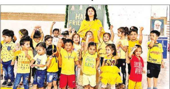
मित्रता दिवस पर खुशी का इजहार करते बच्चे।