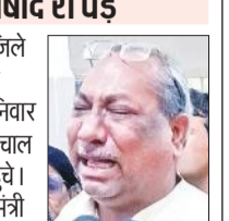
अमृत विचार : मुख्यमंत्री योगी आदित्यनाथ ने विपरीत परिस्थितियों में भी अथक परिश्रम के साथ मरीजों की सेवा करने के लिए डॉक्टरों की सराहना करने के साथ किसी भी हालत में धैर्य बनाए रखने की सलाह दी है।

योगी गोरखपुर में शनिवार को बाबा राधव दास (बीआरडी) मेडिकल कॉलेज में 55.43 करोड़ रुपये की कई विकास परियोजनाओं का लोकार्पण और शिलान्यास करने के बाद समारोह को संबोधित कर रहे थे। इस अवसर पर उन्होंने एमबीबीएस और पैरामेडिकल के 483 छात्रों को टैबलेट व स्मार्टफोन भी वितरित किए। कहा कि एक दौर वह भी था जब गोरखपुर मंडल में एकमात्र बीआरडी मेडिकल कॉलेज ही था। बस्ती, अयोध्या, आजमगढ़, देवीपाटन मंडल में एक भी मेडिकल कॉलेज नहीं था, जबकि आज कुशीनगर, देवरिया, बस्ती, सिद्धार्थनगर, गोंडा, बहराइच, अयोध्या, अंबेडकरनगर, सुल्तानपुर, अमेठी, आजमगढ़ आदि जिलों में मेडिकल कॉलेज बन गए हैं। महाराजगंज, शामली और संभल में पीपीपी मॉडल पर मेडिकल कॉलेज शुरू हो गए हैं, बलरामपुर और बलिया में भी मेडिकल कॉलेज बनने की प्रक्रिया आगे बढ़ी है।