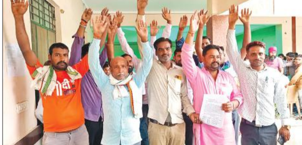
प्रदर्शन करते बसखेड़ा बुजुर्ग गांव के ग्रामीण।