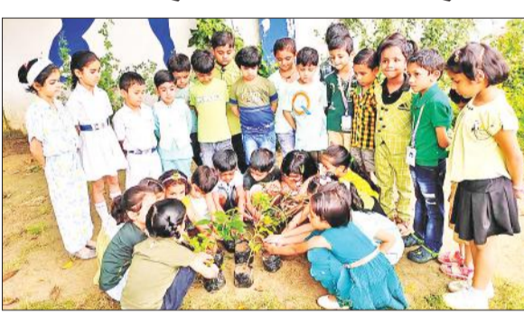
पौधरोपण के लिए पौधे उठाते बच्चे।