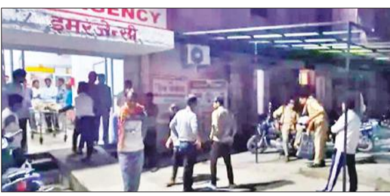
शुक्रवार देर रात हादसे के बाद इमरजेंसी के बाहर लगी भीड़।