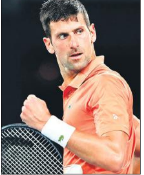
स्लैम खिताब जीत चुके जोकोविच अपने करियर में ओलंपिक खिताब से अब तक मरहूम रहे हैं। जोकोविच रविवार को स्वर्ण पदक के लिए स्पेन के अल्कराज से भिड़ेंगे जबकि 11वीं वरीयता प्राप्त मुसेटी कांस्य पदक के लिए कनाडा के फेलिक्स ऑगर-अलियासिमे से भिड़ेंगे।

पेरिस, एजेंसी पेरिस ओलंपिक 2024 में टेनिस के एकल मुकाबले में स्वर्ण पदक के लिये नोवाक जोकोविच अपने चिर प्रतिद्वंदी स्पेन के कार्लोस अल्कराज से भिड़ेंगे। हाल ही संपन्न विंबल्डन का खिताबी मुकाबला भी इन्ही दो दिग्गजों के बीच हुआ था जिसमें जोकोविच को अल्कराज से हार का सामना करना पड़ा था। सर्बिया के 37 वर्षीय खिलाड़ी ने शुक्रवार को इटली के लोरेंजो मुसेटी को 6-4, 6-2 से हराकर अपने पहले ओलंपिक फाइनल में प्रवेश किया जहां उनका मुकाबला कार्लोस अल्कराज के साथ होगा। शीर्ष वरीयता प्राप्त जोकोविच अपने पिछले तीन ओलंपिक एकल सेमीफाइनल हार गए थे। 24 ग्रैंड