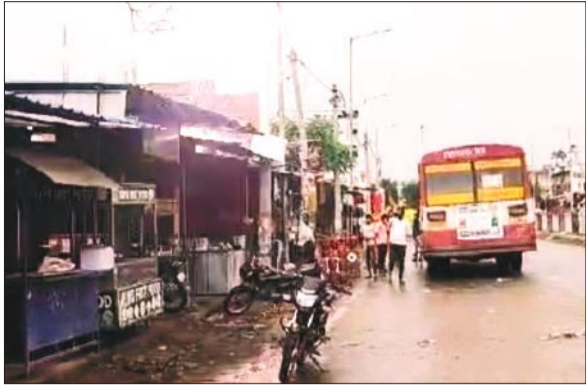
स्पाकिंग के बाद जलती बंच लाइन और पास में खड़ी रोडवेज व यात्री। ● अमृत विचार

शनिवार सुबह करीब 10:20 बजे बिजली सप्लाय के दौरान बंच केबल में फिर से फॉल्ट होने से वह तेजी से जलने लगी। केबल के नीचे खड़ी शाहजहांपुर रोडवेज बस के पास खड़े यात्री और आसपड़ोस में बैठे दुकानदार बाल-बाल बच गए। तार जलने और तड़पड़ की आवाज से भगदड़