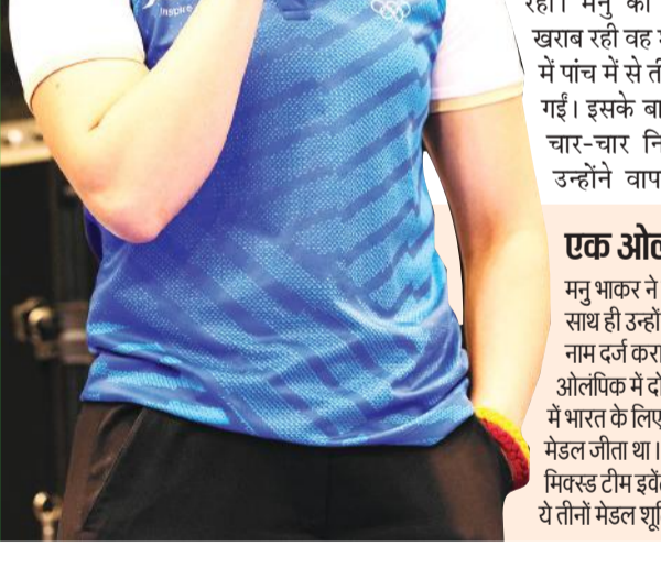
एक ओलंपिक में दो मेडल जीतने वाली पहली भारतीय मनु भाकर ने पेरिस ओलंपिक में अपना अभियान दो मेडल के साथ खत्म किया। इसके साथ ही उन्होंने ओलंपिक इतिहास में सबसे कामयाब भारतीय खिलाड़ी के रूप में अपना नाम दर्ज करा लिया है। एकल मुकाबले में मनु के अलावा कोई भी भारतीय एक ही ओलंपिक में दो मेडल नहीं जीत सका है। भारत की लाइली ने मनु भाकर ने पेरिस ओलंपिक में भारत के लिए पहला मेडल जीता था। उन्होंने 28 जुलाई को 10 मीटर एयर पिस्टल में ब्रॉन्ज मेडल जीता था। मनु ने इसके बाद 30 जुलाई, मंगलवार को सरबजोत सिंह के साथ मिलकर मिक्स्ट टीम इवेंट में ब्रॉन्ज मेडल जीता। भारत ने पेरिस ओलंपिक में अब तक 3 मेडल जीते हैं। ये तीनों मेडल शूटिंग में आए हैं।

महिला वॉल्ट स्पर्धा में बाइल्स ने जीता सातवां स्वर्ण पेरिस। अमेरिका की स्टार जिम्नास्ट सिमोन बाइल्स ने शनिवार को पेरिस खेलों में महिलाओं के वॉल्ट फाइनल में जीत हासिल करके अपना सातवां ओलंपिक स्वर्ण जीता। फाइनल में उपविजेता रही ब्राजील की रेबेका एड्रेड ने रजत जीता। अमेरिका की जेड कैरी ने कांस्य हासिल किया। बाइल्स दो बार वॉल्ट जीतने वाली दूसरी महिला हैं।