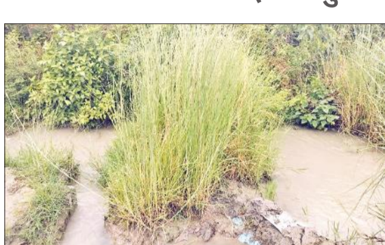
नहर के अवैध कुलावों से निकलता पानी।

मकसूदापुर क्षेत्र में धान की फसल में सिंचाई के लिए पानी की बढ़ती मांग को देखकर कुलावों का दयन (पाइपों से पानी निकासी की क्षमता) बढ़ाए जाने की मांग की गई थी। जिसे देखते हुए नहर विभाग से कुछ कुलावों पर दयन बढ़ाने की स्वीकृति दी गई, लेकिन विभाग की लापरवाही के चलते कुछ प्रभावशाली किसानों ने स्वीकृत साइज से कहीं बड़े साइज