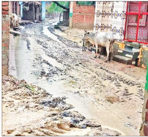
कलान की एक गली का हाल (फाइट फोटो)