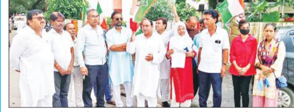
अघोषित बिजली कटौती को लेकर कलेक्ट्रेट में ज्ञापन देने जाते कांग्रेसी।