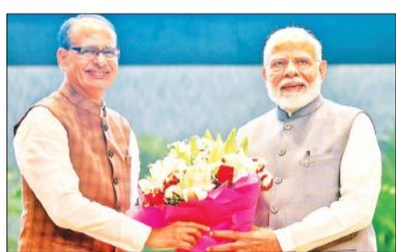
प्रधानमंत्री का स्वागत करते केंद्रीय कृषि मंत्री शिवराज चौहान।

मोदी ने अपने भाषण में कहा कि 65 साल पहले जब भारत ने मैसूर में इस सम्मेलन का आयोजन किया था। उस समय भारत की खाद्य सुरक्षा