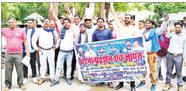
कलेक्ट्रेट में नारेबाजी कर प्रदर्शन करते भीम आर्मी सेना एकता मिशन के कार्यकर्ता।