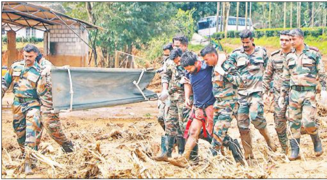
भूस्खलन के बाद बचाव कार्य के तहत युवक को सुरक्षित निकाल कर ले जाते सेना के जवान।