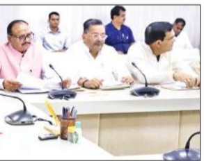
कार्यक्रम की तैयारी को लेकर बैठक करते मुख्यमंत्री योगी आदित्यनाथ।

अमृत विचार : मुख्यमंत्री योगी आदित्यनाथ ने शनिवार को अपने सरकारी आवास पर उच्च स्तरीय बैठक में काकोरी ट्रेन एक्शन शताब्दी महोत्सव और हर घर तिरंगा कार्यक्रम की तैयारियों की समीक्षा की। आह्वान किया कि इस बार भी में हर घर तिरंगा अभियान में 13 से 15 अगस्त तक सर्वाधिक झंडे फहराने का रिकॉर्ड प्रदेश के नाम करना है। लेकिन, प्लास्टिक के झंडों का उपयोग कतई न हो। मुख्यमंत्री ने कहा कि काकोरी ट्रेन एक्शन शताब्दी वर्ष राष्ट्रनायकों के प्रति सम्मान का पर्व है। इस महोत्सव की शुरुआत नौ अगस्त से होगी। निर्देश दिया कि प्रदेश