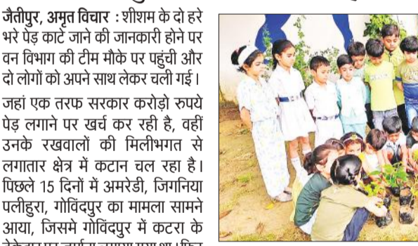
पौधरोपण के लिए पौधे उठाते बच्चे।