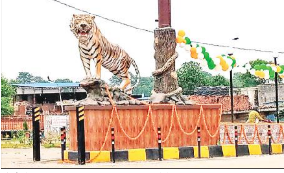
बरेली रोड पर स्थित टाइगर तिराहा। (फाइल फोटो)।

दरअसल, नौगांवां पकड़िया को नगर पंचायत का दर्जा मिलने के बाद से विकास कार्य तेजी से चल रहा