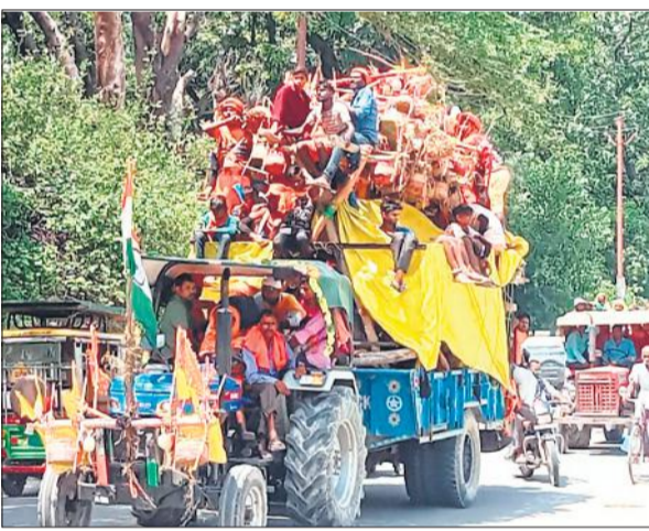
टनकपुर हाईवे पर गौहनिया चौराहा की तरफ जाते कांवड़िये।