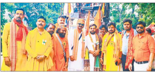
बाइक जलाभिषेक यात्रा में शामिल पदाधिकारी।

अमृत विचार: भारतीय बजरंग दल ने सोमवार को तृतीय भव्य जलाभिषेक बाइक यात्रा निकाली। यह यात्रा नगर के कोतवाली रोड पर स्थित एक बैंक हाल से अतिशवाजी और जयघोष की गूंज से शुरू हुई। कड़ी सुरक्षा के बीच यात्रा शेरपुर कला से होते हुए शारदा नदी के धनाराघाट पहुंची और जल भरने के बाद वापस लौटी। तिरंगा चौराहे पर ब्राह्मण महासभा ने और कस्बे में छत्तों से