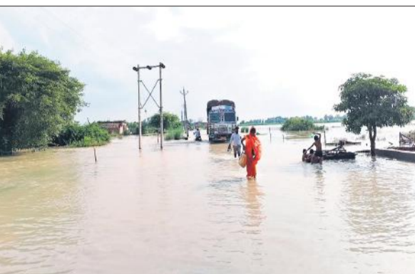
स्टेट हाईवे पर सोमवार को बाढ़ के पानी के बीच से निकलते लोग।