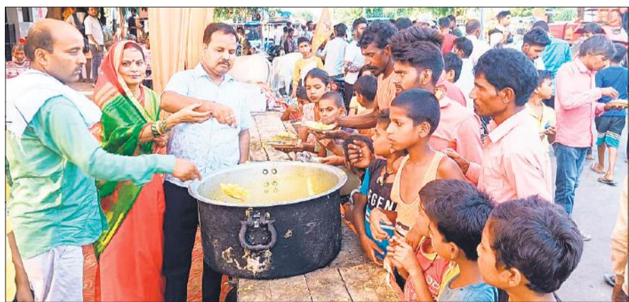
सुभाष चौराहा पर कांवड़ियों को भोजन कराते श्रद्धालु।