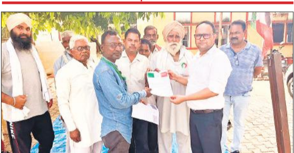
ब्लॉक परिसर में बीडीओ को ज्ञापन सौंपते राष्ट्रीय किसान मजदूर संगठन के कार्यकर्ता।

● बंडा थाना प्रभारी पर कार्रवाई करने की मांग पूरी न होने पर गुस्सा