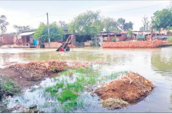
पैलानी गांव में घुसा बाढ़ का पानी।

गंगा का जलस्तर एक बार फिर बढ़कर कहर बरपाने को तैयार है। क्षेत्र के पैलानी, कटेलानगला, आजादनगला, मस्जिदनगला, इस्लामनगर, चौरा, चितार, कमथरी समेत कई गांव बाढ़ के पानी से घिरे हुए हैं। पैलानी, आजादनगला समेत कई गांवों के अंदर बाढ़ का पानी प्रवेश कर गया है। जिससे आवागमन बाधित हो रहा है। जलालाबाद शमशाबाद स्टेट हाईवे के ऊपर से अभी भी चौरा गांव के पास करीब सौ मीटर तक बाढ़ का पानी तेजी से बह रहा है। बाढ़ के पानी के बीच सैकड़ों कांड़ियां गंगाजल लाने के लिए ढाई घाट पहुंच रहे हैं। वहीं चौरा