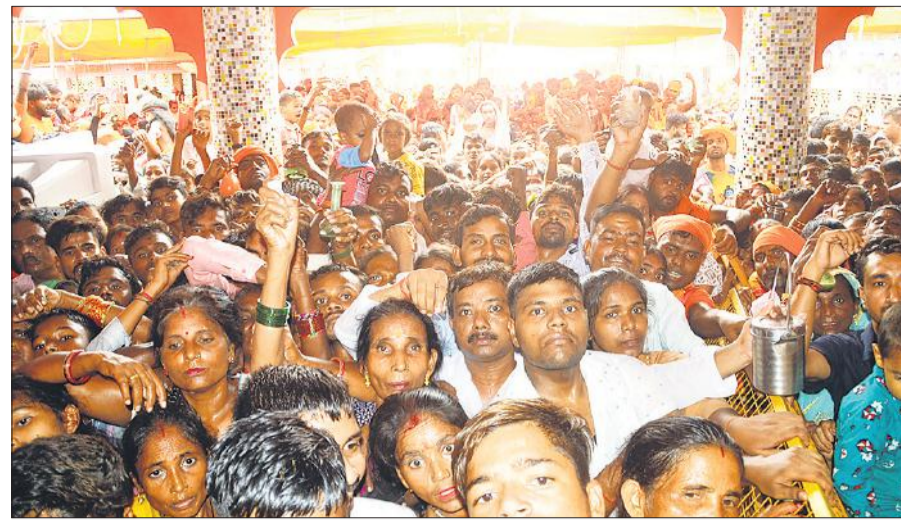
श्रावण मास के तीसरे सोमवार को गौरीशंकर मंदिर के मुख्य द्वार पर लगी शिव भक्तों की भीड़।