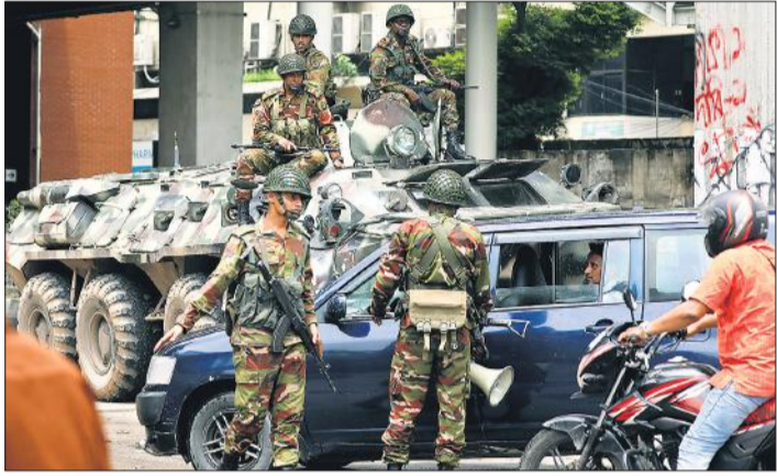
बांग्लादेश की राजधानी ढाका की सड़कों पर गश्त करते सेना के जवान।

बांग्लादेश में आरक्षण को लेकर सरकार विरोधी हिंसक प्रदर्शनों के बीच सोमवार को सेना के तख्तापलट के कारण प्रधानमंत्री शेख हसीना को इस्तीफा देकर देश छोड़ना पड़ा। देश में जारी हिंसक प्रदर्शन सोमवार की सुबह हसीना के आधिकारिक आवास गणभवन तक पहुंच गया। इससे पहले ही वे अपनी छोटी बहन शेख रेहाना के साथ देश छोड़कर रवाना हो गईं। सेना प्रमुख जनरल वकर-उज-जमां ने सभी दलों की भागीदारी से अंतरिम सरकार के गठन की घोषणा की है। हसीना (76) ने सेना प्रमुख को इस्तीफा सौंपा है। जनरल जमां ने कहा है कि सभी राजनीतिक दलों के साथ सार्थक चर्चा के बाद देश में अंतरिम सरकार बनाने का फैसला किया है। हम स्थिति को सुलझाने के लिए अब राष्ट्रपति मोहम्मद शाहबुद्दीन से बात करेंगे। सेना प्रमुख ने विरोध के नाम पर हिंसा को रोकने का आह्वान किया