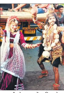
सुभाष चौराहा पर भजनों पर थिरकते शिव-पार्वती के रूप में सजे युवा।

सुभाष चौराहा पर तो नजारा देखने लायक है। यहां सुबह से देर रात तक ट्रैक्टर-ट्रॉलियों की आवाजाही देखी जा सकती है। एक ओर जहां कांवड़ियों पैरों में चुंघरू बांधे बाबा की जय-जयकार करते हुए छोटी काशी गोला गोकर्णनाथ कूच कर रहे हैं, वहीं ट्रैक्टर-ट्रॉलियों, ट्रकों, मैट्रडोर, कारों और मोटरसाइकिलों से हजारों कांवड़िया मस्ती करते