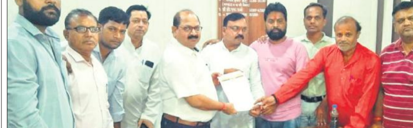
ईओ एचएन उपाध्याय को ज्ञापन सौंपते भाजपा नेता।

पालिका की मंग व्यवस्थाओं को लेकर भाजपाइयों का हंगामा