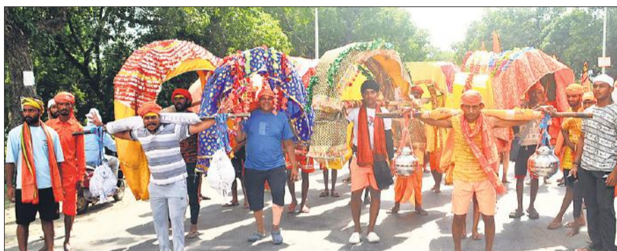
कछला से गंगाजल भरकर आते कांवड़िया।

शहर के ऐतिहासिक गौरी शंकर मंदिर, दुग्धेश्वर नाथ मंदिर, अर्धनारीश्वर मंदिर में सावन के तीसरे सोमवार को आकर्षक ढंग से सजाया गया। हर तरफ उत्साह देखने को मिला। श्रद्धालुओं ने