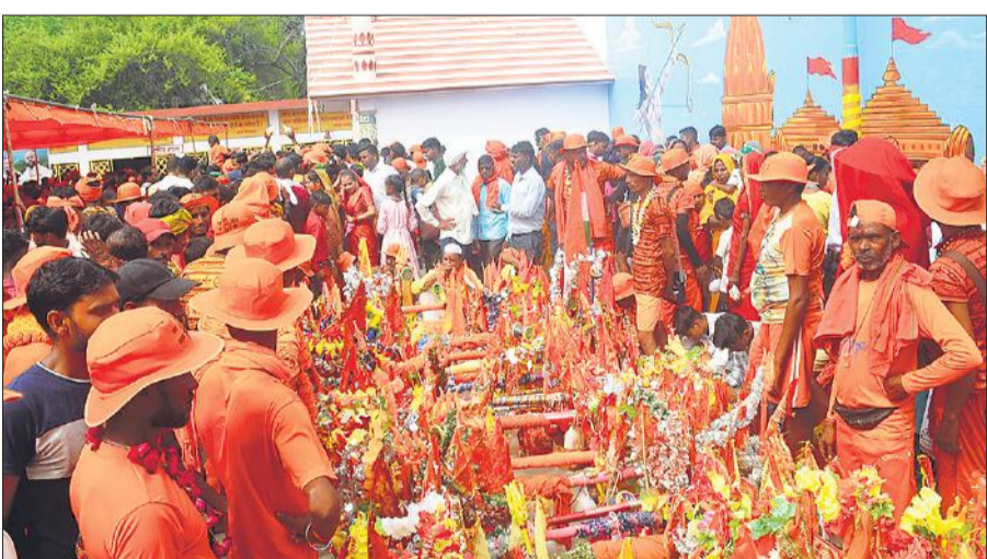
कावड़ की आरती करते कावड़िया