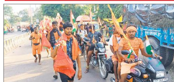
धार्मिक पाताक के साथ छोटी काशी गोला रवाना होते कांवड़ियों।