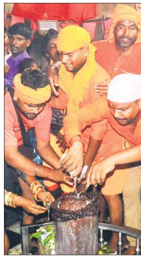
गौरीशंकर मंदिर जलाभिषेक करते श्रद्धालु।