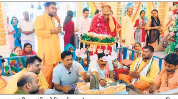
बाबा बनखंडीनाथ मंदिर में शिवार्चन करते श्रद्धालु।

पुष्यां मार्ग पैना बुजुर्ग स्थित श्री त्रिलोकीनाथ शिव मंदिर में हजारों महिलाओं, पुरुषों और युवाओं ने अपने आराध्य देव का पूजन किया।