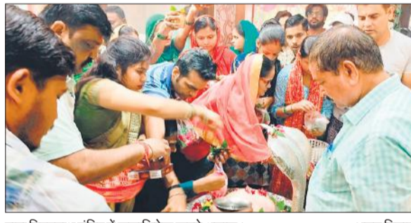
बाबा विश्वनाथ मंदिर में जलाभिषेक करते श्रद्धालु।