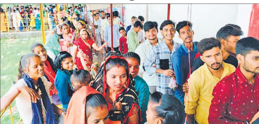
त्रिलोकीनाथ मंदिर पैना में जलाभिषेक के लिए लगीं भक्तों की लंबी कतार।

सावन के तीसरे सोमवार को भी पूरा वातावरण शिवमय रहा। बाजों से लेकर घरों तक भोले बाबा का गुणगान ही सुनाई दे रहा है। सुबह भोले बाबा के भक्तों ने स्नानादि से निवृत्त होकर मंदिर की ओर रुख किया। बेलपत्र, पुष्प, फल, मिष्ठान, रोली, चंदन, अक्षत, भांग, धतूरा आदि से सुसज्जित पूजा का थाल हाथों में लिए श्रद्धालु मंदिरों में पहुंचते रहे। प्रमुख मंदिरों में भक्तों की भारी भीड़ जुटी रही। सुबह से लेकर दोपहर