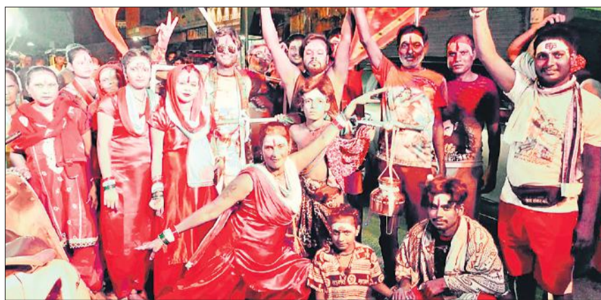
महिला थाने के पास कांवड़ यात्रा में भजनों पर नृत्य करतीं महिलाएं।

पानी आदि भी भेंटकर जय भोले के उद्घोष कर उनका मनोबल बढ़ा रहे हैं। रविवार रात महिला थाना के पास से भव्य कांवड़ियात्रा निकाली गई, जिसमें महिलाओं और युवतियों ने भजनों पर झूमते हुए माहौल को शिवमय बनाया। महिलाओं में कांवड़ को लेकर खाता उत्साह दिखा।