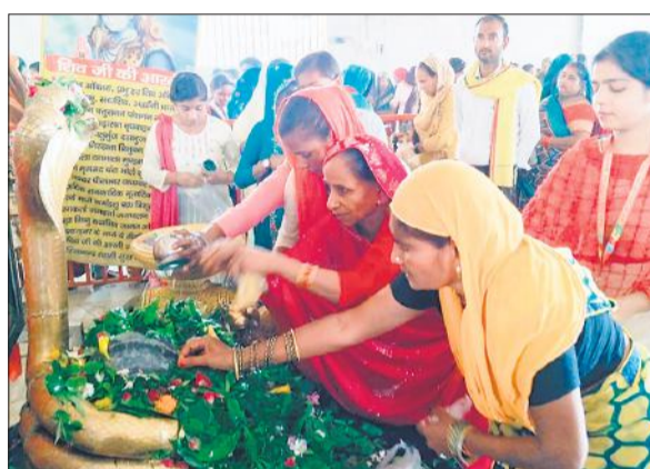
त्रिलोकीनाथ मंदिर पैना में बेलपत्र अर्पित करतीं महिलाएं।

यहां मंदिर के बाहर मुख्य मार्ग और खेतों तक लंबी कतार लगीं रहीं। वहीं, महानगर स्थित बाबा विश्वनाथ मंदिर, बाबा बनखंडीनाथ मंदिर, बाबा चौकसीनाथ मंदिर, रेती स्थित बाबा मनोकरण मंदिर, हनुमंतधाम