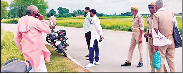
जमीन में दफन किए गए नवजात का शव निकलवाते तहसीलदार।