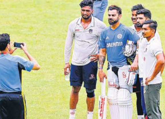
कानपुर में प्रशंसकों के साथ तस्वीर लेते विराट कोहली।

टेस्ट मैच के लिए ग्रीनपार्क में आईडियल विकेट तैयार हुई है। लेकिन गुरुवार को बारिश के कारण विकेट का मिजाज बदलने की भी संभावना बनी है। मैच से पहले दो विकेट तैयार की गई हैं। नमी के कारण विकेट के मिजाज में बदलाव आ सकता है। इससे टॉस की भूमिका भी अहम हो गई है।