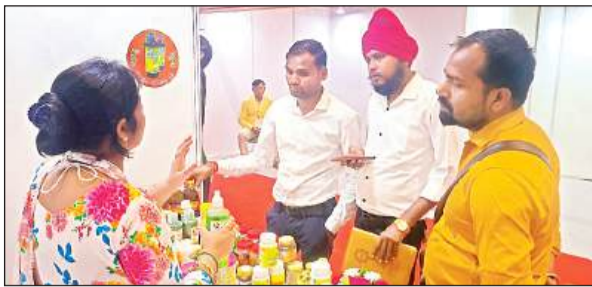
इंटरनेशनल ट्रेड शो में अरगा ब्रांड देखते व खरीदते लोग ।