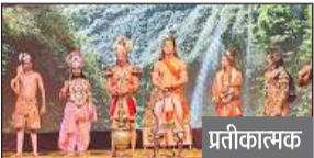
प्रतीकालक 03 अक्टूबर से होगा लाइव प्रसारण, बॉलीवुड के 42 कलाकार निभाएंगे पात्रों का किरदार

अयोध्या में बीते 5 वर्षों से हो रही फिल्मी सितारों की रामलीला