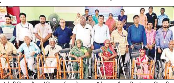
दि लोपोसी मिशन में आयोजित कार्यक्रम में उपकरणों के साथ मौजूद दिव्यांग व अधिकारी।