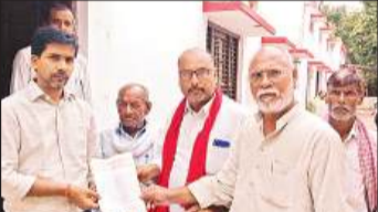
सदर तहसील में नायब तहसीलदार को ज्ञापन सौंपते श्रमिक संघ के लोग।

अयोध्या कार्यालय। अमृत विचार : उत्तर प्रदेश लोक निर्माण विभाग श्रमिक संघ ने एनपीएस और यूपीएस समाप्त कर पुरानी पेंशन को बहाल करने, स्क्रीम वर्कर्स की सेवाएं नियमित करने, आठवें वितन आयोग की समिति का गठन करने जैसी मांगों से संबंधित प्रधानमंत्री और मुख्यमंत्री को संबोधित ज्ञापन नायब तहसीलदार सदर को सौंपा।