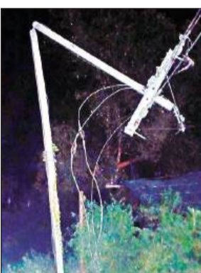
वाहन की टोकर से टूटा पोल।