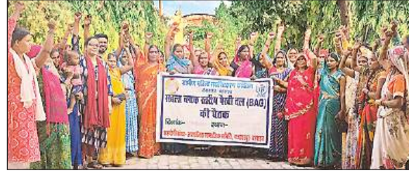
जागरूकता कार्यक्रम में मौजूद महिलाएं।

अपराजिता द्वारा संचालित ग्रामीण महिला सशक्तिकरण परियोजना के अंतर्गत, पुरवा स्तर से लेकर ब्लॉक स्तर तक एक संगठनात्मक ढांचा विकसित किया गया है, जिससे महिलाओं को उनके हक और अधिकारों की पहचान कराई जा रही है और उन्हें दिलाने के प्रयास किए जा रहे हैं। बैठक में, महिलाएं अपनी