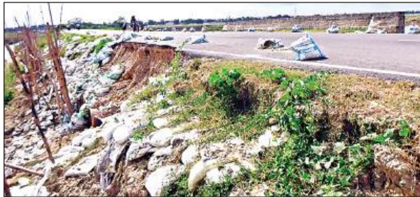
खतरों को न्योता देती सड़क। अमृत विचार

अमृत विचार। निर्माण के एक वर्ष में ही 39 करोड़ रुपये लागत की तेतरी-सोहांस लोटन सड़क दरक गई। यहां तक कि सड़क पर पुलिस का एक तरफ का हिस्सा टूटकर ध्वस्त हो चुका है, और सड़क धंस गई है। यहां बोरियां डालकर वाहन चालकों को सड़क क्षतिग्रस्त होने का संकेत दिया गया है। अगर भारी वाहन गुजरें तो सड़क धंस सकती है और बड़ा हादसा हो सकता है। स्थानीय लोगों को मनें तो किनारे गड्ढे खोदकर सड़क पर मिट्टी डालने से वाहन चालक हादसे का शिकार हो रहे हैं।