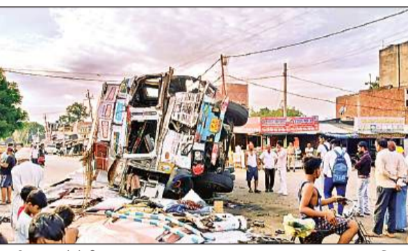
आर्यनगर कस्बे में बीच सड़क पर पलटा हुआ ट्रक।

पलट गया तथा गोंडा-बहराइच मार्ग अवरुद्ध हो गया। घटना में जनपद बाराबंकी के फतेहपुर थाना क्षेत्र का रहने वाला ट्रक चालक इसरार (50) व खलासी सरवर (30) घायल हो गया। उन्होंने बताया