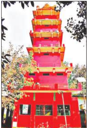
रानी तालाब हनुमान मंदिर।

धनावंतन का प्रस्ताव शासन को भेज दिया है। जिलाधिकारी ने बताया कि रानी तालाब के निकट स्थित हनुमान मन्दिर सांस्कृतिक, पौराणिक, धार्मिक एवं ऐतिहासिक महत्व के दृष्टिगत अत्यन्त महत्वपूर्ण है। हनुमान मन्दिर परिसर में श्रद्धालुओं की सुविधा के लिए सम्पर्क मार्ग, परिक्रमा पथ, विश्रामालय, हवन कुण्ड शेड, बेन्च एवं घाट के सौन्दर्यीकरण के सीडी का निर्माण कार्य तथा सम्पर्क मार्ग तिराहा का