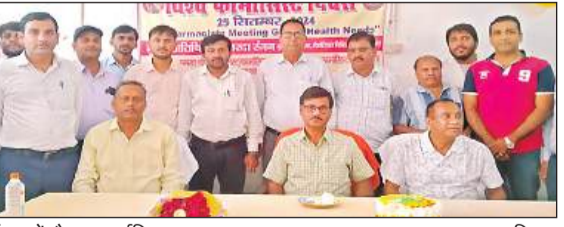
कार्यक्रम में मौजूद फार्मासिस्ट। अमृत विचार

बलरामपुर, अमृत विचार। विश्व फार्मासिस्ट दिवस पर गत बुधवार को जिला मेमोरियल चिकित्सालय के सभागार में कार्यक्रम का आयोजन किया गया। मुख्य चिकित्सा अधीक्षक की अगुवाई में केक काटकर फार्मासिस्टों ने एक-दूसरे को बधाई दी। गोष्ठी को संबोधित करते हुए अस्पताल के सीईओ ने कहा कि फार्मासिस्ट स्वास्थ्य विभाग के महत्वपूर्ण अंग हैं। अस्पताल आने वाले मरीजों को स्वास्थ्य सुविधाएं प्रदान करने में आप लोगों की अहम भूमिका होती है। इसीलिए फार्मासिस्ट को मरीजों का सच्चा हिस्सेी कहा जाता है। चौक