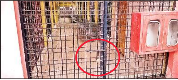
जिला अस्पताल में जनरल ओटी जाने वाले गेट पर लगा ताला (लाल घेरे में)।