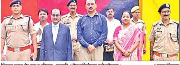
जिला जज के साथ डीएम, एसपी और सीजेएम रहे मौजूद।