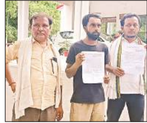
डीएम को शिकायती पत्र देने आए लोग।