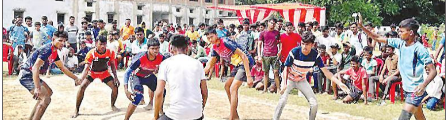
कबड्डी प्रतियोगिता में एक दूसरे पर दम खम आजमाते खिलाड़ी।