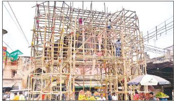
दुरां पूजा के लिए चौक में बनाया जा रहा भव्य पंडाल।