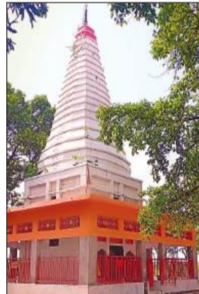
शिवगढ़ धाम मंदिर।

सौन्दर्यीकरण कार्य कराने के लिए 01 करोड़ निन्नान्वे लाख 65 हजार रूपए का बजट का प्रस्ताव भेजा गया है। इसी प्रकार नगर पंचायत