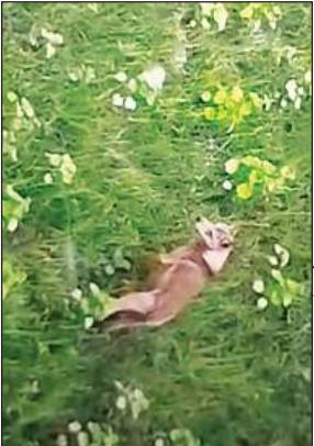
महसी तहसील क्षेत्र में ड्रोन कैमरे में कैद हुआ आदमखोर भेड़िया।

जिले के महसी तहसील क्षेत्र में भेड़िया के हमले में अब तक 10 लोगों की मौत हो चुकी है। जबकि 45 से 50 लोग घायल हो चुके हैं। वन विभाग ने अब तक पांच भेड़ियों को पकड़ा है। लेकिन सबसे खतरनाक और झुंड का सरदार लंगड़ा भेड़िया अब तक पकड़ में