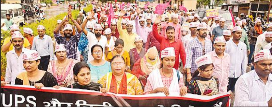
पुरानी पेंशन बहाली की मांग को लेकर मार्च निकालते शिक्षक और कर्मचारी।

अमृत विचार : ऑल टीचर्स एम्प्लॉई वेल्फेयर एसोसिएशन के बैनर तले पुरानी पेंशन बहाली और एनपीएस/यूपीएस और निजीकरण के विरोध में गुरुवार को संगठनों ने बारिश के बीच गांधी पार्क से सिविल लाइन और रिक्वागंज से लेकर आक्रोश रैली के तहत जिलाधिकारी कार्यालय तक पैदल मार्च किया। मुख्यमंत्री को संबोधित ज्ञापन सिटी मजिस्ट्रेट को सौंपा। इससे पूर्व गांधी पार्क में भारी संख्या में इकट्ठा होकर राज्य सरकार से पुरानी पेंशन बहाली के लिए जबरदस्त नारेबाजी किया। आक्रोश रैली में हजारों शिक्षक व कर्मचारी शामिल रहे। प्रमुख रूप से शिक्षणोत्तर संघ, राजकीय नर्सिंग संघ, राजपत्रित फार्मासिस्ट नर्सिंग, पीडब्ल्यूडी नियमित व कर्मचारी संघ संयुक्त कर्मचारी एसोसिएशन