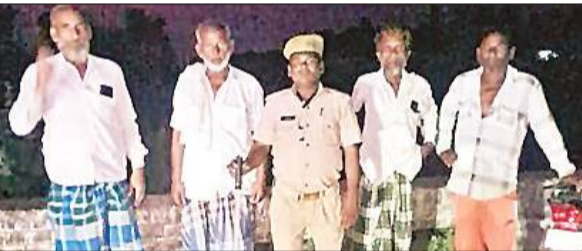
जंगली जानवर की दहशत के कारण रात में गश्त करते ग्रामीण।