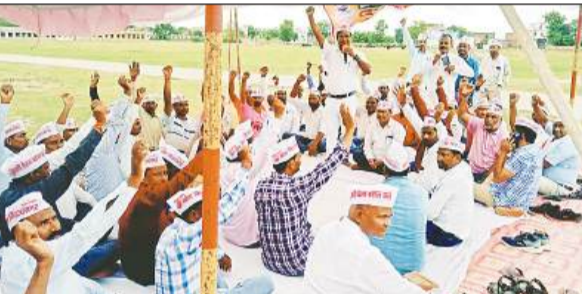
पुरानी पेंशन बहाली को लेकर धरना-प्रदर्शन करते शिक्षक व कर्मचारी।

ज्ञापन में मांग की गई है कि उत्तर प्रदेश के लगभग 14 लाख शिक्षक कर्मचारी व अधिकारी लगातार पुरानी पेंशन की मांग कर रहे हैं। जो नई पेंशन व्यवस्था एनपीएस है उसके दुष्परिणाम लगातार सामने आ रहे हैं, जिसके तहत शिक्षकों कर्मचारियों को 800 व 1200 एवं 2800 पेंशन