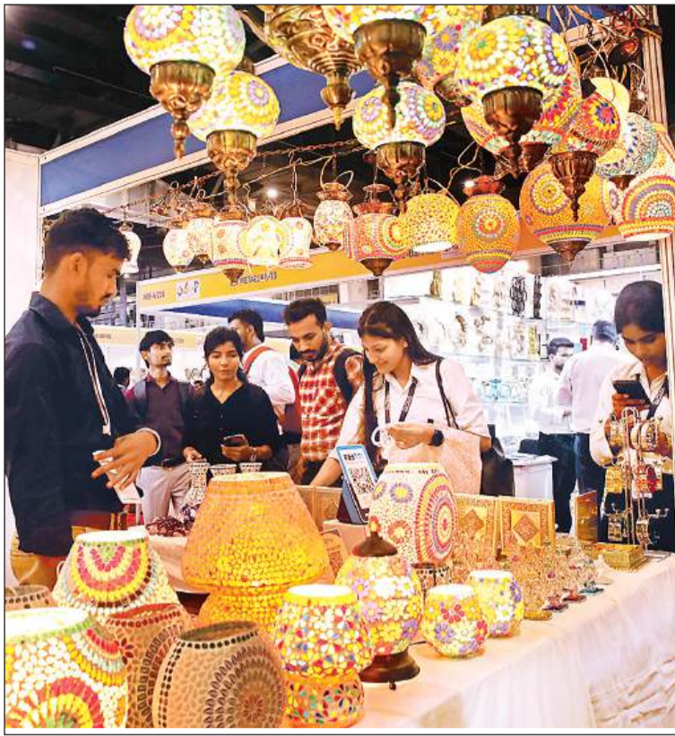
ग्रेटर नोएडा में लगे यूपी इंटरनेशनल ट्रेड शो में उत्पादों को देखते बाहरी प्रदेशों से आए लोग।

एंकर जैसी कंपनियां सामने आ रही हैं। उम्मीद है कि इसकी स्कीम भी अगले 10 से 15 दिनों में लांच की जाएगी। उन्होंने बताया कि इन तीन बड़े स्टॉल क्षेत्र में या तो कार्य कर रही है या फिर करने जा रही हैं।