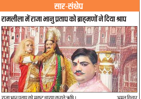
राजा भानु प्रताप को मुकुट धारण कराते ऋषि ।

अधिक सशक्त होने का अवसर मिलेगा। यह पहल महिलाओं के सशक्तिकरण और ग्रामीण अर्थव्यवस्था को सुदृढ़ करने की दिशा में एक प्रेरणादायक कदम है। इससे महिलाओं की आमदनी में वृद्धि होगी और वे आत्मनिर्भर बनेंगी।