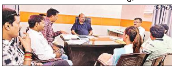
संचारी रोग नियंत्रण को लेकर बैठक करते सीएचसी अधीक्षक।