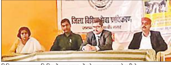
विधिक जागरूकता शिविर में छत्र छात्राओं को जागरूक करते एडीजे