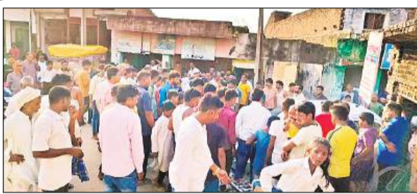
सड़क पर अतिक्रमण कर मकान निर्माण के चिन्हंकन के दौरान मौके पर जुटी भीड़।

खरगपुर, अमृत विचार: सरकारी रास्ते की भूमि को कब्जा कर पक्का मकान का निर्माण करा लिया गया। चौड़ाई कम करके लोनिवि 500 मीटर तक सड़क का निर्माण करा रही थी। शिकायत पर मौके की जांच करने पहुंची राजस्व टीम पर उक्त रास्ते के गाटे को छोड़कर दूसरे गाटे की भूमि का रिपोर्ट लगा कर विभाग को भेजने का ग्रामीणों ने आरोप लगाते हुए मुख्यमंत्री कार्यालय, लोक निर्माण मंत्री उत्तर प्रदेश, जिलाधिकारी, कार्यालय मुख्य अभियंता देवी पाटन गोंडा, क्षेत्र लोनिवि गोंडा आदि को पत्र भेजकर शिकायत की है।