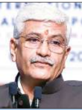
गगेन्द्र सिंह शेखावत केंद्रीय पर्यटन एवं संस्कृति मंत्री

समकालीनता और आधुनिकता की बात की जाती है, आधुनिकता और समकालीनता अनिवार्य हैं परंतु परंपरा की अदम्यशक्ति को भी साथ लेकर ही चलना होगा। मानवीय मूल्य न हों, तो ऐसी आधुनिकता निजी-अहंकार हो सकता है, वह समाज के लिए कोड़ी-भर काम की नहीं है।