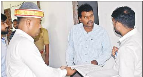
धनगढ़िया में निर्माणाधीन अध्यापक आवास का निरीक्षण करते डीएम। अमृत विचार

जिलाधिकारी को ई द्वारा अवगत कराया गया कि यह निर्माण 2.70 करोड़ की लागत से बन रहा है। इसमें टाइप-1 का 5 सेट बन रहा है, जिसमें 3 ग्राउण्ड फ्लोर तथा 2 फ्लोर फ्लोर पर बन रहा है। टाइप-2 के 12 सेट बनना है। भवन अभी अपूर्ण है। जिलाधिकारी ने समय से एवं गुणवत्तापूर्ण ढंग से पूर्ण कराने का निर्देश दिया तथा थर्ड पार्टी सत्यापन कराने का भी निर्देश दिया।