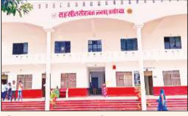
पिस रहा आम आदमी