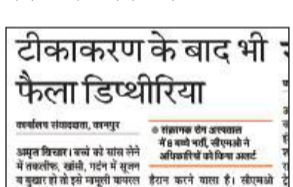
टीकाकरण के बाद भी फैला डिप्टीरिया