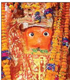
कुड़नी के हनुमान जी।

कुड़नी के प्रसिद्ध हनुमान मंदिर में बुढ़वा मंगल पर सुबह से बाबा के दर्शन करने के लिए भक्तों की भारी भीड़ उमड़ी। यहां पर आधी रात आरती के बाद से ही दर्शन का