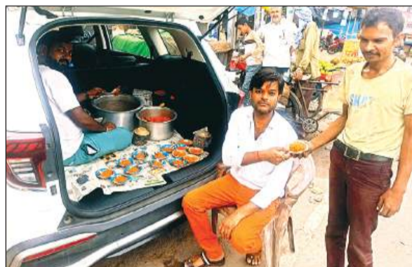
बुढ़वा मंगल पर बुंदी का प्रसाद बांटते समाजसेवी।