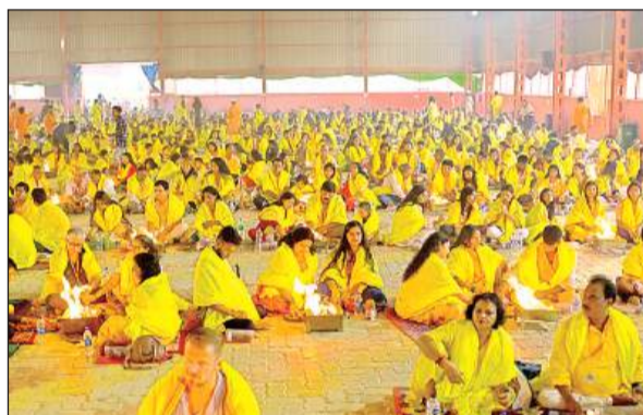
करौली शंकर धाम में हवन करते भक्त।