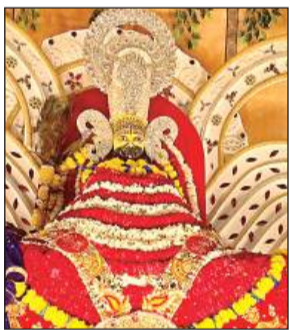
श्याम बाबा का सजा दरबार।