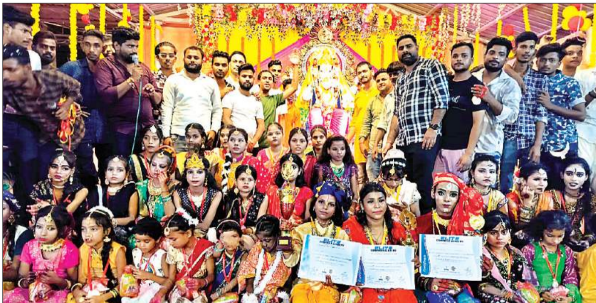
सिद्धेश्वर मंदिर रावतपुर गांव में सांस्कृतिक प्रतियोगिताओं के प्रतिभागी बच्चों को सम्मानित किया गया।

पंडालों में विराजमान गणपति के विसर्जन का सिलसिला महोत्सव के पांचवें दिन से चालू हो गया था। लेकिन सोमवार को भी जारी रहा। अब तक अधिकांश मूर्तियों का विसर्जन कमेटीयों ने कर दिया है, लेकिन मंगलवार को महोत्सव के अंतिम दिन अनंत चतुर्दशी को शतभिषा नक्षत्र के शुभ संयोग में शहर में स्थापित सभी प्रतिमाओं का विसर्जन किया गया। इस बार शहर में गणपति बापा की 1800 से अधिक प्रतिमाएं स्थापित की गई थीं। जिसमें कई कमेटीयों रेसी हैं जिनका यह महोत्सव 31, 41, 51 या 101वां था। इन कमेटीयों ने विघ्नहर्ता का नियमित 10 दिन पूजन अर्चन