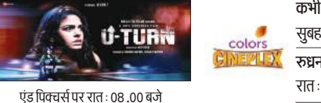
एड पिक्चर्स पर रात: 08.00 बजे