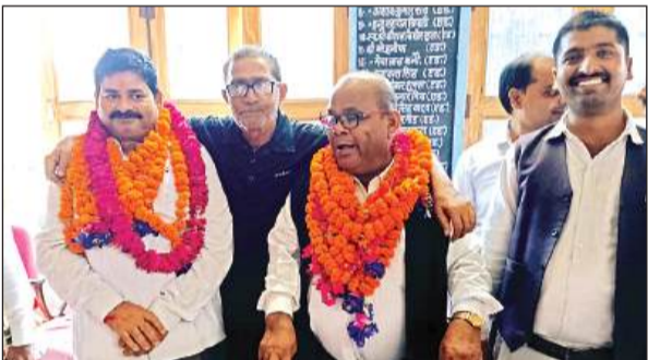
विजयी बार अध्यक्ष व महामंत्री।