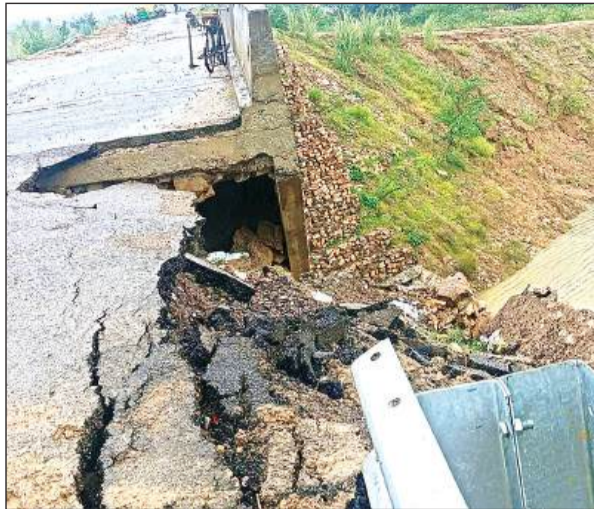
बारिश के दौरान अप्रोच मार्ग धंसा।

दादों पुल को जाने वाले रास्ते में तुर्की नाला पड़ने की वजह से छोटे पुल का निर्माण कार्य हुआ। उसी पुल के दोनों तरफ अप्रोच भी बनाया गया था। जिसमें कमीशनखोरी के चलते मानक को दरकिनार कर अप्रोचों को नष्ट कर दिया गया। पुल के अप्रोच, सड़क व इंटरलॉकिंग नाली निर्माण में घंटिया सामग्री का इस्तेमाल कर लाखों