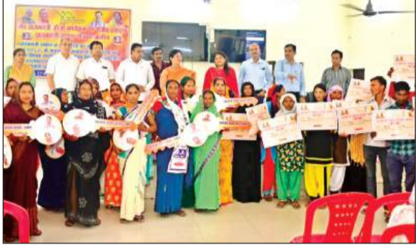
कल्याणपुर ब्लॉक में मंगलवार को आवास की चाबी सौंपी गई।