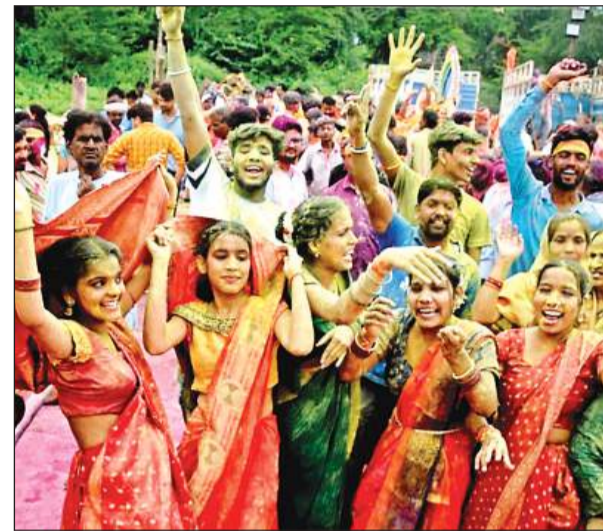
रंग-अबीर उड़कर खूब डंसा हुआ।

कई यात्राएं सड़क से निकलीं तो उनका संगम होने से नजारा देखने लायक था। बापा के जयकारों से शहर की हर गली व सड़क गूंजती रही।