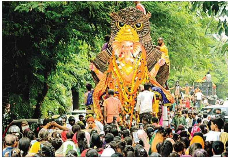
लाजपत नगर से भी गणेश जी विसर्जन को ले जाए गए।