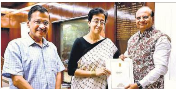
उपराज्यपाल वीके सक्सेना से मिले आतिशी और केजरीवाल, पेश किया दिल्ली में नई सरकार बनाने का दावा।