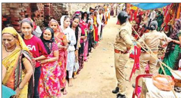
महिलाओं ने कतार में लगकर बाबा के दर्शन किए।

सिलसिला शुरू हो गया था। भीड़ को संभालने के लिए महिला और पुरुषों की अलग-अलग लाइनें लगीं। पुलिस भी पूरी तरह से मुस्तेद रही। सादी वर्दी में भी पुलिसकर्मी मेला में निगरानी करते रहे। मंदिर परिसर में सीसीटीवी कैमरों के साथ डिस्प्ले स्क्रीन लगाई गई थी। पुलिस कर्मी उस पर भी नजर बनाए रहे। भीड़ को ध्यान में रखते हुए मंदिर परिसर में हवन सामग्री, कपूर, अगरबत्ती जलाने की मनाही रही। परिसर में कथावाचकों की चौपाल भी नहीं लगने दी गई। साढ़