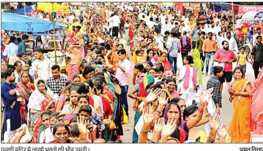
पनकी मंदिर में लाखों भक्तों की भीड़ उमड़ी।

पनकी धाम मंदिर में देर रात मंगलाआरती तक भक्तों ने संकटमोचन के दर्शन किए। भक्तों ने बाबा को भोग लगाने के बाद कपूर से आरती उतारी। मंदिर में बैजक हनुमान चालीसा का पाठ किया। इसके बाद परिक्रमा लगाकर सुख-समृद्धि की कामना की। पनकी मंदिर