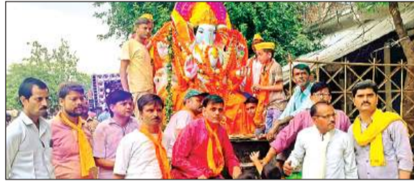
सिकंदरा में शोभायात्रा निकालकर प्रतिमा का विसर्जन किया गया।