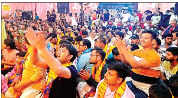
भजनों पर आनंदित होते भक्त।

पूरी रात नृत्य करने को मजबूर रहे। अंत में कलाकारों ने बर्बरीक की कथा सुनाकर श्रद्धालुओं को