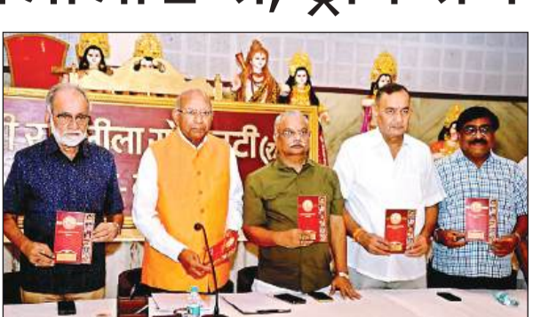
रामलीला की जानकारी देते आयोजकगण।