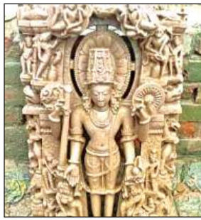
खुदाई से निकली प्राचीन मूर्ति।

विभाग ने उन पर कार्यवाही के बदले आवागमन को बंद करा दिया है। ऐसा पहली बार नहीं हुआ जब अप्रोचों की पोल खुली हो। इससे पूर्व में भी टेढ़े मड़े अप्रोच टूट चुके हैं जिन्हें मरम्मत कर जोड़ दिया गया था।