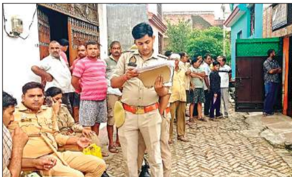
हत्या के बाद मौजूद पुलिस और ग्रामीण।

पुलिस ने शव का पंचनामा भरकर पोस्टमार्टम के लिये भेजा। भोगनीपुर सीओ ने बताया कि