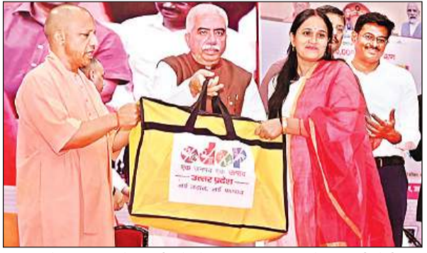
लखनऊ में हस्तशिल्पियों व कारीगरों को टूलकिट वितरित करते मुख्यमंत्री योगी। साथ में एमएसएमई मंत्री राकेश सचान।

अमृत विचार: मुख्यमंत्री योगी आदित्यनाथ ने कहा कि विश्वकर्मा दिवस पर ऐलान किया कि युवा उद्यमियों के लिए एक नई स्कीम आ रहा है। पहले चरण में पांच लाख और दूसरे चरण में 10 लाख का लोन उपलब्ध कराया जाएगा। इस योजना के अंतर्गत कुल 10 लाख युवाओं को स्वरोजगार के लिए प्रेरित करने का मार्ग प्रशस्त होगा।