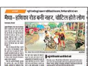
चार सितंबर को अमृत विचार में प्रमुखता से खबर प्रकाशित हुई थी।