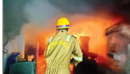
गोदाम में धक्कती आग को बुझाते दमकलकर्मी।