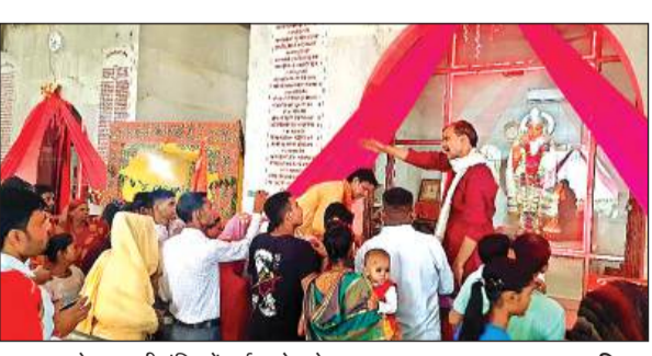
मूसानगर के बालाजी मंदिर में दर्शन को जुटे भक्त।