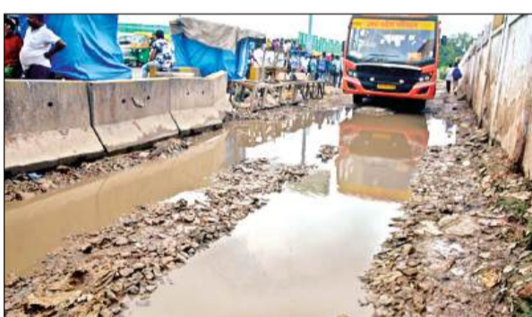
झकरकटी बस अड्डे से निकलने वाले मार्ग की दुर्दशा।

झकरकटी बस अड्डा के अंदर सड़क से सीधे बसों के प्रवेश करने का रास्ता बना है लेकिन बस अड्डा के गेट पर पहुंचते ही बड़े बड़े गड्ढे बसों में बैठे यात्री की कमर तोड़ देते हैं। यदि इन गड्ढों को भर दिया जाये