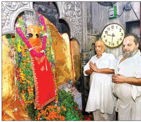
पनकी मंदिर में सजा बाबा का दरबार।