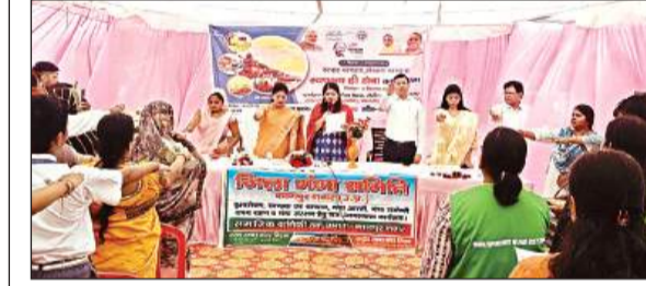
कल्याणपुर ब्लॉक में स्वच्छता की शपथ दिलाती सीडीओ व ब्लॉक प्रमुख।