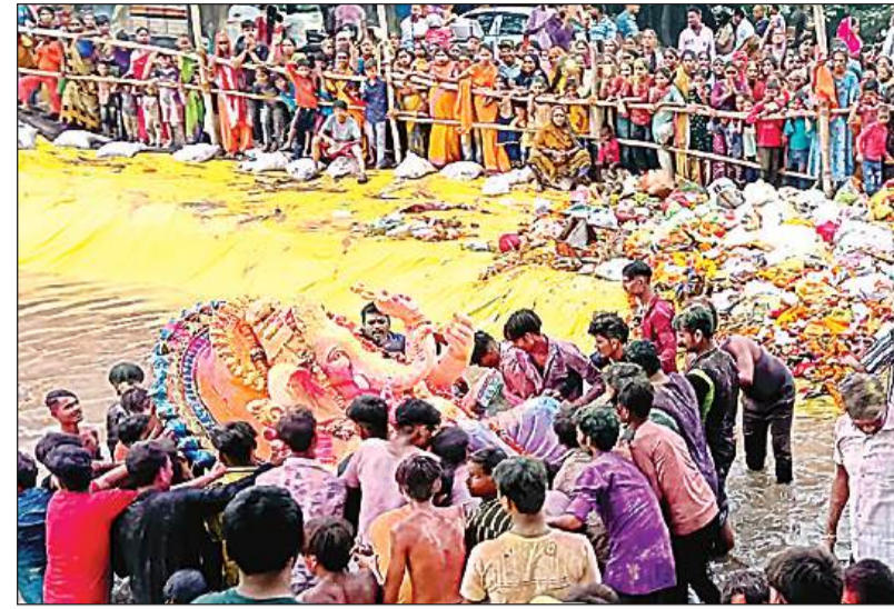
घांटों पर बने कृत्रिम तालाबों में गणपति को विसर्जित किया गया।