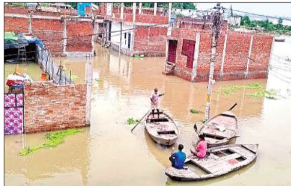
चंपापुरवा के निचले इलाकों में भरा बाढ़ का पानी। अमृत विचार

अमृत विचार। गंगा का जलस्तर एक बार फिर तेजी से बढ़ रहा है। जिससे तटवर्ती इलाके, ग्रामीण क्षेत्रों के अलावा शुक्लागंज के कई मोहल्लों में बाढ़ का पानी घुस गया है। जिससे यहां के रहने वाले लोगों को मुसीबतें उठानी पड़ रही हैं। मंगलवार को भी तेजी से जलस्तर बढ़ा और खतरे के निशान से 65 सेमी दूर दर्ज किया गया है। वहीं अब जलस्तर पोनी रोड के कई तटवर्ती इलाकों की ओर पहुंचने लगा है।