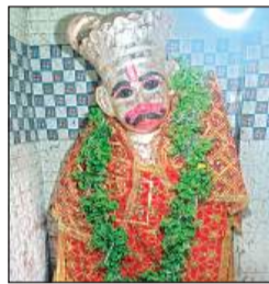
बाबा को तुलसी की माला चढ़ाई।