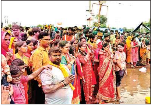
विसर्जन के दौरान झील पर उमड़ी भक्तों की भीड़। अमृत विचार