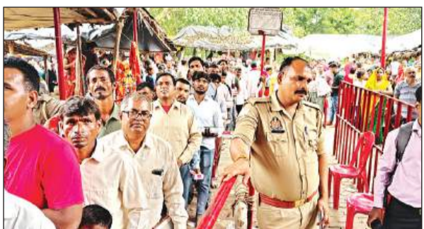
दर्शन के लिए पुरुषों की अलग कतार लगी रही।

पर सुबह पांच बजे मंगल आरती के साथ भक्त बाबा के दर्शन करते रहे। मंदिर परिसर में मेला भी लगा। यह प्राचीन मंदिर क्षेत्र में एक मात्र आस्था का प्रमुख केंद्र है। भीतरगांव के प्रसिद्ध महावीर मंदिर में रामलीला और भंडारा का आयोजन हुआ। दिन भर भंडारा चला। यहां भागवत कथा का आयोजन हो रहा है। महावीर दरबार में हनुमान जी की बाल स्वरूप की मूर्ति स्थापित है। यह मंदिर आसपास के गांवों के लोगों की आस्था का प्रमुख केंद्र है।