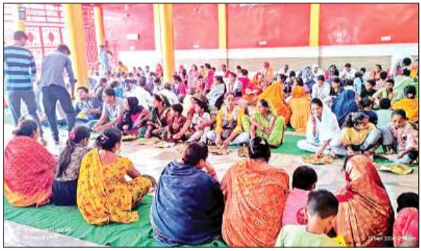
हनुमान मंदिर के भंडारे में श्रद्धालुओं ने पंगत में बैठकर प्रसाद छका।

जी को भोग लगा प्रसाद वितरित किया। वहीं कई जगहों पर भंडारे का आयोजन भी किया गया। कस्बा स्थित प्राचीन हनुमान मंदिर में मंगल मारुति कमेटी द्वारा विशाल भंडारे का आयोजन किया गया, जिसमें श्रद्धालुओं ने मौके पर पहुंचे लोगों के अलावा राह गुजरते लोगों को रोक-रोक कर प्रसाद वितरित किया। सुबह से देर रात तक मंदिरों में जय हनुमान व जय श्री राम के जयकारों की गूंज रही।