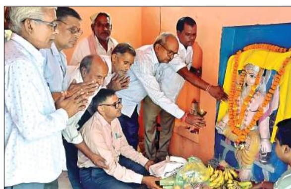
विश्वकर्मा मंदिर में पूजा अर्चना करते श्रद्धालु।