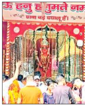
चौबेपुर के हनुमान मंदिर पहुंचे भक्त।

अमृत विचार। बुढ़वा मंगल पर क्षेत्र स्थित मंदिरों में हनुमान जी की पूजा अर्चना के साथ भजन कीर्तन व भंडारे आदि आयोजित हुए। इस मौके पर श्रद्धालुओं ने दान पुण्य कर भगवान को मिष्ठान अर्पित किया। पर्व पर सुबह से देर रात तक मंदिरों में श्रद्धालुओं की भीड़ रही। भाद्रपद महीने के आखिरी मंगलवार को बुढ़वा मंगल के रूप में मनाया जाता है। मान्यता है कि महाभारत काल में कुंती पुत्र भीम को अपनी ताकत पर बहुत घमंड था। घमंड को तोड़ने के लिए हनुमान जी ने बूढ़े वानर का रूप धारण किया था। इस दिन हनुमान जी की पूजा और प्रतिमा दर्शन करने से सारे पाप नष्ट हो जाते हैं और मनुष्य को कष्टों से निवारण मिलता है। पर्व पर मंगलवार को क्षेत्र स्थित मंदिरों में सुबह से ही श्रद्धालुओं का पहुंचना शुरू हो गया। लोगों ने पूजा-अर्चना कर हनुमान