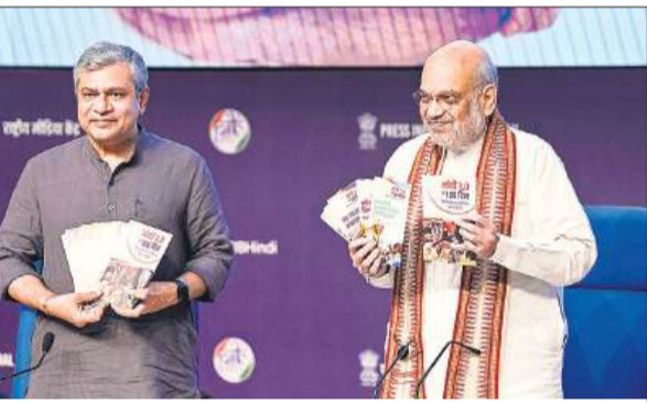
सरकार के 100 दिन पूरे होने पर रिपोर्ट जारी करते अमित शाह।