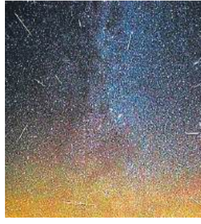
आसमानी आतिशबाजी की तस्वीर।

मारी थी। यह खतरनाक टक्कर थी। टक्कर में ढेर सारा मलवा छिटककर अंतरिक्ष में फैल गया था। अब यह मलवा पृथ्वी के पथ पर आगे बढ़ रहा है। अगले 10 सालों में कभी भी पृथ्वी से टकराएगा। मगर पृथ्वी की सतह पर न टकराकर वातावरण से टकराएगा और उल्कावृष्टि का शानदार नजारा देखने को मिलेगा। वैज्ञानिकों के अनुसार यह पहली उल्कावृष्टि होगी, जो मानव निर्मित होगी। धरती की ओर आने वाले खतरनाक क्षुद्रग्रह से रक्षा के लिए नासा ने इस सफल मिशन को अंजाम दिया था। मिशन 2022 में एक क्षुद्रग्रह को विक्षेपित करने यानी उसके मार्ग को बदलने को लेकर नासा ने डाट अंतरिक्ष यान को दूर स्थित क्षुद्रग्रह डिमोफॉस नामक एक छोटे पिंड से टकराया था। इस परीक्षण में लगभग 1 मिलियन