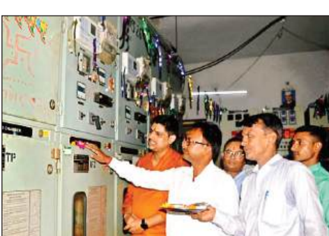
केस्को में उपकरणों की पूजा करते अधिकारी।

अमृत विचार। शहर के निजी-सरकारी प्रतिष्ठानों, फैक्ट्रियों और संस्थानों में मंगलवार को विधि विधान से विश्वकर्मा जयंती मनाई गई। भगवान विश्वकर्मा की पूजा के बाद कर्मचारियों ने मिलकर आरती की और आशीर्वाद लिया। मिस्त्री व मैकेनिकों ने अपने टूल किटों की पूजा की। कारखानों में भी मशीनों की पूजा की गई। कई जगह भंडारे का आयोजन कर प्रसाद बांटा गया। विश्वकर्मा जयंती पर फैक्ट्रियों के साथ ही दुकानों में भी पूजा हुई। कलपुर्जों, वाहनों की पूजा कर हवन किया गया। दादानगर इंडस्ट्रियल