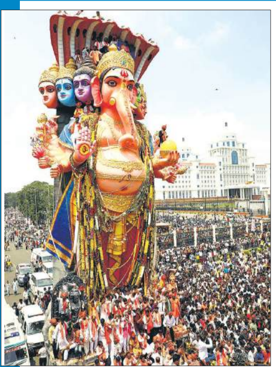
हैदराबाद में मंगलवार को 70 फीट की श्री गणेश की मूर्ति के विसर्जन के दौरान गणपति का आशीर्वाद लेने उमड़े श्रद्धालु।