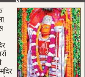
हनुमान गढ़ी काशीपुर में सजा बालाजी का दरबार।

रूरा। बुढ़वा मंगल का पर्व भक्ति भाव के साथ मनाया गया। क्षेत्र के काशीपुर बाला जी मंदिर व धनीरामपुर के मंदिरों में बांस बल्लियों के सहारे अलग-अलग पूजन के लिए कतारें बनाई गई थी। सुबह से देर शाम तक वातावरण पवनसुत के जयकारों से गुंजायमान रहा। मंदिर में भगवान की मोहक झांकी सजाई गई। सुबह जल्दी मंदिर के मंठों ने भगवान पवनसुत को सिंदूर से अभिषेक कर विधिविधान से पूजा अर्चना की। इसके बाद मंदिर के कपाट भक्तों के लिए खोल दिए और अखंड रामायण का पाठ चलाया गया। बालाजी हनुमान मंदिर में भी सुबह मंदिर के पुजारी ने भगवान की पूजा पाठ की। इसके बाद कपाट दर्शनों के लिए खोले। लोगों ने भगवान की पूजा कर जयकारे लगाए। यहां भी विशाल मेले का आयोजन किया गया। जिसमें भक्तों ने जमकर खरीददारी की। कस्बा रूरा के रेलवे कालोनी स्थित संकट मोचन हनुमान मंदिर में भी बड़ी संख्या में भक्त भगवान के दर्शन करने पहुंचे। रूरा चौराहा स्थित हनुमान मंदिर में भक्तों का जमघट लगा रहा।