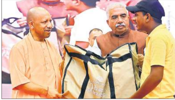
इंदिरा गांधी प्रतिष्ठान लखनऊ में हस्तशिल्पी को टूलकिट देते मुख्यमंत्री योगी।

अमृत विचार : मुख्यमंत्री योगी आदित्यनाथ ने मंगलवार को प्रधानमंत्री के जन्मदिन पर लखनऊ से लेकर वाराणसी तक विभिन्न कार्यक्रमों में केंद्र सरकार की उपलब्धियां गिनाते हुए विरोधियों को ललकारा। कहा कि विपक्ष की सरकारें तुष्टिकरण की पराकाष्ठा पर चढ़कर भारत की आस्था से खिलवाड़ करती थीं। भारत को गौरव की अनुभूति का अवसर न प्राप्त हो, इसके लिए षडयंत्र करती थीं। भ्रष्टाचार सरकार की पहचान बन चुकी थी और अराजकता चरम पर थी। देश की सुरक्षा