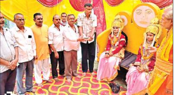
कड़री हनुमान मंदिर की रामलीला में आरती उतारते भक्त।