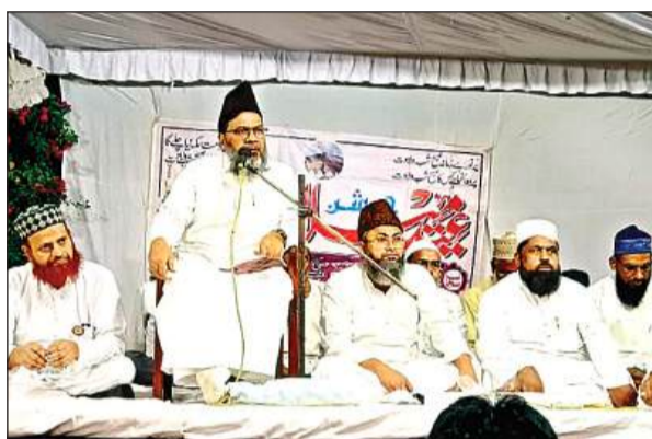
बासमंडी में जलसे को खिताब करते मौलाना।

कानपुर। काकादेव में रहने वाले एक दंपती ने पुलिस को बताया कि उनकी चार वर्षीय बच्ची थानाक्षेत्र में स्थित एक निजी विद्यालय में पढ़ती है। आरोप है कि सोमवार को उनकी बच्ची विद्यालय गई थी। घर लौटने के बाद बच्ची ने अपनी मां को बताया कि विद्यालय में कक्षा पांच में पढ़ने वाले एक बालक ने उसके साथ बैट टच किया है। जिसके बाद बच्ची के माता-पिता ने देर शाम काकादेव थाने में मामले की शिकायत की। वहीं इस मामले में विद्यालय के प्रबंधक का कहना है कि उन्हें घटना की जानकारी नहीं है। अगर बच्ची के स्वजन मामले की शिकायत करेंगे तो जांच कर कार्रवाई की जाएगी। थाना प्रभारी ने बताया कि विद्यालय के सीसी कैमरे देखे जाएंगे।