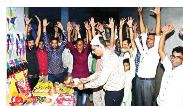
दादानगर की एक फैक्ट्री में विश्वकर्मा पूजन किया गया।