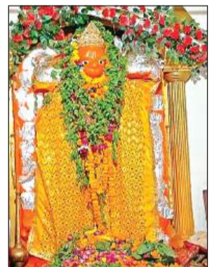
बुढ़वा मंगल पर बाबा का हुआ भव्य श्रृंगार। अमृत विचार

अमृत विचार। बुढ़वा मंगल पर नगर व ग्रामीण क्षेत्रों के हनुमान मंदिर में भव्य श्रृंगार कराया गया। जिसके बाद कन्यापूजन कर भंडारे का आयोजन हुआ। वहीं कई मंदिर में सुंदरकांड और अखंड रामायण का पाठ भी कराया गया। समापन के बाद प्रसाद वितरण किया गया।