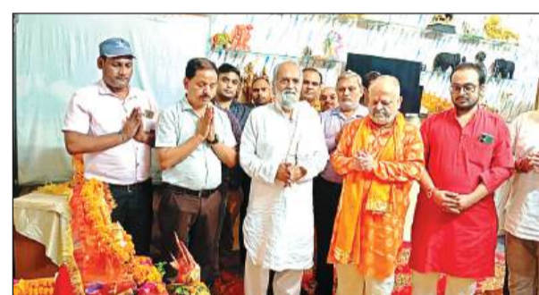
बाल विद्यालय शिक्षण संस्थान में गणेश वंदना।