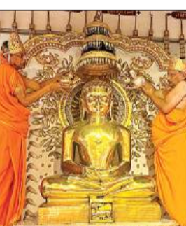
प्रभु का अभिषेक किया गया।