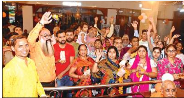
सनातन धर्म हनुमान मंदिर में गूंजे जयकारे।