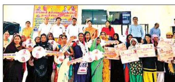
पीएम आवास योजना के लाभार्थियों को आवास की चाबी देते अधिकारी।