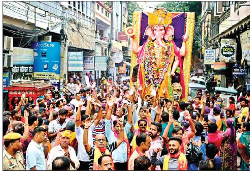
शिवाला से विसर्जन को ले जाते गणपति की प्रतिमा।