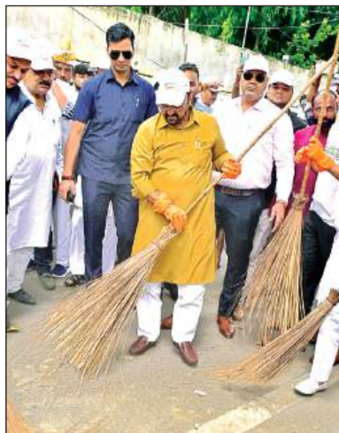
स्वच्छता ही सेवा कार्यक्रम के तहत झाड़ू लगाते मंत्री।