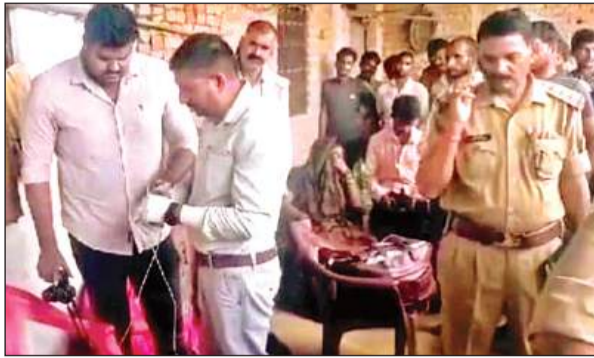
घटनास्थल पर जंच-पड़ताल करती फॉरेंसिक टीम और पुलिस।