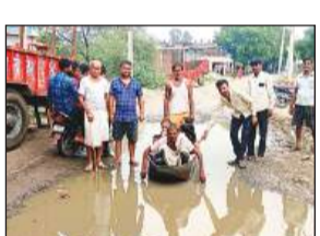
मैथा-हथिका रोड पर भरे पानी में नाव चलाकर प्रदर्शन करते ग्रामीण।

मैथा से हथिका से लेकर गहलों तक तक करीब नौ किलोमीटर डामर रोड बुरी तरह से खराब हो गई है। बरसात के दिनों में पानी भरे गड्ढों से निकलना बेहद कष्टप्रद साबित होता है। पैदल आने जाने वाले लोगों को पानी से मंझाकर आना जाना