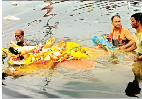
गगनी खेड़ा झील में गजानन की प्रतिमा विसर्जित करते भक्त।

गणेश विसर्जन में श्रद्धालुओं की रही भीड़, अबीर-गुलाल उड़ाते हुए किया विदा