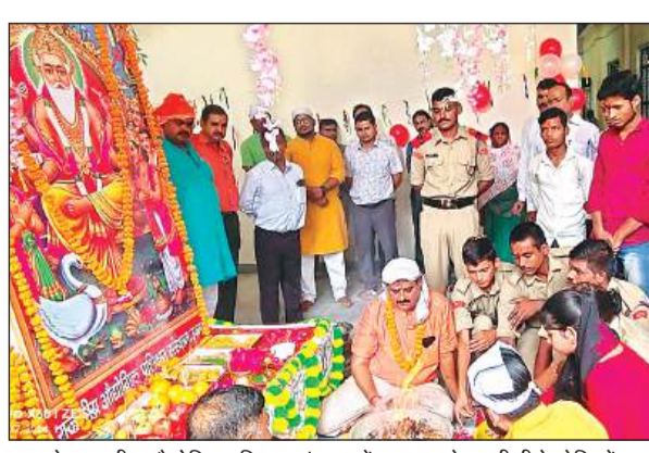
शहर के राजकीय औद्योगिक प्रशिक्षण संस्थान में पूजन करते एनसीसी के लेफ्टिनेंट।

। जिले में आदि शिल्पी विश्वकर्मा की जयंती धूमधाम से मनाई गई। मंगलवार को यांत्रिक कार्य से जुड़े लोगों ने विश्वकर्मा की पूजा कर कारोबार में तरक्की की कामना की। जिला मुख्यालय में पीडब्ल्यूडी, जलनिगम, नलकूप व बिजली विभाग सहित अन्य कार्यालयों और लोहे के कारोबार से जुड़े शहर से लेकर ग्रामीण इलाकों के लोगों ने आदि शिल्पी की आराधना की। वहीं नगर पालिका, लोक निर्माण विभाग व बिजली विभाग के पावर हाउस में सृष्टि के पहले वास्तुकार व शिल्पकार विश्वकर्मा की विधिविधान से पूजा