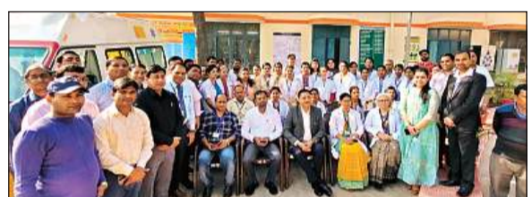
कल्याणपुर सीएचसी का स्टाफ।