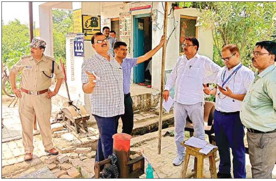
घटनास्थल के पास केबिन पर जानकारी लेते रेलवे अफसर।

इंडियन गैस एजेंसी पहुंची पुलिस, मांगी सूची: पुलिस की टीम ने इंडियन गैस एजेंसी पहुंची। जहां पर संचालक से यह सूची मांगी गई कि पिछले तीन दिनों में किसको-किसको कहां पर सिलेंडर बांटा गया। पुलिस इसके बाद सूची में शामिल लोगों के घर जाकर पूछताछ कर इनपुट जुटाएगी। घटनास्थल पर मिले सिलेंडर पर अंकित नंबर के आधार पर भी जांच की जा रही है कि सिलेंडर कहां से आया।