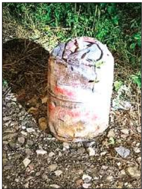
इसी सिलेंडर से टकराई थी ट्रेन।

एटीएस समेत कई जांच एजेंसियों ने जांच की और सुबूत जुटाए। ट्रेक