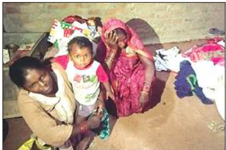
अजगैन में चोरी के बाद मायूस बैठा परिवार। अमृत विचार

अमृत विचार। जिले में इस समय पुलिस का कोई इकबाल या रस्ख नहीं रह गया है। क्योंकि जिले में चोरों को पुलिस का कोई भय नहीं रह गया है। बेखौफ चोर रातभर जिले भर में घूम-घूमकर चोरी की वारदातों को अंजाम देते हुए पुलिस को चुनौती दे रहे हैं और पुलिस हाथ पर हाथ धरे बैठी है। जानकारी पर पीड़ित घटना की सूचना जब पुलिस को देते हैं तो वह मौके पर जाकर जांच कर जल्द से जल्द घटना का खुलासा करने का दावा कर लौट जाती है। बीते दिन भी चोरों ने जिले के सोहरामऊ, अजगैन, पुरवा, हसनगंज, बांगरमऊ व बेहटा मुजावर क्षेत्र के अलग-अलग गावों में घटनाओं को अंजाम दिया। लेकिन, पुलिस आज तक इनका खुलासा नहीं कर सकी।