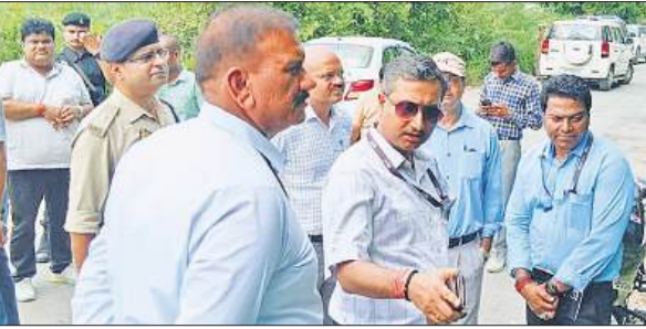
जांच करते एटीएस के आईजी नीलाका चौधरी व अन्य अधिकारी। ● अमृत विचार

8.37 बजे ट्रेन फर्रुखाबाद रूट के बर्राजपुर-बिल्हौर स्टेशन के बीच स्थित मुड़ेरी गांव की क्रासिंग के पास पहुंची थी कि तभी ट्रेक पर रखे एलपीजी सिलेंडर से टकराई थी। तेज रफ्तार ट्रेन पर सिलेंडर से टकराई