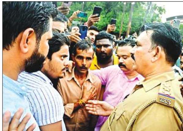
आक्रोशित कार्यकर्ताओं व परिजनों की पुलिस से होती तीखी झड़प।