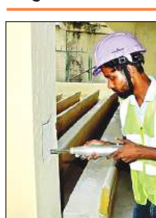
स्टेडियम में चल रहा मरम्मत का काम।