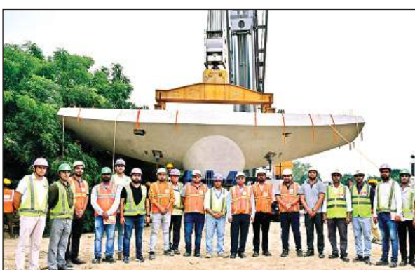
कंपनी बांग चौराहे के पास रखे गये पियर कैम्प के साथ मेट्रो के अधिकारी व कर्मचारी।

मेट्रो अधिकारियों ने बताया कि उपरिगामी (एलिवेटेड) संरचना में पियर (पिलर) के ऊपर पियर कैम्प रखे जाते हैं। इन पियर कैम्प के ऊपर ही यू-गर्डर और आई-गर्डर इत्यादि का परिनिर्माण होता है। कॉरिडोर-2 के एलिवेटेड सेक्शन