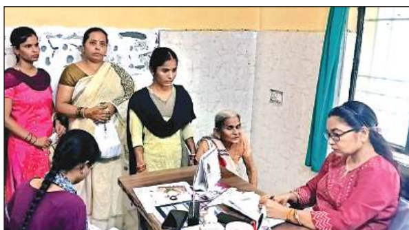
ओपीडी में मरीजों की जांच करती डॉक्टर।

क्योंकि अभी तक मौसम सामान्य हो गया था लेकिन तेज धूप के बाद दो चार दिन से अचानक भारी बारिश होने से लोगों की तबियत बिगड़ रही है, जिससे उल्टी दस्त के मरीज भी बढ़ गये हैं। वहीं प्राइवेट डॉक्टरों के यहां मरीजों की भारी भीड़ देखी जा रही है। गंभीर अवस्था में उन्हें