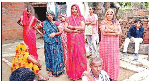
महिला की मौत पर मौजूद गमगीन परिजन।

● चौबेपुर सीएचसी में भर्ती बहू को देखकर आते समय रात को हुआ हादसा