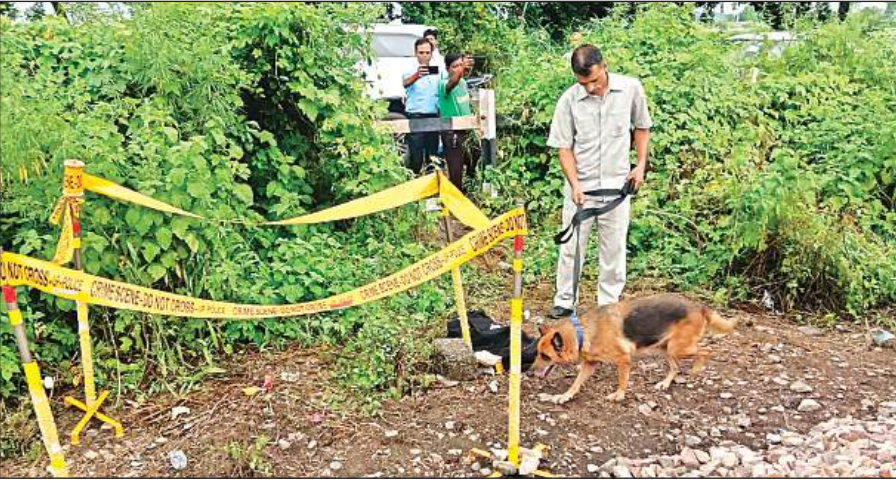
घटनास्थल पर डॉग स्वयायड भी पहुंचा।

पिछले कई वर्षों में कानपुर व आसपास के शहरों में रेल की घटनाओं में शामिल अपराधियों के बारे में एजेंसी जानकारी जुटा रही है। कहीं ना कहीं पुलिस और एजेंसियां मुख्य आरोपी तक पहुंचना चाहती है। इसको लेकर आसपास के होटल में रुकने वाले लोगों के बारे में भी जानकारी की जा रही है। वहीं शिवराजपुर, मंधाना, कल्याणपुर, बिल्हौर और कन्नौज के रेलवे स्टेशन को भी चेक कर सीसीटीवी देखे जा रहे हैं।