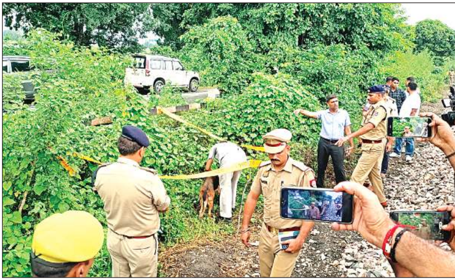
घटनास्थल पर जांच करते पुलिस और रेलवे के अधिकारी।