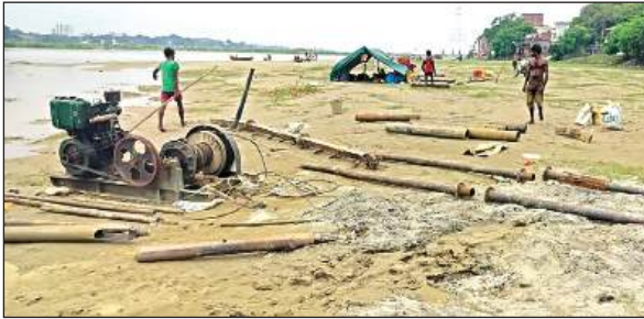
बोरिंग का सामान समेटती कार्यदायी संस्था।

हाल ही में, मृदा परीक्षण के दौरान बोरिंग मशीन की खराबी के कारण परीक्षण कार्य रोक दिया गया है। अरूण सोयल लैब द्वारा संचालित मृदा परीक्षण में लगी बोरिंग मशीन ने काम के दौरान तकनीकी खामियों का सामना किया, जिससे परीक्षण की गति प्रभावित हुई। सोमवार को