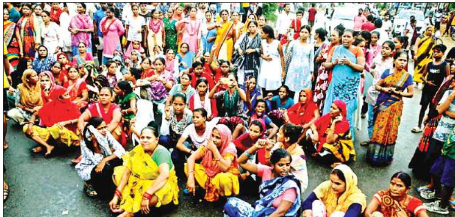
जीटी रोड जाम कर धरने पर बैठी महिलाएं।