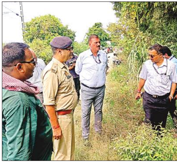
एटीएस के आईजी नीलाब्जा चौधरी ने की छानबीन।

डिब्बा और झोला मिला था। झोले में बारूद जैसा पदार्थ पाया गया।