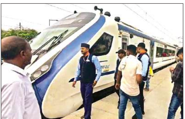
भरथना स्टेशन पर खड़ी वंदे भारत एक्सप्रेस।

अमृत विचार। नई दिल्ली से वाराणसी जा रही हाईस्पीड वंदे भारत ट्रेन का इंजन फेल हो जाने से डाउन ट्रैक पर साढ़े 3 घंटे तक ट्रेनों का आवागमन पूरी तरह से ठप रहा। तकनीकी टीम की कोशिशों के बाद भी इंजन में आई खराबी को ठीक नहीं किया जा सका। बाद में वंदे भारत को मालगाड़ी के इंजन से खींचकर भरथना स्टेशन के लूप लाइन तक पहुंचाया गया। इसके चलते आनंद बिहार से अयोध्या जाने वाली वंदे भारत भी भरथना स्टेशन पर खड़ी रही। शताब्दी सहित अन्य गाड़ियों को इटावा ज स वं त न गर आदि पीछे के स्टेशनों पर रोका गया। इससे सुबह नौ बजे से