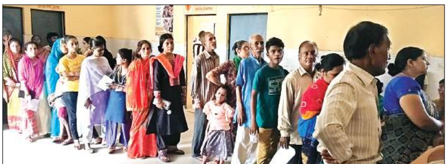
अस्पताल में लगी मरीजों की लाइन।

लगातार बरसात होने के बाद अचानक मौसम बदला और तेज धूप निकली। जिसके बाद एक बार फिर बरसात ने दस्तक दे दी है। जिससे लोगों में वॉटरल फीवर तेजी से फैल रहा है। इसके साथ ही दस्त, स्किन रोग, समेत सिर दर्द, लबन दर्द, तेज बुखार, सर्दी, जुकाम आदि के मरीज