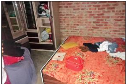
हसनगंज में चोरों द्वारा फैलाया गया सामान। अमृत विचार