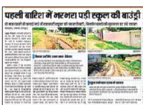
सिरावल के स्कूल को लेकर 21 अगस्त को प्रकाशित खबर। अमृत विचार

गौरतलब है कि 'अमृत विचार' समय-समय पर लोगों की समस्याओं को उठाता रहा है। गांवों और खासकर गांव-मजरों के स्कूलों में बच्चों को होने वाली दिक्कतों पर कई समाचार प्रकाशित किए गए। इनका असर भी दिखने लगा है। मऊ ब्लाक के खंड शिक्षाधिकारी ने इस संबंध में बीडीओ को पत्र लिखकर जानकारी दी है कि ब्लाक के 33 गांवों में विद्यालय पहुंच मार्ग को पक्का कराया जाना है। सिर्फ एक ब्लाक में इतने स्कूलों