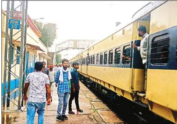
स्टेशन पर खड़ी देर से पहुंची ट्रेन।

इस दौरान 22426 अयोध्या वन्दे भारत एक्सप्रेस, 12004 लखनऊ शताब्दी एक्सप्रेस, 22308