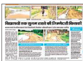
स्कूलों को जाने वाले बदहाल रास्तों को बताती 7 अगस्त को प्रकाशित खबर