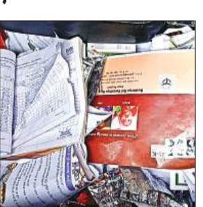
गाड़ी में फैली पड़ी दवाएं।

अमृत विचार। आरबीएसके टीम में लगी गाड़ी सीएचसी में खड़ी थी। गाड़ी की खिड़की खुली थी। बंदर गाड़ी के अन्दर घुस गए। बंदरों ने दवाएं नष्ट कर दी और प्रपत्र फाड़ दिए। अधीक्षक बोले, ड्राइवर गाड़ी का निजी प्रयोग कर रहा था।