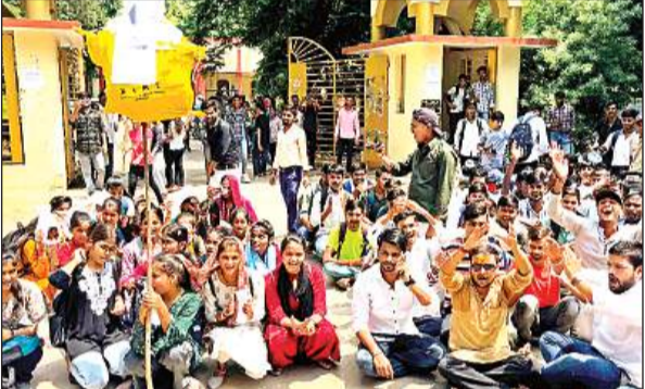
पंडित जेएन महाविद्यालय के सामने विरोध-प्रदर्शन करते छात्र-छात्राएं।