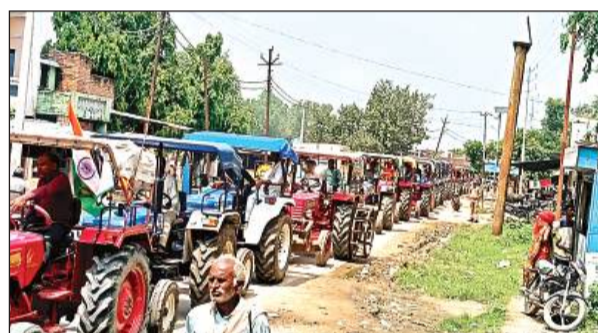
ट्रैक्टर लेकर ब्लाक कार्यालय पहुंचे किसान।