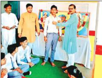
स्थान पाने वाले छात्र को पुरस्कृत करते प्रधानाचार्य।