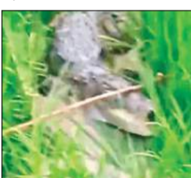
खेत में घुसा मगरमच्छ।

फर्रुखाबाद। कारमगंज कोतवाली क्षेत्र के गांव कुआँ खेड़ा में धान के खेत में अचानक मगरमच्छ पहुंच गया। इससे ग्रामीणों में हड़कंप मच गया। ग्रामीणों ने मगरमच्छ का वीडियो बनाकर सोशल मीडिया पर वायरल कर दिया। बता दें कि ग्रामीणों ने मगरमच्छ पकड़ने का प्रयास किया। लेकिन पकड़ने में असफल हुए। वन विभाग की टीम पहुंचने से पहले ही मगरमच्छ बाढ़ के पानी में पहुंच गया और वहाँ से गायब हो गया।