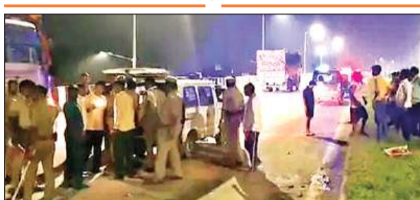
देर रात हादसे के बाद घटनास्थल पर मौजूद पुलिस। अमृत विचार