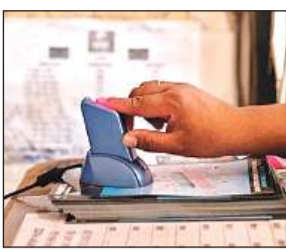
● जिले के 3 लाख 59 हजार राशनकार्डों में 13 लाख 80 हजार हैं सदस्य

संवाददाता, बांदा अमृत विचार। जिले के राशन कार्ड धारकों का ई-केवाईसी कराया जा रहा है। लेकिन अभी आधा काम ही निपट पाया है। जबकि ई-केवाईसी सभी के लिए जरूरी है। पूर्ति विभाग के मुताबिक बांदा में कुल तीन लाख 59 हजार राशनकार्ड में 13 लाख 80 हजार यूनिट (सदस्य) हैं, लेकिन अभी सात लाख 32 हजार यूनिटों का ही ई-केवाईसी हो पाया है।