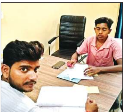
दवा लिख रहा प्रशिक्षु फार्मासिस्ट।

अमृत विचार। डॉ. राम मनोहर लोहिया अस्पताल की महिला यूनिट का हाल बदहाल है। अस्पताल में तैनात चिकित्सक अपने कार्य को लेकर कितने संजीदा हैं इसकी पोल कई बार खुल चुकी है। ताजा मामला महिला अस्पताल की ओपीडी से निकल कर सामने आया है। यहां सोमवार को प्रशिक्षु फार्मासिस्ट बच्चों का उपचार कर दवाएं लिख रहा था।