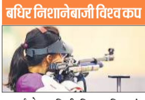
बधिर निशानेबाजी विश्व कप