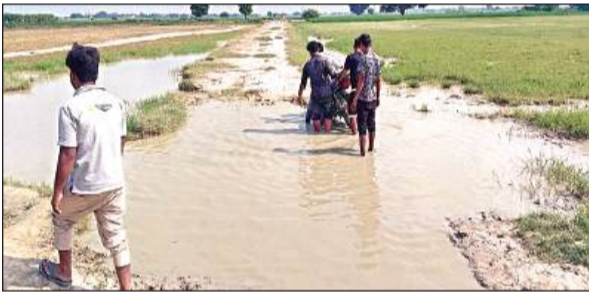
सड़क का निर्माण न होने से जलभराव से होकर गुजरता बाइक सवार।