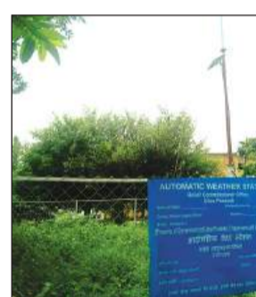
कलक्ट्रेट में निर्वाचन कार्यालय के सामने लगा एडब्ल्यूएसए