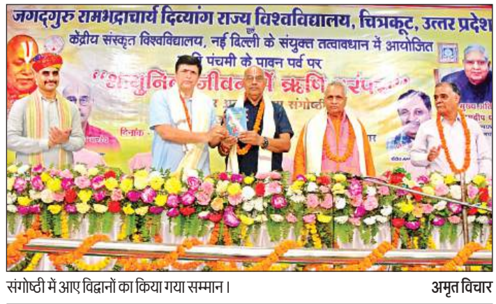
संगोष्ठी में आए विद्वानों का किया गया सम्मान।

। जगद्गुरु रामभद्राचार्य दिव्यांग राज्य विश्वविद्यालय में सोमवार को आधुनिक जीवन में ऋषि परंपरा विषय पर तीन दिवसीय अंतर्राष्ट्रीय संगोष्ठी का समापन हो गया। इस मौके पर वक्ताओं ने कहा कि आधुनिक संदर्भ में भी ऋषि परंपरा प्रासंगिक है।