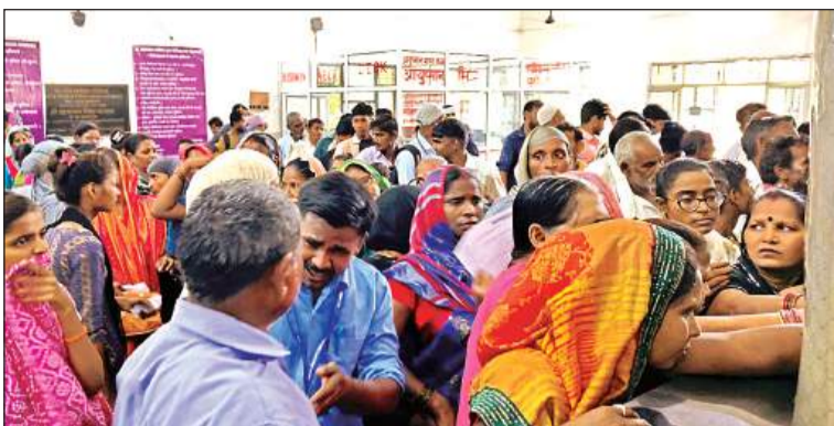
पर्चा काउंटर पर लगी मरीजों की भीड़।