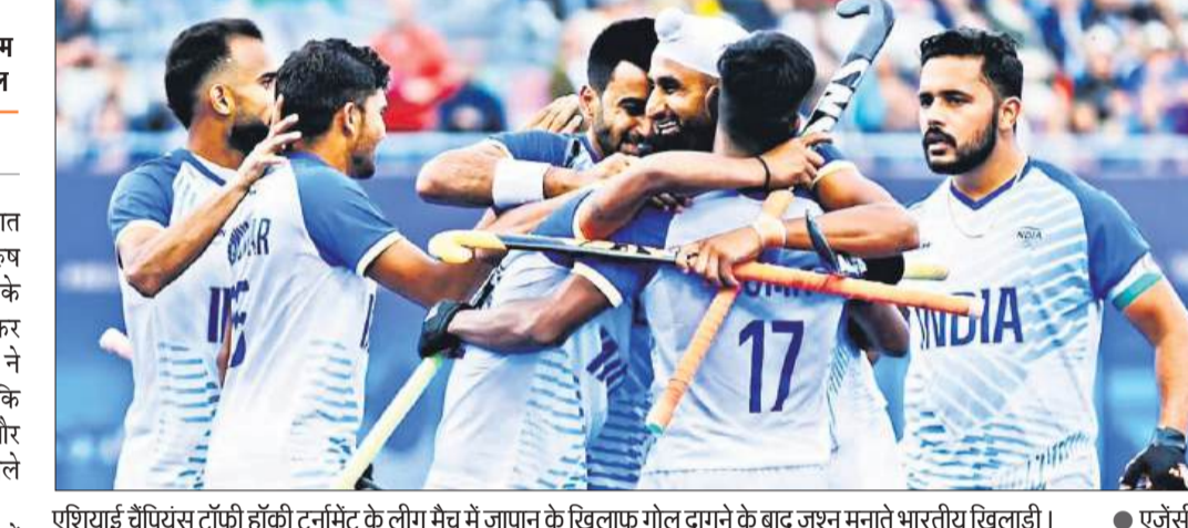
एशियाई चैंपियंस ट्रॉफी हॉकी टूर्नामेंट के लीग मैच में जापान के खिलाफ गोल दागने के बाद जश्न मनाते भारतीय खिलाड़ी।