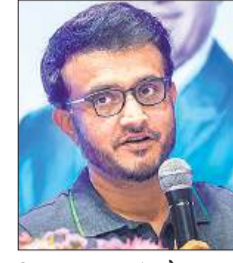
● भारत के पूर्व कप्तान सौरव बोले- भारत के ऑस्ट्रेलिया दौरे का इंतजार कर रहा हूँ, वहां होगी भारतीय टीम की असली परीक्षा

भारत के पूर्व कप्तान सौरव गांगुली का मानना है कि ऋषभ पंत टेस्ट क्रिकेट में सर्वकालिक महान खिलाड़ी बनने की राह पर हैं, लेकिन साथ ही उन्हें छोटे प्रारूपों में अपने प्रदर्शन में सुधार करने की जरूरत है। दिसंबर 2022 में कार दुर्घटना में चोटिल होने के बाद पंत को रिविवाक को पहली बार भारतीय टेस्ट टीम में शामिल किया गया है और पूरी उम्मीद है कि बांग्लादेश के खिलाफ 19 सितंबर से चेन्नई में शुरू होने वाले पहले टेस्ट मैच के लिए उन्हें अंतिम एकादश में शामिल