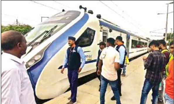
भरथना स्टेशन पर खड़ी वंदे भारत एक्सप्रेस।

संवाददाता भरथना, इटावा अमृत विचार। नई दिल्ली से वाराणसी जा रही हाईस्पीड वंदे भारत ट्रेन का इंजन फेल हो जाने से डाउन ट्रेक पर साढ़े 3 घंटे तक ट्रेनों का आवागमन पूरी तरह से ठप रहा। तकनीकी टीम की कोशिशों के बाद भी इंजन में आई खराबी को ठीक नहीं किया जा सका। बाद में वंदे भारत को मालगाड़ी के इंजन से खींचकर भरथना स्टेशन के लूप लाइन तक पहुंचाया गया। इसके चलते आनंद बिहार से अयोध्या जाने वाली वंदे भारत भी भरथना स्टेशन पर खड़ी रही। शताब्दी सहित अन्य गाड़ियों को इटावा जसवंतनगर आदि पीछे के स्टेशनों पर रोका गया। इससे सुबह नौ बजे से दोपहर 12 बजकर 28 मिनट तक लगभग साढ़े 3 घंटे तक डाउन ट्रेक पर ट्रेनों का संचालन पूरी तरह से ठप रहा। इंजन में लगे पेट्रो में खराबी आने से वंदे भारत में डाउन ट्रेक पर खड़ी हो गई।