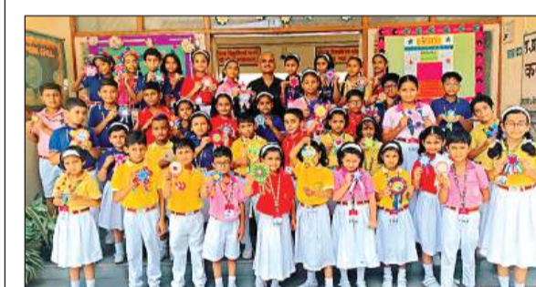
अपनी कला को प्रदर्शित कर बनाए हुए बर्थ डे बैज को दिखाते छात्र।