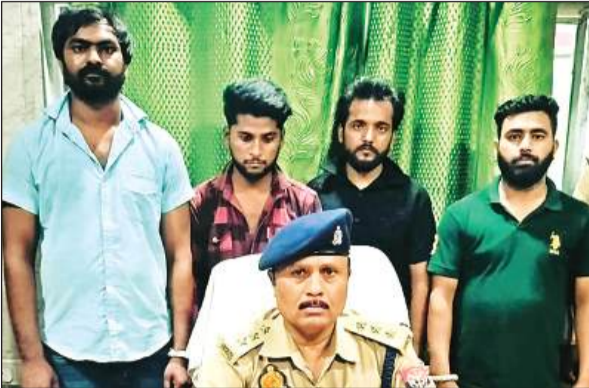
नकली नोट के साथ पकड़े गये आरोपी युवक।

गत 8 सितंबर की रात को थाना दिबियापुर पुलिस, एसओजी, सर्विलांस टीम द्वारा संयुक्त रूप से रात्रि चेकिंग की जा रही थी। इस दौरान मुखबिर द्वारा सूचना मिली थी कि ककोर बन्धा पुलिस की ओर से कनारपुर की तरफ रोड पर एक सफेद ईको गाड़ी खड़ी है जो कि संदिग्ध प्रतीत हो रही है। जिस पर संयुक्त पुलिस टीम द्वारा कार्रवाई करते हुए सफेद रंग की ईको से 4 व्यक्तियों को हिरासत में लेकर उनकी की जामालाशी ली गई, जिससे उनके कब्जे से 500-500 के नकली व असली नोटों से बने 20 लाख रुपये के 4 बंडल बरामद हुए। वहीं पुलिस ने उन सभी को गिरफ्तार करके थाना दिबियापुर में मुकदमा दर्ज कराया। बरामद मालुमति ईको कार जिसका नंबर