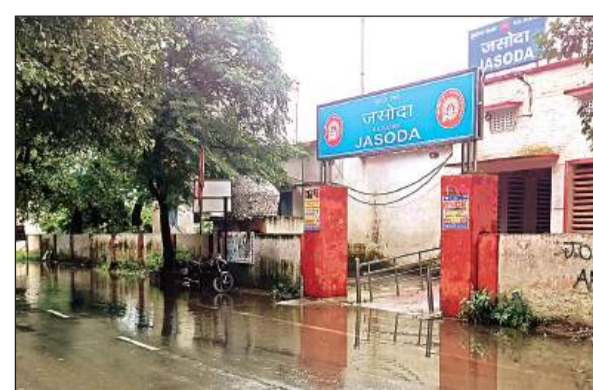
जसोदा रेलवे स्टेशन के सामने बरसात के बाद हुआ जलभराव। अमृत विचार

सोमवार की सुबह से ही आसमान में काले बादल छाए और दोपहर लगभग 01 बजे तक रुक-रुककर तो दोपहर बाद करीब दो बजे हुई मूसलाधार बरसात ने लोगों को जहां तहां रुकने पर मजबूर कर दिया। जबकि जलभराव व गंदगी से लोगों को परेशानी का सामना करना पड़ा। ग्राम जसोदा, जलालाबाद, तेराजाकेट, सराय प्रयाग, मिरगांवा, नदसिया सहित नगर की चकोर गली, जीटी रोड, पूर्वी रेलवे क्रॉसिंग, किदबई नगर, आजाद नगर, अशोक नगर आदि स्थानों पर जलभराव हो गया। इसी प्रकार जलालाबाद में जीटी रोड पर हुए जलभराव से लोगों को परेशानी का सामना करना पड़ा। जलालाबाद से गौरियापुर जाने वाला सम्यक मार्ग पर जलमग्न हो गया। बारिश से किसानों को राहत मिली।