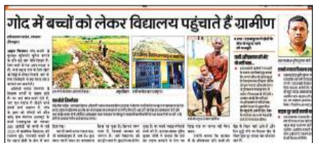
9 सितंबर को छपी एडवापुरवा मजरे के स्कूल जाने वाले रास्ते की हालत संबंधी खबर। अमृत विचार