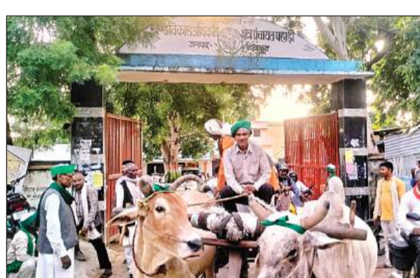
द्वार पर खड़ी कर दी बैलगाड़ी। अमृत विचार

अमृत विचार। अधिकारियों पर समस्याओं को लेकर उदासीनता का आरोप लगाते हुए किसानों ने भारतीय किसान यूनियन जिला इकाई की अगुवाई में ब्लाक परिसर में विरोध प्रदर्शन किया। कार्यालय का घेराव कर किसानों ने द्वार पर ट्रैक्टर-बैलगाड़ी खड़ी कर दी। बाद में अधिकारियों के पहुंचने पर और एक सप्ताह में समस्याओं के निराकरण का आश्वासन मिलने के बाद किसान माने।