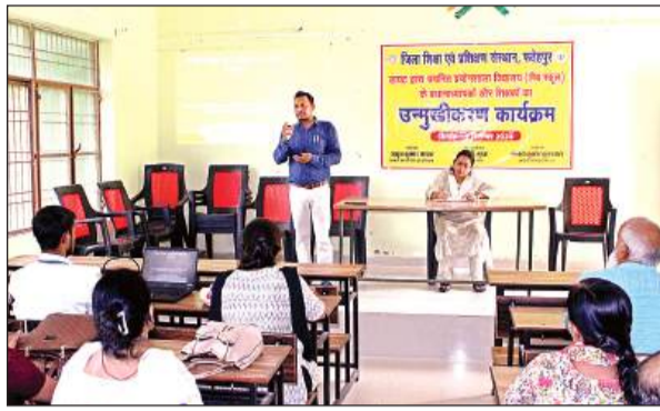
उन्मुखीकरण कार्यक्रम में मौजूद प्रधानाध्यापक।