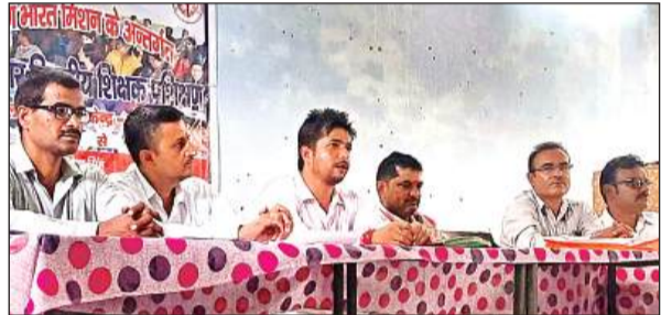
शिक्षकों को प्रशिक्षण देते प्रशिक्षक।