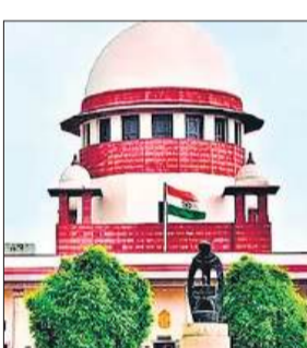
● अब 23 सितंबर को होगी इस मामले में अगली सुनवाई