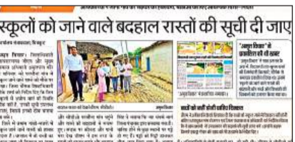
11 सितंबर को छपी खबर, जब जिलाधिकारी ने किया था मुआयना। अमृत विचार

के लिए अभी तक कच्चा मार्ग होना दर्शाता है, जिम्मेदारों ने इस ओर कितनी उपेक्षा और लापरवाही बरती और बदहाल मार्ग से कैसे