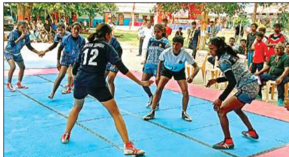
कबड्डी प्रतियोगिता में भाग लेती छात्राएं। अमृत विचार