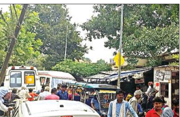
जाम में फंसी एंबुलेंस।