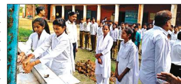
विद्यालय में हाथ धोती छात्राएं।

होना है। हालांकि विभाग का दावा है की राशन वितरण पूरा होने के बाद ही राशन कार्ड धारक को ई-केवाईसी शुरू हो जाता है जल्द ही शेष कार्य पूरा करा लिया जाएगा।