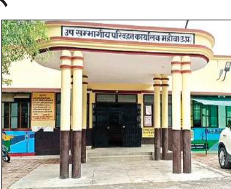
एआरटीओ विभाग कार्यालय महोबा।

अमृत विचार। सहायक संभागीय परिवहन विभाग में वाहनों की फिटनेस के नाम पर 20 किमी दूर यूपी एमपी की सरहद के समीप स्थित कस्बा श्रीनगर में वाहन मालिकों को बुलाया जाता है जिससे वाहन संचालकों का आने जाने में समय बर्बाद होने के साथ साथ वाहनों का डीजल पेट्रोल अतिरिक्त खर्च हो रहा है। इससे वाहन चालकों में एआरटीओ विभाग के प्रति खासा गुस्सा है। स्थिति यह है कि एआरटीओ के रहमो करम पर दूसरे प्रांतों से आने वाले ट्रक डंपर नियम विरुद्ध तरीके से जिले में धडल्ले से दौड़ रहे हैं। गौरतलब है कि एआरटीओ विभाग में कर्मचारियों की कमी होने के बाद भी बाहरी लोगों को लगाकर उन्हें अच्छा खासा महीने का पैसा