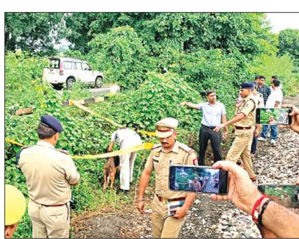
मौके पर जांच करती टीम। अमृत विचार

अमृत विचार। कालिंदी कांड को पलटाने की साजिश के बाद पुलिस अधिकारियों के निर्देश पर शिवराजपुर टोल समेत 5 किमी बिल्हौर साइड और 5 किमी कानपुर साइड के भवनों, मिलों, कोल्डस्टोरेज और फैक्ट्रियों में लगे सीसीटीवी फुटेज खंगाले जा रहे हैं। आसपास कई किमी के दायरे में जो भी पेट्रोल पंप कर्म हैं, उनसे भी पूछताछ शुरू कर दी गई है। उनके यहां लगे सीसीटीवी फुटेज खंगाले जा रहे हैं। सर्विलांस टीम की मदद से घटनास्थल के आसपास जो भी मोबाइल नंबर एक्टिव थे, उनकी कई दिन की डिटेल् निकलवाई जा रही है। उसमें देखा जाएगा कि किसकी कितने बार