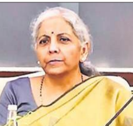
● वित्त मंत्री सीतारमण बोली-ऑनलाइन गेमिंग से राजस्व 412 प्रतिशत बढ़ा

सीतारमण ने कहा कि कैंसर की दवाओं पर जीएसटी को 12 प्रतिशत से घटाकर 5 प्रतिशत करने का उद्देश्य कैंसर के इलाज की कुल लागत को और कम करना है। परिषद ने चुनिंदा