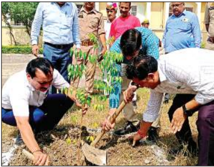
कार्यक्रम के बाद पौधरोपण करते अतिथि।