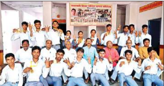
प्रतियोगिता में प्रतिभाग करने वाले छात्रों के साथ शिक्षक।