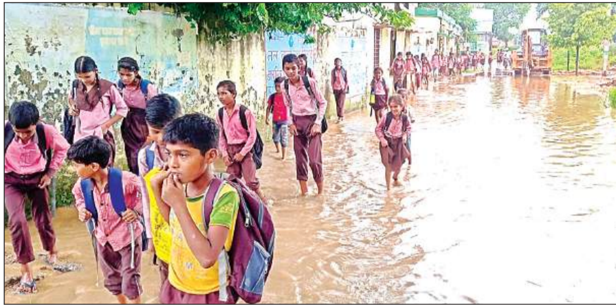
सदर ब्लाक के नजरापुर गांव में प्राथमिक व जूनियर स्कूल के सामने सड़क पर भर बारिश के पानी से निकलते बच्चे।

लंबे इंतजार व उमस भरी गर्मी के बाद सोमवार की दोपहर करीब दो घंटे जमकर बारिश हुई। खेतों में बारिश का पानी पूरी तरह से भर गया। इससे खेत में खड़ी उर्द, मूग की फसल को नुकसान हुआ। इसके अलावा जिन खेत में तोरई व लौकी की फसल खड़ी थी उसे भी नुकसान होने की संभावना बनी हुई है। तेज बारिश होने से पेड़ों का डाली टूटने से कई स्थानों पर बिजली के तार व पोल टूट कर गिर गये। इससे बिजली मिलने में दिक्कत हुई। बारिश समाप्त होने के बाद लाइनमैन फाल्ट खोजने निकले। शाम तक खोज करने के बाद टूटे पोल व तारों को ठीक किया जा सका। फिर भी कई दूर दराज गांव में बिजली व्यवस्था ठीक नहीं हो सकी।