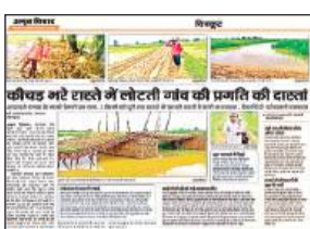
रामनगर के बेलरी गांव की हालत बयां करती 25 अगस्त को छपी खबर। अमृत विचार