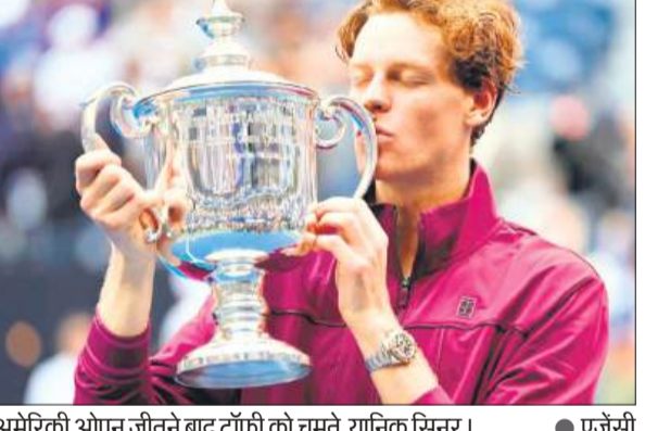
अमेरिकी ओपन जीतने बाद ट्रॉफी को घुमते यानिक सिनर।

पिछले दिनों डोपिंग मामले में दोष मुक्त होने वाले लुनिया के नंबर एक खिलाड़ी यानिक सिनर ने अपना शानदार प्रदर्शन जारी रखते हुए अमेरिका के टेलर फ्रिट्ज को सीधे सेटों में हराकर अमेरिकी ओपन टैनिस टूर्नामेंट में पुरुष एकल का खिताब जीता। सिनर ने आर्थर पेशा स्टेडियम में खेले गए फाइनल में 12वीं वरीयता प्राप्त फ्रिट्ज के खिलाफ अपने बेसलाइन के खेल का शानदार नमूना पेश किया और 6-3, 6-4, 7-5 से जीत दर्ज करके अमेरिका का वर्ष के इस अंतिम ग्रैंड स्लैम टूर्नामेंट में पुरुष एकल का खिताब जीतने का पिछले 21 वर्षों से चला आ रहा इंतजार बड़ा दिया।