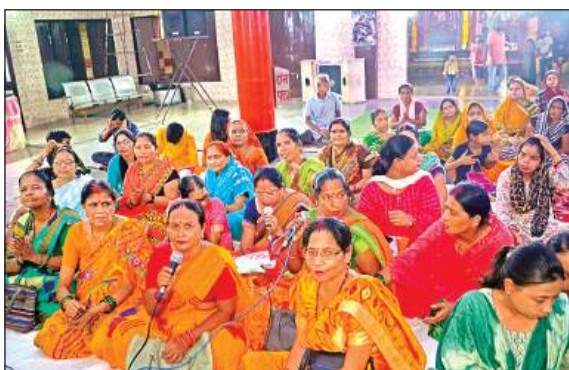
महोत्सव में भाग लेती महिलाएं।