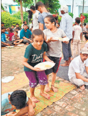
बिलसंडा के दुर्गा मंदिर प्रांगण में कान्हा की छठी पर प्रसाद ग्रहण करते हुए श्रद्धालु।

बाद उन्होंने बंडा रोड स्थित किसान एग्री ट्रेडर्स पर उर्वरक विक्रेताओं की बैठक की। जिसमें बताया कि ग्रामीण क्षेत्र में बिना लाइसेंस उर्वरक व्यापार धड़ल्ले से किया जा रहा है,ऐसी शिकायतें लगातार मिल रही हैं विक्रेताओं द्वारा अनियमितताएं