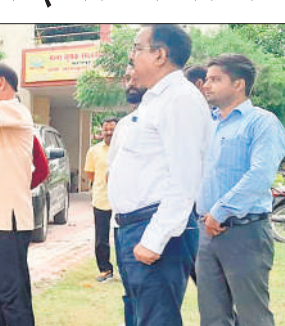
डीएम को कॉलेज की प्रगति के बारे में जानकारी देते प्राचार्य।