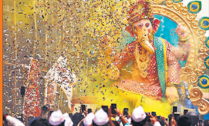
मुंबई। देश की आर्थिक राजधानी गणपति बाप्पा के स्वागत के लिए पूरी तरह तैयार है। इस बार भी पुराने उत्साह और उमंग के साथ गणेश उत्सव मनाया जाएगा। रविवार को वर्कशॉप से गणपति की मूर्ति पंडाल ले जाते श्रद्धालु।