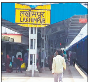
लखीमपुर रेलवे स्टेशन।

सोमवार से मैलानी से डालीगंज व सीतापुर से मैलानी के बीच संचालित चार पैसेंजर ट्रेनें नए समय पर चलेंगी। रेलवे ने मैलानी से सीतापुर और डालीगंज जाने वाले दो पैसेंजर ट्रेनों के नंबर भी बदले हैं। इसमें मैलानी से