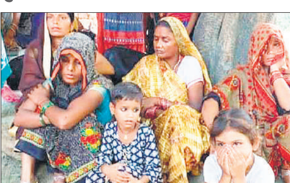
● अमृत विचार

पीलीभीत टाइगर रिजर्व की माला रेंज में शुक्रवार रात घुसे दो बाइक सवार पांच शिकारियों ने फायरिंग कर दहशत फैला दी थी। फायरिंग की घटना माला रेंज कार्यालय से महज एक किमी दूरी पर पीलीभीत-माधोटंडा मार्ग के समीप हुई थी। वन वाचर की