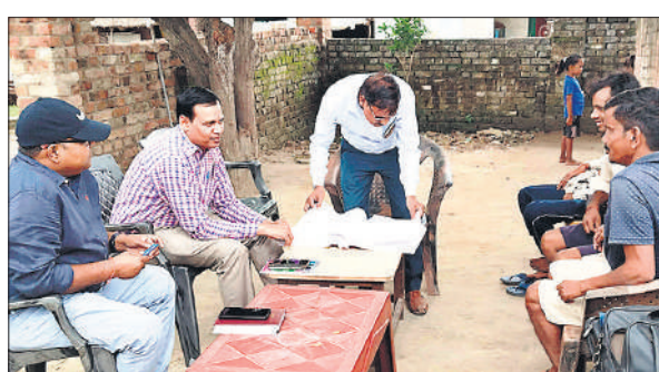
गन्ना सर्वे सट्टा प्रदर्शन के दौरान किसानों को जानकारी देते डीसीओ।

जनपद में गन्ना विभाग द्वारा गन्ना सर्वे का कार्य पूर्व में पूरा किया जा चुका है। सर्वे रिपोर्ट के मुताबिक इस बार जनपद में 1.02 लाख हेक्टेयर गन्ने की फसल बोई गई है। इसके बाद 20 जुलाई से जनपद के 1207 गांवों में ग्राम