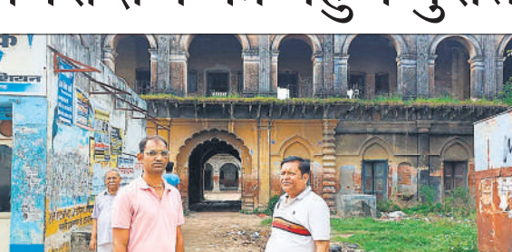
समामाजिक कार्यकर्ता संग मूलचंद धर्मशाला को देखने पहुंचे पुरातत्व विभाग के अधिकारी।

अमृत विचार: राज्य पुरातत्व निदेशालय से आए सहायक पुरातत्व अधिकारी ने अमरिया तहसील भवन समेत शहर के ऐतिहासिक धरोहरों का निरीक्षण किया। इस दौरान उन्होंने नगर पालिका के टाउन हॉल का भी निरीक्षण किया। वर्तमान में अमरिया तहसील चर्चनित भूमि पर बने सिंचाई विभाग के भवन में संचालित की जा रही है। इस नवसृजित तहसील का भवन बनाया जाना है। चर्चनित भूमि पर सिंचाई विभाग का डाक बंगला बना हुआ है। पीडब्ल्यूडी की ओर हैरिटेज बिल्डिंग को तोड़े जाने के बाद ही भवन निर्माण की बात कही है। वहीं, शासन ने अमरिया तहसील भवन के निर्माण के लिए जारी शासनादेश में