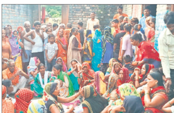
बिलख रही मृतक की पत्नी को दांडस बंधाती महिलाएं