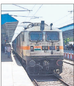
रेलवे स्टेशन लखीमपुर।

मैलानी से डालीगंज के बीच ट्रेन चलते काफी दिन बीत चुके हैं। मगर, अब तक दैनिक यात्रियों को सुबह नौ से दस के बीच लखीमपुर पहुंचने और वापसी करने के लिए शाम चार से पांच के बीच ट्रेन की सौगात नहीं मिली है। जबकि जिला मुख्यालय पर रोजाना तिकुनियां, बेलरायां, पलिया से लेकर मैलानी, बांकेगंज, गोला व फरधान आदि से