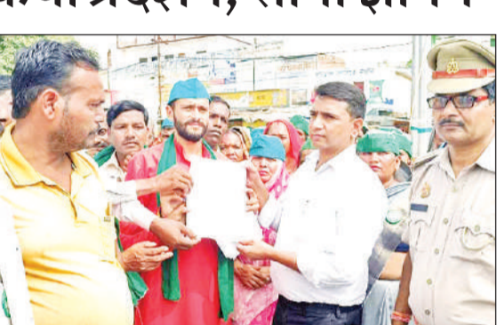
नायब तहसीलदार को ज्ञापन देते किसान।

अमृत विचार : किसान मजदूर सेवा कल्याण समिति के कार्यकर्ताओं ने रैली निकालकर डीएम को संबोधित ज्ञापन नायब तहसीलदार को सौंपा। इस दौरान समिति कार्यकर्ताओं ने राजीव चौक पर प्रदर्शन भी किया। ज्ञापन में आवारा पशुओं की समस्याओं से निजात दिलाए जाने, सभी पात्रों को प्रधानमंत्री आवास योजना का लाभ दिए जाने, सदापुर से समुलिया होते हुए पंचायत तक दो किलोमीटर मार्ग का निर्माण कराए जाने, नवाबपुर गंगा पुल के पार