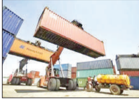
● जीटीआरआई ने कहा- कंपनियों के उपयोगिता से आपूर्ति शृंखला के जोखिम को कम कर सकते हैं कम