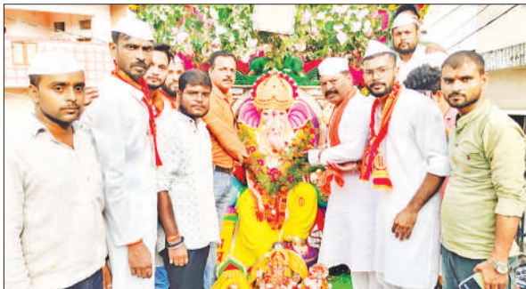
विसर्जन के लिए गणपति बप्पा को ले जाते आयोजक मंडल के सदस्य।

शोभायात्रा बहादुरगंज, मशीनी मार्केट, घंटाघर, कच्चा कटरा मोड़, चौक, चारखंबा होते हुए गर्रां घाट पहुंची, जहां पारंपरिक ढंग से गणपति जी पूजा कर भोग लगाया गया और महाआरती के बाद उन्हें गणपति बप्पा