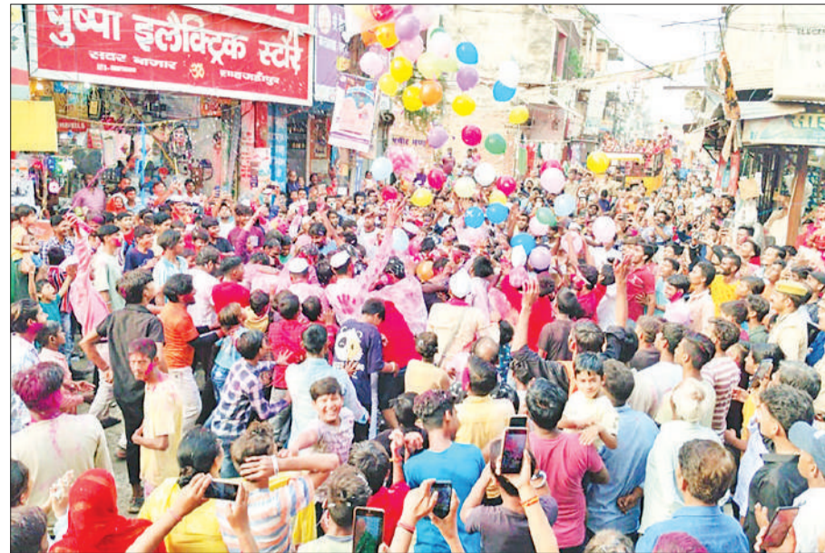
शाहजहांपुर के महाराजा की विसर्जन यात्रा में उमड़े श्रद्धालु।