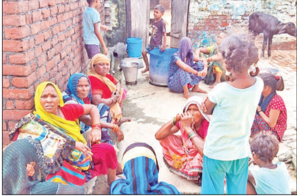
युवक की मौत पर विलाप करती परिजन।

अमृत विचार : घर से आठ दिन से लापता युवक गांव की एक महिला के साथ आपत्तिजनक अवस्था में पति ने देख लिया। कमरे में वह दृश्य देखकर पति आपा खो बैठा और युवक को जमकर पीटकर मरणासन्न हालत में खेत में फेंक दिया। अस्पताल ले जाते समय उसकी रास्ते में मौत हो गई। युवक के परिजनों ने महिला के परिजनों पर हत्या का आरोप लगाते हुए तहरीर दी है।