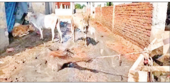
मृत गोवंश को ट्रैक्टर से बांधकर खींचते गोशाला कर्मचारी।