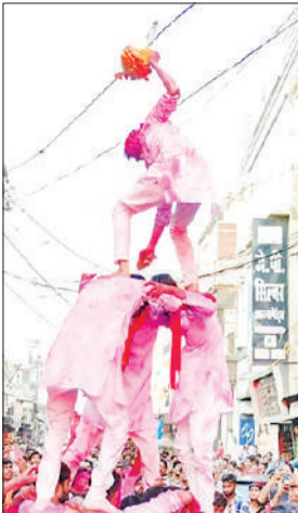
विसर्जन शोभायात्रा के दौरान मटक की फोड़ते मराठा युवा।