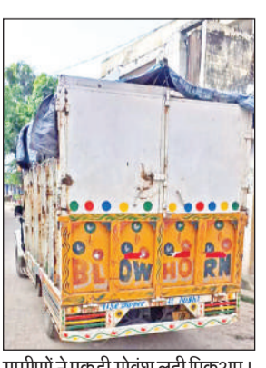
ग्रामीणों ने पकड़ी गोवंश लदी पिकअप।

अमृत विचार : गोवंश भरी पिकअप को ग्रामीणों ने पकड़ लिया। सूचना मिलने पर पुलिस मौके पर पहुंची। आरोप है कि पुलिस ने गोवंश को पिकअप से बाहर उतारा और चालक को भेज दिया। मामला अधिकारियों तक पहुंचा तो पुलिस ने पिकअप को चालक समेत पकड़ लिया। रविवार दोपहर लगभग एक बजे एक पिकअप बरेली-मथुरा राजमार्ग से गांव पुठी सराय होते हुए गांव मोहम्मदी की ओर जा रही थी। गांव पुठी सराय की बाजार में बैठे लोगों को शक हुआ तो उन्होंने पिकअप रोकने के लिए इशारा किया। चालक