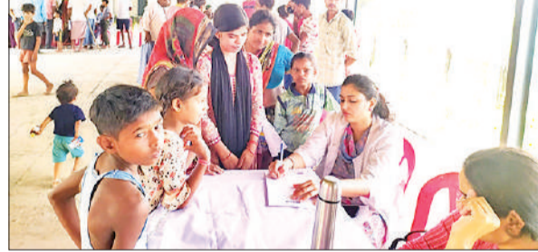
शिविर में मरीजों की जांच करती डॉक्टर।

कार्यालय संवाददाता, शाहजहांपुर अमृत विचार: वरुण अर्जुन मेडिकल कॉलेज एवं रोहिलखंड अस्पताल बंथरा की ओर से रविवार को भावलखेड़ा क्षेत्र के ग्राम जमुका में मुफ्त स्वास्थ्य शिविर का आयोजन किया गया।