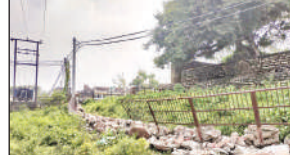
सीताराम मंदिर की बाउंड्रीवाल गिरने के बाद पड़ा मलबा।