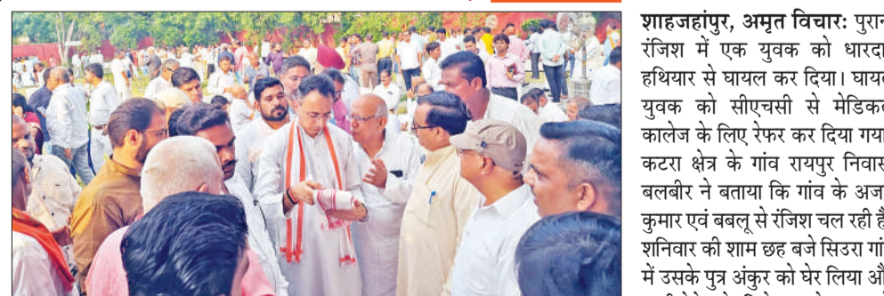
प्रसाद भवन में पदाधिकारियों से मिलते केंद्रीय वाणिज्य एवं उद्योग राज्य मंत्री जितिन प्रसाद।

अमृत विचार : केंद्रीय वाणिज्य, उद्योग और इलेक्ट्रॉनिक्स एवं सूचना प्रौद्योगिकी राज्य मंत्री जितिन प्रसाद ने रविवार को अपने आवास पर जिले भर से आए जनप्रतिनिधि, पार्टी के पदाधिकारी और कार्यकर्ताओं से मुलाकात की। मुलाकात के दौरान उन्होंने सभी से आह्वान किया कि वह अपने-अपने क्षेत्रों में जनता की समस्याओं का निराकरण कराएं। उन्होंने कहा कि जिस प्रकार प्रधानमंत्री बिना रुके, बिना थके राष्ट्र के समग्र विकास के लिए अपने जीवन को समर्पित किए हुए उसी प्रकार हम सभी को अपने-अपने क्षेत्रों में जनता के लिए समर्पित रहना चाहिए। कहा कि आज भाजपा ऐसे ही नहीं विश्व की सबसे बड़ी पार्टी बनी है, इसके पीछे सभी कार्यकर्ताओं का परिश्रम शामिल है। सभी अपने-अपने