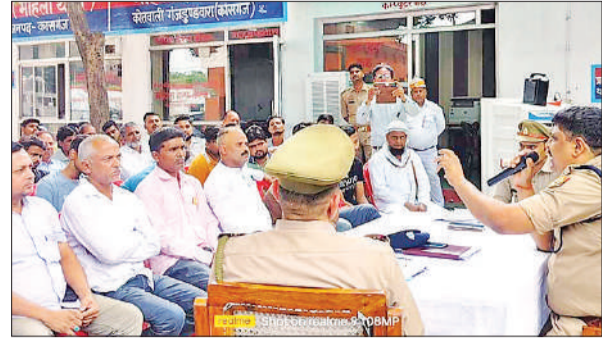
गंजडुडवारा थाने में आयोजित पीस कमेटी की बैठक को संबोधित करते अधिकारी।