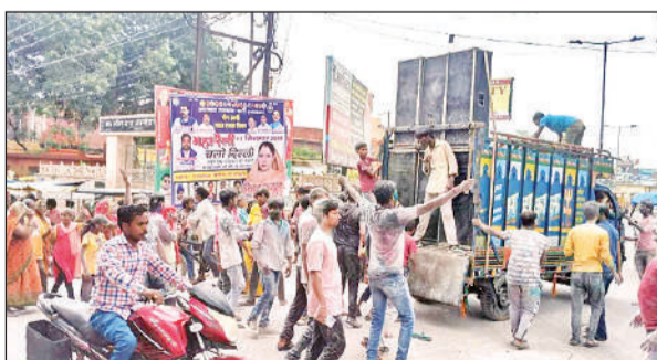
शहर में निकाली गई गणेश विसर्जन यात्रा में नाचते थिरकते गणेश भक्त।

गणेश महोत्सव के आठवें दिन रविवार को शहर मोहल्ला जय जयराम स्थित पल्लेदार गली, राम जानकी मंदिर, बसंत राय गली मोहल्ला जय जयराम के अलावा शहर के पीएलजीसी कॉलोनी चंदन नगर, नवाब गली धांविवाला से गणेश विसर्जन यात्रा निकाली गई। इसमें शामिल भक्त भजनों की धुन पर नाचते रहे।