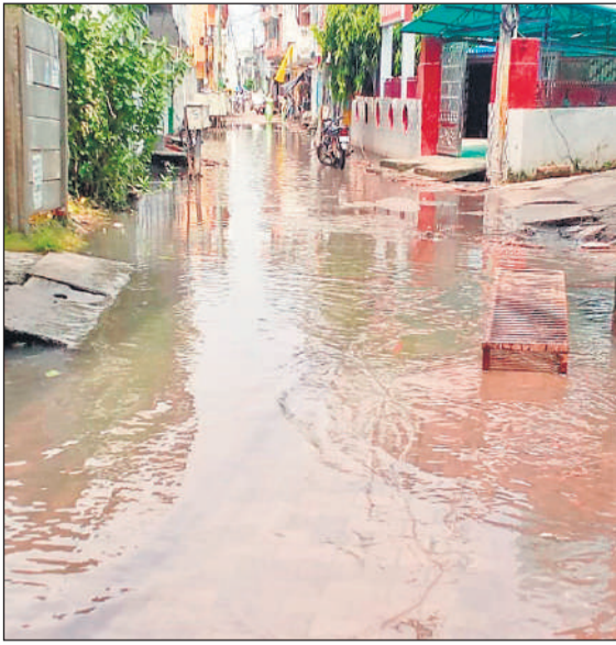
मधुवन कॉलोनी में रोड पर भरा पानी।

एक ओर सड़कों का जाल बिछा रही है। वहीं दूसरी ओर शहर में ऐसे मोहल्ले भी हैं जो आज भी जलभराव की समस्या से दिन रात जूझ रहे हैं। छोटे स्कूली बच्चे महिलाएं मात्र तीस मीटर में जलभराव पार करने को ई रिक्शा चालकों को पांच रुपए किराया देकर दूसरी पार पहुंच रहे हैं। मोहल्ले के लोग दिन रात