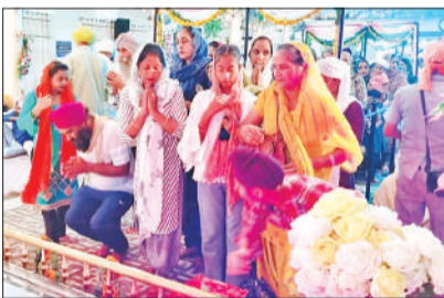
गुरु ग्रंथ साहिब के दरबार में मत्था टेक आशीष लेते श्रद्धालु।