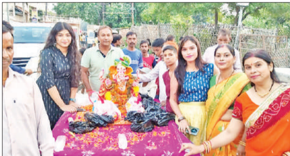
धनुमधाम में विसर्जन के लिए गणपति बप्पा की प्रतिमा लेकर पहुंचा परिवार।