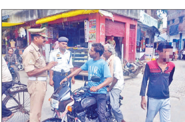
बाइक चालकों को यातायात के नियमों की जानकारी देते टीएसआई।

यातायात पुलिस ने शहर में अलग-अलग स्थानों में चेकिंग अभियान चलाया। इस दौरान 25 तेज रफ्तार वाले वाहनों का चालान भी शामिल रहा। वहीं एक नाबालिग के वाहन चलाने पर वाहन को सीज किया गया। यातायात पुलिस ने राज कोल्ड स्टोर, बाईपास, अमांपुर रोड, बस स्टैंड, सोरों गेट, बिलराम गेट चौराहा, नंदरई गेट, हजारा नहर क्षेत्र में चेकिंग अभियान चलाया। इस दौरान मोडिफाइड साइलेंसर, डिंक एंड ड्राइव, दोपहिया वाहन पर तीन सवारी, बिना हेल्मेट के