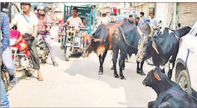
अमृत विचार बेखौफ... कच्चे कटरा मोड़ पर सड़क पर कब्जा जमाए चल रहे पशु।

महानगर में पुवायां रोड पर चिनौर के पास अवंतीबाई पार्क के सामने पशुओं का जमावड़ा रहता है, वहीं दूसरा जमावड़ा चिनौर में ही कैट को जोड़ने वाली सड़क पर रहता है। यहीं हा कटियाटोला, तारिन बहादुरगंज, खिरनोबाग, दिलाजाक, मोहम्मदजई, खलीलगंजी, बक्सरियां, चौबुर्जी आदि की तंग गलियों में छुट्टा पशु घूमते हुए देखे जा रहे हैं। खिरनोबाग में सुदामा चौराहा से सदर कोतवाली की ओर जाने वाले मार्ग पर बिस्मिल पार्क के पास पशु जमे रहते हैं। दिन में पशुओं की संख्या कम मिलेगी क्योंकि यह इधर-उधर घूमते रहते हैं, लेकिन शाम होते ही बिस्मिल पार्क के पास