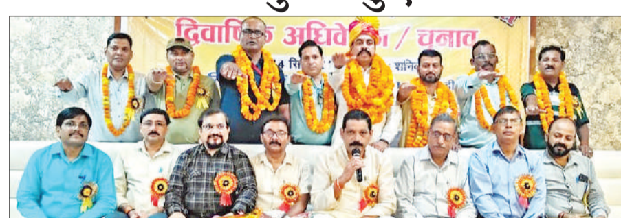
शाश्य ग्रहण करते नव निर्वाचित पदाधिकारी।

इस दौरान उन्होंने कहा कि इस समय फार्मासिस्ट समस्याओं से जूझ रहे हैं। उन्होंने फार्मासिस्ट के वेतन विसंगतियों के बारे में बताया कि आंदोलन के परिणाम स्वरूप सिर्फ दो सालों के बाद ही नॉन फंक्शनल ग्रेड पे 4200 सिर्फ फार्मासिस्टों को ही मिलता है। बताया कि हमें वेतनमान केंद्र के अनुसार मिलता है लेकिन केंद्र के फार्मासिस्टों के और राज्य के फार्मासिस्टों के कार्यों में जमीन-आसमान का अंतर है। राज्य के फार्मासिस्ट कार्य के बोझ से दबे हैं। उन्होंने पुरानी पेंशन के मांग को आवश्यक बताते हुए इसके लिए सरकार से मांग करने