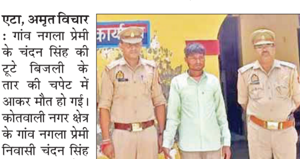
पुलिस की गिरफ्तार में आरोपी।