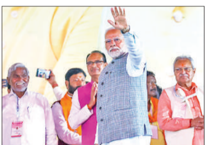
जमशेदपुर में परिवर्तन महारैली के दौरान लोगों का अभिवादन करते प्रधानमंत्री मोदी।

यांगून। म्यांमार में भीषण बाढ़ के कारण मरने वालों की संख्या 74 हो गई है, जबकि 89 लोग लापता हैं। ग्लोबल न्यू लाइव ऑफ म्यांमार की रिपोर्ट में कहा गया कि भारी बारिश के कारण आई बाढ़ ने पी ताव, बागो, मांडले और अय्यावाडी क्षेत्रों के साथ-साथ मोन, कायिन और शान राज्यों के 64 बस्तियों के 462 गांवों और वार्डों को प्रभावित किया है। बाढ़ के कारण 13 सितंबर की शाम तक मृतकों की संख्या बढ़कर 74 हो गयी। रिपोर्ट के मुताबिक आपदा के कारण बाढ़ प्रभावित क्षेत्रों में 24 पुल, 375 स्कूल, एक मठ, पांच बांध, 456 लैंप-पोस्ट और 65,759 मकान नष्ट हो गए।