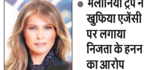
मेलानिया ट्रंप ने खुफिया एजेंसी पर लगाया निजता के हनन का आरोप

मेलानिया ने 'एक्स' पर एक वीडियो में कहा, "मैंने कभी नहीं सोचा था कि अमेरिकी सरकार मेरी निजता का हनन करेगी। एफबीआई ने फ्लोरिडा में मेरे घर पर छापा मारा और मेरे निजी सामान की तलाशी ली। यह सिर्फ मेरी कहानी नहीं है, यह सभी अमेरिकियों के लिए एक चेतावनी है। याद रखने की बात है कि