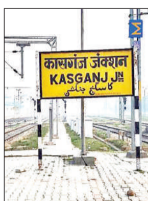
कासगंज रेलवे स्टेशन।

फिरोजाबाद-कासगंज के बीच नई रेल लाइन बनाने पर पूर्वोत्तर रेलवे के इञ्जतनगर मंडल का यह ट्रैक सीधे टनकपुर से जुड़ जाएगा। इससे फिरोजाबाद के टूंडला स्टेशन से बरेली व टनकपुर तक ट्रेनें चलेंगी। हालांकि, इसकी मांग लंबे समय से चल रही थी, लेकिन यह मांग पूरी नहीं हो पा रही। पिछले दिनों इसके लिए हरी झंडी मिल चुकी है। वैसे तो इसके आम बजट में संकेत मिले थे, लेकिन