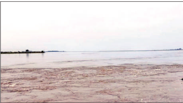
उसहैत इलाके में उफान मारती गंगा।

उसहैत इलाके के निचले इलाकों में गंगा का पानी पहुंच चुका है जिससे जटा, प्रेमी नगला, असमिया रफतपुर, कमलैयापुर टंकुरी नगला सहित दर्जन भर गांव टापू बन गए