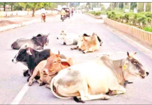
रोसर कोटी क्षेत्र में सड़क पर कब्जा जमाए बैठे पशु।