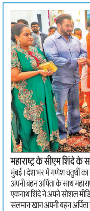
महाराष्ट्र के सीएम शिंदे के साथ सलमान खान ने मनाई गणेश चतुर्थी...