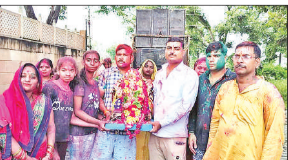
अमांपुर कस्बे से गणेश की प्रतिमा को विसर्जन को ले जाते गणेश भक्त।

पांडालों से लेकर कछला तक जमकर अबीर गुलाल उड़ाया। गंगा में गणेश की प्रतिमा को विसर्जित किया गया। इस दौरान भक्तों ने गणपति बप्पा मोरया अनंत बरस तू जल्दी आ की प्रार्थना कर उन्हें विदा कर दिया।