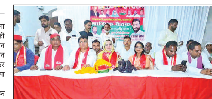
गनेशपुर में समाजवादी पार्टी की बैठक में मंचासीन पदाधिकारी।

गनेशपुर स्थित रोज वैली पब्लिक स्कूल में आयोजित बैठक का आयोजन अल्पसंख्यक प्रकोष्ठ के जिलाध्यक्ष असहाब हुसैन की देखरेख में हुई। बैठक में मुख्य अतिथि पटियाली विधायक नादिरा सुल्तान रहें। इस मौके पर विधायक नादिरा सुल्तान ने कहा कि समाजवादी पार्टी ने हमेशा दलित अल्पसंख्यक और पिछड़ा वर्ग की लड़ाई लड़ी है। भाजपा सरकार हमेशा से आरक्षण के खिलाफ रही है। अल्पसंख्यकों की विरोधी है। देश में जब से भाजपा सरकार आई है छात्र और नौजवानों का रोजगार छीन रही है। पीडीए से उपेक्षापूर्ण व्यवहार हो रहा है। राष्ट्रीय