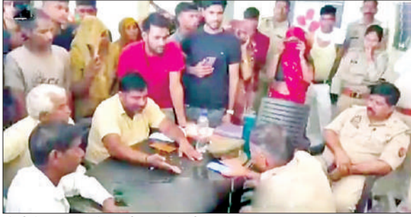
चौकी में थानाध्यक्ष से बातचीत करते ग्रामीण।