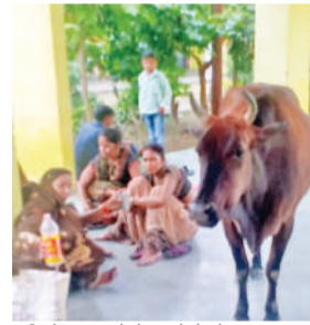
वाई और बरामदे में घूमते हैं गौवंश।