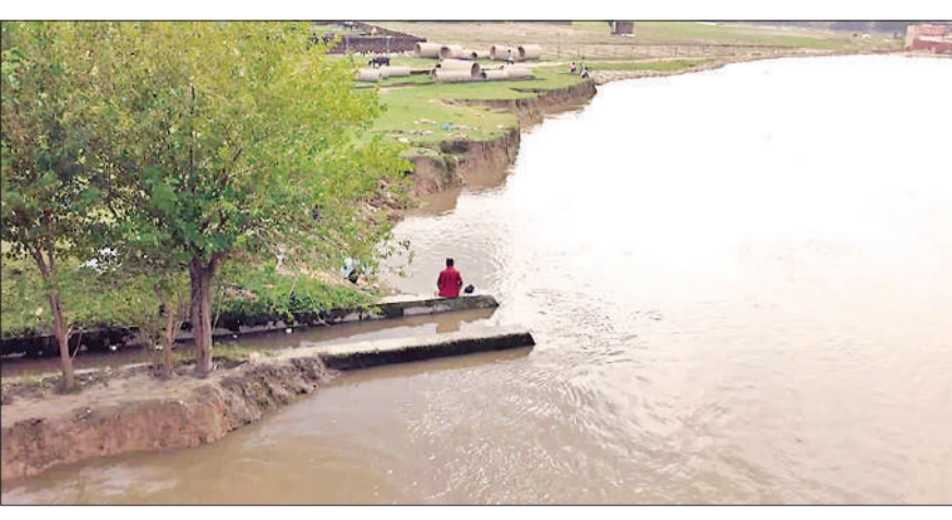
रविवार को बढ़ा हुआ दर्ज किया गया गर्रा का जलस्तर।

बढ़ते जलस्तर की चपेट में कई गांव : खुदागंज में गर्रा नदी में बढ़ रहे जलस्तर के चलते कई गांव बाढ़ की चपेट में आने की संभावना है। क्षेत्र के गांव होशीपुर के प्राथमिक विद्यालय व गांव के कई स्थानों पर पानी पहुंच गया है। इसके साथ ही आधा दर्जन से अधिक अन्य गांव भी बाढ़