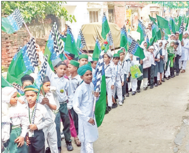
ईद मिलादुन्नबी का जुलूस निकालते मदरसा अतारिया के बच्चे।