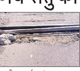
पुल की अलग हुई ज्वाइंट।

वर्षों में धीरे-धीरे पुल की बढ़ चुकी उम्र व भारी वाहनों के आवागमन के भार में बेतहाशा वृद्धि हुई है। जिससे पुराने हो चुके पुल की हालत काफी जर्जर है। रिपेयरिंग के कारखाने किसी तरह आवागमन चालू है, लेकिन पुल पर गड्ढा युक्त सरिया ईंगल ऊपर निकल कर उभरा हुआ है। जिससे गाड़ियों में फंसने का खतरा है, स्थिति दयनीय है। पुल पर ज्वाइंट की दरारें जानलेवा रूप धारण कर चुकी हैं। जिसके कारण आए दिन जाम का भी सामना करना पड़ता है। इससे लोगों में काफी संशय है। मालूम हो कि उक्त मार्ग को स्टेट हाइवे से 2006में नेशनल हाइवे की मंजूरी बाद भी संजय सेतु घाघरा पर नया