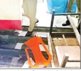
विद्युत उपकेंद्र वशीरगंज में हुई तोड़फोड़

अमृत विचार। शहर के मोहल्ला वशीरगंज और नाजिरपुरा मोहल्ले में सोमवार सुबह से बिजली नहीं आई। इससे नाराज लोग देर रात को उपकेंद्र पहुंचे। सभी ने उपकेंद्र में तोड़फोड़ की। रजिस्टर फाड़ डाले। भीड़ को तितर बितर करने के लिए पुलिस को लाठी चलानी पड़ी। काफी देर बाद लोग उपकेंद्र से बाहर हटे।