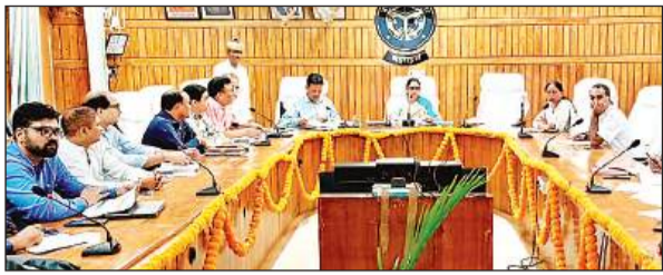
कलेक्ट्रेट में स्वास्थ्य समिति की बैठक को संबोधित करती डीएम।

अमृत विचार। कलेक्ट्रेट में जिला स्वास्थ्य समिति की बैठक जिलाधिकारी मोनिका रानी की अध्यक्षता में हुई। डीएम ने नोडल अधिकारियों को निर्देश दिया कि वे स्वास्थ्य केन्द्रों का नियमित रूप से निरीक्षण करें तथा शासन द्वारा संचालित योजनाओं की गहन समीक्षा कर आमजन को मानक के अनुसार चिकित्सा सुविधा मुहैया कराना सुनिश्चित करें। उन्होंने कहा कि ग्राम स्वच्छता समिति और पोषण समिति के खाते में सरकार की ओर से भेजा जा रहा डंप है। ऐसे में जब तक इसका उपयोग न हो, तब तक सीएचसी अधीक्षक का वेतन बाधित कर दें। डीएम मोनिका रानी ने बैठक में