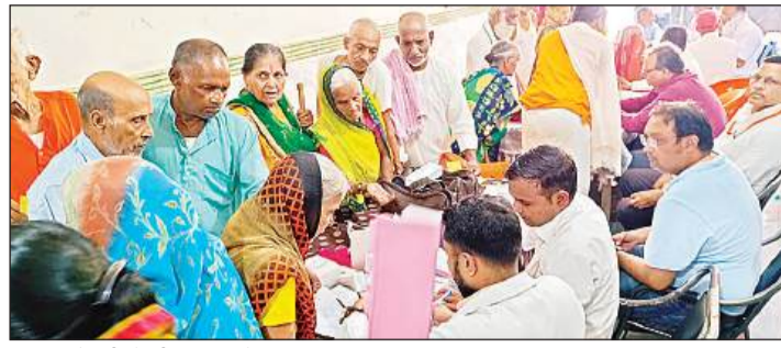
वृद्धाश्रम में मरीजों की जांच करते चिकित्सक।