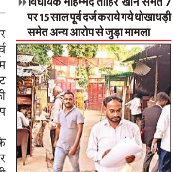
देवीानी न्यायालय परिसर में वादकारी व अधिवक्तागण।