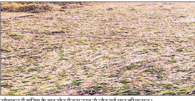
सोहावल में बारिश के बाद खेत में इस तरह से लोट गई धान की फसल।

इस साल शुरुआती मौसम ठीक नहीं रहा। पहली बारिश के बाद बीच में पर्याप्त बारिश नहीं हुई। किसानों को खेतों में पानी लगाकर फसल बचानी पड़ी, लेकिन जाते मानसून ने सितंबर के अंतिम चार दिनों में कहर बरपा दिया। लगभग 200 मिमी बारिश रिकॉर्ड की गई। 26 सितंबर को बारिश की शुरुआत तेज हवा के साथ हुई। इससे धान, गन्ने और केले की फसलें खेतों में गिर गईं। कई