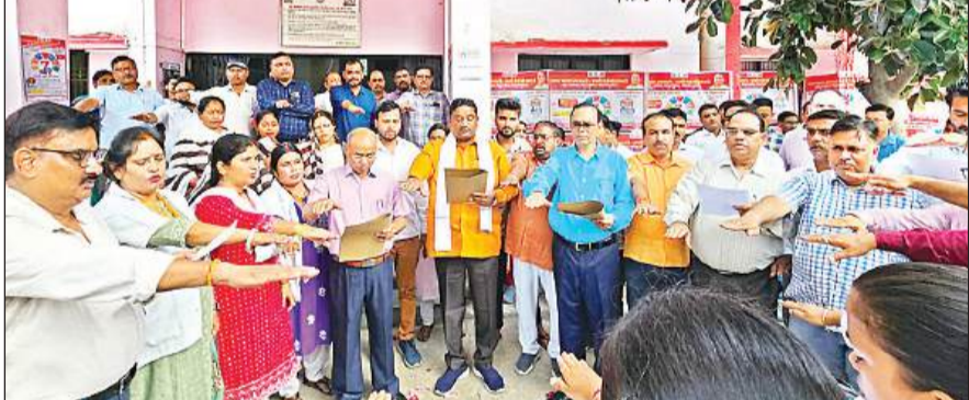
अधिकारियों व कर्मचारियों को संचारी रोग नियंत्रण की शपथ दिलाते सदर विधायक, सीएमओ।

सदर विधायक पल्लूराम द्वारा उपस्थित अधिकारियों, कर्मचारियों को दस्तक व संचारी अभियान का शपथ दिलाया गया। विशेष संचारी रोग नियंत्रण अभियान 31 अक्टूबर 2024 तक चलेगा तथा दस्तक अभियान ग्यारह से इकतीस अक्टूबर तक चलेगा। संचारी रोग