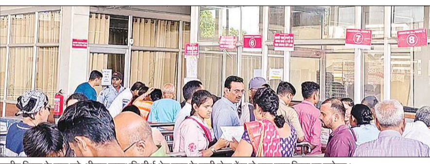
सुग्रीव किला के पास बने श्रीराम जन्मभूमि तीर्थ क्षेत्र ट्रस्ट के यात्री सेवा केंद्र से पास प्राप्त किया जा सकेगा।

अमृत विचार : राममंदिर में दर्शन के लिए आने वाले श्रद्धालुओं के लिए श्रीराम जन्मभूमि तीर्थ क्षेत्र ट्रस्ट ने मंगलवार से विक्क पास की व्यवस्था शुरू कर दी है। इस व्यवस्था के तहत दूर-दराज से आने वाले श्रद्धालु तीर्थ यात्री सेवा केंद्र से विक्क पास लेकर कम समय में रामलला के दर्शन कर सकेंगे। इसके लिए हर दो घंटे में 50 पास दिए जाने की अभी है सुविधा