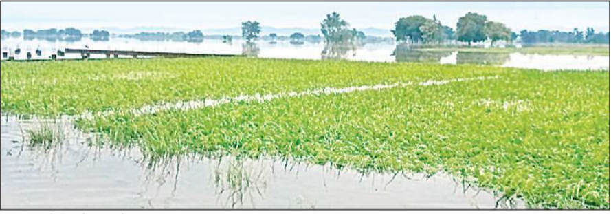
बाढ़ के पानी में डूबी धान की फसल।

किसानों की कम नहीं हो रही मुसीबतें, हजारों एकड़ धान की फसल बाढ़ के पानी में डूबी