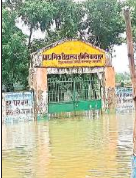
परिषदीय स्कूल में घुसा बाढ़ का पानी।