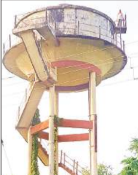
पानी की टंकी पर चढ़ा सफाई ठेकेदार।

करनैलगंज, अमृत विचार: कार्य से हटाए जाने पर एक सफाई ठेकेदार मंगलवार की सुबह पानी की टंकी पर चढ़ गया और टंकी से कूदकर जान देने की धमकी देने लगा। युवक को पानी की टंकी पर चढ़ा देख पुलिस व प्रशासन के अधिकारी मौके पर पहुंचे और उसे समझाने की कोशिश की लेकिन वह अपनी जिद पर अड़ा रहा। आरोप लगाया कि मंडी प्रशासन ने उसका टेंडर निरस्त कर उसे सफाई कार्य से विरत कर दिया है, जिससे अब वह बेरोजगार हो गया है।