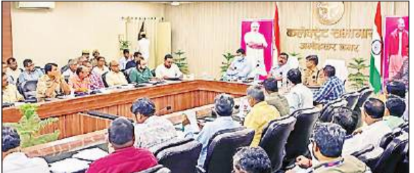
जिला व्यापार बंधु की बैठक को संबोधित करते जिलाधिकारी, सीडीओ ।

जिलाधिकारी ने उद्यमिता विकास संस्थान में चलाए जाने वाले प्रशिक्षण कार्यक्रमों की जानकारी ली और उद्यमियों का सहयोग करने के निर्देश दिए। उन्होंने जनपद में प्राप्त एमओयू प्रस्तावों को स्थापित करने के लिए भूमि उपलब्ध कराने के लिए किए