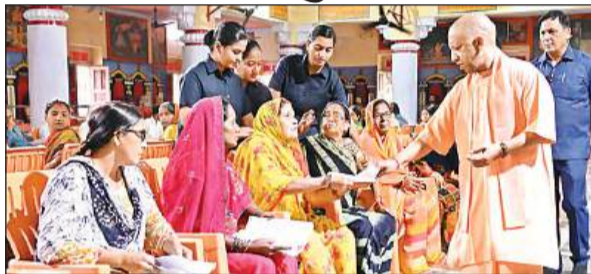
जनता दर्शन में लोगों से मिलते मुख्यमंत्री योगी आदित्यनाथ।

सोमवार को सुबह मुख्यमंत्री योगी आदित्यनाथ ने गोरखनाथ मंदिर परिसर के महंत दिग्विजयनाथ स्मृति भवन में आयोजित जनता दर्शन में करीब 200 लोगों से