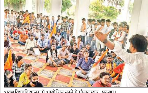
अवध विश्वविद्यालय में आयोजित धरने में मौजूद छात्र-छात्राएं।