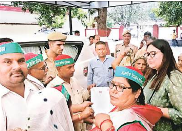
डीएम को ज्ञापन देते किसान क्रांति यूनियन के सदस्य।