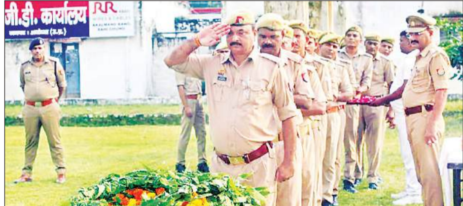
हादसे में मृत अग्निशमन विभाग के मुख्य आरक्षी लीडिंग फायरमैन को अंतिम सलामी देते कर्मियों।