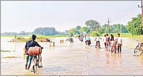
दतरंगवा डिप पर बह रहे बाढ़ के पानी से गुजरते लोग।