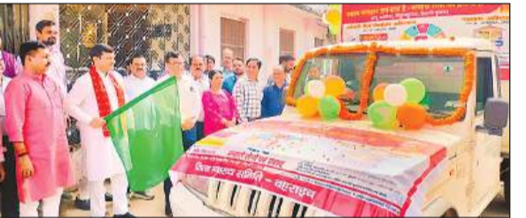
सीएमओ कार्यालय से जागरूकता रैली को हरी झंडी दिखाते सांसद।