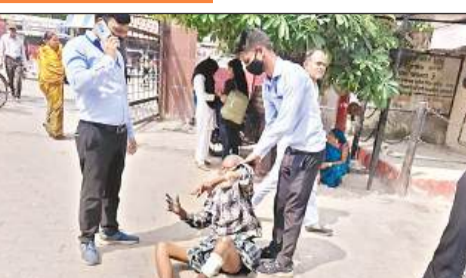
जिला अस्पताल की इमरजेंसी ओपीडी के बाहर पड़े मरीज को उठाने सुरक्षाकर्मी।

कक्ष से हिलचेयर गायब, किसी तरह कराया भर्ती जमीन पर पड़े बुजुर्ग की फोटो खींचते ही मौके पर दो गार्ड पहुंच गए। तबीरी ने पीछे टिनशेड के नीचे हिलचेयर कक्ष बनाया गया है। वहां हिलचेयर भी नहीं थी। बुजुर्ग को किसी तरह से उठाकर इमरजेंसी ओपीडी में जाने वाले स्लॉप पर बैठाया गया। इसके बाद उसे ले जाकर इंपनटी वार्ड में भर्ती किया गया।