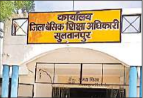
बीएसए कार्यालय भवन।

अब समस्त प्रकार के बोर्ड से संचालित एक से 12 तक के विद्यार्थियों का अपार (आटोमेटिक