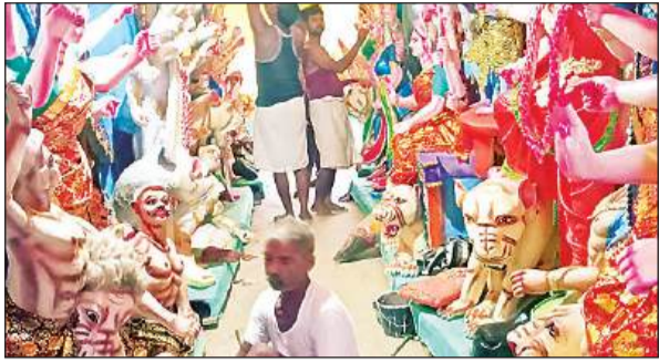
दुर्गा प्रतिमाओं को अंतिम रूप देते कलाकार ।

तीन अक्टूबर से शुरू हो रही दुर्गा पूजा को लेकर जनपद में पूजा पंडालों को तैयार करने में कारीगरों के हाथ तेजी से चलने लगे हैं। शहर से लेकर ग्रामीण क्षेत्र तक न सिर्फ प्रसिद्ध मंदिर बल्कि