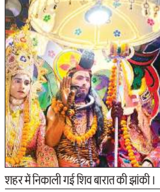
शहर में निकाली गई शिव बारात की झांकी।