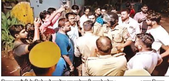
विद्युत कटौती के विरोध में उपकेंद्र पर नारेबाजी करते लोग।

आपूर्ति दी जाती है। मोहल्ले के लोगों के मुताबिक लगभग पांच दिन से बिजली नहीं मिल रही है। बिजली अधिकारियों ने सोमवार शाम तक आपूर्ति देने की बात कही, लेकिन रात तक सप्लाई शुरू नहीं हो पाई। इस पर नाराज मोहल्ले के लोग रात