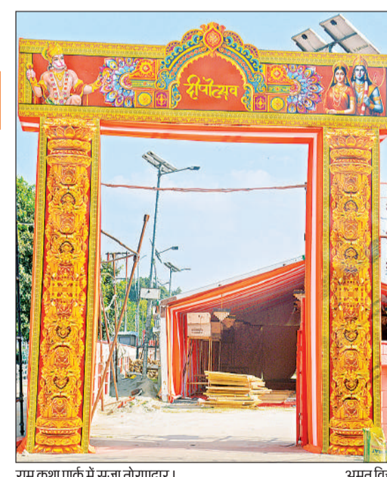
राम कथा पार्क में सजा तोरणद्वार। अमृत विचार

पर्यावरण संरक्षण का भी रखा गया ध्यान इस दीपोत्सव में पर्यावरण संरक्षण का भी विशेष ध्यान रखा गया है। मंदिर भवन के ढांचे को धुंसी की कालिख से बचाने के लिए परिसर में विशेष मोम के दीपक जलाए जाएंगे। जिनसे कार्बन उत्सर्जन न्यूनतम होगा। मंदिर ट्रस्ट का प्रयास है कि इस दीपावली में अयोध्या न केवल धर्म और आस्था का केन्द्र बने, बल्कि स्वच्छता और पर्यावरण संरक्षण का भी संदेश दे।