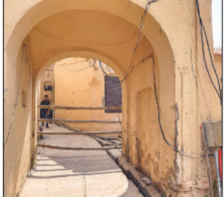
राम की पैड़ी से मिलने वाली गलियों में लगाई गयी बैरिकेडिंग।

राम की पैड़ी पर दीपोत्सव की तैयारी को लेकर पास धारकों के अलावा अन्य लोगों के आवागमन को प्रतिबंधित कर दिया गया है। घाटों पर लगाए गए स्वयंसेवक, दीपोत्सव से जुड़े अन्य अधिकारियों व पास धारकों को ही जाने की अनुमति दी जा रही है। नोडल अधिकारी प्रो. एस एस मिश्रा के मूलाधिक सभी घाटों पर दीपों को बिछाने का कार्य प्रारंभ कर दिया गया है। दीपोत्सव स्थल पर दीपों के बीच खड़े होकर लोग सेल्फी ले रहे हैं, जिस कारण टूटने का डर भी बना हुआ था।