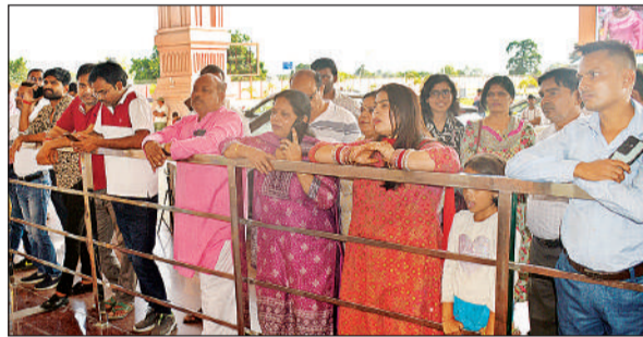
अपने जानने वाले यात्री को लेने के लिए खड़े लोग।