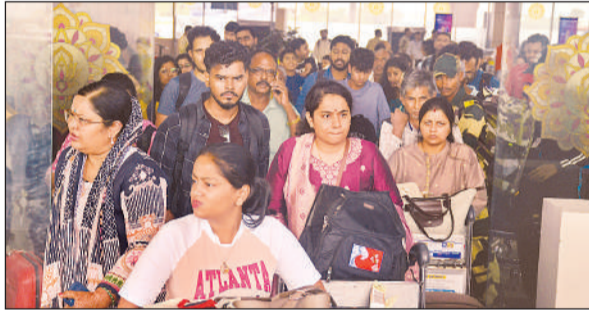
यात्रियों ने एयरपोर्ट से बाहर निकल रहत की सांस ली।

अकासा एयरलाइन्स के सोशल मीडिया प्लेटफॉर्म एक्स पर रविवार दोपहर साढ़े 12 बजे के करीब बम