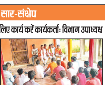
हरखापुर में बैठक करते पदाधिकारी।

को एक से ज्यादा कलस्टर हैं, वहां विकास खण्ड स्तर पर कार्यरत अन्य सरकारी कर्मचारी को सर्वेक्षण कार्य के लिए दायित्व सौंपे जाने पर विचार किया जा सकता है। डीएम ने बताया कि शासकीय कर्मचारियों की तैनाती के दृष्टिगत आवास साफ्ट पर ग्राम विकास अधिकारी, ग्राम पंचायत अधिकारी, ग्राम विकास अधिकारी और अभियन्ता लघु सिंचाई, अवर अभियन्ता ग्रामीण अभियन्त्रण सेवा तथा लेखपाल का पद नाम राज्य स्तर से भारत सरकार को प्रेषित करते हुए सर्वेक्षणकर्ता के रूप में इनकी तैनाती के लिए विकल्प प्राप्त किया गया है। डीएम ने बताया कि यदि एक सर्वेयर