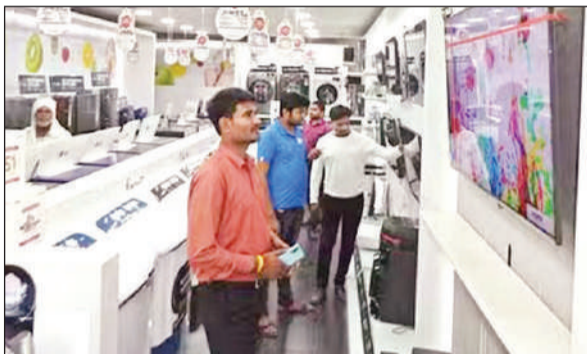
इलेक्ट्रॉनिक्स उपकरणों के शोरूम में उत्पाद देखते उपभोक्ता। अमृत विचार

धनतेरस की तैयारियों को लेकर जिले के दुकानदारों ने पहले ही माल मंगा लिया है। बर्तन की दुकानों, इलेक्ट्रॉनिक्स और वाहनों के शोरूमों को आकर्षक ढंग से सजाया गया है। बड़े व्यापारी दर्जनों छोटे डीलरों को माल भेज रहे हैं। कारोबारी धनतेरस पर अच्छे कारोबार की उम्मीद जता रहे हैं।