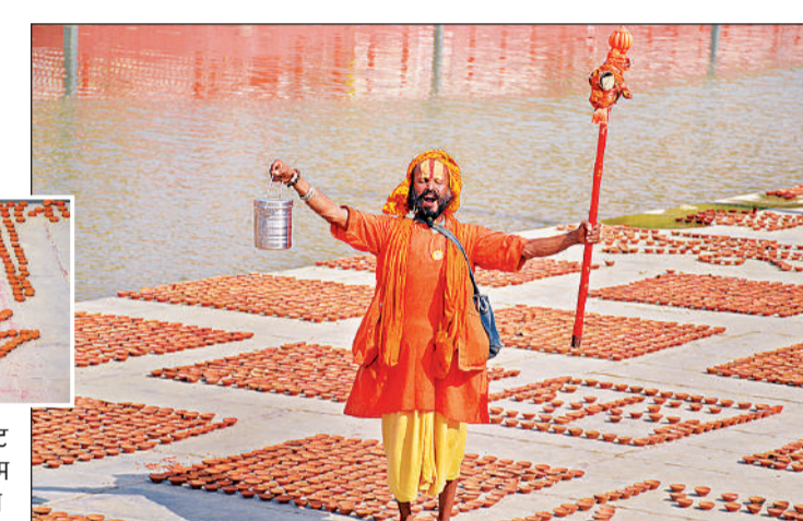
दीये बिछाने के दौरान घाट पर पहुंचे संत ने किया राम नाम का जयघोष एवं दीये से लिखा जय श्री राम।