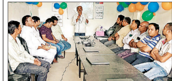
फ्रीडम इम्प्लाइविलिटी संस्थान की शाखा पर मौजूद लोग।

फ्रीडम इम्प्लाइविलिटी एकेडमी की 5वीं शाखा का उद्घाटन