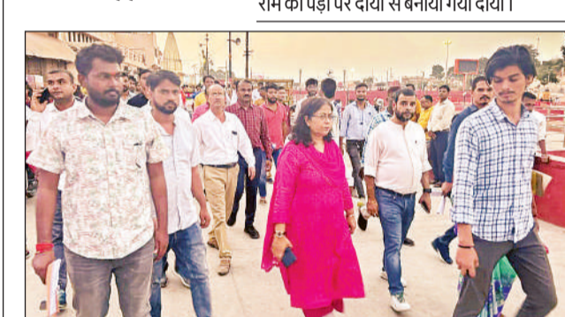
राम की पैड़ी पर रविवार को निरीक्षण करती कुलपति। अमृत विचार

कुलपति ने स्वयं सेवकों के लिए कराई सभी व्यवस्थाएं