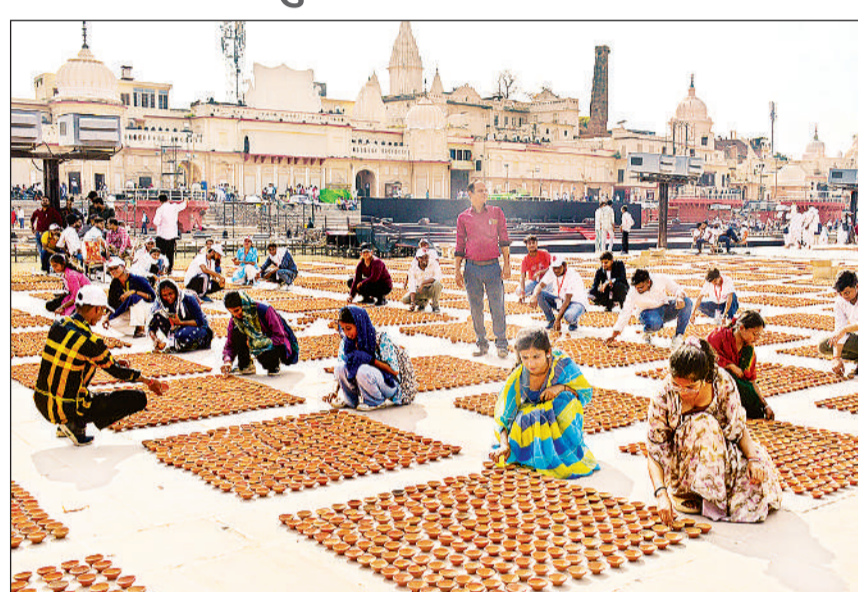
राम की पैड़ी पर समूह में दीये बिछाते स्वयं सेवक छात्र-छात्राएं।

राममंदिर में प्राण प्रतिष्ठा के बाद पहली बार होने जा रहे दीपोत्सव में आस्था और विश्वास की नवीन झलक देखनी है तो सरयू तीरे बसी राम की पैड़ी आइए। यहां 30 को राम की उपस्थिति में होने जा रहे दीपोत्सव के लिए दीये बिछा रहे स्वयंसेवक मर्यादा पुरुषोत्तम राम के प्रति अपनी श्रद्धा का भी प्रकटीकरण कर रहे हैं। ' ' की टीम रविवार को राम की पैड़ी पर पहुंची तो न केवल अलौकिक दृश्य मिला वरन् दीप सज्जा में आस्था और विश्वास का भी प्रस्फुटन दिखा। कई ब्लॉकों में पहली बार दीयों को अलग अंदाज में सजाया गया है। घाट नंबर एक से 20 तक बने विभिन्न ब्लॉकों में रामायण के प्रसंगों को उकेरने का प्रयास किया गया है। दीयों के जरिए कहीं श्रीराम लिखा गया है तो कहीं स्वास्तिक बनाया है। इसके अतिरिक्त मेरे आराध्य की अयोध्या, जय हनुमाना, राम धनुष, जय श्री राम को उकेरा गया है। आध्यात्मिक झलक दिखलाती दीयों की श्रंखला में 'मेरे राम सबके राम', 'अयोध्या दीपोत्सव में आपका स्वागत है' जैसी कलाकृतियां भी प्रदर्शित की गई है। दीयों को इस प्रकार से सजाया गया है कि 30 अक्टूबर की शाम प्रज्वलित होने के बाद राम की पैड़ी पर एक अलग अदभुत छटा लोगों को देखने के लिए मिलेगी। इसके अलावा भजन संध्या स्थल घाट, श्रीराम कथा पार्क के निकट चौधरी चरण सिंह घाट पर भी स्वयं सेवकों ने अपनी श्रद्धा दीयों की साज-सज्जा से निवेदित की है।