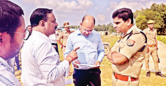
पचपेड़वा नगर पंचायत का निरीक्षण करते डीएम और एसपी।

इस दौरान उन्होंने ने नक्शा एवं अप्रिलेखों का अवलोकन किया एवं पहुंच मार्ग आदि का जायजा लिया। उन्होंने संबंधित विभागों के