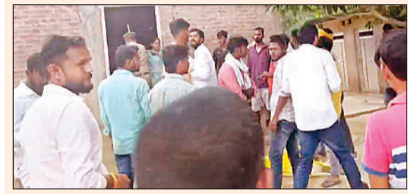
प्रार्थना सभा स्थल पर जुटी भीड़।