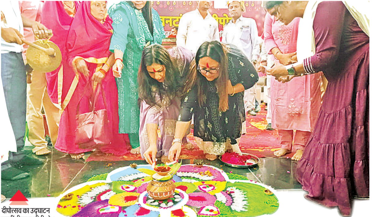
दीपोत्सव का उद्घाटन करती डीएम व सीडीओ।