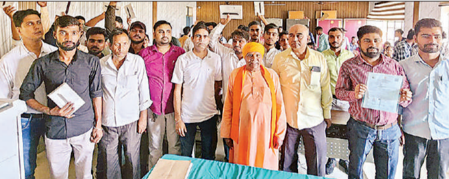
राजकीय औद्योगिक प्रशिक्षण संस्थान नौगढ़ में टेबलेट व प्रमाण पत्र के साथ प्रशिक्षणार्थी और विधायक।