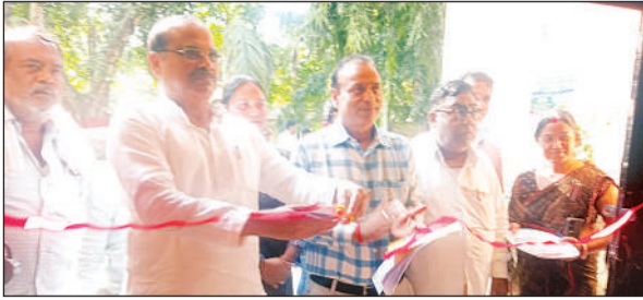
स्वयं सहायता समूह के स्टाल का उद्घाटन करते ब्लॉक प्रमुख।

अमृत विचार: राष्ट्रीय आजीविका मिशन के तहत संचालित समूह समय समय पर अपनी उपयोगिता को साबित करते रहे हैं। जश्ने आजादी के मौके पर समूहों द्वारा तैयार किए गए तिरंगे से जहां गली गली देश भक्ति का वातावरण तैयार होता है तो वहीं, इस बार नाथनगर ब्लॉक में संचालित एक समूह द्वारा तैयार किए गए दीपावली किट से इस बार की दीवाली रोशन होगी। ब्लॉक क्षेत्र के ग्राम सिसवनिया के समूह शिव शक्ति स्वयं सहायता समूह ने हाथ से बने दीवाली किट की ब्लॉक परिसर में स्टॉल लगाई तो लोगों ने