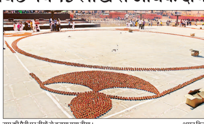
राम की पैड़ी पर दीयों से बनाया गया दीया। अमृत विचार

अयोध्या, अमृत विचार : दीपोत्सव-2024 के लिए सरयू के 55 घाटों पर दूसरे दिन रविवार को 10 लाख से अधिक दीये बिछाए गए, जबकि शनिवार को 5 लाख बिछाए गए थे। अब तक 15 लाख से अधिक दीये बिछाए जा चुके हैं। दो हजार से अधिक पर्यवेक्षक, समन्वयक, घाट प्रभारों, दीप गणना व अन्य सदस्यों की देखरेख में 30 हजार से अधिक स्वयं सेवक घाटों पर 28 लाख दीपों को सजाने का कार्य कर रहे हैं।