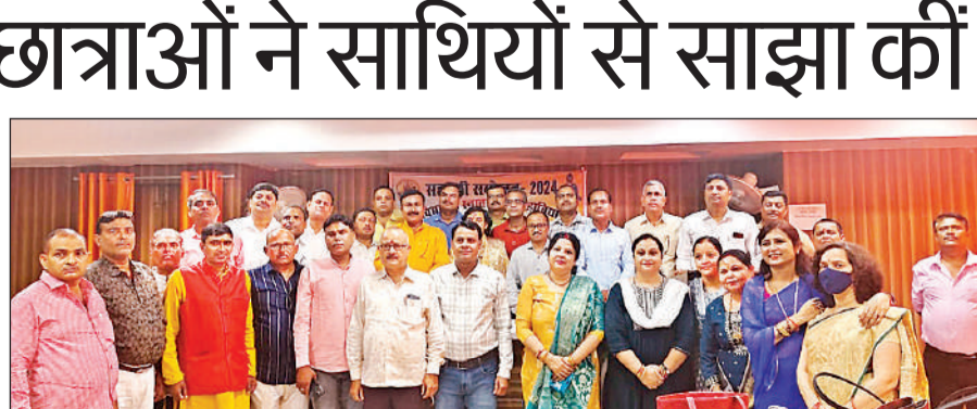
बुद्ध विद्यापीठ स्नातकोत्तर महाविद्यालय में सम्मेलन में मौजूद पूर्व छात्र-छात्राएं।