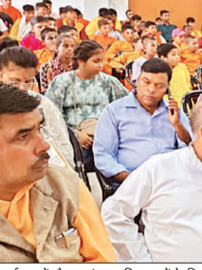
कार्यक्रम में मौजूद संस्कृत विद्यालयों के शिक्षक व विद्यार्थी।