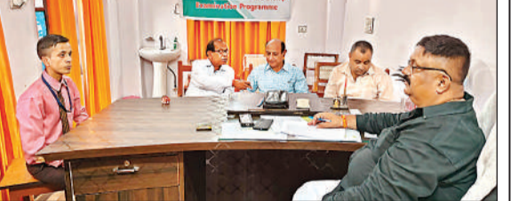
छात्रवृत्ति परीक्षा के दौरान मौजूद छात्र और शिक्षक।