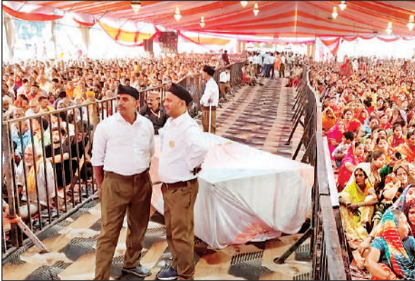
श्रीराम भद्राचार्य जी महाराज की कथा सुनने को उमड़ी भीड़।

संवाद, भीषण युद्ध, मेघनाथ का वध, सुलोचना का विलाप कर अपने पति का सिर राम से मांगती हैं। अहिरावण का जिन्न करते हुए कहा कि सही समय पर हनुमान वहां पहुंच जाते हैं। जहां उनका सामना अपने ही पुत्र मकरध्वज से हो जाता है। हनुमान उसे बंदी बनाकर और अहिरावण का वध कर मकरध्वज को राम के द्वारा पाताल लोक का राजा बना देते हैं। अंत में राम रावण का घमसात युद्ध होता है। परन्तु उसकी मौत नहीं होती। विभीषण राम को उसकी नाथि पर तीर मारने