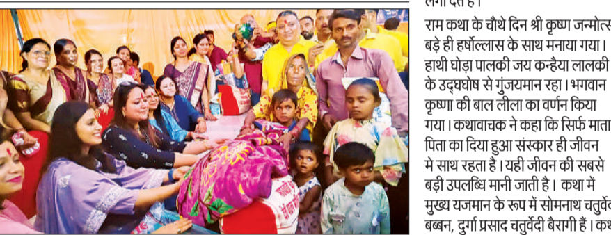
वनटांगिया परिवारों को कंबल वितरित करती डीएम।