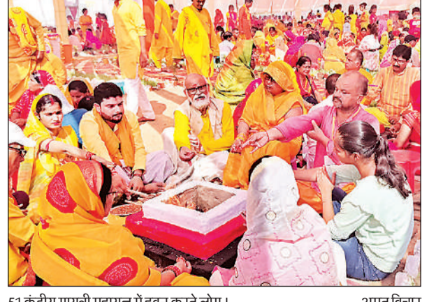
51 कुंडीय गायत्री महायज्ञ में हवन करते लोग।

अमृत विचार: अखिल विश्व गायत्री परिवार की ओर से क्षेत्र के कटरा शहबाजपुर मेला परिसर में 51 कुंडीय गायत्री महायज्ञ एवं विराट पुस्तक मेला का आयोजन किया गया है। जिसमें रविवार को 551 जोड़े श्रद्धालुओं ने एक साथ यज्ञ कुंड में आहुति डाली। प्रातः 7 बजे से 11 बजे तक चलने वाले 51 कुंडीय गायत्री महायज्ञ का आरंभ देवपूजन के साथ किया गया। मां गायत्री के दिव्य मंदिर में माल्यार्पण कर दीप प्रज्वलन के साथ धर्म की जय हो अधर्म का नाश हो उद्घोष के साथ शांतिकुंज के टोली