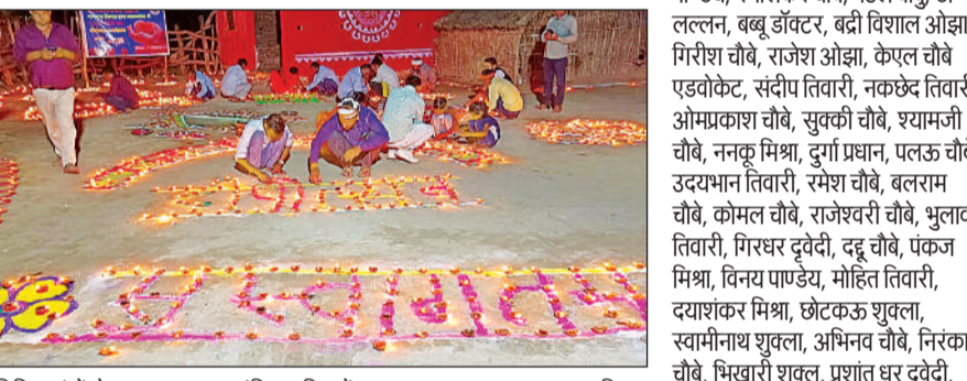
विभिन्न रंगों से सजाया गया वनटांगिया परिवारों का घर।