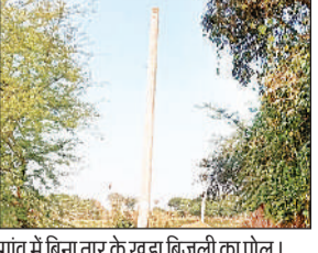
गांव में बिना तार के खड़ा बिजली का पोल।