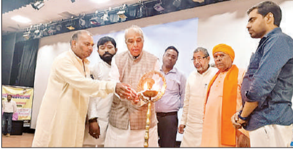
दीप जलाकर कार्यक्रम की शुरुआत करते सांसद जगदम्बिका पाल।