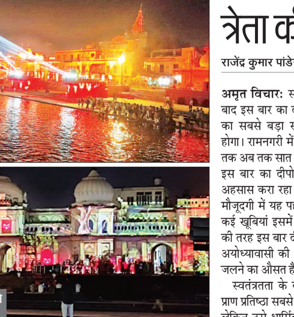
राम की पैड़ी पर चल रहे द्रायल में लेजर शो के जरिये रामायण के प्रसंग दिखाये गए।

दीपोत्सव 2024 स्वतंत्रता के बाद इस बार अयोध्या का सबसे बड़ा सांस्कृतिक उत्सव, जिले की सीमा से ही दिखने लगा दीपोत्सव का आकर्षण त्रेता की तरह पहली बार जलेगा प्रत्येक अयोध्यावासी की ओर से एक दीया