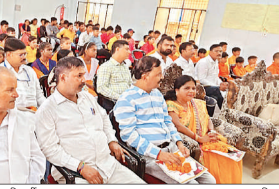
कार्यक्रम में मौजूद संस्कृत विद्यालयों के शिक्षक व विद्यार्थी।