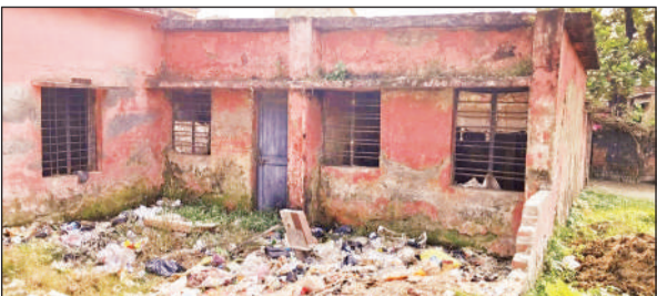
कूड़ा घर बना प्राथमिक स्वास्थ्य केंद्र।

अमृत विचार। ग्राम पंचायत बड़खड़िया में लाखों की लागत से बना प्राथमिक स्वास्थ्य केंद्र झाड़ झंखाड़ में तब्दील हो गया है। गांव के लोगों ने स्वास्थ्य केंद्र को कूड़ा घर बना दिया है। इस स्वास्थ्य केंद्र में कोई स्वास्थ्य कर्मी भी नहीं आता है। जिसके चलते क्षेत्र के लोगों को इलाज के लिए भटकना पड़ता है। विकास खंड मिहीपुरवा अंतर्गत ग्राम पंचायत बड़खड़िया में दो दशक पूर्व लाखों की लागत से प्राथमिक स्वास्थ्य केंद्र का निर्माण हुआ था। जिस पर लोगों को बेहतर इलाज की उम्मीद जागी थी, लेकिन लाखों की लागत से बने प्राथमिक स्वास्थ्य केंद्र में कोई कर्मचारी ही नहीं आ रहा है। इतना ही नहीं