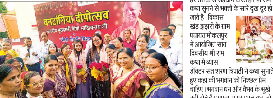
डीएम व सीडीओ का स्वागत करती महिलाएं।

इस पहल का उद्देश्य केवल घरों को सुंदर बनाना नहीं था, बल्कि यह वनटांगिया समुदाय में स्वच्छता, सुंदरता और आत्मसम्मान की भावना को प्रोत्साहित करने के लिए थी। दीपावली का पर्व खुशियों और प्रकाश का प्रतीक है। प्रशासन की इस पहल के परिणाम में उत्सव का एक नया रंग भरने का प्रयास किया गया है।