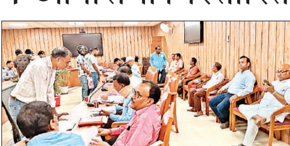
नगर निगम के शिविर में शिकायतें सुनते अधिकारी।

अमृत विचार। नागरिकों को सम्पत्ति कर की जानकारी देने और जोआईएस से सम्बंधित उनकी आपत्तियों एवं जिज्ञासाओं के निस्तारण के लिए नगर निगम द्वारा लगाये जाने वाले शिविर की श्रृंखला में रविवार को नगर निगम के सभा कक्ष में जोन 01 एवं जोन 03, लाल डिग्री स्थित जोनल कार्यालय जोन नं0-02, नेता जी सुबास चन्द्र बोस नगर स्थित जोनल कार्यालय जोन 04 एवं शाहपुर थाना स्थित जोनल कार्यालय जोन 05 में मेगा शिविर का आयोजन किया गया। नगर निगम के करदाताओं की आपत्तियों का निस्तारण किया गया। जोन 01, 02, 03, 04 व 05 में क्रमशः 14,