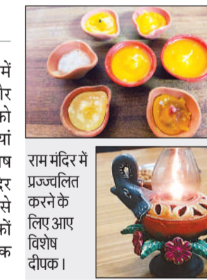
राम मंदिर में प्रज्वलित करने के लिए आए विशेष दीपक।

रात 12 बजे तक हो सकेंगे बाहर से भवन दर्शन दीपोत्सव की भयता को श्रद्धालुओं के लिए अविस्मरणीय बनाने के लिए श्री राम जन्मभूमि तीर्थ क्षेत्र ने मंदिर को 29 अक्टूबर से 1 नवम्बर तक रात 12 बजे तक बाहर से भवन दर्शन के लिए खुला रखने का निर्णय लिया है। गेट संख्या चार बी (लगेज स्कैनर प्लांट) से श्रद्धालु आधी रात तक मंदिर की भव्य सजावट का आनंद ले सकेंगे।