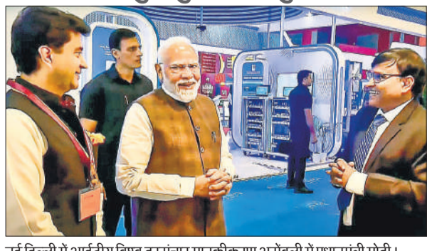
नई दिल्ली में आईटीयू विश्व दूरसंचार मानकीकरण असेंबली में प्रधानमंत्री मोदी।

प्रधानमंत्री ने यहां अंतर्राष्ट्रीय दूरसंचार संघ (इंटरनेट) और इंडिया मोबाइल कांग्रेस के उद्घाटन के अवसर पर कहा कि जिस तरह विमानन क्षेत्र के लिए वैश्विक समुदाय ने एक व्यापक रूपरेखा तैयार की है, उसी तरह डिजिटल दुनिया को भी नियमों तथा विनियमों की आवश्यकता है। वैश्विक