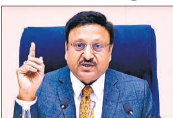
चुनाव संबंधी जानकारी देते मुख्य चुनाव आयुक्त।

एक्जिट पोल पर आत्मचिंतन जरूरी, ईवीएम पूरी तरह सुरक्षित : नई दिल्ली। चुनाव आयोग ने कहा है कि एक्जिट पोल पर आत्मचिंतन तथा जिम्मेदारी से काम करने की जरूरत है और ईवीएम को लेकर जो सवाल उठते हैं वे आधारहीन