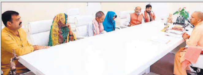
पीड़ित के परिजनो को कार्रवाई का आश्वासन देते मुख्यमंत्री योगी आदित्यनाथ।