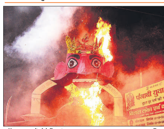
मॉडल टाउन में चौथे दिन फूँका गया रावण का पुतला।

मॉडल टाउन के इंद्रा पार्क में दशहरा पर पंजाबी युवा मंच की ओर से धार्मिक-सांस्कृतिक कार्यक्रम आयोजित किए गए थे। शाम को जब रावण, मेघनाथ और कुंभकर्ण के पुतले जलाने की तैयारी शुरू हुई तो पार्क की देखरेख की जिम्मेदारी संभालने वाली पंजाबी विकास समिति के सदस्यों ने विरोध शुरू कर दिया। यह विवाद तूल पकड़ गया। मौके पर पहुंचे पुलिस-प्रशासन के अधिकारियों ने भी बगैर अनुमति पार्क में पुतले जलाने पर रोक लगा दी। इसके बाद तीनों पुतलों