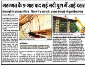
8 अक्टूबर को अमृत विचार में छपी खबर।

और इसमें दरारें भी आ गई हैं। जो कभी भी बड़े हादसे का कारण बन सकता है। इस गंभीर समस्या को देखते हुए अमृत विचार ने बीती 8 अक्टूबर को एक खबर प्रमुखाता से