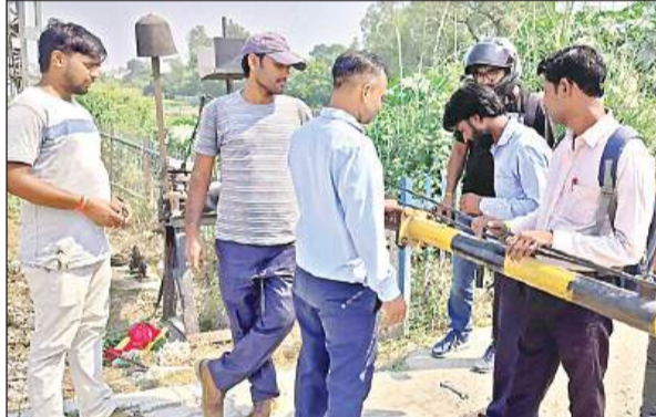
गेटबूम की मरम्मत करते एसएनटी कर्मी।

गेट बूम टूटने के बाद लोडर चालक मौके से भागने का प्रयास कर रहा था लेकिन, गेटमैन व अन्य कर्मियों ने उसे पकड़ने में मदद की। आरपीएफ ने लोडर व चालक को हिरासत में लेकर उनके विरुद्ध रेलवे एक्ट के नेतुआ चंपापुरवा मार्ग की ओर डायवर्ट किया गया, जबकि उन्नाव और लखनऊ की ओर से आने वाले वाहनों को नवीन