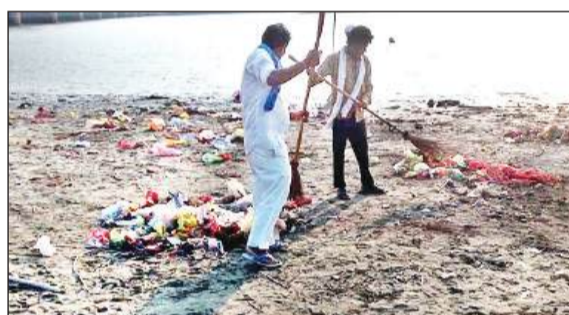
घाटों की साफ-सफाई करते पालिका कर्मी।