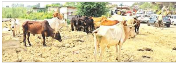
सरेयां गांव के पास खड़ा गोवंशों का झुंड।

संचालित चर्म इकाइयों व स्लाटर हाउसों द्वारा बिना किसी रोक-टोक के लोन नदी में खुले नालों के जरिये केमिकल युक्त जहरीला पानी लगातार बहाया जा रहा है। जो सीधे गंगा में मिल रहा है।