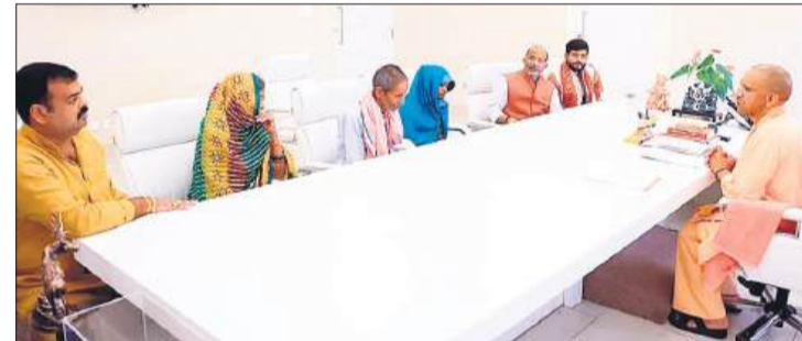
लखनऊ में पीड़ित के परिजनों को कार्रवाई का आश्वासन देते मुख्यमंत्री योगी आदित्यनाथ।