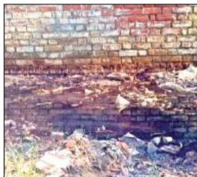
दही औद्योगिक क्षेत्र में लोन नदी जाने वाले खुले नाले में बहता केमिकलयुक्त पानी।

अमृत विचार। तीर्थराज प्रयागराज में आगामी 13 जनवरी से शुरू होने जा रहे महाकुंभ को लेकर शासन से लेकर जिला प्रशासन ने भी तैयारियां शुरू कर दी हैं। इसके अलावा मुख्यमंत्री खुद इस बार के महाकुंभ को लेकर संजीदा हैं। उनकी मंशा है कि इस बार के महाकुंभ में देश-विदेश से आने वाले श्रद्धालुओं को ऐसा शुद्ध गंगाजल मिल सके जिसका वे बिना संकोच के आचमन कर सकें।