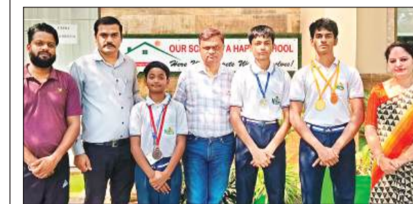
पदक जीतने वाले छात्रों के साथ विद्यालय का स्टॉफ