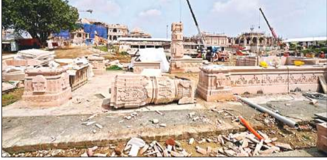
राम जन्मभूमि परिसर में चल रहे मंदिरों के निर्माण का कार्य।