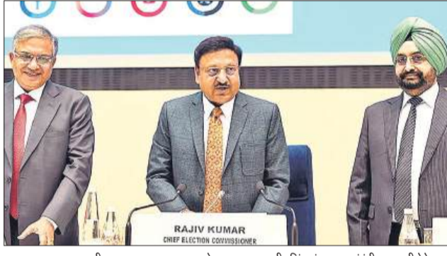
मुख्य चुनाव आयुक्त राजीव कुमार, चुनाव आयुक्त ज्ञानेश कुमार व सुखबीर सिंह संधू चुनाव संबंधी जानकारी देते हुए।

निर्वाचन आयोग ने मंगलवार को महाराष्ट्र और झारखंड विधानसभा चुनाव की तारीखों का ऐलान किया। इसके तहत महाराष्ट्र में एक चरण में 20 नवंबर को जबकि झारखंड में दो चरणों में 13 और 20 नवंबर को मतदान होगा। दोनों राज्यों में मतगणना 23 नवंबर को होगी। इसी के साथ दोनों राज्यों में आदर्श चुनाव आचार संहिता लागू हो गई है। मुख्य निर्वाचन आयुक्त राजीव कुमार ने चुनाव कार्यक्रम की घोषणा की। निर्वाचन आयोग ने 15 राज्यों की 48 विधानसभा सीटें तथा दो लोकसभा क्षेत्रों वायनाड और नांदेड़ के लिए उपचुनाव की भी घोषणा की। मुख्य निर्वाचन आयुक्त ने कहा कि महाराष्ट्र में 22 अक्टूबर को अधिसूचना जारी होगी तथा नामांकन की आखिरी तिथि 29 अक्टूबर होगी। उन्होंने बताया कि नामांकन पत्र चार नवंबर, 2024 तक वापस लिए जा सकते हैं। मुख्य निर्वाचन आयुक्त ने कहा महाराष्ट्र में 9.63 करोड़ योग्य मतदाता हैं जबकि झारखंड में यह संख्या 2.6 करोड़ है। कुमार