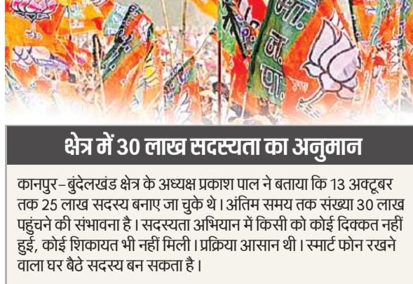
ओटीपी साझा करने की अनिवार्यता न होती तो अभियान काफी सहज हो जाता। एक एजेंसी के मैनेजर ने बताया कि सांसद, विधायक और मंत्रियों के प्रतिनिधियों ने संपर्क किया था। लक्ष्य पूरा करने के लिए स्कूल-कालेज, फैक्ट्री, नगर निगम, प्राधिकरण, केस्को व स्वास्थ्य विभाग में संविदा कर्मचारियों से नेताओं के रेफरल कोड पर सदस्यता

फर्जी और डमी सदस्य रोकने के लिए ओटीपी सिस्टम लागू किया। सदस्य बनने के लिए ओटीपी दर्ज करके फॉर्म भरकर सबमिट करना था। लेकिन ओटीपी बताने से बैंक फ्राड होने की आशंका के चलते तमाम लोगों ने मिस कॉल तो दी फिर ओटीपी दर्ज करने में अनिच्छा जता दी। उन्होंने ओटीपी साझा करने में धोखाधड़ी का संदेह जता दिया। पार्टी सूत्र बताते हैं कि ओटीपी और रेफरल कोड प्रक्रिया के कारण कई सांसदों, विधायकों और वरिष्ठ नेताओं ने लक्ष्य प्राप्ति के लिए निजी एजेंसियों का सहारा लिया। एजेंसी के लोगों ने नेताओं के रेफरल कोड पर भाजपा का सदस्य बनाए। 30 से 50 रुपये प्रति सदस्य सेवा शुल्क चार्ज किया। एक नेता कहते हैं कि