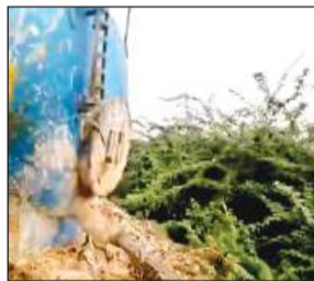
लोन नदी को जाने वाले नाले में बहाया जाता टैंकर में भरकर लाया गया जहरीला पानी।

महाकुंभ-2025 में पतित पावनी मांगंगा के जल को शुद्ध रखने की शासन की मंशा को जिले के प्रदूषणकारी उद्योग व चर्म इकाइयों पलीता लगा रही है। इन उद्योगों के संचालकों द्वारा विभागीय अफसरों