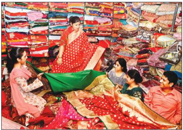
करवा चौथ पर बाजार में कई तरह की साड़ियां आई हैं।

थोक बाजार जनरलगंज व नौघड़ा में रिटेल कारोबारियों की ओर से जरदौजी व सिरोस्की कढ़ाई की साड़ियों की सर्वाधिक मांग की जा रही है। आर्यनगर, गुमटी, गोविंद नगर, पीरोड, सीसामऊ, नवीन मार्केट में जरदौजी व सिरोस्की कढ़ाई की हल्के रंग की साड़ियां तमाम वैरायटी में उपलब्ध हैं। कारोबारियों ने बताया कि इस