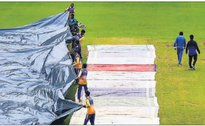
चिन्नास्वामी स्टेडियम पर मौसम विगडने के चलते पिच कवर करते ग्राउंडमैन।

भारतीय क्रिकेट की अगली पीढ़ी के स्टार यशस्वी जायसवाल और शुभमन गिल न्यूजीलैंड के खिलाफ बुधवार से शुरू हो रहे तीन टेस्ट मैचों की श्रृंखला के पहले टेस्ट में अपने बेहतरीन फॉर्म को आगे ले जाना चाहेंगे। विराट और कप्तान रोहित अपने करियर के आखिरी पड़ाव में हैं और गिल तथा जायसवाल पर उनकी विरासत को आगे ले जाने की महती जिम्मेदारी है। बेंगलुरु के मैदान पर दोनों की टीम की परीक्षा होगी। मैच से पहले बारिश की भी संभावनाएं हैं, मैच देर शुरू हो सकता है।