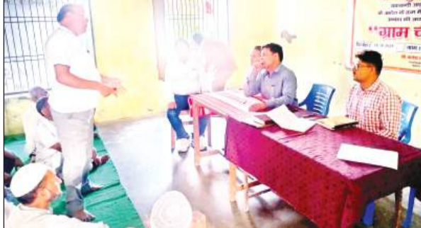
किसानों की समस्याएं सुनते अधिकारी।