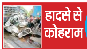
कार्यालय संवाददाता, कानपुर