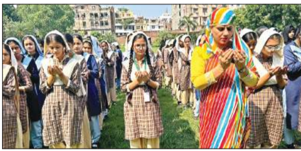
हलीम इंगलिश स्कूल में मृतक छात्र-छात्राओं को श्रद्धांजलि देते बच्चे। अमृत विचार

इससे पहले आरटीओ प्रवर्तन की टीम ने घटनास्थल भौती जाकर हाईवे का सर्वे किया और ये पता करने की कोशिश हुई कि हादसे के पीछे का कारण क्या है।