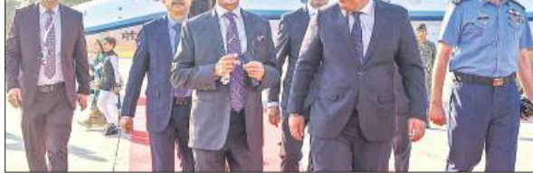
इस्लामाबाद पहुंचे विदेश मंत्री जयशंकर का स्वागत करते पाकिस्तानी अधिकारी।

पिछले करीब नौ साल में पहली बार भारत के विदेश मंत्री ने पाकिस्तान की यात्रा की है। दोनों पड़ोसी देशों के बीच इलाके में स्थित नूर खान हवाई अड्डे पर उतरा और पाकिस्तान के वरिष्ठ अधिकारियों ने उनका स्वागत किया।