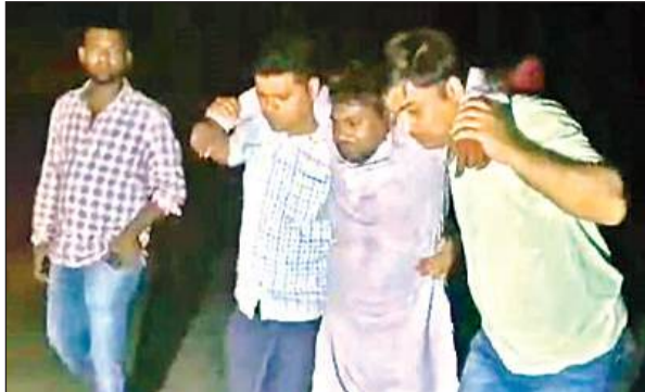
घायल लुटेरे को ले जाते पुलिस कर्मी।