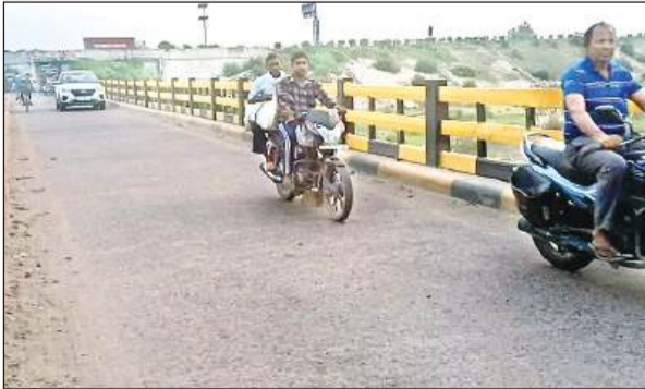
औरास कस्बा स्थित सई नदी के जर्जर पुल से गुजरते वाहन सवार। अमृत विचार

अमृत विचार। संडीला-चकलवंशी मार्ग पर कस्बा औरास में सई नदी पर वर्ष-1965 में पुल का निर्माण कराया गया था। जो पूरी तरह से जर्जर हो गया था। 9 माह पूर्व ही पुल की मरम्मत के लिए 39 लाख का बजट प्रस्तावित किया गया था। जिसकी मरम्मत के लिए 2 से 31 दिसंबर 2023 तक का समय मांगा गया था। लोक निर्माण विभाग द्वारा 23 दिसंबर-2023 को पुल कर्लीट दिखाकर इस पर आवागमन चालू कर दिया गया था। लेकिन विभागीय भ्रष्टाचार के चलते 39 लाख से मरम्मत होने के मात्र 9 माह में ही पुल कुछ हिस्सा टूटकर गिर गया