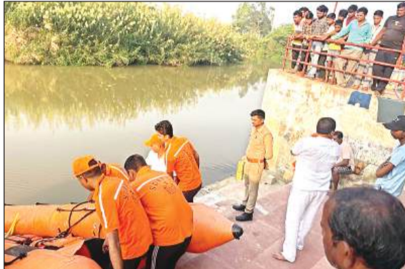
नदी में महिला की तलाश करने जाती एसडीआरएफ की टीम।