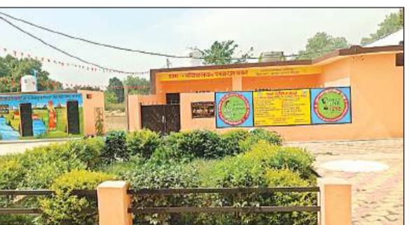
ग्राम पंचायत सचिवालय में तैयार गाड़ें।