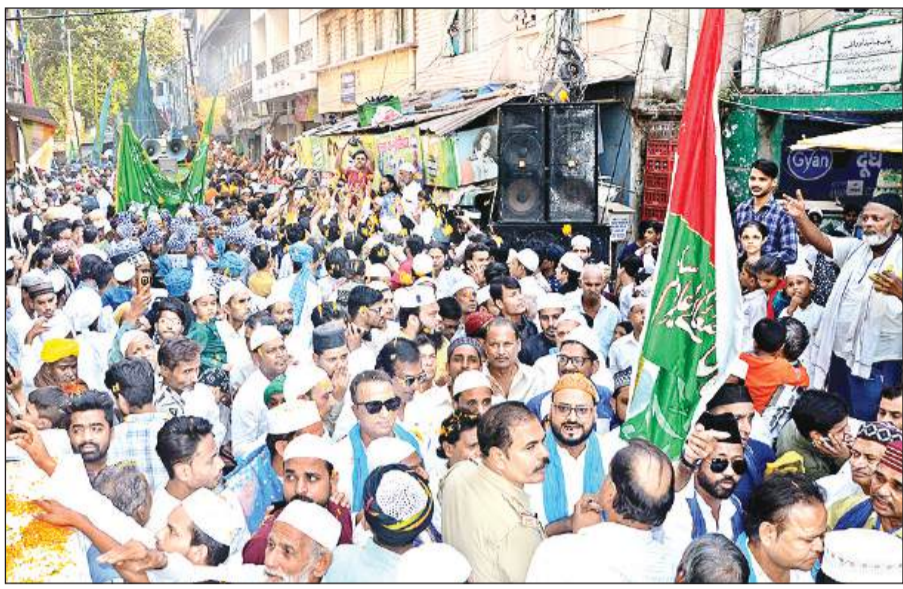
कर्मलगंज से बड़े पीर साहब की याद में निकले जुलूस-ए-गौसिया में हजारों लोग उमड़े।

फेथफुलगंज में लहराए सैकड़ों परचम: अंजुमन फिदायाने