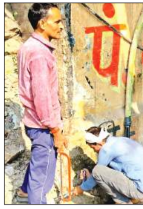
रेलवे पुल के नीचे मरम्मत कार्य करते बिजली कर्मी। अमृत विचार

सोमवार की रात लगभग पौने 11 बजे, रेलवे पुल के समीप दो स्थानों पर एचटी केबल दग गई, जिससे सरैयां, नेतुआ, गगनी खेड़ा, मनसुख खेड़ा, चंपापुरवा, कर्बाला, हुसैन नगर, सैय्यद कम्पाउंड, राजीव नगर, मिश्रा कालोनी, तेजीपुरवा जैसे मोहल्लों में बिजली आपूर्ति टप हो गई। इस दौरान, गर्मी और मच्छरों की वजह से हजारों परिवार पूरी रात जागते रहे। पावर डिपार्टमेंट ने फॉल्ट की पहचान करने के लिए मंगलवार सुबह से पैट्रोलिंग शुरू की, लेकिन पूर्व में मरहला के पास वैकल्पिक लाइन कटी होने के कारण आपूर्ति को तुरंत सुचारू नहीं किया जा सका। लोगों की