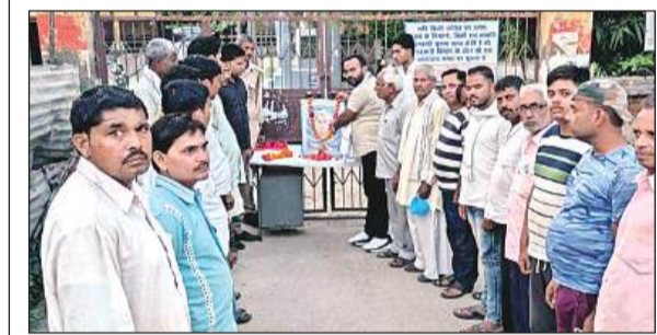
अब्दुल कलाम के चित्र पर माल्यार्पण करते लोग।