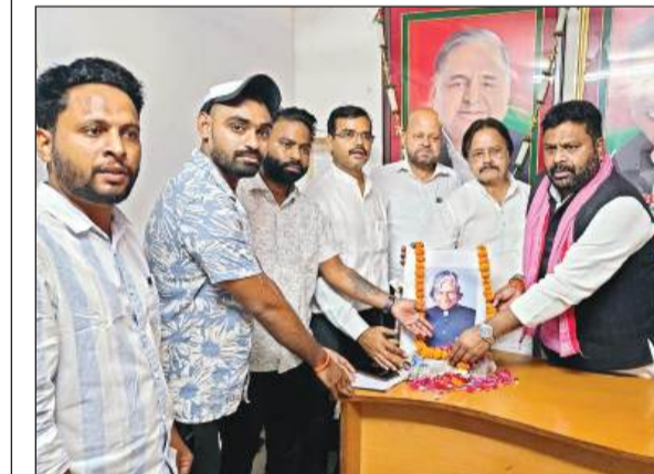
पूर्व राष्ट्रपति डॉ. एपीजे अब्दुल कलाम के चित्र पर पुष्प अर्पित करते सपाईं।

कानपुर। राष्ट्रीय स्वयं सेवक संघ राजनीतिक गतिविधियों से बिल्कुल पृथक रहते हुए सांस्कृतिक संगठन के रूप में हिंदू अनुशासन के माध्यम से राष्ट्र निर्माण के कार्य में सक्रिय रहता है। चरित्र प्रशिक्षण के साथ ही हिंदू समाज को एकजुट करना संघ का प्रमुख उद्देश्य है। सीसामऊ उपचुनाव को लेकर प्रकाशित समाचार में कानपुर प्रांत प्रचारक का नाम आना सर्वथा अनुचित है। उनका या संघ का राजनीति से कोई वास्त नहीं है। संघ सद्व्यवहार संस्कृति और नागरिक समाज के मूल्यों को बनाए रखने के आदर्शों को बढ़ावा देता है और बहुसंख्यक हिंदू समुदाय को मजबूत करने के लिए हिंदुत्व की विचारधारा का प्रचार करता है।