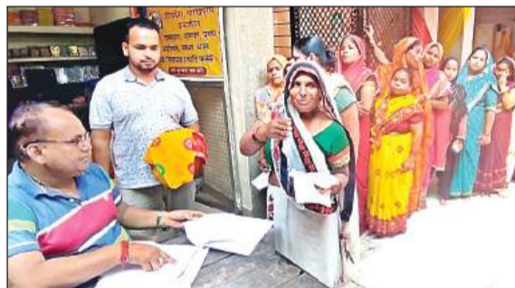
दुर्गा मंदिर में साड़ी लेने के लिये लगी महिलाओं की लाइन।