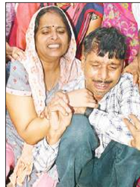
आयुषी के माता-पिता बिलखते रहे।