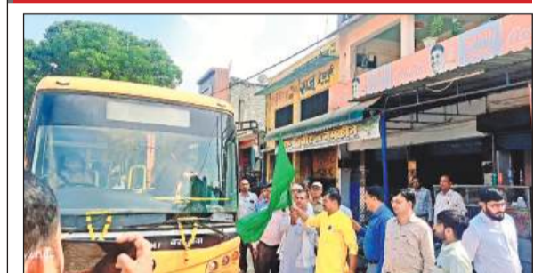
बस को झंडी दिखाकर रवाना करते अधिकारी।