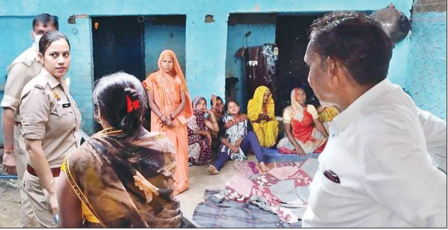
सिकंदरा में वृद्धा की मौत पर गम में डूबी महिलाएं और छानबीन करती पुलिस।