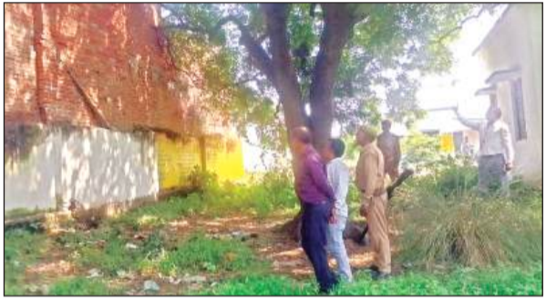
विद्यालय की दीवार पर लगे गोबर के ऊपले।