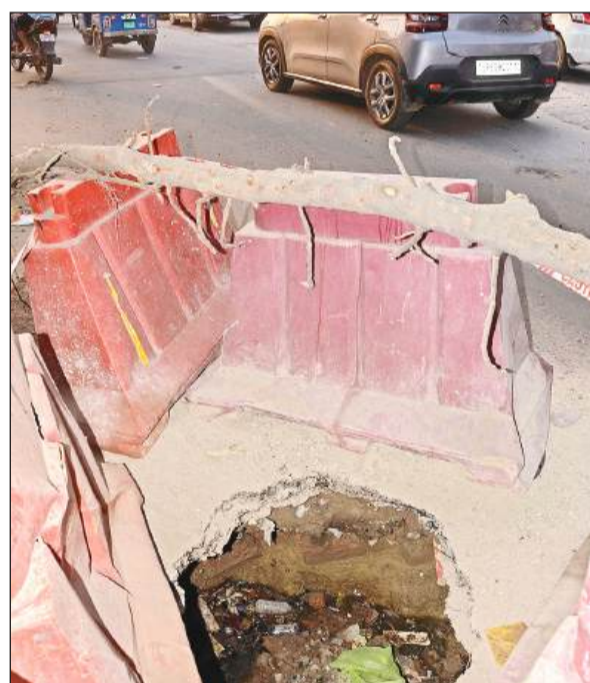
परेड में चार दिन पहले बनी सड़क धंस गई।

मंगलवार को आईएमए के पास सड़क पर बड़ा गड्ढा हो गया। गड्ढे की वजह से यातायात प्रभावित होने लगा। सूचना पर मेट्रो के अधिकारियों और कर्मचारियों ने