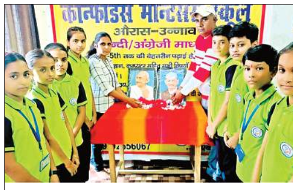
औरस में महापुरुषों के चित्र पर पुष्प अर्पित करते बच्चे।