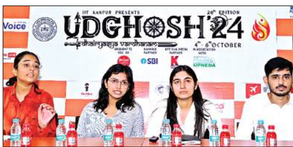
उद्घोष की जानकारी देते आयोजक।

कि यह परियोजना औद्योगिक, वाणिज्यिक और आवासीय उपयोग के लिए सुनियोजित बुनियादी ढांचा प्रदान करती है। कार्यक्रम में 50 से अधिक निवेशक शामिल हुए, जिनको यूपीसीडा सीईओ ने बताया कि कैसे प्राधिकरण निवेशक अनुकूल नीतियों को सुविधाजनक बना रहा है। पंजाब नेशनल बैंक ने एमएसएमई प्राइम प्लस और प्रगति प्राइम प्लस जैसी अपनी वित्तीय योजनाएं पेश कीं, जो विकास के लिए वित्तीय समाधान के साथ व्यवसायों का समर्थन करने के लिए डिजाइन की गई हैं।