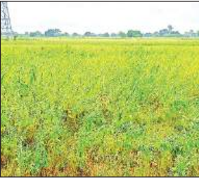
ढैंचा की फसल तैयार।

अमृत विचार। मिट्टी की सेहत सुधारने को किसानों ने तैयारी शुरू कर दी है। इसके लिए कृषि विभाग ने ढैंचा की खेती को बढ़ावा देने के लिए अनुदान में बीज देने का फैसला किया है। अधिकारियों का कहना है कि ढैंचा की खेती से तैयार खाद से फसलों की बंपर पैदावार होगी।