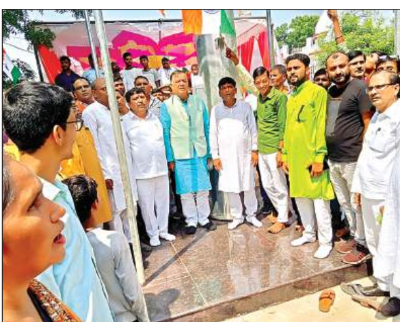
ध्वजारोहण के बाद राष्ट्र गान करते विधानसभा अध्यक्ष सतीश महाना। अमृत विचार

याद आए महापुरुष ► नर्वल के गणेश सेवा आश्रम में फहराया गया राष्ट्रीय ध्वज ► यूपी विधानसभा अध्यक्ष सतीश महाना ने किया लोकार्पण