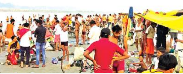
अमावस्या पर गंगा स्नान करते श्रद्धालु। अमृत विचार

अलावा उन्नाव, लखनऊ व नगर के आस पास मोहल्लों से सुबह से ही श्रद्धालुओं के आने का सिलसिला शुरू हो गया था। इस दौरान श्रद्धालुओं ने गंगा में स्नान किया श्रद्धालुओं की भीड़ नगर के सभी घाटों पर देखी गई। कुछ श्रद्धालुओं ने गंगा तट पर सत्य नारायन की कथा का भी श्रवण किया। स्नान के बाद श्रद्धालुओं ने गंगातट पर लगी दुकानों पर खरीददारी भी की।