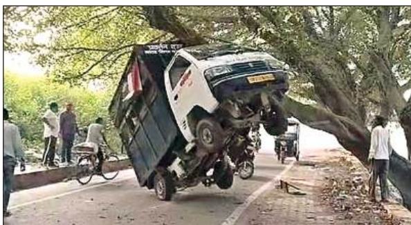
इस तरह पेड़ पर चढ़ी नगर निगम की गाड़ी।