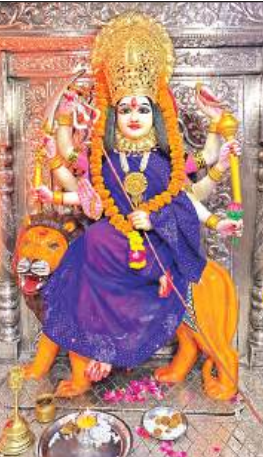
शहर के दुर्गा मंदिर में माता की मूर्ति साफ करते पुजारी व भक्त।

अमृत विचार। शारदीय नवरात्र की पूर्व संध्या पर बुधवार को नगर में जगह-जगह सजी पूजन सामग्री व फल की दुकानों पर लोगों की भारी भीड़ रही। वहीं मन्दिरों में रंगरोगन व सजा सज्जा कर नवरात्रि पर्व की तैयारी पूर्ण कर ली गई। शारदीय नवरात्र की खरीददारी को लेकर बुधवार को नगर में खरीददारों की भारी भीड़ देखी गई। पूजन सामग्री, चुनरी, फल, नरियल, आदि की दुकानों पर लोगों ने जमकर खरीददारी की। दूसरी ओर मन्दिरों में आज ज्यादा संख्या में श्रद्धालुओं साफ सफाई व रंगरोगन के बाद राजमार्ग प्राचीन मन्दिर दुर्गा मन्दिर व अन्य मंदिरों पर भव्य श्रृंगार किया गया तथा सोम से शुरू साप्ताहिक पर्व की तैयारिया पूर्ण कर ली गई। वहीं राजधानी मार्ग स्थित दुर्गा मंदिर में आज सुबह कलश पूजन के साथ पूजन कार्य शुरू किया जायेगा। छह बजे माता को भोग लगाने के बाद महाआरती का आयोजन किया जायेगा।