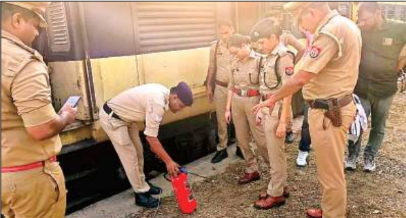
रेलवे लाइन पर पड़े फायर सिलेंडर को उठाती जीआरपी।