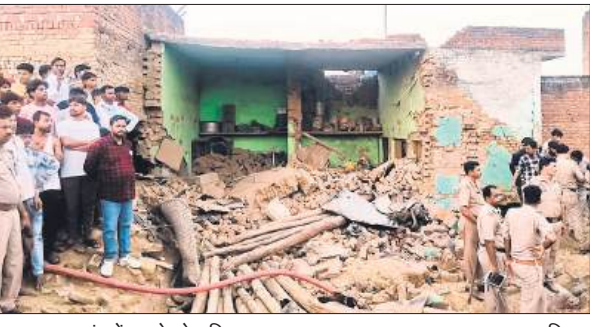
कल्याणपुर गांव में धमाके से क्षतिग्रस्त हुए मकान का मलबा।

कार्यालय संवाददाता, बरेली अमृत विचार : सिरौली के गांव कल्याणपुर के एक घर में अवैध रूप से पटाखे बनाते समय एक के बाद एक हुए भीषण धमाकों से पांच मकान जर्मीदोज हो गए। इन घरों में मौजूद तीन महिलाओं की मौत हो गई और चार लोग गंभीर रूप से घायल हो गए। तीन लोगों के मलबे में दबे होने की आशंका है। एसडीआरएफ की टीम अग्रिशमन, पुलिस और राजस्व विभाग की टीमों के साथ देर रात तक रेस्क्यू ऑपरेशन में जुटी हुई थी। एटाखों में हुए धमाके इतने जबरदस्त थे कि उनकी गूंज करीब दो किमी दूर तक सुनी गई। हादसा बुधवार दोपहर करीब 3.40 बजे रहमान शाह के घर में हुआ जहां पटाखे बनाए जा रहे थे। दिवाली नजदीक होने की वजह से