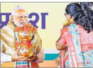
हजारीबाग में आयोजित सभा के दौरान प्रधानमंत्री मोदी को कलश भेंट करती महिला ।

प्रधानमंत्री नरेन्द्र मोदी ने बुधवार को कहा कि झारखंड में हिंदुओं और आदिवासियों की जनसंख्या घट रही है और उन्होंने झामुमो नीत गठबंधन सरकार पर राज्य की पहचान, संस्कृति और विरासत की कीमत पर घुसपैटियों का समर्थन करके वोट बैंक की राजनीति करने का आरोप लगाया । उन्होंने कहा कि माटी, बेटी, रोटी को बचाने के लिए अब ऐसी ताकतों को बाहर करने का समय आ गया है । मोदी ने भाजपा की परिवर्तन यात्रा के समापन पर आयोजित कार्यक्रम में कहा कि झारखंड में बेटी, माटी, रोटी की रक्षा करने और भ्रष्टाचार पर अंकुश लगाने को परिवर्तन का समय आ गया है । झारखंड मुक्ति मोर्चा (झामुमो) के नेतृत्व वाला