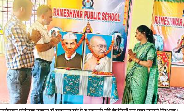
रामेश्वर पब्लिक स्कूल में महात्मा गांधी व शास्त्री जी के चित्रों पर पुष्प चढ़ाते शिक्षक।