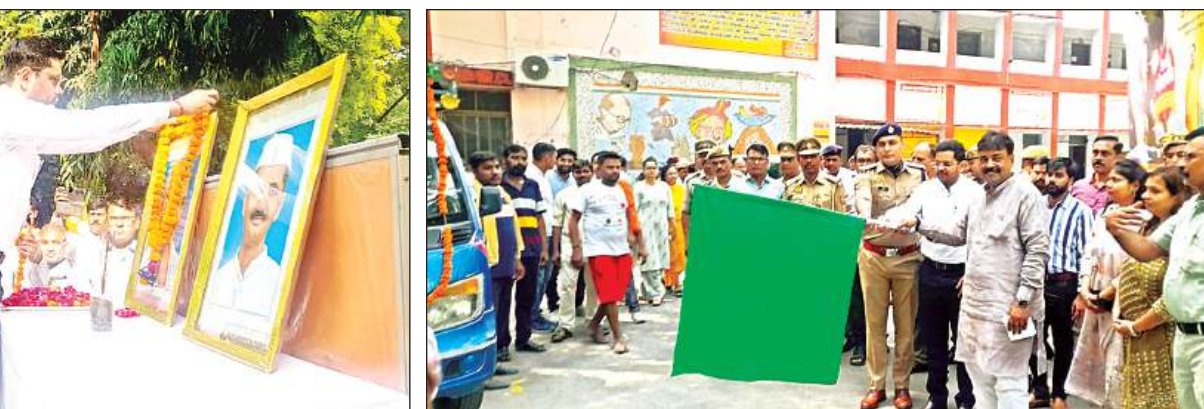
सड़क सुरक्षा पखवाड़ा के शुभारंभ पर प्रचार वाहन को हरी झंडी दिखाकर रवाना करते विधायक, जिलाधिकारी व अन्य।

महत्वपूर्ण है। इस दिन हमारे देश की दो महान विभूतियों ने जन्म लिया था। उनकी वजह से ही आज हमें गर्व से जीने का मौका मिल सका है। इसके लिए हम अपने महापुरुषों के सदैव ऋणी रहेंगे। उन्होंने गांधी जी के बारे में कहा कि गांधी जी का दर्शन व आदर्श आधुनिक समय में