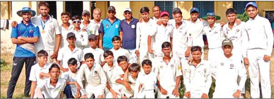
मैच जीतने के बाद घाटमपुर टीम के खिलाड़ियों ने खुशी का इजहार किया।