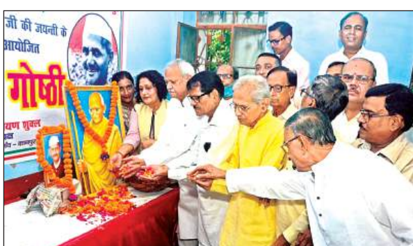
तिलक हाल में गांधी जयंती पर पुष्पांजलि देते कांग्रेसी।