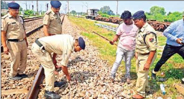
सिलेंडर मिलने के बाद ट्रैक पर जांच करती पुलिस।