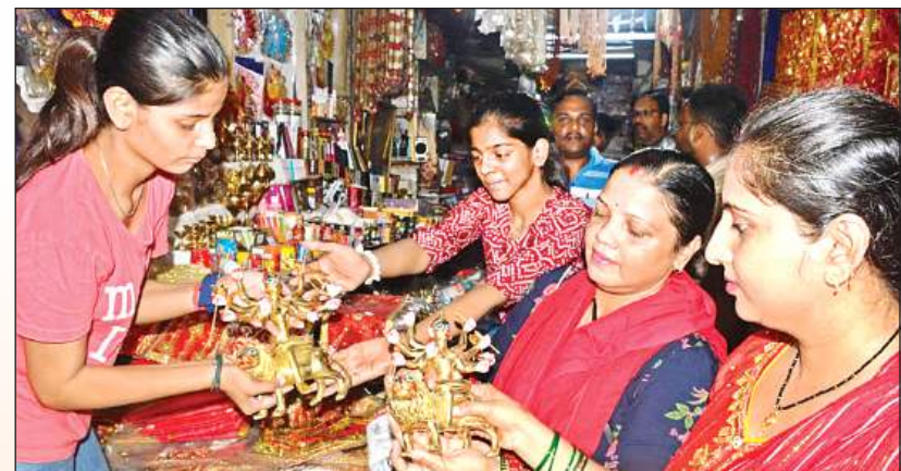
नवरात्र पर खरीदारी के लिए बाजारों में उमड़ी भीड़।

पंचांग के अनुसार शारदीय नवरात्र के पहले दिन कलश स्थापना के लिए दो शुभ मुहूर्त हैं। पहला शुभ मुहूर्त सुबह काल 6.02 मिनट से लेकर 7.07 मिनट तक रहेगा। इसके बाद घटस्थापना के लिए दूसरा मुहूर्त दोपहर के समय है। यह मुहूर्त सुबह 11.34 मिनट से लेकर दोपहर 12:21 तक रहेगा। इस दौरान भी कलश स्थापना कर सकते हैं। शहर के बारादेवी, तपेश्वरी, जंगलीदेवी उजियारी व काली मटिया मंदिर में प्रतिदिन भक्तों की जबरदस्त भीड़ होती है। इन मंदिरों के बाहर मेला भी लगता है। इन मंदिरों में बैरीकेडिंग पर विशेष ध्यान दिया गया है।