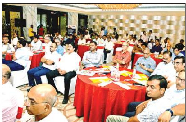
कार्यक्रम में उद्योग जगत के नामचीन लोग मौजूद रहे।