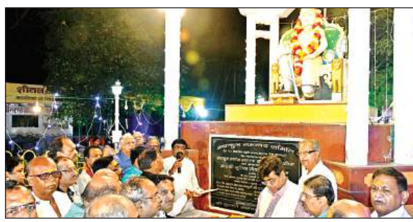
अग्रसेन प्रतिभा पर की गई आरती।