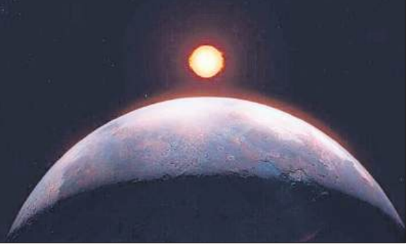
बर्नाड तारे के साथ उसके ग्रह की काल्पनिक तस्वीर।

अमृत विचार : हमारा सबसे नजदीकी तारा बर्नाड का भी अपना सौर परिवार है। बर्नाड का अपना एक ग्रह है। कई दशकों की मशक्कत के बाद इस ग्रह की खोज हो पाई है। मंगलवार को खगोलविदों की अंतरराष्ट्रीय टीम ने इस खोज को पुष्टि की है। बर्नाड तारा हमसे 6 प्रकाशवर्ष दूर है। तारों की दुनिया अनूठी है। अनेक तारों का हमारे सौरमंडल की तरह अपना परिवार होता है। बर्नाड हमारे सबसे नजदीकी तारा है। जिसकी जानकारी जुटाना खगोलविदों के लिए स्वाभाविक है। जिसके चलते कई दशक से खगोलविद इसके अध्ययन में जुटे हुए थे। अंततः कामयाबी मिल गयी और इसके कम से कम एक ग्रह होने की खबर सामने आ गई। बर्नाड का ग्रह शुरु के द्रव्यमान का लगभग