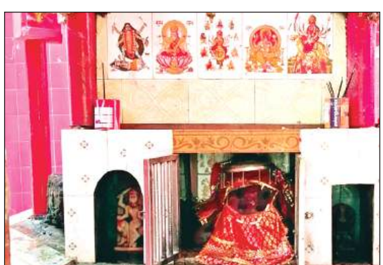
मंदिर में विराजमान मां शंकरी देवी।

अमृत विचार। अश्विन मास शुक्ल पक्ष की प्रतिपदा के साथ ही नवरात्र की शुरुआत हो रही है। जहां इन पावन दिनों में देवी मंदिरों में भारी भीड़ देखने को मिलती है। वहीं कस्बा स्थित मां शंकरी देवी प्राचीन सिद्धपीठ स्वरूप क्षेत्र की अधिष्ठात्री व आराध्य देवी के रूप में स्थापित हैं। वहीं कस्बे के सलींद रोड स्थित दुर्गा मंदिर, उम्मेदराय बाजार स्थित शीतला मंदिर ब्राह्मण टोला स्थित फूलमती देवी मंदिर, मिर्जापुर गांव स्थित माता हिंगलाज देवी मंदिर में भारी भीड़ रहती है। वहीं तहसील क्षेत्र के ही पंडाखेड़ा स्थित सिद्धपीठ माता मंशादेवी मंदिर के बाबत मान्यता है कि सच्चे मन से जाने वाले भक्तों पर मां की कृपा होती है।