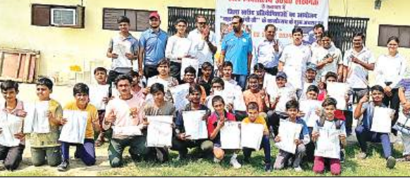
जिजेताओं के साथ मौजूद अधिकारी।