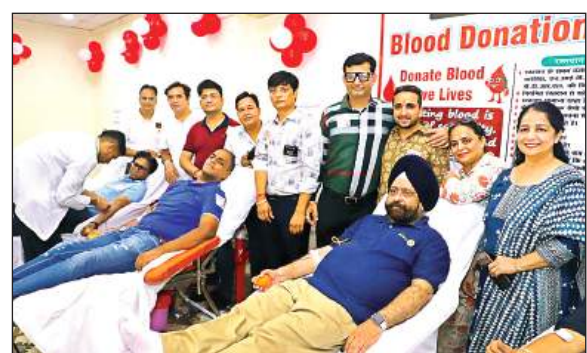
शिविर में रक्तदान करते रक्तदाता।