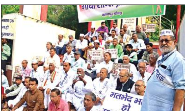
फूलबाग में गांधी शांति प्रतिष्ठान ने एकता का संदेश दिया।