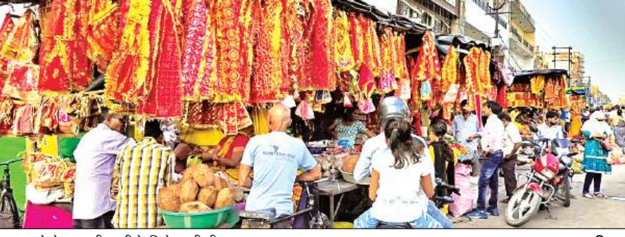
नवरात्र को लेकर खरीददारी के लिये उमड़ी भीड़। अमृत विचार