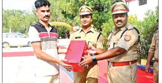
गांधी जयंती पर कर्मियों को उपहार भेंट करते एसपीबीबीजीटीएस मूर्ति। अमृत विचार

उन्होंने चतुर्थ श्रेणी कर्मचारियों वामासारथी की अध्यक्ष नीवी मूर्ति को उपहार बांटे। इस मौके पर ने बच्चों को मिठाई बांटी।