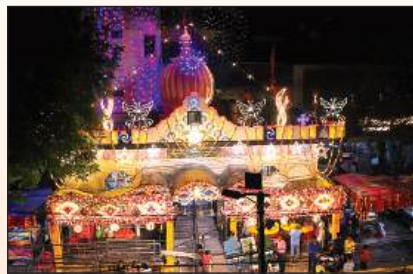
काली मटिया मंदिर सजाया गया है।

दुर्गा मंदिरों में भव्य दरबार सजाया गया है। पंडालों को महल का रूप दिया गया है। गुरुवार को पहले दिन घरों व मंदिरों में मां के प्रथम स्वरूप शैलपुत्री की आराधना होगी। घरों में कलश स्थापना के साथ ही भव्य व्रत रहेंगे। मंदिरों में दर्शन व पूजन के लिए भक्तों की भीड़ रहेगी। मंदिरों को लाइटों से सजाया गया है। मंदिरों के बाहर नारियल, चुनरी, कलश, दीपक, फूल-फूल व प्रसाद की दुकानें लग गई हैं। काली मटिया, तपेश्वरी देवी, बुद्धा देवी, उजियारी देवी, बारह देवी, वैष्णो माता दरबार बर्रा, जंगली देवी आदि मंदिरों में श्रद्धालु दर्शन व पूजन कर मां भगवती को प्रसन्न करेंगे। भक्तों ने घरों में स्थापित करने के लिए मूर्तियां खरीदीं और श्रृंगार कराया।