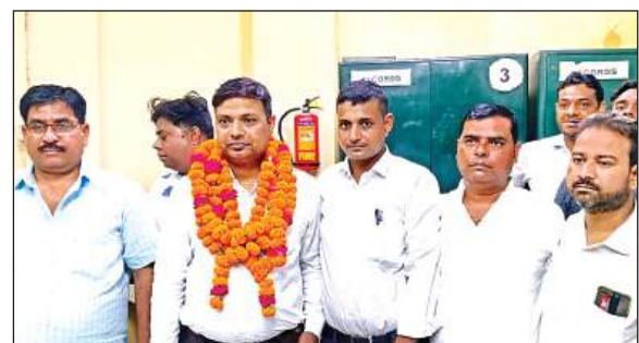
डिप्लोमा फार्मसिस्ट एसोसिएशन के पदाधिकारी चुने गए।