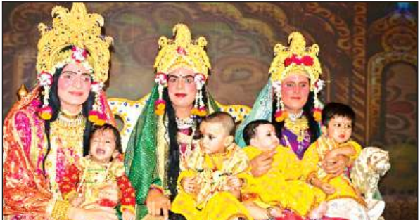
माताओं की गोद में राम, भरत, लक्ष्मण और शत्रुघ्न।

अमृत विचार। राजा दशरथ के महल में गूंजती राम, लक्ष्मण, भरत और शत्रुघ्न की किलकारियां, खुशियों से झूमती अवध की प्रजा और उपहार लुटाती महारानी कैकेयी, कौशल्या और सुमित्रा, महल में गूंजते बधाई गीत, पुष्प की वर्षा करते देवता, यह मनोहारी दृश्य रहा परेड स्थित रामलीला मैदान में आयोजित रामलीला का। श्रीराम लीला सोसाइटी परेड की ओर से आयोजित इस उत्सव की शुरुआत मेस्टन रोड स्थित रामलीला भवन से निकाली गई श्रीहरि विष्णु और