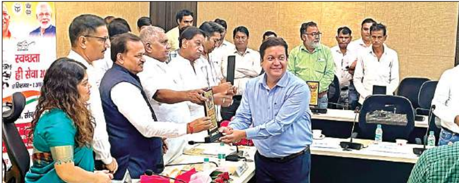
स्वच्छता ही सेवा अभियान के तहत सम्मान पाकर खिल उठे चेहरे।