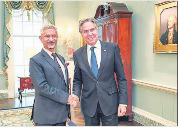
विदेश मंत्री जयशंकर से मुलाकात करते एंटनी ब्लिंकन।

जयशंकर ने कहा बुधवार वाशिंगटन डीसी में विदेश मंत्री ब्लिंकन के साथ बातचीत करके बहुत खुशी हुई। हमने डेलावेयर द्विपक्षीय और क्वाड