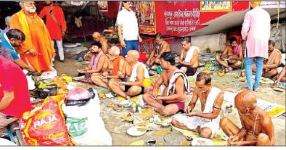
तट पर पिंडदान कराते महापात्र। अमृत विचार

अमृत विचार। बुधवार को पितृपक्ष की समाप्ति हो गई। लोगों ने अपने पूर्वज पितरों का पिंडदान कर उन्हें गंगाजल से श्रद्धांजलि दिया। इन पन्द्रह दिनों के पितृपक्ष में पूर्वजों पितर स्वर्ग से बाहर आते हैं, जिन्हें उनके परिजन पिंडदान गंगा तट पर उनकी श्राद्ध करते हैं। बालूघाट स्थित गायत्री शक्ति पीठ में भी सामूहिक रूप से लोगों ने आचार्यों द्वारा विधि-विधान के साथ उनके पूर्वजों का पिंडदान का कार्य हुआ। अमावस्या पर ही पितरों का तर्पण किया जाता है। पितृ पक्ष पर लोग अपने पुरखों का आवाह्न कर उनको तर्पण देते हैं। जिससे विधि विधान के साथ लोग दान पुण्य करते हैं। जिससे कि उनके पूर्वजों को आत्म शक्ति मिलने के साथ तर्पण करने वाले व्यक्ति का गृहस्थ जीवन सुखमय हो। वहीं सर्वपैत्री