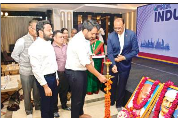
दीप जलाकर उद्घाटन करते उद्यमी।

औद्योगिक, वाणिज्यिक व आवासीय उपयोग के लिए मिलेगा सुनियोजित बुनियादी ढांचा