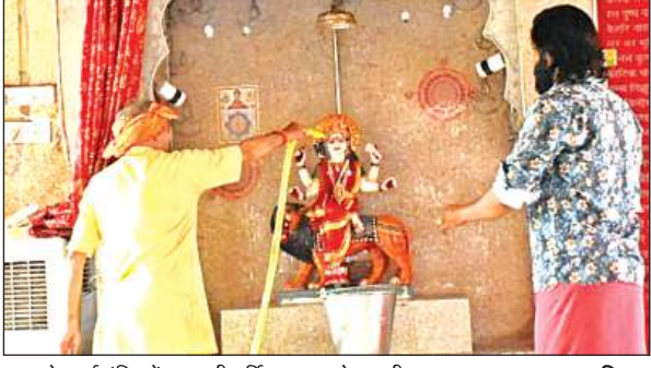
शहर के दुर्गा मंदिर में माता की मूर्ति साफ करते पुजारी व भक्त।