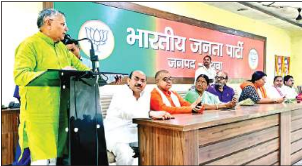
कार्यकर्ताओं को संबोधित करते प्रभारी मंत्री धर्मवीर प्रजापति।

अमृत विचार। जिले के प्रभारी मंत्री धर्मवीर प्रजापति ने कहा कि समाजवादी पार्टी वोट बैंक के लिए जाति धर्म की राजनीति कर रही है। भारतीय जनता पार्टी सबका साथ सबका विकास को लेकर काम करती है। किसी के साथ भेदभाव नहीं करती। पत्रकारों के साथ बातचीत में उन्होंने कहा कि इस समय स्वच्छता अभियान चलाया जा रहा है और सभी को इसमें जुटना है। सपा नेता ने कहा है कि मुस्लिमों की आबादी बढ़ रही है, इसलिए अब भाजपा की सरकार नहीं बन पाएगी, इस बारे में प्रजापति ने कहा कि ऐसा कुछ नहीं है, हम सब भारतीय हैं और हमें सबसे पहले भारत के लिए सोचना है और भारत के लिए कार्य करना है। उन्होंने कहा कि कार्यकर्ताओं के सम्मान से बड़ा कुछ भी नहीं है। कार्यकर्ताओं को आश्वस्त करते हुए उन्होंने