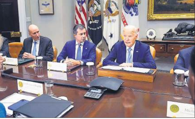
व्हाइट हाउस में बैठक करते राष्ट्रपति बाइडन।

इंदौर। इंदौर में होटल में रुककर शहर में भीख मांगने वाले 11 नाबालिग बच्चों समेत 22 लोगों को राजस्थान में उनके मूल निवास स्थान भेज दिया गया है। महिला एवं बाल विकास विभाग के एक अधिकारी ने बताया कि मंगलवार को मिली एक शिकायत के आधार पर जांच की गई, तो पता चला कि राजस्थान से 22 लोगों का समूह भीख मांगने इंदौर आया था और ये लोग एक होटल में ठहरे थे। अधिकारी ने कहा कि इस समूह में 11 नाबालिग बच्चे और 11 महिलाएं शामिल थीं। ये लोग दिन भर शहर के अलग-अलग स्थानों पर भीख मांगते और रात में होटल में आकर सो जाते थे।