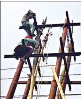
मरहला चौराहे पर लाइन शिफ्टिंग का कार्य करते बिजली कर्मी।