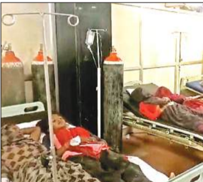
अस्पताल में भर्ती घायल । अमृत विचार

● ट्रॉली पर सवार होकर मूंगफली खोदने जा रहे थे मजदूर