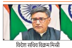
विदेश सचिव विक्रम मिश्री

● सेनाएं भी नियंत्रण रेखा से पीछे हटेंगी, दोनों देशों में बनी सहमति