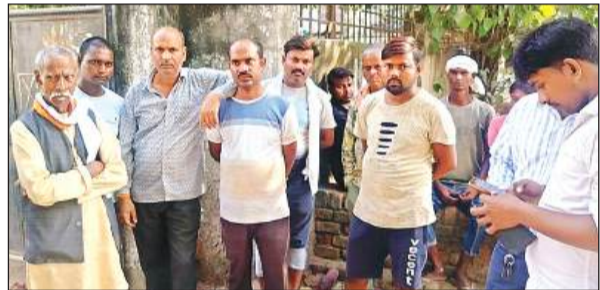
पोस्टमार्टम हाउस में मौजूद परिजन।

मगरवारा चौकी क्षेत्र के अकरमपुर बाजार के सामने तेज रफ्तार वैन की टक्कर से वह उछलकर सड़क पार गिर गये। इस दौरान उनके सिर से हेलमेट निकल गया। वैन का पहिया सिर के ऊपर से निकलने से वह गंभीर घायल हो गए। राहगीरों की सूचना पर पहुंची चौकी पुलिस ने उनकी सांसे चलती देख एंबुलेंस से जिला अस्पताल पहुंचाया। जहां डाक्टर ने उन्हें मृत घोषित कर दिया। घटना की खबर मिलते ही परिजनों में