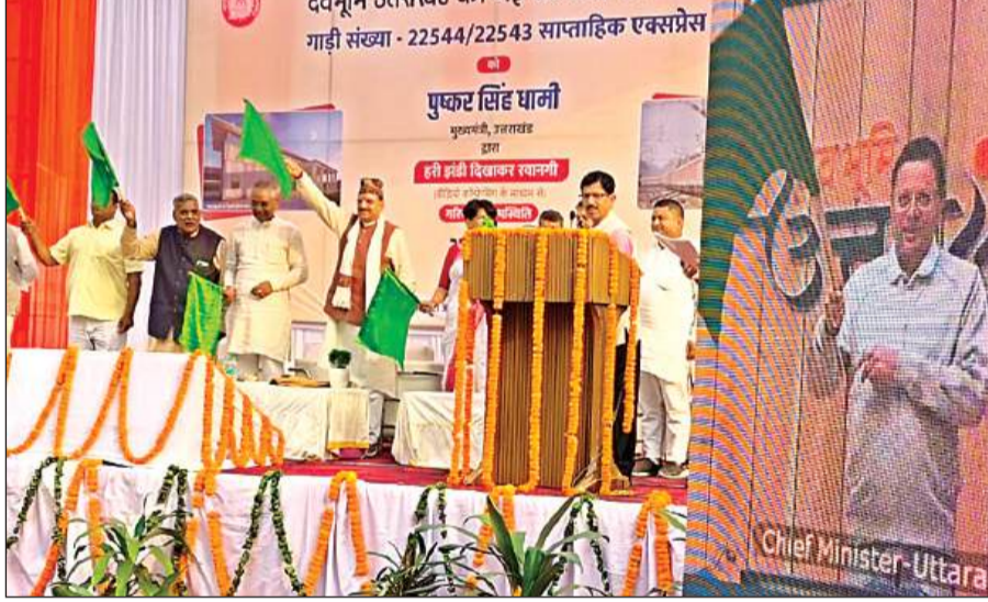
लालकुआं रेलवे स्टेशन पर लालकुआं-बांद्रा सुपरफास्ट रेलगाड़ी का वरुंडल उद्घाटन करते सीएम धामी

उन्होंने कहा कि सम्पूर्णानंद जैसे लोकप्रिय राजनेता का नाम किसी प्रतिष्ठान से हटा दिया जाना महज उनका व काशीवासियों की भावनाओं का ही नहीं बल्कि प्रदेशवासियों की भावनाओं का अपमान है।