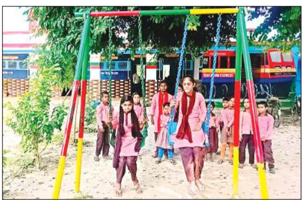
विद्यालय प्रांगण में झूला झूलते बच्चे।