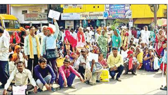
ठगी पीड़ितों ने पटेल नगर चौराहे पर जाम लगाकर प्र