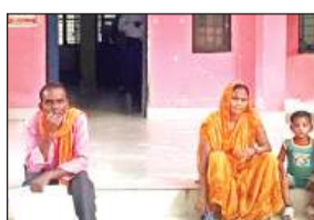
डॉक्टर के आने का इंतजार करते मरीज।