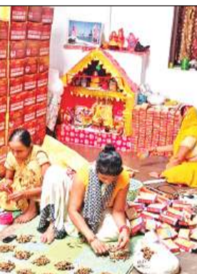
गोमय पूजन किट बनाती महिलाएं।