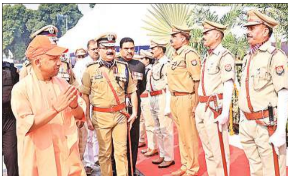
लखनऊ पुलिस लाइन्स में आयोजित कार्यक्रम में पुलिस अधिकारियों से मिलते मुख्यमंत्री।

सेवानिवृत्त पुलिसकर्मियों एवं उनके आश्रितों के चिकित्सा प्रतिपूर्ति संबंधी 266 दावों के निस्तारण करते हुए 30.56 लाख रुपए दिए गए। पांच लाख से अधिक चिकित्सा प्रतिपूर्ति संबंधी 3,12 प्रकरण के लिए 12.60 करोड़, 135 पुलिस कर्मियों और उनके आश्रितों की गंभीर बीमारियों के उपचार के लिए अग्रिम ऋण 5.05 करोड़, जीवन बीमा योजना के तहत 3,06 मृतक पुलिस कर्मियों के आश्रितों को 9.08 करोड़ रुपए, कैशलेस उपचार के तहत 31.16 लाख रुपये, पुलिस कर्मियों के 205 मेधावी छात्रों को शिक्षा निधि से 53.30 लाख रुपये की छात्रवृत्ति दी गई।