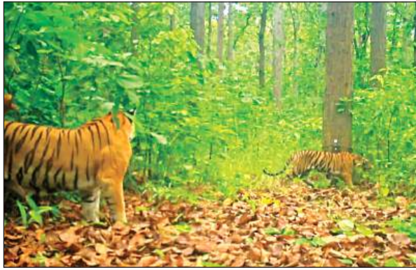
पीलीभीत टाइगर रिजर्व के जंगल में घूमते बाघ।

पीलीभीत टाइगर रिजर्व में वर्तमान में 71 से अधिक बाघ हैं। एनटीसीए (नेशनल टाइगर कंजर्वेशन अथॉरिटी) के निर्देश पर देश के सभी टाइगर रिजर्वों में हर चार साल बाद बाघ गणना कराई जाती है। वहीं स्थानीय स्तर पर टाइगर रिजर्व प्रशासन द्वारा हर साल फेज-4 के तहत बाघ गणना का