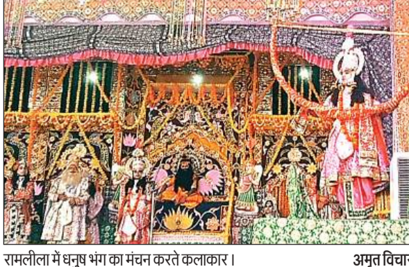
रामलीला में धनुष भंग का मंचन करते कलाकार।

सीता का विवाह उस वीर से कराने का संकल्प दिखाया गया। जो भगवान शिव के पिनाक नामक धनुष को तोड़ सके। विश्वामित्र के साथ राम और लक्ष्मण भी स्वयंवर में पहुंचे हैं। जहां विभिन्न राजाओं ने धनुष उठाने का प्रयास किया लेकिन