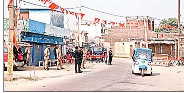
महाराजगंज में तैनात पुलिस के जवान।

इक्का दुक्का लोग ही सड़क पर दिख रहे हैं। इलाके में तनाव को देखते हुए महाराजगंज व आसपास के गांवों में पुलिस और पीएसी के