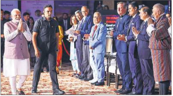
नई दिल्ली में कार्यक्रम के दौरान प्रतिनिधियों का स्वागत करते प्रधानमंत्री नरेंद्र मोदी।

प्रधानमंत्री नरेंद्र मोदी ने सोमवार को कहा कि हरियाणा विधानसभा चुनाव के नतीजों ने स्थिरता की उस अभिव्यक्ति को और मजबूत किया है, जिसे केंद्र में उनके नेतृत्व वाली सरकार को लगातार तीसरी बार मौका देकर जनता ने व्यक्त किया था। प्रधानमंत्री की यह टिप्पणी ऐसे समय में आई है जब महाराष्ट्र और झारखंड में विस चुनावों की घोषणा हुई चुकी है और राजनीतिक दल प्रचार अभियान को धार देने में जुटे हुए हैं। एक सम्मेलन में मोदी ने कहा कि उनकी सरकार अपने तीसरे कार्यकाल में अभूतपूर्व गति और पैमाने पर काम कर रही है और दुनिया में जारी संघर्षों