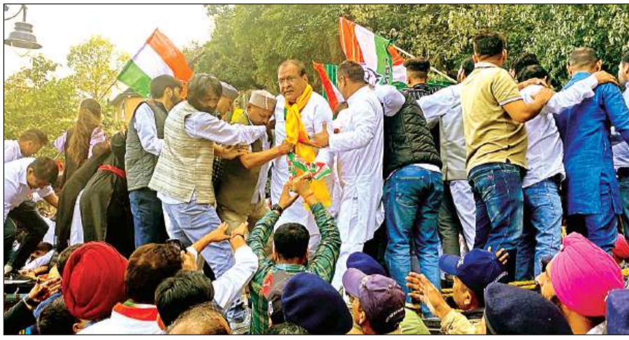
नैनीताल मालरोड पर बैरिकेडिंग पर चढ़कर प्रदर्शन करते कांग्रेसी कार्यकर्ता।

जन आक्रोश रैली में नैनीताल के अलावा हल्द्वानी, बेतालघाट, ऊधमसिंह नगर सहित कुमाऊं के सभी जिलों से बड़ी संख्या में