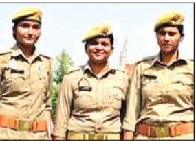
महिला पुलिस कर्मी (प्रतीकात्मक फोटो) ।

आब दरोगा व इंसपेक्टर को वर्दी भत्ता 3000 रुपये मिलेगा। हेड कांस्टेबल व कांस्टेबलों