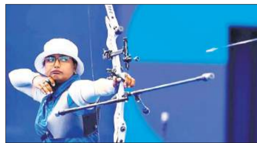
टि.लेक्सकला (मैक्सिको), एजेंसी

भारत की शीर्ष रिकर्व तीरंदाज दीपिका कुमारी ने विश्वकप फाइनल में पांचवां रजत पदक जीता। वह फाइनल में चीन की लि जियामैन से हार गई। दिसंबर 2022 में बेटी के जन्म के बाद फाइनल में लौटी चार बार की ओलंपियन दीपिका को आठ तीरंदाजों में तीसरी वरीयता मिली थी।