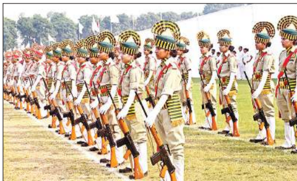
परदे के दौरान महिला पुलिस कर्मी।