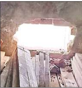
चोरों ने इस तरह दीवार में लगाई सेंध।