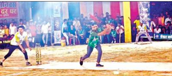
कैनवास बाल क्रिकेट टूर्नामेंट में प्रदर्शन दिखाते खिलाड़ी ।

दूसरे दिन हुए मैचों में पहला मैच डीपी भदोही व न्यू इंडिया फतेहपुर की टीमों के बीच खेला गया। जिसमें भदोही ने टॉस जीतकर पहले बल्लेबाजी करते हुए निर्धारित दस ओवर में पांच विकेट के नुकसान पर 65 रन बनाए। जवाब में फतेहपुर