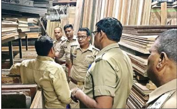
मौके पर जांच-पड़ताल करती गंगाघाट पुलिस।