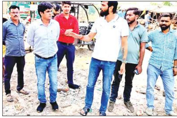
बालूघाट मोड़ पर चौड़ीकरण को लेकर चर्चा करते ई और चेत्यमैन प्रतिनिधि।