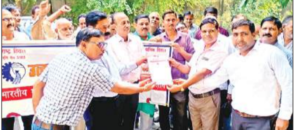
क्षेत्रीय प्रबंधक कार्यालय पर जन-जागरण करते परिवहन कर्मी।