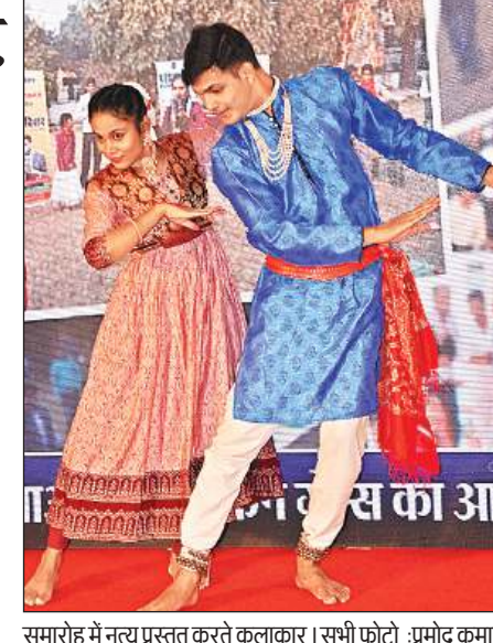
समारोह में नृत्य प्रस्तुत करते कलाकार।

जनता तक पहुंचा रहा है। उन्होंने कहा कि सामाजिक सरोकार पर हमारा विशेष फोकस रहता है लेकिन सच यह भी है कि अखबार रोजगार भी देता है। इसलिए आज मैं उनसे यह भी कहना चाहता हूँ कि अगर सरकार हिन्दी अखबारों की स्थितियों पर ध्यान दे दे तो हिन्दी पत्रकारिता निश्चित तौर पर नए सोपान गढ़ेगी और समाचार पत्रों का बहुत भला होगा। उन्होंने उपमुख्यमंत्री ब्रजेश पाठक की व्यस्तताम दिनचर्या से सभी को सीख लेने की सलाह भी दी। उनका समय प्रबंधन लोगों को प्रेरित करने वाला है।