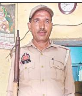
बिजली विभाग के एक्सईएन कार्यालय में 303 बोर की कंडम राइफल के साथ खड़ा पीआरडी जवान।

अमृत विचार। सन् 1947 की राइफलों के सहारा बिजली विभाग की सुरक्षा की जा रही है। जो राइफले पुलिस से हटा ली गई है उनको बिजली विभाग में लगे पीआरडी जवानों को दे दिया गया है। इनमें जंग लग चुकी है। जरूरत पड़ने पर यह फायर करेगी इसकी भी गारंटी नहीं है।