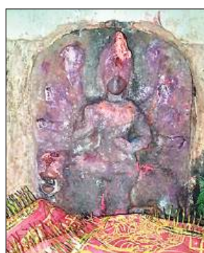
मवई कला के प्राचीन मंदिर में स्थापित समया माता की प्राचीन मूर्ति।

मऊ क्षेत्र में कई प्राचीन देवी मंदिर हैं। पश्चिम पताई में प्राचीन मरीमाता मंदिर, मऊ में आनंदी माता, टिकराटोला में दुर्गा मां, मऊ में खबीसिन माता मंदिर एवं सती चौरा आदि जगहों पर नवरात्र में भारी भीड़ उमड़ती है। प्राचीन एवं धार्मिक महत्व के इन देवी स्थलों पर श्रद्धालुओं को तांता लगा रहता है। इसके बाद भी इन देवी मंदिरों की हालत और आवागमन के लिए रास्तों की कमी लोगों को अखरती है।