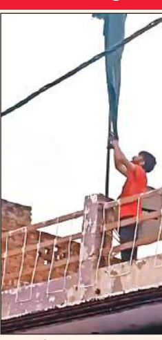
वायरल वीडियो का अंश।