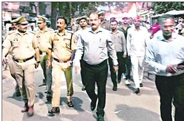
जिलाधिकारी व एसपी ने मार्च कर परखी सुरक्षा व्यवस्था।