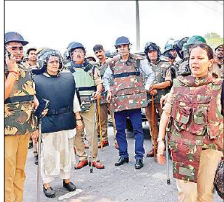
हिंसा पर नियंत्रण की रणनीति बनाती डीएम और एसपी।