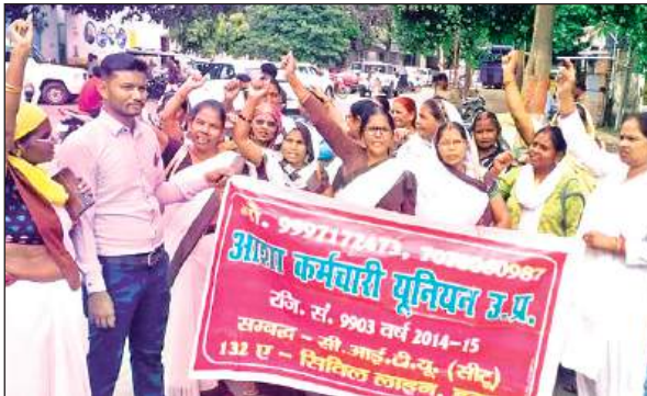
कचहरी में ज्ञापन देने पहुंची आशा कार्यकर्त्रियों।