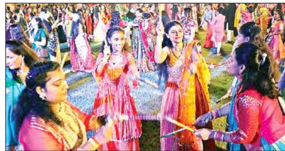
पारंपरिक परिधानों में डांडिया करती महिलाएं।