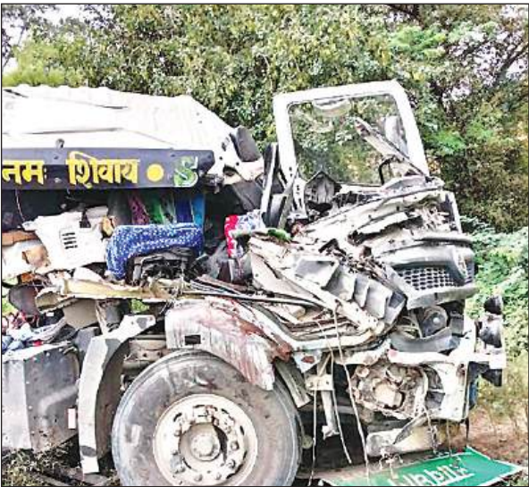
भिड़ंत के बाद क्षतिग्रस्त डंपर।