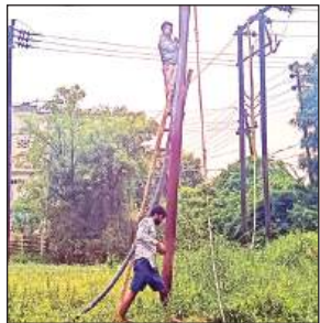
फॉल्ट सही करते विद्युत कर्मी।

अमृत विचार। रात में अचानक हाईटेशन लाइन के ब्रेक डाउन हो जाने से अछल्दा पावर हाउस की विद्युत आपूर्ति ठप हो गई। आपूर्ति ठप होने से लोगों को परेशानियों का आमना करना पड़ा। सुबह जेई ने विद्युत आपूर्ति ठीक कराया तब अछल्दा फीडर की विद्युत शुरू हुई। रविवार रात को अछल्दा पावर हाउस की विद्युत आपूर्ति जारी थी तभी रात 2 बजे करीब बिधुना से अछल्दा पावर हाउस की 33 केबिल में फाल्ट आ गया, जिसके चलते अछल्दा पावर हाउस की आपूर्ति ब्रेक डाउन हो गई। विद्युत आपूर्ति ब्रेक डाउन होने से अछल्दा पावर हाउस के मोहम्दाबाद, रुरुगंज, गुनौली, न्यू