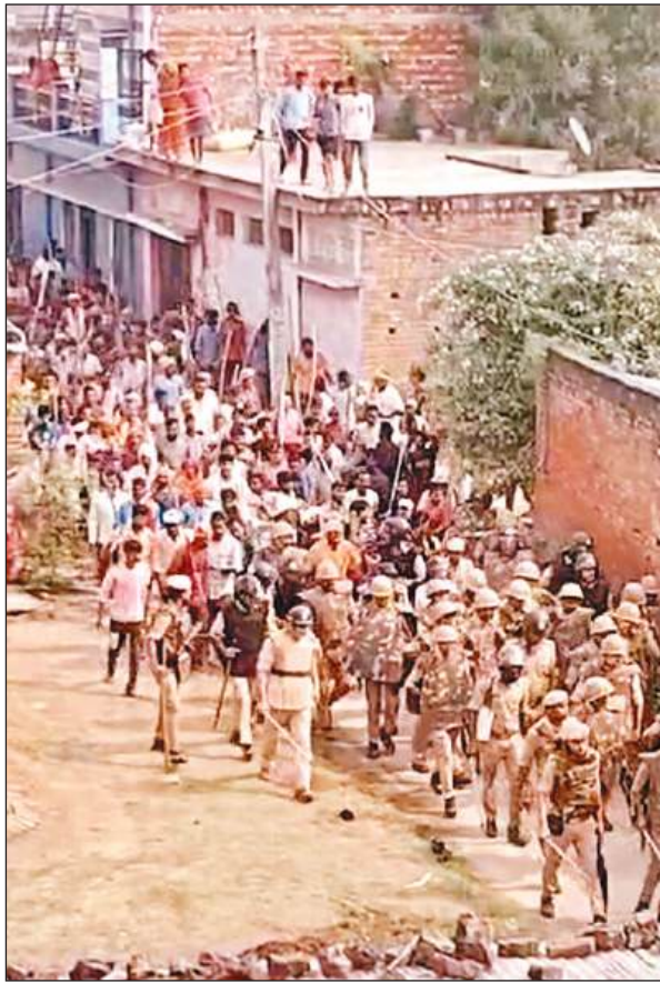
महाराजगंज में उपद्रव के बाद पीएससी के साथ मार्च करती पुलिस।

पांच घंटे तक चला उपद्रव, चपेट में आए कई इलाके, जिले में हाई अलर्ट, प्रमुख स्थानों पर पुलिस तैनात