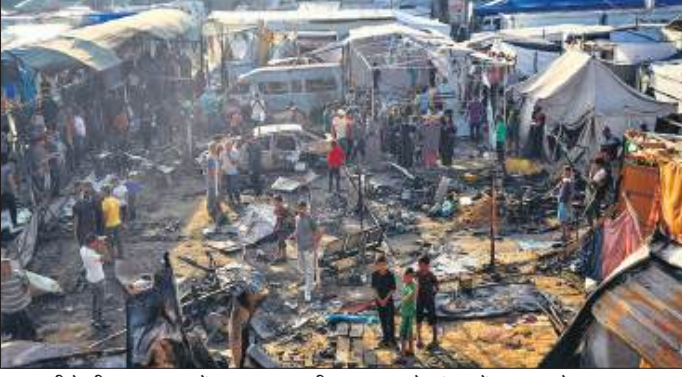
गाजा पट्टी के दीर अल बलाह में अल अक्सा शहीद अस्पताल के प्रांगण में एक तम्बू क्षेत्र पर इजरायली हमले के बाद नुकसान को देखते फिलिस्तीनी।

● इजराइल की राष्ट्रीय बचाव सेवा ने कहा- हमले में घायल हुए 61 लोग