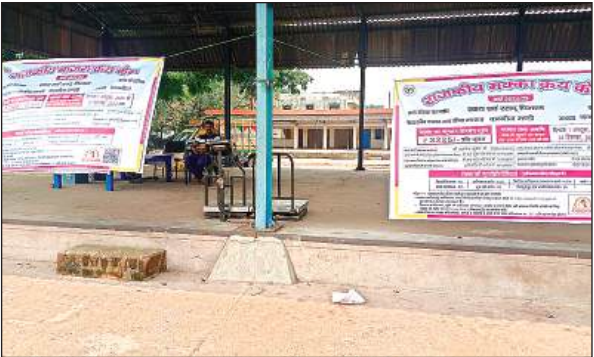
मण्डी समिति में खुला धान, मक्का व बाजरा खरीद केंद्र।