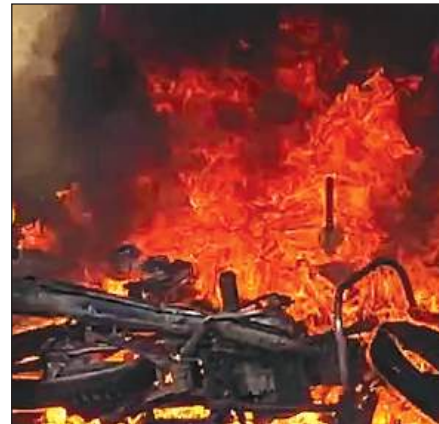
महाराजगंज में उपद्रवियों द्वारा फूकी गई बाइक।