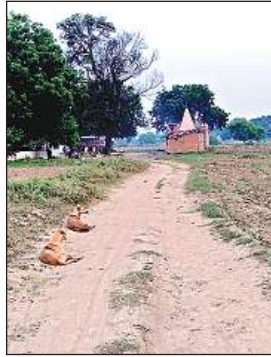
मरी माता जाने के लिए कच्चा रास्ता।