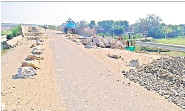
क्षतिग्रस्त पुल का किनारा, सड़क पर लगा गिट्टी का ढेर।

● किशनपुर के तुर्की नाला में बनाया गया था पुल