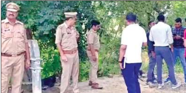
मौके पर जांच-पड़ताल करती पुलिस।

अमृत विचार। कालपी में अज्ञात युवक का कंबल में लिपटा शव मिलने से इलाके में सनसनी फैल गई। मृतक की हत्या सिर कूच कर की गई है। खबर मिलते ही सीओ कोतवाल फॉरेंसिक टीम सहित मौके पर पहुंचकर साक्ष्यों को एकत्रित कर जांच पड़ताल शुरू कर दी। पुलिस ने हत्या का मामला दर्ज कर शिनाख्त के प्रयास शुरू कर दिए हैं। कालपी कोतवाली क्षेत्र में जोल्हूपुर-हमीरपुर हाईवे स्थित लमसर गांव से निकले जोधर नाले के समीप घटोई बाबा मंदिर के पास एक अज्ञात युवक का शव कंबल से लिपटा मिला। मृतक की उम्र करीब