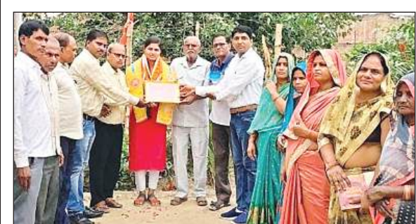
छात्रा को सम्मानित करते महासभा के पदाधिकारी।