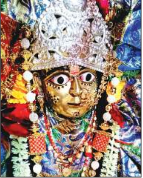
पश्चिम पताई में मरी माता के प्राचीन मंदिर में स्थापित मूर्तियां।