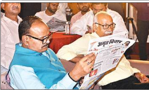
अमृत विचार अखबार पढ़ते उप मुख्यमंत्री ब्रजेश पाठक।