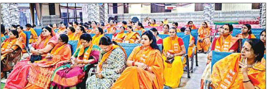
कार्यक्रम में मौजूद विश्व हिंदू परिषद मातृ शक्ति दुर्गावाहिनी की कार्यकर्ता व पदाधिकारी।