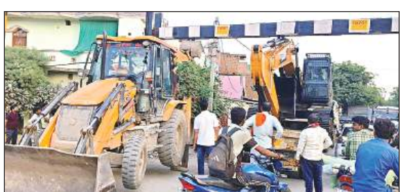
रेलवे फाटक में फेंसा ट्रेलर व लगा जाम।