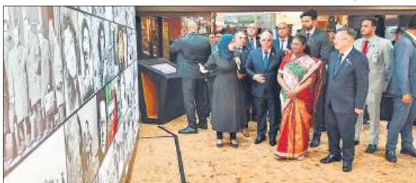
मोडरनाजिहद के राष्ट्रीय संग्रहालय का दौरा करती राष्ट्रपति मुर्मु।

विदेश मंत्रालय ने एक्स पर पोस्ट किया भारत-अल्जीरिया के संबंधों को गति प्रदान कर रहे हैं। राष्ट्रपति ड्रैपदी मुर्मु ने आज अल्जीरिया के राष्ट्रपति