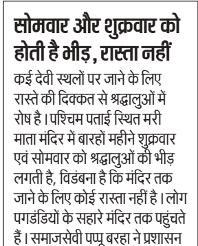
समया माता जाने के लिए कच्चा रास्ता।