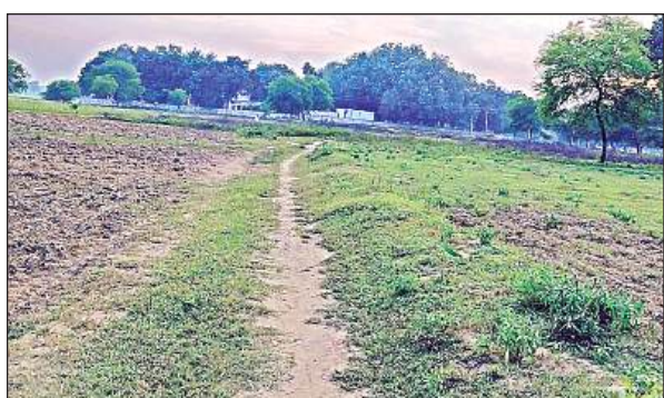
समया माता जाने के लिए कच्चा रास्ता।