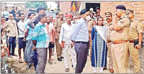
घटना स्थल का निरीक्षण करते अधिकारी।