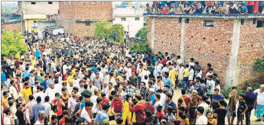
घटना के बाद रेहुवा गांव में भीड़ जमा हो गई, शव के आने के बाद लोगों ने विरोध प्रदर्शन किया।

हालात पर काबू पाने के लिए पुलिस ने लाठीचार्ज करते हुए हवाई फायरिंग की, कई बार आंसू गैस के गोले दागे। सुबह 11 बजे से जिले में इंटरनेट सेवाएं बंद कर दी गईं। इस दौरान 30 से अधिक लोग हिरासत में लिए गए। स्थिति की गंभीरता को देखते हुए डीजीपी मुख्यालय से चार वरिष्ठ आईपीएस, दो एसपी, छह डिप्टी एसपी, एक कंपनी आरएफएफ, तीन कंपनी पीएसी बहराइच भेजी गईं। बहराइच के महसी तहसील स्थित महाराजगंज कस्बे में रविवार को दुर्गा प्रतिमा विसर्जन के दौरान डीजे