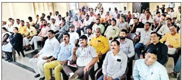
भाजपा जिला कार्यालय में आयोजित कार्यक्रम में मौजूद पार्टी पदाधिकारी व सदस्य।

है। मक्का का न्यूनतम समर्थन मूल्य 2225 रुपये प्रति क्विंटल व बाजरा का न्यूनतम समर्थन मूल्य 2625 रुपये निर्धारित किया गया है। किसान सरकारी खरीद केंद्रों पर मक्का या बाजरा लेकर पहुंचते हैं तो उनके अनाज की जांच की जायेगी। अनाज पूरी तरह से सूखा हुआ होना चाहिये। अनाज में गंदगी नहीं होनी चाहिये। इस के बाद केंद्र किसानों के इन अनाज को खरीद करेंगे।