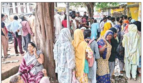
क्रय विक्रय समिति में खाद के लिए लाइन में खड़े महिला व पुरुष।

अमृत विचार। खाद की भीषण किल्लत के चलते किसान खाद पाने के लिए रात दिन खाद वितरण केंद्रों के चक्कर लगा रहा है। रविवार को शाम किसानों को जैसे ही पता चला कि क्रय विक्रय समिति में डीएपी खाद आई है। तो किसान रात से ही लंबी लाइनों में बिना खाए पीए खड़े हो गए। यहां तक बड़ी संख्या में महिलाएं अपना दैनिक काम छोड़कर दो बोरी खाद के लिए दिन निकलने से पहले ही क्रय विक्रय केंद्र के सामने खड़ी हो गई थी। कस्बे की क्रय विक्रय समिति केंद्र में सोमवार की सुबह सैकड़ों की तादाद में महिला आएं पुरुष किसान लाइन में खड़े दिखे। जब इनका