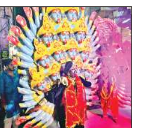
राम बारात में काली माता का करतब दिखाते कलाकार।

अमृत विचार। श्री पंचमुखी दुग्धेश्वर महादेव जी आदर्श रामलीला समिति की तरफ से शहर के एसबीएस कॉलेज ग्राउंड में रामलीला का आयोजन चल रहा है। इस क्रम में श्री राम बारात का आयोजन किया गया। इसमें शामिल करीब 35 झांकियों ने लोगों का मन मोह लिया। श्री राम बारात का शुभारंभ रामलीला स्थल से समिति के पदाधिकारियों द्वारा आरती के साथ किया गया। एसबीएस इंटर कॉलेज ग्राउंड से शुरू हुई बारात नगर की भ्रमण करते हुए देर रात वापस