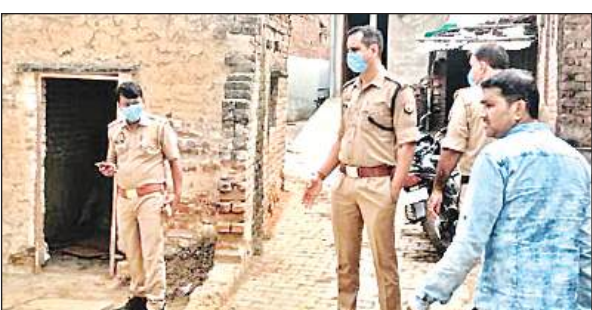
घटनास्थल पर जांच करती पुलिस।