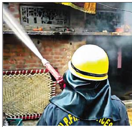
महाराजगंज में उपद्रवियों द्वारा लगाई आग बुझाता दमकलकर्मी।