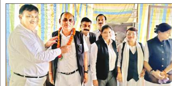
माला पहनाकर नवनिर्वाचित पदाधिकारी को सम्मानित करते अधिवक्ता।