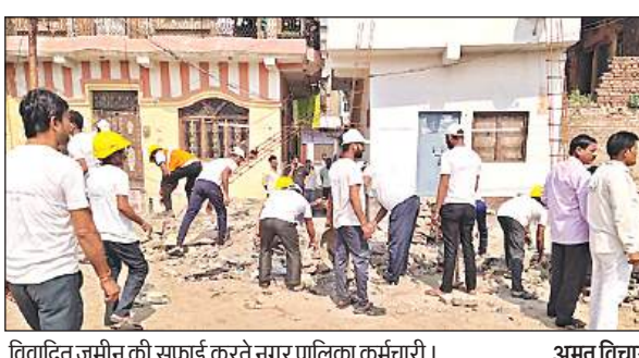
विवादित जमीन की सफाई करते नगर पालिका कर्मचारी।

अमृत विचार। कस्सावान मोहल्ले में जमीन को लेकर दो समुदायों के बीच विवाद चल रहा है। बाल्मीकि जयंती पर यहां होने वाले आयोजन के चलते प्रशासन की देखरेख व कैम्परे की निगरानी में सोमवार को नगर पालिका के कर्मियों ने सफाई अभियान चलाया।