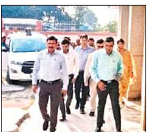
निरीक्षण करते जिलाधिकारी राजेश कुमार।

अमृत विचार। जिलाधिकारी राजेश कुमार पांडेय ने सोमवार को कालपी तहसील का औचक निरीक्षण किया। इस दौरान उन्होंने अधिकारियों की बैठक कर शासकीय कार्यों की समीक्षा करते हुए कार्यों को समय पर निस्तारित करने के निर्देश दिए। निरीक्षण के दौरान उप जिलाधिकारी के कार्यालय में जिलाधिकारी की अध्यक्षता में आयोजित बैठक में जिलाधिकारी ने शासन के द्वारा चलाई जा रही योजनाओं के बारे में बिंदुवार तरीके से समीक्षा की। आईजीआरएस प्रार्थना पत्रों के निस्तारण की वास्तविकता जानी। इसी प्रकार उप जिलाधिकारी एवं तहसीलदार के न्यायालयों में लॉन्ग मुकदमों के निस्तारण की समीक्षा की