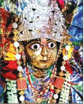
आनंदी माता की प्राचीन मूर्ति।