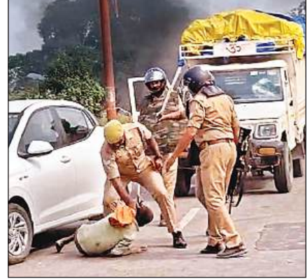
उपद्रव के दौरान आरोपी को दबोचते पुलिसकर्मी।