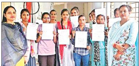
स्लोगन लिखे पोस्टर दिखाती छात्राएं।