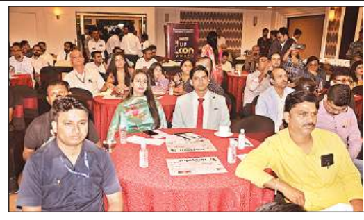
अमृत विचार यूपी कॉन 2024 समारोह में उपस्थित अतिथि।