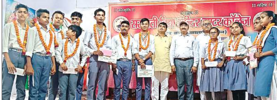
सम्मानित किए गए प्रतिभावन विद्यार्थी।