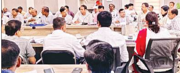
वचन भवन सभागार में अधिकारियों के साथ समीक्षा बैठक करते प्रमुख सचिव।

योजना के अंतर्गत पत्रों की चयन प्रक्रिया शीघ्र पूरी कराई जाए जिससे कि कार्यक्रम समय से पूरा हो सके। पीडब्ल्यूडी विभाग की समीक्षा करते हुए उन्होंने कहा कि मंत्री समूह द्वारा दिए गए निर्देशों को समय से पूरा कराया जाए। साथ ही सेतु निगम के अंतर्गत जो भी बाईपास बनाए जा रहे हैं उनका कार्य शीघ्र पूरा कराया जाए। निर्माण कार्यों के समय यात्रियों की सुविधाओं का भी ध्यान रखें। चिकित्सा विभाग के कार्यों की समीक्षा करते हुए उन्होंने कहा कि आयुष्मान काड अधिक से अधिक लाभाभित्तों तक पहुंचाएं। राशन वितरण में किसी भी प्रकार