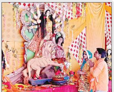
पंडाल में माता की प्रतिमा का पूजन करते भक्त।