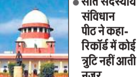
● सात सदस्यीय संविधान पीठ ने कहा- रिकॉर्ड में कोई त्रुटि नहीं आती नजर