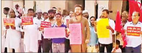
कलेक्ट्रेट में प्रदर्शन करते भाकपा कार्यकर्ता और पदाधिकारी।

इससे पहले भारत की कम्युनिस्ट पार्टी मार्क्सवादी लेनिनवादी भाकपा माले जिलाधिकारी कार्यालय पहुंचकर अमेठी घटना पर विरोध व्यक्त करते हुए जमकर प्रदर्शन किया है। प्रदर्शनकारियों ने कहा कि जिस तरह से उत्तर प्रदेश में कानून व्यवस्था पटरी से उतर चुकी