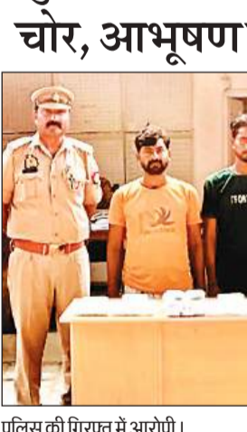
पुलिस की गिरफ्त में आरोपी।