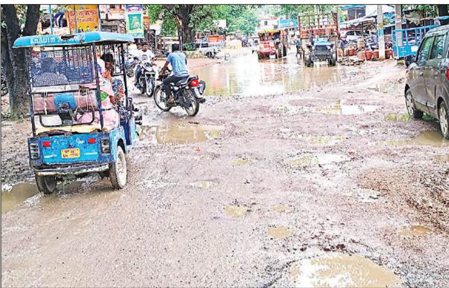
नेवादा बाजार में बदहाल मलिहाबाद-कोथावां मुख्य मार्ग।