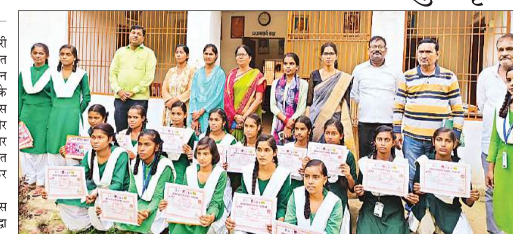
अंतरराष्ट्रीय बालिका दिवस समारोह में मौजूद छात्राएं।