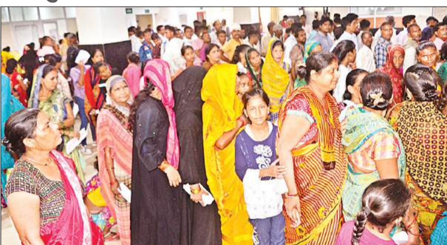
मेडिकल कालेज में मरीजों की लगी कतार।