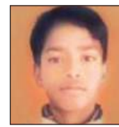
रोशन (फाइल फोटो)