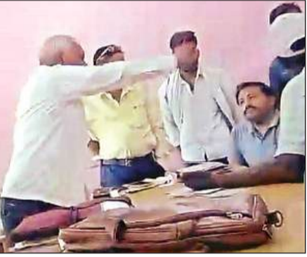
बाढ़ पीड़ित किसान को धमकी देते कानूनगो।

अमृत विचार। सरकार ने बाढ़ की मार से बर्बाद हो चुके किसानों को राहत पहुंचाने का वादा किया है। उसी के लिए बड़े जोर शोर से फीडिंग की जा रही है। सवायजपुर तहसील के बाढ़ पीड़ित किसानों का आरोप है कि लेखपाल फीडिंग के नाम 500-500 रुपये वसूल रहा है। शिकायत एसडीएम के पास पहुंची तो उन्होंने बाढ़ पीड़ित किसानों को कानूनगो के पास भेज दिया। कानूनगो ने बाढ़ पीड़ित किसानों के साथ न सिर्फ गाली-गलौज की, बल्कि जूतों से मारने की धमकी तक दे डाली। कानूनगो ने जो भी बोला, उसका वीडियो सोशल मीडिया पर वायरल हो रहा