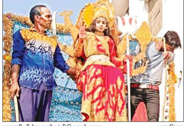
मातारानी की वेशभूषा में झांकी निकालते श्रद्धालु।

अमृत विचार: नवरात्र पर्व के दूसरे दिन दुर्गा जागरण समिति केसरी गंज के तत्वावधान में तहसील क्षेत्र के ग्राम रायपुरगंज स्थित मटिया वाली देवी माता मंदिर प्रांगण से क्षेत्र का प्रसिद्ध सूर्य कुंड मन्दिर तक विशाल शोभायात्रा निकाली गई। गाजे-बाजे के साथ निकली शोभायात्रा में जय श्रीराम के नारे लगाए गए। इस दौरान सजीव झांकियों का प्रस्तुतिकरण किया गया।