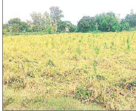
रामपुर मथुरा में खेत में गिरी धान की फसल।