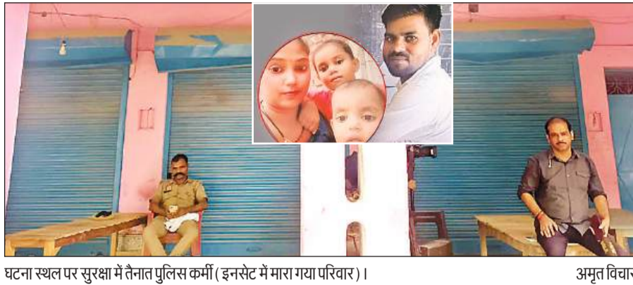
घटना स्थल पर सुरक्षा में तैनात पुलिस कर्मी ( इनसेट में मारा गया परिवार )।