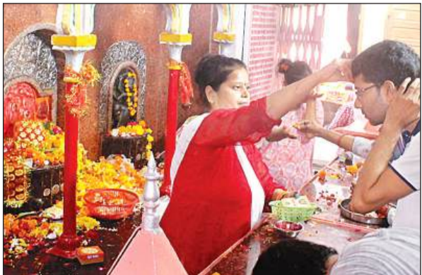
शहर के बड़ी देवी माता मंदिर में दर्शन-पूजन करते भक्त।

विल्व निमंत्रण और आह्वान के साथ ही अखंड ज्योति जलाकर सनातनधर्मियों ने कहीं दुर्गा शप्तसती तो कहीं सहस्रनाम के पाठ शुरू किए। घरों से लेकर देवी मंदिरों तक नवरात्र की आराधना