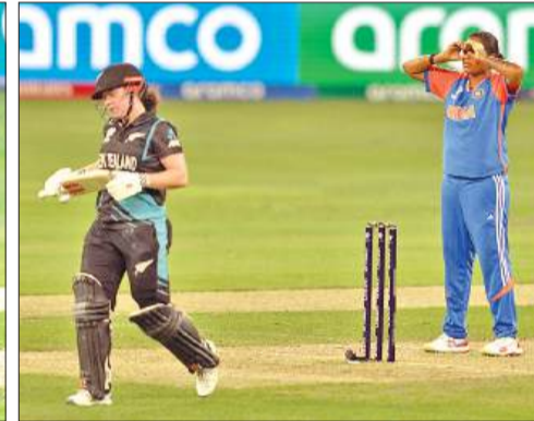
न्यूजीलैंड की पारी के दौरान कप्तान डिवाइन को स्टप करने का प्रयास करती रिचा, भारतीय महिलाओं ने चूके विकेट लेने के कई मौके।

पिच पर स्टोक खेलना मुश्किल लग रहा था लेकिन डिवाइन ने 36 गेंद की अपनी पारी के दौरान सात चौके जड़े। दीर्घ शर्मा ( चार ओवर में बिना विकेट झटके 45 रन) को छोड़कर ज्यादातर भारतीय गेंदबाजों ने पिच का अच्छा इस्तेमाल किया। डिवाइन और बुक हालिडे ( 12 गेंद में 46 रन) ने महज 4.2 ओवर में 16 रन की साझेदारी निभाई जिससे पिच को देखते हुए न्यूजीलैंड अच्छा स्कोर बनाने में सफल रही। न्यूजीलैंड के लिए युवा जॉर्जिया प्लिम्स ने 34 रन और अनुभवी सूजी बेट्स ने 27 रन का योगदान दिया।