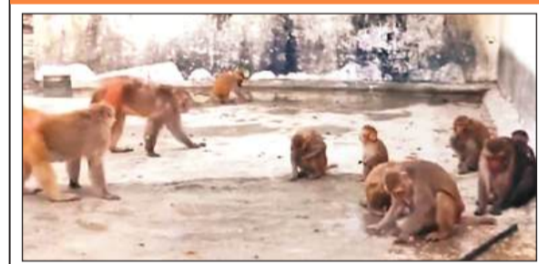
सड़क पर मौजूद बंदरों का झुंड।