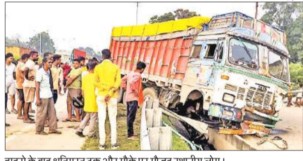
हादसे के बाद क्षतिग्रस्त ट्रक और मौके पर मौजूद स्थानीय लोग।