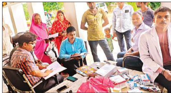
शिविर में लोगों की जांच करती सीएचसी की टीम।

गुजरी रेलवे लाइन पर पहुंच गईं। अभी वह पटरी पर पहुंची ही थीं कि अचानक ट्रेन आ गई। ट्रेन से कटकर दोनों की मौत हो गई। उधर से गुजर रहे ग्रामीणों ने क्षत-विक्षत शव देखा तो द्रवित हो उठे।