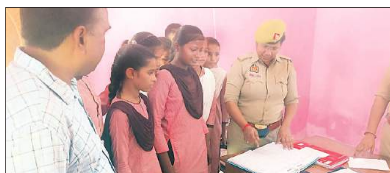
थाने पर कानून की जानकारी लेती स्कूली छात्राएं।