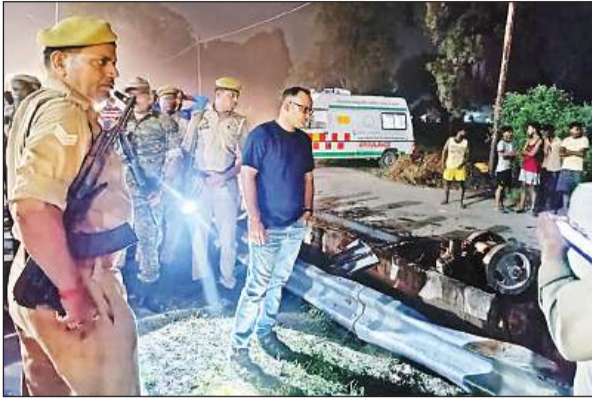
हादसे के बाद घटनास्थल का जायजा लेते अधिकारी।