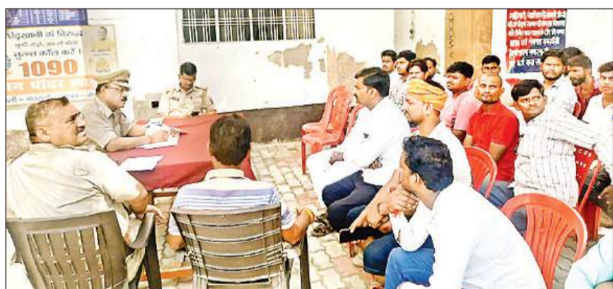
पूजा समितियों के पदाधिकारियों के साथ बैठक करते थानाध्यक्ष।

उप मुख्य विद्युत इंजीनियर-II/निर्माण मुजाहि/विद्युत-144 गोरखपुर गाइडेंस की छतों व पायदान पर कदापि यात्रा न करें।