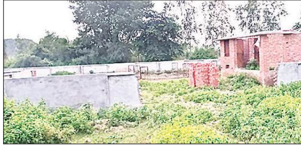
निर्माणधीन पानी की टंकी।

अमृत विचार: विकास खंड हरगांव के सेलूमऊ ग्राम पंचायत में हर घर जल पहुंचाने के लिए जल जीवन मिशन योजना के तहत बनवाई जा रही पानी की टंकी का निर्माण डेढ़ वर्ष गुजर जाने के बाद भी शून्य है। कार्यदायी संस्था अभी तक केवल बाउंड्रीवॉल ही बनावा पाई है। टंकी का निर्माण कार्य तो अभी शुरू भी नहीं हो सका है। निर्माण में देरी से ग्रामीणों में रोष है। लोगों का कहना है कि संस्था की सुस्ती से गांव की लगभग 10 हजार की आबादी को पेयजल परियोजना का लाभ नहीं मिल पा रहा है।