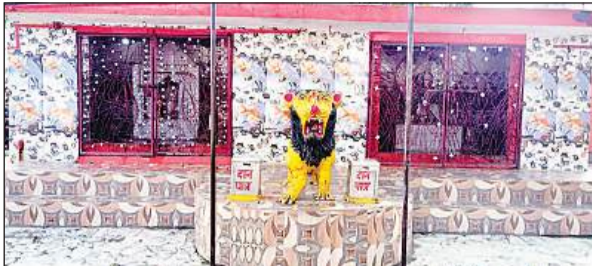
नगर के ठाकुरद्वारा वार्ड स्थित शीतला माता का मंदिर।