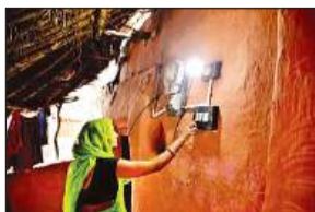
अछूते गांव व मजदूरों तक जलती दिखाई देगी बिजली

साथ ही अयोध्या में काम करवाए जाने के लिए हैदराबाद की कंपनी विश्व समुद्र को टेंडर किया जा चुका है। जल्द ही कंपनी द्वारा काम की शुरुआत की जाएगी। जिससे विद्युतीकरण से अछूते गांव को रोशन किया जा सकेगा। जिले में