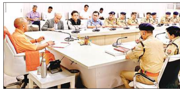
सरकारी आवास पर अधिकारियों के साथ समीक्षा बैठक करते हुए मुख्यमंत्री योगी।

अमृत विचार : मुख्यमंत्री योगी आदित्यनाथ ने कहा है कि मृतक आश्रितों के प्रकरण में आश्रित की आयु को ध्यान में रखते हुए नियमों में बदलाव पर विचार हो। फिजिकल परीक्षण के नियम व्यावहारिक होने चाहिए। मृतक आश्रितों के प्रकरण का तय समय सीमा के भीतर निस्तारित होना सुनिश्चित करें। इसी कड़ी में उन्होंने पुलिस कार्मिकों को 'ई-पेंशन' से जोड़ने के निर्देश दिए। शुक्रवार को अपर पुलिस महानिदेशक स्तर के सभी अधिकारियों के साथ अपने