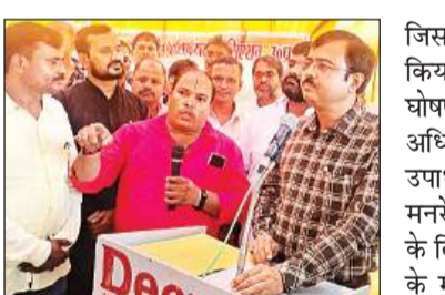
डीसी मनरेगा को ज्ञापन सौंपते रोजगार सेवक।