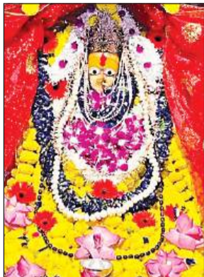
मां का किया गया भव्य श्रृंगार।

सुबह से रात तक पूजा पंडालों में दिखी आस्था, हुए धार्मिक आयोजन