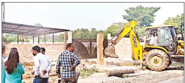
अवैधनिर्माण हटता बुलडोजर।