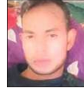
सनोहर (फाइल फोटो)