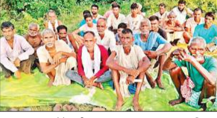
भूख हड़ताल पर बैठे ग्रामीण।