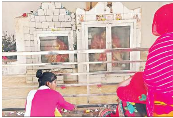
फूलमती देवी मंदिर में पूजन करती महिलाएं।

शारदीय नवरात्रि के दूसरे दिन घरों से लेकर देवी माता के मंदिरों में विधिवत पूजा अर्चना की। रोली, सुपारी, पान, पुष्प, मिष्ठान, धूप दीप आदि से माता रानी की पूजा की और जयकारे लगाए। घरों से लेकर मंदिरों में दुर्गा सप्तशती पाठ का जाप किया गया और फिर महा आरती का गुणगान करते हुए भक्ति का वातावरण बनाया गया। अंबे तू है जगदंबे मैया जय काली मां खपरवाली... की आरती पर भक्ति झूम उठे। पूरे दिन उपवास रखकर शाम को एक बार फिर से देवी माता के श्री चरणों में शीश नवाया और महा आरती का गुणगान किया। शहर के प्रमुख देवी मां के मंदिरों में भक्तों की धूम रही। श्री श्रवण देवी मंदिर, फूलमती देवी मंदिर, श्री दुर्गा देवी मंदिर, श्री काली माता मंदिर समेत अन्य मंदिरों में भक्तों का तांता लगा रहा।