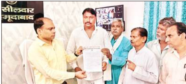
समस्या को लेकर एसडीएम को ज्ञापन सौंपते कांग्रेस कार्यकर्ता।