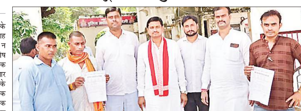
सराफा व्यापारी से लूट के खुलासे को लेकर एसपी कार्यालय पहुंचे व्यापारी नेता।