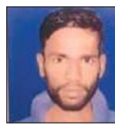
सूरज (फाइल फोटो)