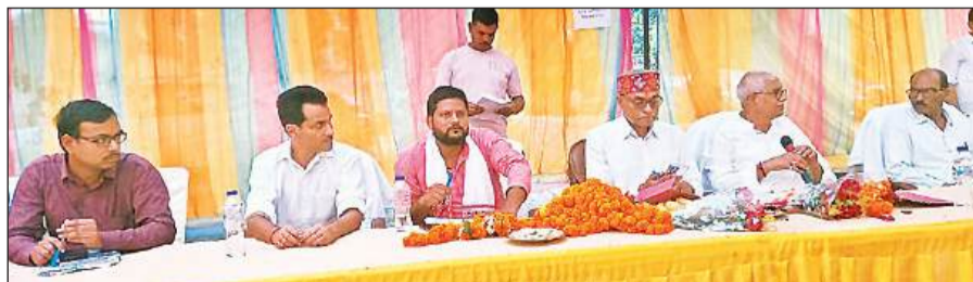
क्षेत्र पंचायत की बैठक में उपस्थित जनप्रतिनिधि व अधिकारी।

अमृत विचार। विकासखंड संग्रामपुर परिसर में क्षेत्र पंचायत की बैठक आयोजित की गई। पिछले वर्ष 21 अगस्त को बैठक की गई थी। उस बैठक में 116 काम अंकित किए गए थे, 37 कार्य पूर्ण हो चुका है, शेष कार्य चल रहा है। विकास की गति को बढ़ाने के लिए ब्लॉक प्रमुख कल्लन देवी व संजीव सिंह (रामू) के निमंत्रण पर मुख्य अतिथि एमएलसी शैलेंद्र प्रताप सिंह, जिला पंचायत अध्यक्ष राजेश अग्रहरि, जिला पंचायत सदस्य मुकेश यादव की उपस्थिति में बैठक की गई। बैठक में जल जीवन मिशन विभाग अनुपस्थित रहा। इस बैठक के माध्यम से खादी ग्रामोद्योग विभाग के महेंद्र मिश्रा ने