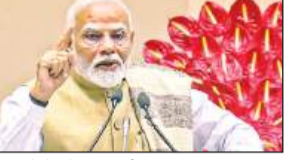
● बोले- देश आर्थिक वृद्धि का सफर जारी रखने को बदलावों से गुजर रहा है।

नई दिल्ली, एजेंसी प्रधानमंत्री नरेंद्र मोदी ने वैश्विक अनिश्चितता के बीच भारत को आकर्षक स्थल बताते हुए शुक्रवार को कहा कि देश उच्च आर्थिक वृद्धि का सफर जारी रखने के लिए व्यापक स्तर पर बदलावों से गुजर रहा है। प्रधानमंत्री मोदी ने कौटिल्य आर्थिक सम्मेलन के तीसरे संस्करण में कहा कि उनकी सरकार 2047 तक भारत को एक विकसित राष्ट्र बनाने में मदद करने के लिए संरचनात्मक सुधारों को जारी रखने को प्रतिबद्ध है। उन्होंने कहा कि नौकरियों का सृजन, कौशल विकास, टिकाऊ वृद्धि और लगातार तेज गति से विस्तार पर उनके तीसरे कार्यकाल विशेष जोर