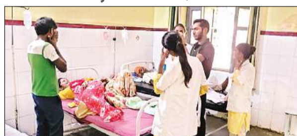
लालगंज सीएचसी में एक बेड पर लेटे दो मरीज।

जिस सामुदायिक स्वास्थ्य केंद्र में अगर दो फिजिशियन की तैनाती हो तो लालगंज, सरेनी, खीरों, रुक्मेश्वरगंज