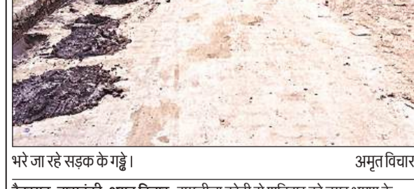
भरे जा रहे सड़क के गड्डे।