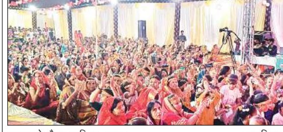
जागरण के दौरान उपस्थित श्रद्धालु।