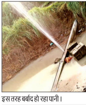
इस तरह बर्बाद हो रहा पानी।

अमृत विचार। एक ओर तो पानी के बचाने की बातें होती हैं, दूसरी ओर कई बार जिम्मेदारों की जिम्मेदारी पर शक होने लगता है। पियरियामाफ्री अतरसुई मार्ग पर स्थित गोशाला के पास पाइप लाइन से हफ्तों से पानी बहकर बर्बाद हो रहा है। बताया जाता है कि यह पाइप लाइन लीकेज की वजह से है। ग्रामीणों के अनुसार एल एंड टी संस्था सहित जल जीवन मिशन