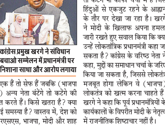
● कांग्रेस प्रमुख खरगे ने संविधान बचाओ सम्मेलन में प्रधानमंत्री पर निशाना साधा और आरोप लगाया

मुंबई, एजेंसी कांग्रेस प्रमुख मल्लिकार्जुन खरगे ने रविवार को एक हैं तो सेफ हैं और बंटेंगे तो कटेंगे नारों की आलोचना करते हुए आरोप लगाया कि भारत को राष्ट्रीय स्वयंसेवक संघ (आरएसएस), भारतीय जनता पार्टी (भाजपा), प्रधानमंत्री नरेंद्र मोदी और गृह मंत्री अमित शाह से खतरा है। खरगे ने मुंबई में संविधान बचाओ सम्मेलन को संबोधित करते हुए प्रधानमंत्री पर निशाना साधा और आरोप लगाया कि संसद में चर्चा और बहस की अनुमति नहीं है। खरगे ने कहा, प्रधानमंत्री कहते