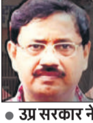
● उग्र सरकार ने सुप्रीम कोर्ट को दी जानकारी