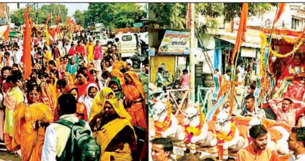
रथों में सजाई गई झांकियां।

के बजरंग चौक स्थित हनुमान मंदिर में विश्व हिन्दू महासंघ के तत्वावधान में प्रति वर्ष राम धुन यात्रा निकाली जाती है। इसी क्रम में रविवार को गाजे बाजे और धूमधाम के साथ राम धुन संकीर्तन यात्रा