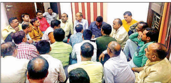
बैठक कर कार्यक्रम की रूपरेखा बनाते ट्रस्ट के पदाधिकारी।

रामविवाह और भंडारे की सौंपी गई जिम्मेदारी