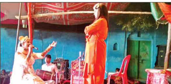
रामलीला में फिरदार निभाते कलाकार।

लीला की शुरुआत राम लक्ष्मण एवं सीताजी के दंडक वन में कुटिया बनाकर रहने के दृश्य से हुई। इस दौरान लंका के राजा रावण की वहन सूपनखा आ जाती है और वह श्रीराम जी से शादी करने की इच्छा जाहिर करती है तभी वह अपने छोटे भाई लक्ष्मण के पास भेज देते हैं इस तरह वह जब गुस्सा होकर के अपने राक्षसी रूप में प्रकट होती है तो लक्ष्मण उसकी नाक कान काट लेते हैं यहीं से रावण और राम के युद्ध की शुरुआत हो जाती है। सूपनखा खरदूसण के पास जाती है और वह युद्ध में लड़ने आते हैं, जिन्हें रामजी