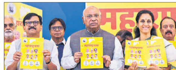
मुंबई में एमवीए का घोषणा पत्र जारी करते कांग्रेस अध्यक्ष मल्लिकार्जुन खरगे, शिवसेना (यूबीटी) सांसद संजय राउत और एनसीपी (एसपी) सांसद सुप्रिया सुले।

विपक्षी गठबंधन महा विकास आघाडी (एमवीए) ने महाराष्ट्र विधानसभा चुनाव के लिए रविवार को अपना घोषणापत्र जारी किया जिसमें नौ से 16 वर्ष की लड़कियों के लिए सविकल कैंसर के मुफ्त टीके और मासिक धर्म के दौरान महिला कर्मचारियों के लिए दो वैकल्पिक अवकाश का वादा किया गया है। महाराष्ट्रनामा शोर्षक वाले घोषणापत्र में जाति आधारित जगणणना, स्वयं सहायता समूहों के सशक्तिकरण के लिए अलग विभाग की स्थापना, बाल कल्याण के लिए मंत्रालय का गठन और महिलाओं को हर साल 500 रुपये की दर से छह रसोई गैस सिलेंडर देने का भी वादा किया गया है। गठबंधन ने महिलाओं और बच्चों की सुरक्षा के लिए निर्भय महाराष्ट्र नीति बनाने और शक्ति कानून लागू करने का