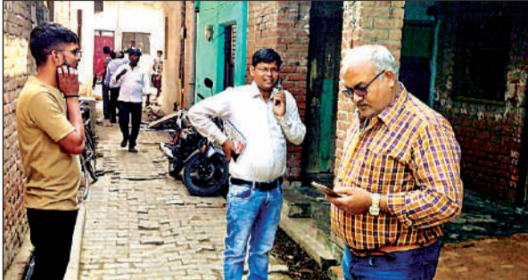
घरों में बिजली मीटर चेकिंग करते बिजली विभाग के अधिकारी।