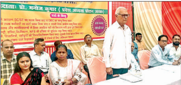
शैक्षिक संगोष्ठी में भाग लेते मुख्य अतिथि व शिक्षक।