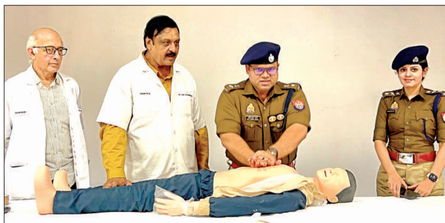
पुलिस लाइन में आयोजित प्रशिक्षण में सीपीआर का अभ्यास करते एसपी व मौजूद विशेषज्ञ डॉक्टर। अमृत विचार

अमृत विचार। वर्तमान में यातायात माह चल रहा है। इसके क्रम में रिजर्व पुलिस लाइन कन्नौज में पुलिसकर्मियों को आपात स्थिति में व्यक्ति को जान के लिए सीपीआर के प्राथमिक उपचार का प्रशिक्षण दिया गया। प्रशिक्षण के दौरान आपात स्थिति में पीड़ित को बचाने के लिए प्राथमिक उपचार देने के उद्देश्य से पुलिसकर्मियों को आवश्यक जानकारी दी गई। प्रशिक्षण के दौरान बताया गया कि सीपीआर एक जीवन रक्षक तकनीक है जो हृदय गति रुकने की स्थिति में किसी व्यक्ति की जान बचाने में मदद कर सकती