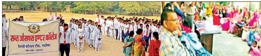
रैली में शामिल छात्र-छात्राएं व कार्यक्रम में जानकारी देते अधिकारी।

संत जोसफ्स इंटर कालेज के प्रधानाचार्य द्वारा जागरूकता रैली को हरी झंडी दिखाकर रवाना किया गया। रैली द्वारा छात्र छात्राओं की भारी भीड़ नजर आई साथ में शिक्षक भी मौजूद रहे। रैली बजरिया, जकरिया पीर सहित आसपास के मोहल्लों से होते हुए विद्यालय में समाप्त हुई। रैली के दौरान छात्र