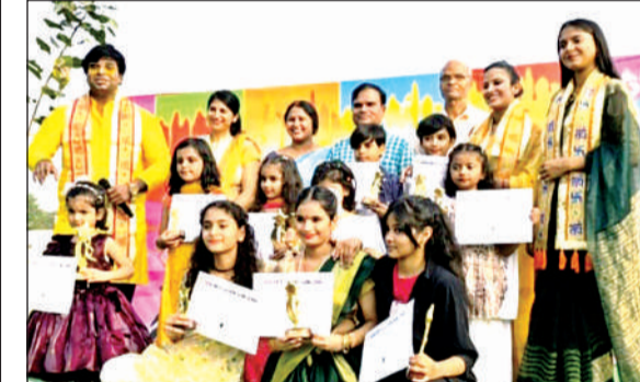
प्रमाण पत्र के साथ मौजूद बच्चे।