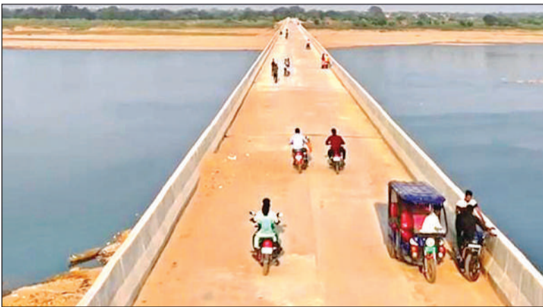
पुल से आवागमन करते हुए लोग।