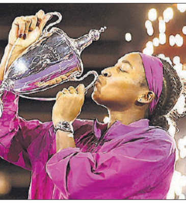
जीत के बाद ट्रॉफी के साथ कोको गॉफ ने कुछ इस अंदाज में खुलासा जश्न। >>

● ओलंपिक चैंपियन झेंग किनवेन को हराकर अमेरिकी खिलाड़ी ने जीता अपना पहला डब्ल्यूटीए फाइनल्स खिताब