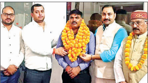
नव निर्वाचित नगर अध्यक्ष को माला पहनाने व्यापारी।

बिचार (हमीरपुर)। थानाक्षेत्र के करगांव गांव मौजे में प्रस्तावित बिजली उपकेंद्र पर लगाया गया बोर्ड अज्ञात युवकों ने उखाड़कर फेंक दिया। अवर अभियंता की तहरीर पर रिपोर्ट दर्ज की गई है। क्षेत्र के करगांव में 33 केवी पावर सब स्टेशन का निर्माण कार्य के लिए शासन से बजट आ चुका है। इसकी देखरेख जेई मान सिंह कर रहे हैं जमीन को चिन्हित कर ती गई है। निर्माण स्थल पर बोर्ड लगाया गया है, लेकिन यहां लगे बोर्ड को अज्ञात युवकों ने उखाड़कर फेंक दिया है। इस मामले में जेई ने अज्ञात युवकों के खिलाफ सरकारी कार्य में बाधा डालने की तहरीर दी है। पुलिस ने बताया कि रिपोर्ट दर्ज कर अज्ञात युवकों की तलाश कर कार्रवाई की जाएगी।