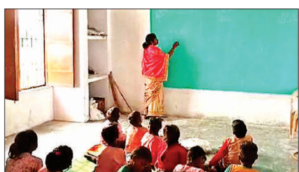
साधन विहीन स्कूल में बच्चों को पढ़ाती शिक्षिका

अमृत विचार । एक ओर सरकारी शिक्षा को लेकर बड़े-बड़े दावे करते हुए सर्व शिक्षा के नाम पर करोड़ों-अरबों रुपया पानी की तरह बहा रही है। लेकिन कुछ प्राथमिक विद्यालय की हकीकत देख कर लगता है कि आखिर इतना रुपया कहाँ खर्च हो रहा है। जबकि कई विद्यालय तो मूलभूत सुविधाओं से ही महारूम हैं। इस क्रम में जिला मुख्यालय से करीब 15 किलोमीटर की दूरी पर राजेपुर ब्लॉक क्षेत्र में तीसराम की मड़ैया ग्राम में एक प्राथमिक विद्यालय है। जहाँ अत्यवस्थाओं का आलम यह है कि पीने के पानी के लिए बच्चों को दूर तक जाना पड़ता है। गांव के नाम पर ही यह स्कूल है। गांव से करीब एक किलोमीटर दूर गंगा है। बाढ़ से विद्यालय भवन