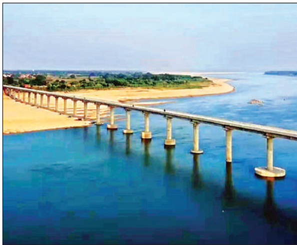
यमुना नदी पर बना महिला पुल।

इस पुल के बन जाने से चित्रकूट में मऊ के साथ सीमावर्ती कौशांबी जिले के महिला व सराय अकिल सहित की लगभग साढ़े पांच लाख की आबादी को सीधा लाभ होगा। इसके साथ ही प्रयागगढ़, फतेहपुर और प्रयागगढ़ आने-जाने के लिए लोगों को सहूलियत भी होगी।