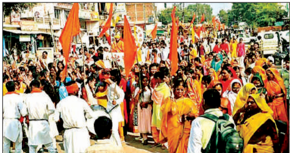
यात्रा के दौरान उमड़ी भक्तों की भारी भीड़।

अमृत विचार। विश्व हिन्दू महासंघ के तत्वावधान में रविवार को दोपहर एक बजे से बजरंग चौक स्थित हनुमान मंदिर से गाजेबाजे के साथ श्रीराम धुन संकीर्तन यात्रा भव्य तरीके से निकाली गई। यात्रा के दौरान सैकड़ों राम भक्तों की भीड़ हाथों में भगवा ध्वज लहराते और जय श्रीराम के उद्घोष करते हुए चल रहे थे। यात्रा दौरान वाहनों पर कई दर्जन धार्मिक झांकियां सजाई गईं, जो आकर्षण का केंद्र रही। यात्रा के दौरान डीजे पर राम के गीत व भजनों को सुन भक्त राम भक्ति में डूबे नजर आए। शहर के मोहल्ला सुभाषनगर