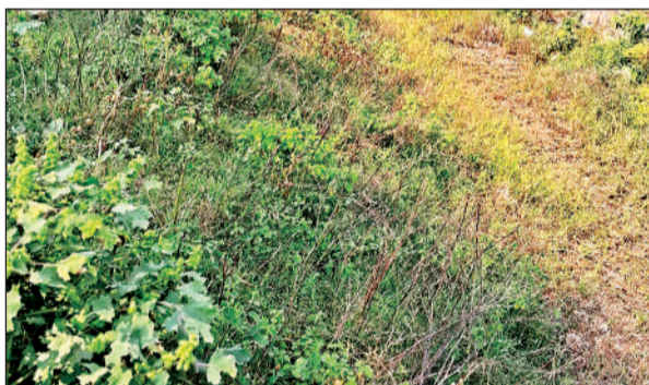
पानी न छोड़े जाने से सूखी पड़ी नहर।

रबी फसल की बुआई में पलेवा के लिए जमीन पूरी तरह से तैयार है लेकिन सिंचाई के लिए नहरों में पानी न छोड़े जाने से किसान पूरी तरह से परेशान हैं। जिले सहित चरखारी, कबरई व हमीरपुर जनपद तक के हजारों हेक्टेयर भूमि की सिंचाई अर्जुन बांध और सिलारपुर बांध से की जाती है। इन बांधों से निकली नहरों में अभी तक सिंचाई विभाग द्वारा पानी नहीं छोड़ा गया, जिससे नहरे सूखी पड़ी हुई हैं। नवम्बर माह में ही सिंचाई का पूरा रोस्टर विभाग