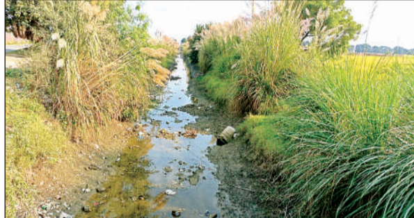
बिना पानी के सूखी पड़ी माइनर।

इन दिनों माइनर से पानी मिलना तो दूर विभागीय अधिकारियों की ओर से इनकी सफाई तक नहीं कराई जा रही है। कटौली झाड़ियों के कारण माइनर दिखाई तक नहीं देती। सरकारी ट्रैक्टर से कोई राहत नहीं