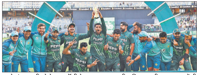
वनडे श्रृंखला जीतने के बाद ट्रॉफी के साथ जश्न मनाती पाकिस्तान टीम।

घरेलू टीम कप्तान पैट कर्मिस, स्टीव स्मिथ, जोश हेजलवुड, मिचेल स्टार्क और मार्नस लाबुशेन के बिना खेल रही थी। इन सभी को भारत के खिलाफ शुरू हो रही पांच मैच की टेस्ट श्रृंखला के 22 नवंबर से पर्थ में शुरू होने वाले पहले मैच की तैयारियों के लिए आराम दिया गया था। सईम अयूब (42 रन) और अब्दुल्ला शफीक (37 रन) ने फिर पहले विकेट के लिए 84 रन की शानदार साझेदारी निभाकर मजबूत नींव रखी। पर