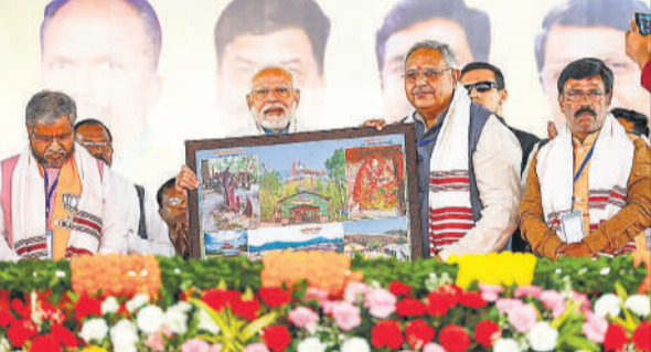
गुमला जिले में एक रैली के दौरान झारखंड भाजपा अध्यक्ष बाबूलाल मरांडी और अन्य द्वारा प्रधानमंत्री नरेंद्र मोदी का अभिनंदन किया गया।

बोकारो, एजेंसी प्रधानमंत्री नरेंद्र मोदी ने रविवार को आरोप लगाया कि कांग्रेस अनुसूचित जाति, अनुसूचित जनजाति और अन्य पिछड़ा वर्ग (ओबीसी) को तोड़कर उन्हें छोटी-छोटी जातियों में बांटना चाहती है। उन्होंने झारखंड की जनता को एकजुट रहने का संदेश देते हुए एक हैं तो सेफ (सुरक्षित) हैं का नारा भी बुलंद किया। झारखंड विधानसभा चुनाव के मद्देनजर यहां एक रैली को संबोधित करते हुए मोदी ने दावा किया कि कांग्रेस ने देश की आजादी के बाद समाज के इस बिखराव का चुनावी फायदा उठाया और केंद्र में सरकारें बनाती रही। उन्होंने कहा, कांग्रेस हमेशा से