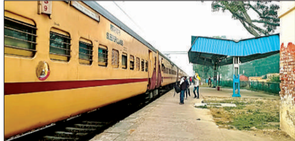
कंचौसी स्टेशन में खड़ी ऊंचाहार एक्सप्रेस।