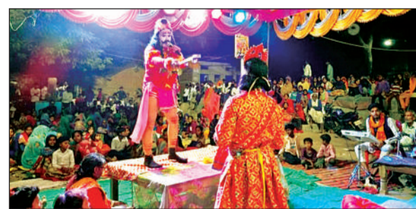
रामलीला में मंचन करते कलाकार।

धार्मिक झांकियां सजाई गईं, जिसे देखने के लिए लोग छल्लों और सड़क किनारे लोगों की भीड़ नजर आई। दर्जनों झांकियां यात्रा में डमरू नाथ टीम उज्जैन और महाराष्ट्र के डोल आकर्षण का केंद्र रहे। यात्रा समाप्त होने के बाद हनुमान मंदिर में महाआरती और प्रसाद वितरण का आयोजन किया गया। यात्रा को शांतिपूर्ण ढंग से संपन्न कराने के लिए पुलिस व्यवस्था की गई साथ ही जुलन मार्गों से यात्रा निकाली वहां के चौराहों, तिराहों पर पुलिस द्वारा बैरिकेडिंग कर वाहनों के आवागमन पर रोक लगाई गई और यात्रा निकलने के बाद ही मार्ग की यात्रायात व्यवस्था को बहाल किया गया।