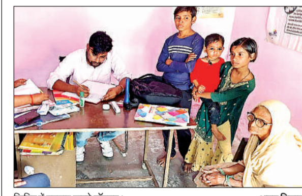
शिविर में उपचार करते डॉक्टर।