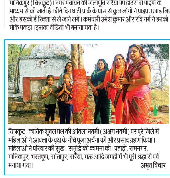
चित्रकूट। कार्तिक शुक्ल पक्ष की आंवला नवमी (अक्षय नवमी) पर पूरे जिले में महिलाओं ने आंवला के वृक्ष के नीचे पूजा अर्चना की और प्रसाद ग्रहण किया। महिलाओं ने परिवार की सुख-समृद्धि की कामना की। पहाड़ी, रामनगर, मानिकपुर, भरतकूप, सीतापुर, संरैया, मऊ आदि जगहों में भी पूरी श्रद्धा से पर्व मनाया गया।