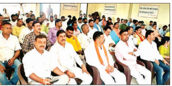
कार्यशाला में मौजूद भाजपा कार्यकर्ता, पदाधिकारी व जनप्रतिनिधि।

कहा कि राष्ट्रीय व प्रदेश स्तर की कार्यशाला हो चुकी है अब जिला स्तर की कार्यशाला हो रही है। बीजेपी विश्व की सबसे बड़ी पार्टी है जिसके 10 करोड़ से ज्यादा सदस्य हैं। रविवार को उन्होंने कहा कि पार्टी में प्रत्येक चुनाव लोकतांत्रिक तरीके से होता है। वहीं परिवारवादी पार्टियों में एक ही परिवार से अध्यक्ष होता है। हम सब को बुध समिति का सही गठन करना है जो एक