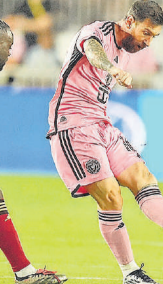
अटलांटा युनाइटेड के खिलाफ गेंद को गोल में दागते इंटर मियामी के मेस्सी >>

स्टार फुटबॉलर लियोनेल मेस्सी की इंटर मियामी टीम को शुरुआती चरण में ही एमएलएस कप से बाहर करके अटलांटा युनाइटेड ने बड़ा उलटफेर कर दिया। जमाल थियरे के दो गोल और बर्टोज स्लाइज के 76वें मिनट में लगाए गए हेडर के दम पर अटलांटा ने बीती रात इंटर मियामी को 3-2 से हराकर एमएलएस कप प्लेआफ पहले दौर का बेस्ट आफ थ्री मुकाबला जीता। आखिरी मिनटों में मेस्सी की दो प्रो किक बरकरार गईं। उन्होंने 65वें मिनट में हेडर पर बराबरी का गोल दागकर स्कोर 2-2 जरूर किया था लेकिन मेजबान टीम कभी बढ़त नहीं बना सकी। कागजों पर इससे बड़ा उलटफेर नहीं हो सकता। इंटर मियामी ने मेस्सी के लिये इस सत्र में 20, 446,667 डॉलर मुआवजा दिया जो अटलांटा की टीम के वेतन से 50 लाख डॉलर ज्यादा है।