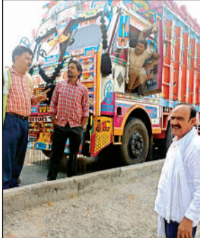
खड़े वाहनों को हटवाते अधिकारी।