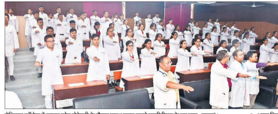
मेडिकल कॉलेज में व्हाइट कोट सेरेमनी के दौरान शपथ ग्रहण करते एमबीबीएस के नए छात्र-छात्राएं।