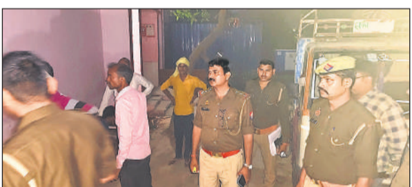
सीएचसी में मौजूद पुलिस व अन्य।