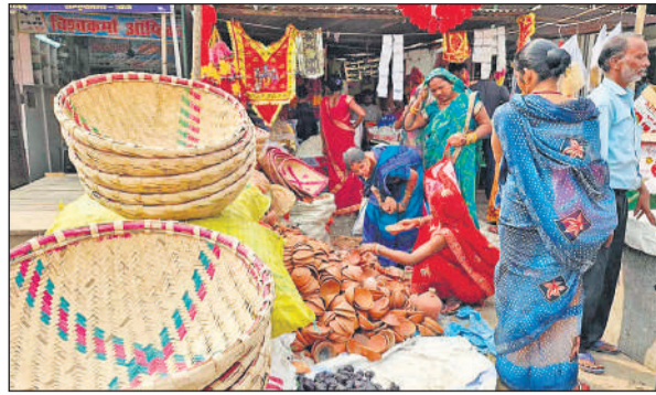
छठ पूजा के लिए डाला व दिये खरीदती महिलाएं।