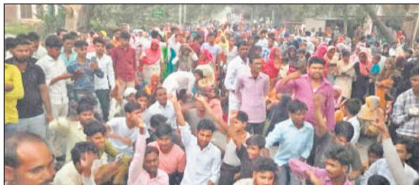
खीरी-लहरपुर मार्ग पर जाम लगाकर प्रदर्शन करते ग्रामीण।