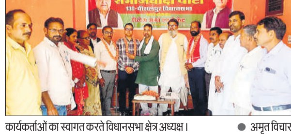
कार्यकर्ताओं का स्वागत करते विधानसभा क्षेत्र अध्यक्ष।

अमृत विचार: समाजवादी पार्टी की विधानसभा स्तरीय मासिक बैठक बुधवार को स्थानीय कार्यालय पर संपन्न हुई। जिसमें संगठन को मजबूत बनाने पर जोर दिया गया। वरिष्ठ नेता हरिपाल लोधी ने कहा कि सभी कार्यकर्ता राष्ट्रीय अध्यक्ष अखिलेश यादव की नीतियों एवं कार्यक्रमों को जन-जन तक पहुंचाने का काम करें। बृथ स्तर पर बैठक कर संगठन को मजबूत बनाएं। अभी से आगामी विधान सभा चुनाव 2027 की तैयारियां कर ली