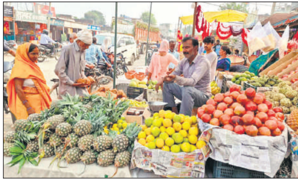
पूजा के लिए फल खरीदते ग्रामीण।