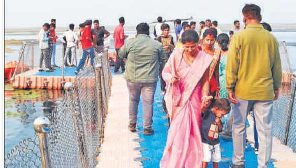
शारदा डेम में तेरते पुल से होकर गुजरते सैलानी।