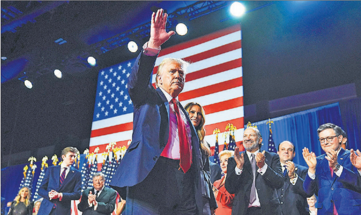
पाम बीच कन्वेंशन सेंटर में पत्नी मेलानिया ट्रंप के साथ पूर्व राष्ट्रपति डोनाल्ड ट्रंप।