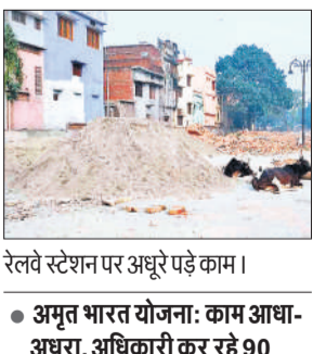
रेलवे स्टेशन पर अधूरे पड़े काम।

रेलवे ने यात्रियों को स्टेशन पर एयरपोर्ट जैसी सुविधाएं मुहैया कराने के लिए कार्याकल्प कराने की शुरुआत की। इसके तहत मैलानी जंक्शन को 18 करोड़ रुपये से नई सुविधाओं के साथ अपग्रेड करने का आगाज किया। इसके तहत सीओपी, वॉटिंग रूम, टॉयलेट, रेनोवेशन, प्लेटफॉर्म सरफेस प्रेनाइट, स्टेशन बिल्डिंग, रूफिंग सर्कुलेंटिंग रोड, सर्कुलेंटिंग ड्रेन, फसाड सहित अन्य तमाम