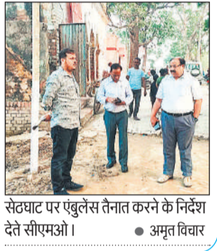
सेटघाट पर एंबुलेंस तैनात करने के निर्देश देते सीएमओ।

छठ पर्व को लेकर बुधवार को सीएमओ डॉ संतोष गुप्ता सेट घाट पहुंचे। उन्होंने पूजा स्थल पर आने वाले श्रद्धालुओं को स्वास्थ्य संबंधी किसी भी तरह की समस्या होने पर तत्काल उपचार मुहैया कराने के लिए मय स्टॉफ के 108 एम्बुलेंस की 7 और 8 नवंबर को सेटघाट पर उपस्थित रहने के निर्देश दिए हैं। स्वास्थ्य टीम में डॉक्टर, फार्मासिस्ट, वाई बॉय सहित एक चतुर्थ श्रेणी कर्मचारी की ड्यूटी लगाई है। एसीएमओ डॉ अनिल गुप्ता, स्ट्रेनो कार्टिकिंग मिश्रा आदि मौजूद रहे।