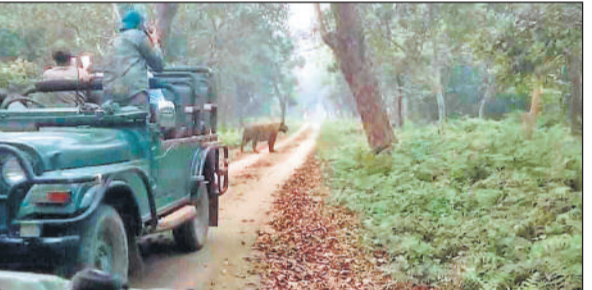
सैलानी द्वारा कैमरे में कैद किया गया बाघ।

दुधवा नेशनल पार्क व किशनपुर सेंचुरी बुधवार से पर्यटकों के लिए खोल दी गई है। नवीन पर्यटन सत्र के पहले दिन दुधवा में सैलानियों को बाघ के दर्शन नहीं हो पाए, लेकिन किशनपुर सेंचुरी में सैलानियों को पहले दिन ही बाघ दिखने से वे खुशी से झूम उठे। उन्होंने उसके चित्र को अपने कमरे में भी कैद किया। दुधवा