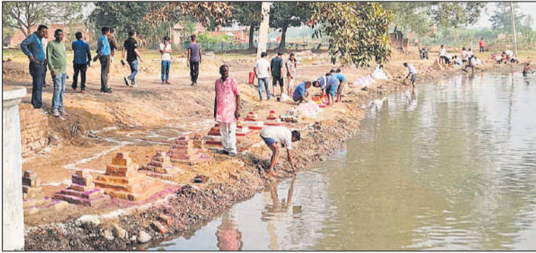
सेटघाट पर पूजन के लिए वेदी तैयार करते श्रद्धालु।

चार दिवसीय छठ पर्व के दूसरे दिन अस्ताचलगामी सूर्य और उदयगामी भगवान सूर्य को अर्घ्य देने का संकल्प पूरा करने के लिए रतियों ने खरना किया। रतियों ने दिनभर उपवास के बाद शाम को स्नान कर छठी मड़या को गुड़ की खीर और गेहूं की रोटी का भोग लगाया। सूर्यास्त के बाद कुलदेवता की पूजा की। खरना के साथ ही रतियों का 36 घंटे का निर्जला व्रत शुरू किया। ब्रह्मस्पतिवार को अस्त होते सूर्य और शुक्रवार को उदीयमान भगवान सूर्य को अर्घ्य के बाद महाव्रत छठ का समापन होगा। इस अवसर पर प्रसाद बनाने के लिए आम की लकड़ी से लेकर सूप, फल आदि की खरीद रही। पूजा स्थल से लेकर घर की छतों पर रतियों के छठ गीत से सारा माहौल भक्तिमय हो गया।