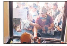
पहली बुकिंग कराती दिल्ली की महिला।