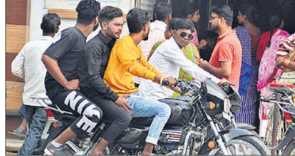
गन्ना तिराहा से पलएच शुगर फैक्ट्री मार्ग पर एक बाइक पर जाते तीन युवक।

बच्चों के प्रति अभिभावक निर्माण अपनी जिम्मेदारी कई बार जागरूकता गोष्ठियों में ये बात खुलकर कही जाती है कि सड़क हादसों में जान गंवाने पर सिर्फ एक व्यक्ति की जान नहीं जाती। उसका असर उसके पूरे परिवार पर पड़ता है। बावजूद इसके ट्रिपल राइडिंग घटने से की जा रही है। बिना सीट बेल्ट लगाए चार पहिया वाहन चलाने वालों की भरमार है। बाइक चलाते वक्त हेलमेट का प्रयोग तो नाममात्र बाइकर्स ही कर रहे हैं। ऐसे में वाहन चालक और उनके परिवार की भी जिम्मेदारी बनती है कि वह बच्चों को नियमों के प्रति जागरूक करें। सिर्फ चालान से बचने के लिए नहीं, बल्कि सड़क सुरक्ष जीवन रक्षा...की मंशा को देखते हुए नियमों के प्रति जागरूक हों।