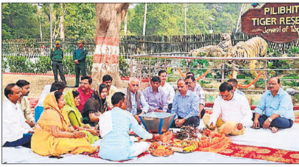
मुस्तफाबाद में हवन पूजन करते अधिकारी व जनप्रतिनिधि।

चूका बीच में खुली कैटीन पर जमकर लोगों ने स्नैक्स समेत खानपान की वस्तुएं खरीदीं। चूका बीच के सफर को यादगार बनाने के लिए विभाग की ओर से चूका बीच में सोबेनियर शॉप भी खोली गई। यहां सैलानियों ने वाइल्ड लाइफ से जुड़ी टीशर्ट, कैप और अन्य सामान की खरीदारी की। सफारी के दौरान सैलानियों को हिरन, जंगली सुअर, मोर समेत अन्य वन्यजीवों के दीदार हुए। पहले दिन स्कूली बच्चों समेत 300 से अधिक सैलानियों ने निशुल्क सफारी वाहनों से चूका बीच की सैर की। चूका बीच पहुंचे सैलानियों ने खासा उत्साह दिखाई दिया।