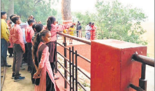
चूका बीच से शारदा डेम का नजारा देखते स्कूल के बच्चे।

चूका बीच में सैलानियों के ठहरने के लिए बैंबो हट, अरण्य कुटी, ट्री हट एवं थारू हट हैं। इन हटों की ऑनलाइन बुकिंग की जाती है। वन निगम के पुलकित के मुताबिक चूका बीच की हटों की ऑनलाइन बुकिंग शुरू हो चुकी है। उन्होंने बताया कि सात नवंबर से लेकर 16 नवंबर तक हटों की बुकिंग कराई गई है। इसमें 15 एवं 16 नवंबर को चूका बीच की सभी हटें एडवांस बुक हो चुकी हैं।