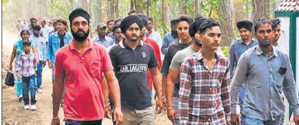
पर्यटन सत्र के पहले दिन सैलानियों की उमड़ी भीड़।

जंगल और जंगली जानवरों को देखने का पहली बार मौका लगा है। चूका बीच जाने के लिए पीटीआर ने सफारी वाहन भी उपलब्ध कराया। पीलीभीत टाइगर रिजर्व को करीब से जानने का मौका मिला।