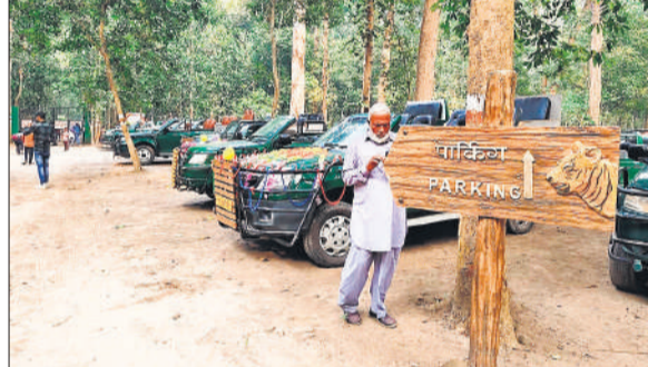
सैलानियों को लेकर चूका बीच पहुंचे सफारी वाहन।