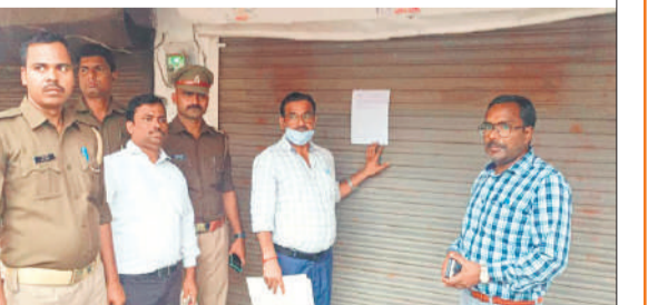
क्लीनिक पर नोटिस चस्पा करते छापेमारी टीम के सदस्य।