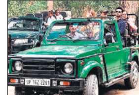
सफारी का आनंद लेते सैलानी।