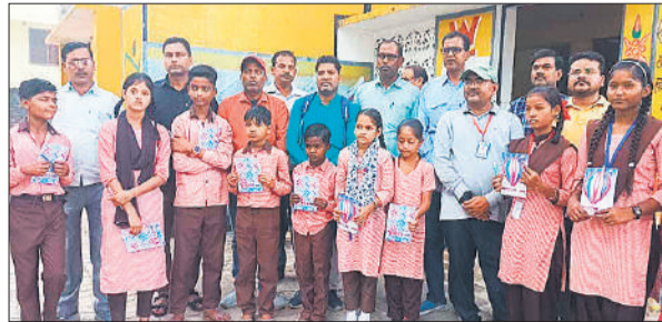
प्रतियोगिता में भाग लेते बच्चे।