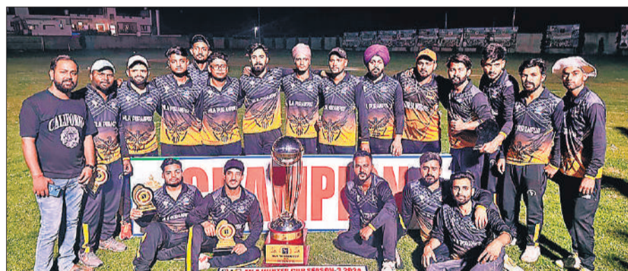
टूर्नामेंट पर कब्जा करने के बाद उत्साहित विजेता टीम के खिलाड़ी।