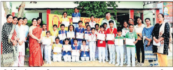
प्रतियोगिता में पुरस्कृत किए गए बच्चे।