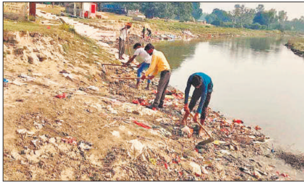
मढ़िया घाट पर साफ-सफाई करते कर्मचारी।