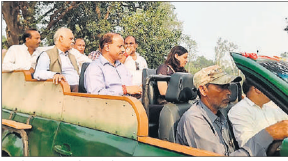
सफारी वाहन से चूका बीच जाते डीएम व जनप्रतिनिधि।

चूका बीच के बारे में केवल सुना ही था, लेकिन आज पहली बार इतने करीब से देखा है। सफारी से साथियों के साथ जंगल भी घूमा। यहां के बारे में जितना सुना था, यह उससे भी अच्छा है।