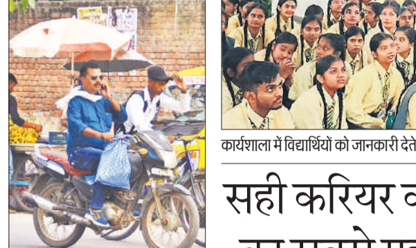
गौहनिया चौराहे पर बाइक चलाते समय मोबाइल पर बात करता युवक।