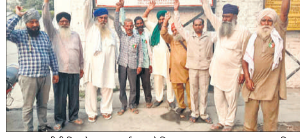
मकसूदापुर चीनी मिल के बाहर प्रदर्शन करते किसान।

अमृत विचार: बजाज शुगर मिल मकसूदापुर की मनमानी की वजह से गन्ना किसान परेशान हैं। आठ नवंबर से शुगर मिल का नवीन पेराई सत्र शुरू होने वाला है, लेकिन पिछले पेराई सत्र का बकाया 85 करोड़ का भुगतान अभी तक नहीं हो सका है। उधर, राष्ट्रीय किसान मजदूर संगठन के कार्यकर्ताओं ने बुधवार को शुगर मिल के जीएम से मिलकर किसानों का तत्काल भुगतान कराने की मांग की है। ठोस आश्वासन न मिलने पर मिल गेट पर प्रदर्शन कर नारेबाजी की। स्थानीय ब्लॉक क्षेत्र के करीब 50 फ्रीसदी किसान बजाज शुगर मिल मकसूदापुर को गन्ने की सप्लाई करते हैं। हर वर्ष गन्ने के भुगतान को लेकर किसानों को परेशान होना पड़ता है। मिल का पिछला पेराई सत्र नौ नवंबर 2023 से भले ही शुरू