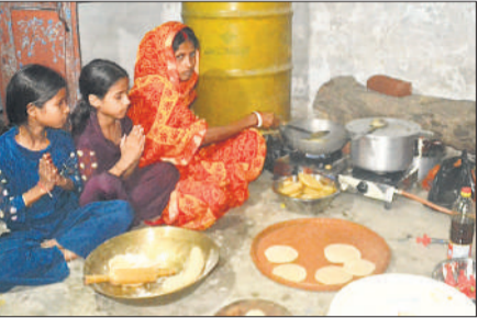
दूसरे दिन घर में खरना के लिए भोजन तैयार करती महिला।