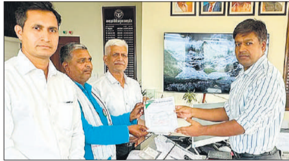
लखनऊ में गन्ना आयुक्त को ज्ञापन देते पदाधिकारी।