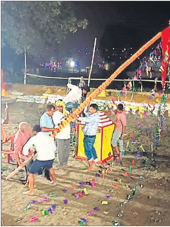
बरहा कॉलोनी में छठ पूजा के लिए जलाशय की तैयारी करते लोग।

सूर्य को पहला अर्घ्य अर्पण करेंगी। इसके लेकर जलाशयों और घाटों