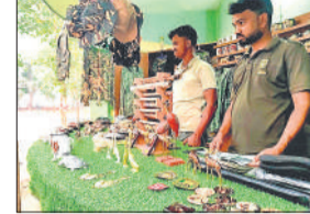
सैलानियों के लिए खुली सोबेनियर शॉप।