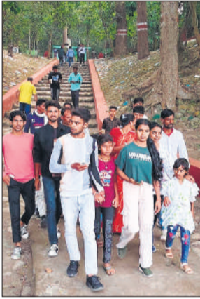
चूका बीच भ्रमण करते सैलानी।