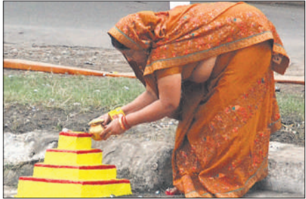
जलाशय में बनी वेदी पर अर्घ्य देती महिला।