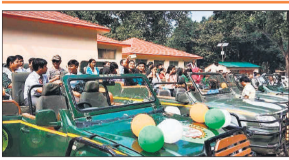
सफारी जिप्सियों में बैठ दुधवा घूमने जाते पर्यटक।