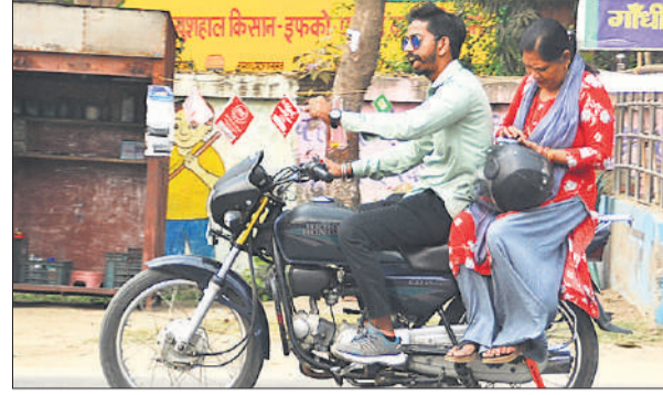
युवक बिना हेलमेट के बाइक चला रहा, हेलमेट पीछे बैठी महिला को पकड़ाया।