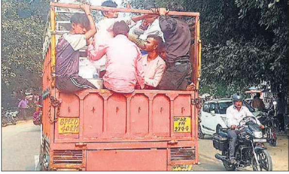
सामान ढोने वाले वाहन में सफर करते लोग।

अमृत विचार: बढ़ते सड़क हादसों की रोकथाम एवं वाहन चालकों को यातायात नियमों का पालन कराने के लिए चलाई जा रही मुहिम से जागरूकता कोसों दूर है। इस मुहिम की शुरुआत के पांच दिनों में कार्रवाई के आंकड़े भले बेहतर हों, लेकिन सड़कों पर हालात नहीं सुधरते दिख रहे। इसके पीछे जिम्मेदारों की कमी नहीं, बल्कि वाहन चालकों की बेपरवाह तस्वीर उजागर हो रही है। सड़कों पर बेतरतीब दौड़ते वाहनों चालकों की लापरवाही साफ दिखती है।