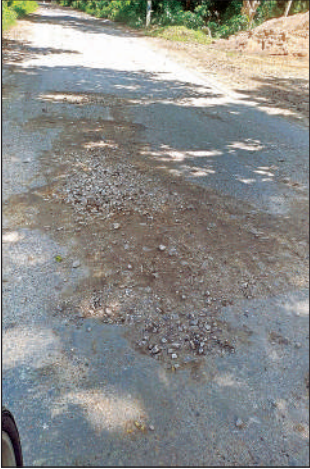
सोहावल-नउवा कुआं मार्ग की मरम्मत के लिए डाली गई गिट्टी। अमृत विचार

सीएम के आने से पहले बंधे पर बना दिया फोरलेन