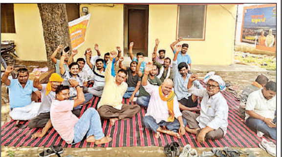
मांगों को लेकर धनरा प्रदर्शन करते बिजली विभाग के संविदा कर्मचारी।