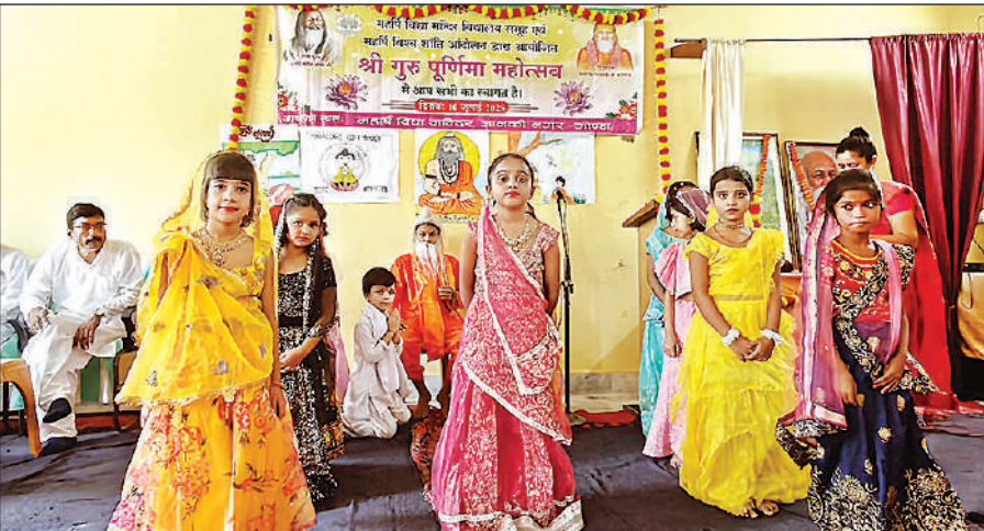
महर्षि विद्या मंदिर में गुरु पूजन पर कार्यक्रम प्रस्तुत करती छात्राएं।