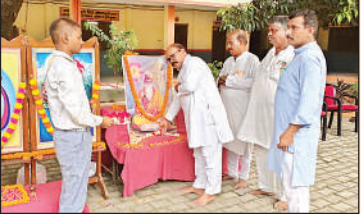
महर्षि वेदव्यास का पूजन करते लोग।