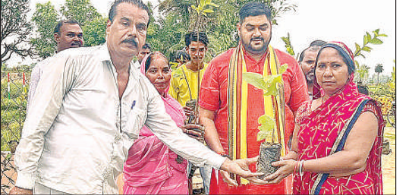
महिलाओं को पौधे वितरित करते अतिथि व अन्य। अमृत विचार

‘एक पेड़ मां के नाम’ अभियान के तहत किया पौधरोपण