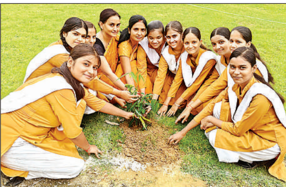
पौधरोपण करती छात्राएं।

पश्चात विद्यालय के छात्र-छात्राओं द्वारा गुरु की महिमा का गायन एवं विभिन्न सांस्कृतिक कार्यक्रमों के माध्यम से किया गया। जिसमें गुरु की महिमा पर आधारित एकल गीत,