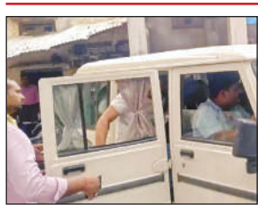
राजस्व निरीक्षक को अकबरपुर कोतवाली ले जाती पीटी करषण की टीम।

से ही एंटी करषण टीम सक्रिय थी और जैसे ही राजस्व निरीक्षक ने शिकायत कर्ता से सात हजार रुपये अपने हाथों में लिया। फौरन उसे टीम ने रंगेहाथ पकड़ लिया। एंटी करषण कार्रवाई के दौरान तहसील में अफरा-तफरी मच गई। जब तक लोग कुछ समझ पाते टीम ने घूसखोर राजस्व निरीक्षक को गाड़ी में बैधया और कोतवाली अकबरपुर लेकर निकल गई। जहां लेखपाल के विरुद्ध मुकदमा दर्ज कराने समेत अन्य कार्रवाई शुरू कर दी गई है।