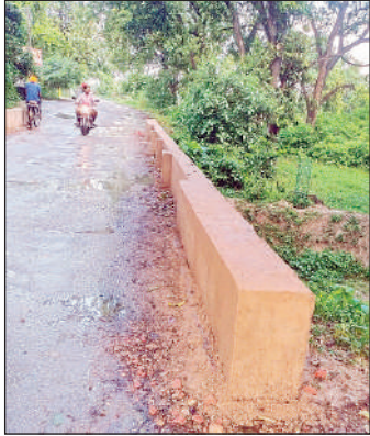
सीएम के प्रस्तावित कार्यक्रम के मद्देनजर मरम्मत किया गया तिलैया पुल।

श्री रमणक ऋषि की तपस्थली आने वाले थे मुख्यमंत्री