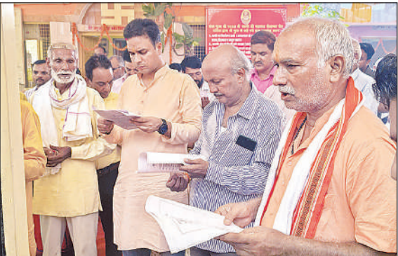
श्री शक्तिपीठ मुबारकगंज स्थित गुरुधाम में पूजन करते साधक व श्रद्धालु।