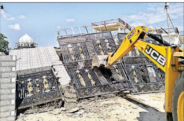
उत्तरौला के मधपुर में ध्वस्त छांगुर बाबा के करीबी नीतू की हवेली।

चर्चा यह भी है कि उक्त निर्माण को कॉलेज भवन के रूप में प्रचारित किया गया था, और उसमें शैक्षणिक संस्था प्रारंभ करने की तैयारियां भी चल रही थीं। ग्रामीणों का कहना