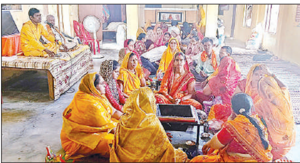
गुरु पूर्णिमा पर्व पर हवन यज्ञ करती गायत्री परिवार की महिलाएं।