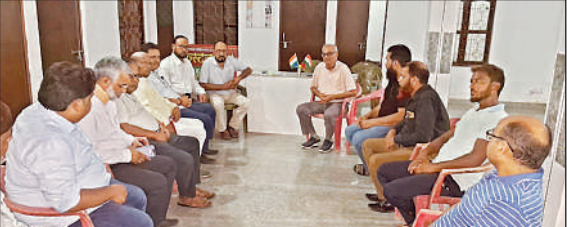
जिला कार्यकारिणी की बैठक करते पदाधिकारी ।