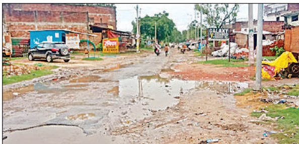
गणेशपुर बाजार की क्षतिग्रस्त सड़क पर भरा बारिश का पानी।

उधर बांध पर स्पर के निर्माण का कार्य तेजी से चल रहा है। जहां बांध से नदी के सीधे टकराने का अनुमान है वहां पत्थर की पिचिंग का कार्य भी चलाया जा रहा है। बाढ़ का पानी तेजी से बढ़ने का क्रम जुलाई के अंतिम सप्ताह में शुरू होने का अनुमान लगाया जा रहा है। सहायक अभियंता पंकज आर्य का कहना है कि अभी बांध और नदी की स्थिति पूरी तरह सामान्य है। बांध पर स्पर निर्माण व पिचिंग का कार्य चलाया जा रहा है।