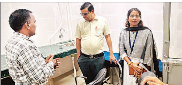
नव संचालित मेडिकल कॉलेज में बना नया पब्लिक लैब।

गतिविधियों में बाधा उत्पन्न कर रहा है, बल्कि स्वास्थ्य के लिहाज से भी यह खतरे की घंटी है। ग्रामीणों ने बताया कि वे ग्राम प्रधान और सम्बन्धित प्रशासनिक अधिकारियों से कई बार शिकायत कर चुके हैं। अफसोस यह कि समस्या को नजरअंदाज किया जा रहा है जिससे आक्रोश बढ़ता जा रहा है।