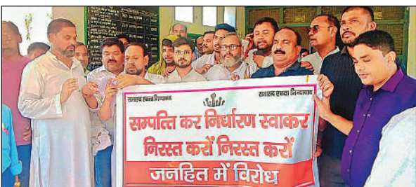
करनैलगंज में प्रदर्शन करते नगरपालिका के सभासद।