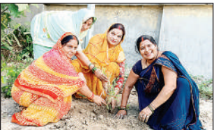
पौधरोपण करती महिलाएं। अमृत विचार

दोस्तपुर, सुलतानपुर, अमृत विचार : श्रावण मास के पहले दिन शुक्रवार को नगर के विभिन्न शिवालियों में भक्तों की भारी भीड़ उमड़ी। महिलाओं ने सुहृद से जलाभिषेक कर पूजा-अर्चना की। बभनेया पर्व स्थित शिव मंदिर में श्रद्धालुओं ने ‘एक पेड़ मां के नाम’