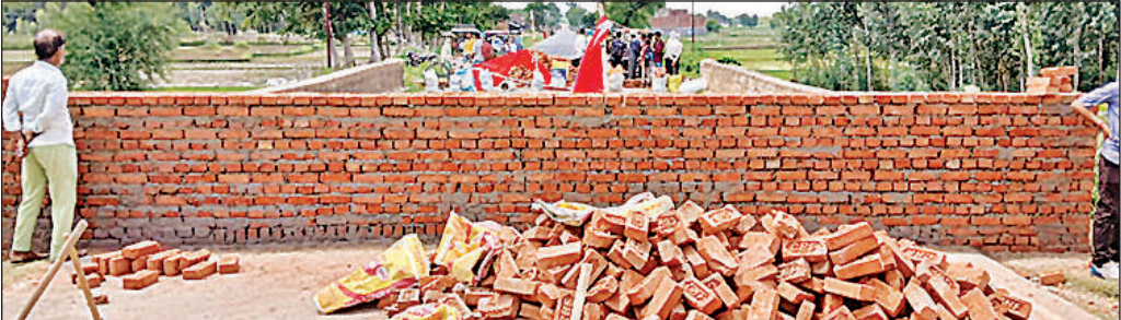
क्षतिग्रस्त पुल पर आवागमन रोकने के लिए बनवाई गई ईंट की दीवार।

गुरुवार को गोंडा से आई इंजीनियरों की टीम ने पुल का निरीक्षण कर उसे राहगीरों के लिए बेहद खतरनाक बताया और तत्काल आवागमन रोकने के निर्देश दिए। इंजीनियरिंग टीम की रिपोर्ट पर तत्काल कार्रवाई करते हुए पुल के दोनों ओर पक्की ईंट की दीवार खड़ी कर दी