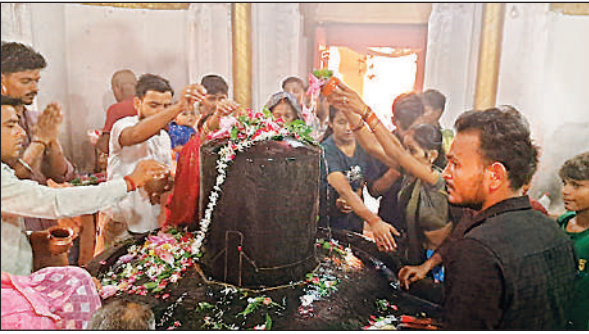
खरगपुर पृथ्वीनाथ शिव मंदिर में जलामिषेक करते भक्त।

अमृत विचार : शक्रवार से पवित्र सावन माह की शुरुआत हो गई। एक माह तक लोगों का हुजूम शिव मंदिरों में आराधना और पूजन के लिए आना शुरू हो गया। पहला दिन शक्रवार होने के नाते खरगपुर के पृथ्वीनाथ मंदिर, गोंडा नगर के दुखहरन नाथ मंदिर, करनैलगंज बरखंडी नाथ शिव मंदिर, मनकापुर के कोरहे नाथ तथा वजीर गंज के बालेश्वरनाथ शिवमंदिर में लोगों ने जलामिषेक किया। मान्यता है कि आषाढ़ माह के शुक्लपक्ष की द्वादशी पर भगवान नारायण क्षीरसागर में निवास करने के लिए प्रस्थान करने चले जाते हैं और चार माह तक शयन के दौरान समस्त ब्रह्मांड का दायित्व भगवान शिव और माता पार्वती पर होता है। पौराणिक पृथ्वीनाथ मंदिर के विशाल शिवलिंग पर सावन माह के प्रथम शक्रवार को सैकड़ों महिला