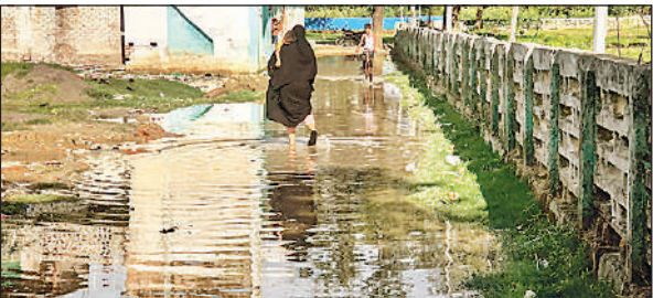
सड़क पर भरे पानी के बीच से गुजरते लोग।

अमृत विचार: मंगलवार और बुधवार की मध्य रात्रि को हुई मूसलाधार बारिश ने उत्तरीला क्षेत्र के ग्राम नई बस्ती में तबाही जैसे हालात पैदा कर दिए। शाहजहानी रोड से सटा यह गांव इस वक्त गम्भीर जलभराव की समस्या से जूझ रहा है। सड़क की बदहाल स्थिति और निकासी के अभाव के चलते ग्रामीणों के घरों में पानी घुस गया है, जिससे जनजीवन बुरी तरह प्रभावित हुआ है। स्थानीय लोगों के अनुसार, नई बस्ती गांव की मुख्य सड़क शाहजहानी दरगाह से होकर गुजरती है। इस सड़क के एक ओर खेत-खलिहान व तालाब है, जबकि दूसरी ओर कब्रिस्तान स्थित