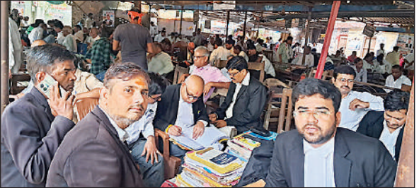
दीवानी न्यायालय में अपने तख्तों पर कामकाज करते अधिवक्ता।