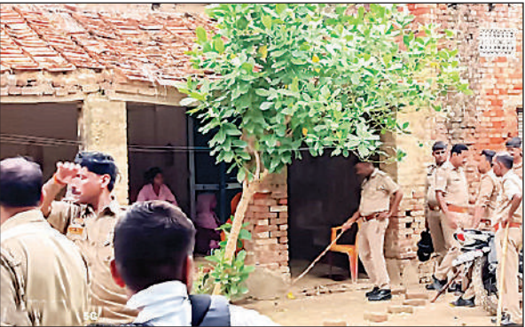
छापेमारी के लिए पहुंची पुलिस टीम।