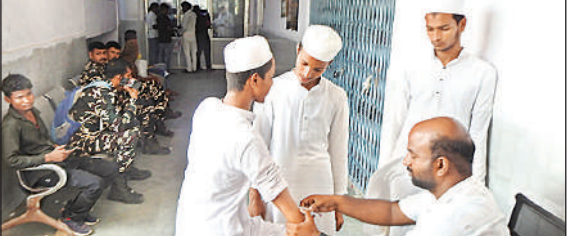
मेडिकल कॉलेज में विभिन्न प्रकार की जांच करते डॉक्टर ।