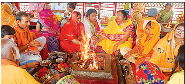
गुरु पूर्णिमा पर मानव कल्याण के लिए हवन करतीं गायत्री परिवार की महिलाएं।