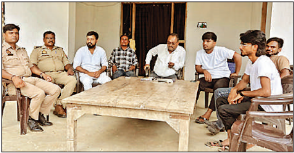
पुलिस की निगरानी में अपने घर में मौजूद कांग्रेस नेता।