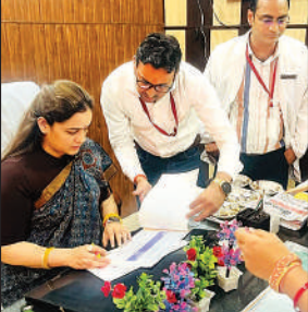
सीएचसी को चेक करती अपर्णा यादव।

अमृत विचार: उत्तर प्रदेश महिला आयोग की उपाध्यक्ष अपर्णा यादव के निरीक्षण में कस्तूरबा गांधी आवासीय बालिका स्कूल करनैलगंज में पढ़ने वाली बेटियों को मिल रहे भोजन के गुणवत्ता की कलाई खुल गयी। निरीक्षण को दौरान पानी जैसी दाल देख अपर्णा भड़क गयी और वार्डन से पूछा कि कौन है ठेकेदार। इसी तरह का भोजन बच्चों को दिया जा रहा है। वार्डन ने सफाई देने की कोशिश की तो नाराज हो गयीं। वार्डन को फटकार लगाते हुए भोजन की गुणवत्ता को दुरुस्त कहा का निर्देश दिया। कस्तूरबा स्कूल के बाद उन्होंने सीएचसी का भी निरीक्षण किया।ओपीडी कक्ष व