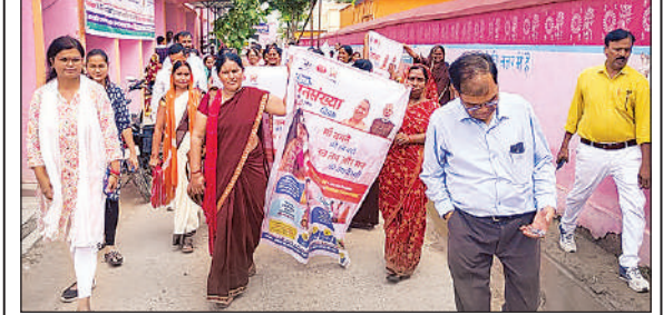
कटरा बाजार सीएचसी से रैली निकालते स्वास्थ्य कर्मी।