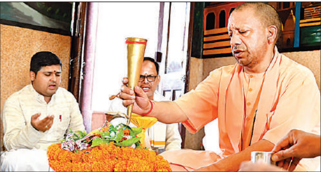
गोरखनाथ मंदिर में भगवान शिव का रुद्राभिषेक करते मुख्यमंत्री योगी आदित्यनाथ।

अमृत विचार : सावन माह की शुरुआत पर शुक्रवार को सुबह गोरक्षपीठाधीश्वर और मुख्यमंत्री योगी आदित्यनाथ ने रुद्राभिषेक और हवन का आयोजन किया। इस पवित्र अनुष्ठान को पूर्ण कर उन्होंने भगवान शिव से समस्त विश्व और प्रदेशवासियों की सुख-शांति व समृद्धि की प्रार्थना की। गोरखनाथ मंदिर में अपने आवास के प्रथम तल पर स्थित शक्तिपीठ में सीएम योगी ने सुबह भगवान शिव को बेलचपूर, दूब, मदार के पत्ते, कमल के फूल और अन्य पूजन सामग्री अर्पित की। इसके बाद जल, दूध और मौसमी फलों के रस से सीएम योगी ने बाबा का रुद्राभिषेक किया। मठ के विद्वान आचार्यों और पुरोहितों ने शुक्ल यजुर्वेद संहिता के रुद्राष्टाध्यायी मंत्रों के साथ