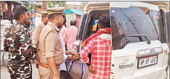
भारत नेपाल सीमा अंतर्गत ककरहवा बॉर्डर पर चेकिंग करते पुलिस व एसएसबी के जवान ।

नेपाल सीमा पर सुरक्षा एजेंसिया की आई डी चेक करके उन्हे आने बॉर्डर पर सक्रिय हो गई हैं। भारत नेपाल सीमा पर चौकसी बढ़ा दी गई है। पेट्रोलिंग कर पखंडी रास्तो पर हर संदिग्ध पर नजर रखी जा रही है हर आने जाने वाले व्यक्तियों