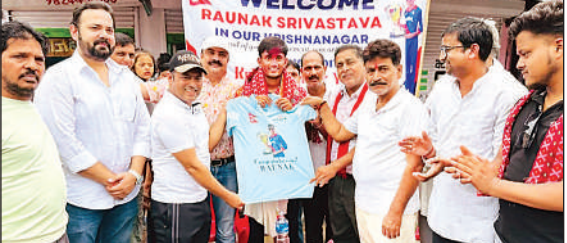
कृष्णानगर में रौनक के लिए आयोजित सम्मान समारोह ।