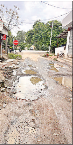
तहरसीपुर-इयोडी संपर्क मार्ग पर बने गड्ढे व जलभराव।