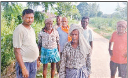
मनरेगा पोर्टल पर अपलोड की गई कार्यस्थल की यह फोटो।