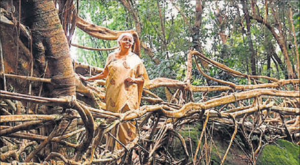
मेघालय के सीज गांव में जीवित जड़ों से बने पुल का दौरा करती निर्मला सीतारमण।

केंद्रीय वित्त मंत्री निर्मला सीतारमण ने मेघालय के ईस्ट खासी हिल्स जिले के ‘लिविंग रूट ब्रिज’ को यूनेस्को विश्व धरोहर का दर्जा दिलाने के प्रयासों के प्रति पुरजोर समर्थन व्यक्त किया है। सीतारमण ने मान्यता के लिए नामांकन को बहाल करने और सामुदायिक सहभागिता एवं अंतर्राष्ट्रीय साझेदारी के माध्यम से प्रस्ताव को मजबूत करने के लिए हाल में जमीनी स्तर पर हुई प्रगति की सराहना की। ‘लिविंग रूट ब्रिज’ ऐसा पुल होता है, जो पेड़ों की जड़ों से तैयार किया गया जाता है। सीतारमण ने कहा कि वैश्विक मान्यता न केवल पारंपरिक ज्ञान का सम्मान करेगी, बल्कि दूसरों को स्थानीय ज्ञान पर आधारित स्थायी प्रथाओं को अपनाने के लिए भी प्रेरित