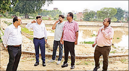
निर्माणधीन तालाब का निरीक्षण करती नगर निकाय निदेशालय से आई टीम।