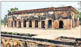
गोंडा में वजीरगंज की बारादरी।

अमृत विचार: खंडहर में तब्दील हो रहे राज्य के ऐतिहासिक धरोहरों को नया जीवन देने के लिए प्रयास शुरू हो गया है। पर्यटन विभाग 11 पुराने किलों और भवनों को चमकाने की तैयारी में है। विभाग ने एजेंसियों के माध्यम से इसके लिए अनुरोध प्रस्ताव (आरएफपी) आमंत्रित किया है। ये काम पब्लिक-प्राइवेट पार्टनरशिप