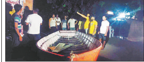
मंदिर परिसर में आई नाव उतारते युवक।