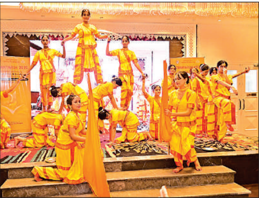
शिक्षक सम्मान कार्यक्रम में छात्राओं ने किया सांस्कृतिक कार्यक्रम एवं रामायण विश्वविद्यालय द्वारा आयोजित कार्यक्रम में शामिल शिक्षक।