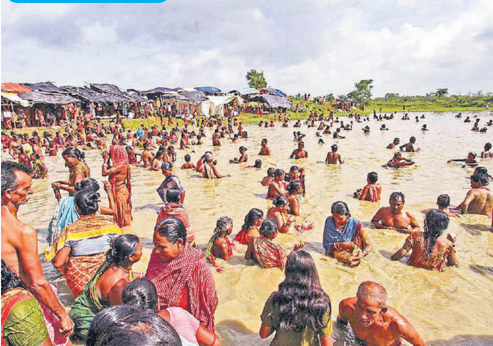
पश्चिम बंगाल के बीरभूम जिले के बेलिया में बंगाली महीने अषार के दौरान लोग धर्मराज मंदिर के सामने कीचड़ में लोटने के बाद तालाब में डुबकी लगाते हैं। ऐसा माना जाता है कि इससे गठिया रोग दूर हो जाता है और देवता का आशीर्वाद मिलता है।