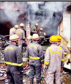
दुकान में लगी आग बुझाने फायर बिग्रेड के कर्मचारी। अमृत विचार

मंगवाया गया था। भवन के दूसरे तल पर स्टेशनरी की दुकान संचालित थी। जबकि भूतल समस्त अन्य तलों को गोदाम के रूप में प्रयोग किया जाता था। जहां स्टेशनरी का स्टॉक रखा हुआ था। पुलिस के मुताबिक रविवार भोर तीन बजे भवन के भूतल को प्रशासन ने खाली करा दिया गया है। इसके बाद आग ने पूरे गोदाम को अपनी चपेट में ले लिया। मोहल्ले के कुछ लोगों ने दुकान के अंदर से धुआं निकलते देख इसकी जानकारी दुकान मालिक को दी। जिसके बाद आनन-फानन में दुकान मालिक सुबह साढ़े तीन बजे दुकान पर पहुंचे और