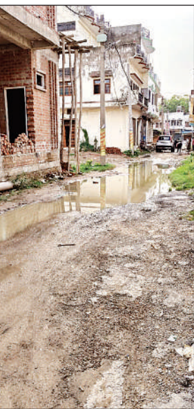
रुदौली के कृष्णा नगर कॉलोनी में जलभराव।

नगर पालिका के कृष्णा नगर कॉलोनी में जलभराव, बदबू और बिजली के खंभों से करंट उतरने की समस्या ने स्थानीय नागरिकों की मुश्किलें बढ़ा दी हैं। कॉलोनी में कई स्थानों पर नालियों की सफाई और मरम्मत न होने के कारण गंदा पानी जमा हो रहा है। इससे संक्रमण और दुर्घटना का खतरा बना हुआ है। स्थिति इतनी खराब है कि बिजली के पोल जलभराव में डूब जाते हैं, जिससे करंट उतरने का खतरा बना रहता है। कॉलोनी में स्थित एक स्कूल के बच्चों को रोजाना गंदे