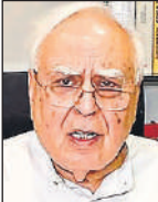
नई दिल्ली, एजेंसी

सांस्कृतिक और स्थापत्य संबंधी महत्व पर प्रकाश डाला गया। हालांकि, प्रक्रियागत आवश्यकताओं, व्यापक दस्तावेजीकरण के अभाव और विरासत मानचित्रण प्रक्रिया में समुदाय-नेतृत्व वाली अधिक भागीदारी की आवश्यकता के कारण नामांकन में देरी हुई।