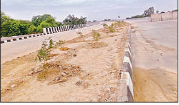
हाईवे पर ओवर ब्रिज बनकर तैयार। अमृत विचार

विचार: सुलतानपुर, अमृत विचार : सुलतानपुर-वाणगंजी फोरलेन हाईवे पर बन रहे हनुमानगंज बाईपास रेलवे ओवरब्रिज का निर्माण कार्य अखिरकार पूरा होने की कगार पर है। निर्धारित समय सीमा बीत जाने के बाद अब पुल का दावा पूरी तरह तैयार हो चुका है, लेकिन हालिया बारिश ने अंतिम फिनिशिंग कार्य में बाधा उत्पन्न कर दी है। भारतीय राष्ट्रीय राजमार्ग प्राधिकरण ने जून 2025 में इस ओवरब्रिज को पूरा करने की समय सीमा तय की थी। निर्माण एजेंसी ने दोनों लेनों का कार्य जून अंत तक पूरा करने का दावा किया था और 10 जुलाई से पुल पर आवगमन शुरू करने की तारीख तय की थी। लेकिन 8 जुलाई को हुई तेज बारिश के कारण पेंटिंग और डेंटिंग का कार्य रुक गया। अधिकारियों के अनुसार अब सोमवार से पुल पर आवगमन शुरू होने की संभावना है, जिससे हनुमानगंज रेलवे क्रॉसिंग पर लगने वाले जाम से लोगों को स्थायी राहत मिलने की उम्मीद है।