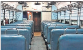
● हर डिब्बे में चार, इंजन में उच्च गुणवत्ता के छह कैमरे लगेंगे

प्रत्येक डिब्बे में चार और इंजनों में छह सीसीटीवी कैमरे लगाए जाएंगे। ये कैमरे अत्याधुनिक होंगे और 100 किमी प्रति घंटे से भी अधिक रफ्तार में तथा कम रोशनी में भी उच्च गुणवत्ता वाली फुटेज उपलब्ध कराएंगे। रेलवे के अनुसार यात्री डिब्बों में कैमरे लगाने के प्रायोगिक परिणाम के आधार पर यह निर्णय लिया गया है। कैमरे लगने