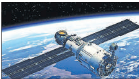
● इजराइल स्पेस एजेंसी ने अपनी महत्वपूर्ण सफलता बताया

इस उपग्रह को अमेरिकी राज्य फ्लोरिडा के केप कैनावेरल स्पेस लॉन्च कॉम्प्लेक्स से स्पेसएक्स फाल्कन-9 रॉकेट के जरिए सफलतापूर्वक प्रक्षेपित किया गया। आईएसए के अनुसार इसे अगले 15 वर्षों के लिए इजराइल की संचार आवश्यकताओं को पूरा करने के लिए डिज़ाइन किया गया है, चाहे वह नियमित संचालन हो या आपात स्थिति और यह देश की रक्षा प्रणाली