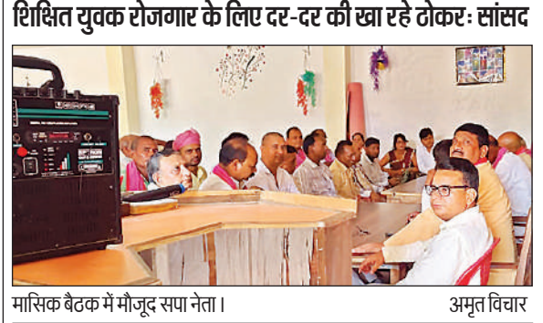
मासिक बैठक में मौजूद सभा नेता।