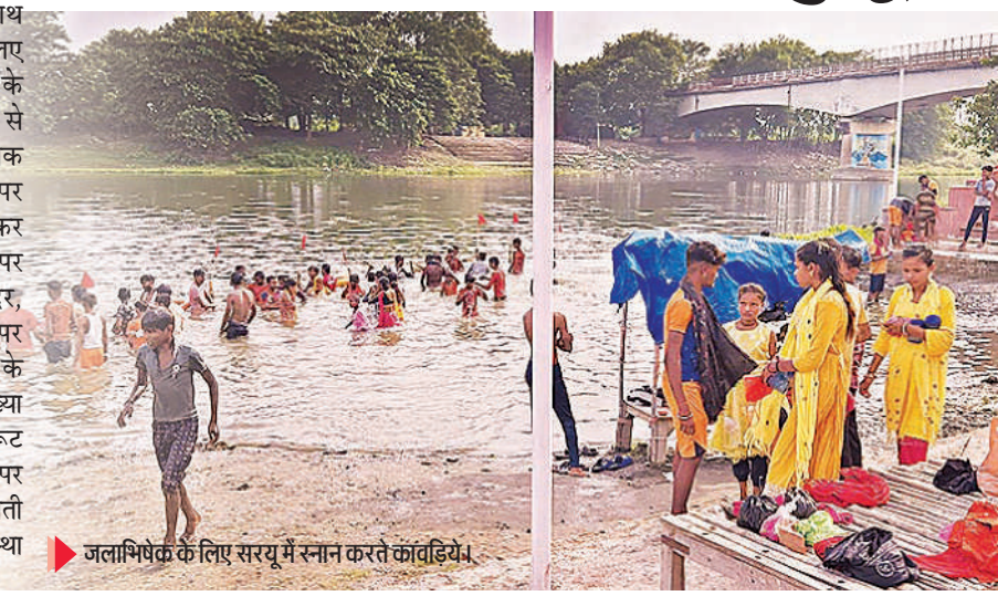
जलाभिषेक के लिए सरयू में स्नान करते कांवड़िये।

मंदिर खरगपुर, श्री लोधेश्वर नाथ महादेव मंदिर रामनगर के लिए कांवड़िये रवाना हुए। कांवड़ियों के आने का सिलसिला दोपहर बाद से शुरू हो गया था और देर शाम तक लगातार कांवड़िया सरयू घाट पर आते रहे और स्नान करके जल भरकर रवाना होते रहे। उधर सरयू घाट पर श्री मनकामेश्वर नाथ महादेव मंदिर, श्री शान्तेश्वर नाथ महादेव मंदिर पर भी कांवड़ियों का हुजूम जलाभिषेक के लिए जुट गया। कांवड़ियों की संख्या को देखते हुए प्रशासन द्वारा रूट डायवर्जन के साथ-साथ सरयू घाट पर भारी संख्या में पुलिस बल की तैनाती की गई है। जो उनकी सुरक्षा व्यवस्था में लगे रहे।