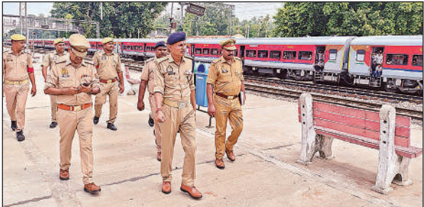
मनकापुर रेलवे स्टेशन पर निरीक्षण करते जीआरपी व आरपीएफ के जवान।