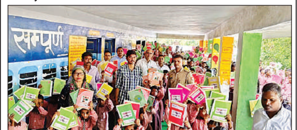
कंपोजिट विद्यालय गोकुला में कापी कलम व अन्य सामग्री के साथ बच्चे।

काँपी, कलम और पेंसिल पाकर खिल उठे नौनिहाल