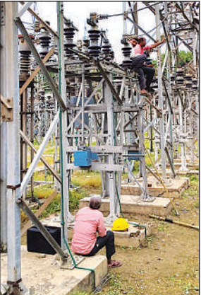
दर्शननगर विधुत उपकेंद्र पर लाइन दुरुस्त करने में जुटे कर्मी।