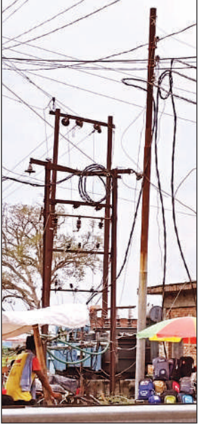
जर्जर पोल बन रहे रूपईडीहा में बिजली कटौती के कारण ।

ग्रामीण क्षेत्रों के साथ-साथ नगर क्षेत्र में भी बार-बार बिजली का गुल हो जाना, आधे घंटे में बीसो बार ट्रिपिंग की समस्या और अनियमित आपूर्ति विद्युत विभाग की कार्यशैली पर सवाल खड़े कर रही है। भीषण गर्मी के इस मौसम में लोग रात-रातभर जागने को मजबूर हैं। कई बार शिकायतों के बावजूद विभागीय अधिकारी, कर्मचारी समस्या को गंभीरता से नहीं ले रहे। लो वोल्टेज के कारण न केवल पंखे, कूलर और अन्य बिजली उपकरणों ने काम करना बंद कर दिया है, बल्कि इनकी खराबी और जलने की घटनाएं भी बढ़ गई हैं। व्यापारी वर्ग, छात्र, किसान व आम लोग इस समस्या से अत्यधिक परेशान हैं। खासकर स्कूली बच्चे जो इस भीषण गरमी में बिजली कटौती से रात भर जागते हैं और फिर सुबह ही स्कूल जाना पड़ता है। ऐसी स्थिति से सबसे ज्यादा स्कूली बच्चे प्रभावित हैं।