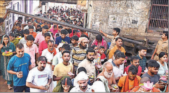
सावन के पहले सोमवार को प्रसिद्ध नागेश्वरनाथ मंदिर में जुटी श्रद्धालु की भीड़।

सिद्धपीठ नागेश्वर नाथ मंदिर में सुबह चार बजे से ही दर्शन-पूजन का सिलसिला शुरू हो गया। लाखों शिव भक्तों ने मां सरयू में स्नान कर मंदिर में जलाभिषेक किया।