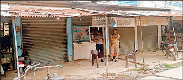
छापेमारी करती आयकर विभाग की टीम।