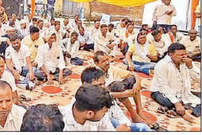
विकास भवन के सामने प्रदर्शन करते कर्मचारी।