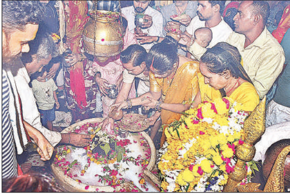
क्षीरेश्वर नाथ मंदिर में शिवलिंग पर जलाभिषेक करते श्रद्धालु।