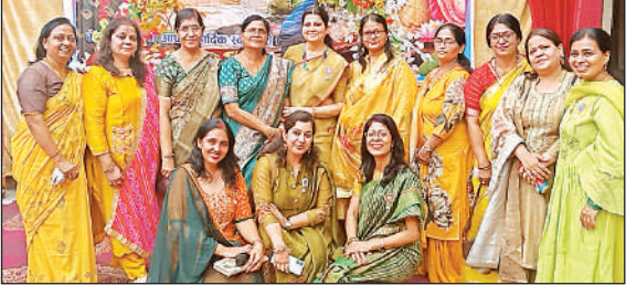
सावन महोत्सव पर रामजानकी मंदिर में जुटी महिलाएं।