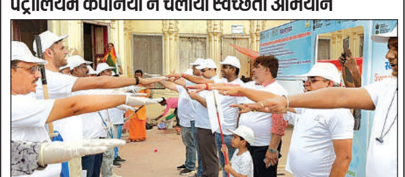
गुप्तार घाट पर स्वच्छता की शपथ लेते पेट्रोलियम कंपनियों के कर्मचारी।

पेट्रोलियम कंपनियों ने चलाया स्वच्छता अभियान