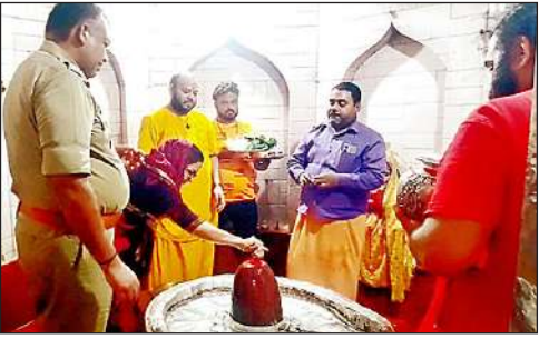
भोलेनाथ का जलाभिषेक करती डीएम व एसपी ।