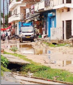
जलभराव वगंदगी से परेशान है स्थानीय लोग।

सिद्धार्थ नगर, अमृत विचार: जिला मुख्यालय के वार्ड नं 14 वीर सावरकर नगर ग्राम परसा शाह आलम क्षेत्र वासियों तथा राहगीरों को थोड़ी सी बरसात में ही परेशानी का सामना करना पड़ता है। वहीं तमाम लोगों ने यह भी कहा कि कहने के लिए विकास भवन के सामने यह वार्ड है, लेकिन दुर्व्यवस्था इतना ज्यादा है कि उसकी कल्पना नहीं की जा सकती। रोड के किनारे खुले ढक्कन तथा गंदगी का संसार लाना रहता है। जबकि अंबासद की जानकारी में यह मामला है। लेकिन कोई सुधि लेने वाला नहीं है। क्षेत्र वासियों ने कहा कि शीघ्र हम लोग जिला प्रशासन और नगर पालिका अध्यक्ष से मिलकर इसकी शिकायत करेंगे ताकि इस मामले का त्वरित निस्तारण किया जाए।