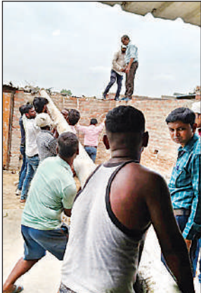
14 कोसी परिक्रमा मार्ग पर पोल को खड़ा करते नियावां विधुत उपकेंद्र के कर्मी।