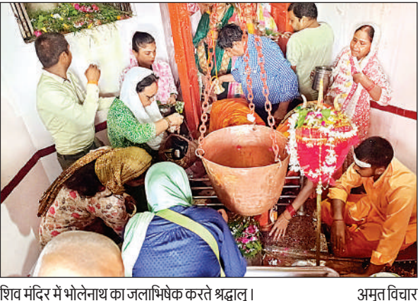
शिव मंदिर में भोलेनाथ का जलाभिषेक करते श्रद्धालु।