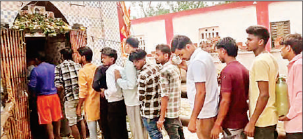
शिवालियों में लगी भक्तों की कतार ।