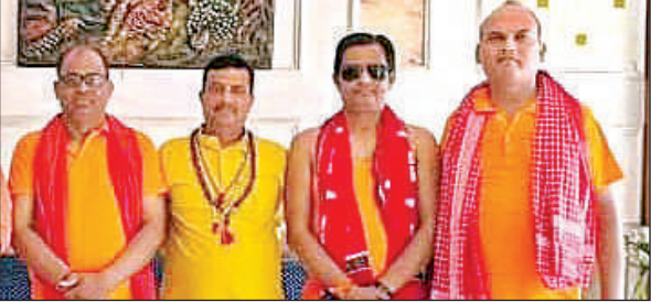
चारों दोस्तों की फाइल फोटो।

सिद्धार्थनगर, अमृत विचार: जनपद में बारिश होने से किसानों के चेहरे पर खुशी की लहर दौड़ गई जो की आज लगातार कई हफ्तों से किसान अपनी धान की फसल को लेकर चिंतित थे। बताते चलें कि धान की खेती को लेकर किसानों ने नर्सरी तो अपनी लगा दी थी लेकिन पानी के बिना उनकी नर्सरी बेहाल रही। वहीं कुछ किसानों ने पंपिंग सेट लगवा कर200 प्रति घंटा देकर अपनी नर्सरी को किसी तरह से जीवित रखा जिसके पास अपना साधन रहा वह लोग भी अपनी नर्सरी को सुरक्षित किए रहे। लेकिन कुछ किसान ऐसे भी दिखाई दिए जो बरखा का इंतजार लगातार कर रहे थे और भगवान से पूजा अर्चना कर बारिश के इंतजार में रहे। आज बारिश होने से किसानों के चेहरे खिल उठे और वह धान रोपाई के लिए आतुर हैं। वहीं, कुछ किसानों ने कहा कि मानसून जैसा हर साल आता है उस तरह का मानसून न होने से खेती के लिए काफी परेशानियों का सामना करना पड़ रहा है।