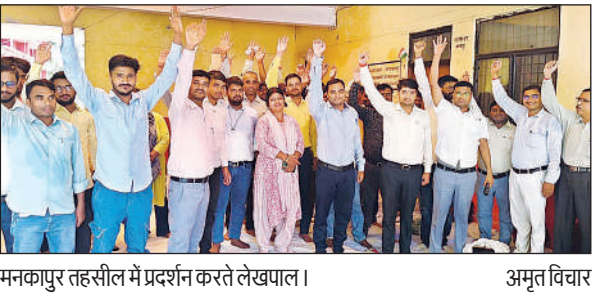
मनकापुर तहसील में प्रदर्शन करते लेखपाल।