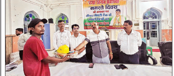
कर्मचारी को पीपीई किट देते अपर नगर आयुक्त व अन्य।