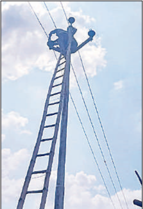
गिरे पोल को खड़ा किए जाने के बाद लाइन दुरुस्त करता लाइनमैन।