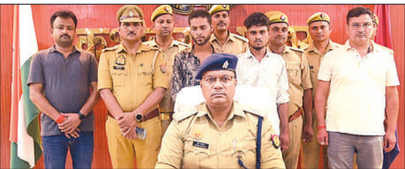
हत्या का खुलासा कर आरोपियों को जेल भेजती पुलिस।