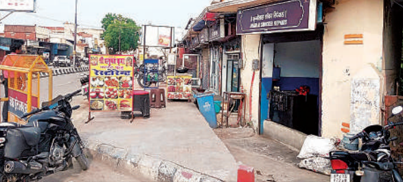
सीतापुर आंख अस्पताल के निकट बनीं दुकानें नोटिस के दायरे में आईं। अमृत विचार

अमृत विचार: सीतापुर आंख अस्पताल के दुकानदारों को दुकान खाली करने का नोटिस दे दिया गया है। इससे दुकानदारों में हलचल है। अस्पताल के स्थान पर सुपर स्पेशियलटी तीन सौ शैया के अस्पताल का निर्माण किया जाना है। शासन से इसकी संस्तुति हो गई है। सीतापुर आंख अस्पताल शहर के बीच रीडगंज में स्थित है। कभी यह अस्पताल आंख के मरीजों से भरपूर रहता था। आंख के अच्छे डॉक्टर होते थे। ऑपरेशन की बेहतर सुविधा भी थी। ऐसा शहर से देहात तक के बुजुर्ग बताते हैं। अस्पताल के पूरी रफ्तार में होने के दौरान ही इसके परिसर