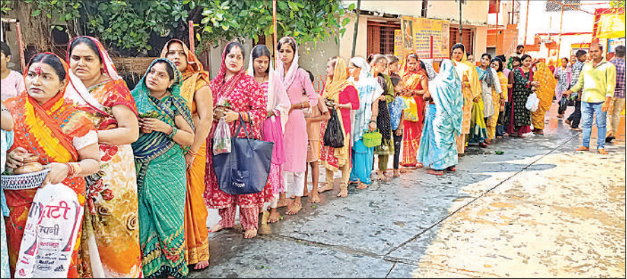
भोलेनाथ के जलाभिषेक के लिए लगी श्रद्धालुओं की कतार।