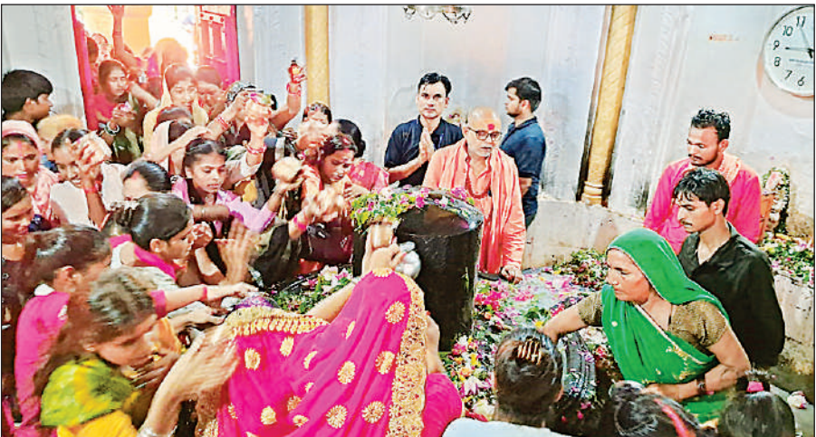
खरगपुर के ऐतिहासिक बाबा पृथ्वीनाथ मंदिर स्थित एशिया के सबसे बड़े शिवलिंग पर जलाभिषेक करते शिवभक्त।

सावन के पहले सोमवार पर भगवान शिव के जलाभिषेक के लिए श्रद्धालुओं के आने का सिलसिला आधी रात से ही शुरू हो गया था। शहर के ऐतिहासिक बाबा दुखहरननाथ मंदिर पर जलाभिषेक के लिए हजारों श्रद्धालु लाइन में खड़े दिखे। भोर में 4 बजे से जलाभिषेक प्रारंभ शुरू हुआ तो ‘हर हर महादेव’ और ‘बोल बम’ के नारों से पूरा शहर गुंजायमान हो उठा। शिवभक्तों ने भगवान