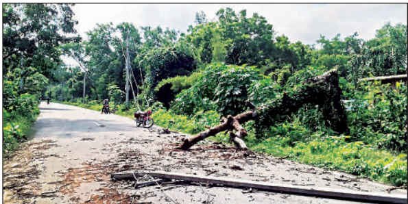
हवा व तेज बारिश से गिरा पेड़ व बिखरी बिजली लाइन।

वजीरगंज में रविवार रात में आई आंधी के चलते आधा दर्जन बिजली के खम्भे टूटने से एक दर्जन गांवों में आपूर्ति ठप हो गयी है। डुमरियाडीह उपकेंद्र के भरहापारा के ऊंचवा के पास 11 हजार वॉट लाइन का खम्भा टूटने से महादेव बौगड़ा की आपूर्ति बंद हो गयी। मोहनपुर उपकेंद्र के अंतर्गत कोठा में 9 बिजली के खम्भे