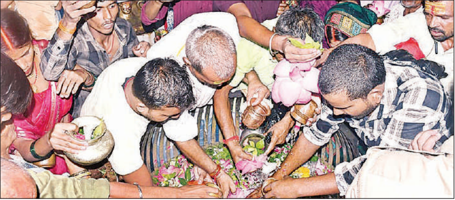
अयोध्या पौराणिक नागेश्वरनाथ मंदिर में शिवलिंग पर जलाभिषेक करते श्रद्धालु।

सावन के पहले सोमवार पर नागेश्वरनाथ, क्षीरेश्वरनाथ समेत अन्य शिवालयों में उमड़ी आस्था