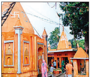
मंगलीनाथ मंदिर में जलाभिषेक करते शिवभक्त ।