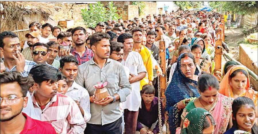
पृथ्वीनाथ मंदिर के बाहर जलाभिषेक के लिए लगी शिवभक्तों की कतार।