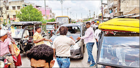
मौर्यनगर चौराहे पर बैरिकेडिंग की वजह से जाम।