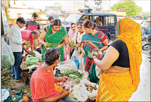
मंदिर परिसर में पूजन सामग्री खरीदती महिलाएं।

अमृत विचार । सावन माह के पहले सोमवार को जिले के प्रमुख शिव मंदिरों में श्रद्धालुओं की भारी भीड़ उमड़ पड़ी। तड़के चार बजे से ही भक्त जलाभिषेक के लिए कतारों में लग गए थे। ‘हर हर महादेव’ और ‘बम बम भोले’ के जयकारों से पूरा वातावरण शिवमय हो गया। मुख्य रूप से नगर के प्राचीन झारखंडी मंदिर, कल्पेश्वर महादेव मंदिर, शिवगढ़ धाम पंचपेड़वा सहित जिले के शिवालयों में भारी संख्या में