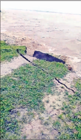
कटान करती घाघरा।