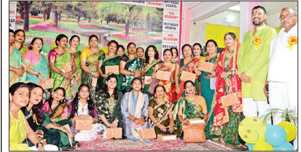
हरियाली तीज उत्सव में शामिल महिलाएं और आयोजक।