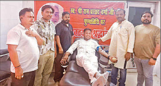
रक्तदान करते लोग।