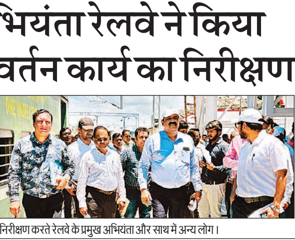
निरीक्षण करते रेलवे के प्रमुख अभियंता और साथ में अन्य लोग।