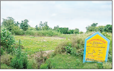
कूड़े से पटा लखन गोडा का अमृत सरोवर।

(बहराइच), अमृत विचार।बिशेशवरगंज विकासखंड की ग्राम पंचायत लखनगोडा में प्रधानमंत्री नरेंद्र मोदी की महत्वाकांक्षी “अमृत सरोवर योजना” की सरेआम धज्जियाँ उड़ रही हैं। लाखों रुपये खर्च कर बनाया गया