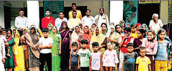
अमानीगंज ब्लाक के प्राथमिक विद्यालय पूरे मंगल में प्रदर्शन करते अभिभावक।