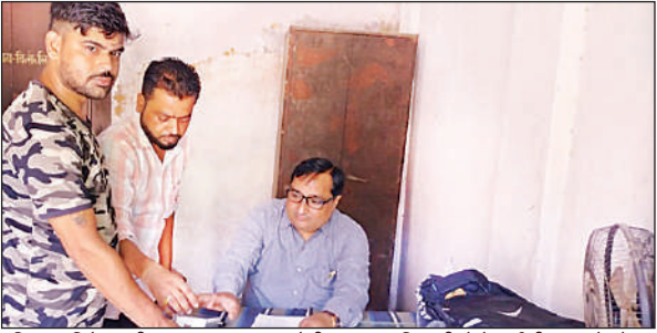
उचित दर विक्रीता की दुकान पर पहुंचकर क्षेत्रीय खाद्य अधिकारी से केवाईसी करवाते लोग।

जिला पूर्ति की ओर से करीब एक पखवाड़ा भर पहले सभी क्षेत्रीय खाद्य अधिकार व पूर्ति निरीक्षकों को नोटिस जारी कर सभी यूनितों का केवाईसी को लेकर चेतावनी दी