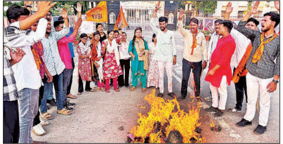
अवध विवि के समक्ष उड़ीसा के बालेश्वर में कार्यकर्ता द्वारा आत्महत्या करने पर विभागाध्यक्ष का पुतला फूंकते विद्यार्थी परिषद के पदाधिकारी।