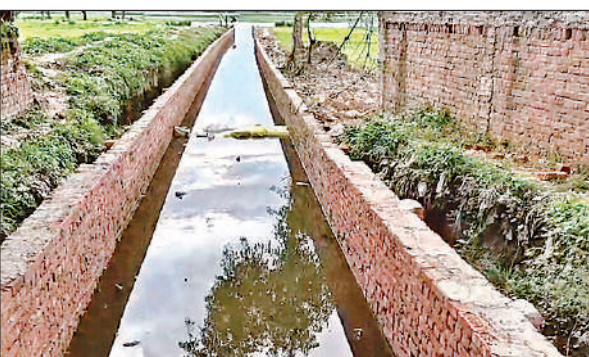
सिंचाई विभाग के नाले पर बनाई गयी दीवार ।

इस पर छत लगी वे की तैयारी चल रही थी तो प्रधान प्रतिनिधि व ग्रामीणों के बीच विवाद हो गया। ग्रामीण दीवार पर ढक्कन रखने की मांग कर रहे थे जबकि ग्राम प्रधान प्रतिनिधि छत लगाने पर अड़े रहे।