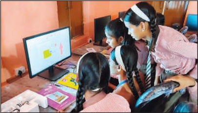
पीएम श्री कम्पोजिट विद्यालय पाराताजपुर में कम्प्यूटर में दक्ष बन रही बेटियां।