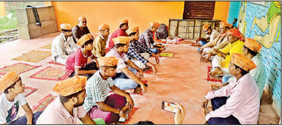
बैठक करते अहिप कार्यकर्ता।