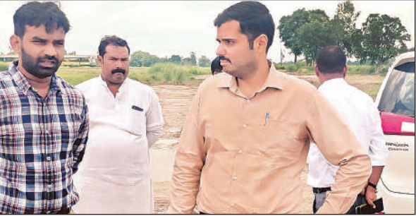
निर्माणधीन पोखरे का निरीक्षण करते मुख्य विकास अधिकारी।