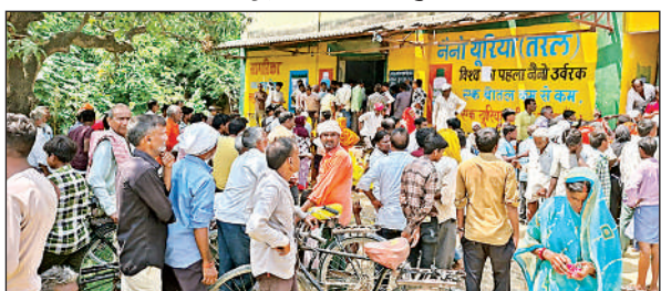
सहकारी समिति पर लगी किसानों की भीड़ ।