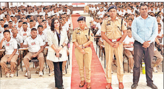
प्रशिक्षण में उपस्थित अधिकारी व आरक्षी ।