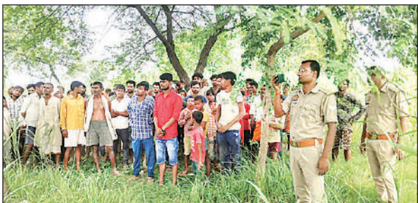
घटनास्थल पर मामले की छनबीन करती पुलिस और जुटी ग्रामीणों की भीड़ ।