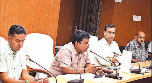
कलेक्ट्रेट सभागार में अधिकारियों के साथ बैठक करते जिलाधिकारी। अमृत विचार

अमृत विचार। जिलाधिकारी डा. राजा गणपति आर की अध्यक्षता में राजस्व वाद एवं वसूली को लेकर समीक्षा बैठक कलेक्ट्रेट सभागार में हुई। मीटिंग में डीएम ने निर्विवाद वरासत एवं राजस्व वादों के निस्तारण आदि की समीक्षा की। कहा निर्विवाद वरासत का कोई प्रकरण लंबित न रहे। इसे समय सीमा के अंदर निस्तारित करें। राजस्व निरीक्षक लेखपाल के स्तर पर लंबित होने पर उन्हें नोटिस निर्गत करें। उन्होंने तहसील बांसी एवं शोहरतगढ़ में भी राजस्व वादों के निस्तारण की समीक्षा की।