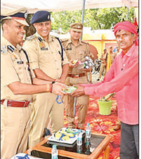
चौकीदार को टॉर्च देते डीआईजी।