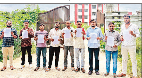
अपना प्रपत्र दिखाते छात्र ।