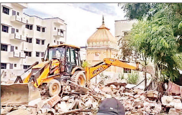
अवैध निर्माण पर चल रहा बुलडोजर ।

अतिक्रमणकारियों को पूर्व में नोटिस जारी कर चेतावनी दी गई थी, लेकिन बावजूद इसके उन्होंने अवैध कब्जा नहीं हटया, जिसके चलते प्रशासन को सख्त कदम उठाना पड़ा। इस दौरान