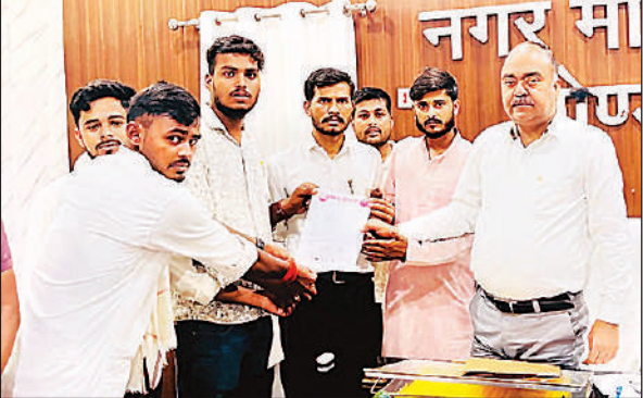
सिटी मजिस्ट्रेट को ज्ञापन देते छात्र ।