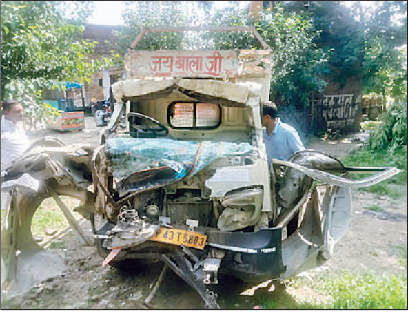
क्षतिग्रस्त वाहन ।