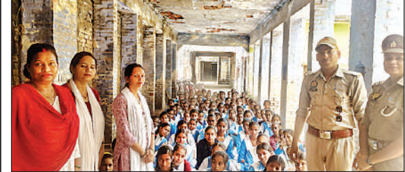
छात्राओं को कानूनी जानकारी देते पुलिस कर्मी ।