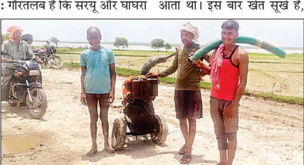
घाघरा नदी के किनारे सूखे खेत में सिंचाई करने को पंपिंग सेट ले जाते किसान।

इस बार जुलाई बीतने को है लेकिन मानसून की बेरुखी ने किसानों की कम्पर तोड़ दी है। धान की रोपाई का समय निकलता जा रहा है और खेतों में पानी न होने से कंदई की प्रक्रिया ठप पड़ी थी। ऐसे में जिन गांवों में हर साल बाढ़ से फसलें डूब जाती थीं, वहां के किसान अब पंपिंग सेटों के सहारे खेतों में पानी भरने को मजबूर हैं। बाढ़ से त्रस्त, अब सूखे से पस्त