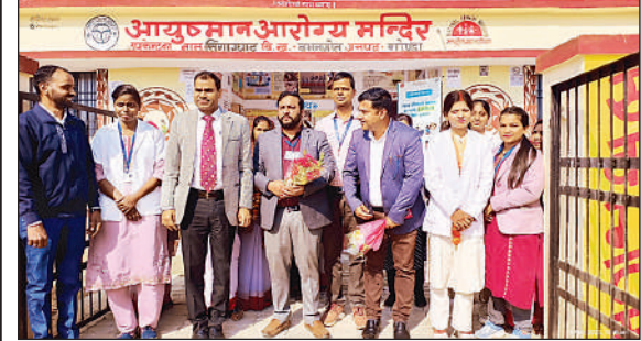
आरोग्य मंदिर सिंगार घाट पर उपस्थित स्वास्थ्य विभाग के अधिकारी ।