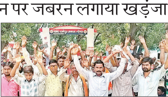
धानेपुर थाने के गेट पर प्रदर्शन करते ग्रामीण।