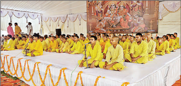
वेदपाठ करते अयोध्या के बाल आचार्य।