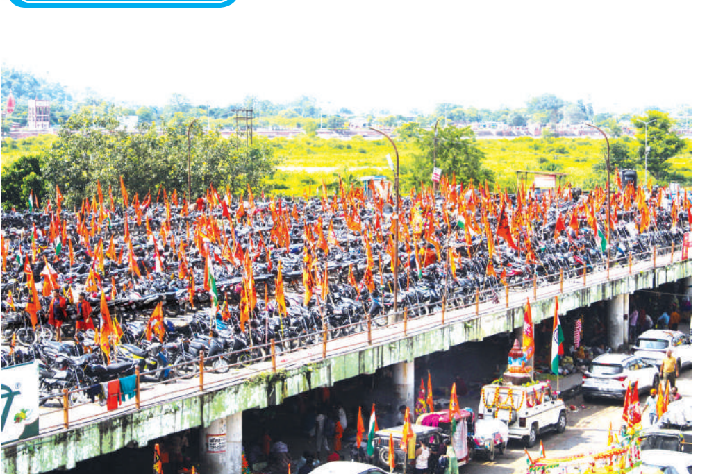
हरिद्वार में कांवड़ यात्रा चरम पर है। लाखों शिवभक्त गंगाजल लेने के लिए पैदल यात्रा कर हरिद्वार पहुंच रहे हैं। सड़कों पर जगह-जगह उनके वाहन खड़े हैं। हरिद्वार की गलियां हर-हर महादेव के जयकारों से गूंज रही हैं। प्रशासन ने व्यवस्था बनाए रखने को विशेष इंतजाम किए हैं।