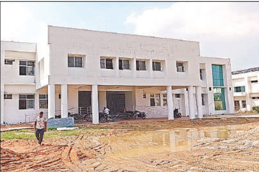
अवध विवि में निर्माणाधीन विश्वविद्यालय का फार्मसी भवन।

और आधुनिकीकरण की दृष्टि से अत्यंत महत्वपूर्ण है। इसके अलावा अन्य बुनियादी ढांचागत परियोजनाएं जैसे छात्रावास, पुस्तकालय, प्रयोगशालाएं और प्रशासनिक भवन भी पूर्णता की राह देख रहे हैं। नवीन परिसर का निर्माण प्रमुख है। जो विश्वविद्यालय के विस्तार