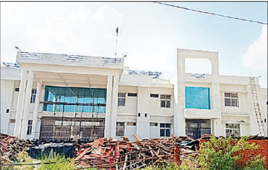
अवध विवि में निर्माणाधीन मल्टी परपज लेक्चर भवन।

अमृत विचार : डॉ. राम मनोहर लोहिया अवध विश्वविद्यालय में नवीन परिसर समेत कई महत्वपूर्ण परियोजनाएं लंबे समय से अधूरी पड़ी हैं। जिससे न केवल विश्वविद्यालय की प्रगति प्रभावित हो रही है, बल्कि शैक्षणिक और प्रशासनिक गतिविधियां भी बाधित हो रही हैं। विश्वविद्यालय अपने मद से करीब 30 करोड़ की परियोजनाओं पर कार्य करा रहा है। यह धनराशि केंद्र से मिले 100 करोड़ से अलग है। यह परियोजनाएं अब तक पूरी हो जानी चाहिए थीं, लेकिन प्रगति की धीमी गति ने कई सवाल खड़े कर दिए हैं। इन अधूरी परियोजनाओं में नवीन परिसर का निर्माण प्रमुख है। जो विश्वविद्यालय के विस्तार