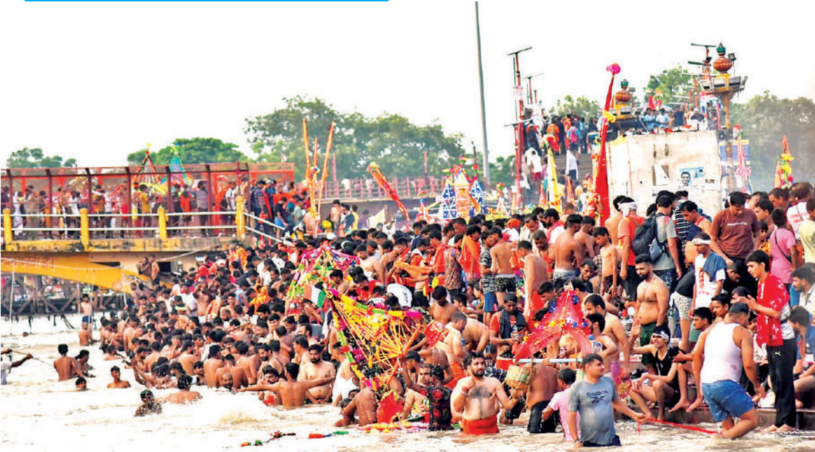
श्रावण मास पर हरिद्वार में हर की पैंड़ी पर हजारों शिवभक्त एकत्र हुए। श्रद्धालुओं ने गंगा में स्नान किया और भगवान शिव को अर्पित करने को गंगाजल ले गए। हाथों में रंग-बिरंगी कांवड़ लिए भक्त वातावरण को भक्तिमय बना रहे हैं।