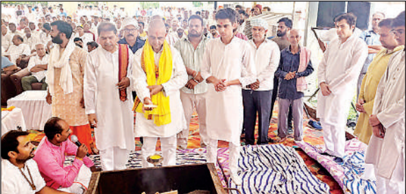
राजतिलक के बाद आहुति डालते विदेश राज्यमंत्री कीर्तिवर्धन सिंह।

की शांति हेतु वैदिक मंत्रों के साथ शांति पाठ व हवन पूजन किया गया। तेरहवीं संस्कार के उपरांत आयोजित राजतिलक समारोह में भारी संख्या में संत, राजपरिवार के सदस्य, जनप्रतिनिधि और आमजन