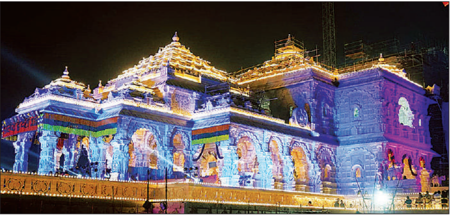
राग बिरंगी लाइटों से सजा राम मंदिर परिसर।