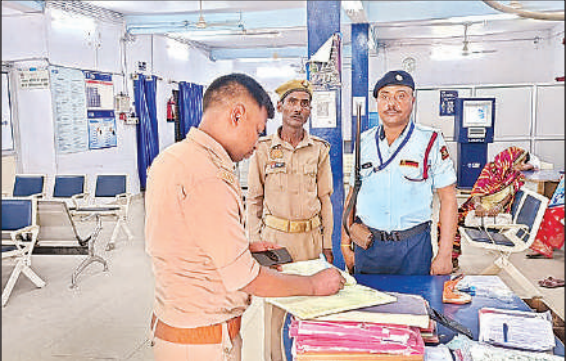
वित्तीय संस्थानों के सुरक्षा की जांच करते पुलिसकर्मों।