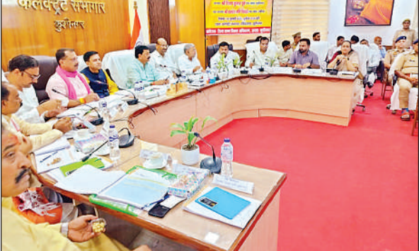
दिशा की बैठक में भाग लेते जनप्रतिनिधि व अधिकारी।

लापरवाह अधिकारियों को चेतावनी देकर उनके कार्यों में सुधार लाने की नसीहत दी। कहा कि सभी जन प्रतिनिधि योजनाओं का धरातल पर मूर्त रूप देने में सहयोग करें। यदि अधिकारी गण सभी जन प्रतिनिधियों का फोन अटेंड कर लें तो आधी समस्याएं ऐसे ही खत्म हो जाएंगी। उन्होंने कहा कि आने वाले दिनों में डीएम व सीडीओ के सहयोग से जनपद की तस्वीर निश्चित रूप से बदलेगी। समिति की सह -अध्यक्ष सांसद देवरिया शशांक मणि त्रिपाठी ने कहा कि जनपद के विकास की प्रतिबद्धता होनी चाहिये। अधिकारी व जनप्रतिनिधि जनहित में कार्य करें। जन कल्याणकारी व जनता के प्राथमिकताओं से जुड़े कार्यों को शीघ्रता व गुणवत्ता के साथ