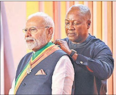
मोदी को सम्मानित करते घाना के राष्ट्रपति महामा।

घाना की संसद को संबोधित करते हुए प्रधानमंत्री मोदी ने कहा कि 'ग्लोबल साउथ' को आवाज दिए बिना प्रगति संभव नहीं है। दो दिवसीय यात्रा पर यहां आए प्रधानमंत्री मोदी ने कहा कि दुनिया के सबसे बड़े लोकतंत्र के रूप में