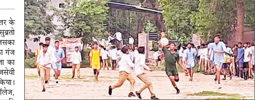
फुटबाल प्रतियोगिता में जोर-आजमाइश करते खिलाड़ी।