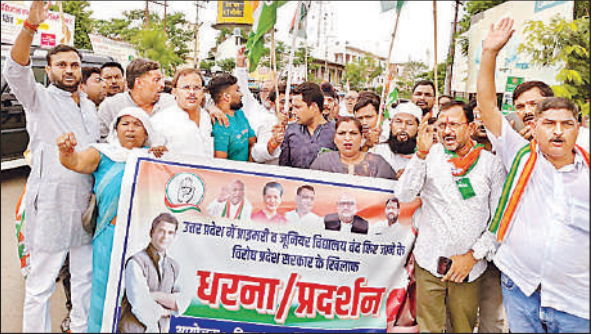
शहर की सड़क पर जुलूस निकालते कांग्रेस कार्यकर्ता।