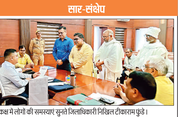
कक्ष में लोगों की समस्याएं सुनते जिलाधिकारी निखिल टीकाराम फुंडे।

शिकायतकर्ता को निस्तारण से संतुष्टि मिलनी चाहिए: डीएम अयोध्या, अमृत विचार : जिलाधिकारी निखिल टीकाराम फुंडे ने गुरुवार को कलेक्ट्रेट स्थित जिलाधिकारी कक्ष में जन सुनवाई के दिन सामान्य की शिकायतें सुनीं। एक-एक व्यक्ति की शिकायत सुनकर संबंधित अधिकारियों को गुणवत्तापूर्ण निस्तारण सुनिश्चित कराने का निर्देश दिया। कहा कि जमीन से संबंधित समस्या को पुलिस व राजस्व की संयुक्त टीम के द्वारा तत्काल मौके पर जाकर निस्तारण कराएं। उन्होंने कहा कि जो भी जन सुनवाई के दौरान समस्याएं आ रही है इसका गुणवत्तापूर्ण निस्तारण सम्मय सुनिश्चित कराएं। शिकायतकर्ता को निस्तारण से संतुष्टि भी मिलनी चाहिए। जनसुनवाई के दौरान अपर जिलाधिकारी नगर, अपर जिलाधिकारी एल/उ, एप जिलाधिकारी मौजूद रहे।