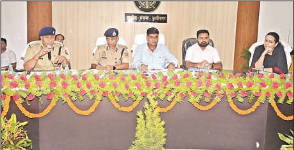
बैठक करते मंडलायुक्त व अपर पुलिस महानिरीक्षक गोरखपुर।

बैठक के दौरान जनपद में कानून-व्यवस्था, यातायात प्रबंधन, और जनसुरक्षा सुनिश्चित करने के लिए संबंधित प्रशासनिक व पुलिस