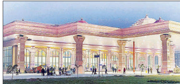
अयोध्या का महर्षि वाल्मीकि अंतरराष्ट्रीय एयरपोर्ट।

अमृत विचार: रामनगरी के महर्षि वाल्मीकि अंतरराष्ट्रीय एयरपोर्ट से उड़ानों की संख्या में लगातार कमी देखी जा रही है। राम मंदिर में प्राण प्रतिष्ठा समारोह के बाद इस एयरपोर्ट पर रोजाना 15 से अधिक उड़ानों का संचालन हो रहा था, लेकिन अब इनमें काफी कमी आ गई है। वर्तमान में दिल्ली के लिए सिर्फ एक और मुंबई के लिए महज दो फ्लाइट्स संचालित हो रही हैं। हाल ही में अकासा एयर ने अपनी बेंगलुरु-अयोध्या फ्लाइट सेवा को भी बंद कर दिया है, जिससे यात्रियों