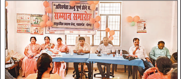
विदाई समारोह में बोलते हुए स्वास्थ्य विभाग के अधिकारी।

पांच महिला स्वास्थ्य कर्मियों को सेवानिवृत्ति पर दी विदाई