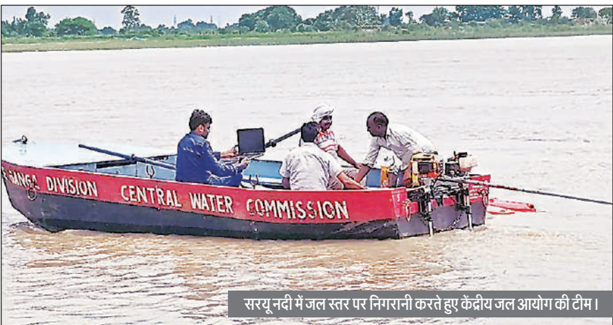
सरयू नदी में जल स्तर पर निगरानी करते हुए कैदीय जल आयोग की टीम।