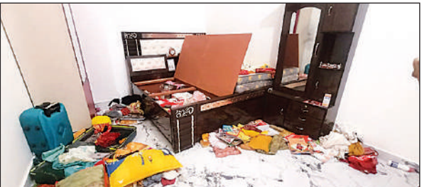
लूट के बाद बिखरा सामान।

कटरा बाजार, गोंडा, अमृत विचार : कौडिया थाना क्षेत्र के कटुआनाला गांव में गुरुवार देर रात अज्ञात बदमाशों ने परिवार के लोगों को बंधक बनाकर लाखों के जेवर व सामान लूट लिए और फरार हो गए।पीडित परिवार ने कौडिया थाने में अज्ञात बदमाशों के विरुद्ध प्रार्थना पत्र दिया है।