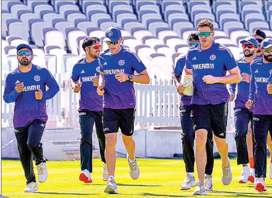
लंदन के लॉर्ड्स क्रिकेट ग्राउंड पर प्रशिक्षण सत्र के दौरान भारतीय खिलाड़ी।

स्टोक्स की बल्लेबाजी फॉर्म में गिरावट आई : आर्थरटन लंदन : पूर्व कप्तान माइकल आर्थरटन ने एजबस्टन में दूसरे टेस्ट में मेजबान टीम की भारत के हाथों शर्मनाक हार के बाद कहा कि बेन स्टोक्स की बल्लेबाजी फॉर्म में पिछले कुछ वर्षों में लगातार गिरावट आई है, विशेषकर ऐसे समय में जब उन्हें आलोचनाओं का सामना कर रही इंग्लैंड टीम की आगे बढ़कर अगुवाई करनी चाहिए।