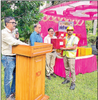
कर्मचारी को सम्मानित करते मिल महाप्रबंधक।