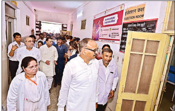
निरीक्षण करते डिप्टी सीएम।

का शासनादेश है जो मौके पर नहीं मिला। इसे कार्यशैली में ढिलाई मानते हुए उन्होंने जवाबदेही तय करने को कहा। उन्होंने सीएमओ व सभी एसीएमओ को निर्देश दिया कि वह लगातार भ्रमणशील रहें और सप्ताह में 4-5 अस्पतालों का निरीक्षण करें। उन्होंने अस्पताल के नोडल अधिकारियों को एम्बुलेंस के इंडावर व एमटी के द्वारा लाकर भर्ती कराए गए मरीजों को क्रॉस चेक करने का निर्देश भी दिया। समीक्षा के बाद पत्रकारों से बात करते हुए डिप्टी सीएम ने कहा कि अस्पताल में सभी तरह की दवाएं उपलब्ध हैं। कुत्ता, बंदर व सांप का इन्जेक्शन भी पर्याप्त मात्रा में है। निरीक्षण में जो कमियां