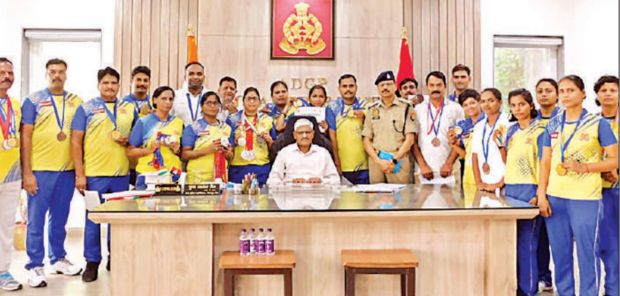
पदक हासिल करने के बाद खुश नजर आते खिलाड़ी।