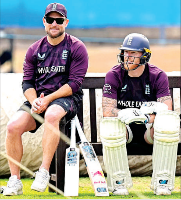
इंग्लैंड के कोच ब्रेंडन मैकुलम व कप्तान बेन स्टोक्स।

उन्होंने कहा यह मैच शानदार होगा, लेकिन अगर पिच में जान रही तो यह और भी जरूरतस्त होगा। 2018 में लॉर्ड्स की हरियाली भरी पिच पर भारत बुरी तरह फंस गया था, लेकिन चार साल पहले टीम ने यहां पर एक रोमांचक टेस्ट मैच भी जीता था। भारत बर्मिंघम में आराम