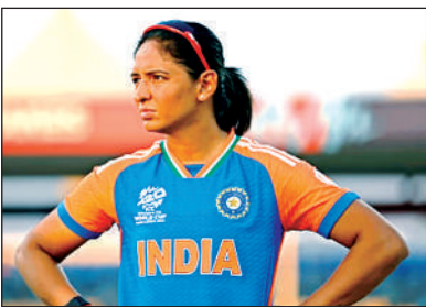
कप्तान हरमनप्रीत कौर।