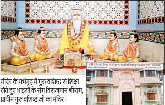
मंदिर के गर्भगृह में गुरु वशिष्ठ से शिक्षा लेते हुए भाइयों के संग विराजमान श्रीराम, प्राचीन गुरु वशिष्ठ जी का मंदिर।

अमृत विचार : अयोध्या एक ऐसा शहर है, जिसके कण-कण में भगवान श्रीराम बसते हैं। यहां के हर महत्वपूर्ण मंदिर और प्राचीन इमारतों से कहीं न कहीं भगवान श्रीराम का संबंध रहा है। ऐसा ही एक प्राचीन मंदिर गुरु वशिष्ठ का है। यह राम मंदिर परिसर के ठीक पीछे स्थित है। पौराणिक मान्यता के अनुसार मर्यादा पुरुषोत्तम भगवान श्रीराम ने अपने तीनों भाइयों के साथ गुरु वशिष्ठ से इस श्राध्द पर शिक्षा ग्रहण की थी। गुरु पूर्णिमा पर बड़ी संख्या में भक्त यहां पहुंच च दर्शन-पूजन करते हैं।