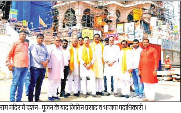
राम मंदिर में दर्शन-पूजन के बाद जितिन प्रसाद व भाजपा पदाधिकारी।

वाणिज्य एवं उद्योग राज्य मंत्री जितिन प्रसाद ने कहीं। वह राममंदिर और हनुमानगढ़ी में पूजा-अर्चना करने के बाद पत्रकारों से वार्ता कर रहे थे। इसके साथ ही वे भी पहुंचे और आशीर्वाद प्राप्त किया। उन्होंने कहा, प्रधानमंत्री नरेंद्र मोदी के मार्गदर्शन और मुख्यमंत्री योगी आदित्यनाथ की दूरदर्शी सोच के चलते अयोध्या का कायाकल्प हुआ है। आज अयोध्या एक विश्वस्तरीय धार्मिक व सांस्कृतिक नगरी के रूप में उभर रही है, जिसे देखने देश-दुनिया से श्रद्धालु और पर्यटक आ रहे हैं।