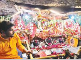
धोपेश्वरनाथ में गुफा के अंदर बना मंदिर।