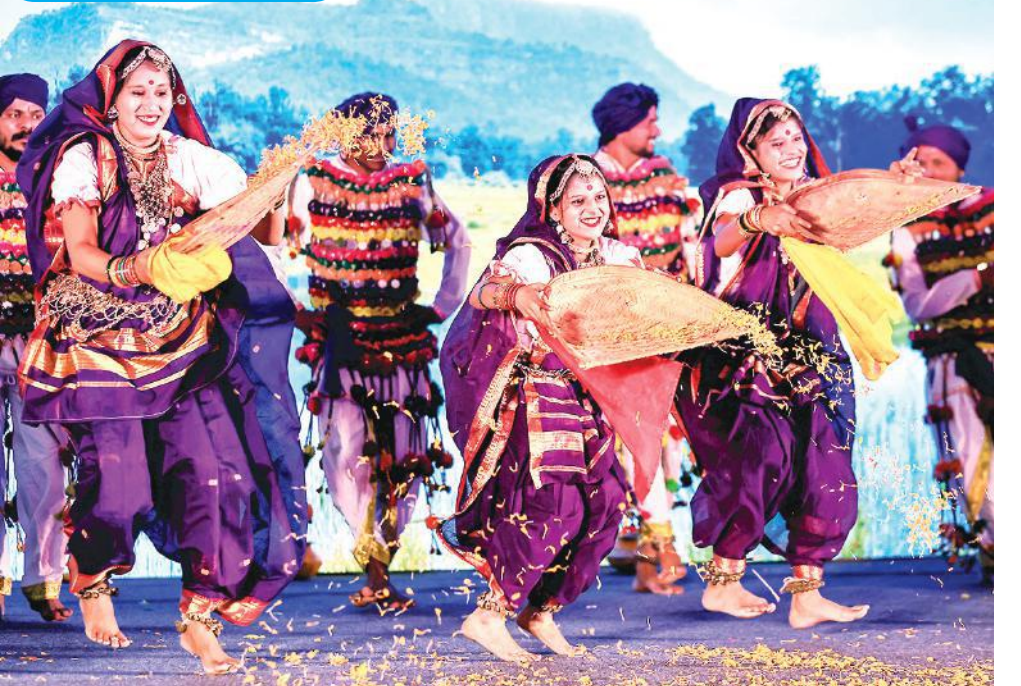
मध्य प्रदेश के लोक कलाकार जयपुर में राज्य के पर्यटन संवर्धन कार्यक्रम के दौरान प्रस्तुति देते हुए। हर साल यहां पर्यटन विकास के लिए ऐसे कार्यक्रम होते हैं जिनमें कई राज्यों के लोक कलाकार शामिल होते हैं। पर्यटक इन कार्यक्रमों का खूब लुफ्त उठाते हैं।