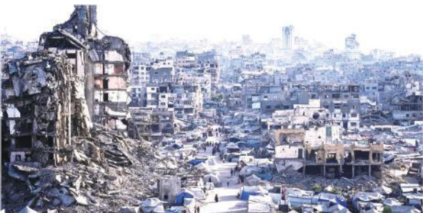
इजराइली बमबारी से तबाह गाजा में लोग तंबुओं में रह रहे हैं।

संयुक्त राष्ट्र प्रवक्ता स्टीफन दुजारिक ने पुष्टि की कि मानवाधिकार मामलों के समन्वय के लिए संयुक्त राष्ट्र कार्यालय, मानवाधिकार एजेंसी ओएचसीएचआर और गाजा में फलस्तीनियों की सहायता करने वाली एजेंसी यूएनआरडब्ल्यूए के स्थानीय नेताओं के वीजा का हाल के महीनों में नवीनीकरण नहीं किया गया है। संयुक्त राष्ट्र के मानवाधिकार मामलों के प्रमुख टॉम फ्लेचर ने सुरक्षा परिषद को बताया कि संयुक्त राष्ट्र का मानवीय अधिदेश केवल जरूरतमंद नागरिकों