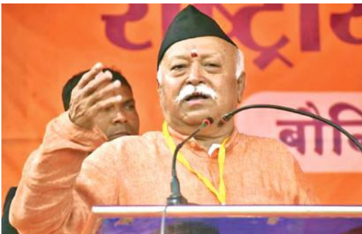
● सोलापुर में गैर-लाभकारी संगठन उद्योगवर्धनी के कार्यक्रम को किया संबोधित

उन्होंने कहा कि एक पुरुष अपनी मृत्यु तक काम करता है। एक महिला भी अंत तक काम करती है, लेकिन उससे भी आगे वह आने वाली पीढ़ियों को प्रेरित करती है। एक महिला के प्यार और स्नेह के तले बच्चे बढ़ते और परिपक्व होते हैं। आरएसएस प्रमुख ने कहा कि राष्ट्रीय विकास के लिए महिलाओं का सशक्तिकरण बेहद महत्वपूर्ण है। उन्होंने कहा कि ईश्वर ने