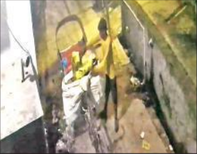
मूर्ति ले जाता चोर।