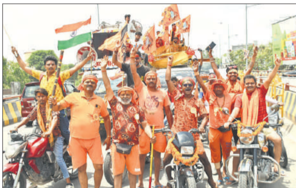
पुराना शहर से जल लेने के लिए जाता कांवड़ियों का जत्था ।