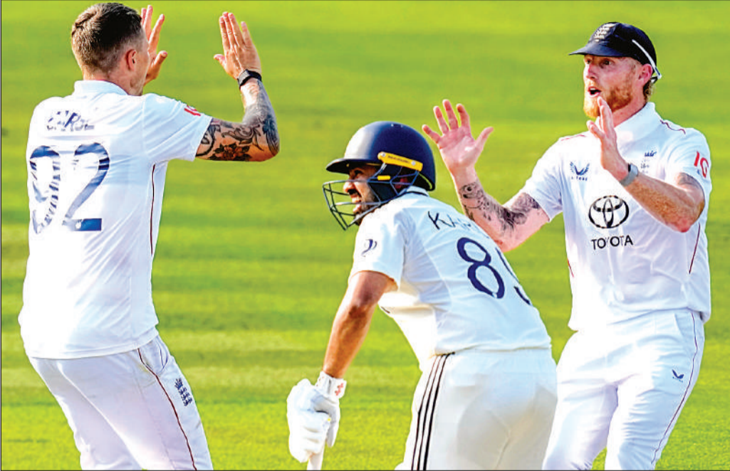
भारतीय बल्लेबाज करुण नाथर का विकेट लेने के बाद जघन मनाते इंग्लैंड के कप्तान बेन स्टोक्स व गेंदबाज ब्राइडन कार्स।

इससे पहले चायकाल के बाद वाशिंगटन सुंदर ने इंग्लैंड के कप्तान बेन स्टोक्स (33) को बोल्ड कर अपना तीसरा विकेट झटका। इसके बाद ब्राइडन कार्स (एक) और क्रिस वोक्स (1०) बुमराह का शिकार बने। 63वें ओवर की पहली गेंद पर सुंदर ने शोएब बशीर (दो) को बोल्ड कर इंग्लैंड की