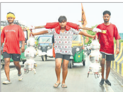
कछला से जल लेकर फतेहगंज पश्चिमी जाते कांवड़िये ।