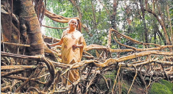
मेघालय के सीज गांव में जीवित जड़ों से बने पुल का दौरा करती निर्मला सीतारमण।

केंद्रीय वित्त मंत्री निर्मला सीतारमण ने मेघालय के ईस्ट खासी हिल्स जिले के ‘लिविंग रूट ब्रिज’ को यूनेस्को विश्व धरोहर का दर्जा दिलाने के प्रयासों के प्रति पुरजोर समर्थन व्यक्त किया है। सीतारमण ने मान्यता के लिए नामांकन को बहाल करने और सामुदायिक सहभागिता एवं अंतर्राष्ट्रीय साझेदारी के माध्यम से प्रस्ताव को मजबूत करने के लिए हाल में जमीनी स्तर पर हुई प्रगति की सराहना की। ‘लिविंग रूट ब्रिज’ ऐसा पुल होता है, जो पेड़ों की जड़ों से तैयार किया गया जाता है। सीतारमण ने कहा कि वैश्विक मान्यता न केवल पारंपरिक ज्ञान का सम्मान करेगी, बल्कि दूसरों को स्थानीय ज्ञान पर आधारित स्थायी प्रथाओं को अपनाने के लिए भी प्रेरित