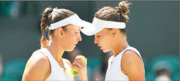
रुस की वेरोनिका कुदेमेंतोवा (दाएं) और बेल्जियम की एलिस मेटेंस मैच के दौरान सर्विस तैयार करती हुईं।

लंदन : वेरोनिका कुदेरमेटोवा और एलिस मेटेंस की जोड़ी ने रविवार को विम्बलडन महिला युगल के फाइनल में हसीह सु-वेई और येलेना ओस्ट्रापेंको को 3-6, 6-2, 6-4 से शिकस्त दी। कुदेरमेटोवा पहली बार ग्रैंड स्लेम चैंपियन बनी है जबकि मेटेंस का यह पांचवां ग्रैंड स्लेम और दूसरा विम्बलडन युगल खिताब है। कुदेरमेटोवा और मेटेंस 2021 के फाइनल में एक-दूसरे के खिलाफ थीं, लेकिन इस साल विंबलडन में पहली बार एक साथ खेल रही थीं। यह जोड़ी तीसरे सेट में 2-4 से पीछे थी पर फिर शानदार वापसी करते हुए अंतिम चार गेम को भुना कर खिताब जीतने में सफल रही। कुदेरमेटोवा ने कहा मैं वह (2021) फाइनल हार गई थी और वह बहुत