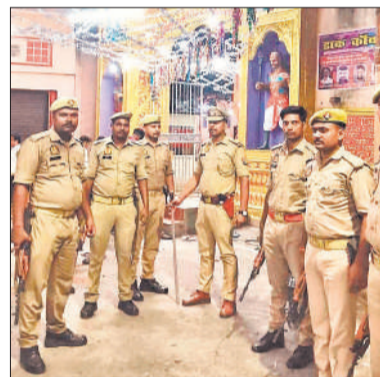
अलखनाथ मंदिर पर तैनात पुलिस कर्मी ।

बरेली, अमृत विचार : विश्व हिंदू परिषद के तीन प्रखंडों में सावरकर नगर प्रखंड, पशुपति नगर प्रखंड एवं प्रतापनगर प्रखंड में परिचय वर्ग आयोजित हुआ। इसमें विश्व हिंदू परिषद से नए लोगों को जोड़ने के लिए प्रेरित किया गया।