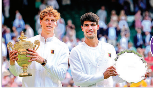
इटली के यानिक सिनर (बाएं) और स्पेन के कार्लोस अल्काराज विजेता व उपविजेता की ट्रॉफियों के साथ।