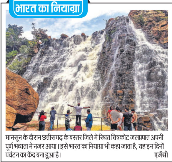
मानसून के दौरान छत्तीसगढ़ के बस्तर जिले में स्थित चित्रकोट जलप्रपात अपनी पूर्ण भव्यता में नजर आया। इसे भारत का नियाग्रा भी कहा जाता है, यह इन दिनों पर्यटन का केंद्र बना हुआ है।

आदेशानुसार यात्रा के दौरान भड़काऊ या किसी समुदाय की भावनाओं को ठेस पहुंचाने वाली सामग्री वाले डीजे, लाउडस्पीकर का उपयोग भी वर्जित रहेगा। जिला प्रशासन ने रविवार से यात्रा मार्ग पर मांस की बिक्री पर भी प्रतिबंध लगा दिया है और कांवड़ मार्ग पर मांस की दुकानें 24 जुलाई तक बंद रहेंगी।