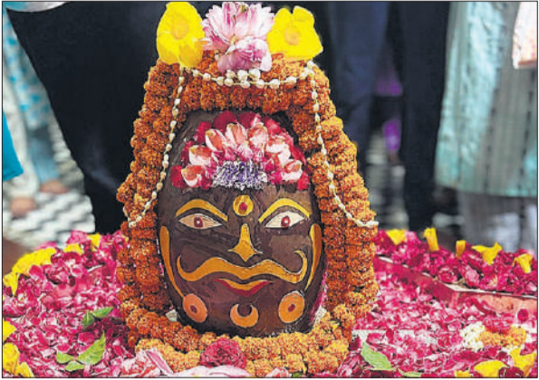
बाबा त्रिवटीनाथ का महाकाल के स्वरूप में किया श्रृंगार ।

रविवार को सड़कों पर कांवड़ियों के जत्थे नजर आए। एक ओर शिवभक्त कछला व अन्य तीर्थ स्थल से जल लेने के लिए रवाना हुए तो बड़ी संख्या में जल लेकर भी लौटे। कांवड़ियों का शहर में जगह-जगह फूल बरसाकर स्वागत किया गया। वहीं, कांवड़ियों के जत्थों से शहर में कई जगह जाम की स्थिति बनी। यातायात पुलिस ने जाम को खुलवाकर कांवड़ियों के जत्थों को रवाना किया।