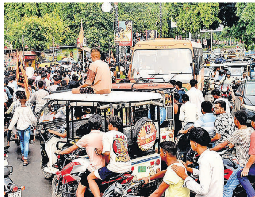
सावन शुरू होते ही कांविड़ियों के जत्थे निकलने लगे हैं। शहर में जाम न लगे इसके लिए शुक्रवार से ही रूट डायवर्जन भी किया जा रहा है। इसके बावजूद रविवार को जत्था निकलने के दौरान चौकी चौराहा पर जाम लग गया।

जांची जाएं और यह सुनिश्चित किया जाए कि गेटमैन सभी निर्देशों का पालन कर रहे हैं या नहीं। इस जांच व्यवस्था से न केवल गेटमैन की जवाबदेही तय होगी, बल्कि दुर्घटनाओं की संभावना भी कम होगी। रेलवे अधिकारियों के अनुसार वाइस रिकॉर्डर डेटा की नियमित समीक्षा से संचालन संबंधी कमियों को समय रहते पकड़ा जा सकेगा। सभी संबंधित अधिकारियों को निर्देश जारी कर दिए हैं। अब हर दिन की रिपोर्ट उच्च अधिकारियों को भेजी जाएगी। इस नई व्यवस्था से रेलवे क्रांशिंग पर सुरक्षा और संतर्कता में महत्वपूर्ण सुधार की उम्मीद है।