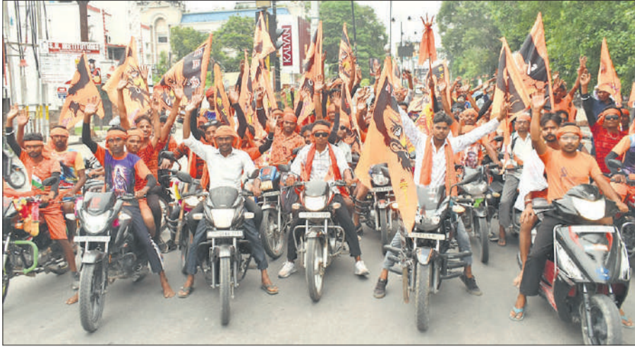
बीसलपुर रोड से कछला जल लेने के लिए रवाना होता कांवड़ियों का जत्था ।