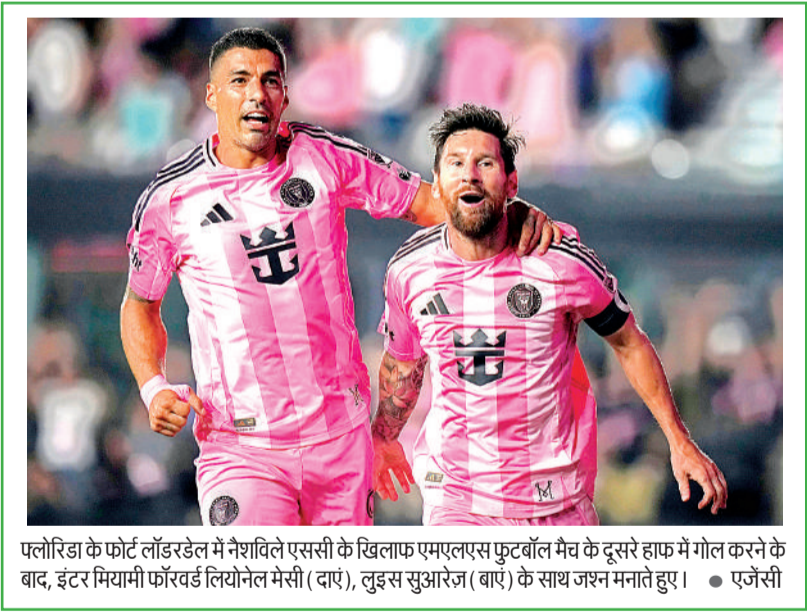
प्लोर्तिडा के फोटो लॉंडरडेल में नेशविले एससी के खिलाफ एमएलएस फुटबॉल मैच के दूसरे हाफ में गोल करने के बाद, इंटर मियामी फॉरवर्ड लियोनेल मेसी (दाएं), लुइस सुआरेज़ (बाएं) के साथ जश्न मनाते हुए।

कहा यह समय की बर्बादी का अब तक का सबसे अच्छा उदाहरण है। उन्होंने कहा भारत शिकायत नहीं कर सकता क्योंकि कल गिल की पैर की मांसपेशियों में खिंचाव आ गया था - (लोकेश) राहुल मैदान से बाहर थे और वह पारी की शुरुआत नहीं कर पाते। वॉन ने कहा कि यह दोनों टीमों के लिए एक जैसा मामला है।