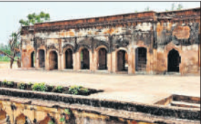
गोंडा में वजीरगंज की बारादरी।