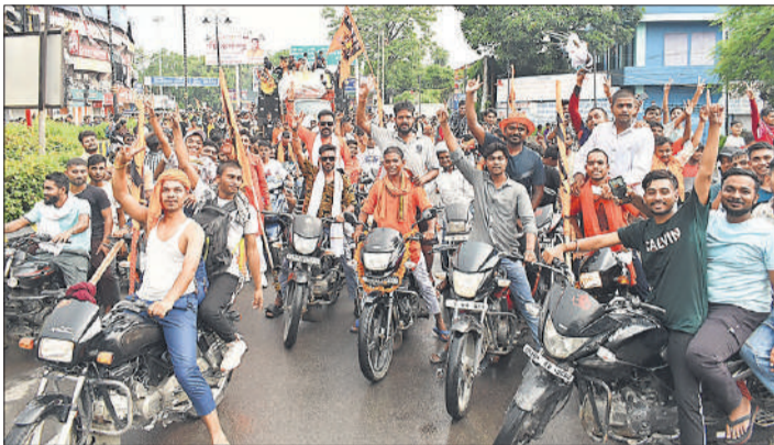
कछला जल लेने जाता भरतौल के कांवड़ियों का जत्था ।