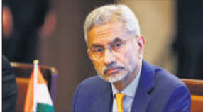
● जयशंकर की बीजिंग यात्रा से पहले चीनी दूतावास की टिप्पणी

इस महीने की शुरुआत में दलाई लामा के उत्तराधिकारी सहित तिब्बत से संबंधित मुद्दे भारत-चीन द्विपक्षीय संबंधों में एक 'कांटा' हैं और वे नई दिल्ली के लिए एक 'बोझ' बन गए हैं। यह टिप्पणी विदेश मंत्री एस जयशंकर की शंघाई सहयोग संगठन (एएससीओ) के संयोजित बैठक के लिए चीन यात्रा से पहले आई है।