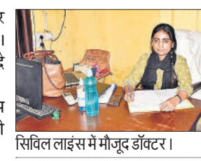
सिविल लाइंस में मौजूद डॉक्टर।

लोग ग्रसित मिल रहे हैं। केंद्र पर कोई विशेषज्ञ डॉक्टर नहीं है। हालांकि, मरीजों को इलाज दे रहे हैं। बताया कि एलटी समेत अन्य स्टाफ की भी कमी है। इसकी वजह से परेशानी हो रही है।