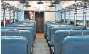
● हर डिब्बे में चार, इंजन में उच्च गुणवत्ता के छह कैमरे लगेंगे

74 हजार डिब्बों और 15 हजार इंजनों में सीसीटीवी कैमरे लगाए जाएंगे। ये कैमरे अत्याधुनिक होंगे और 100 किमी प्रति घंटे से भी अधिक रफ्तार में तथा कम रोशनी में भी उच्च गुणवत्ता वाली फुटेज उत्पन्न करायेंगे। रेलवे के अनुसार यात्री डिब्बों में कैमरे लगाने के प्रयोगिक परिणाम के आधार पर यह निर्णय लिया गया है। कैमरे लगने