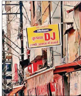
आलमगिरी गंज में व्यापारियों ने लगाए पोस्टर बैनर।