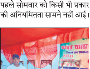
रिठौरा में भंडारे का निरीक्षण करने पहुंचे एफएसडीए के अधिकारी।