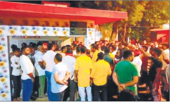
तिकुनिया के देवी मंदिर पर लगी व्यापारियों और कस्बे के लोगों की भीड़।

अमृत रस में नशीला पदार्थ पिलाकर उसके साथ दुष्कर्म किया, जिसका मोबाइल में आरोपी ने वीडियो भी बनाया। जब उसने विरोध किया तो आरोपी ने अश्लील वीडियो वायरल करने और उसके पति को