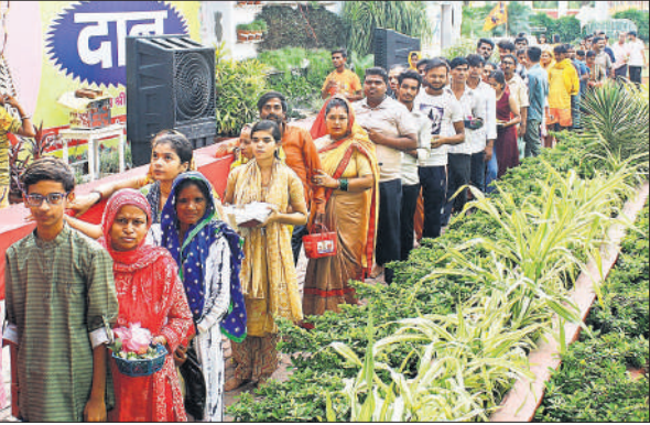
त्रिवटीनाथ मंदिर के बाहर लगी श्रद्धालुओं की कतार।