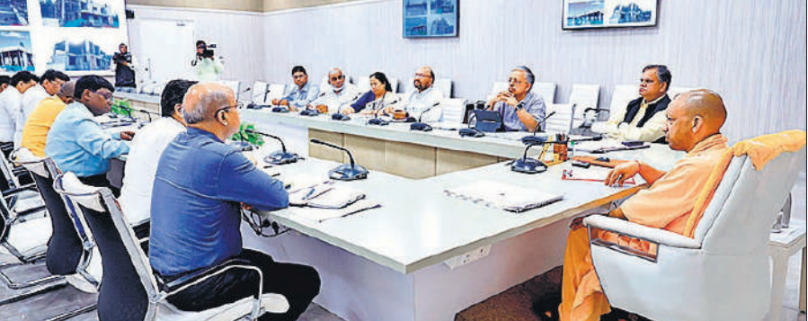
मुख्यमंत्री सोमवार को अपने सरकारी आवास पर उच्च शिक्षा विभाग की नए विश्वविद्यालयों के संबंध में बैठक करते हुए।

इस दौरान तीनों विश्वविद्यालयों के कुलपति उपस्थित रहे। मुख्यमंत्री ने गुरु जम्भेश्वर राज्य विश्वविद्यालय, मुरादाबाद की वेबसाइट https://www.gjum.ac.in/ व लोगों का विमोचन भी किया। मुख्यमंत्री ने कहा कि इन नवस्थापित विश्वविद्यालयों को केवल शैक्षणिक परिसर न मानकर प्रधानमंत्री श्री नरेंद्र मोदी के उस व्यापक विजन का विस्तार समझा जाए, जिसमें हर जिले के युवाओं को गुणवत्तापरक, रोजगारपरक