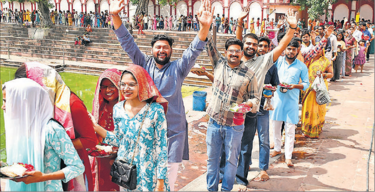
सावन माह के पहले सोमवार को बाबा धोपेश्वर नाथ मंदिर में जलाभिषेक करने के लिए श्रद्धालुओं की लगी कतार।