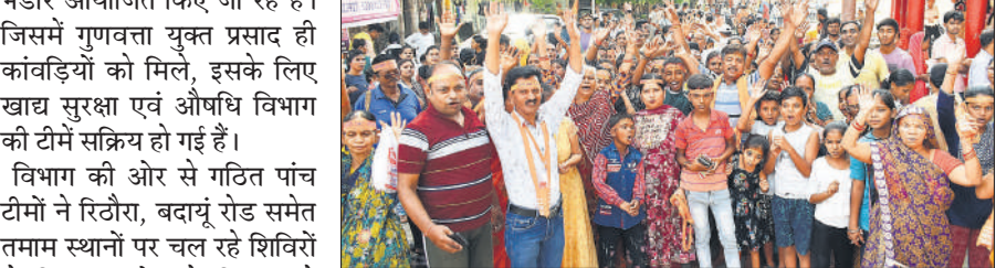
जलाभिषेक यात्रा में बड़ी संख्या में शामिल हुए श्रद्धालु।