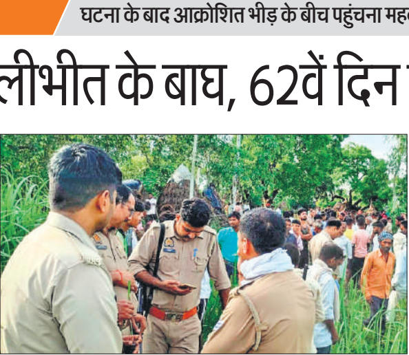
घटना के बाद मौके पर जुटी पुलिस।