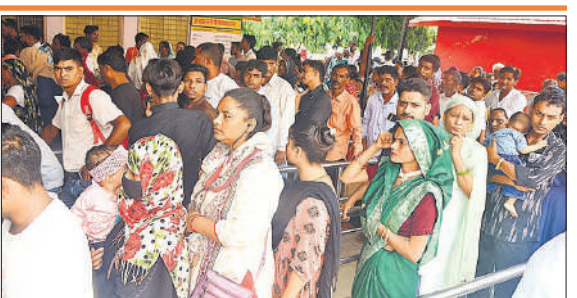
जिला अस्पताल में दवा काउंटर पर लगी मरीजों की कतार।

न होने से मरीजों को मजबूरन फिजिशियन से इलाज कराना पड़ रहा है। डायरिया वार्ड में एक बेड पर दो-दो मरीज : 18 बेड का डायरिया वार्ड फुल हो गया है। एक बेड पर दो-दो मरीज भर्ती करने पड़ रहे हैं। हालांकि, अस्पताल प्रशासन बेड बढ़ाने की तैयारी कर रहा है।