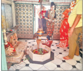
मढ़ीनाथ मंदिर में स्थापित शिवलिंग।

पहली कथा पर्यटन विभाग का बरेली हेरिटेज बोर्ड बताता है कि एक तपस्वी ने राहगीरों की प्यास बुझाने को कुआं खोदा था, जिसमें से शिवलिंग निकला, जिस पर एक मणि धारी सांप लिपटा हुआ था, इसलिए इसे मढ़ीनाथ कहते हैं। दूसरी कथा मंदिर की श्री राधे