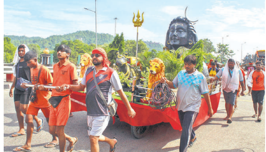
हरिद्वार : श्रावण मास के शुरू होते ही कांवड़ यात्रा जोरों पर है। पहले सोमवार को अलग-अलग जगहों पर भोले के भक्तों के जल्ये डीजे में झूमते दिखे। दिल्ली-हरिद्वार एक्सप्रेसवे पर भगवान शिव की मूर्ति के साथ कांवड़ खींचते हुए कांवड़िये।