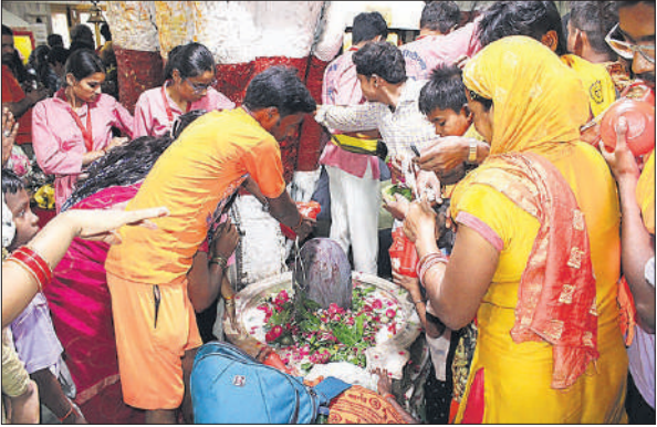
त्रिवटीनाथ मंदिर में जलाभिषेक करते कांवड़िये और श्रद्धालु।

तड़के ही मंदिरों में श्रद्धालुओं के पहुंचने का सिलसिला शुरू हो गया। कुछ ही समय में अलखनाथ, त्रिवटीनाथ, तपेश्वरनाथ, मढ़ीनाथ, धोपेश्वर नाथ, पशुपतिनाथ, वनखंडी नाथ आदि मंदिरों में भक्तों की लाइनें लग गईं। श्रद्धालुओं ने बाबा भोलेनाथ को दूध, दही, शहद, जल, धतूरा, बेलपत्र, फूल आदि अर्पित किए। परिवार की सुख समृद्धि के लिए प्रार्थना की। मंदिरों में महाआरती की गई। दोपहर तक शिवालयों में भक्तों का तांता लगा रहा। बोल बम के जयकारे गुंजते रहे।