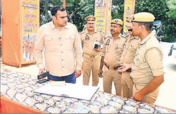
कांवड़ियों के लिए बनाए गए विश्राम स्थल का निरीक्षण करते एसएसपी।