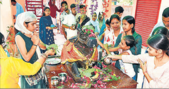
बाबा धोपेश्वर नाथ मंदिर में नंदी को जलाभिषेक करते श्रद्धालु।