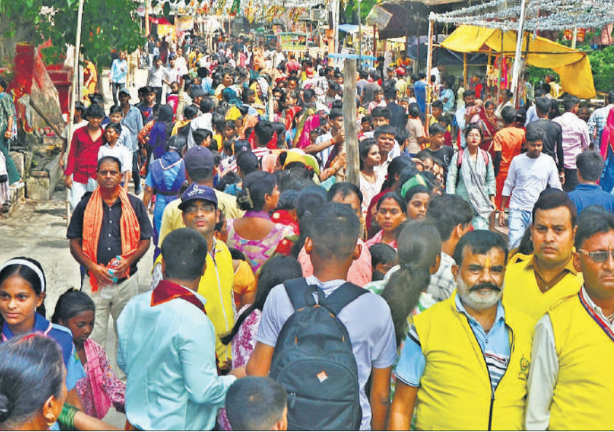
अलखनाथ मंदिर में भी बड़ी संख्या में श्रद्धालु जलाभिषेक करने पहुंचे।