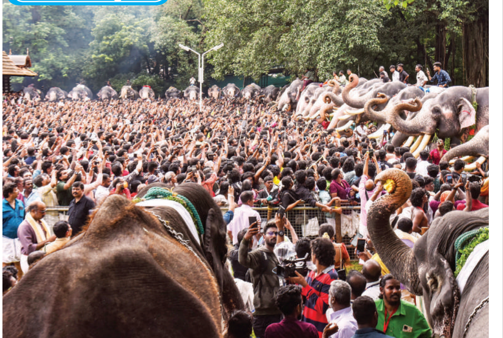
केरल के त्रिशूर स्थित श्री वडवकुमनाथन मंदिर में गुरुवार को मलयालम महीने कार्किडकम की शुरुआत के उपलक्ष्य में हाथियों को खाना खिलाते लोग, इस रस्म को आनाखूट्टू कहा जाता है। यह भगवान गणेश को समर्पित उत्सव है जिसमें हजारों लोग भाग लेते हैं।