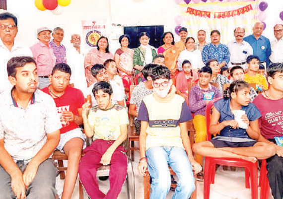
कार्यक्रम में बच्चों ने उत्साह के साथ भाग लिया।