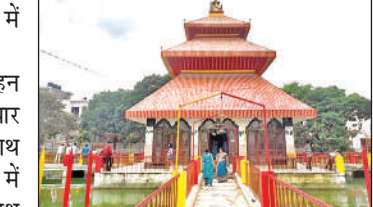
पशुपतिनाथ मंदिर। ● अमृत विचार

शिव परिवार की व नीचे बहते जल की सुंदरता देखते ही बनती है। मंदिर के सामने ही भव्य यज्ञशाला व धर्मशाला की व्यवस्था मंदिर निर्माण के साथ हुई। मंदिर के एक कोने में कैलाश स्वरूपी पर्वत पर 1101