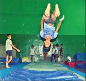
ट्रायल में भाग लेती खिलाड़ी।