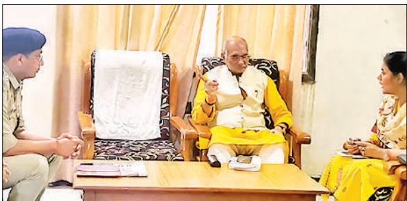
कैप कार्यालय में अधिकारियों के साथ समीक्षा बैठक करते पशुधन मंत्री।

से इस बार धान की पौध आसानी से रोपी गई है और फसल अच्छी होने की संभावना है।