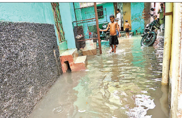
आधे घंटे की बारिश के बाद गली में बहता पानी।

सूत्रों के अनुसार बड़ी बहन ने बीसलपुर पहुंचकर गुरुवार को प्रेमी से निकाह भी कर लिया। इस बीच परिजन उसकी तलाश में लगे रहे। वहीं छोटी बहन नवाबगंज क्षेत्र के ही एक ग्राम में प्रेमी के पास पहुंच गईं। प्रभाव से सूचना मिलने परिजन उसे मनाने में जुटे हुए है।