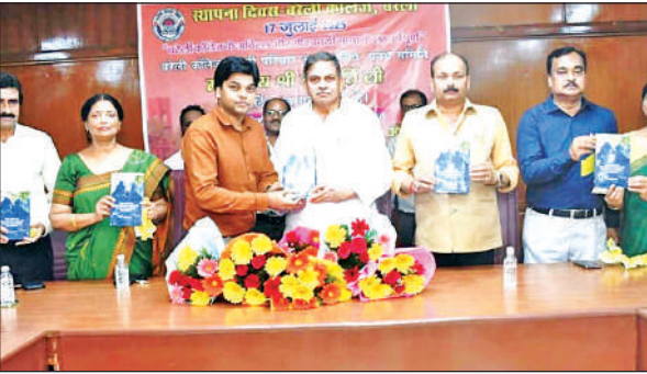
किताब का विमोचन करते सचिव देवमूर्ति व अन्य।

उन्होंने कहा कि कई साल से कॉलेज के लिए कोई ग्रांट नहीं आई