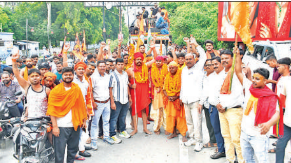
कछला रवाना होता कांवड़ियों का जत्था।