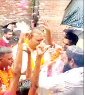
कांवड़ियों का स्वागत करते मुस्लिम समाज के लोग।