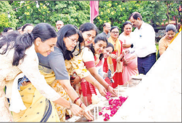
स्थापना दिवस पर कॉलेज परिसर में स्तंभ पर कैंडल जलाती शिक्षिकाएं।