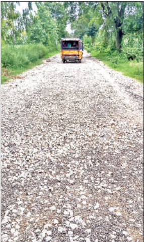
सड़क पर डाल गए मोटे पत्थर।

मीरगंज से दिवना मार्ग 10 दिन से टूटा और उखड़ा पड़ा है। मीरगंज