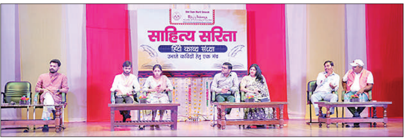
साहित्य सरिता में काव्य पाठ करते कवि।