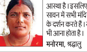
महादेव पर अपार आस्था है। इसलिए सावन में सभी मंदिरों के दर्शन करते हैं। यहां भी आना होता है।